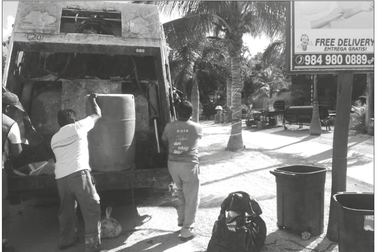
▲ El servicio de recolección de basura está garantizado para las fechas festivas del 25 de diciembre y 1º de enero.

En vacaciones de invierno, los camiones recolectores juntan más de 250 toneladas al día