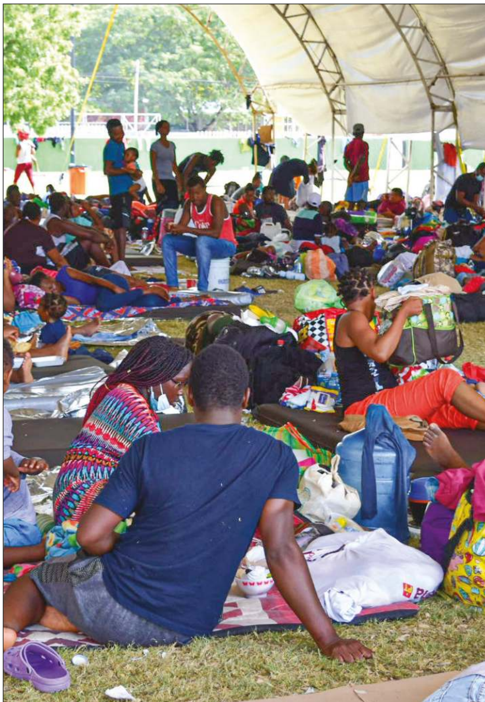
▲ Cientos de migrantes de diversos países continúan llegando a tierras campechanas para obtener su permiso de estancia en México.

Pidió que comprendan no solo a los ciudadanos, sino a los hermanos haitianos, guatemaltecos, hondureños y demás, ya que hoy Campeche debe solidarizarse.