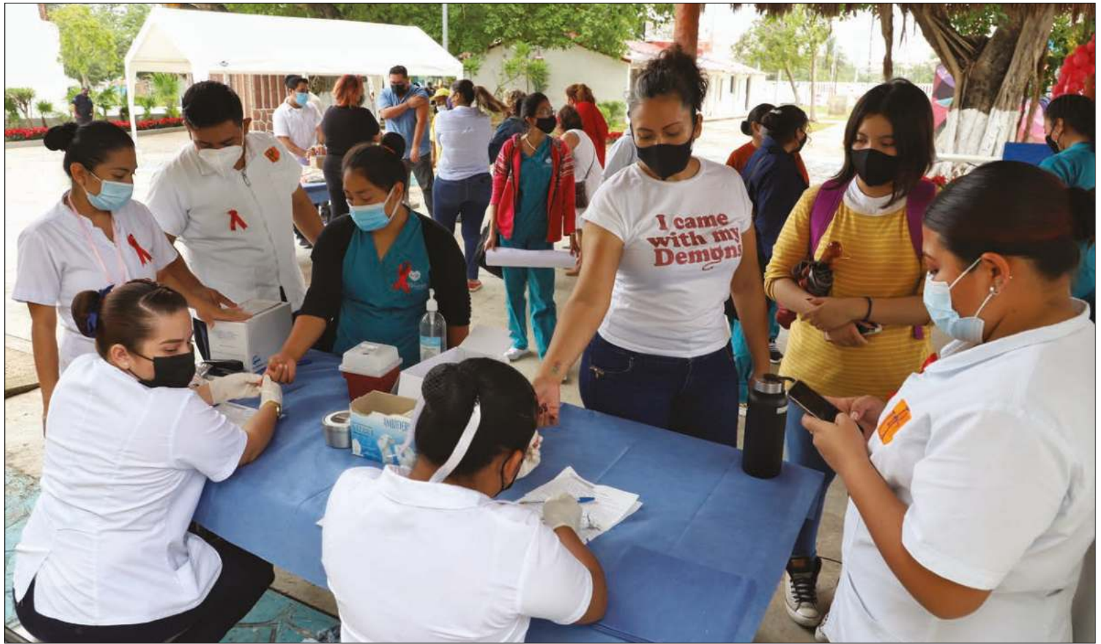
▲ Las personas que viven con el VIH sufren cuadros más graves y tienen mayores comorbilidades frente al Covid-19.