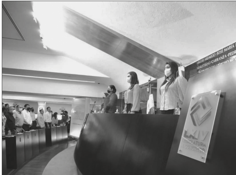
▲ Legisladores recomendaron a los alcaldes mejorar sus estrategias de captación.

Previo a la sesión para elegir a los presidentes de la