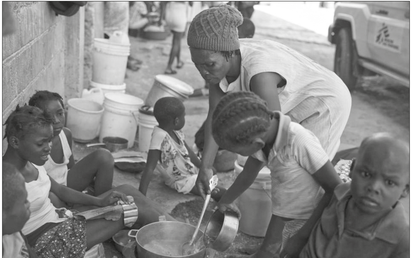
▲ La Policía Nacional ha informado de más de 460 secuestros en lo que va del año, más del doble de lo que se informó el año pasado, según la Oficina Integrada de Naciones Unidas en Haití.

Pocos trabajadores humanitarios están dispuestos a hablar abiertamente sobre los recortes, luego del secuestro en octubre de 17 personas de Christian Aid Ministries, una organización religiosa de ayuda con sede en Ohio, 12 de los cuales permanecen como rehenes.