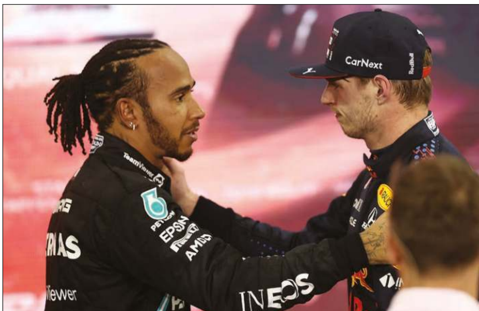
▲ Max Verstappen (derecha) y Lewis Hamilton fueron las estrellas de memorable campaña de la Fórmula Uno.

Hamilton y Verstappen largaron pegados el uno al otro en la última vuelta, con el británico al frente.