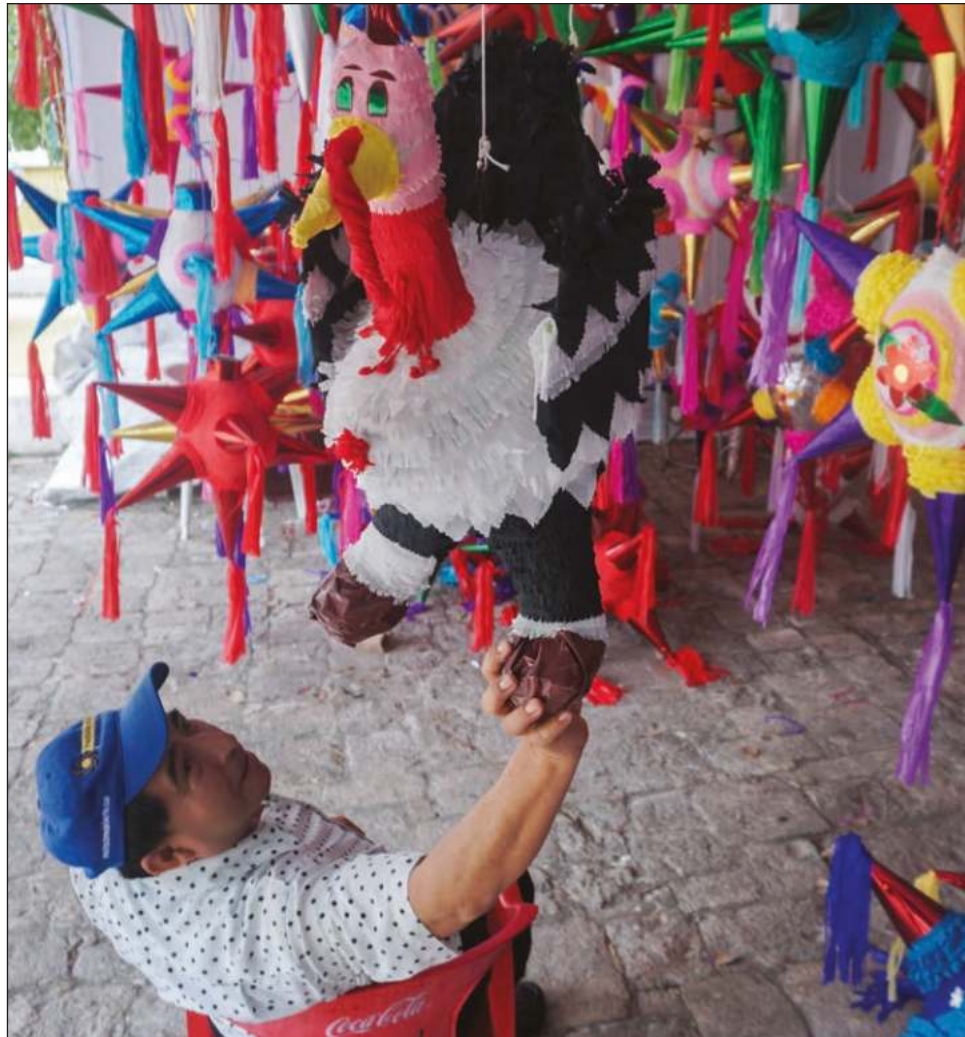
▲ Eventos como la Feria de la Piñata ayudan a inyectar recursos a los micro, pequeños y medianos empresarios y emprendedores.

La inauguración de este evento fue este viernes 10 de diciembre en la Alameda "Francisco de Paula Toro" junto al mercado principal, en punto de las 18 horas, como indicó el subdirector de Promoción Económica.