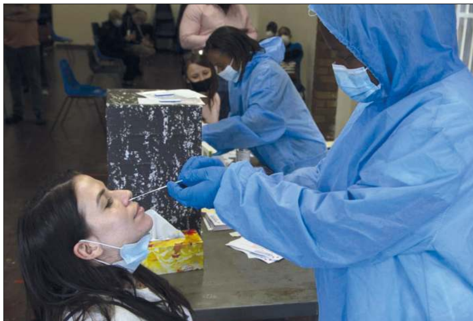
▲ El organismo señaló que aún no cuenta con datos suficientes para establecer el nivel de gravedad del cuadro clínico que genera la nueva variante.

Pero por el momento, la falta de mayor información impide afirmar si la tasa de transmisión de ómicron se debe a que logra sortear la inmunidad, a que sus características la hacen más contagiosa o una combinación de ambos factores.