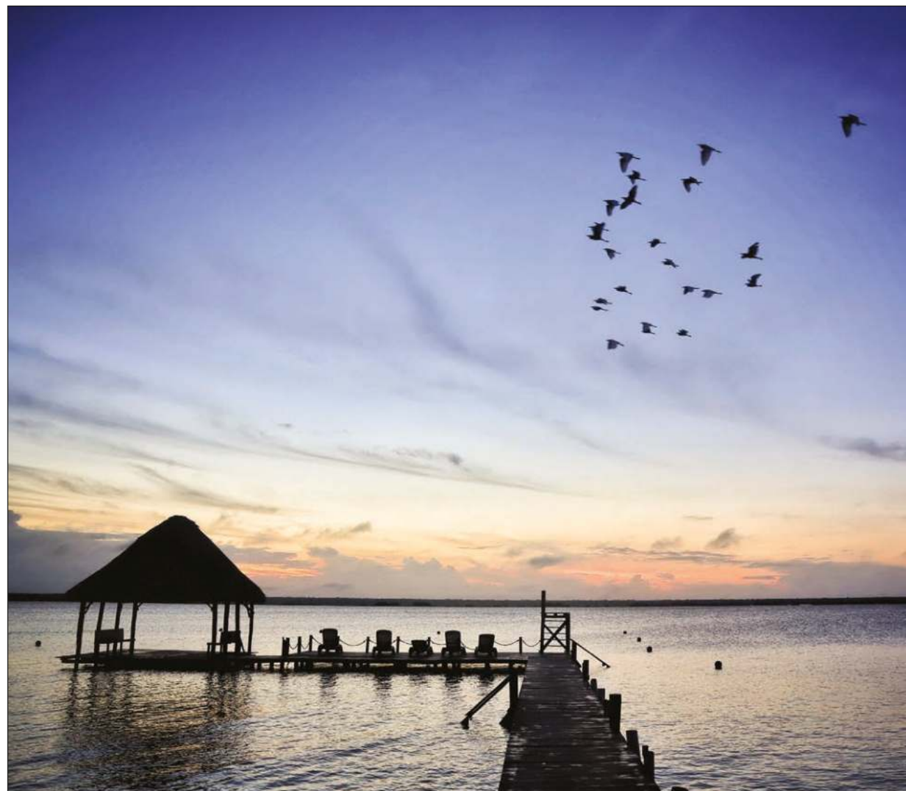
▲ La situación en la laguna de los siete colores, a decir del organismo dedicado a estudiar la cuenca de este cuerpo de agua, ha empeorado durante la última década.

“Ahora son beneficiarios del área protegida, y debemos seguir buscando esos diálogos, ir demostrando con casos de éxito como de México y el extranjero, cómo cuidar Bacalar bajo el es-