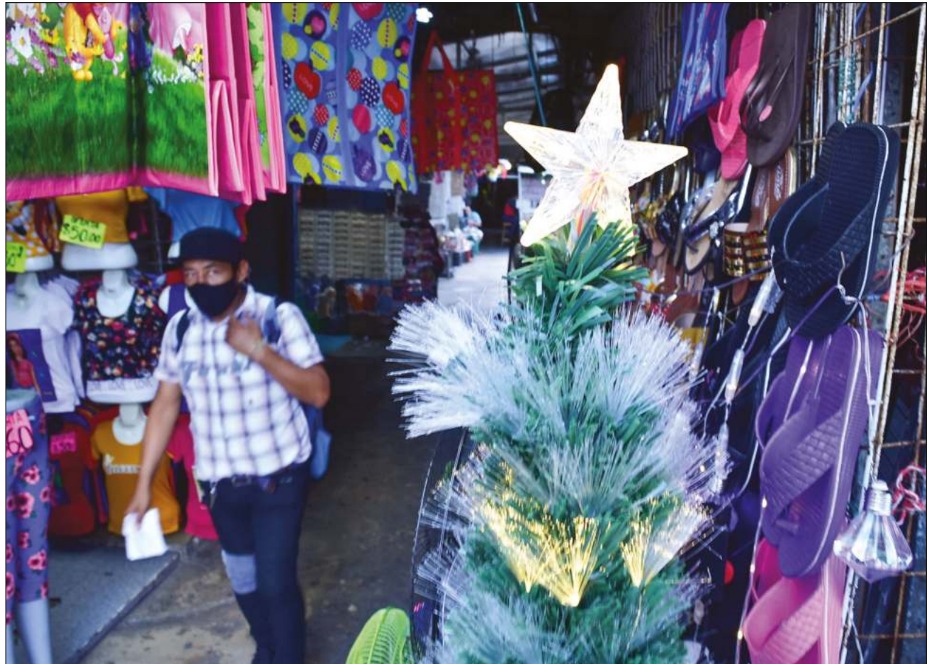
▲ Basado en el Semáforo Epidemiológico Nacional, la entidad se mantendrá en color verde hasta el 26 de diciembre.

Y es que según el reporte de este viernes, hay dos casos positivos nuevos y cero defunciones, cifra considerada positiva y que tenía más de dos meses sin presentarse, por lo que hoy anuncian dos semanas de riesgo bajo.