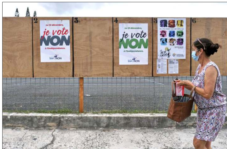
▲ Este evento es el tercer referéndum desde los Acuerdos de Matignon de 1988, que buscaron cerrar una crisis entre indígenas y descendientes de colonos.

En una alocución solemne desde el Eliseo, Macron pidió una recepción “respetuosa y humilde” del resultado, señalando que “el