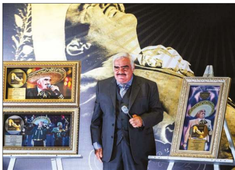
▲ Ya no bastaron los aplausos para que Chente siguiera cantando.