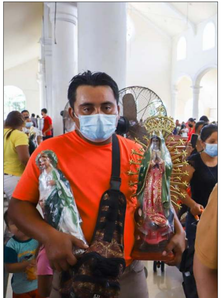
Para la fe, poco importan las restricciones de aforo, de distancia. Igual se llega de la mano del acompañante en la peregrinación que se crea una comunidad en la que no importa la sana distancia, porque el guadalupanismo une.