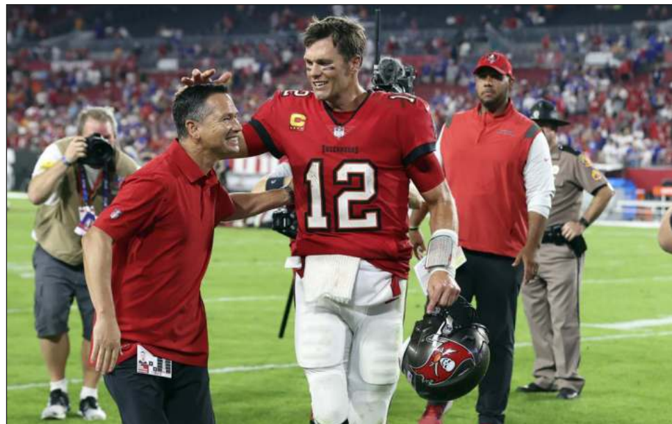
▲ Tom Brady, tras la victoria de los Bucaneros.

Brady, quien dominó a Buffalo y ganó 17 cetros de la División Este de la Americana durante un periodo de dos décadas con los Patriotas