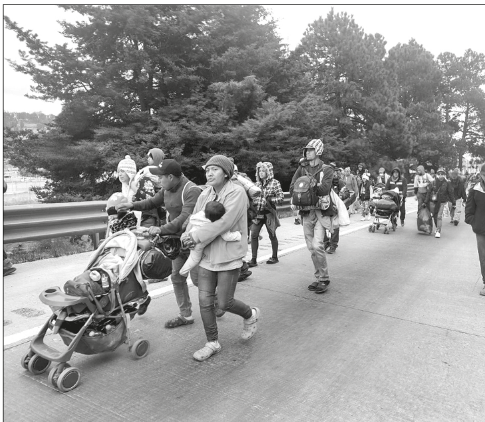
▲ La caravana avanza lentamente, a pesar del frío y de que algunos traen consigo niños y bebés.

A los intentos por frenar a la caravana también se ha sumado el embajador de Estados Unidos en México, Ken Salazar, quien ha afirmado que los líderes de la movilización están vinculados con grupos del crimen organizado, en particular con traficantes de personas.