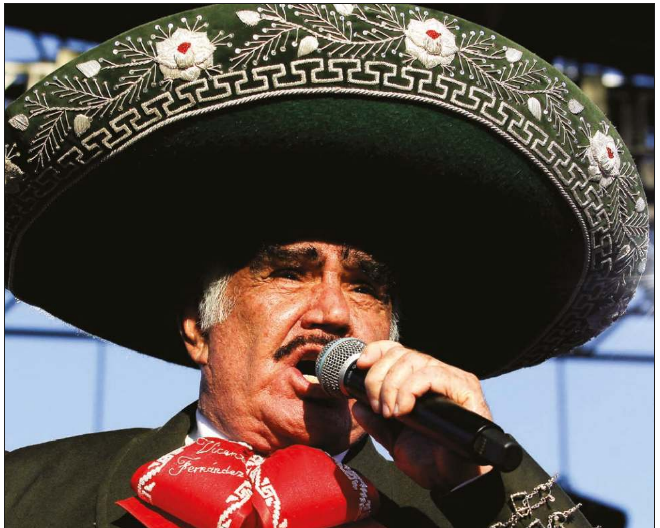
▲ Ícono de la música ranchera, Vicente Fernández tuvo una trayectoria artística de más de medio siglo.

Vicente Fernández nació el 17 de febrero de 1940 en Guadalajara, Jalisco, y fue uno de los artistas mexicanos más populares y reconocidos, no solo en su país natal, sino también en toda América Latina, EU y Europa.