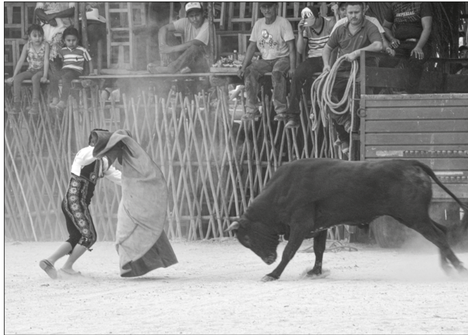
▲ Cada uno de los 106 municipios yucatecos tiene su feria y su respectiva corrida de toros.

Al respecto, el representante de la empresa Toros Yucatán, indicó que lo que pasó en CDMX fue el intento de un político por llamar la atención, pero no pasó a más.