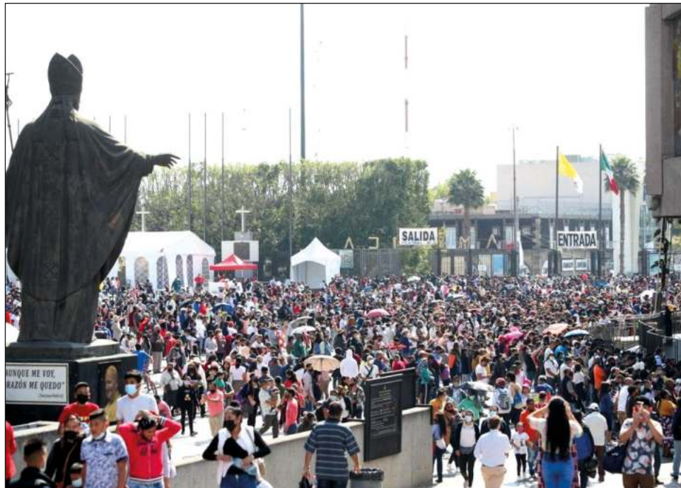
Las autoridades capitalinas señalaron que, al corte de ayer, mantenían saldo blanco por la celebración mariana.

Cerca del mediodía, el trayecto desde la reja de entrada al atrio y hasta la salida del templo, tras pasar por algunas de las cuatro bandas que están frente a la imagen de la Virgen, tomaba unos ocho minutos; dos horas después ya eran 11 y por la tarde subieron a 15, es decir, casi