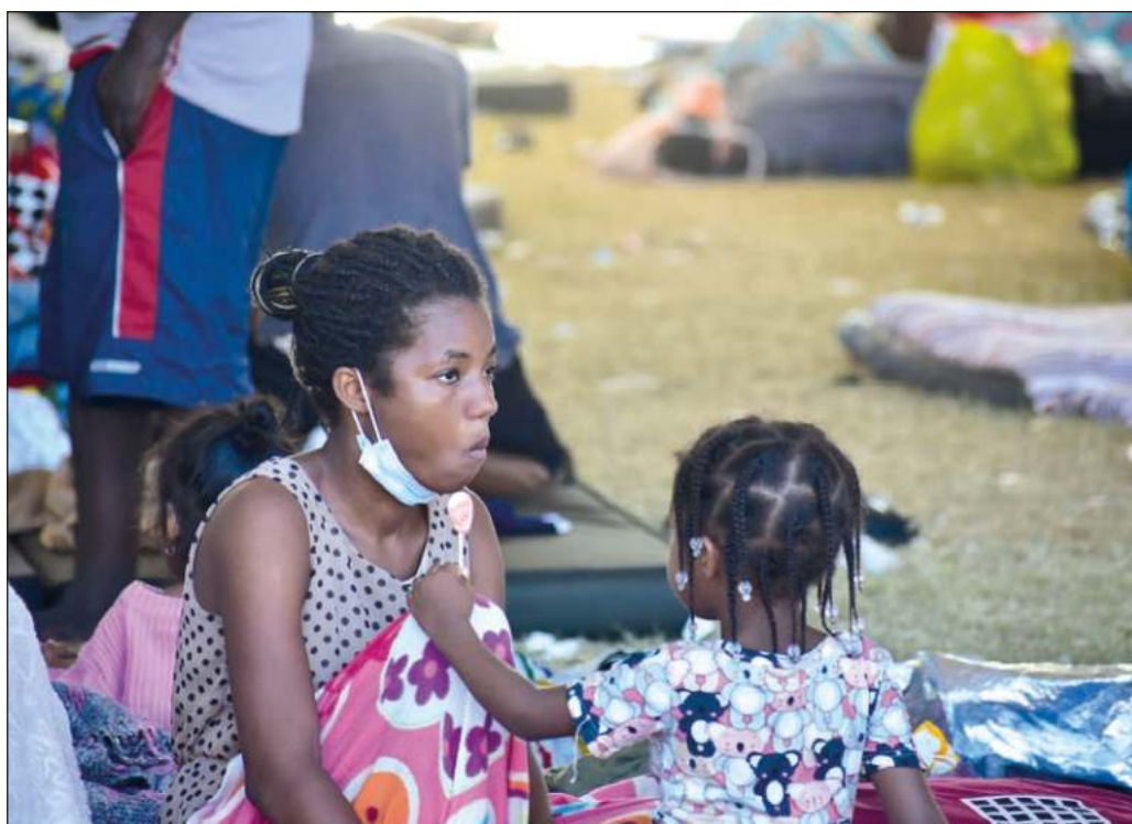
▲ Detrás de las redes de tráfico de personas hay centenares de miles que buscan desesperadamente llegar a Estados Unidos.

Por lo dicho, resulta evidente que el combate al tráfico de personas no puede ser sino el primer paso de un plan integral de tratamiento de la migración. Ya sea que se retomen las propuestas del mandatario mexicano o que se elaboren otros programas, lo cierto es que debe irse más allá del paradigma de la contención, pues sólo atendiendo a las causas del fenómeno migratorio se evitará la repetición de tragedias tan dolorosas como la actual.