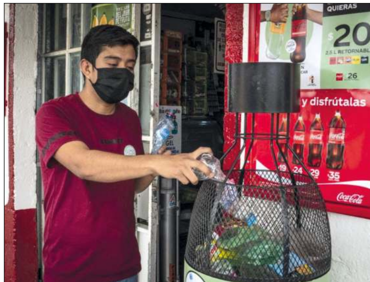
Buscan reducir residuos plásticos en espacios comunes.

La meta para la primera etapa es implementar esta iniciativa en cerca de 400 tienditas a finales de este año en más de 10 entidades del país con el fin de