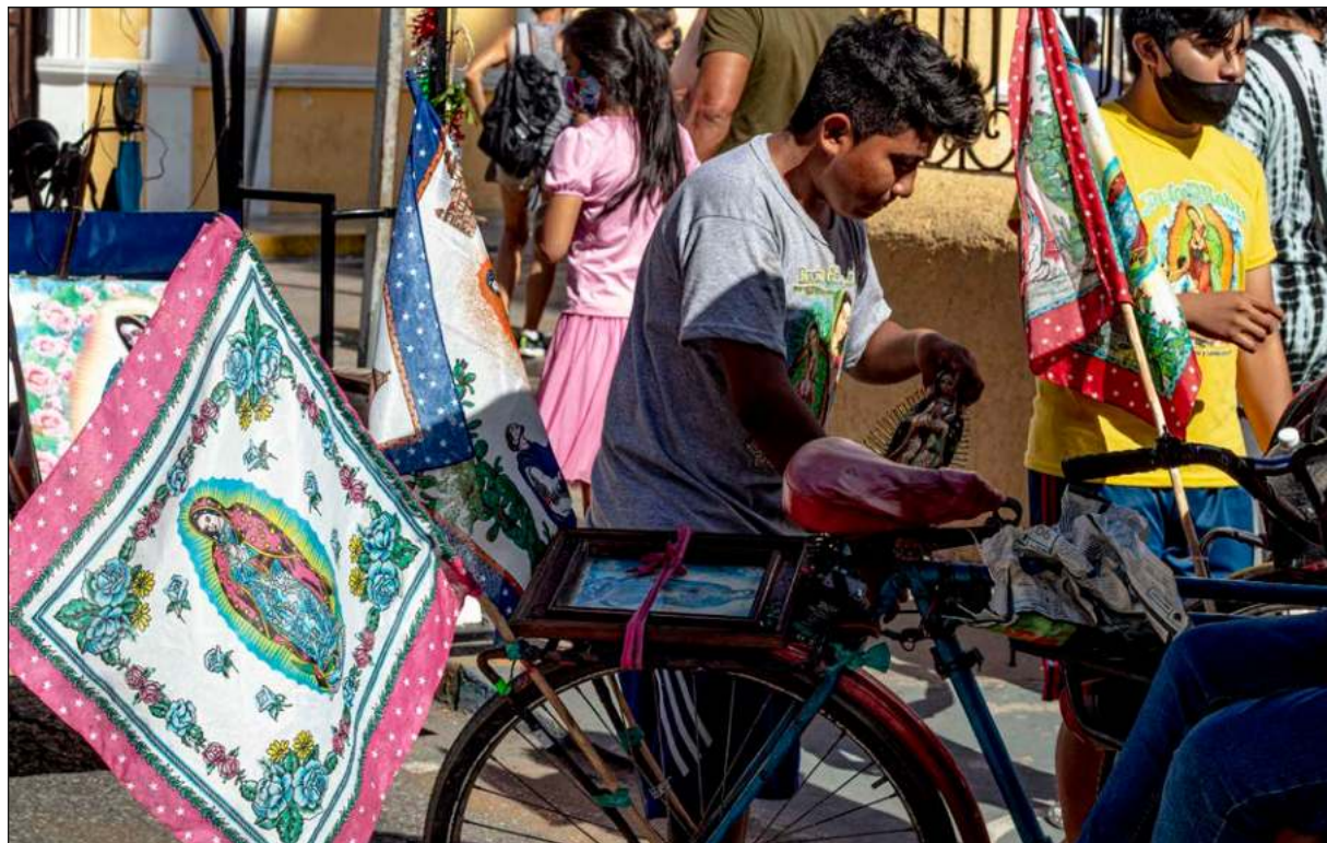
A pie, en caravana, en recorridos cortos o largos, pero con mucha fe, llegan peregrinos para celebrar a la Virgen María.

Durante el camino coincidió con personas de Umán, Halachó, Maxcanú y de municipios de Campeche;