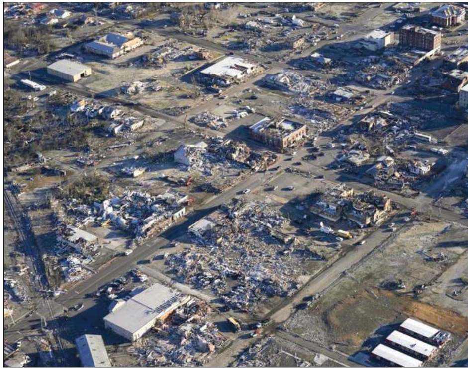
▲ La génesis del enjambre de tornados fue una serie de tormentas eléctricas nocturnas, incluida una que se formó en el noreste de Arkansas.

Pero ningún lugar sufrió tanto como la pequeña ciudad de Mayfield, Kentucky, donde los potentes tornados, que según los meteorólogos son inusuales en invierno, destruyeron una fábrica de velas y las estaciones de bomberos y policía.