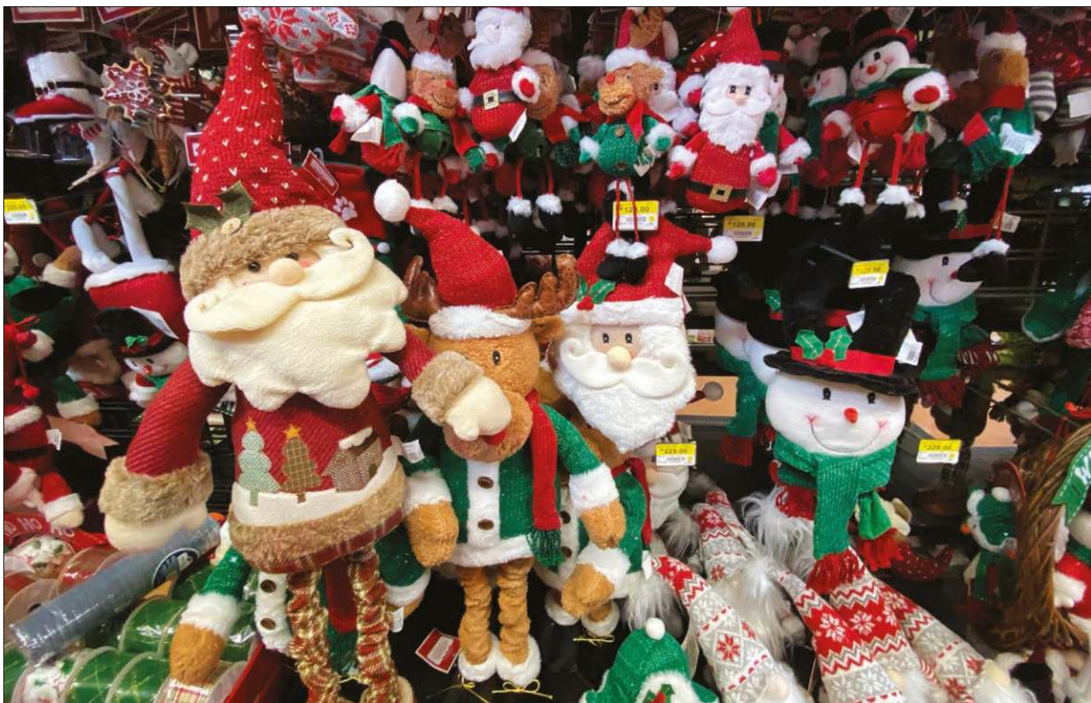
▲ ¿En qué momento la mercadotecnia nos transformó en estos energúmenos a los que nos pica el aguinaldo, y nos urge a gastarlo?