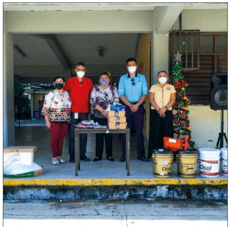
La concesionaria entregó a la Escuela General N°10 Ignacio Zaragoza, equipo para los baños y otras áreas.

Con estas acciones Aguakan promueve y orienta al personal educativo a elaborar una estrategia de trabajo que identifique las necesidades en materia de mantenimiento y cuidado de las instalaciones hidráulicas, con el objetivo de contar con servicios de agua adecuados dentro de la institución académica, a fin de que los alumnos puedan seguir desarrollando y fortaleciendo su formación académica.