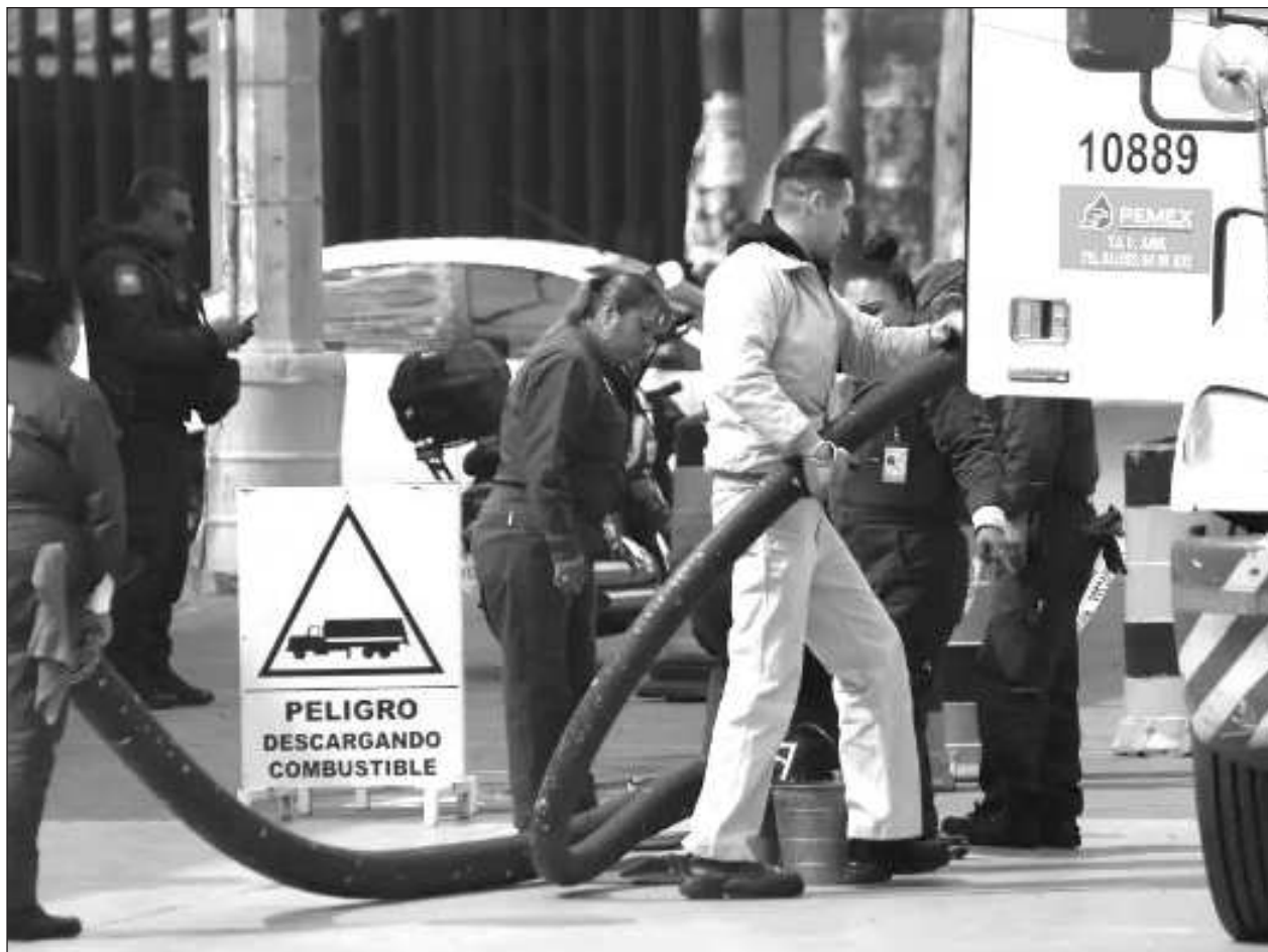
▲ La organización Jóvenes Empresarios A.C. expuso que es urgente que el Congreso del estado se pronuncie en respaldo y apoyo a los proveedores, que atraviesan por severos problemas financieros, "algunos de ellos al borde de la quiebra".

En la imagen difundida en redes sociales, se puede apreciar el logotipo del Consejo Coordinador Empresarial de Ciudad del Carmen, organismo que se deslindó de esta convocatoria, asegurando que llevan a cabo gestiones, dentro del marco legal a nivel local.