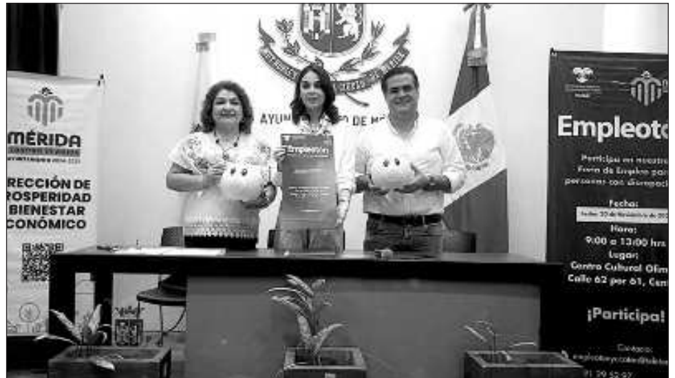
▲ Los organizadores del evento -autoridades del sector estatal y municipal- dieron a conocer que 13 empresas empleadoras participaran en la nueva edición del encuentro.

“Al personal que va a estar a cargo de estos proyectos se le facilitan talleres de sensibilización y capacitación. Hacemos visitas a las