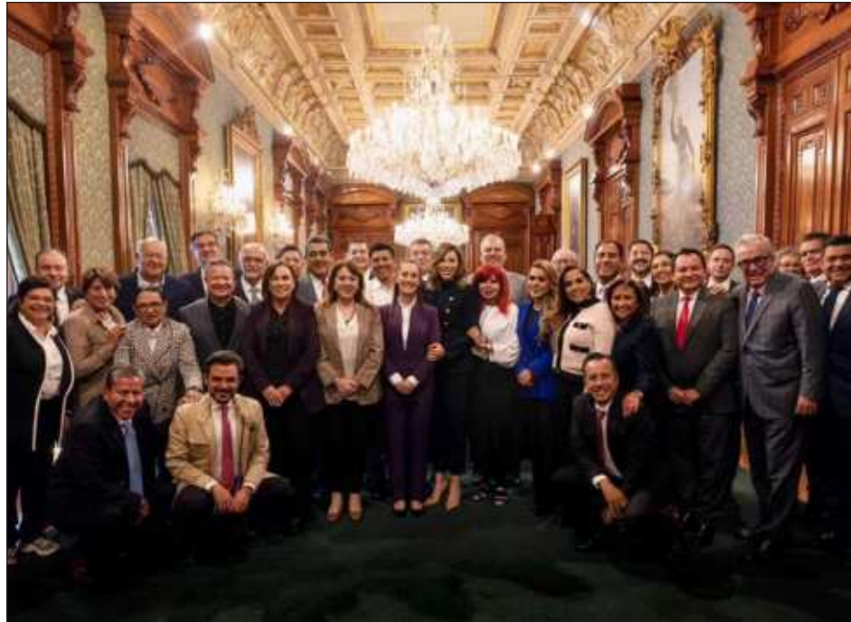
▲ La gobernadora y sus homólogos sostuvieron un encuentro con la presidenta Claudia Sheinbaum Pardo en Ciudad de México.

Se tocaron temas del IMSS-Bienestar, avances de los nuevos hospitales, de los asuntos laborales del personal de salud, mejora de