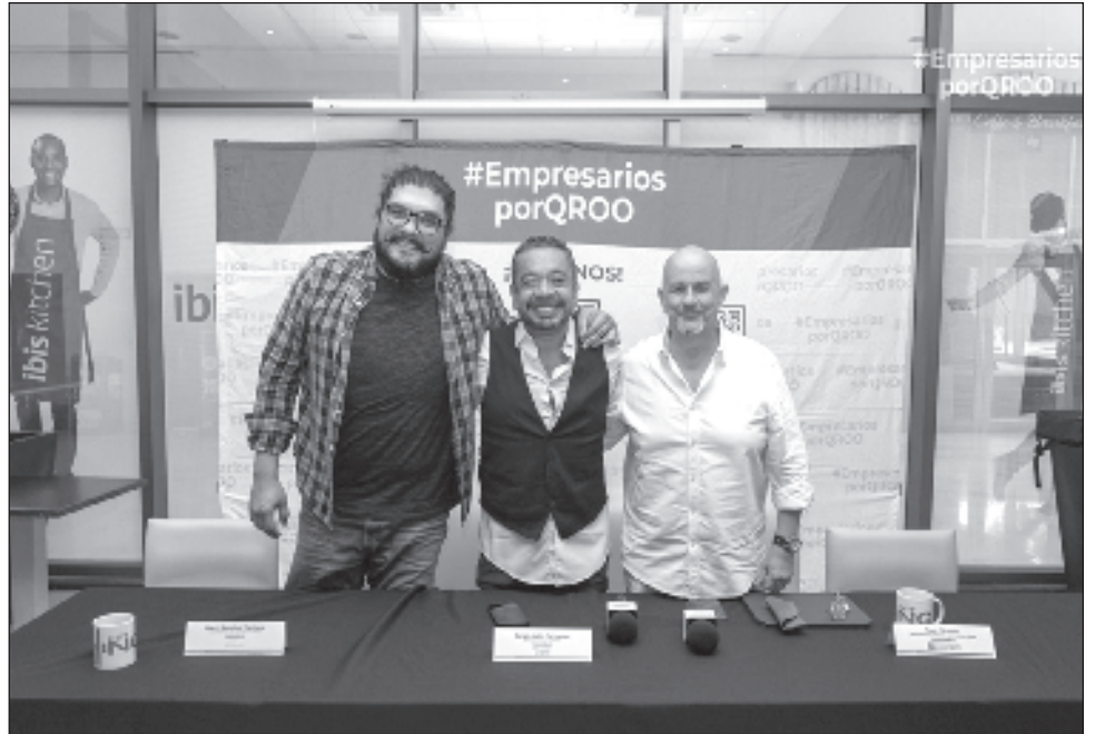
▲ En total fueron once las empresas mexicanas que participaron en el evento Americas Freight Cargo Conference, de las cuales hubo cinco quintanarroenses y seis entre Jalisco, Nuevo León, Ciudad de México y Veracruz.