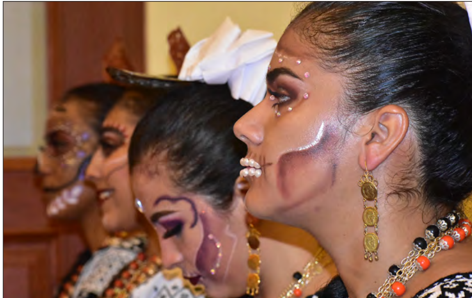
▲ Parte esencial del evento es formar parte de la escenografía, con las catrinas.

El motivo de la cancelación es la pandemia, que aún no está erradicada. El sector turismo dejará de percibir durante esos días al menos 35 millones de pesos, pues dicha eventualidad atrae a turismo nacional y extranjero.