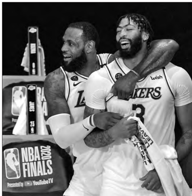
▲ LeBron James y Anthony Davis, artífices del título de los Lakers.

El domingo, tras una dominante victoria ante el Heat de Miami en el sexto partido de las finales, empataron a los Celtics de Boston como los máximos ganadores en la historia del