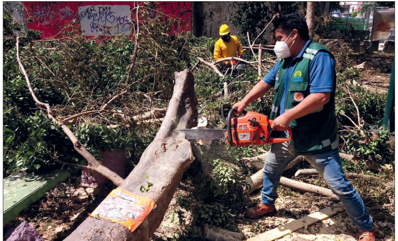
▲ El paso de los sistemas tropicales por el estado dejó afectaciones como árboles y postes de luz caídos, obstruyendo vialidades.