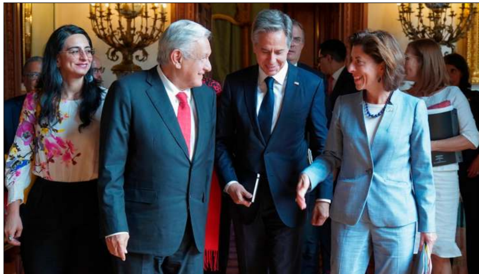
▲ Según publicó en redes el presidente López Obrador, la reunión con los secretarios estadounidenses Antony Blinken y Gina Raimondo fue "productiva y amistosa".

Luego de la reunión a puerta cerrada que se realizó