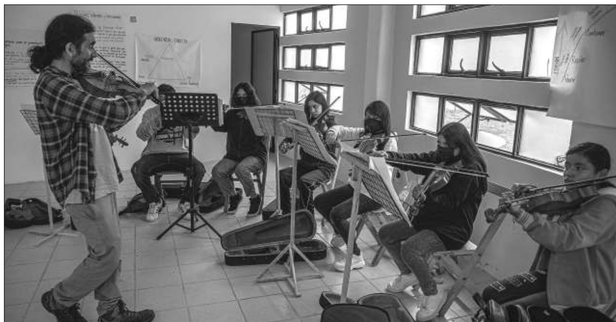
▲ El coro y la sinfónica Por la paz de la zona norte reactivó espacios culturales en San Cristóbal de las Casas.

“Por ello la participación ciudadana es fundamental para erradicar la violencia, ayudar al orden social y salvaguardar a la niñez y juventud”, concluyó el especialista en seguridad social que ha estudiado la problemática de esta zona.