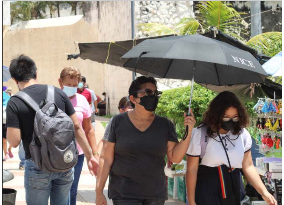
▲ De los casos activos, 267 están estables, aislados y con síntomas leves.

Como ya se mencionó, 13 de los casos positivos están en hospitales públicos y en aislamiento total. Hay otros pacientes a la espera de diagnóstico.