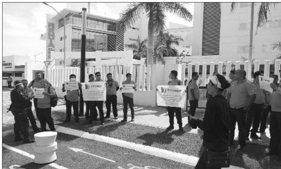
▲ La manifestación de los operadores se replicó en la ciudad de Playa del Carmen y en el encierro de vehículos ubicado en el ejido de Alfredo V. Bonfil.

“Hemos hablado con él, quisimos dialogar para no pasar la autoridad del jefe, pero no ha habido una solución, dijo que iba a haber