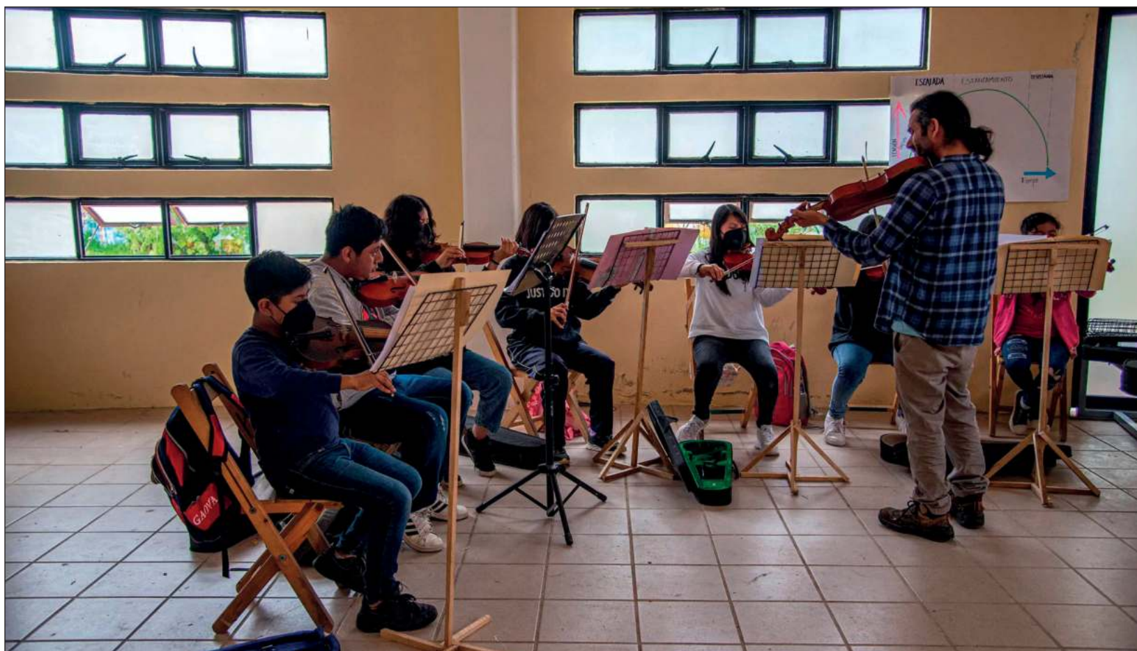
▲ En una de las zonas más conflictivas del sureste mexicano, jóvenes indígenas tzotziles con padres desplazados de sus comunidades, se unieron en una orquesta y un coro para romper la violencia.