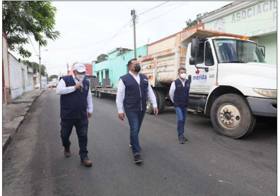
▲ El alcalde supervisó la rehabilitación de la calle 44 entre 65 y 67 de la colonia Centro, junto con los directores de Obras Públicas y Servicios Municipales.

Finalmente, se han atendido 23 mil 4 reportes ciudadanos recibidos, de los cuales 21 mil 979 ya fueron atendidos, equivalente a un 95.5% de avance.