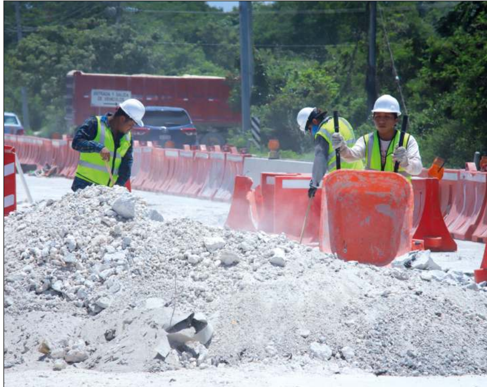
▲ Los sindicatos trabajan ahora en la mejora de salarios para nivelar lo que se percibe contra la inflación, que ha alcanzado niveles históricos.

En cuanto a los salarios, la legislación de hoy ayuda, en el sentido de que se acabaron los outsourcing y las pocas terciarias que hay están bien reguladas, lo que