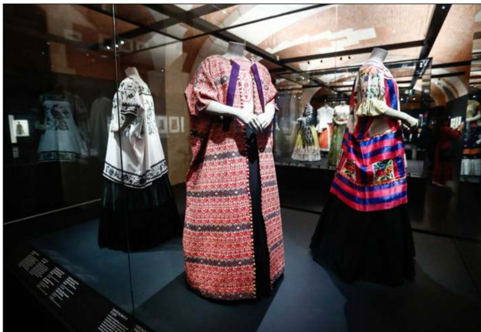
▲ La muestra Frida Kahlo, más allá de los clichés exhibe más de 200 objetos procedentes de la colección personal de la artista, descubierta en La Casa Azul en 2004.

Como toque propio, París añade a la muestra creaciones de grandes diseñadores contemporáneos como Alexander McQueen; Jean-Paul Gaultier; Chanel; Maria Grazia Chiuri, en Dior, o Riccardo Tisci, en Givenchy, que bebieron, directa o indirectamente, de la inagotable fuente de estilo e inspiración que fue Frida Kahlo.