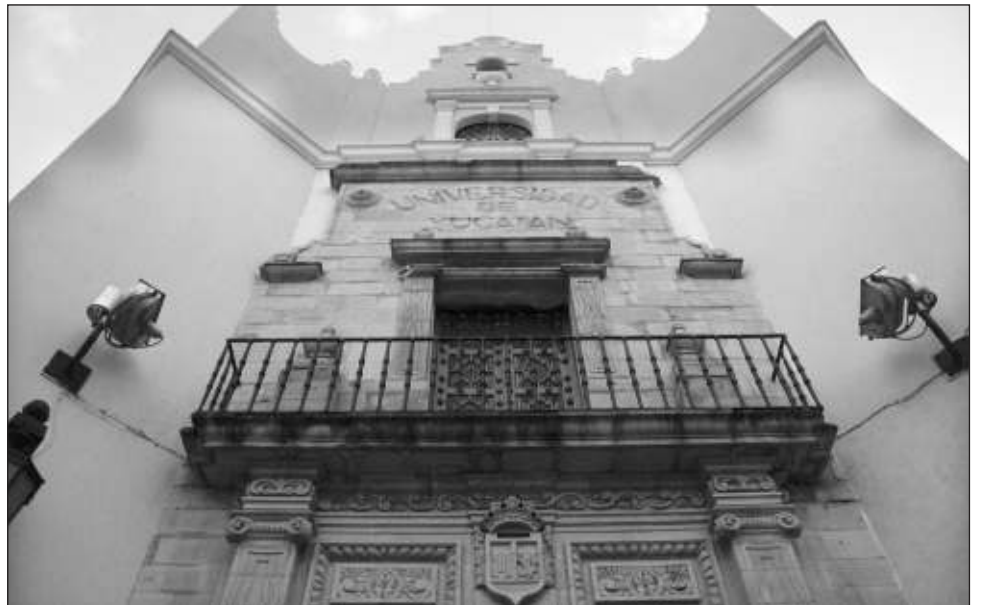
▲ Especialistas internos y externos a la institución educativa de Yucatán se encuentran apoyando a la comisión para evaluar el documento y proponer cuál debería ser la versión final.