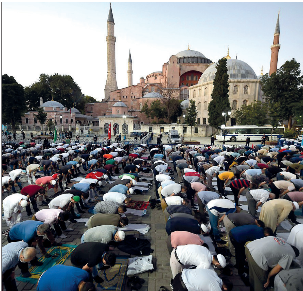
A diferencia de la decisión militar de 1943, el cambio de estatus de Santa Sofía se dio como resultado de una iniciativa cívica.

ferían tener un museo o un templo, sólo les fue impuesta una decisión que acabó con su centro religioso.