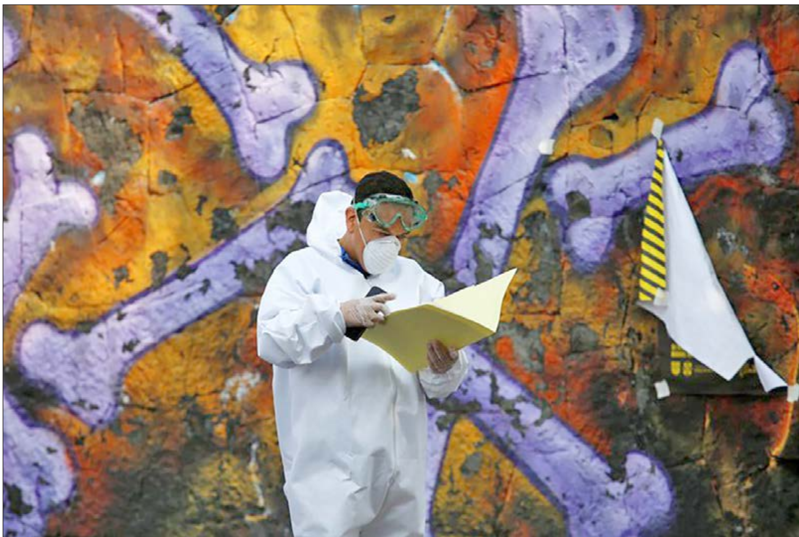
▲ La ocupación hospitalaria en Bacalar y Felipe Carrillo Puerto se encuentra al límite; la capital del estado, al 75%.

ENTIDAD ACUMULA MÁS DE 5 MIL CASOS Y 699 MUERTES