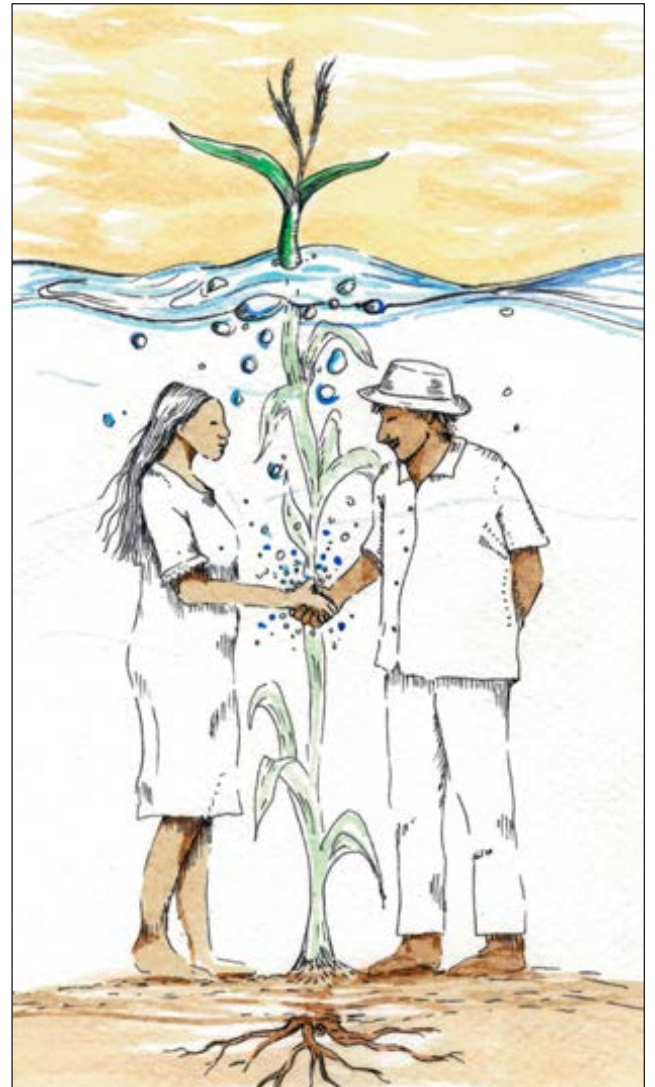
El desarrollo comunitario se basa en la cooperación entre sus miembros y el respeto a la naturaleza. Ilustración Sergiopv @serpervil

Indicó que falta que la figura de cooperativa esté bien definida en el marco legal, en torno a los derechos culturales y económicos.