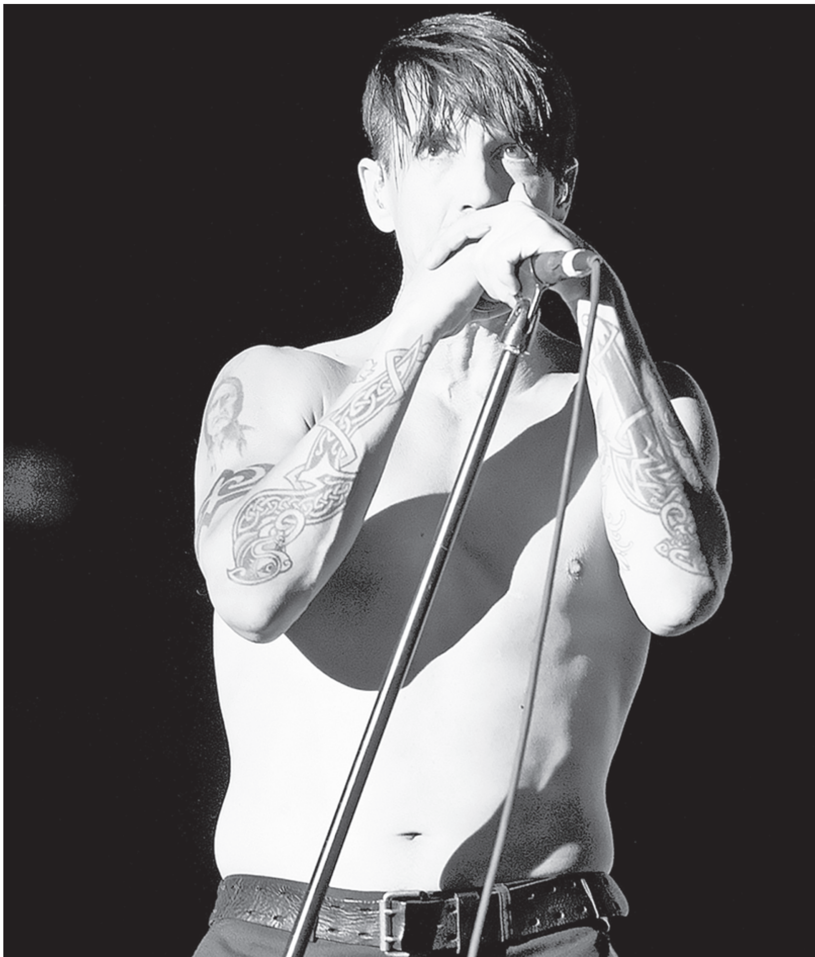
▲ En Scar Tissue (Capitán Swing, 2016), biografía del vocalista de Red Hot Chili Peppers, Anthony Kiedis –en imagen de archivo– da cuenta de las vivencias de su infancia, sus acercamientos y abusos con las drogas, entre otros pasajes. El título

del libro del músico también es el nombre de un sencillo del séptimo álbum de la banda –con la cual no ha grabado desde hace cuatro años– dedicado a la pintora Frida Kahlo. ESPECTÁCULOS /P 24