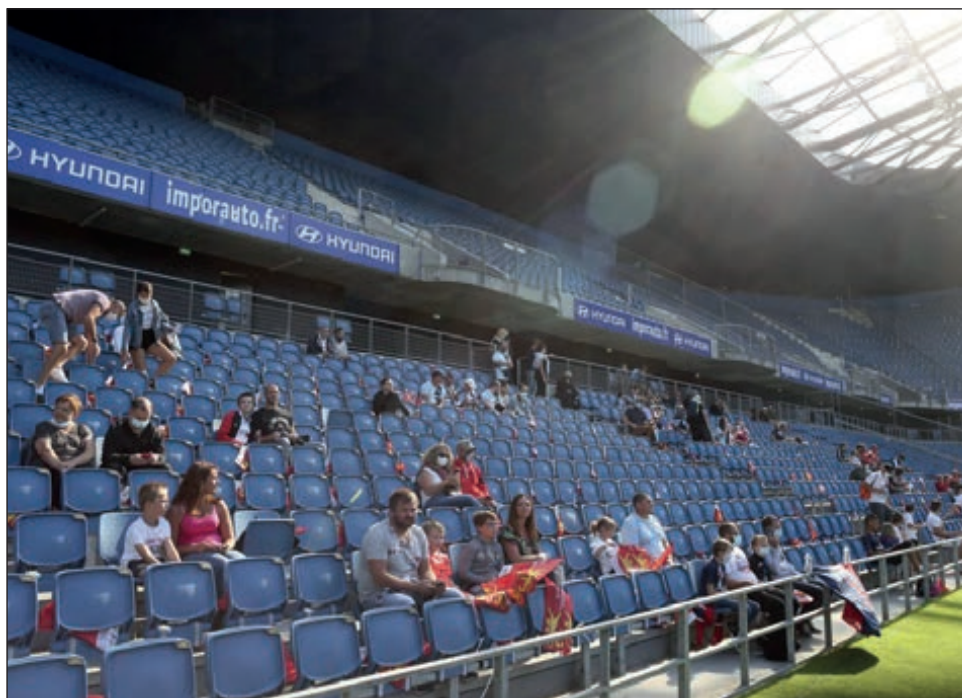
▲ Cinco mil aficionados presenciaron la goleada del PSG a un equipo de segunda división.

Dentro de las cinco principales ligas de Europa, la de Francia es la única que ha permitido la vuelta de espectadores a los estadios. Alemania completó su tem-