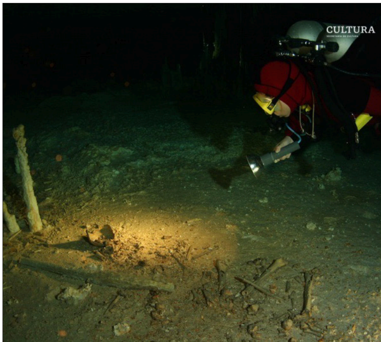
▲ Se han encontrado especies de camélidos, caballos y perezosos gigantes en la isla de Cozumel.