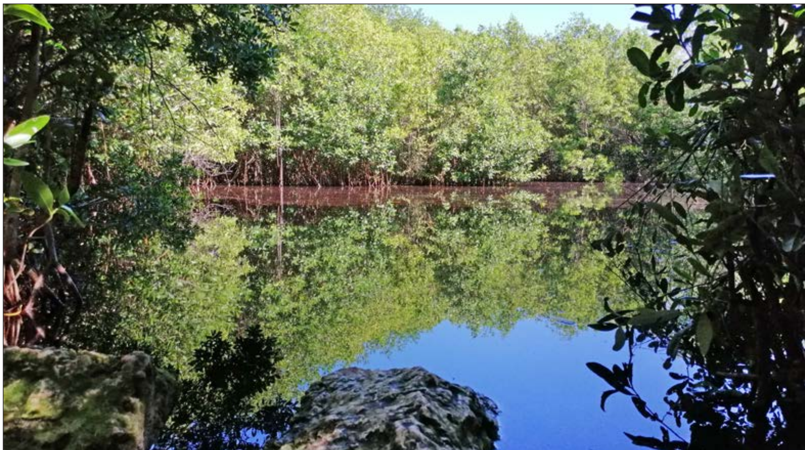
▲ El programa sectorial de turismo contempla el desarrollo de circuitos turísticos de bienestar social en armonía con la naturaleza.