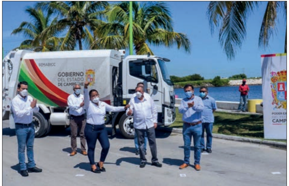
▲ Para la operación de vehículos se entregó 50 mil pesos en vales de combustible. En la imagen, el gobernador Carlos Miguel Aysa con Angélica Herrera Canul, presidente de la junta municipal de Sabancuy.

Como parte del Programa Concurrencia, en el que de manera tripartita, el gobierno federal, el gobierno del estado y los productores hacen una aportación, apro-