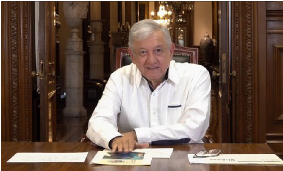
▲ "Quiero dar tranquilidad en la medida de la circunstancia, en circunstancias difíciles la seguridad de que vamos a salir adelante", señaló el Presidente.