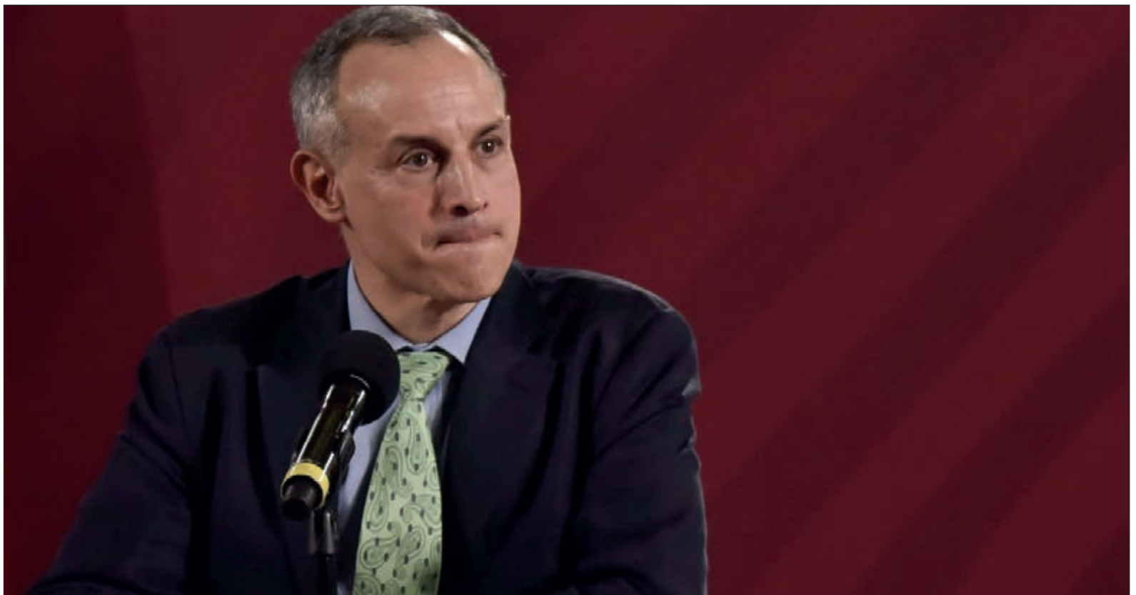
▲ La Subsecretaría federal de Prevención y Promoción de la Salud decidió ser ante todo espectadora de la vuelta a la normalidad.

*El papel arde a los 233 grados centígrados, tal como lo hace en la inmortal novela de Ray Bradbury, Fahrenheit 451 .