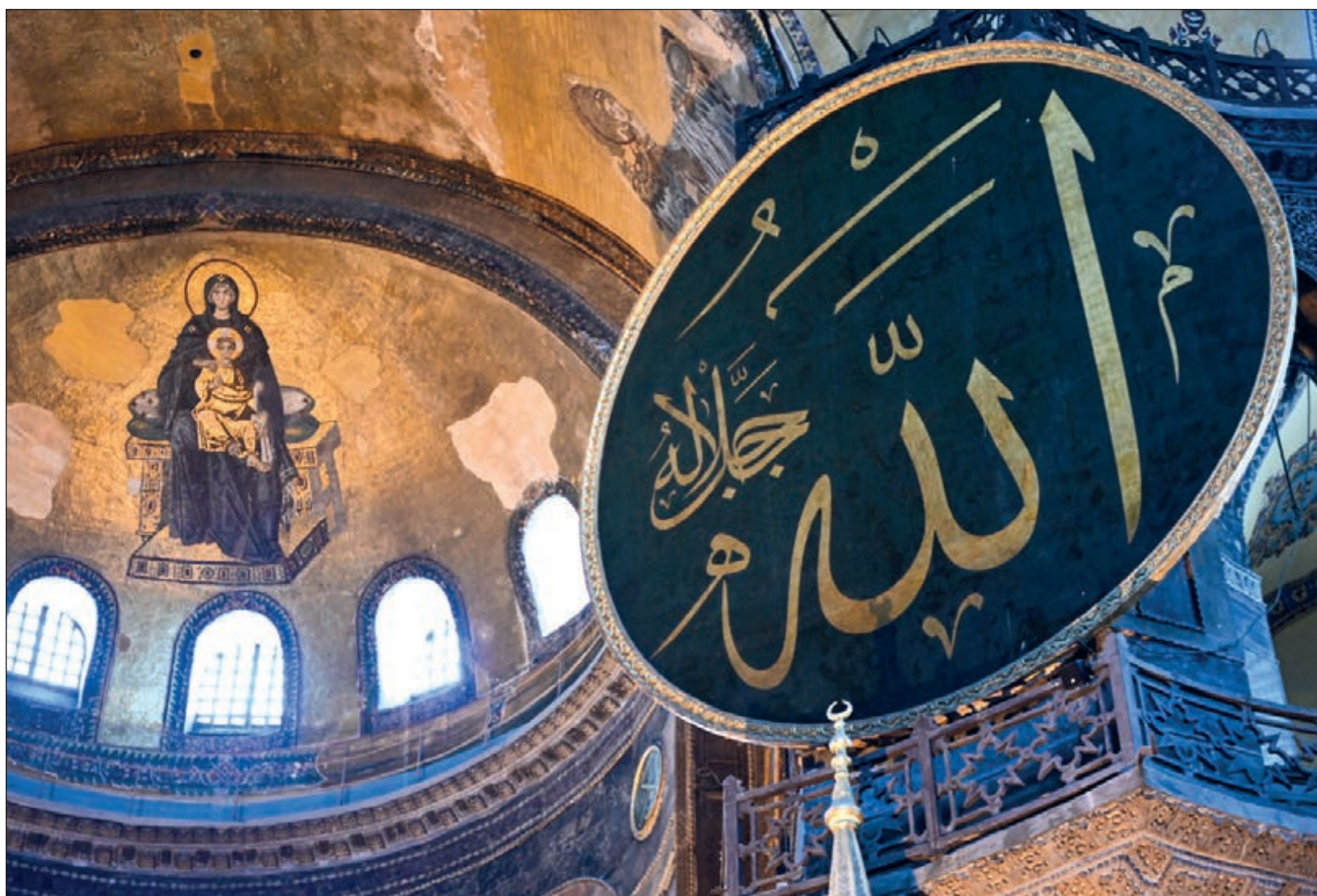
Hagia Sophia no había sido utilizado como centro de adoración cristiana en por lo menos 500 años.

tonces mezquita fue convertida en museo como parte de una campaña nacional para imponer una ideología externa a los habitantes de Anatolia. El laicismo, promovido por la cúpula militar turca que derrocó al sultanato otomano a principios del siglo XIX, era tan extranjero para muchos otomanos como lo es ahora el islamismo para los habitantes de América. La decisión de convertir a la entonces mezquita en museo formó parte de dicha iniciativa oficial que buscaba acabar con los máximos símbolos del esplendor musulmán. A los turcos de entonces nadie les preguntó si pre-