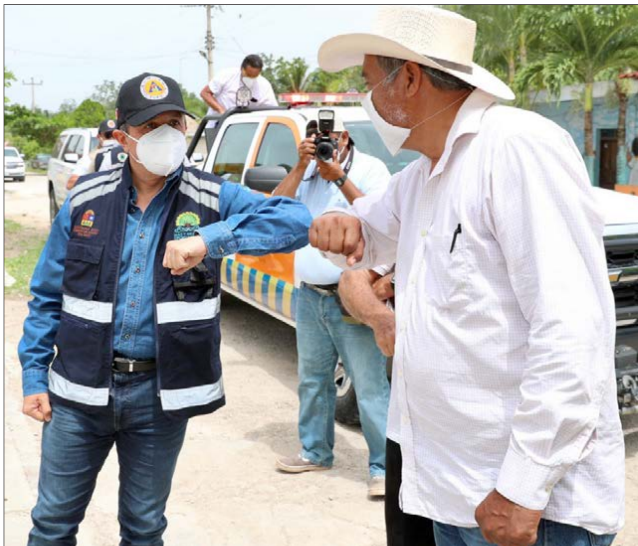
▲ Con acciones en materia de disminución de la movilidad y un proceso gradual, ordenado y responsable, se puede avanzar en la recuperación económica.

Carlos Joaquín dijo que continuarán con el proceso de recuperación anteponiendo el cuidado de la salud e implementando medidas adicionales en disminución de la movilidad, cuando sea necesario por los repuntes en los contagios, como el cierre de vialidades y filtros sanitarios que se instalaron en puntos críticos en Chetumal.