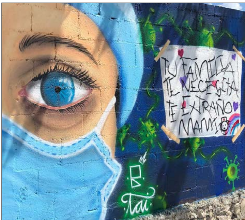
▲ El mural abarca 18 de los 60 metros lineales de la barda que rodea a la primaria Frida Kahlo, en la cabecera municipal de Benito Juárez.