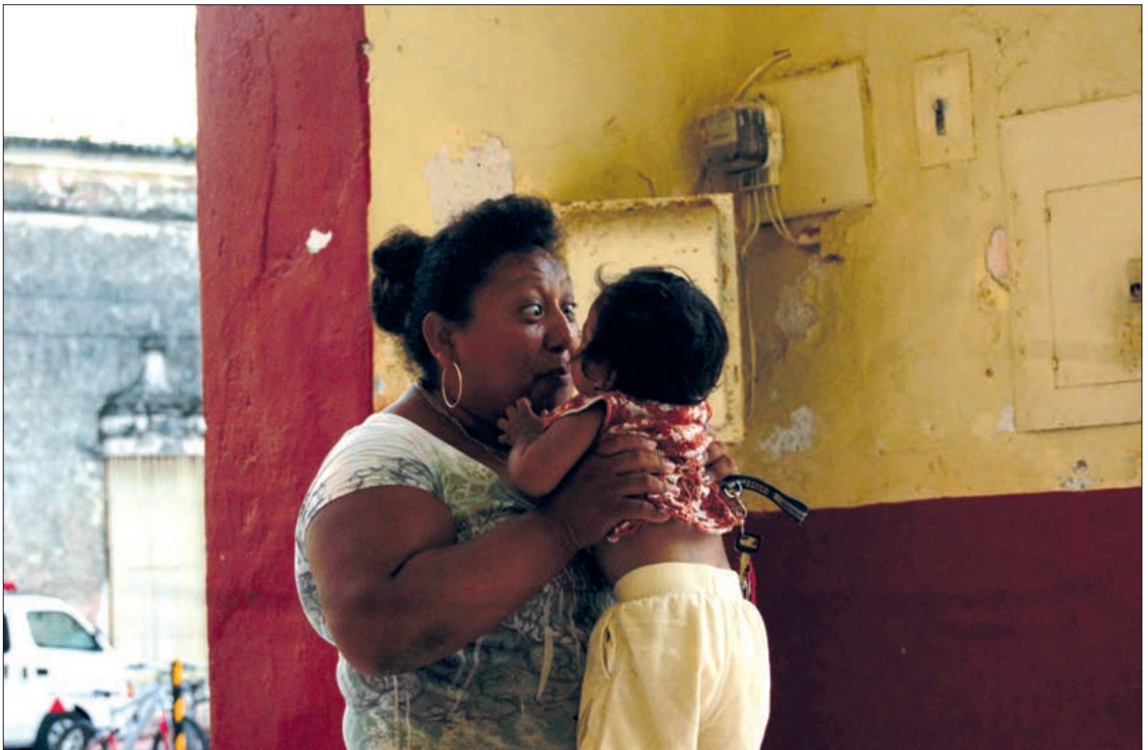
▲ En la cartilla, las mujeres indígenas de la península también exigen el derecho a una maternidad elegida.

Asimismo, el derecho al acceso a la justicia, a la educación formal e informal, al proceso de reparación del daño en caso de violencia; derecho a decidir sobre su cuerpo y autonomía en sus relaciones; a ser o no madres y decidir cuántos y cuándo tener hijos; al acceso a la información pública y a la alimentación de acuerdo a sus pueblos.