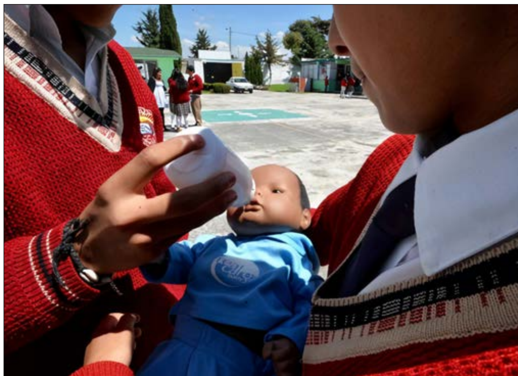
▲ La polémica por el pin parental es áspera en España, y podría serlo en México.

El enfoque propuesto por los promotores del pin parental comenzó a tomar fuerza en España hace un par de años, a instancias del ultraderechista partido Vox, y desató una polémica tan áspera como la que podría desatarse en nuestra nación si dichas iniciativas encuentran eco en las legislaturas locales. De ahí la oportunidad del pronunciamiento de la CNDH sobre la cuestión y su señalamiento de que esas iniciativas, además de ser inconstitucionales, atentan contra los derechos humanos en general y los que conciernen a la niñez y la adolescencia en particular.