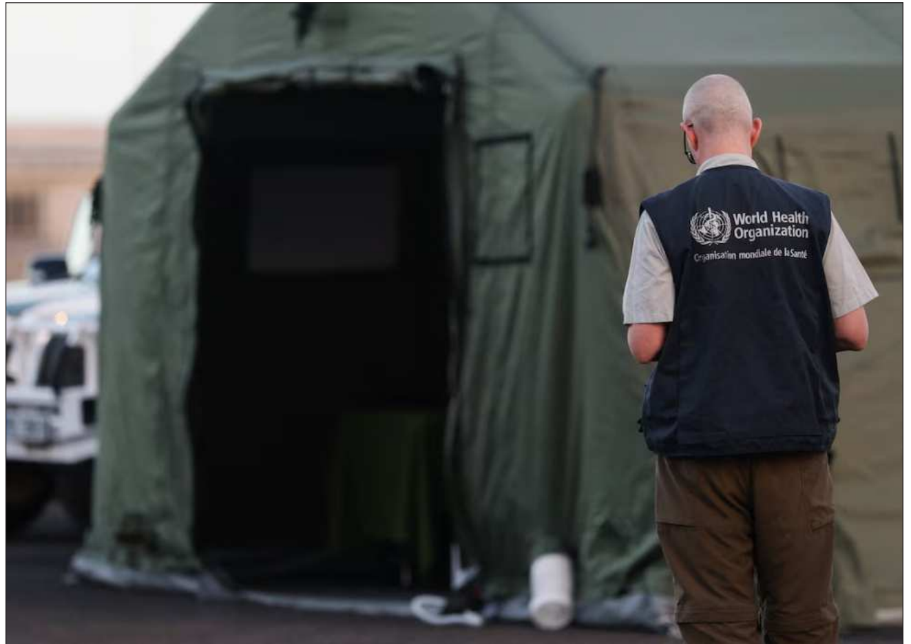
▲ La recomendación de la OMS es que las personas evacuadas sean sometidas a un seguimiento activo durante 42 días.

De los evacuados, por ahora, tres personas han dado positivo por hantavirus, una enfermedad contagiosa poco frecuente para la que no hay vacuna. Son una francesa, un estadounidense y un español.