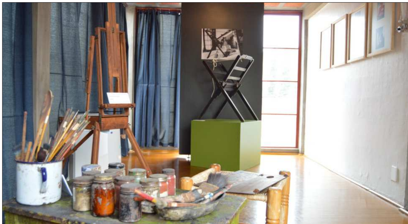
▲ La muestra incluye dos sillones, un perchero y un escritorio originales; el resto del mobiliario fue recreado por el Taller Nacional.

TAL FUE MI susto, que empecé a revolotear para averiguar alrededor de él, y resulta ser que el mexicano que llevó el cactus a esa feria, tiene un hijo que ahora se está haciendo cargo del vejete que es un portento. Pienso que no lo debieron de haber movido de México. Pobrecito.