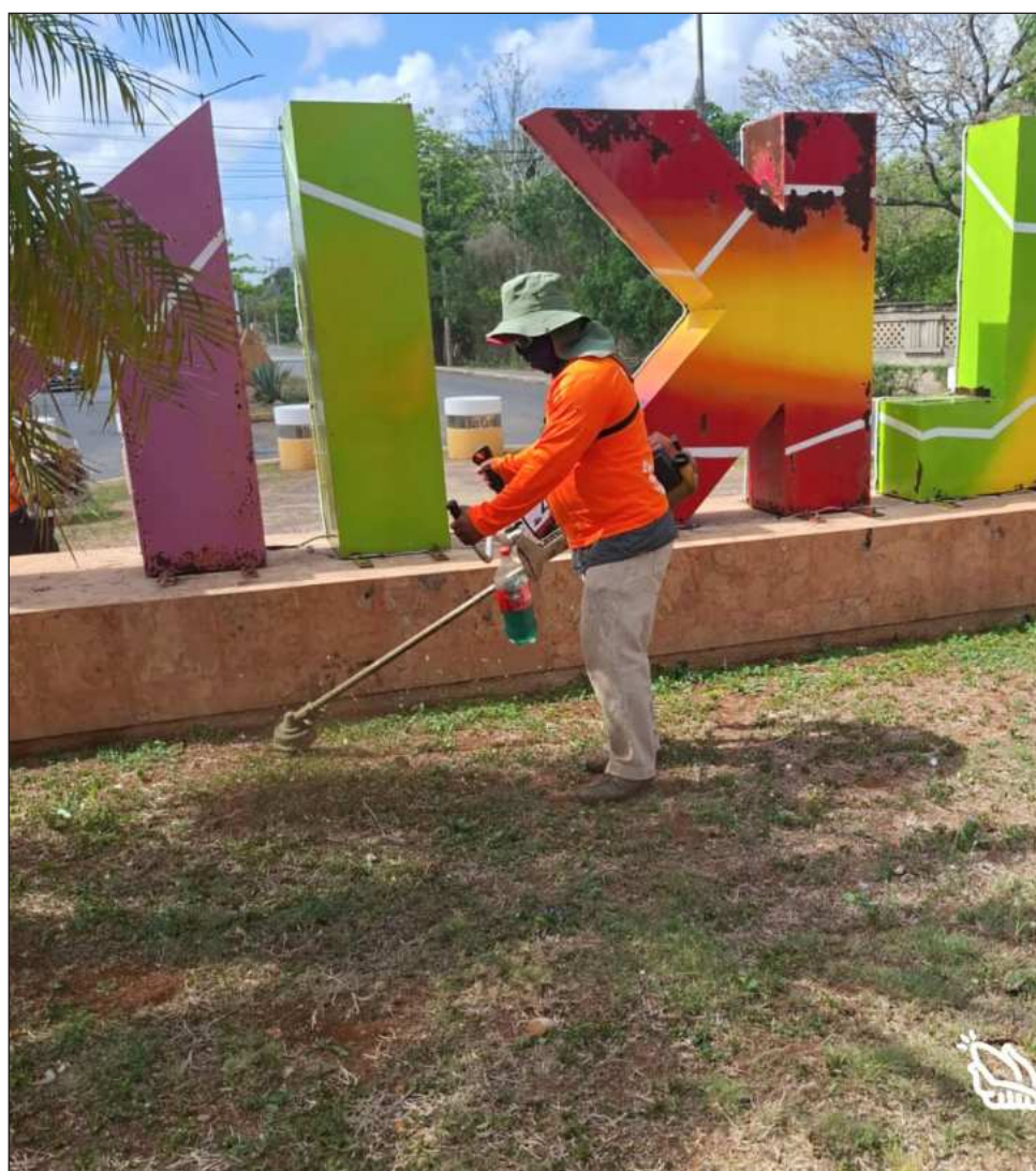
▲ Los ayuntamientos sostuvieron reuniones con sus directores y llegaron a la decisión de modificar sueldos para no dar de baja a los trabajadores.