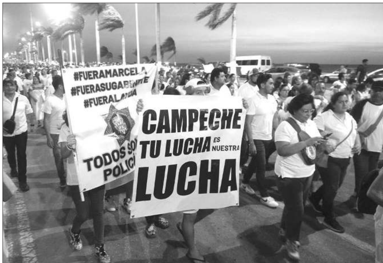
▲ Los elementos policiacos destacaron que se espera la participación de más de 20 mil personas para la manifestación.

De acuerdo con los policías, se espera la llegada de más de 20 mil personas siempre que el gobierno del estado no amenace a transportistas que presten servicio ese día, así como a quienes rentan sus unidades, pues aseguraron que en marchas anteriores pudo haber llegado aún más gente, pero el Instituto Estatal del Transporte