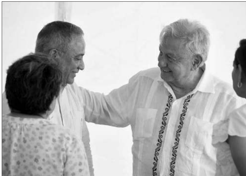
▲ El primer ministro beliceño se mostró interesado en proyectos como el Tren Maya y Sembrando Vida, así como temas de migración y seguridad regional.

"Aquí, en el aeropuerto de Tulum, concluimos un fin de semana de importantes avances en temas prioritarios para el bienestar y desarrollo de Quintana Roo, con nuestro presidente Andrés Manuel