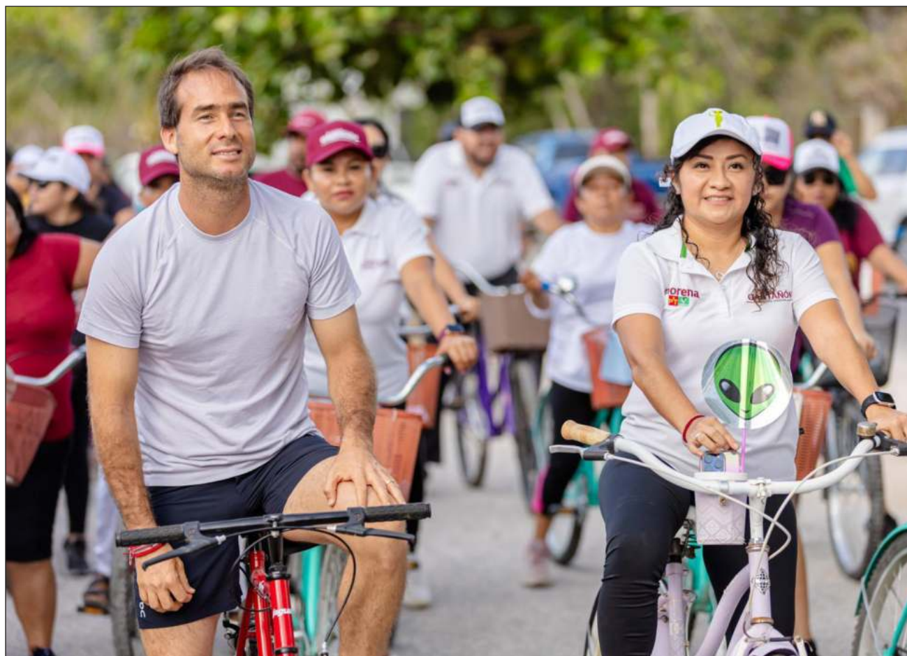
▲ El abanderado de la coalición Sigamos Haciendo Historia anunció que se construirán nuevos espacios deportivos y se rehabilitarán los existentes a fin de fomentar “vidas sanas y alejadas de los malos hábitos”.

Como fiel defensor y promotor del deporte como mo-