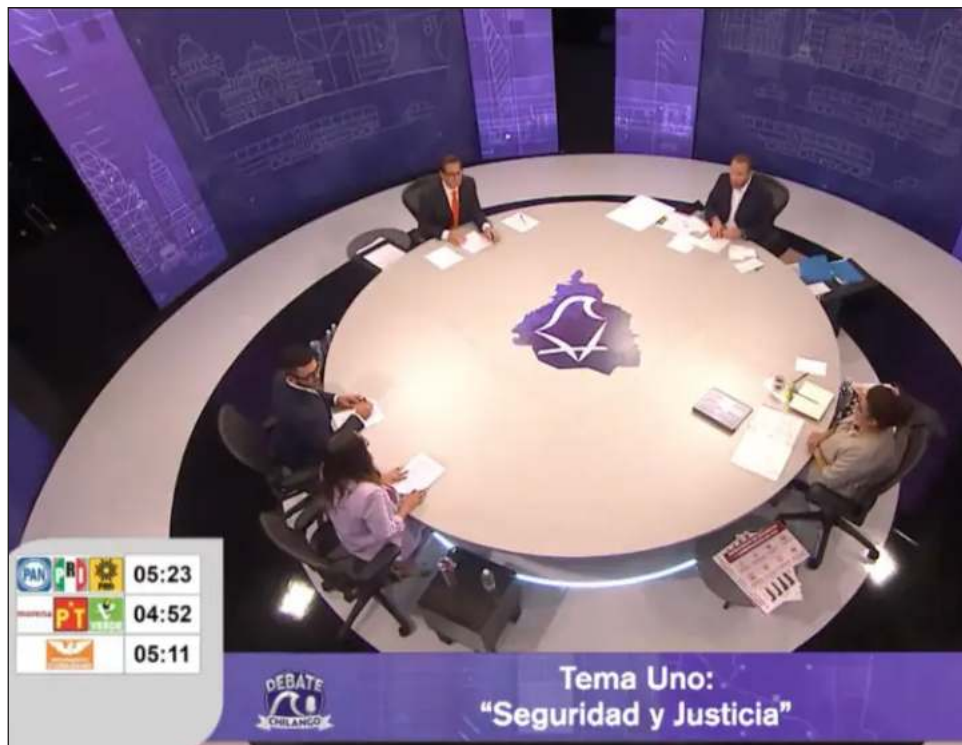
▲ El tercer y último debate incluyó por primera vez la intervención de preguntas de la ciudadanía, y se abordaron temas como la seguridad y el desarrollo urbano. Foto captura de pantalla

Previo a que la denuncia fuera formalmente presentada, la FGJCDMX inició una investigación luego de que la candidata diera a conocer en redes sociales los disparos hacia la camioneta en la que viajaba; mientras, la Secretaría de Seguridad Ciudadana ya realiza el análisis de las cámaras del C5 y C2, para ubicar a el o los presuntos responsables.