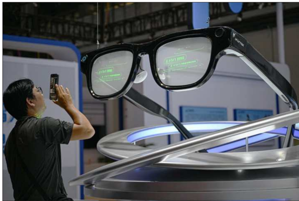
▲ Según Tollbit, la caída en el tráfico de las editoriales está muy ligado a la IA.

Buena parte de este tráfico no sólo busca entrenar a los modelos de IA para que sepan cómo responder a los usuarios, como ya se hace, sino para robar en tiempo real el contenido de los medios para dar una síntesis de las noticias de última hora mediante sus chatbots.