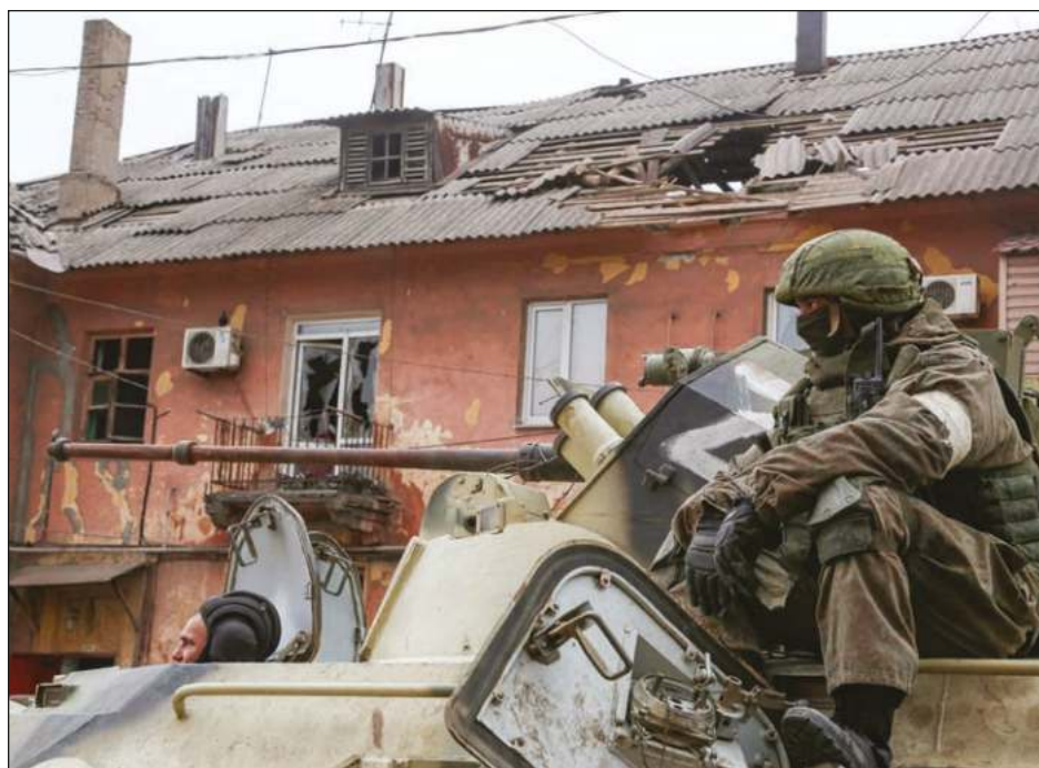
▲ OPAQ monitorea uso de armas químicas en guerra de Europa del este.

“Una vez que se empiezan a utilizar las propiedades del fósforo blanco, las propiedades tóxicas, de forma específica y deliberada, entonces pasa a estar prohibido”.