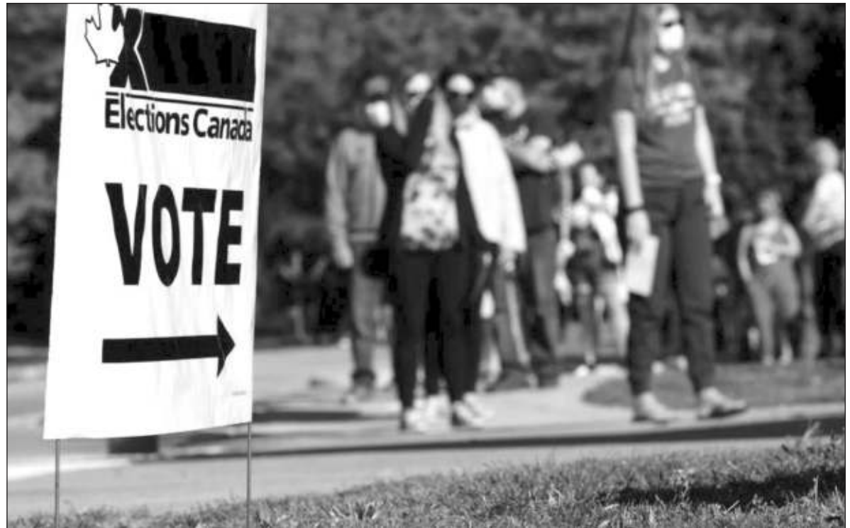
▲ The tyranny of the majority cannot prevail in a society when the rights of the minority are attacked and curtailed.

AS A FRENCH speaking region of North America, Quebec has for many years promoted the immigration of French-speaking people to its shores. Many of the immigrants are Muslims from French Africa. Hence the anti-Muslim racism growing in many parts of the province as well as in other provinces. As well, anti-Semitism has long been a social factor in Quebec, so the ban on yarmulkas is also welcome in certain circles of society but dis-