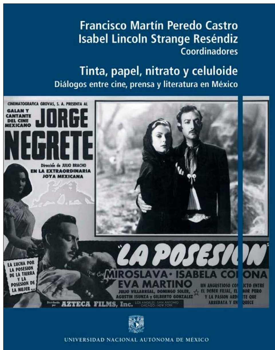
▲ El libro Tinta, papel, nitrato y celuloide puede adquirirse en forma digital. Próximamente llegará a las librerías de la Red UNAM en formato físico. Portada del libro