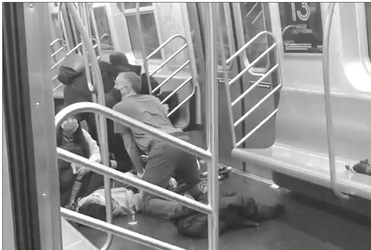
▲ Un hombre armado que portaba una máscara antigás y un chaleco de seguridad industrial hizo estallar una lata de humo en un convoy del metro en hora pico.

La Autoridad Metropolitana de Transporte anunció el año pasado que había colocado cámaras de seguridad en las 472 estaciones del metro de la ciudad, señalando que pondrían a los delincuentes en una “vía rápida hacia la justicia”.