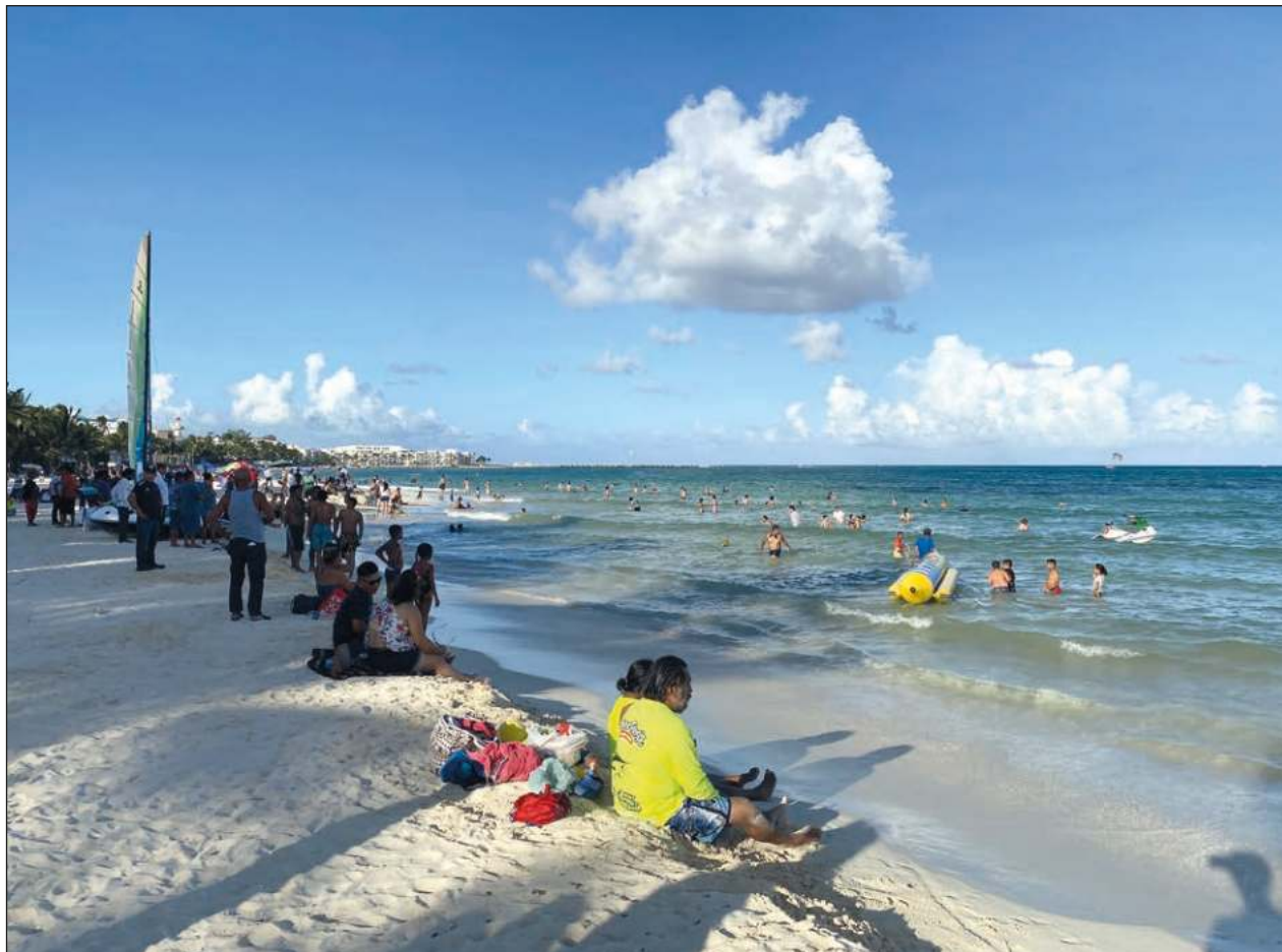
▲ Los recorridos de vigilancia federal tendrán el propósito de garantizar el libre acceso y tránsito de turistas y visitantes, inhibir la introducción de vehículos automotores y verificar el cumplimiento de la legislación ambiental.

Cuatro playas consideradas como no aptas en el monitoreo anterior correspondiente a diciembre 2021, en esta ocasión tuvieron resultados favorables.