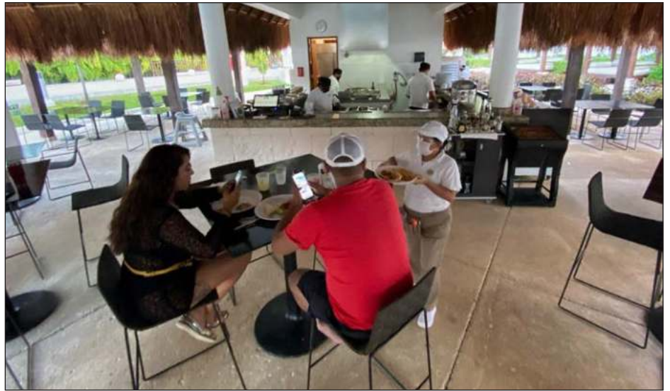
▲ La empresa reclutadora PHRS admitió que hay ciertos miedos de los postulantes, especialmente por las diferencias culturales y seguridad de las mujeres.

Resaltó que los agentes locales son capacitados en uso de la fuerza, derechos humanos y perspectiva de género, además de clases de inglés. “Estamos listos para esta temporada, estamos trabajando con turnos dobles, ojalá puedan visitar Tulum, donde cuentan con el compromiso del presidente municipal y de su servidor que se seguirá garantizando la seguridad de todos los tulumenses y visitantes”, concluyó el titular de Seguridad Pública.