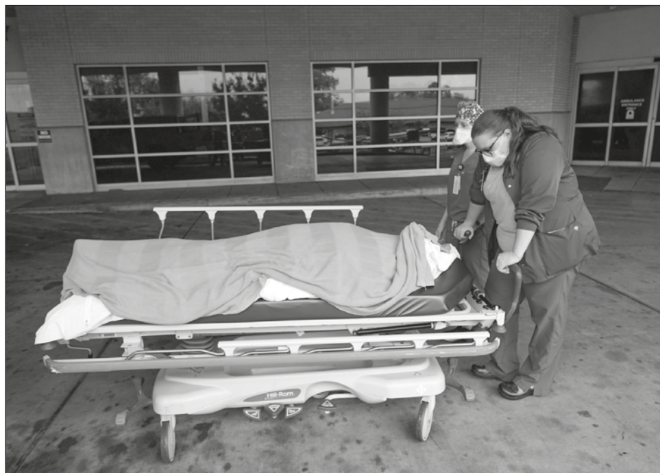
▲ El coronavirus no es el único culpable. También aumentaron las muertes por cáncer, diabetes, enfermedades hepáticas e infartos.

De igual manera subieron las muertes por sobredosis de drogas. Los CDC todavía no tienen un conteo definitivo de muertes por sobredosis para 2021 porque las investigaciones y pruebas de laboratorios tardan semanas. Pero según datos provisionales que llegan hasta octubre, el país está encaminado a registrar por lo menos 105 mil decesos por so-