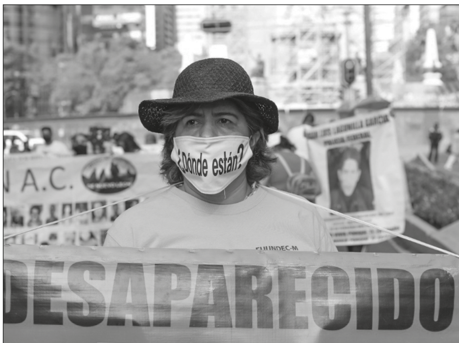
▲ El Comité de Desaparición Forzada de la ONU manifestó que en México preocupa el enfoque militarizado para combatir a la delincuencia.

El funcionario aclaró que hay altas expectativas para que no se desestime el caso.