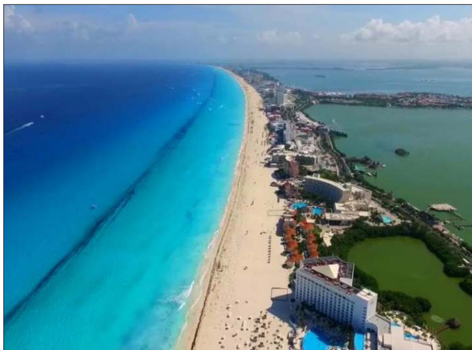
▲ El municipio de Benito Juárez mantiene el liderazgo en arenales limpios desde 2016.

El Comité de Playas Limpias Cancún Riviera Maya es coordinado por el muni-