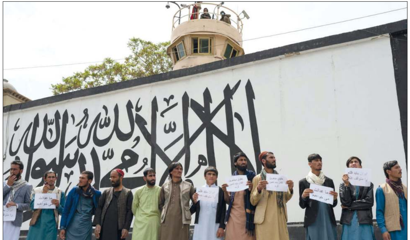
▲ A diferencia de protestas pasadas, la movilización de este martes fue completamente aprobada por el Emirato Islámico.

Estas protestas se producen después de que durante la última semana comenzaran a circular vídeos en las redes sociales en los que se observan a varias personas, entre ellas