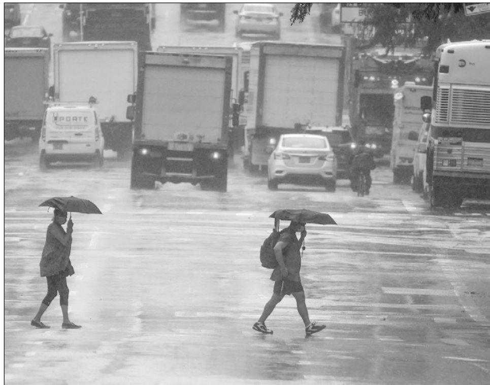
▲ Durante la temporada se registraron 30 huracanes, un récord que provocó que los expertos se quedaran sin nombres para seguir bautizando a los fenómenos meteorológicos.

“La conclusión principal de nuestro estudio es que el cambio climático provocado por el hombre au-