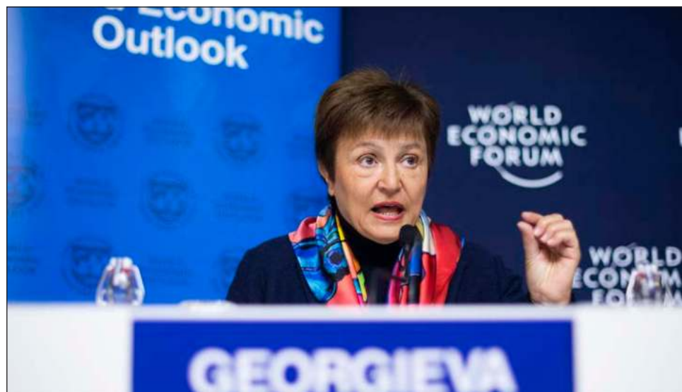
▲ Este martes, el Fondo Monetario Internacional publicó un análisis sobre el gravamen a transnacionales. En la imagen, Kristalina Georgieva directora gerente del FMI.

Además, el hecho de que los países dejen de competir entre sí para bajar impuestos, podría aumentar la recaudación todavía más, en un 8.1 por ciento adicional, indicaron desde el Fondo.