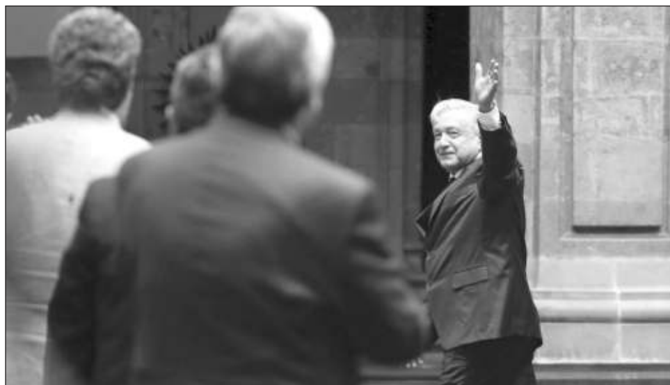
▲ Desde que llegamos al gobierno el salario mínimo ha aumentado 71 por ciento en términos reales. Con ello, su poder adquisitivo se ha incrementado por primera vez en más de cuatro décadas

Están inscritos en el Seguro Social 21 millones de trabajadores, una cifra histórica,