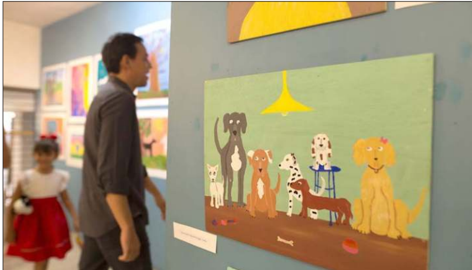
▲ De acuerdo con un estudio del Alto Comisionado de Naciones Unidas para los Derechos Humanos, la condición de discapacidad aumenta el riesgo de que la niñez sea víctima de violencia.

Este espacio formativo se impartió al personal docente de educación básica de la Secretaría de Educación del Gobierno del Estado de Yucatán (Segey).