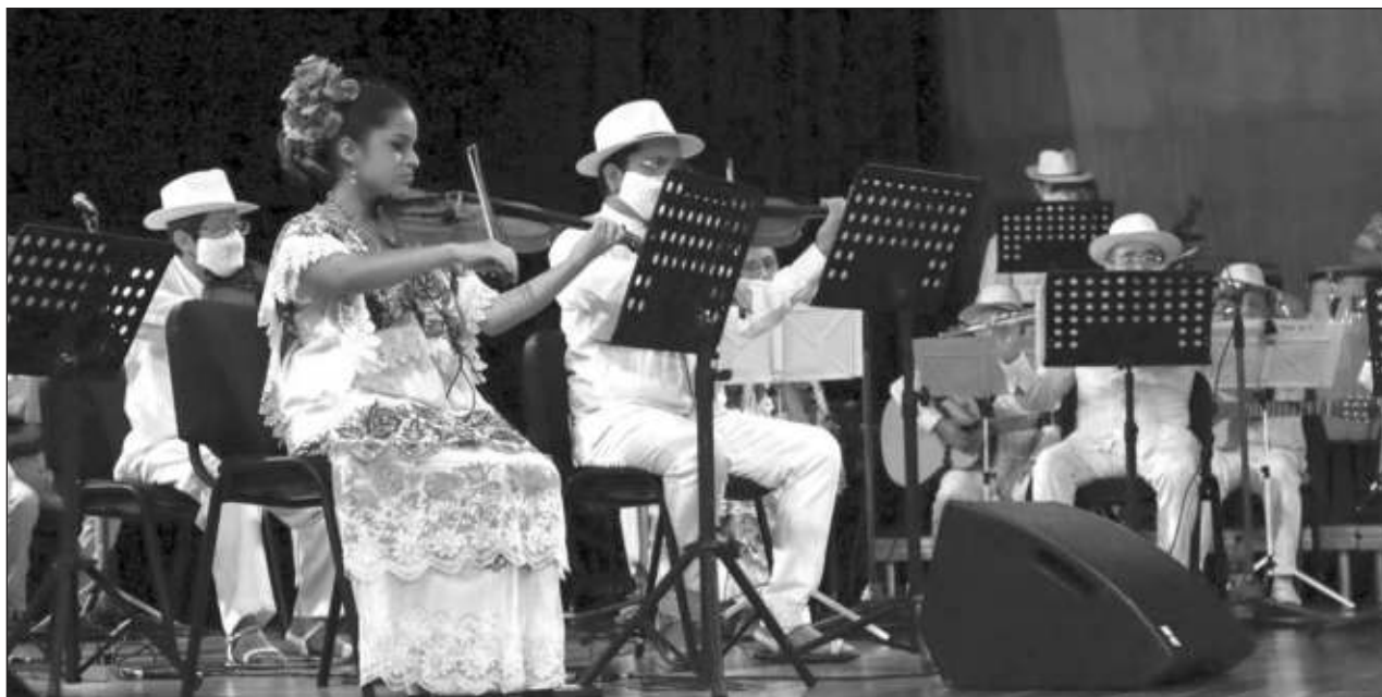
▲ La máxima institución musical vernácula de Yucatán cuenta entre sus reconocimientos el Premio Nacional de Ciencias y Artes de 1999 y la Medalla de Honor Héctor Victoria, que otorga el Congreso del estado.

AHORA VEO ALGO totalmente diferente. Mucha diversión, muchos viajes y un total olvido de lo que es la Semana Santa. Y no sé qué es mejor si mis tiempos o estos tiempos.