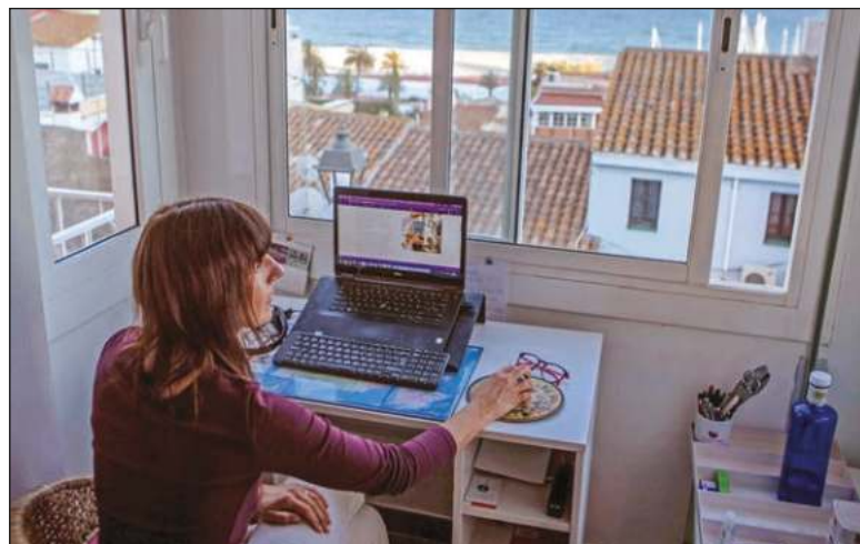
▲ "Mujeres y hombres como yo, que les está costando un trabajo titánico regresar a la rutina de antes ".

El marino japonés realizó celosas guardias, oteó el horizonte en busca de aliados o enemigos, escribió una meticulosa bitácora en la que incluso describía su dieta —basada principalmente en cocos y cangrejos— y su rutina de ejercicios; cavó trincheras, construyó una red de túneles, tan estrechos como úteros, y, en sus ratos libres, le escribió a su esposa. En los últimos años, cuando ya no encontró materiales en los que podía escribir y al ver que hacerlo en la