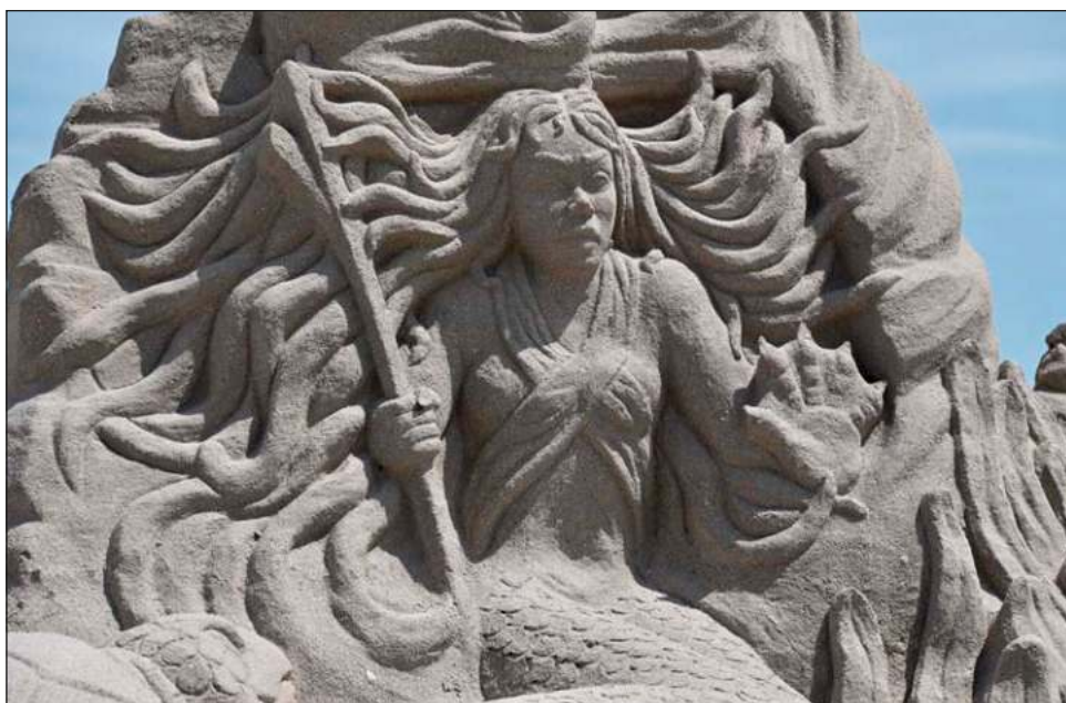
▲ Las esculturas se encuentran expuestas desde el pasado 9 de abril y es notable la presencia de visitantes que se detienen en las proximidades para tomar una fotografía de estas obras de arte efímero.