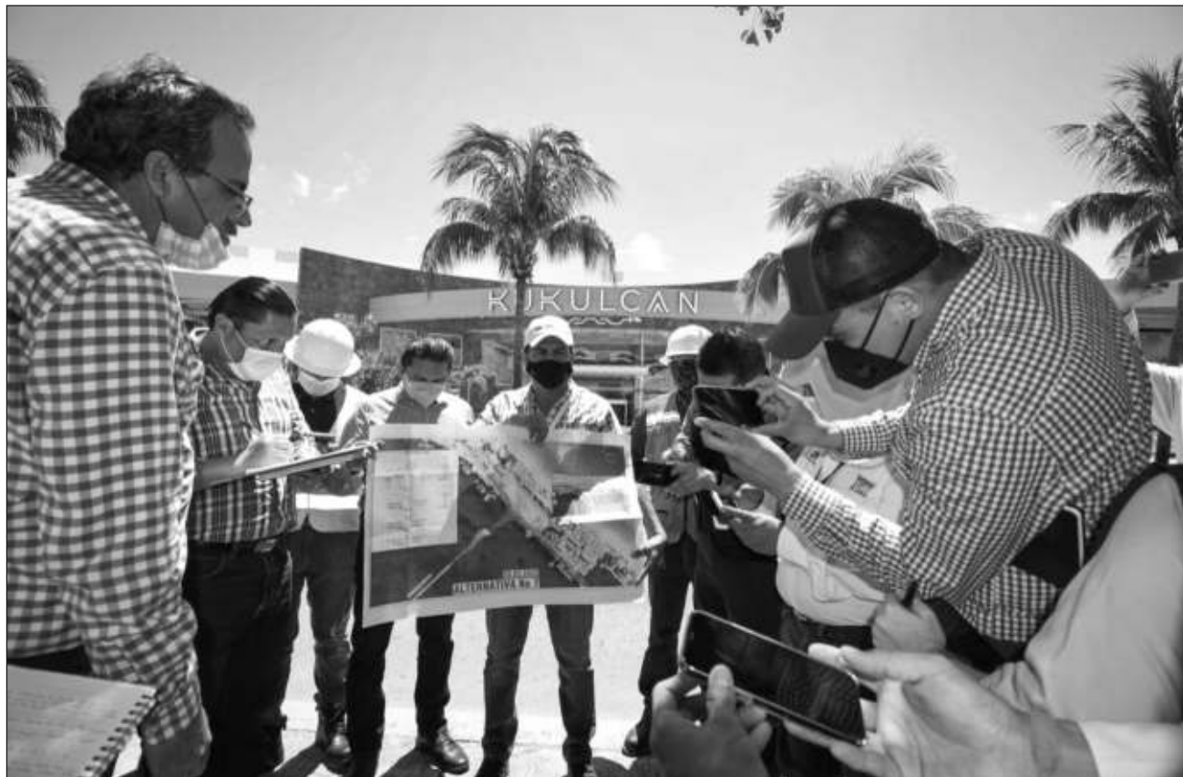
▲ En el recorrido, personal de la Secretaría de Infraestructura, Comunicaciones y Transportes y la Agepro presentaron a los interesados algunas soluciones viales para los entronques y los derechos de vía para los 8.8 kilómetros del puente.

Durante el trayecto, personal de SICT y de la Agencia de Proyectos Estratégicos del Estado de Quintana Roo (Agepro) presentaron soluciones viales para los entronques y los derechos de vía para los 8.8 kilómetros del puente, partiendo del entronque que conecta con el distribuidor vial Ka-