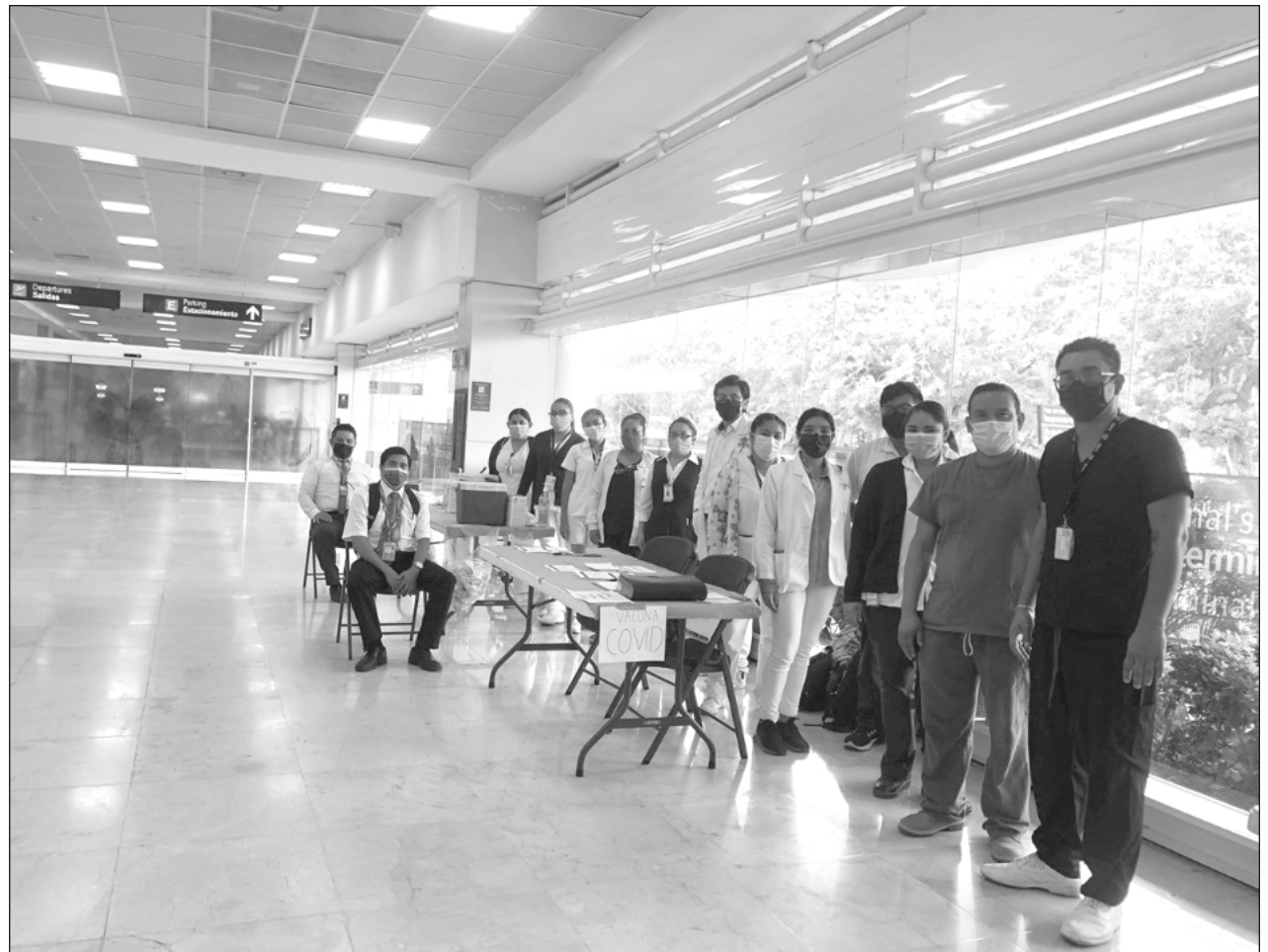
▲ Para la Sesa, es necesario contar con habilidades de trabajo en equipo, comunicación efectiva y liderazgo.

Es necesario contar con habilidades, orientación a resultados, calidad en el trabajo, trabajo en equipo, comunicación efectiva y liderazgo. En estas tres convocatorias para la contratación de personal se solicita la cartilla militar liberada en el caso de los varones.