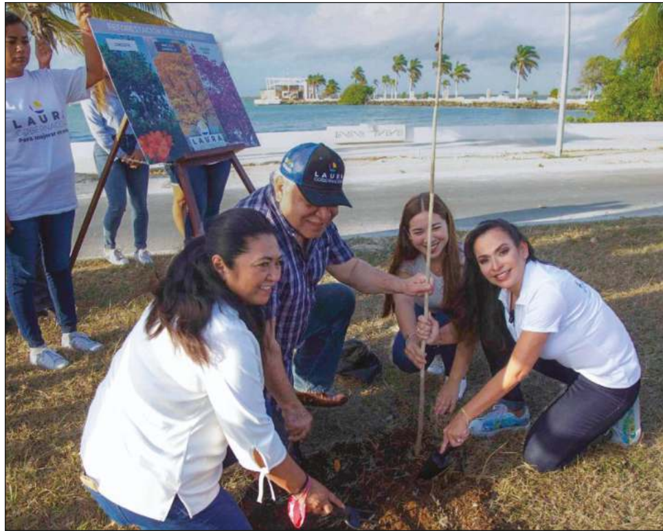
▲ La abanderada de Va por Quintana Roo encabezó acciones de reforestación en el bulevar Bahía, donde llamó a cuidar el medio ambiente y proteger las áreas verdes.

La abanderada del PRD-PAN-Confianza destacó sus