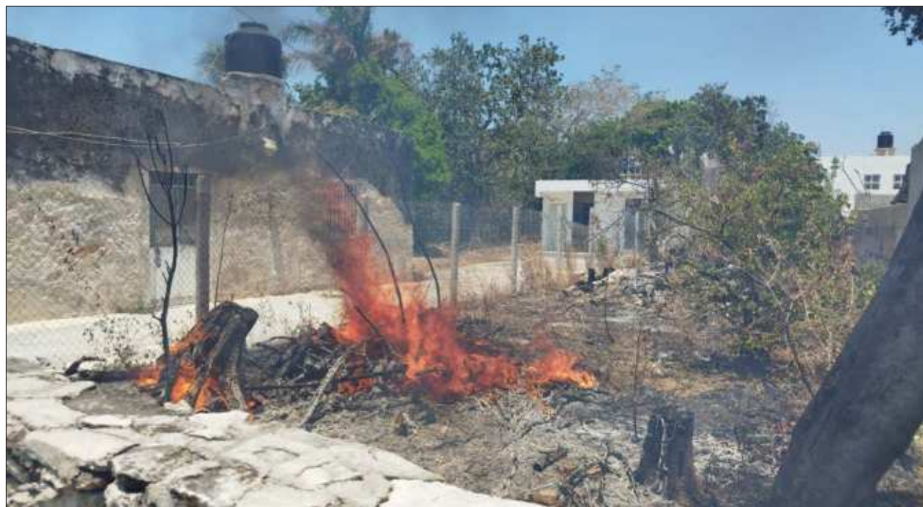
▲ Los terrenos baldíos son los puntos más sensibles. sobre todo los que ya son conocidos como parte de la propiedad de organismos federales, como el de la Semar, donde recientemente se construyó el nuevo hospital naval.

Los terrenos baldíos son los puntos más sensibles, sobre todo los ya conocidos que son propiedad de organismos federales como la Secretaría de Marina (Semar) en el norte de la ciudad y donde recientemente se construyó el nuevo hospital naval pero