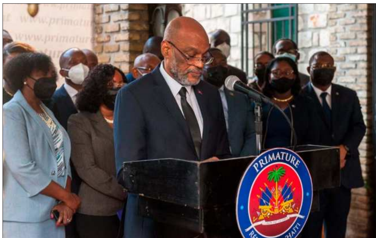
▲ La renuncia de Ariel Henry se produjo tras una reunión de emergencia sobre Haití, convocada en Kingston por la Comunidad del Caribe y a la que asistió el secretario de Estado de Estados Unidos, Antony Blinken.

"Esperamos una tregua, pero la situación en Puerto Príncipe es difícil desde hace tiempo, incluso antes de las dos últimas semanas", declaró a la prensa.