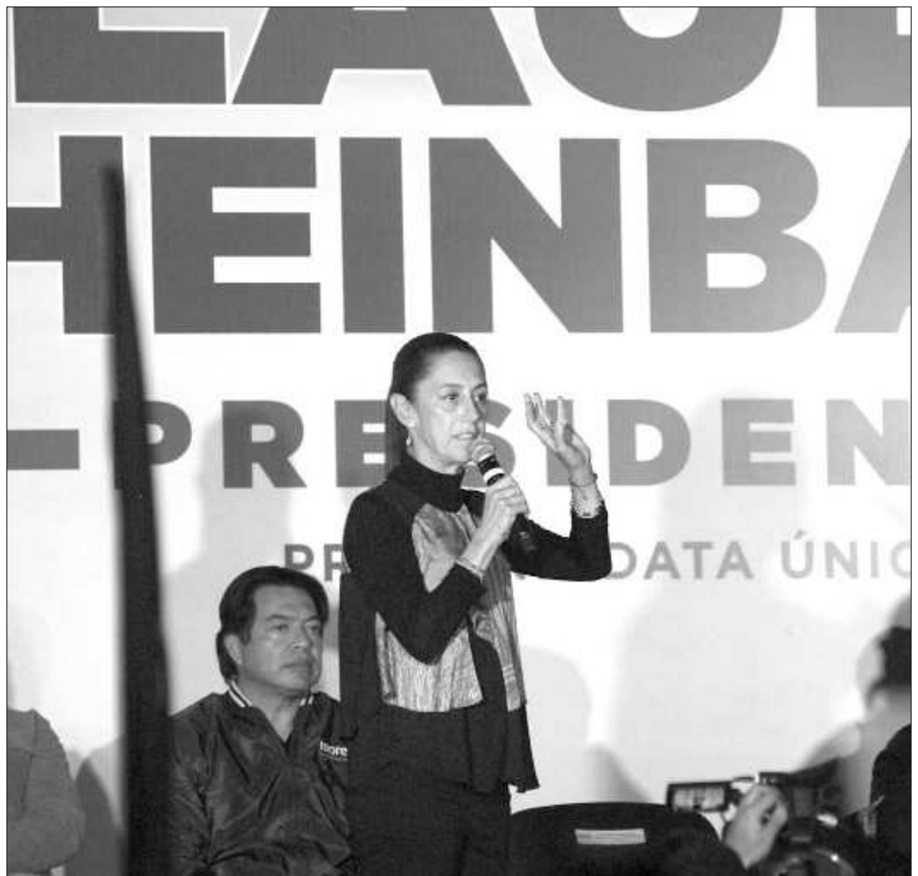
▲ La agenda de la candidata presidencial incluye eventos en Felipe Carrillo Puerto, Playa del Carmen y Cancún.

Ella estará presente en un foro sobre turismo que se llevará a cabo en la Universidad Anáhuac Cancún a partir de las 8 horas.