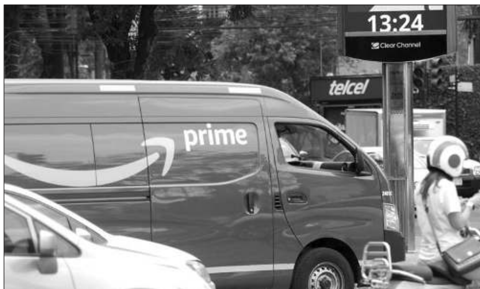
▲ El Inegi señaló en su informe que “estos resultados reflejan la paulatina recuperación que la economía ha tenido tras el aislamiento social derivado de la pandemia.

En 2022, el comercio electrónico de bienes y servicios participó con 5.9 por ciento del PIB nacional. De acuerdo con el último dato oficial, el Valor Agre-