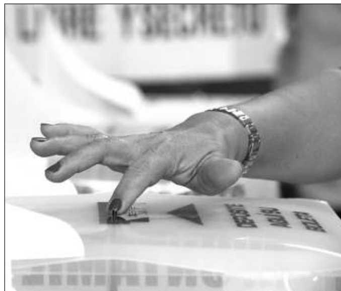
▲ Tendríamos que hablar de la calidad de ciudadanía que queremos alcanzar y de las cualidades que debieran tener los órganos de gobierno en sus tres órdenes y niveles.

Según señaló el Presidente en su conferencia, en junio, la ciu-