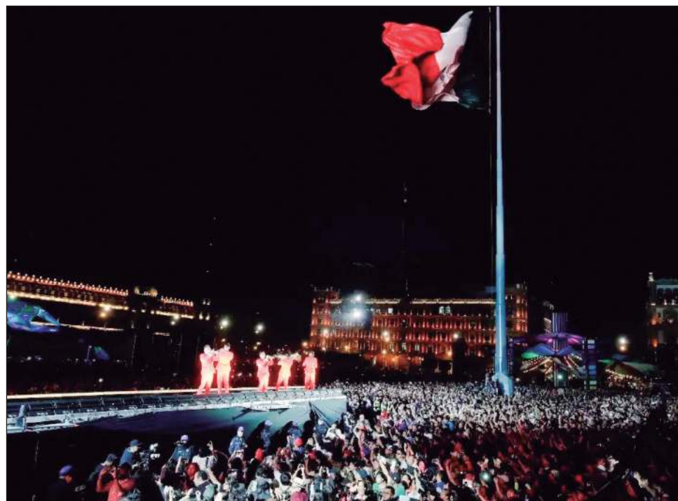
▲ Adultos mayores, familias, turistas y personajes folclóricos tradicionales del primer cuadro de la urbe gozaron con los éxitos de la emblemática agrupación.

La tarde-noche de este domingo, en el contexto de un bailongo sabrosón, las autoridades de la Ciudad de México (CDMX) decidieron concretar la relación de la Santanera con su público multigeneracional, y expusieron la declaratoria oficial que dicta: el grupo creado en 1955 por el compositor tabasqueño Carlos Colorado es ahora de todos los chilangos, que de varias generaciones han bailado con éxitos como La boa , Perfume de gardenias , El ladrón , Luces de Nueva York ... piezas que el domingo sonaron con aris-