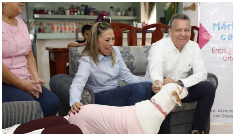
▲ El alcalde Alejandro Ruz Castro señaló que “este es un compromiso que tenemos con la ciudadanía, porque sabemos que la esterilización de un perro o un gato en muchas ocasiones está fuera del alcance del bolsillo de algunas personas, entonces con esta campaña queremos apoyarlos”.

“Trabajaremos para que acudan las personas a la jornada del 17 de marzo que se realizará en la Clínica Veterinaria Municipal, por ello, las valoraciones previas serán del 19 de febrero al 1 de marzo para constatar que los animales de compañía estén en