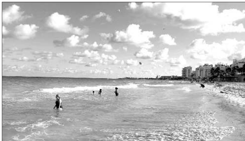
▲ La Asociación de Hoteles de Cancún, Puerto Morelos e Isla Mujeres han recibido quejas de gente engañada en tiempos compartidos, que desembolsan dinero, llegan y no tienen nada confirmado.