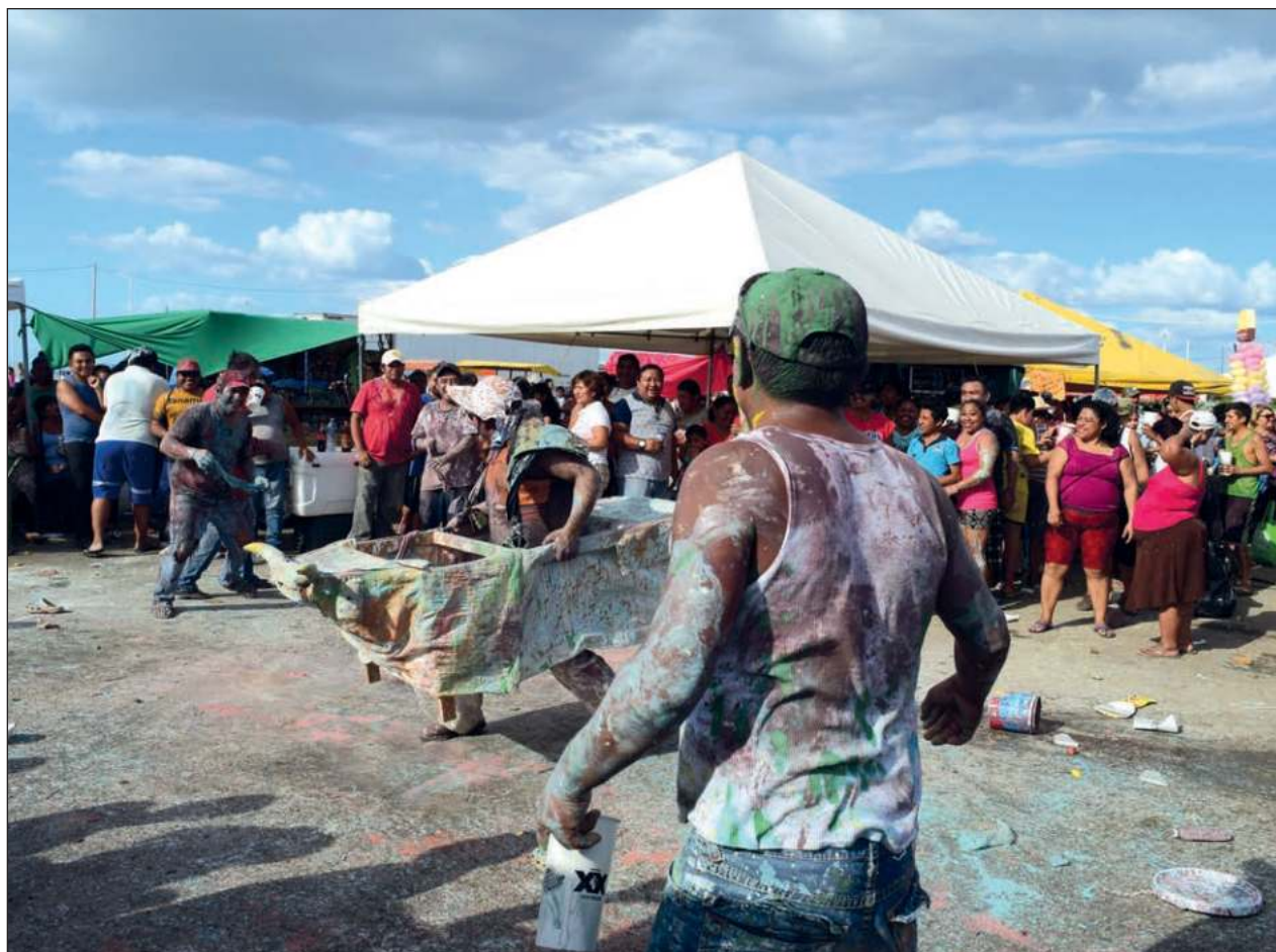
▲ El lunes de mojadera fue tomado menos en cuenta, esperando sólo el martes de pintadera , celebración que también ha disminuido en barrios y colonias populares, debido a la centralización de la festividad en el malecón.

Descartó dar a conocer una cifra de la posible derrama económica, pero señaló que se considera importante, la cual permitirá un respiro a los micro y pequeños empresarios.