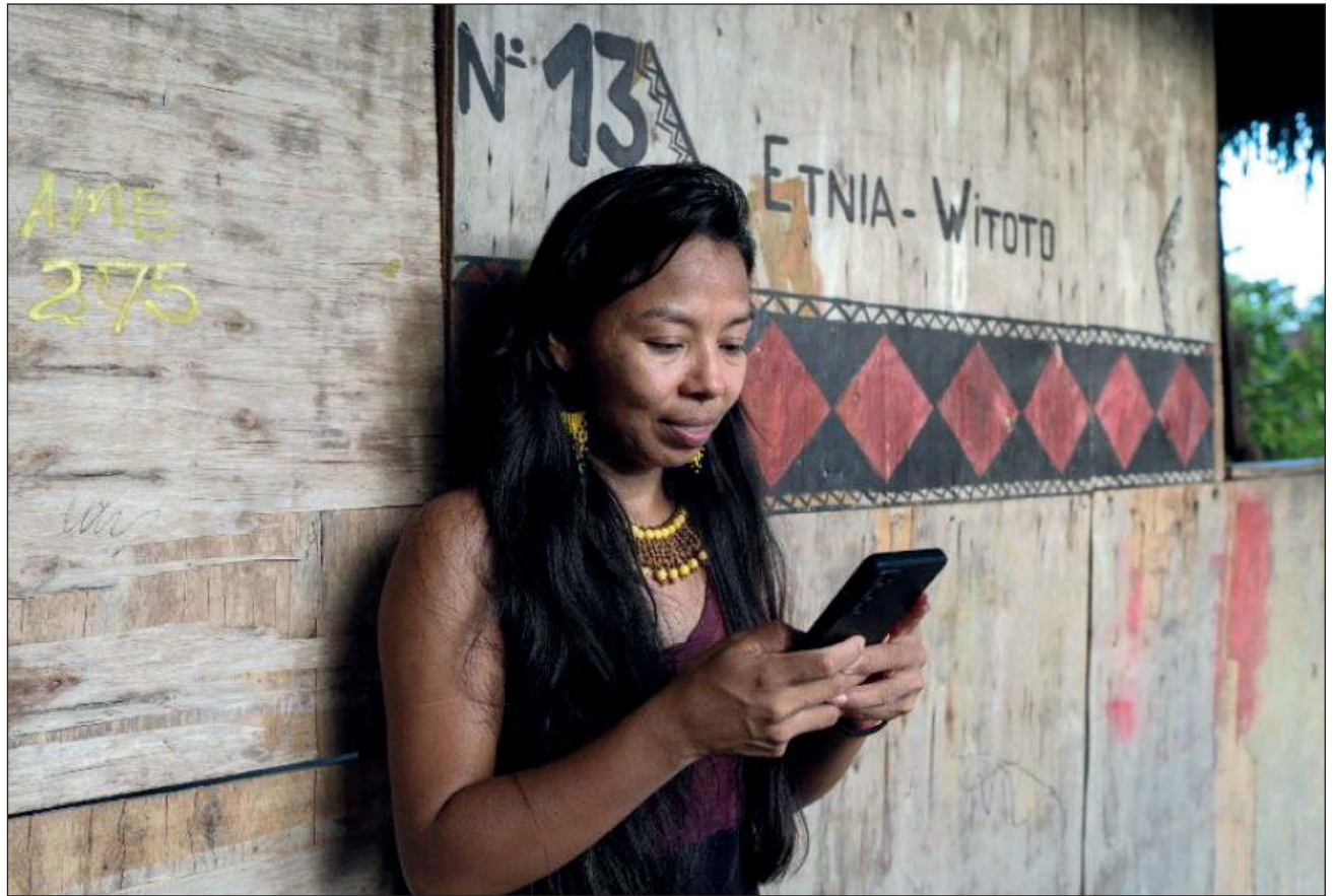
▲ Ojéela'ane' tak walkila', ts'o'ok maanal 3 mil u téena'al éensa'an le áaplikasyoona'.

Ba'ale', tak ma' seen úuche', mixba'al ti' le ba'alo'oba' táakbesa'am ichil séelularo'ob, tumen walkila' ojéela'an ku