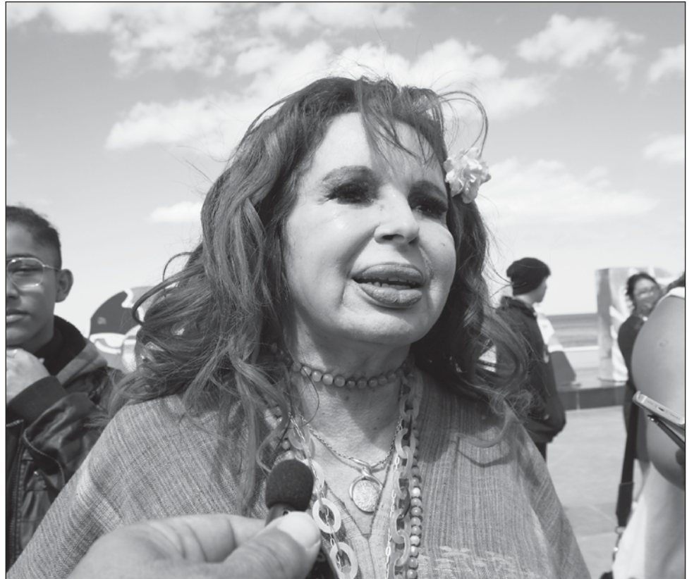
▲ Durante su reciente gira de trabajo por el municipio de Carmen, la mandataria estatal expuso que los homicidios que se han cometido están siendo investigados.

“Campeche es uno de los tres estados más seguros del país y de los que mayor porcentaje de homicidios dolosos esclarecidos, derivado del trabajo pericial de los elementos policiacos”. Indicó que sólo grupos políticos buscan generar un ambiente de inseguridad que no existe, pero tiene objetivos electorales muy específicos.