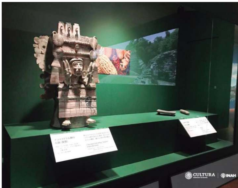
▲ México antiguo: Maya, azteca y Teotihuacan se encuentra desde hace una semana en el Museo Nacional de Arte de Osaka. La muestra finaliza su estancia en Japón el 6 de mayo.