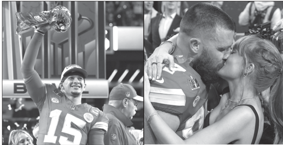
▲ Patrick Mahomes, el quarterback que volvió a brillar a la hora cero, y Travis Kelce, quien arriba a la derecha aparece con su novia Taylor Swift, ganaron su tercer anillo juntos con Kansas City.

"Esto es fabuloso", dijo Mahomes. "Legendario".