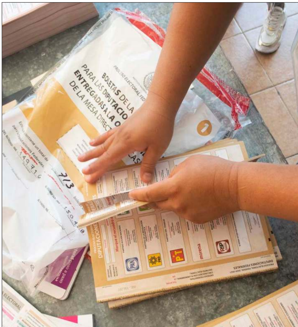
▲ Copamex es la empresa encargada de producir este papel, la cual se encuentra en Chihuahua, y efectuará 21 viajes para llevarlo a los Talleres Gráficos de México.

A su vez, TGM producirá más de 312 millones boletas electorales. Este proceso inicia el primero de marzo con la producción de la boleta para la elección presidencial, continuando con la boleta para senadurías y finalizando para la diputación federal.