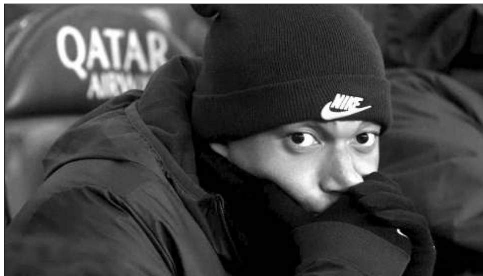
▲ Kylian Mbappé observa desde la banca el partido contra Lille en la liga francesa, el pasado sábado.

Mascherano reveló que Messi lo llamó para felicitar al equipo que disputó el Pre-olímpico en Venezuela. "Nos felicitó, muy contento", indicó Mascherano. "Todos sa-