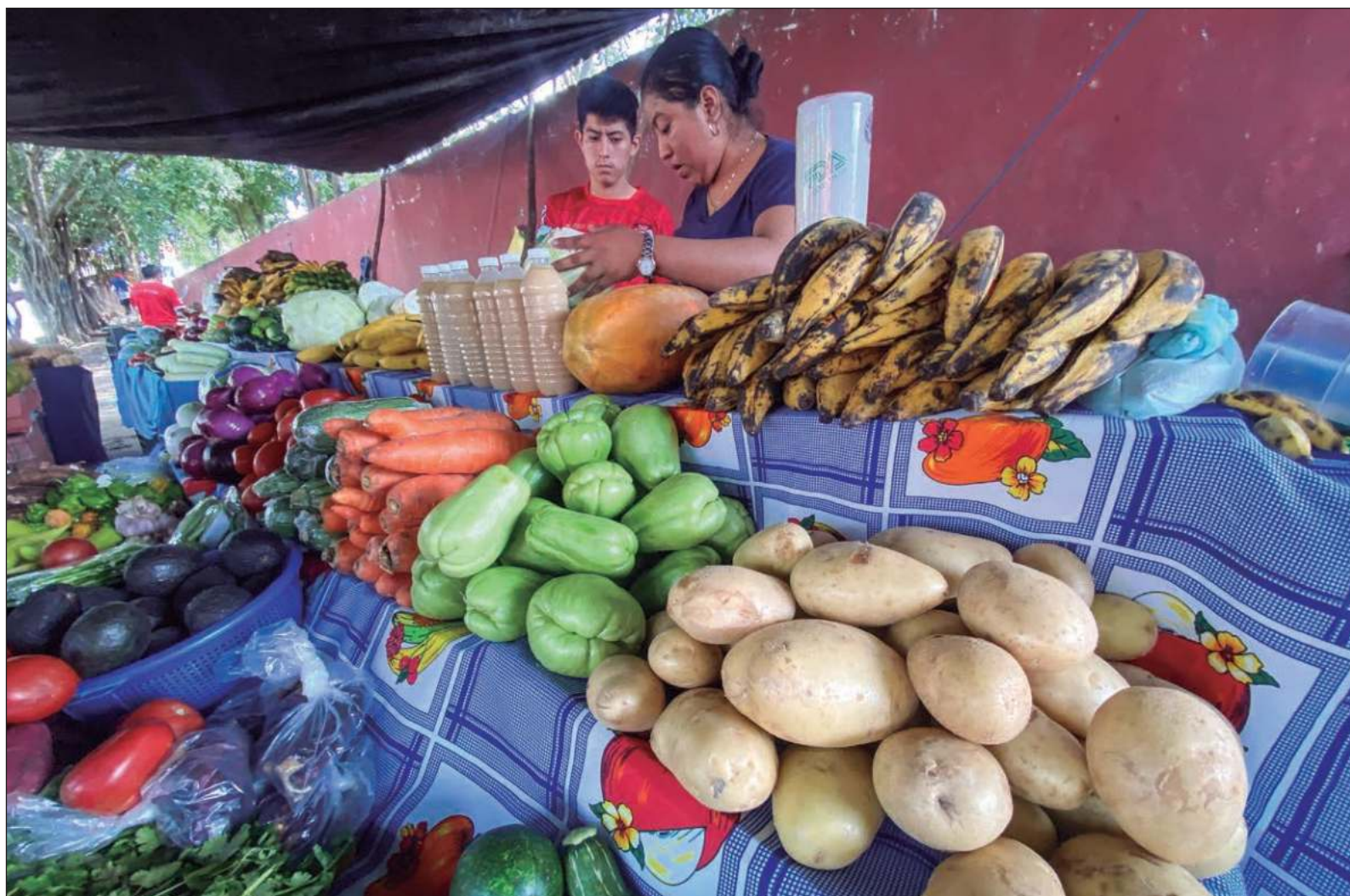
▲ "Nuestros sistemas alimentarios -la forma en cómo producimos, comercializamos y consumimos alimentos- son parte del tejido político, social, económico, ecológico y cultural que tenemos en nuestras comunidades. Este tejido ha logrado algo así como un milagro, manteniendo por décadas el paso del crecimiento poblacional".