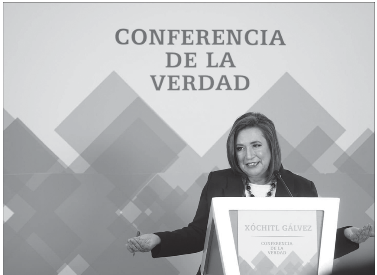
▲ “El embate sincronizado de publicaciones extranjeras sobre presunta entrega de fondos criminales a la campaña de López Obrador en 2006 suministró una plataforma de arranque para la gira de Xóchitl”.

EL TAMAÑO DE la apuesta que grandes inversionistas políticos han lanzado ha podido verse en el insólito sostenimiento de etiquetas contra AMLO y Sheinbaum en los cuatro prime-