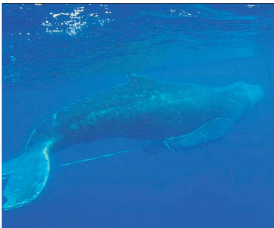
▲ Muchos pájaros, tortugas, ballenas, tiburones y otros animales migratorios se ven amenazados por la pérdida de hábitat, caza y pesca ilegal, contaminación y cambio climático.

Durante la jornada también se realizó el juego Cazadoras de sabiduría: el misterio de la científica perdida, desarrollado por infantes de Pauta para que sepan que ha habido muchas científicas que han hecho muchísimas grandes aportaciones en distintas áreas, no nada más Marie Curie.