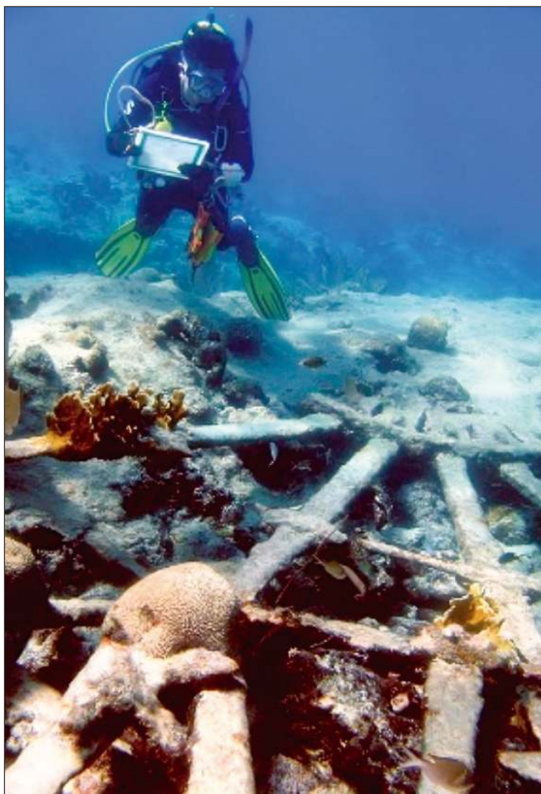
▲ "Preservar el patrimonio cultural subacuático in situ no sólo enriquece nuestra comprensión del pasado, sino que también fomenta la investigación y la conexión con nuestra identidad cultural".

PRESEVAR EL PATRIMONIO cultural subacuático in situ no sólo enriquece nuestra comprensión del pasado, sino que también fomenta la investigación y la conexión con nuestra identidad cultural. Estos secretos sumergidos no solo son testimonios del pasado, sino también oportunidades para