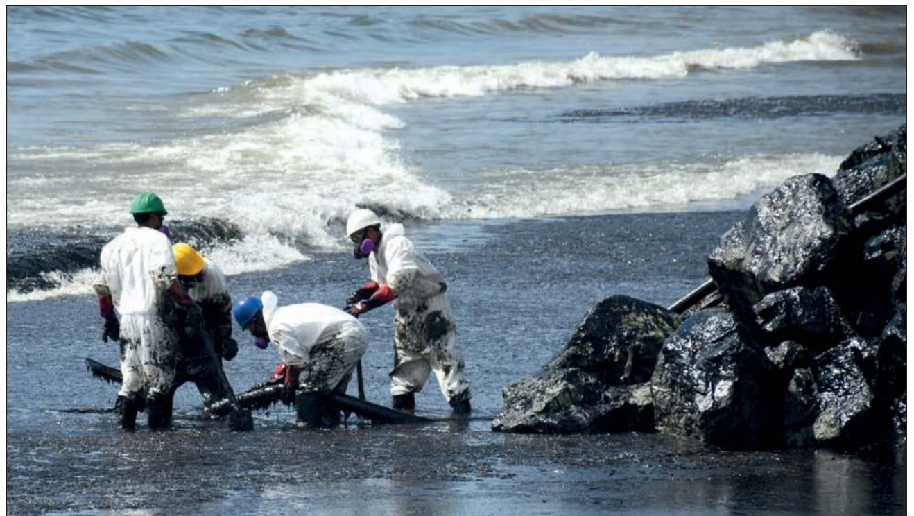
▲ Cuadrillas intentan contener el petróleo que ya cubre varias playas en la costa sudoccidental de Tobago.

Tobago es un popular destino turístico y las autorida-