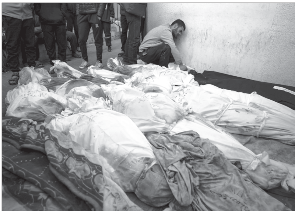
▲ Mientras Benjamín Netanyahu calificaba a la maniobra como "una de las operaciones de rescate más exitosas de la historia de Israel", la alta cúpula del grupo insurgente palestino Hamas acusaba una masacre "contra civiles desarmados, incluidos niños, mujeres y ancianos desplazados".

El portavoz del Ejército, Daniel Hagari, informó de que murieron "unos 50 terroristas"