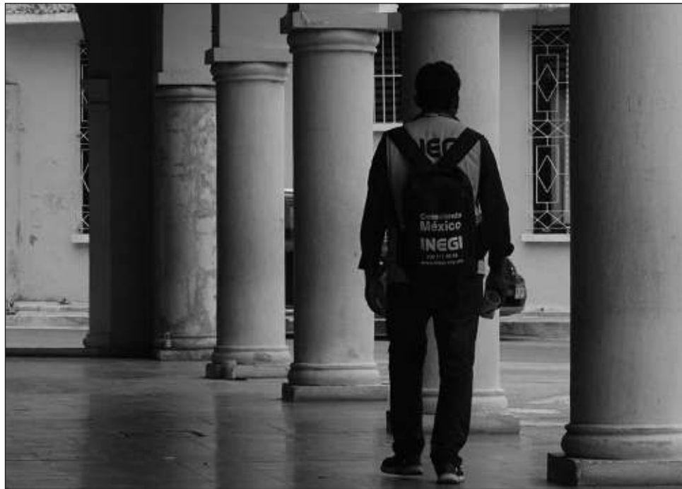
▲ En Yucatán, el Inegi visitará a cerca de 146 mil negocios durante los próximos siete meses. El ejercicio contará con la participación de cerca de 750 personas.

A nivel nacional, del 6 de febrero al 31 de agosto, el Inegi llevará a cabo el censo económico, para lo cual, visita a empresas y negocios en todo el país.