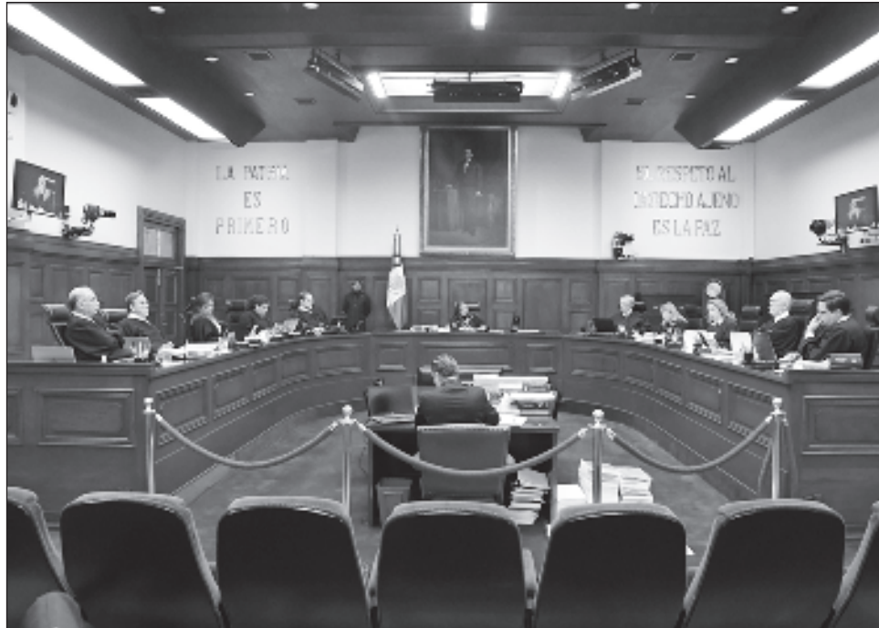
▲ La controversia presentada por la síndico Elsa Zamora fue turnada por la ministra presidenta Norma Piña a la ministra Yasmín Esquivel, quién decidirá el cauce del recurso. Foto crédito

“Se solicita que se declare la invalidez del decreto por el que se aprueba el dictamen con punto de acuerdo relativo a la minuta con proyecto de decreto por el que se reforman, adicionan y derogan diversas disposiciones de la Constitución Política de los Estados Unidos Mexicanos, en materia de reforma del Poder Judicial, publicada en el Diario Oficial de la Federación el 15 de septiembre de 2024”, aprobado por el Poder Le-