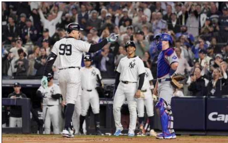
▲ Aaron Judge celebra tras conectar un jonrón en el quinto juego de la Serie Mundial contra los Dodgers. Juan Soto (centro) espera al cañonero para felicitarlo.

Ohtani y Judge consiguieron este año dos de las mejores campañas ofensivas en la historia de las Grandes Ligas.