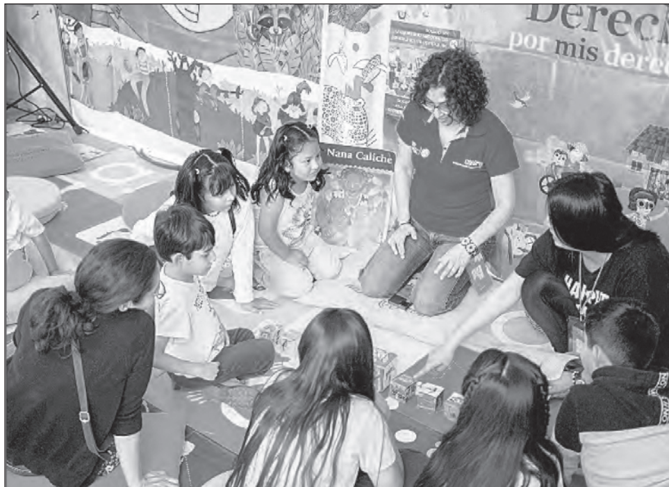
▲ La Feria Internacional del Libro Infantil y Juvenil que inició el domingo concluirá el 18 de noviembre y desarrolla un programa con más de 220 actividades.

La Filij tiene los foros Gabriela Mistral, Mary Shelley,