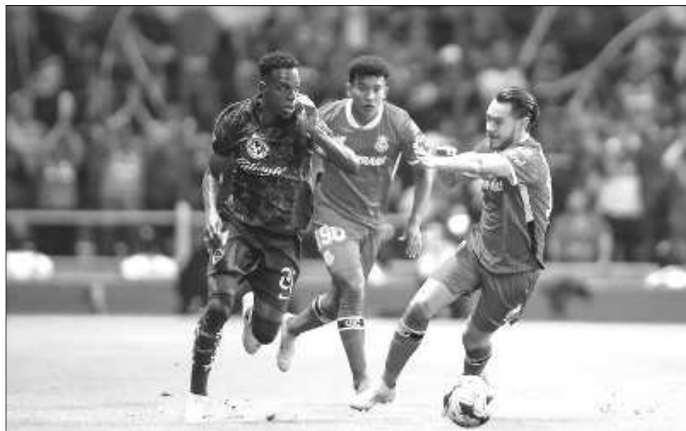
▲ Las Águilas tendrán que vencer a los Xolos en Tijuana para regresar a la liguilla.

Ambos desafíos del "play-in" se llevarán al cabo el próximo jueves 21, tras la Fecha FIFA. A las 19:05 horas, en el Estadio Akron, el "rebaño" recibirá al Atlas; dos horas después, comen-