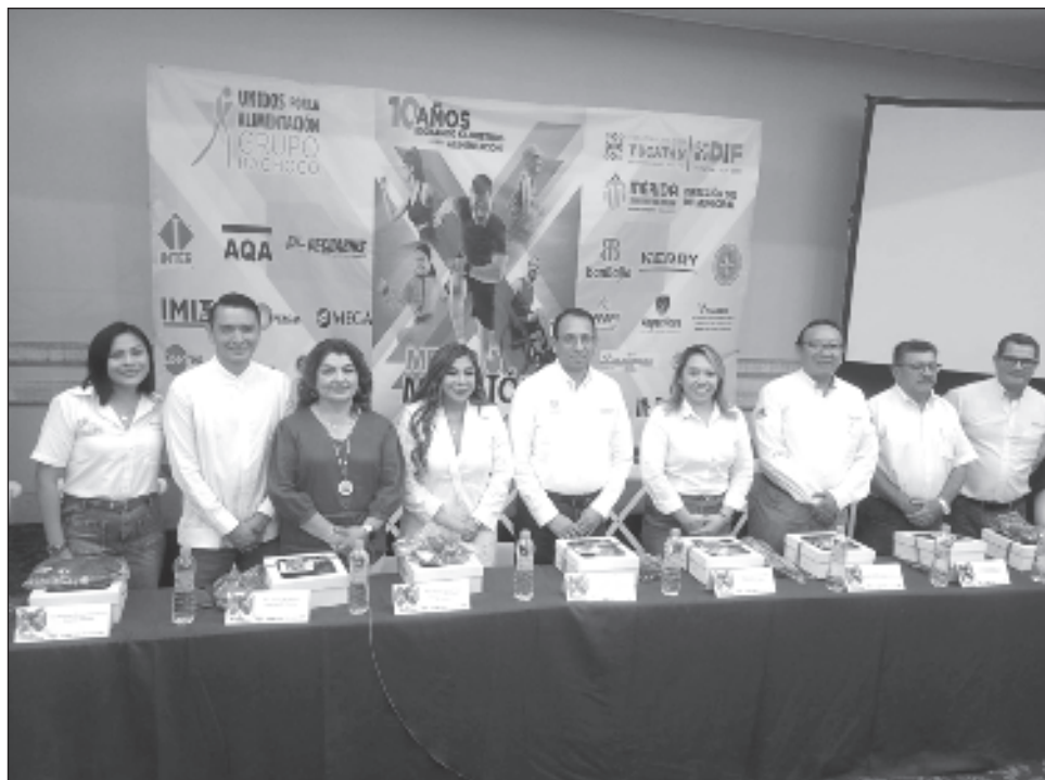
▲ Todo lo que se recaude con las inscripciones y por cada persona que se inscriba, Grupo Bachoco aportará un kilo de pollo en beneficio de los comedores gestionados por el DIF.

El costo por inscripción depende de las categorías y se divide en 3, 5 y 10 kilómetros a un precio de 300 pesos en la categoría infantil y de 400 pesos las demás categorías, siendo la categoría de 21 kilómetros la única con un precio de 450 pesos la inscripción.