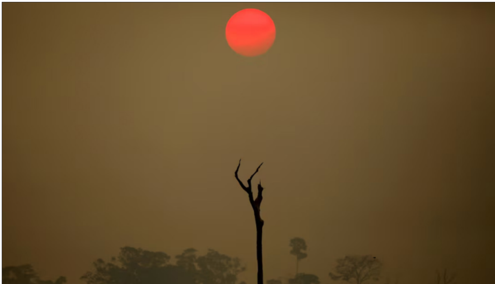
▲ El año pasado perdieron la vida cerca de 200 personas por defender la tierra; 43% eran indígenas y 12% mujeres. En México fueron 18 los asesinados; todas las víctimas luchaban contra las industrias extractivas (como la minería y la deforestación de las selvas y bosques), la contaminación y el acaparamiento de territorios.

Y el mandatario colombiano agregó que ya eran treinta años de fracasos durante dichas reuniones. Esta vez, igualmente hubo mucho de ello, pero igualmente avances importantes que bien vale la pena destacar el lunes próximo.