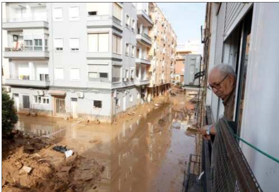
▲ En España la gestión de las catástrofes depende de las administraciones regionales, pero el gobierno central, que se encarga de lanzar las alertas, puede facilitar recursos.

En España, un país muy descentralizado, la gestión de las catástrofes depende de las administraciones regionales, pero el gobierno central, que se encarga de lanzar las alertas a través de Aemet, puede facilitar recursos e incluso tomar el mando en casos extremos.