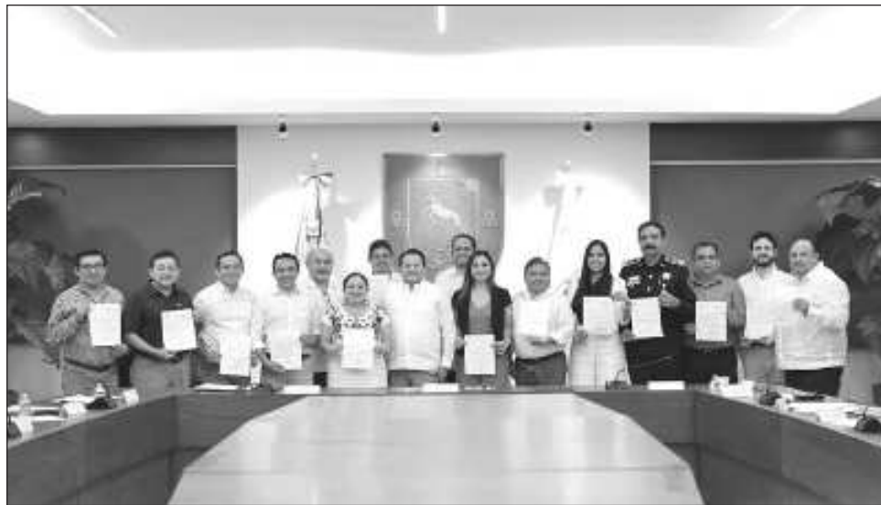
▲ El mandatario presentó a las personas titulares de las comisiones sectoriales, territoriales y la Comisión Especial para el Pueblo Maya.

“Será un proyecto de todo el pueblo de Yucatán, traduciendo nuestra visión humanista en cada directriz y proponiendo acciones concretas y tangibles que respondan a las necesidades y sueños de la población yucateca, para