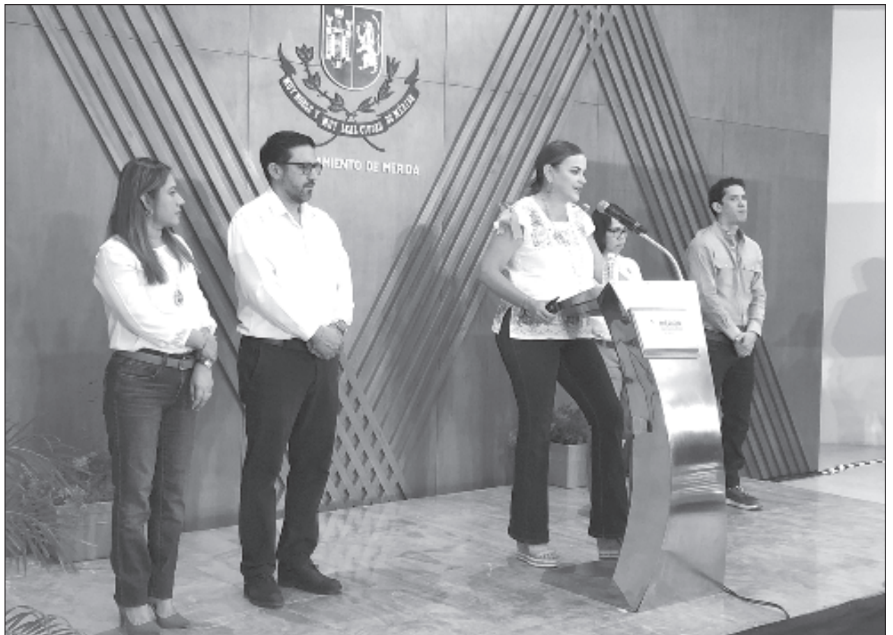
▲ La estrategia presentada por la alcaldesa involucrará a 13 direcciones del ayuntamiento, conectará los corredores verdes que se ubican en la Avenida Mérida 2000 e incluye la revitalización de parques y reservas.

Llamó a las cámaras empresariales, universidades así como a toda la sociedad meridana a formar alianzas para asegurar la sostenibilidad de esta estrategia, que aseguró debe ser permanente y no sólo durante su administración.