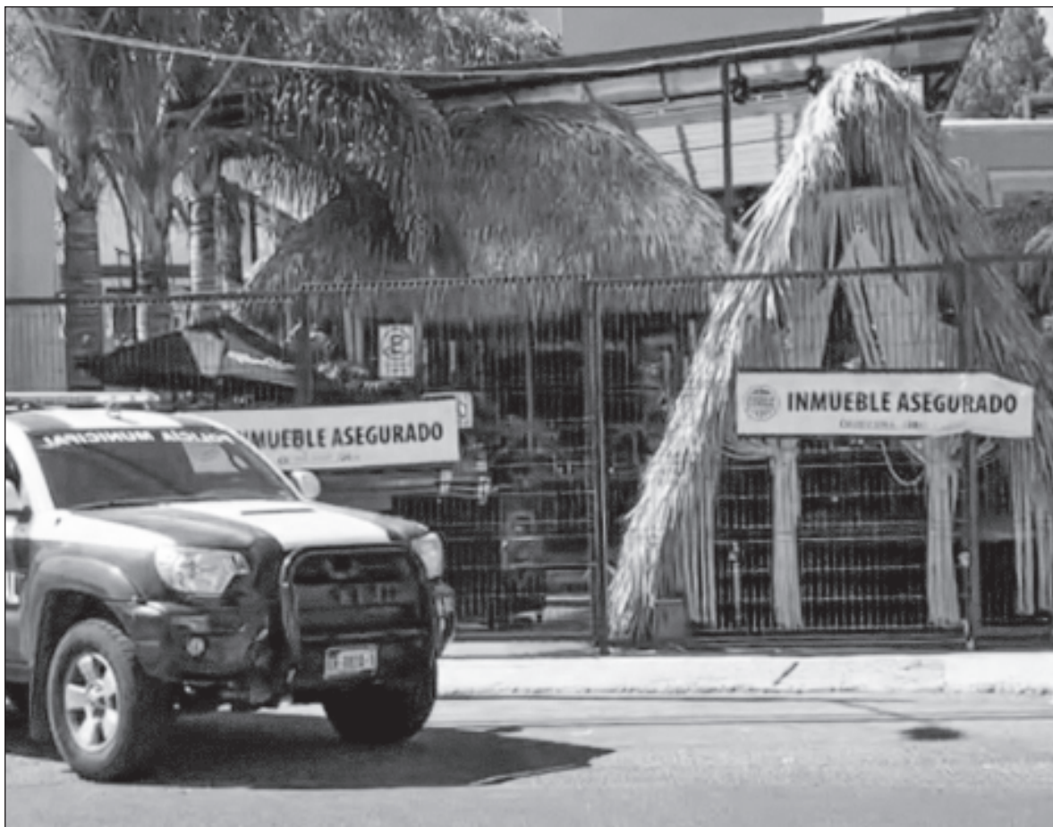
▲ "La masacre en Querétaro plantea una interrogante: ¿Hará falta un quinto eje? Uno que fije como tarea inmediata y urgente contener el crimen dentro de los territorios donde está actuando e impedir su expansión".