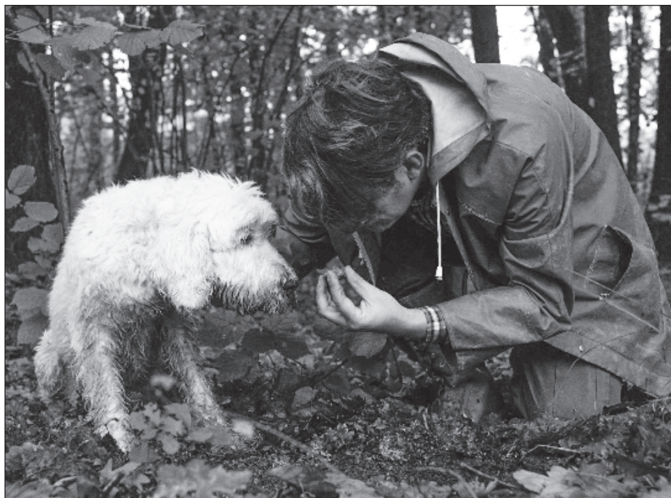
▲ En los últimos 30 años, la superficie dedicada a la trufa blanca en Italia se redujo en 30 por ciento, cediendo espacio poco a poco a viñedos y avellanares, más rentables.

Buscada por gourmets y chefs destacados de todo el mundo, la trufa blanca de Alba, la más prestigiosa, es una seta subterránea que crece en simbiosis con cier-