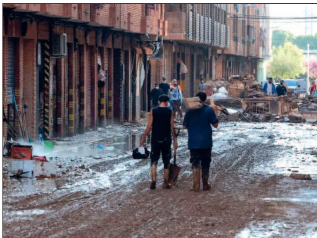
▲ El reclamo principal se centra en la extrema ineptitud de Mazón –del Partido Popular–, quien decidió incomunicarse en las horas críticas en las que se gestaban las inundaciones.

El enojo es transversal, general, trasciende partidos y clases sociales y marca un antes y un después en el escenario político español. Ante la justificada indignación, la permanencia de Mazón en el cargo resulta insostenible, pero además es indispensable que las autoridades de Madrid y de Valencia elaboren a marchas forzadas un programa serio de auxilio a quienes aún lo requieren, de reconstrucción y de reactivación económica para la región afectada. Más allá de eso, es claro que la institucionalidad de España debe reconfigurarse, pues en su condición actual ha resultado incapaz de cumplir con las tareas más elementales de un Estado: auxiliar a los habitantes afectados por fenómenos naturales y evitar hasta donde sea posible que sus impactos se traduzcan en pérdida de vidas.