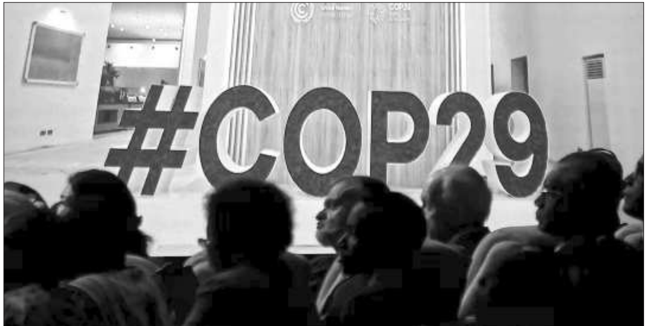
▲ La gran cita anual del clima, bajo los auspicios de la ONU, se celebra a partir del lunes y hasta el viernes 22 de noviembre.

Las nuevas normas conciernen sobre todo a los países –especialmente los contaminadores ricos– que buscan compensar sus emi-