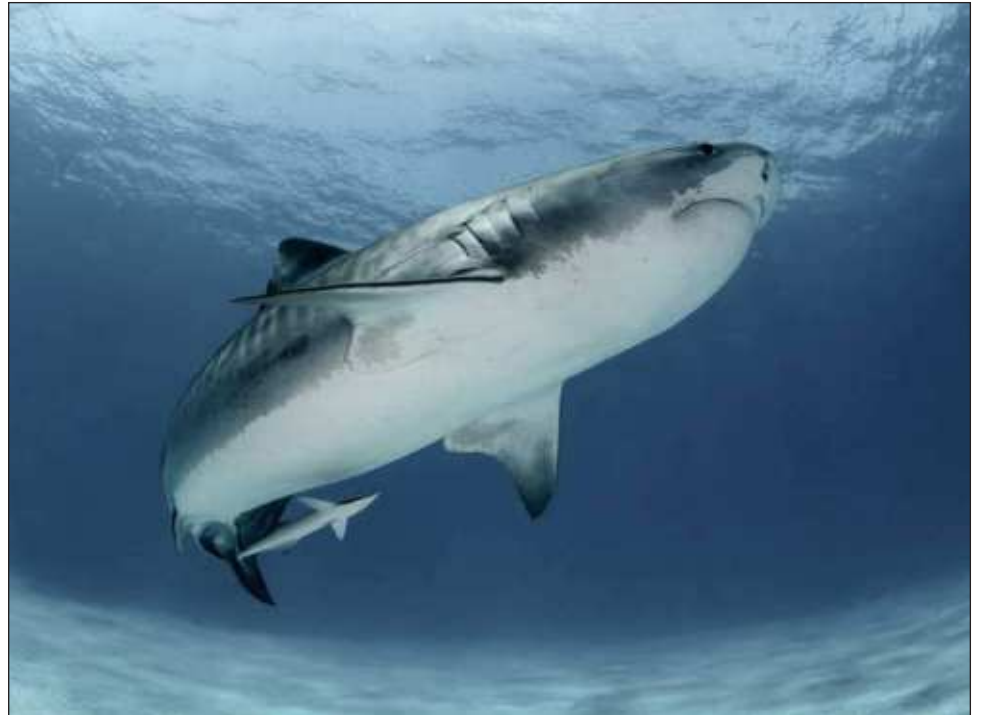
▲ Los recursos que se obtengan se destinarán a proyectos de la mano con los ex pescadores de tiburón de Isla Mujeres, que capturaban cerca de 70% del total en la región.

“La pesca siempre se ha realizado para alimentar, aquí en la región se consume bastante el pan de cazón, eso es tiburón, y bueno, pues también fue parte de la gastronomía típica debido a que se puede salar y conservar por mucho tiempo este alimento. Entonces para convencer a los compañeros no es fácil, llevamos muchos años trabajando con ellos, desde el 2016. Estamos colaborando en proyectos de investigación, monitoreo, capacitación y colaboración