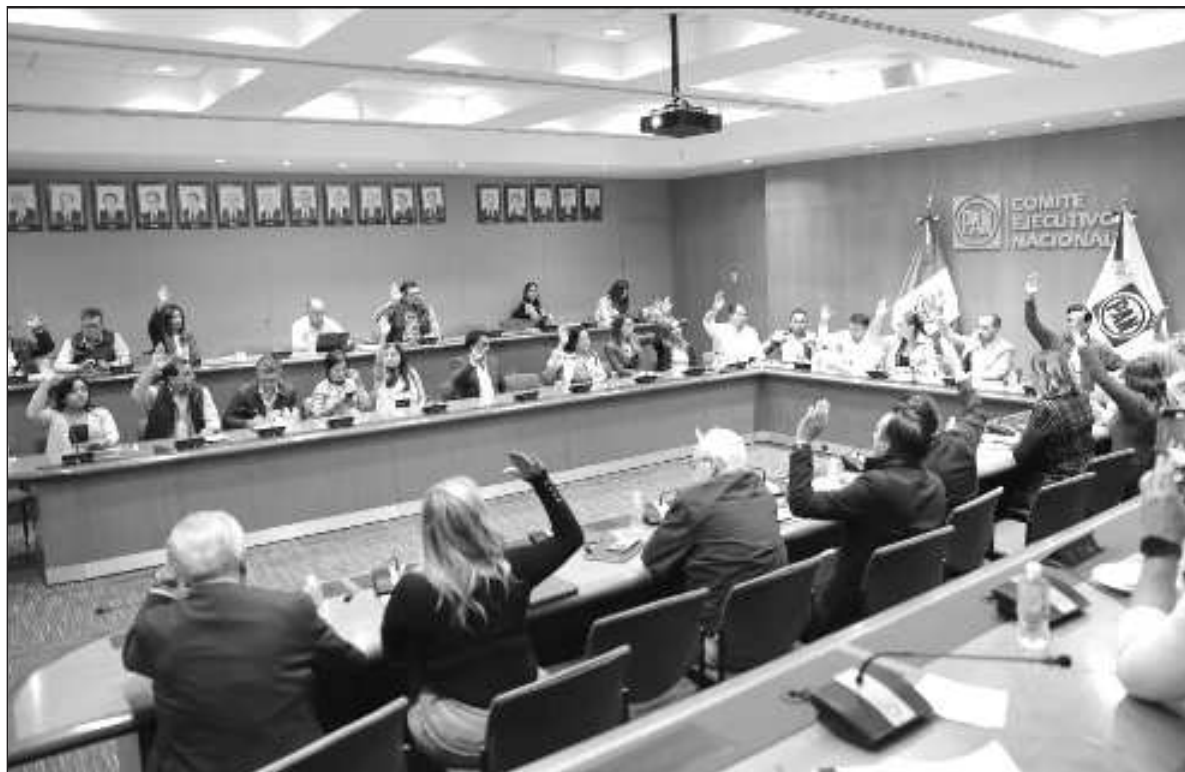
▲ "Acción Nacional es hoy la principal fuerza partidista opositora, pero su poderío real está muy disminuido: ha perdido infinidad de posiciones de gobierno, en el Congreso federal no tiene ningún poder de contención a la aplanadora de Morena".

Y, LO PEOR, no hay ningún atisbo de producción ideológica o programática que permita suponer que esa derecha inserta en el sistema pueda salir de su laberinto de oportunismo, patrimonialismo e inmediatez.