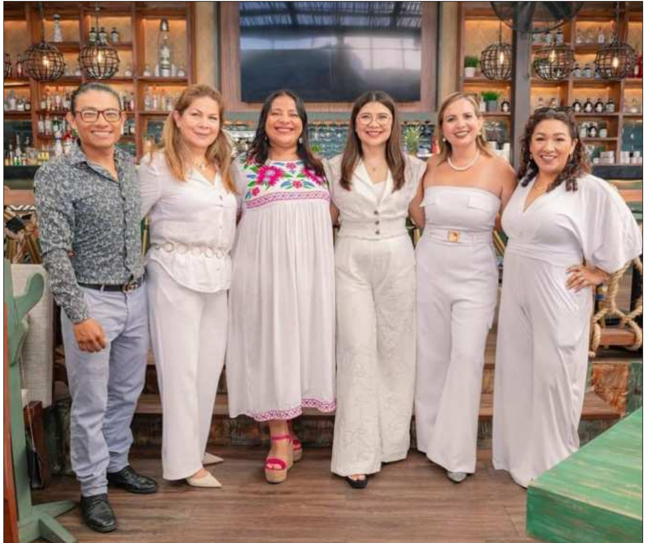
▲ La iniciativa Mujeres conectando responde a una comunidad que engloba mujeres emprendedoras, empresarias y profesionistas que trabajan con un propósito del crecimiento profesional, enfocado en sus diferentes proyectos de negocios.

El número máximo de mujeres afiliadas en Mérida es de 60. Hasta la fecha, esta iniciativa lleva la mitad de sus afiliaciones completadas.