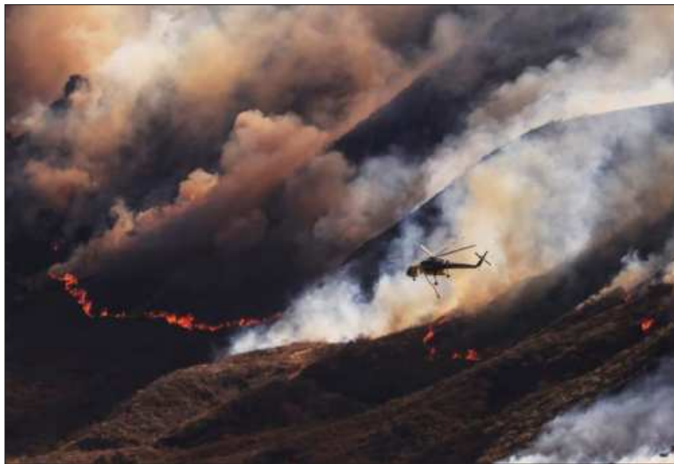
▲ El incendio es uno de varios que arden en la costa este en medio de una falta de lluvias significativas desde septiembre; un bombero murió durante las acciones de control.

El servicio de bomberos forestales del estado de Nueva Jersey dijo el domingo que el incendio — denominado el Incendio Forestal Jennings Creek — amenazaba 25 estructuras, incluidas dos casas de Nueva Jersey. Había crecido a 12 kilómetros cuadrados (4,7 millas cuadradas) y estaba contenido en un 10% hasta el domingo por la noche.