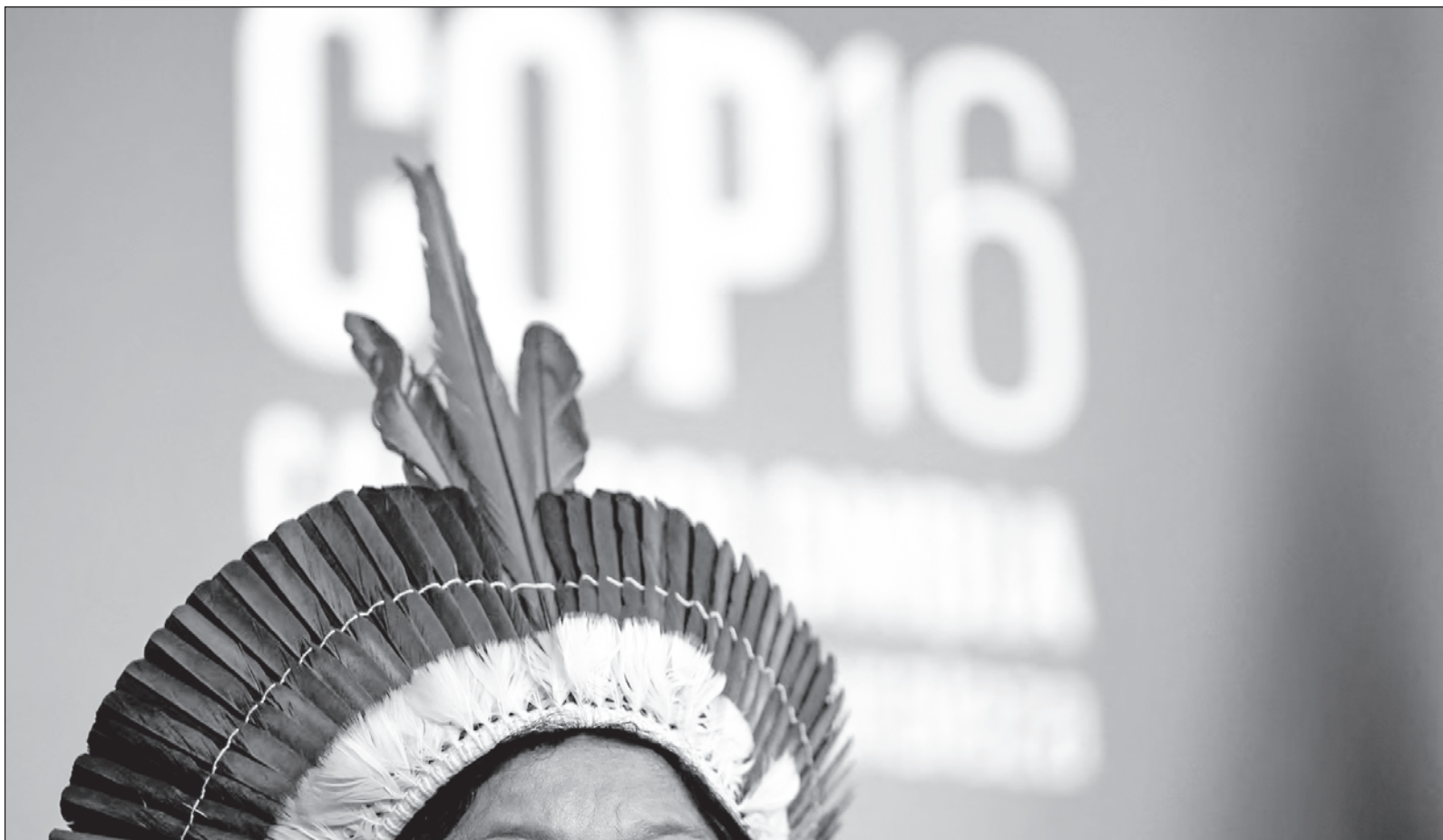
▲ "La historia está llena de casos de abusos, extorsiones, simulaciones, que explican el posicionamiento de varios grupos indígenas en el planeta, en el sentido de proteger y no compartir sus saberes y logros (...) en los tres tipos de COP la biodiversidad y los sistemas alimentarios son factores transversales".