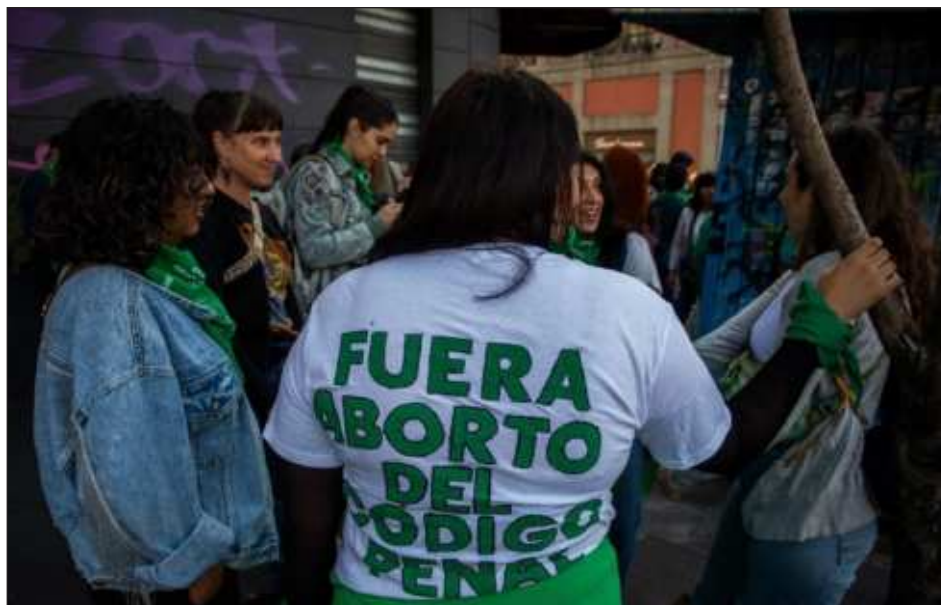
▲ A finales de agosto del 2023, la Corte ordenó al Congreso de Aguascalientes que elimine los artículos de su Código Penal que castigan con cárcel el aborto, siempre que este se realice en el periodo de 12 semanas de la gestación.

"A quien voluntariamente se practique un