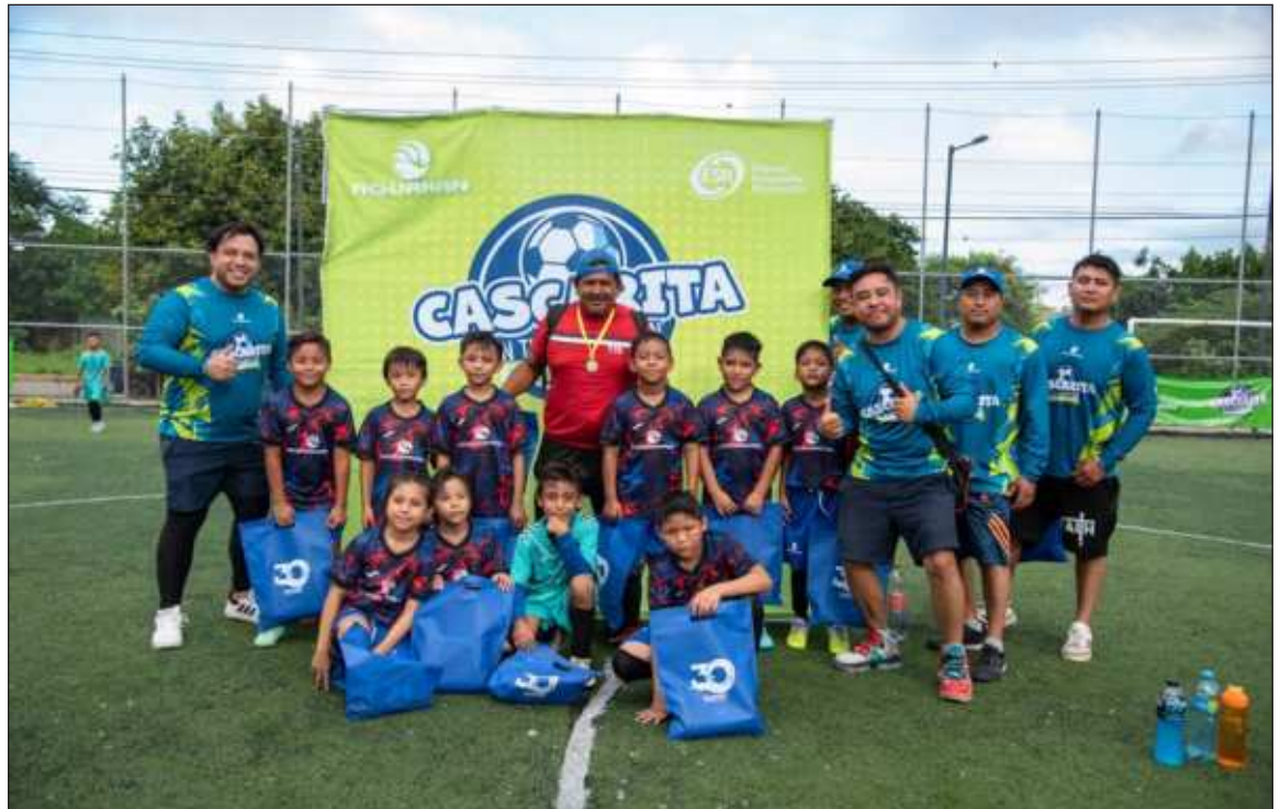
▲ El torneo reunió a más de 40 equipos de los municipios de Benito Juárez, Solidaridad, Puerto Morelos e Isla Mujeres. Las finales se celebraron el 9 de noviembre en el “Parque de los Gemelos” en la Supermanzana 227.