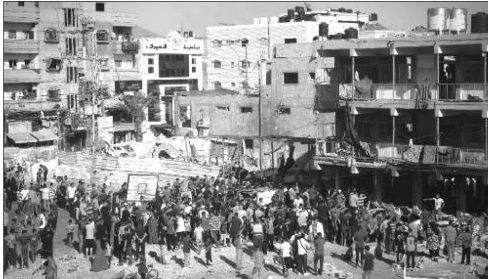
▲ Los ataques de Israel contra la Franja de Gaza han matado a por lo menos 41 mil 84 palestinos y ha dejado heridos a otros 95 mil 29, según el Ministerio de Salud del territorio.

Por lo menos 14 muertos de ese ataque, incluyendo dos menores de edad y una mujer, fueron llevados al Hospital Awda y al Hospital de los Mártires al-Aqsa, dijeron funcionarios de esas dos instalaciones.