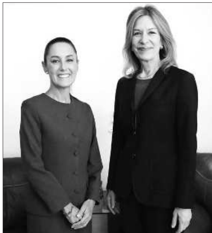
▲ Sería de esperar que la cuestión electoral en EU fuese el tema primordial. Ahí, los comicios serán el 5 de noviembre, un mes después de que Sheinbaum asuma la presidencia.

Sería de esperar que la cuestión electoral en Estados Unidos fuese el tema primordial. Ahí, los comicios tendrán lugar el 5 de noviembre, un mes después de que Sheinbaum Pardo asuma la presidencia. El caso es que, según dio a conocer la virtual presidenta electa, ha quedado de manifiesto que el Entendimiento Bicentenario será la base de más acuerdos en los temas de