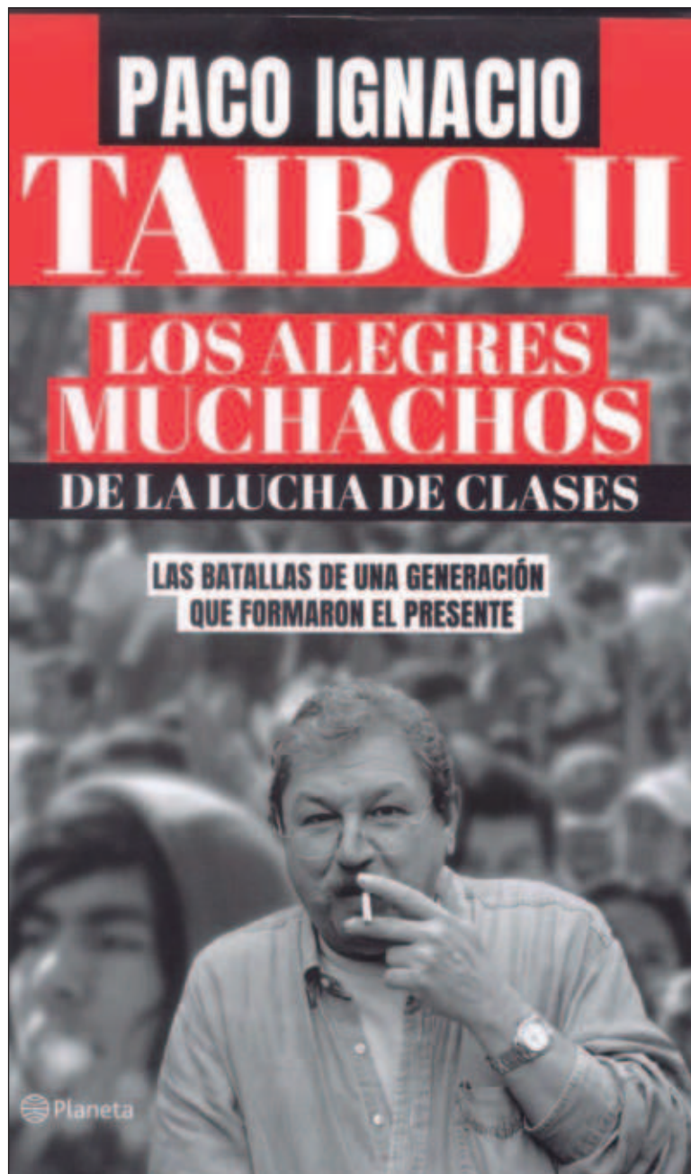
▲ “El universo multiforme de Taibo se gesta en un núcleo familiar de transterrados progresistas que orientan su percepción unitaria de la vida llevándolo a adoptar, en hora temprana, la cultura del país receptor”. Foto Facsímil

La identidad del narrador —que además apela al uso de distintas personas gramaticales en la exposición segmentada del relato— recurre a varias figuras individuales para confluir en un perfil generacional definido en símbolos y rituales, for-