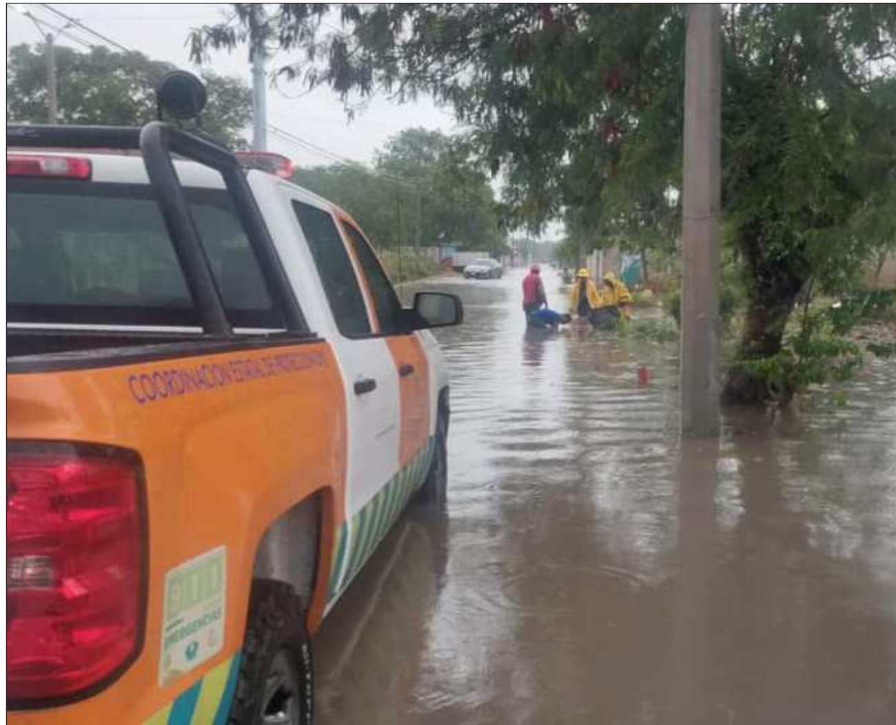
▲ A los conductores de manera específica se les pide: reducir la velocidad, usar luces intermitentes, aumentar la distancia entre vehículos, mantener los vidrios desempañados y evitar introducir el vehículo en encharcamientos.

De acuerdo con el pronóstico del Servicio Meteorológico