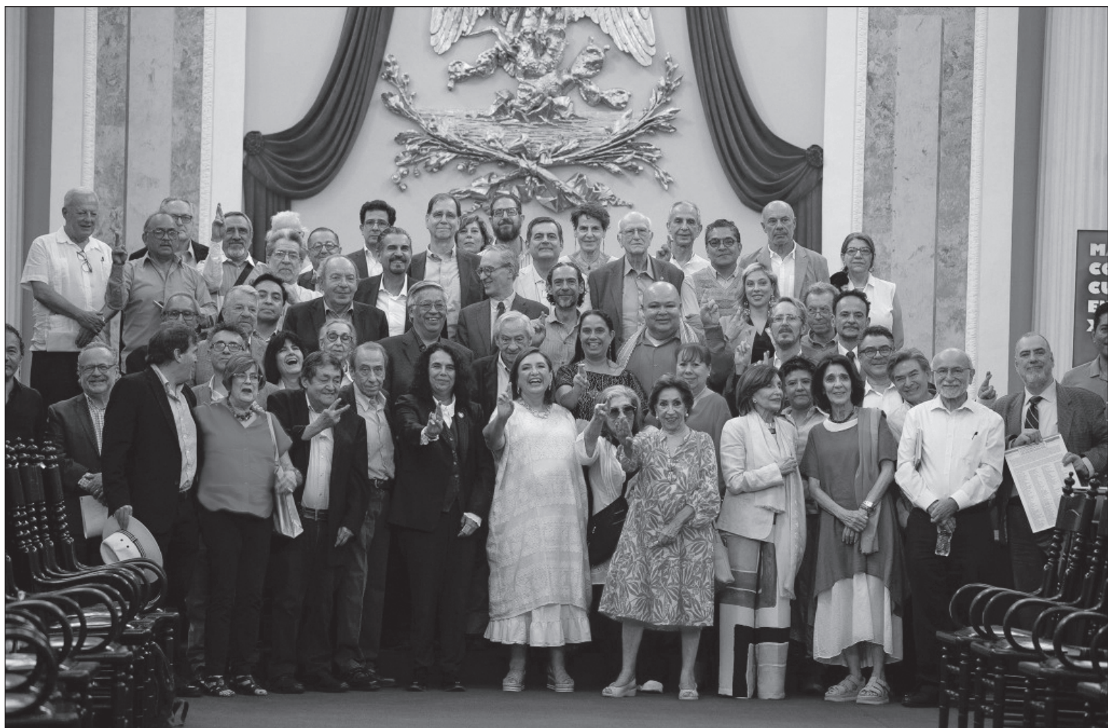
▲ “Los intelectuales orgánicos de la oposición mostraron su clasismo al proponer abiertamente la baja y la mentira como estrategias de campaña”.