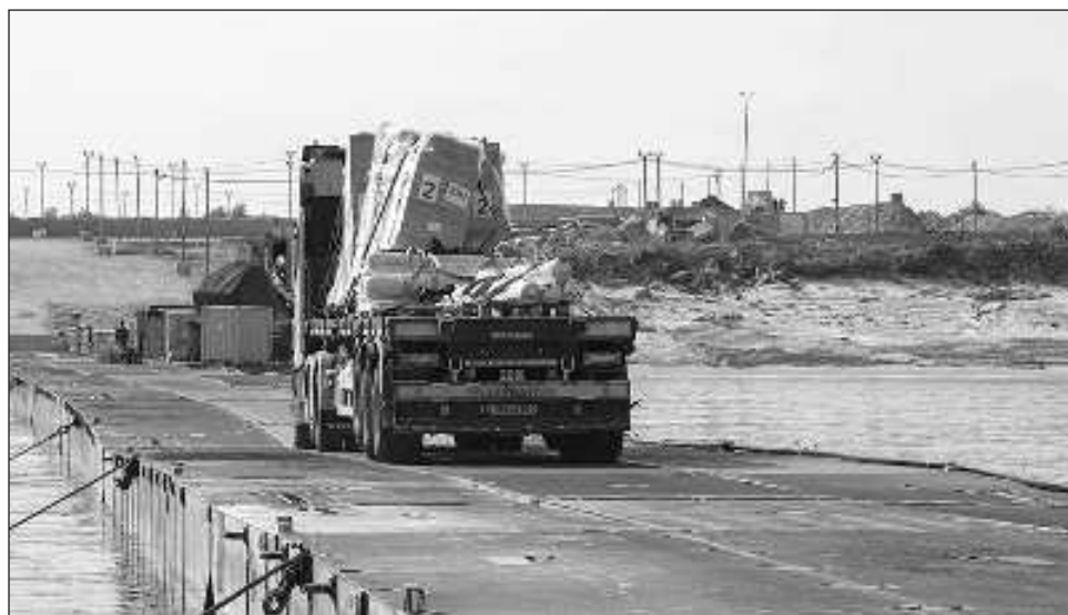
▲ Los grupos armados presentaron un comunicado sobre la propuesta de tregua que también respaldó el Consejo de Seguridad de la ONU en una nueva resolución.

En el comunicado, las milicias insisten en la necesidad de que Israel se retire totalmente de Gaza y aseguran que entregaron su respuesta oficial la tarde de este martes