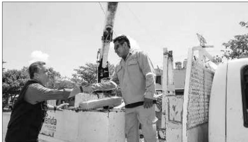
▲ El ayuntamiento refuerza el programa de bacheo y mantenimiento de las calles a fin de evitar en lo posible las afectaciones viales en esta temporada de lluvias.

Explicó que parte de este programa preventivo incluye la construcción de dos aljibes, limpieza de calles, desazolve de pozos de absorción, poda de árboles, bacheo, construcción y mantenimiento de rejillas.