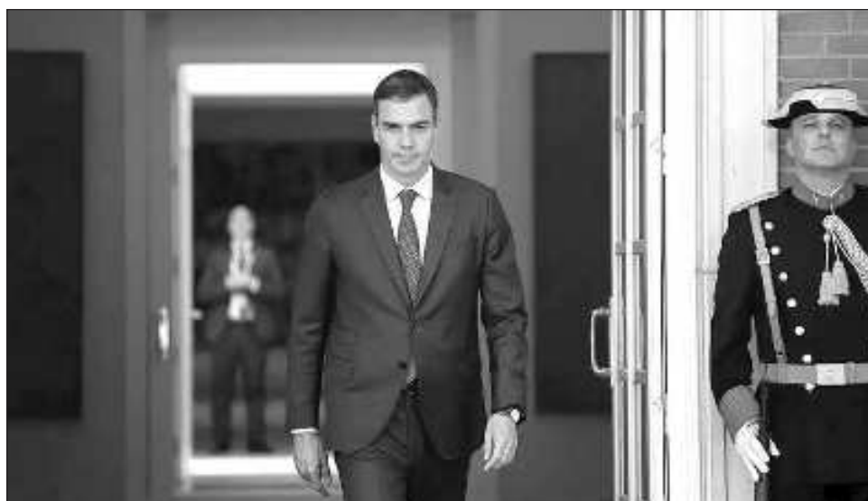
▲ Pese a que la ley de amnistía superó el último trámite parlamentario desde el pasado 30 de mayo, Pedro Sánchez decidió ralentizar el proceso de su entrada en vigor.

A pesar de que la ley de amnistía superó el último trámite parlamentario desde el pasado 30 de mayo, el Ejecutivo español decidió ralentizar el proceso de su entrada en vigor ante el temor de que