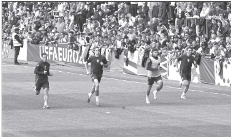
▲ Jugadores de Italia durante un entrenamiento el martes en Iserlohn, Alemania.

Esa fue la primera derrota de España en casi un año después de hilvanar ocho victorias. Ello incluyó la campaña para consagrarse en la Liga de Naciones, con triunfos frente a dos de sus oponentes en el Grupo B -Italia en las semifinales y Croacia en una tanda de penales en la final.