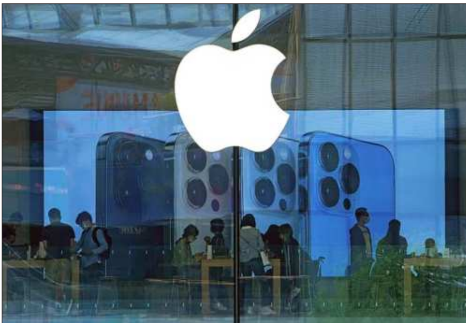
▲ La demanda original se presentó en marzo de 2024 y 15 estados, así como el Distrito de Columbia se unieron a la demanda en ese momento, ahora se suman cuatro más.

Los funcionarios también dijeron que Apple impone cargos ocultos a varios socios comerciales, desde desarrolladores de software a compañías de tarjetas de crédito e incluso rivales como Google de Alphabet GOOGL.O.