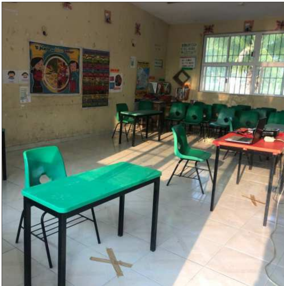
▲ Tanto en la primaria Rafael Ramírez y la secundaria Técnica Industrial 26, hay aulas que no cuentan con aire acondicionado, por lo que los estragos de las altas temperaturas son mayores.

En algunos de ellos los horarios establecidos serán de 8 a 12 horas en el turno matutino y de 15 a 18 horas en el turno vespertino.