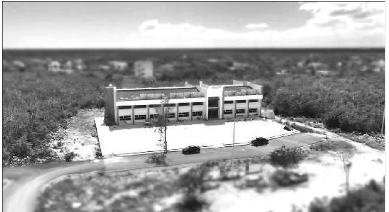
▲ El nuevo plantel educativo consta de 12 salones para poder atender los turnos matutino y vespertino. Tiene auditorio, laboratorios de cómputo e idiomas y una cocina; además, ya cuenta con el mobiliario y equipamiento correspondiente de todas las áreas.

El encargado de la Rectoría indicó que actualmente cuentan con una matrícula de 120 alumnos y están esperando recibir en el nuevo ciclo escolar 120 más, pero podrían recibir más estudiantes debido a que Tulum es un municipio con mucho crecimiento demográfico y por ende auguró que el crecimiento