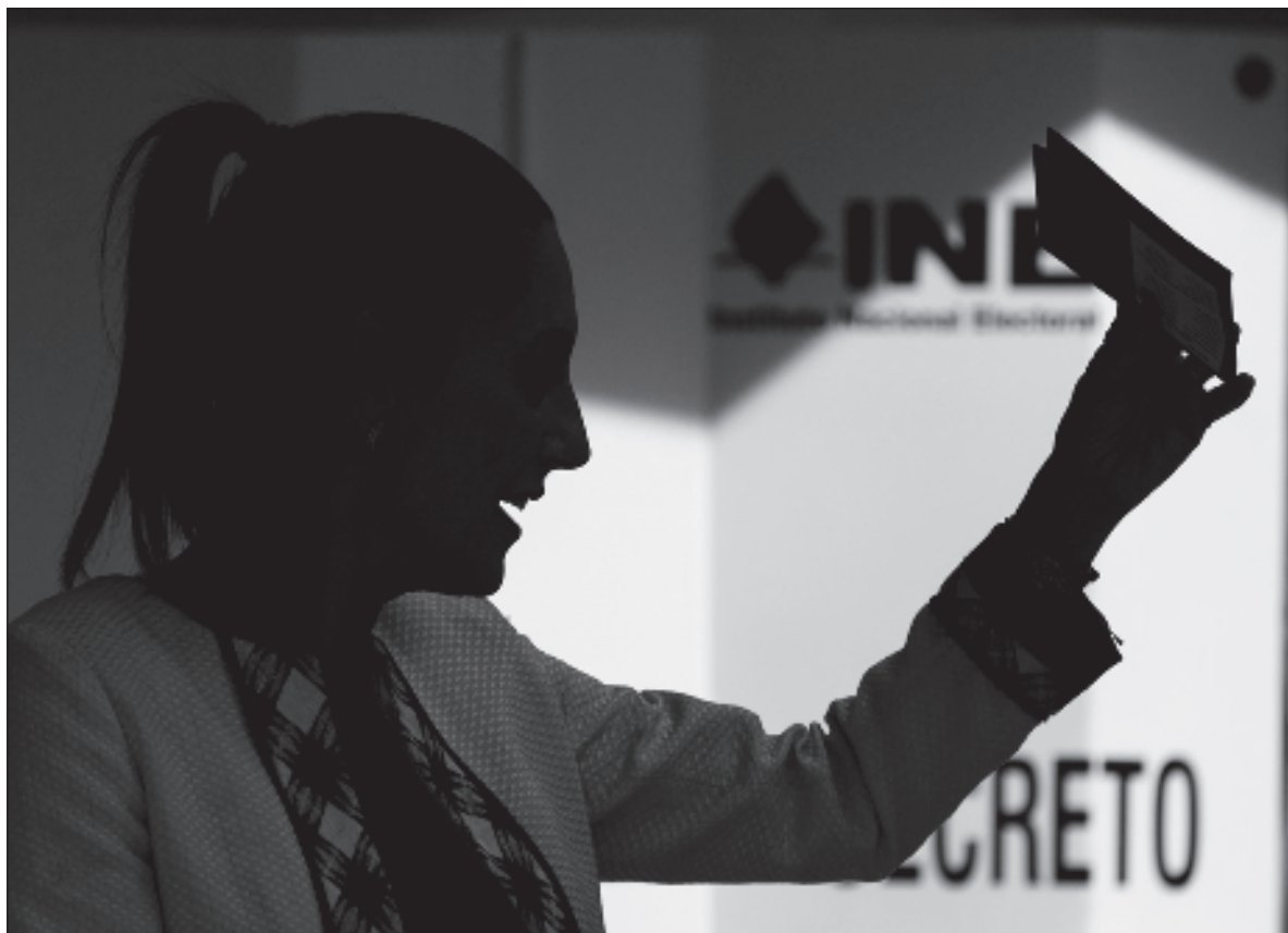
▲ “Improductivo y paralizante es dedicar la energía ciudadana a descalificar, alimentando la desconfianza y el prejuicio, e intentando frenar, detener o dificultar cualquier acción que provenga de la administración legítimamente constituida”.

Unos pocos sugieren que tenemos delante un brevísimo período de transición, de unos cuatro meses, que nos pone delante la tarea de conocer lo que espera lograr la presidenta electa, saber quiénes formarán parte de su equipo y cuál será su talante y su capacidad, estimar cómo matiza su relación con la administración anterior y el partido (ha ofrecido sin cortapisas que será “presidenta”