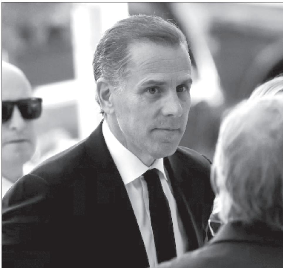
▲ El hijo del mandatario estadounidense enfrenta hasta 25 años en prisión cuando sea sentenciado por la jueza Maryellen Noreika; de momento no está claro si recibirá tiempo tras las rejas.

El jurado del proceso emitió un fallo histórico del primer juicio al hijo de un presidente de Estados Unidos en ejercicio.