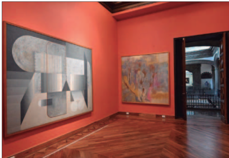
▲ A poco más de 40 años desde que Banamex y Seguros de América se separaron, ahora se reúnen de nueva cuenta, gracias a Volver a vernos: Reencuentro de dos colecciones , una de las dos exposiciones con las que Citibanamex celebra su 140 aniversario en el Foro Valparaíso.

Con ella se logra, por primera vez, "la reconstrucción temporal de lo que fue la colección" de arte de Banamex hasta la nacionali-