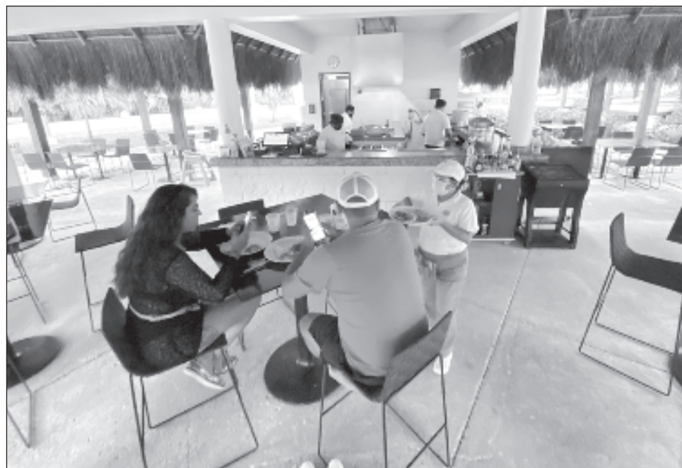
▲ En busca de fortalecer alianzas y generar beneficios, Gignet firmó un convenio de colaboración con la APAR para ofrecer Internet de calidad a sus miembros, además de acceso a proyectos especiales y participación en la feria de rentas vacacionales.

En ese marco, Luis de Potestad mencionó que a nivel nacional hay cerca de 900 mil cuartos hoteleros y una tercera parte de esa cifra es renta vacacional, es decir, cerca de 350 mil unidades, pero en Quintana Roo esa proporción es mayor, pues de un total de 130 mil cuartos hoteleros que reporta la Secretaría de Turismo, hay cerca de 65 mil más