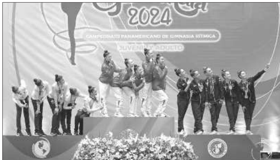
▲ El equipo nacional de gimnasia rítmica se coronó en el campeonato panamericano.

"Pasamos por mucho, la ruta ha sido larga y con muchas piedras en el camino, lo que nos sucedió entrenando con las campeonas mundia-