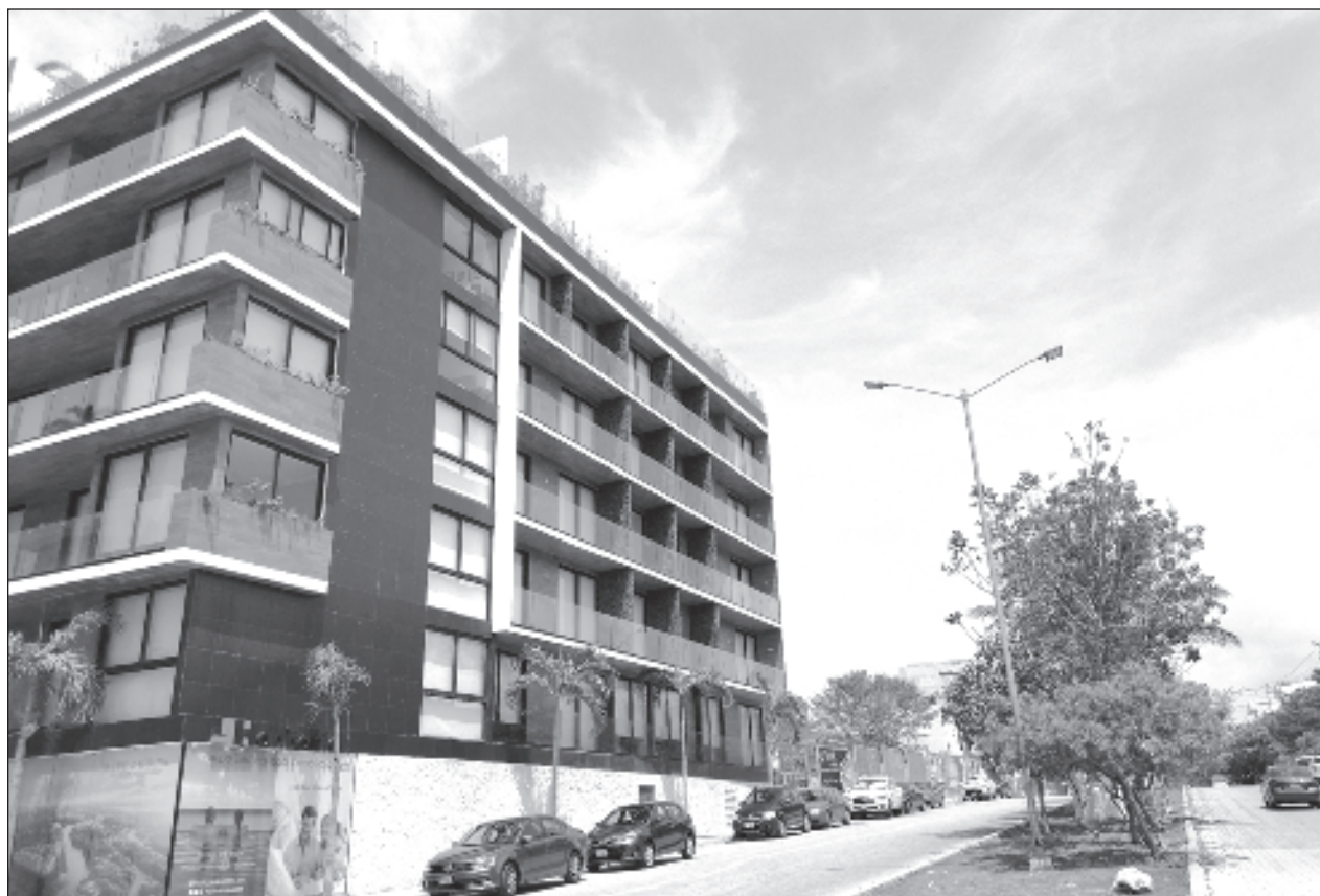
▲ En la reglamentación para rentas vacacionales, adelantó el presidente de la APAR, se incluirá la obligación del registro a nivel estatal en el Returq para cualquier negocio que trabaja con turismo.

Por ello, insistió, hay mucha esperanza de que se tendrá un factor para generar más inversión extranjera y nacional. En temas extranjeros se tendría especialmente interés desde Europa y China.