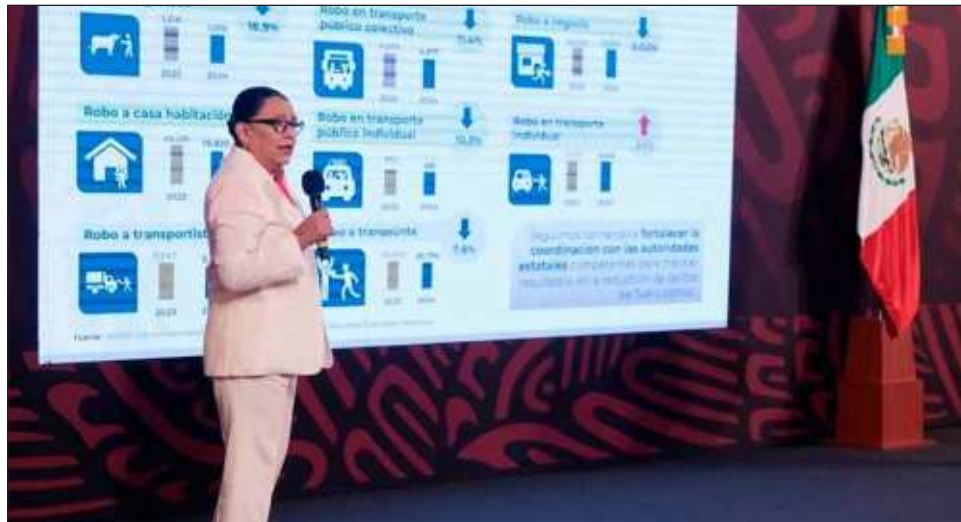
▲ En un comparativo a los asesinatos registrados en el país en enero de 2019, el promedio diario se ha reducido en 17%, de acuerdo a cifras presentadas por la SSPC.

Durante la presentación del informe quincenal de seguridad, la funcionaria ratificó que en seis entidades se concentran 44 por ciento de los homicidios cometidos en todo el país. Al desglosar la situación en cada una de las entidades con más alto índice de este delito, mencionó que en