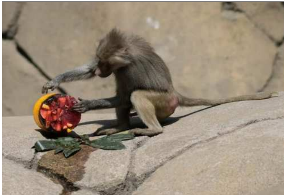
▲ La Semarnat no ha ofrecido datos de aves u otros animales muertos por el calor.

En la región La Huasteca, en San Luis Potosí, una zona montañosa del centro norte del país, el refugio de fauna silvestre Selva Teenek ha atendido en los últimos dos meses a medio centenar de ejemplares en tres espacios con aire acondicionado. Allí han recibido búhos, lechuzas, polluelos, águilas, pero también coyotes, lince o tigres, todos deshidratados.