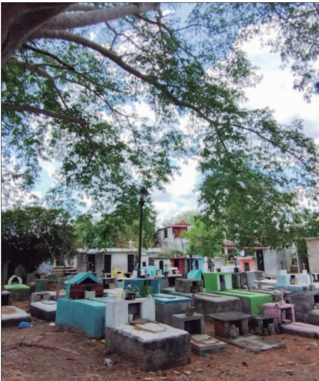
▲ Las calles de esta localidad a diario se vacían, pues es el lugar del país con mayor porcentaje de residentes que trabajan en otro municipio: estudio del Coneval.

TIMUCUY, PUEBLO YUCATECO QUE SE VUELVE FANTASMA PARA SALIR DE LA POBREZA