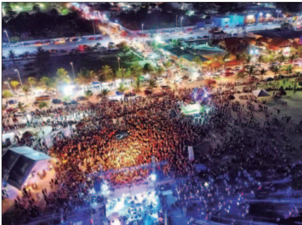
▲ Se prev3 que este 16 de julio se realizar3 el acto inaugural de la Concha Ac3stica de Playa Norte, con la participaci3n de Mijares.

Cabe destacar que en este marco de la Feria Carmen 2024, se tienen contemplados eventos deportivos, culturales, recreativos, art3sticos, entre otros.