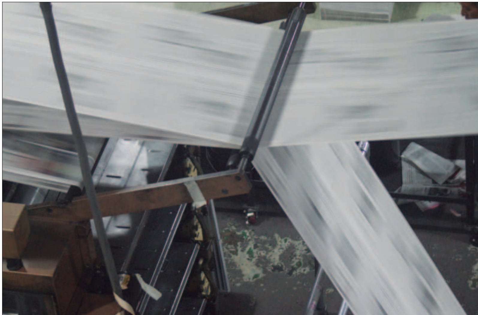
▲ “Aunque no hay nada más efímero que una noticia impresa en una página, la constancia que deja la tinta en el papel hace aún más creíble el suceso o la declaración. Los periódicos tatúan el instante en la memoria. Los medios impresos son honestos: no intentan esconder sus tendencias, las presumen”.