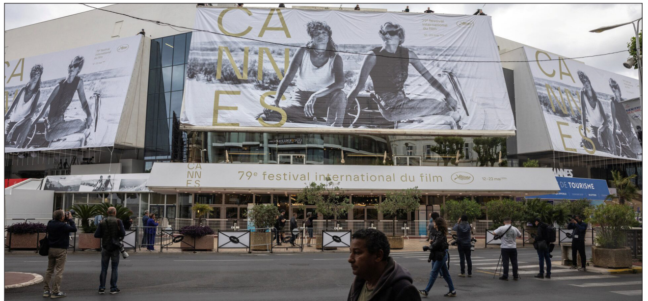
▲ Cannes firmó una carta que reclamaba la paridad en todas las áreas del cine, pero el texto no incluía que eso se tuviera que aplicar a la competición oficial. “Nos acusan de lavado de imagen feminista”, dijo Thierry Frémaux

En una rueda de prensa en la víspera de la apertura