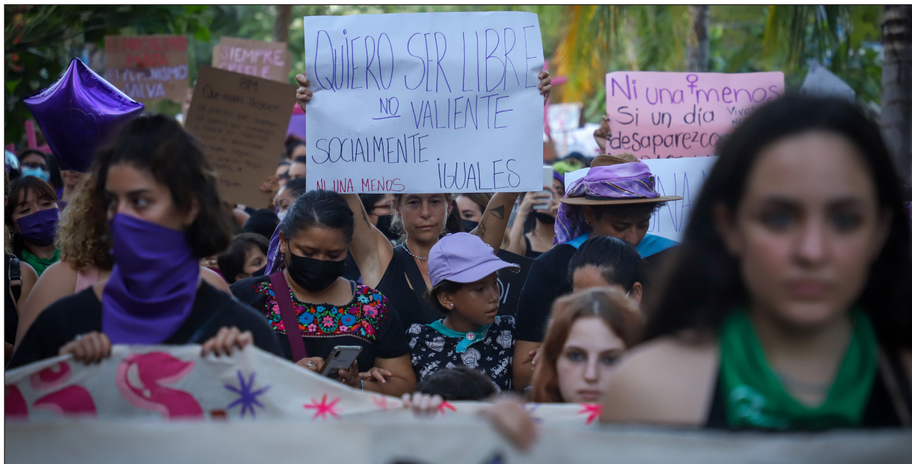
▲ Yucatán es una de las 27 entidades que aprobó la reforma para emitir una ley general a fin de prevenir, investigar y sancionar el delito de feminicidio, con la cual se podrá establecer un protocolo y sanciones únicas para todo el país.