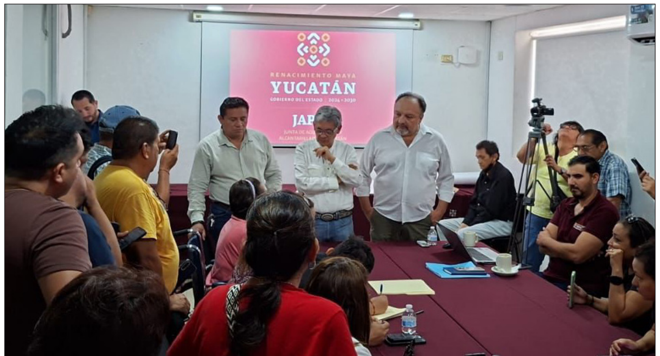
▲ El titular de la Japay señaló que el desabasto se debe en parte al crecimiento de la ciudad.

Para atender el nulo abasto de agua en colonias como la Alemán, Jesús Carranza, San Miguel, López Mateos, Industrial, entre otras, se construirá un nuevo cárcamo con miras a estar listo en diciembre de este