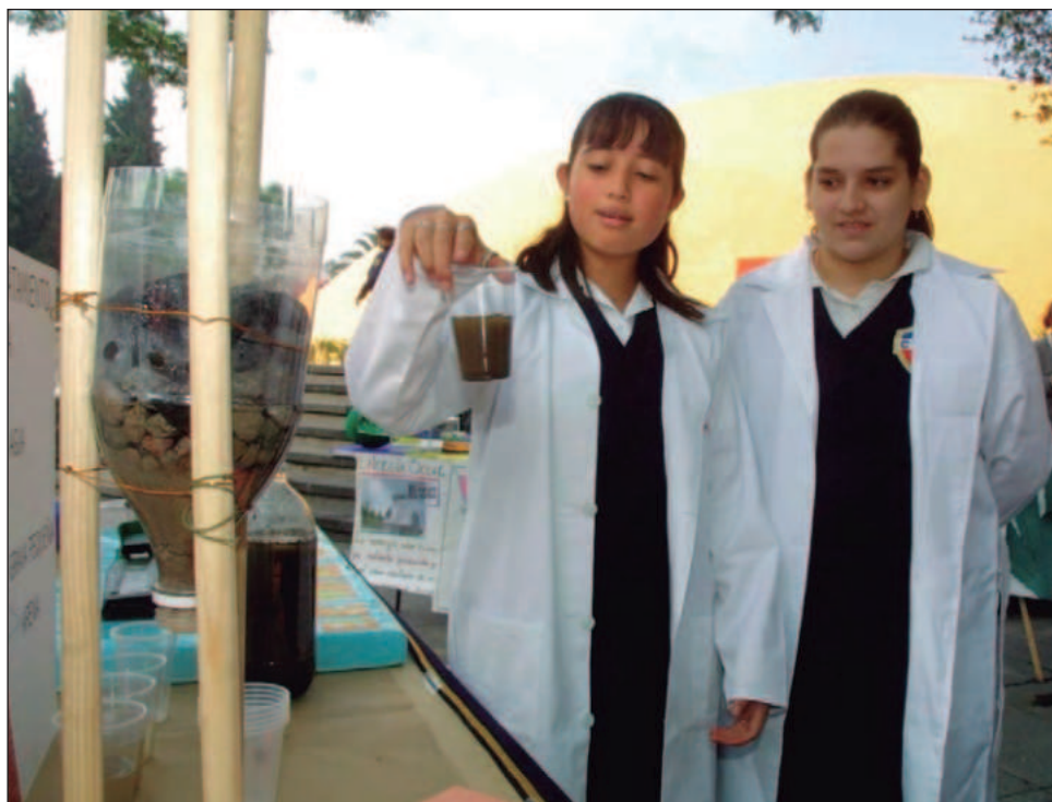
▲ “Nos dicen que avanzar en la ciencia es como subir una escalera, vas peldaño a peldaño, pero para la mayoría de las mujeres, va en zigzag y con obstáculos”.

En el marco del Día Internacional de la Mujer y la Niña en la Ciencia, que se conmemora cada 11 de febrero, la Unesco destaca la importancia de reconocer el papel clave de las mujeres en la comunidad científica y tecnológica, así como en la necesidad de visibilizar la desigualdad de género que aún enfrentan las mujeres en estos campos del conocimiento.