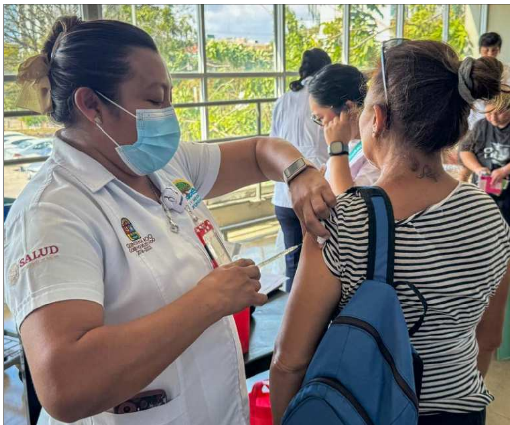
▲ Al coctel se suma el rezago de vacunas durante y tras la epidemia de Covid-19.

El número de personas contagiadas de sarampión desde el inicio del brote está próximo a llegar a 10 mil, y lamentablemente ya han perdido la vida 29 personas. Debe hacerse énfasis en que tanto la enfermedad como los decesos por su causa son completamente prevenibles y que, a diferencia de la pandemia de 2020, no es necesario esperar a que se desarrolle una vacuna. Al contrario, esta ya existe y su eficacia está probada. Entonces, procedamos con calma a localizar el módulo que más resulte conveniente y protejamos a quienes aún no tienen la cobertura.