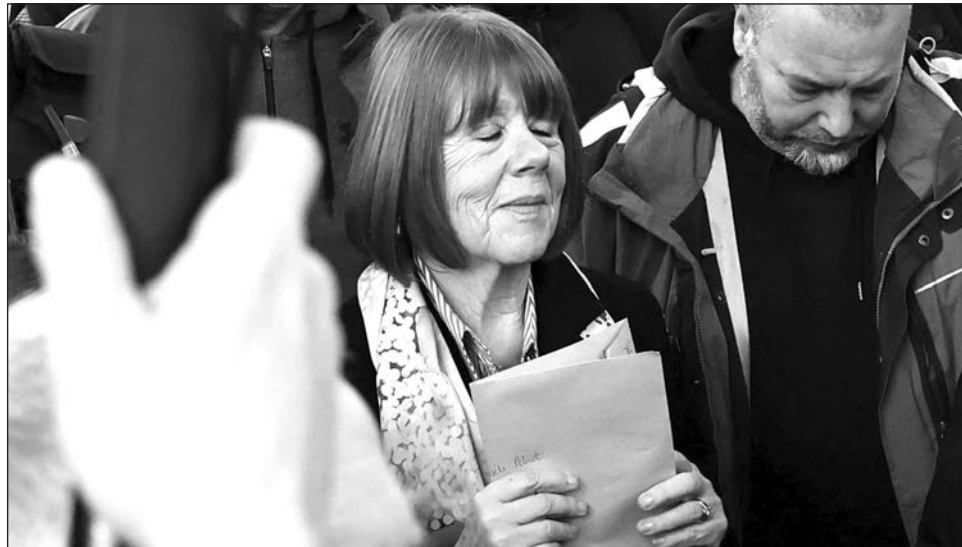
▲ Los extractos de Un himno a la vida. La vergüenza tiene que cambiar de lado publicados el martes por el periódico francés Le Monde, se remontan al día en que el mundo de Gisèle se vino abajo.

Su entonces esposo, Dominique Pelicot, había sido citado por la policía para ser interrogado después de que un guardia de seguridad de un supermercado lo sorprendiera grabando en secreto videos bajo las faldas de mujeres.