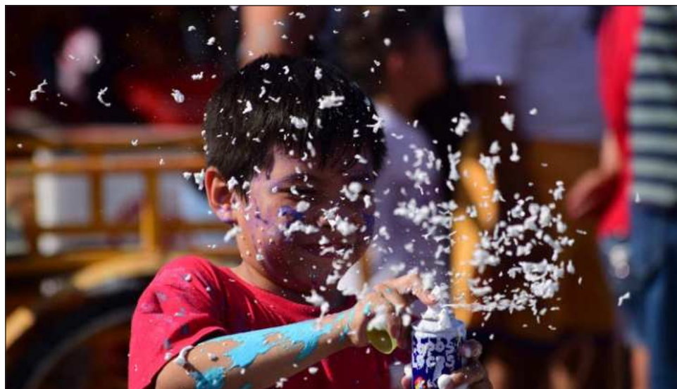
▲ Autoridades sanitarias realizarán la supervisión para que no se comercialicen productos como la espuma, la cual contiene productos que son nocivos para la salud de la población.

Como sucede en cada festividad de este tipo, se realizará la supervisión para que no se comercialicen productos como la espuma, la cual contiene productos que son