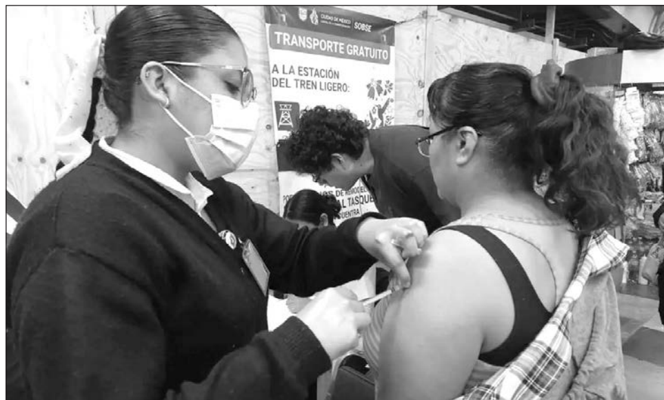
▲ La Presidenta citó que siete estados registran "un número significativo de transmisión", que "vamos a tratar de reducir": Jalisco, Colima, Chiapas, Sinaloa, Nayarit, Tabasco y CDMX.

"Lo importante en este momento es, a todas las familias que tienen hijas e hijos de los 6 meses a los 12 años, si no se han vacunado, que se vayan a vacunar a su centro de salud. Si recibieron la primera vacuna hace seis meses o más, ya pueden recibir la segunda dosis. Entonces, hay que dar primero prioridad a las niñas y a los niños, y en ciertos estados a otro sector de edad y ya vamos a unificar todos los mensajes, porque es importante que sea un sólo mensaje en todo el país",