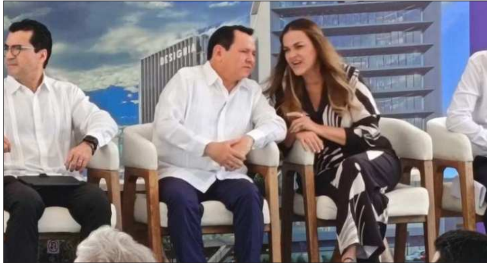
▲ El jefe del Ejecutivo estatal señaló que elegir a la entidad como sede corporativa representa una inversión y una presencia permanente, pero también demuestra confianza en la estabilidad.

"Gracias por confiar en Yucatán como sede de largo