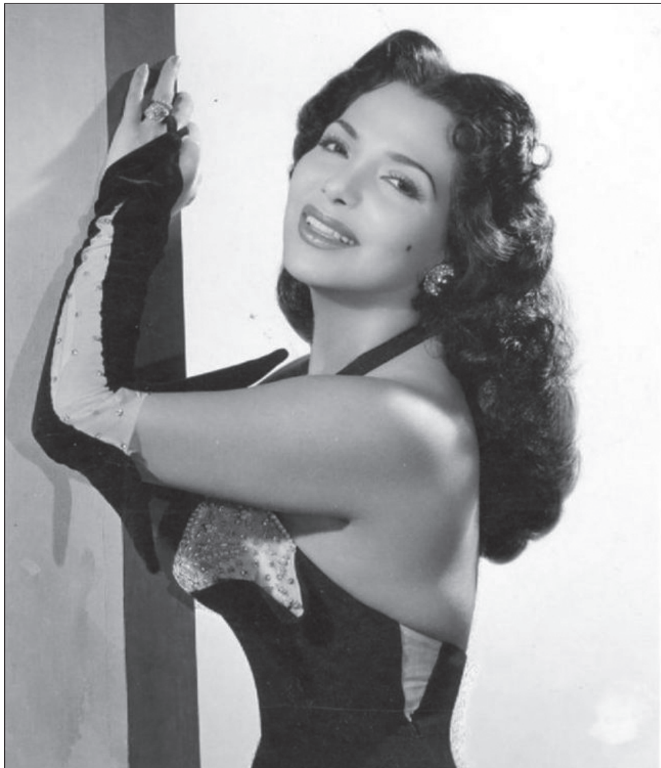
▲ En escena para celebrar a la diva, estarán alrededor de 12 bailarinas, con 15 músicos que integran la orquesta y 10 cantantes.

La también bailarina agradeció a la familia de