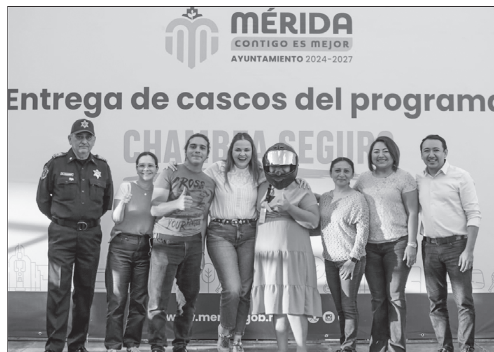
▲ El objetivo es que quienes utilicen este medio de transporte como fuente principal de sustento, puedan realizar su labor diaria con mayor seguridad.