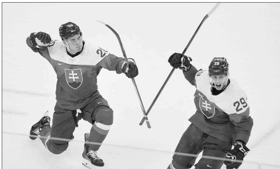
▲ Eslovaquia sorprendió a Finlandia en el arranque del hockey sobre hielo varonil.

Además, el joven de 21 años estableció un récord olímpico, pero tuvo que esperar más de lo habitual para que se confirmara su victoria después de que le dieron a otro patinador una repetición a raíz de que fue golpeado durante su carrera.