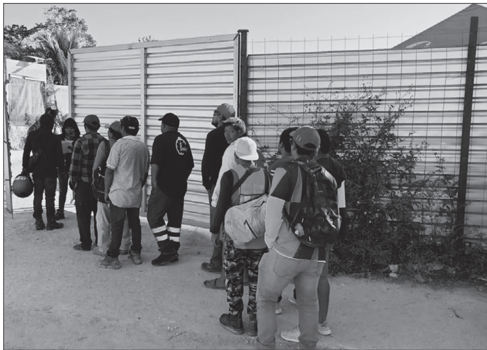
▲ Los obreros se encuentran en la incertidumbre pues no saben si van a recibir pagos por las jornadas que ya trabajaron y por los días caídos ante la suspensión de labores.

Al calor de los reclamos, y ante la presencia de unos 30 obreros molestos, la representante de una de las empresas participantes, quien solo se identificó como arquitecta pero no quiso dar su nombre, o datos de la empresa a la cual representa, afirmó que no hay