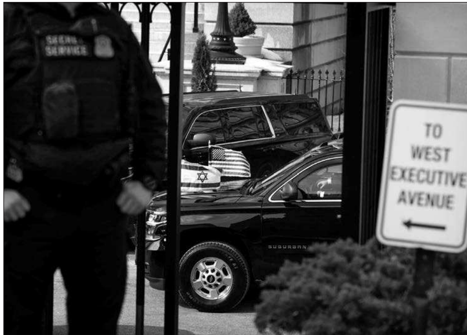
▲ De acuerdo con un comunicado oficial, Netanyahu reiteró las necesidades de seguridad de Israel en el marco de las negociaciones entre Washington y Teherán.

El líder israelí, que visita por sexta vez Estados Unidos en este segundo mandato del republicano, reclama que las negociaciones incluyan también