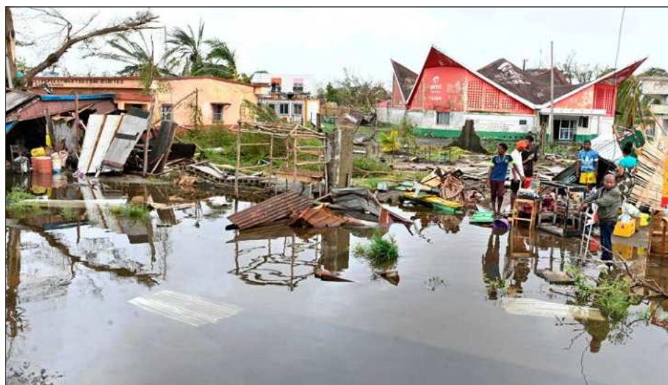
▲ Toamasina, con alrededor de 300 mil habitantes, sufrió graves daños; el presidente Michael Randrianirina, quien asumió el poder en un golpe de Estado en octubre, visitó el lugar para evaluar lo sucedido.

Madagascar, que recibió el impacto de otro ciclón letal hace menos de dos semanas, es especialmente vulnerable a los ciclones procedentes del Índico.