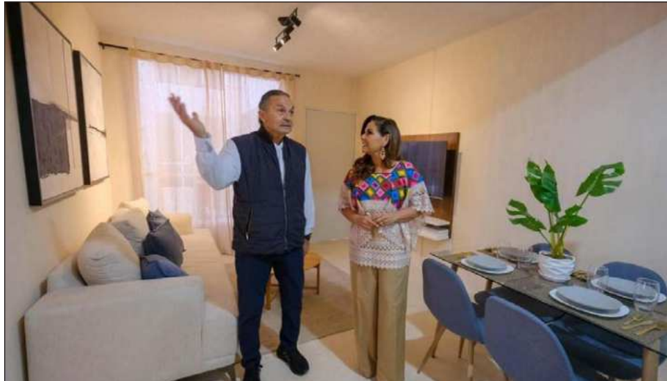
▲ Mara Lezama Espinosa reiteró que en Quintana Roo el programa ya está construyendo 31 mil viviendas con una inversión estimada de 37 mil millones de pesos.

En la conferencia también se realizó un enlace con el gobernador de Sonora, Alfonso Durazo, quien acompañado de la secretaria de Desarrollo