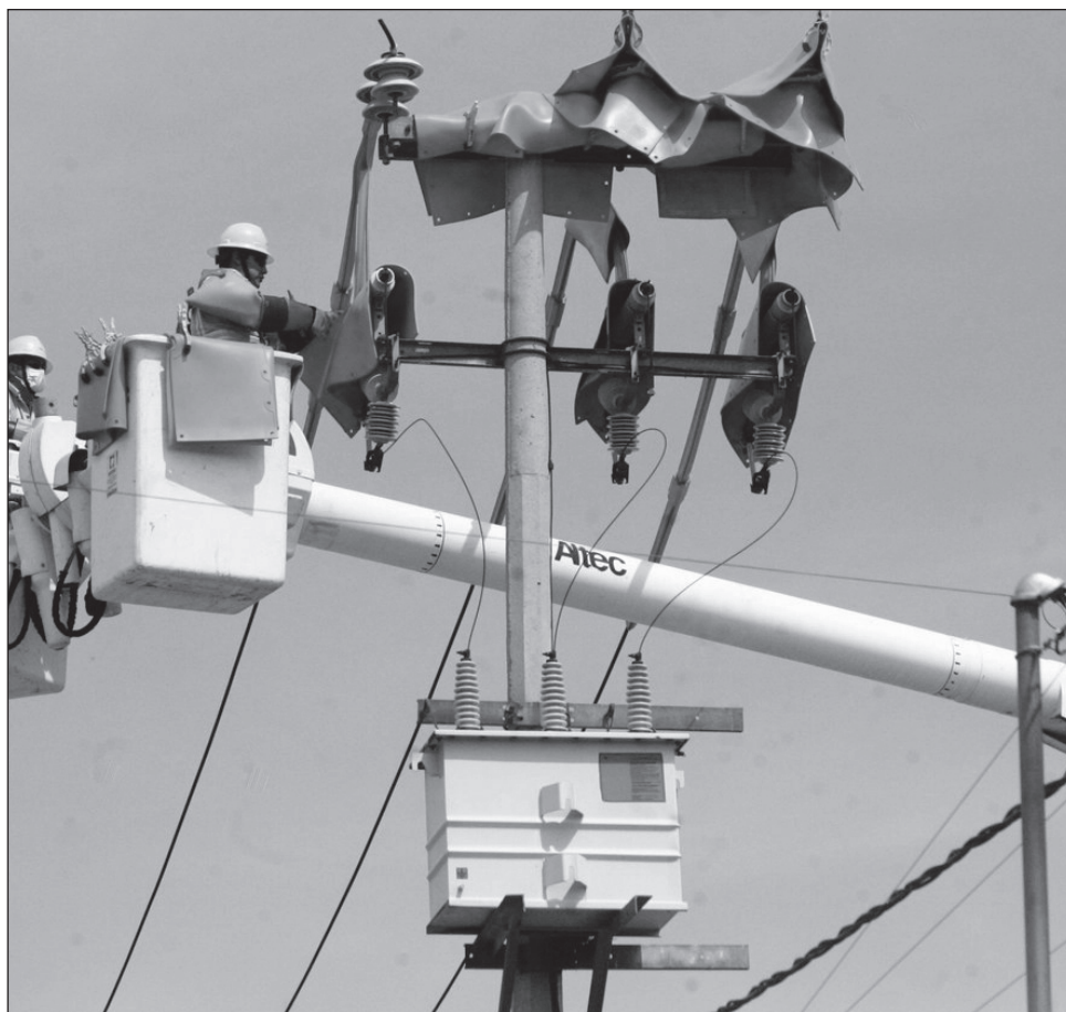
▲ En el caso de líneas menores a 220 kilovoltios, el retiro de electricidad será de 0.1801 pesos por kilowatt hora, según lo establecido en el Acuerdo CT/7.SE/3-2025.

Esta actualización es relevante para los usuarios y el sector eléctrico en general, ya que impacta directamente en los costos asociados a la transmisión de energía.