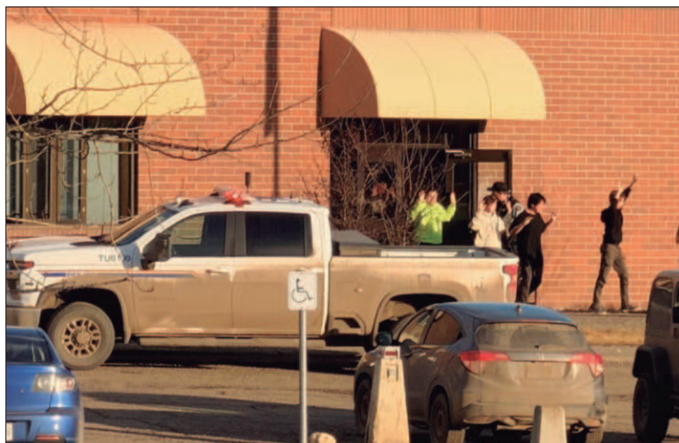
▲ “Padres, abuelos, hermanas, hermanos en Tumbler Ridge se despertarán sin alguien a quien aman. La nación llora con ustedes, y Canadá está con ustedes”, subrayó el primer ministro canadiense Mark Carney a su llegada al Parlamento.

Más de 25 personas resultaron heridas durante el ataque del martes en la pequeña comunidad montañosa de Tumbler Ridge, incluidas dos que conti-