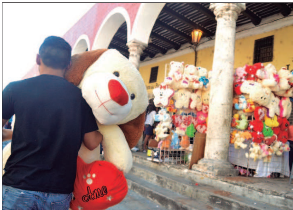
▲ La aplicación de citas Tinder tiene un aumento de millones de mensajes entre el 1° de enero y el 14 de febrero, en comparación con el resto del año.

No es cosa de otro mundo: los delincuentes buscan perfiles de solteros en internet, los contactan y hablan durante el mes previo a San Valentín, piden dinero para viajar y conocer