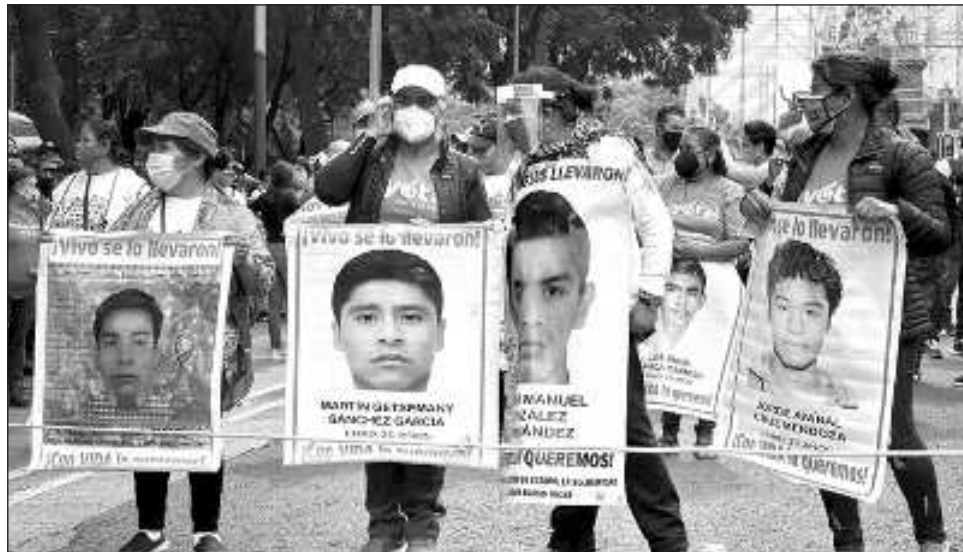
▲ López Obrador también señala que el desmoronamiento de la llamada verdad histórica, urdida en la pasada administración priista, generó una secuela de complicaciones.

"La desaparición de los jóvenes y el crimen de Iguala no fue ordenado por el pre-