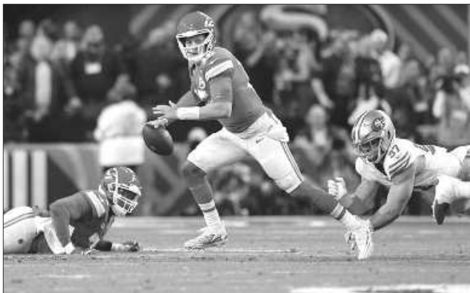
▲ El jefe Patrick Mahomes elude a Nick Bosa durante el Súper Tazón en Las Vegas.

Los Jefes perdían 22-19 luego que Jake Moody pateó un gol de campo de 27 yardas en la primera posesión del tiempo extra, pero Mahomes condujo a los campeones de la Conferencia