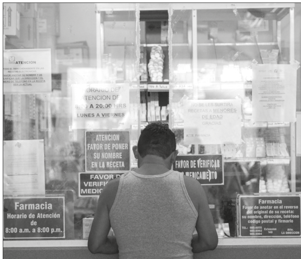
▲ Aun cuando las autoridades del IMSS aseguran que se ha mejorado el abasto de medicamentos en la institución, la realidad es otra a través de los datos.

“De acuerdo con la solicitud de información 0064101935621, emitida por la Plataforma Nacional de Transparencia, en Campeche, de enero a junio,