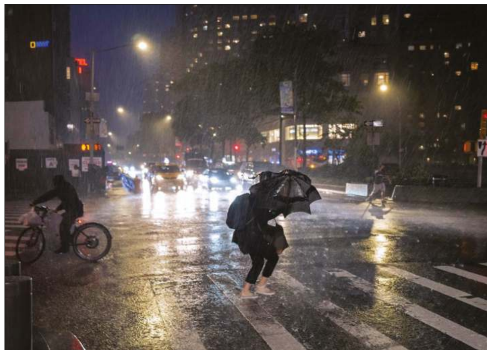
▲ La investigación de la Universidad de Harvard demuestra que todavía hay muchas sorpresas en el sistema climático.

“Pero descubrimos que en climas extremadamente cálidos, podría haber varios días sin lluvia en ninguna parte sobre una gran parte del océano. Entonces, de repente, una tormenta masiva estallaría en casi todo