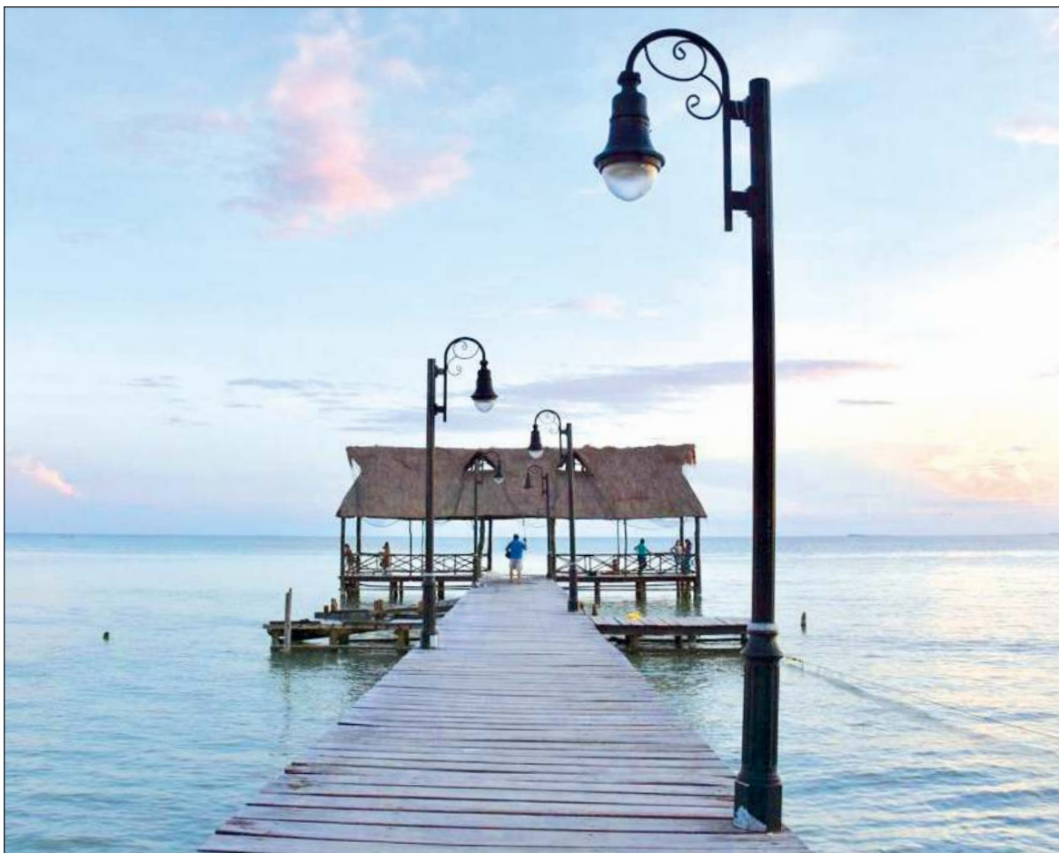
▲ Bejla'a juevese' yaan u káajal u díjitalisarta'al u jejeláas ba'al yóok'lal u kaajil Palizada yéetel Isla Aguada, tu péetlu'umil Kaanpech, ikil tán u beeta'al Cruzada Nacional para la Digitalización Turística en