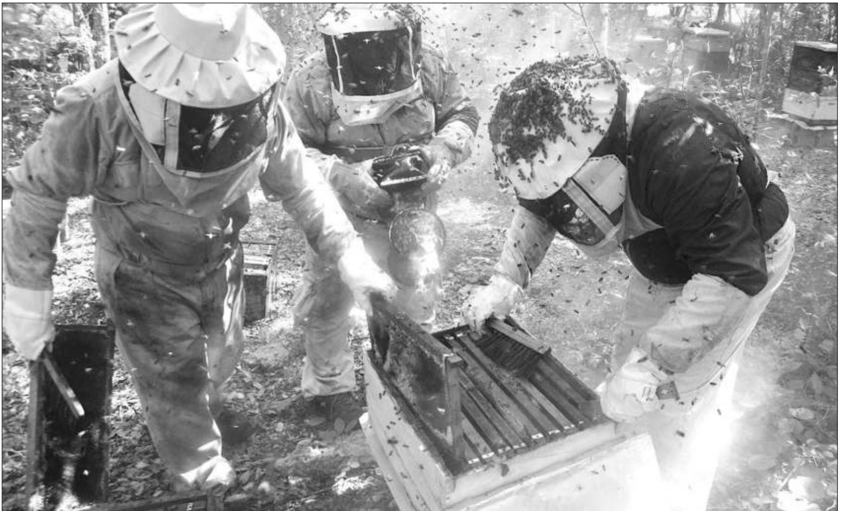
▲ La semana pasada, la empresa Supermiel sufrió el hurto de 27 colmenas, que representan una inversión de aproximadamente 80 mil pesos.