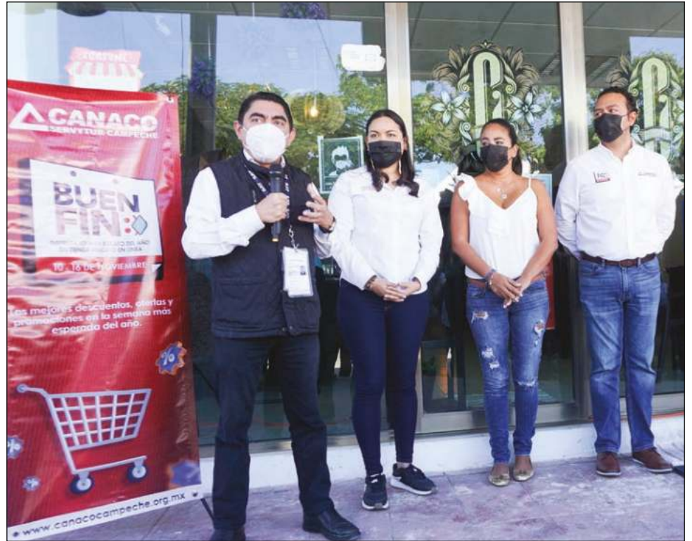
▲ Este año, los consumidores tendrán la oportunidad de escoger productos, ofertas, variedad de mercancía e incluso servicio al cliente, entre establecimientos registrados en la Canaco y otros ajenos a la Cámara que también "le entran a los descuentos".