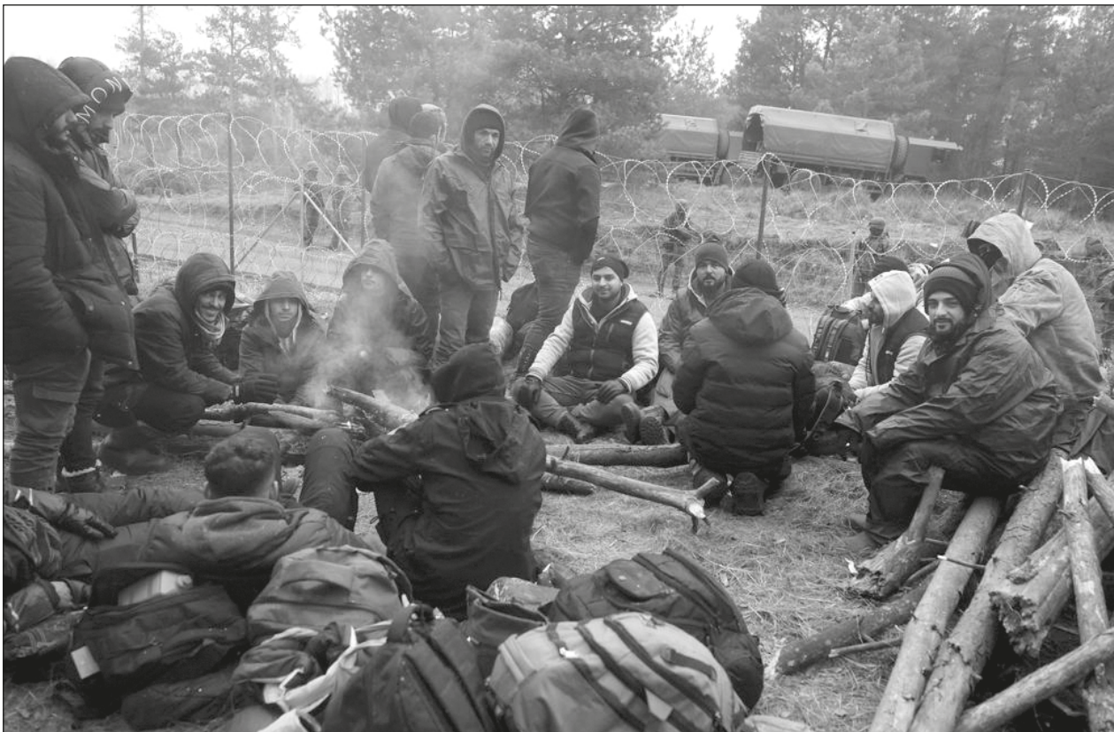
▲ Desde hace varios días, más de dos mil migrantes acampan bajo un clima helado en la frontera que comparten Bielorrusia y la Unión Europea.

Más de dos mil migrantes acampan bajo un clima helado desde hace varios días en una zona boscosa donde Polonia instaló una valla de alambre de púas y desplegó no menos de 15 mil soldados para bloquearles el paso.