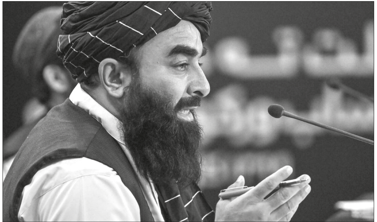
▲ En conferencia de prensa desde Kabul, Zabihulá Mujahid señaló que el EI no tiene una presencia fuerte en Afganistán porque no cuenta con el apoyo del pueblo.

Consideró que, a diferencia de Medio Oriente, el EI en Afganistán esta inte-