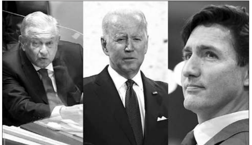
▲ El mandatario mexicano abordará temas como Covid-19, seguridad sanitaria en Norteamérica, migración y crecimiento equitativo.

En rueda de prensa en el Salón Tesorería, se le preguntó a López Obrador si estaría dispuesto a tocar el