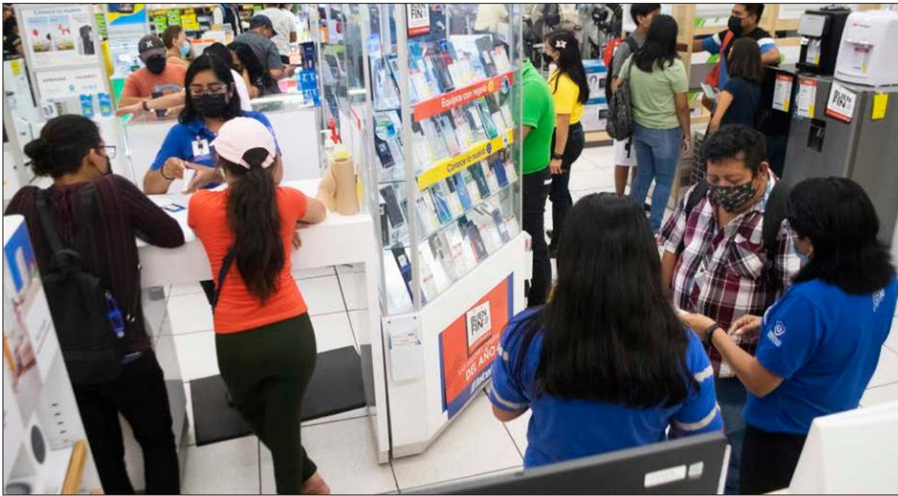
▲ En noviembre, el gasto promedio de los usuarios de tarjetas de crédito aumenta tradicionalmente. La recomendación es adquirir artículos cuya vida útil sea mayor al plazo para pagar la deuda adquirida.