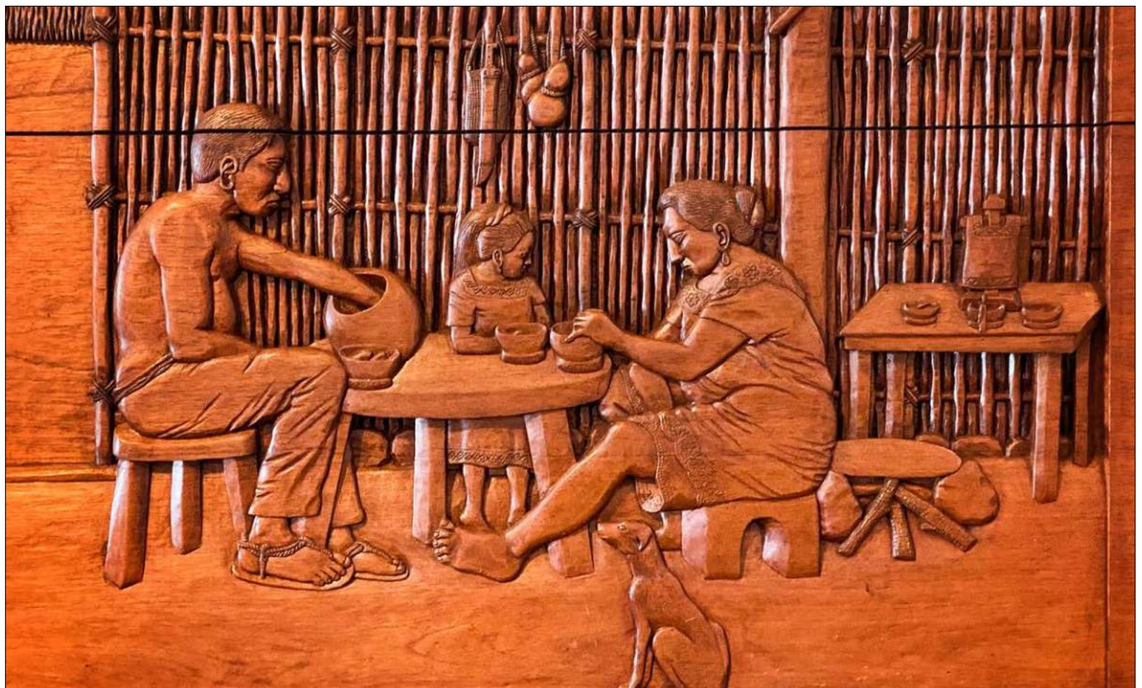
▲ La interconexión con todo lo que les rodeaba es la piedra angular de una filosofía de respeto hacia ellos mismos.