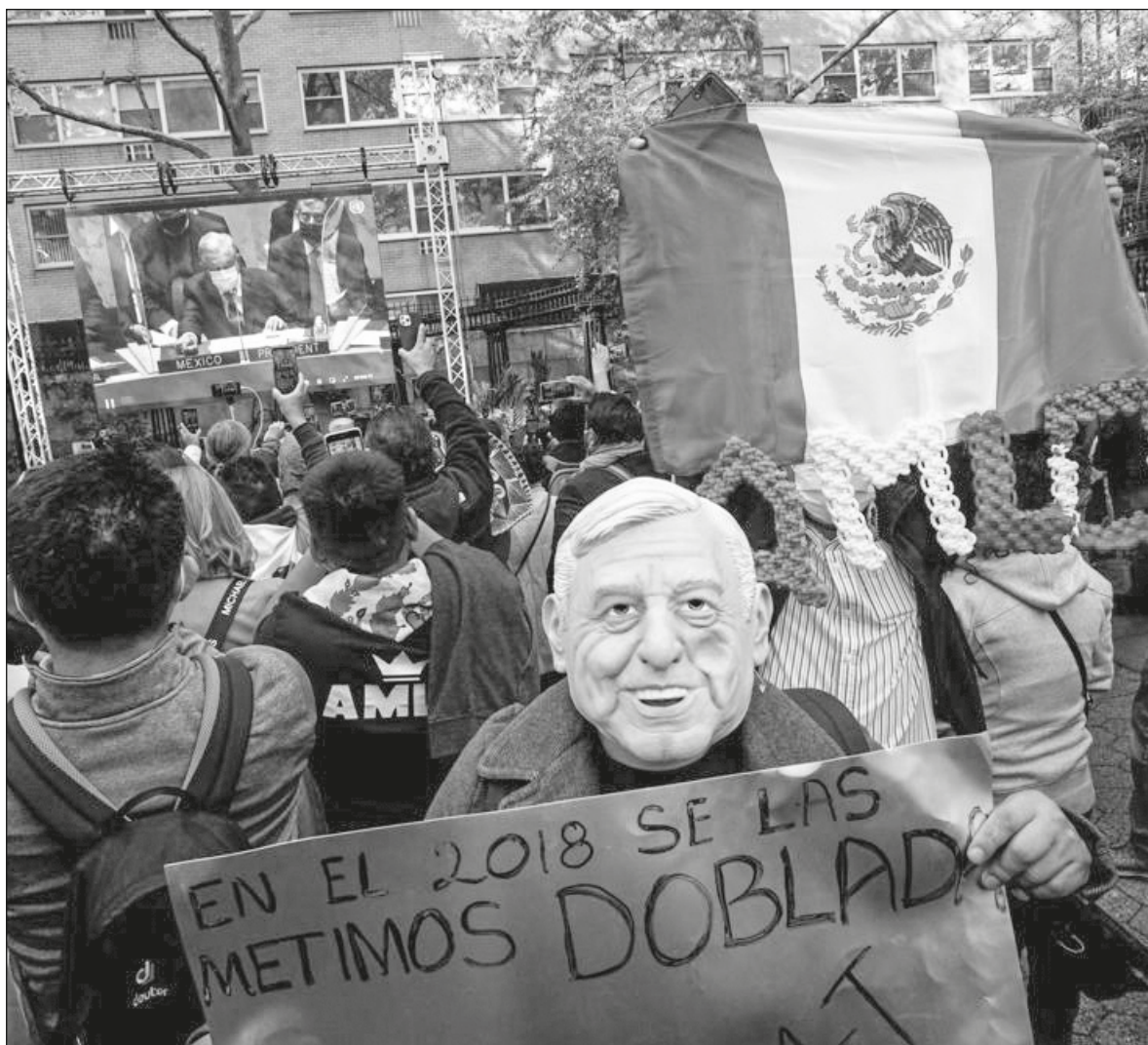
▲ Es incierto el destino del plan mundial contra la pobreza, presentado en una instancia de la ONU que no atiende exactamente este tipo de propuestas, pues se especializa en controversias, fricciones.