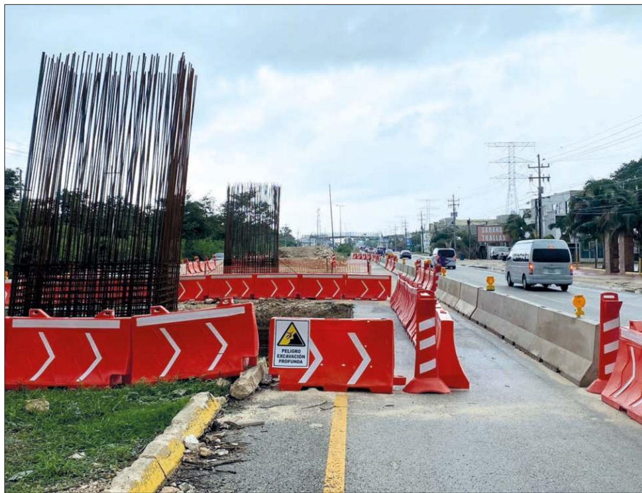
▲ Los hoteleros de la Riviera Maya argumentan que el precio que ofrece la Sedatu por partes de sus predios está por debajo incluso del valor catastral de estos.

Cuestionada al respecto, Lilia González, enlace terri-