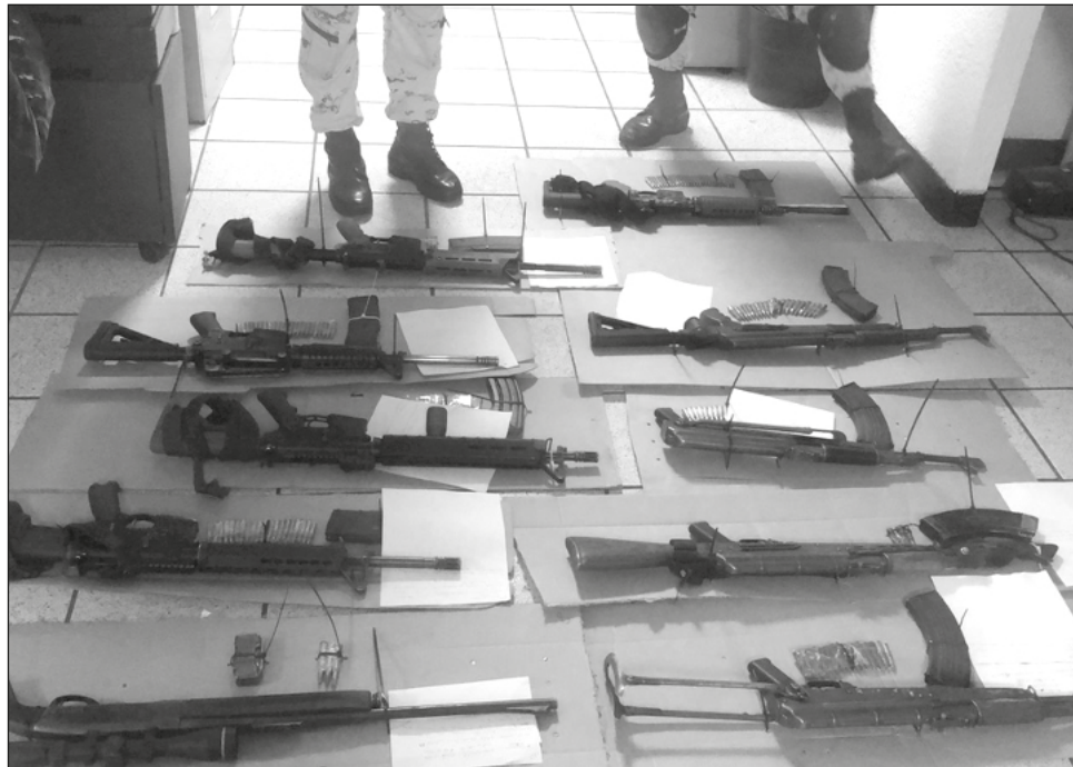
▲ De acuerdo a las autoridades estadounidenses, se trata del “primer enjuiciamiento exitoso” en el país por la exportación y fabricación de armas para cárteles mexicanos.

Se espera que en próximos días, el juez federal de