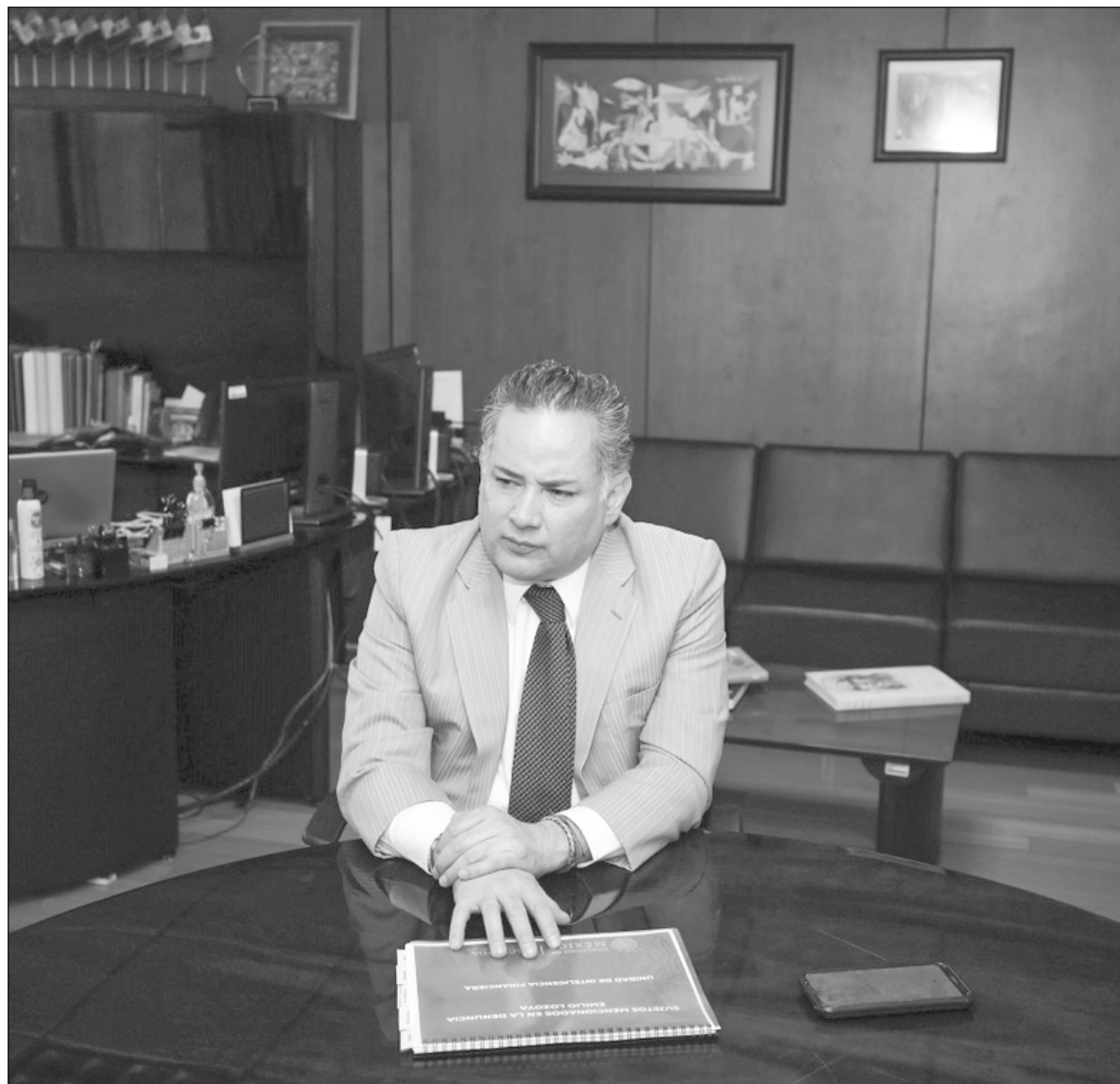
▲ Santiago Nieto Castillo renunció al cargo tras escándalos generados por su boda en la ciudad de Antigua, Guatemala, con la consejera del Instituto Nacional Electoral, Carla Humphrey Jordan.

POCO ANTES, A las 11:46 pm del 8 de noviembre, su esposa Carla Humphrey Jordan había publicado: "Mi amor absoluto e incon-