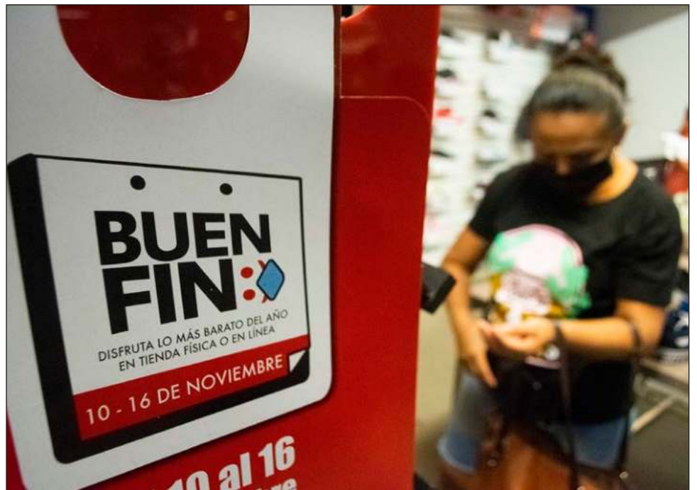
▲ Con motivo de El Buen Fin , se espera bastante movimiento en plazas comerciales y el centro de Mérida.

En este Buen Fin , subrayó, el sector turismo tendrá una mayor presencia con las mejores ofertas, para ampliar la posibilidad a los compradores de planear sus vacaciones a playas, pueblos mágicos y ciudades coloniales, entre otros, para los meses que restan del año y para el 2022.