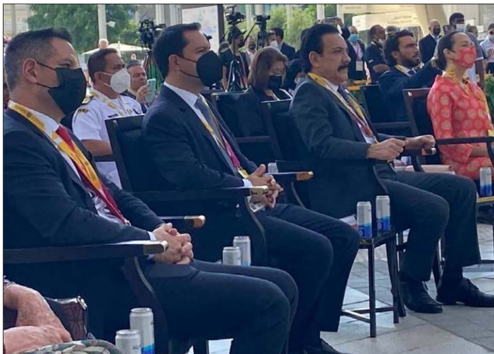
▲ El gobernador Mauricio Vila Dosal formó parte de la comitiva de México que sostuvo una reunión bilateral con los Emiratos Árabes.

Al respecto, el gobernador señaló que la Expo Dubái es una gran oportunidad para mostrar los atractivos de Yucatán, como sus bellezas naturales y culturales, pueblos mágicos, reservas naturales y centros arqueológicos, “por lo que hoy, aquí, es estar en el centro más importante del mundo para incrementar las relaciones de nuestro estado con el mundo”.