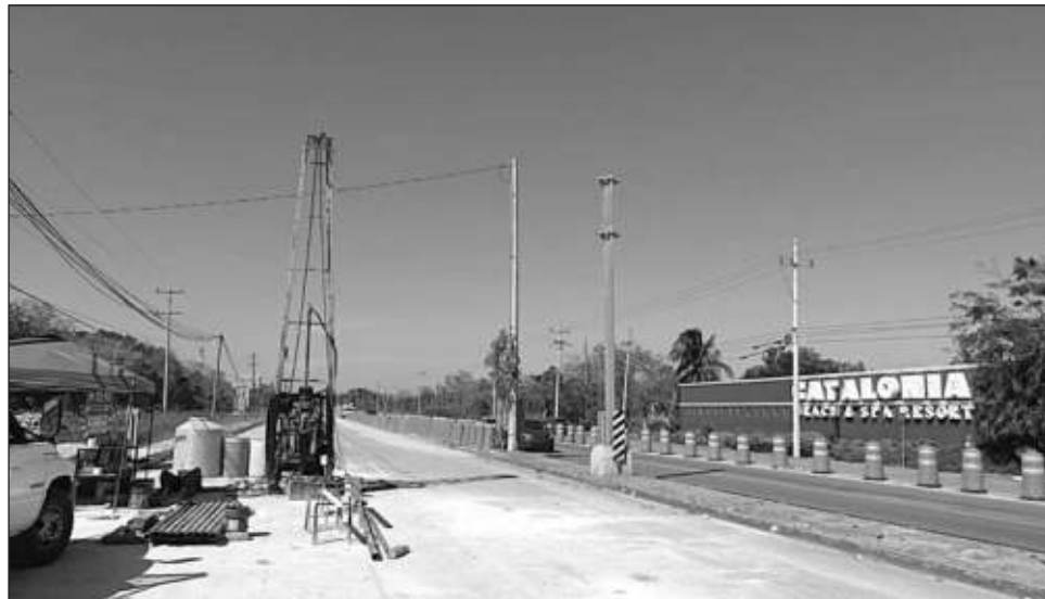
▲ Del 29 de noviembre al 1 de diciembre próximos tendrá lugar el World Meetings Forum Caribe Mexicano.

Abundó en que la Secretaría federal de Turismo (Sectur), que dirige Miguel Torruco Marqués, ha estimado que el turista internacional, principalmente europeo, que busca el turismo cultural o arqueológico, podría extender su estancia; sin embargo, “tanto en la percepción de los organizadores de eventos extranje-