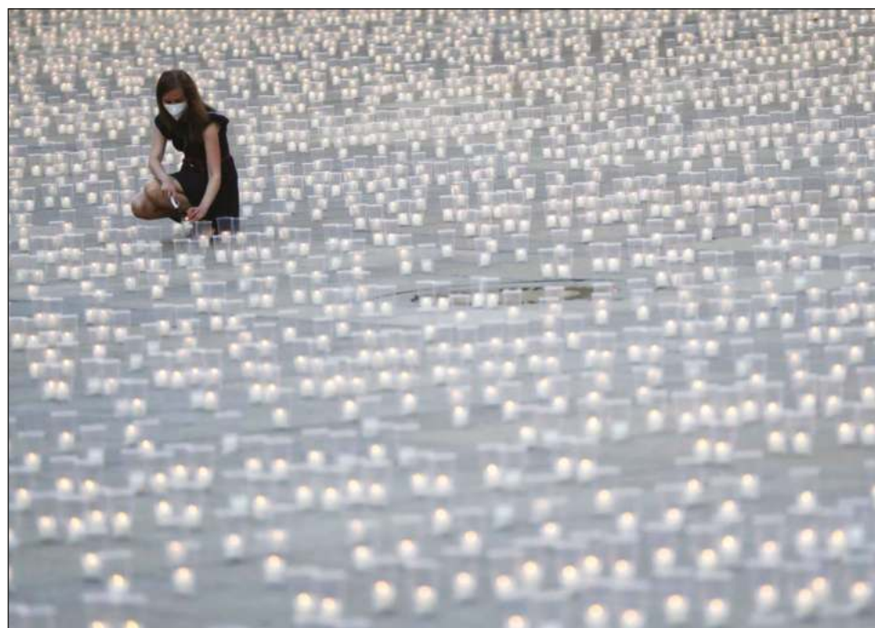
▲ Durante la última semana hubieron al rededor de 3.1 millones de nuevas infecciones en todo el mundo.

Los países con más nuevos casos de Covid-19 en el mundo son Estados Unidos, Rusia, Gran Bretaña, Turquía y Alemania. La cifra de fallecimientos semanales