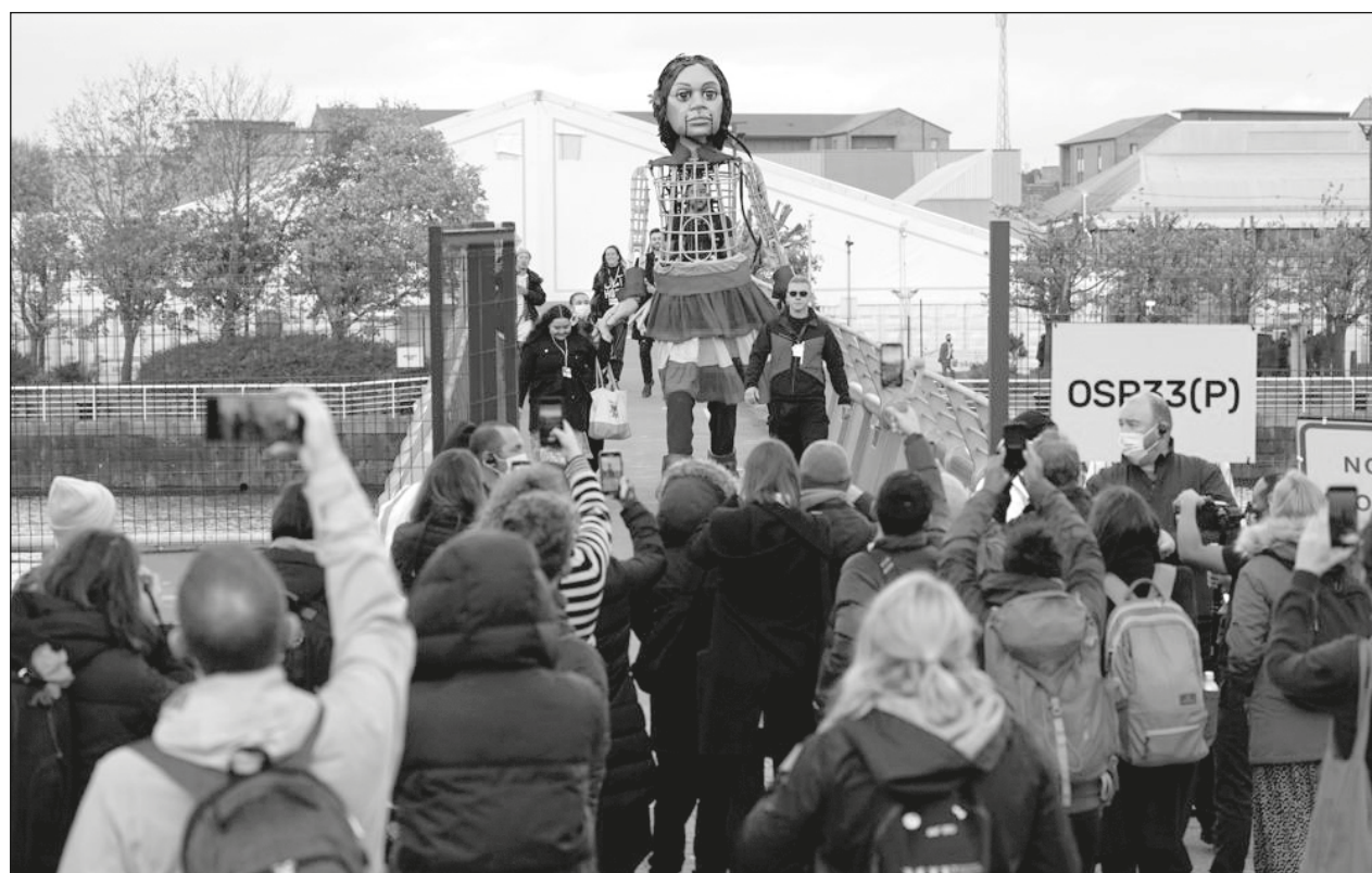
▲ Los días previos a la conclusión de la cumbre serán los que vean el mayor número de pactos globales.

"Exhortamos", "llamamos", "animamos" e "invitamos" no es el lenguaje decisivo que necesitamos en estos momentos", expresó Aubrey Webson, embajador ante la ONU de Antigua y Barbuda.