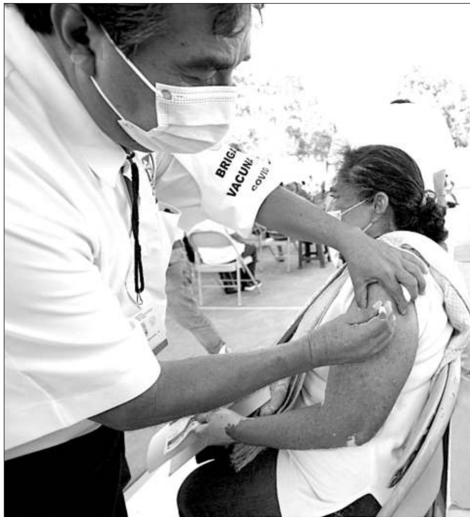
▲ En adultos mayores de 60 años, el número de dosis administradas es de 213 mil 950.

Agregó que en las personas de 30 a 39 años el acumulado de dosis aplicadas es de 474 mil 55, en los de 18 a 29 años es de 651 mil 533, en embarazadas, 10 mil 237, en adolescentes de 12 a 17 años con comorbilidades, 564, en personal del sistema educativo, 30 mil 256, y en personal de brigadas, voluntarios y otros grupos es de un total de 3 mil 849.