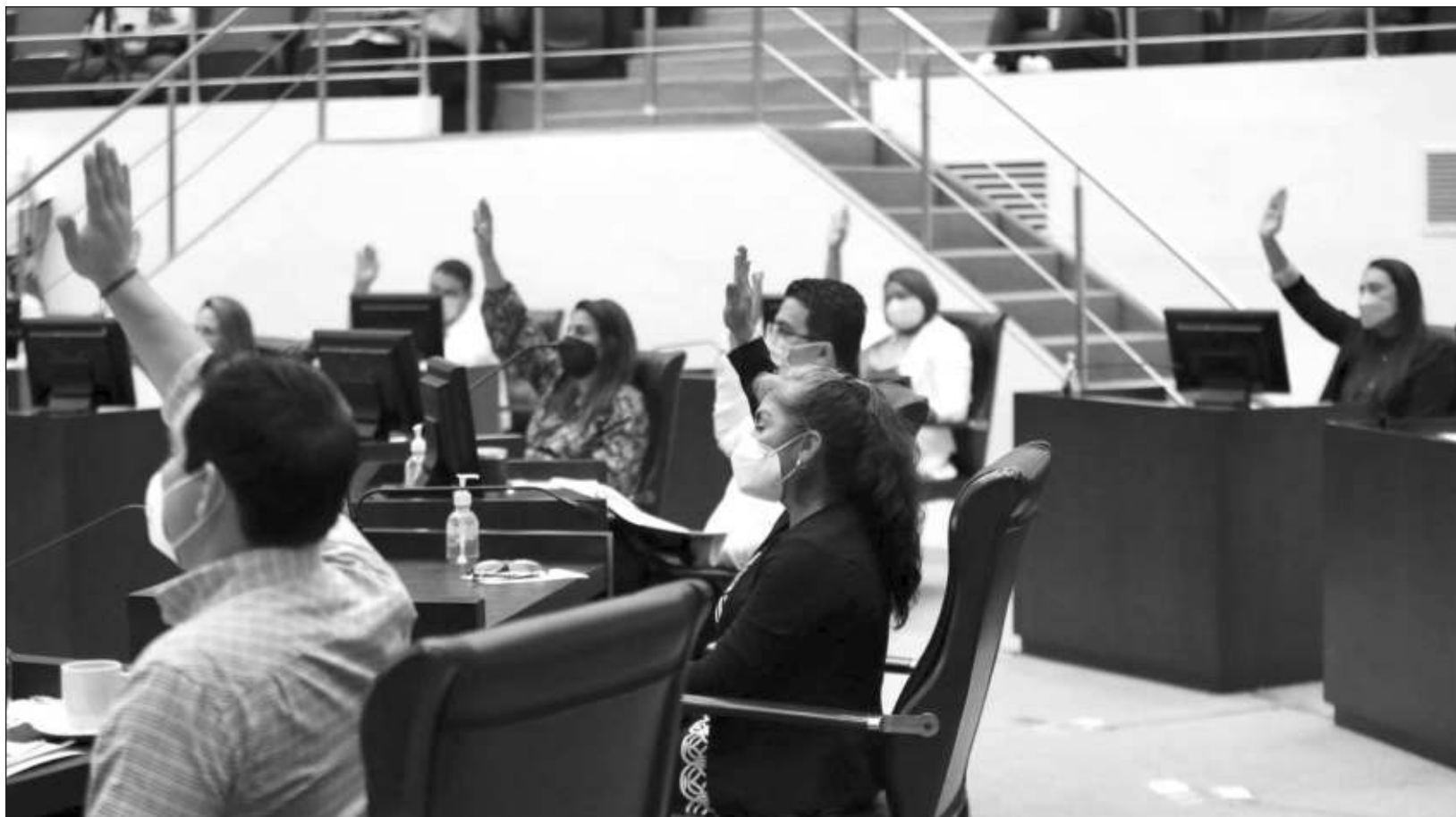
▲ El Pleno del Congreso de Yucatán aprobó de manera unánime el traspaso de dominio de cinco predios, que recibirá ahora el IMSS.