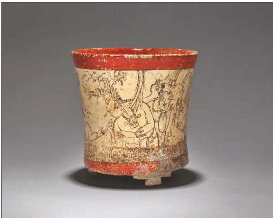
▲ El evento denominado Pre-Columbian Art & Taino Masterworks from the Fiore Arts Collection cerró con la venta de 97 obras de 139 ofertadas.

Puntualiza que para corroborar o rectificar los enunciados del dictamen, deberá considerarse la inspección física de las piezas.