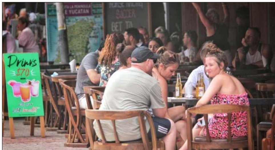
▲ El cierre de este 2021 se visualiza mucho mejor que el año pasado por el regreso del turismo.

"Hubo bastante reactivación económica e inversiones, tanto en zonas turísticas como en zona centro, no nada más en el norte sino en