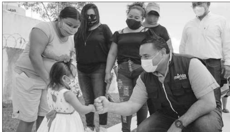
▲ La intención de la ruta Circuito Aventura es que las familias inviertan menos en su traslado y puedan convivir más tiempo, incluso visitando las tres atracciones en un día.

“Con la puesta en marcha del programa Circuito Aventura las familias podrán planear con anticipación sus actividades lúdicas en el Cente-