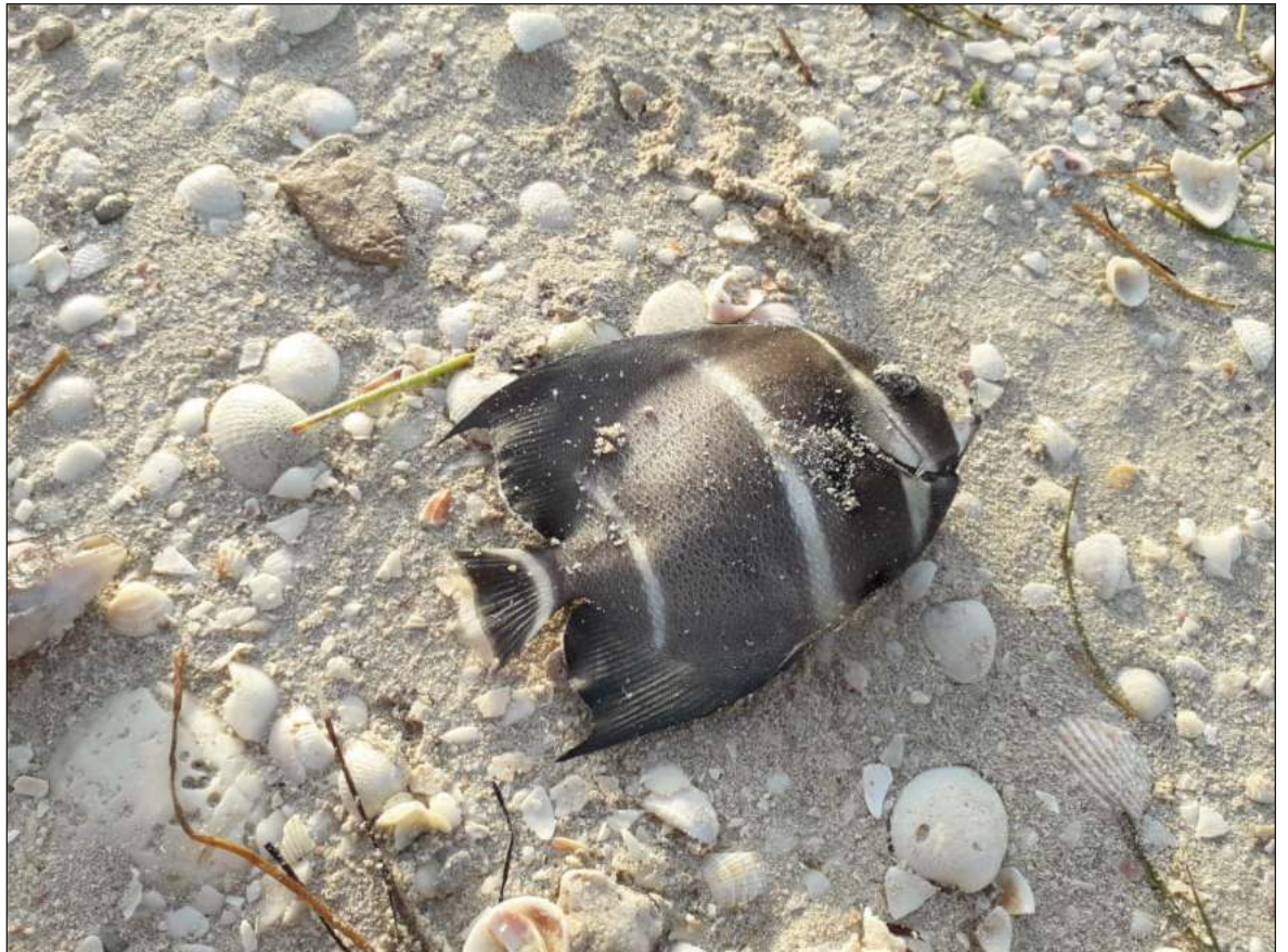
▲ "La biomasa estimada de la fauna muerta por kilómetro cuadrado es de 30 toneladas, de peces y mariscos que ya no formarán parte de la potencial captura comercial de Yucatán, con el impacto que ello implica".

En este año, la marea roja tiene un efecto impresionante en la biodiversidad marina de la flora y fauna y en su biomasa. Unas especies las vemos porque recalán a la playa y son grandes. Pero otras, las microscópicas, las larvas y crías que no las vemos. Esas también están muriendo. Lo mismo los pastos marinos, que requieren de luz solar y la marea roja causa efecto de sombra. Además de la disminución del oxígeno disuelto, se tiene una proliferación de bacterias, virus y sustancias del metabolismo de las micro algas de la marea roja