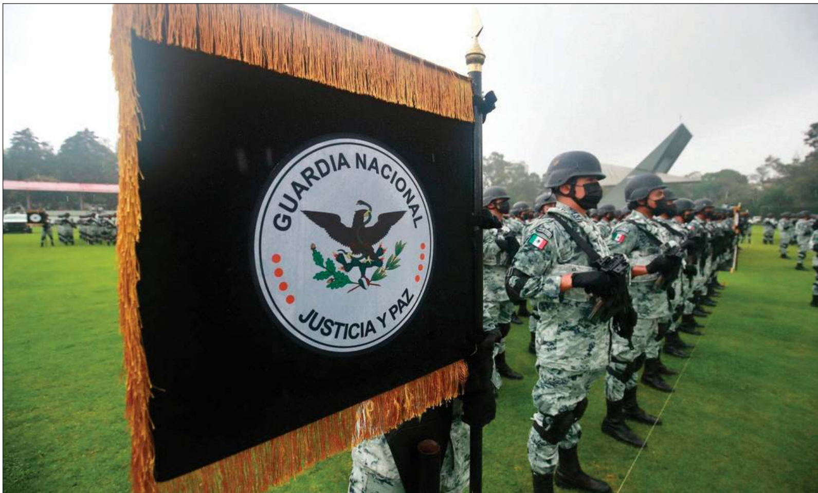
▲ "El riesgo que la Guardia Nacional se 'eche a perder' es elevado y AMLO pretende evitarlo transfiriendo la corporación a la Sedena".