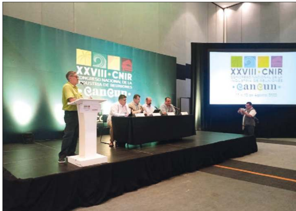
▲ Actualmente la recuperación de este sector se estima en 70 por ciento, aseguró el Consejo Mexicano de la Industria de Reuniones (Comir).

“La industria de reuniones alcanza una participación del 1.3 por ciento del PIB nacional, 80 por ciento en organización de eventos y 65 por ciento en generación de ingresos, es la equivalencia que tenemos en porcentajes, la verdad es que todavía nos falta una recuperación importante de esos 25 mil mi-