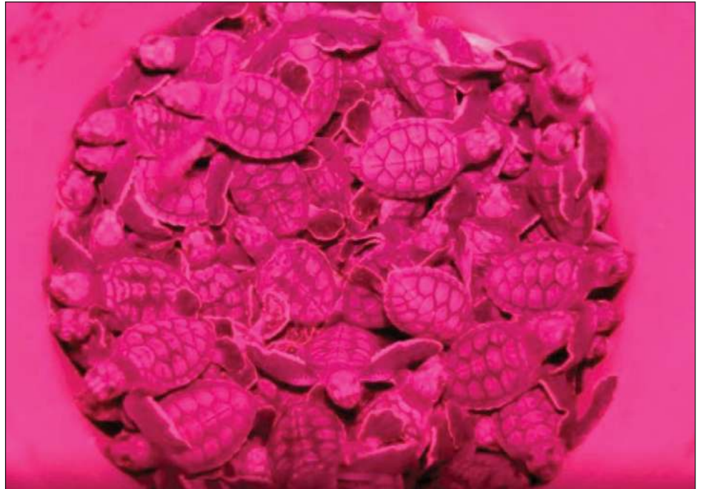
▲ Kex talam u yila'ale', te'e ja'aba' ts'o'ok u yantal u jejeláasil le ba'alche'a', ba'ale' yáax táanile' yanchaj u péektsilta'al ba'axten k'a'an u kaláanta'al.

Beyxan tu ya'alaje', tuláakal le je'ela', ts'o'ok u béeykunsal tumen ma' tu xu'ulul múul meyaj ichil máax ti' p'ata'an ka beeta'ak le nu'ukbesaj'o'