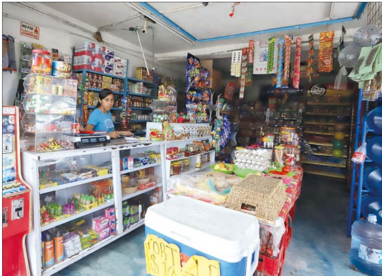
▲ Los productos que las familias dejaron de comprar en mayor medida son los enlatados, el huevo, botanas, dulcería y lácteos; 71.67% de los encuestados indicó que no le alcanza para una canasta básica completa.

Expuso que son un tipo de giro comercial que elabora alimentos en base a productos de la canasta básica, tales como huevos, aceite, harina, frutas y verduras, que también han elevado su valor en el mercado nacional.