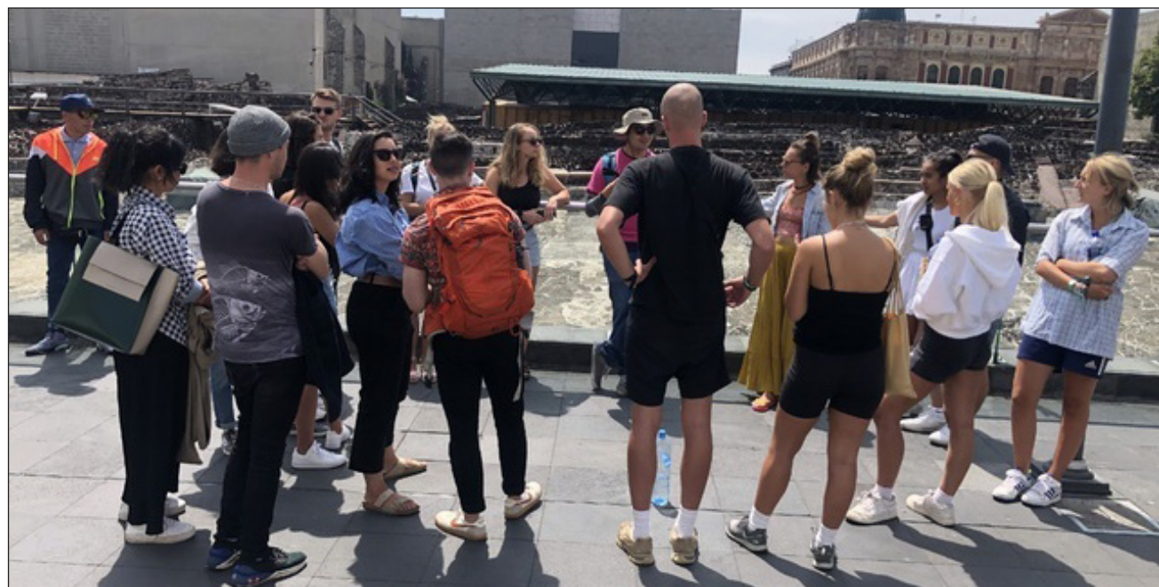
▲ Durante junio, el ingreso de divisas a México fue de 2 mil 261.8 millones de dólares. De esta cifra total, 2 mil 158.2 millones de dólares correspondieron a turistas de internación y 103.6 a turistas fronterizos.

México recibió 17.9 millones de turistas internacionales durante la primera mitad del año