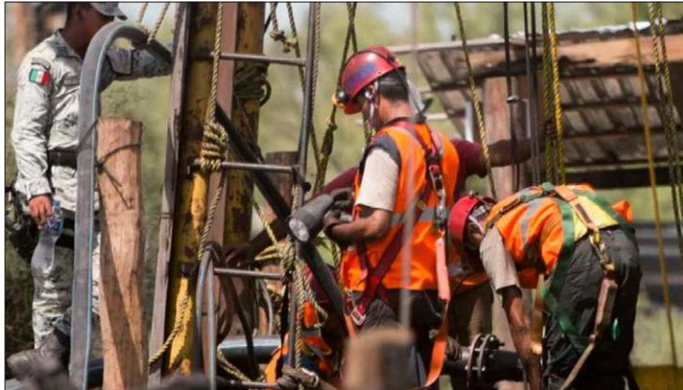
▲ Desde el medio día de este miércoles iniciaron los trabajos para el retiro de pilotes en el pozo 4 de la mina El Pinabete, donde permanecen 10 mineros atrapados desde hace una semana.

Según reportan medios de comunicación, en vivo desde el lugar de los hechos,