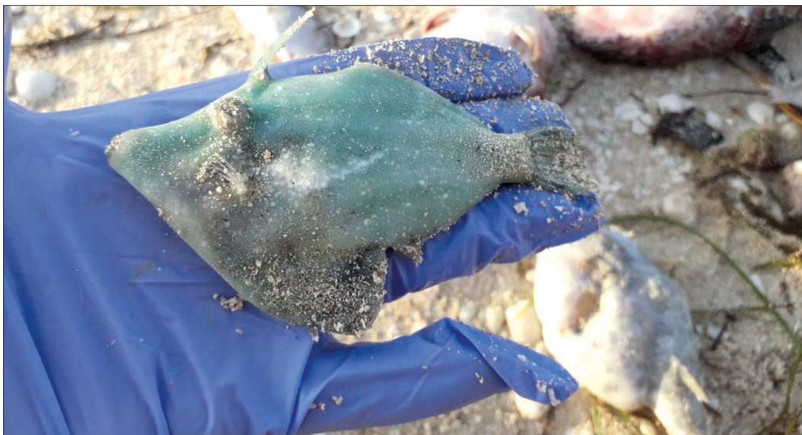
▲ “Las soluciones BIP (Baratas, Inmediatas y Populares) que la mayoría de gobernantes implementan no resuelven los problemas. Ante esta marea roja, no hay un protocolo estatal que cómo atenderla en la limpieza de playas y el destino bioseguro de esa fauna en descomposición”.