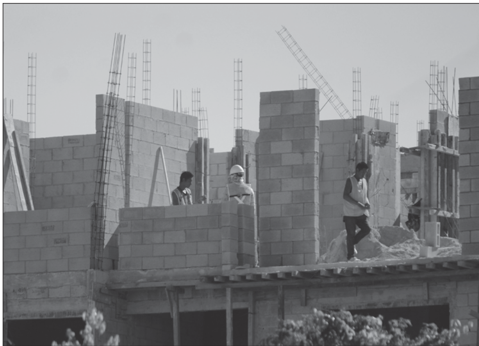
▲ Otra problemática a la que también se está enfrentando la industria, como en muchos otros sectores económicos de Quintana Roo, es la falta de mano de obra.

"Si teníamos 15 mil trabajadores de la construcción, ahorita necesitamos más, pero traer más gente depende también de traer más infraestructura, más escuelas, más casas, más transporte y luego se quejarán de eso, entonces mejor capacitamos a la gente que está en el estado y yo creo que hay mucha gente en comunidades mayas