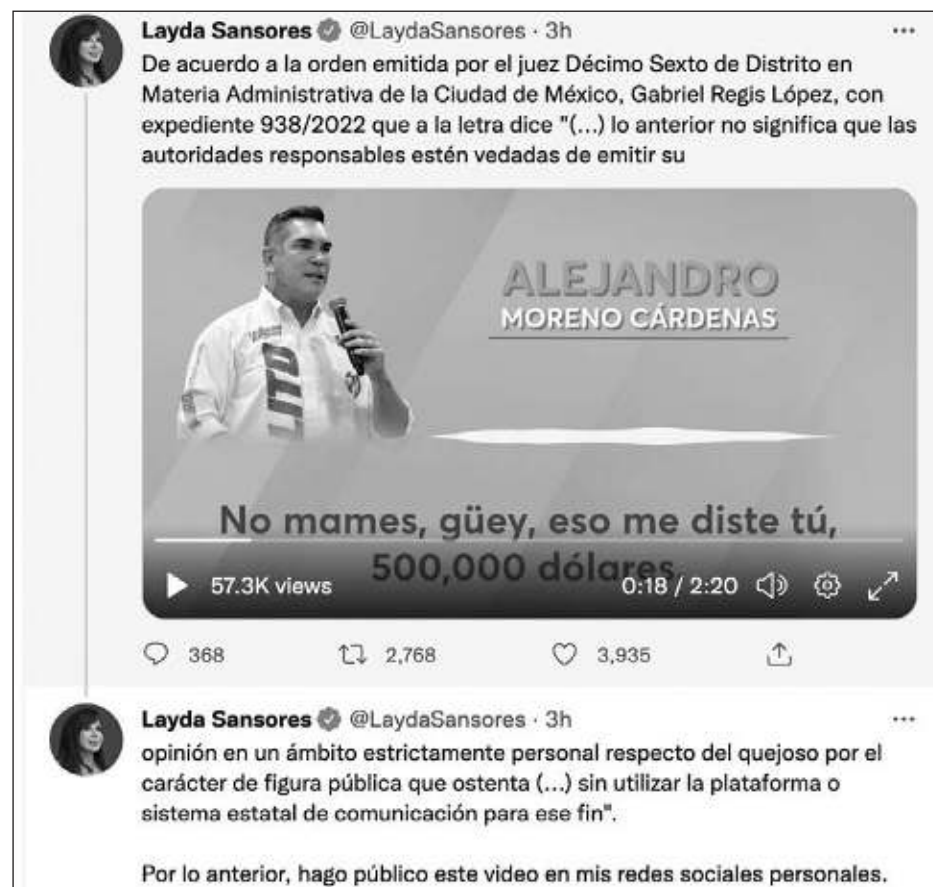
▲ En audio difundido en la cuenta personal de la gobernadora, Moreno Cárdenas habla de una reforma fiscal que haría que varios empresarios se sientan apretados.

Por ello, a un día de presentar su primer informe de gobierno, Sansores San Román apuntó en su cuenta que "por lo anterior, hago público este video en mis redes sociales personales", un audio en el que el presidente del PRI nacional habla de que con una reforma