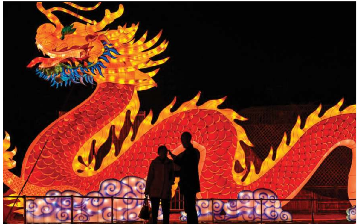
▲ "According to the American Security Project, Chinese infrastructure investment in Latin America likewise presents new risks for U.S. and Canadian national security, and U.S.'s response seems to be stuck".

THESE LOANS CAN be a double-edged sword. On the one hand, China makes no demands on receiving countries to implement