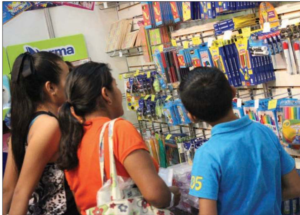
▲ La compra de útiles escolares básicos está en alrededor de 700 pesos.

espera de que el gobierno del estado o las autoridades competentes cumplan con el apoyo de uniformes e incluso con la entrega de útiles como se hizo antes de la pandemia, pero hasta ahora han anunciado nada.