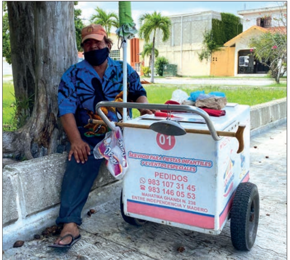
▲ Para don Víctor, quedarse en su casa no es una opción: tiene que recibir ingresos de algún modo, y pasar tiempo a solas le hará sentir peor.

Confiesa que quedarse en su casa no es una opción, primero porque debe tener ingresos y luego porque se va “a sentir peor de pasar tiempo solo, sin luz, sin ventilador y sin una radio”.