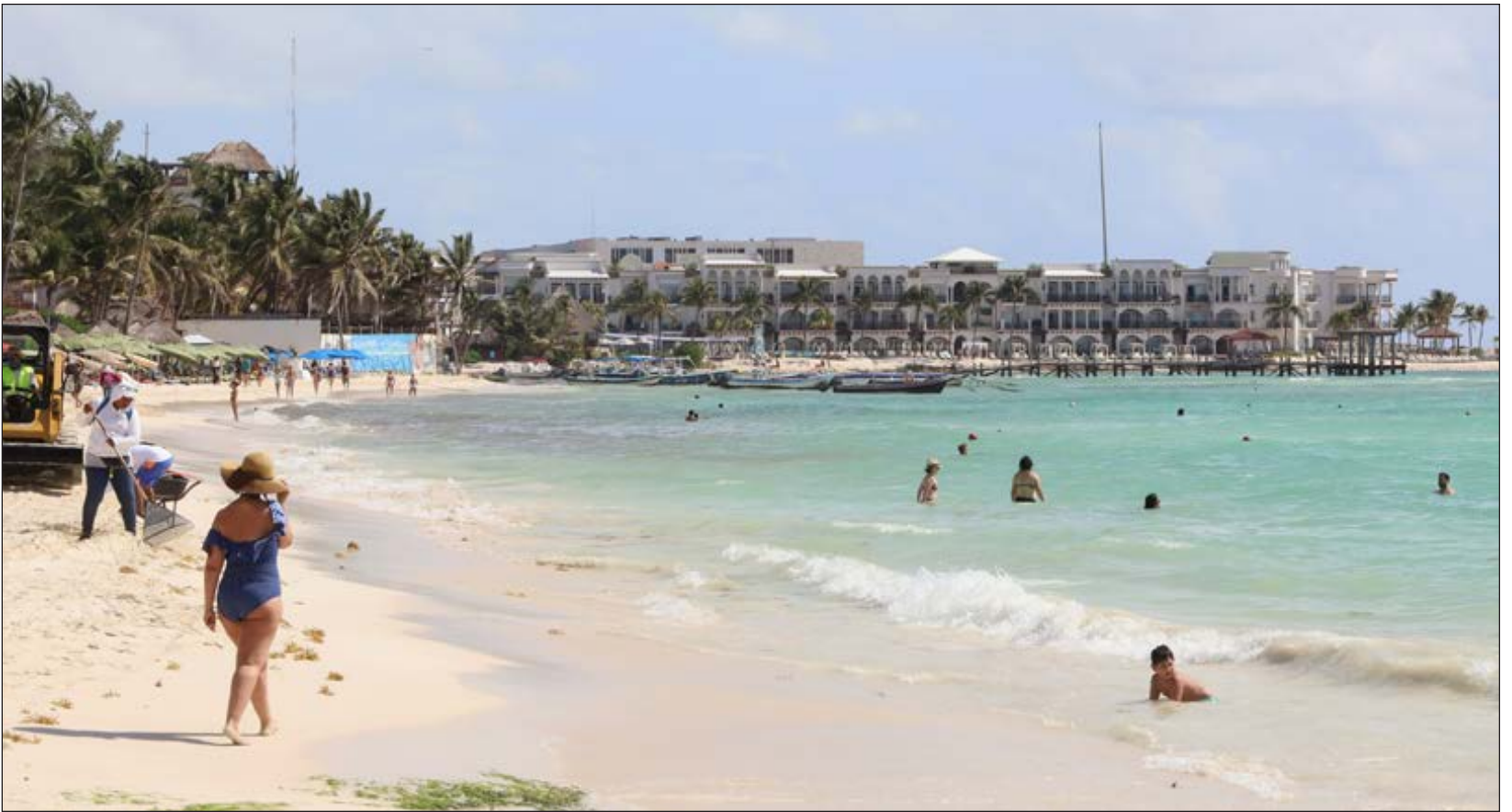
▲ Alrededor del 50% de los visitantes que ha recibido la Riviera Maya son nacionales.

HAN REABIERTO 62 DE LOS 135 CENTROS DE HOSPEDAJE QUE CONFORMAN LA AHRM