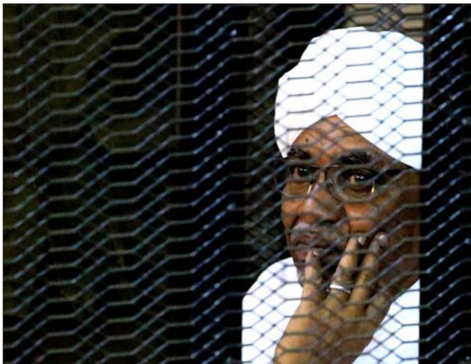
▲ Sobre Al Bashir, quien gobernó Sudán por casi 30 años, pesan dos órdenes de arresto del Tribunal Penal Internacional por crímenes contra la Humanidad.

Sobre Al Bashir, dirigente de Sudán por cerca de 30 años, pesan dos órdenes de arresto del Tribunal Penal Internacional por genocidio, crímenes contra la Humanidad y crímenes de guerra por los presuntos abusos cometidos bajo su mando en la región de Darfur.