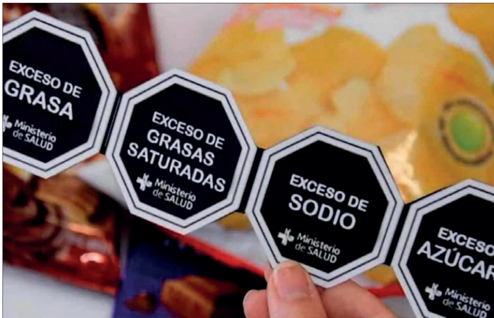
▲ Con el nuevo etiquetado en productos procesados las autoridades de salud esperan reducir padecimientos como la diabetes, la obesidad o problemas cardiovasculares.