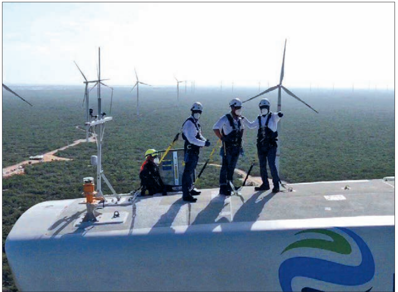
▲ El Parque Eólico de Progreso es una de las 24 iniciativas de este tipo que están planteadas para desarrollarse durante la presente administración.

Mientras la demanda eléctrica a nivel nacional crece al 3%, la del sistema peninsular lo hace al 10% anual