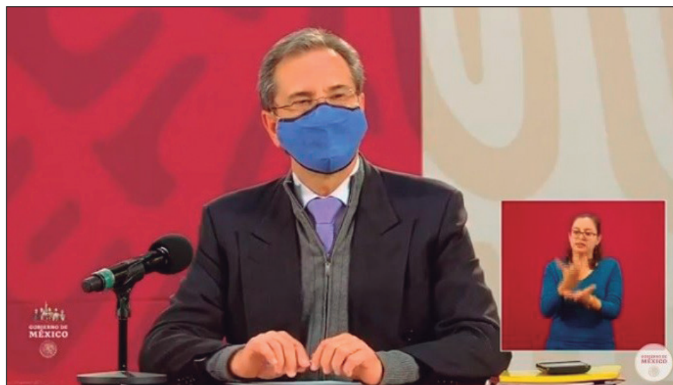
▲ El titular de la SEP, Esteban Moctezuma señaló que la currícula comprenderá las materias de Vida Saludable y Formación Cívica y Ética.

En la conferencia vespertina en Palacio Nacional, donde se dieron más detalles