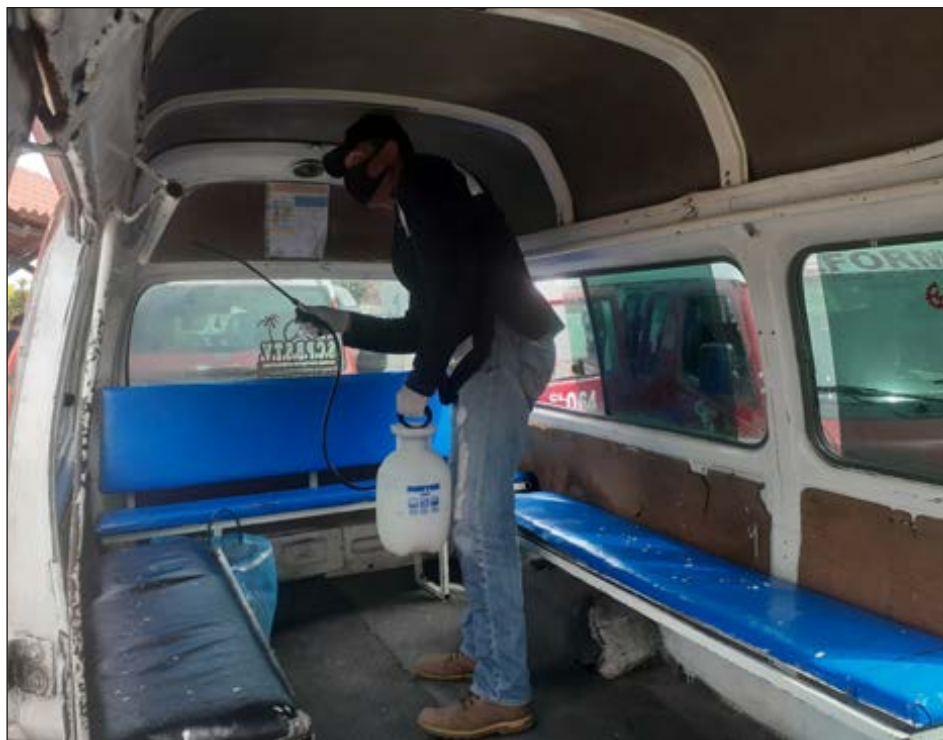
▲ Diariamente se desinfectan los vehículos del transporte público, tanto autobuses como combis.