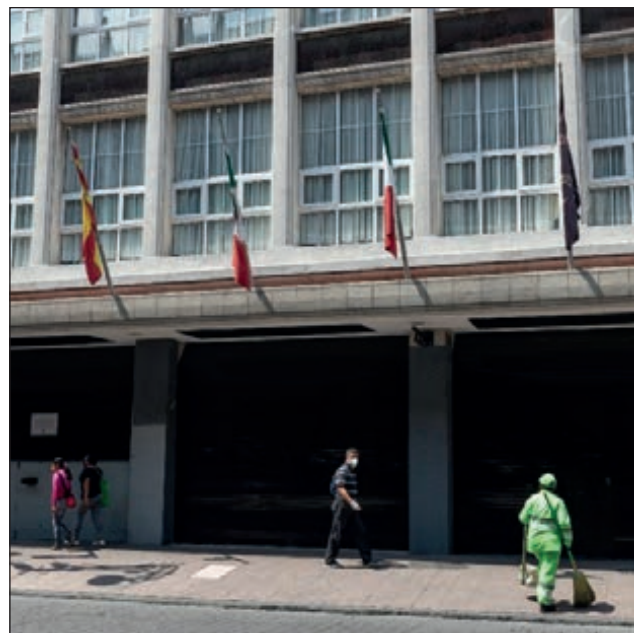
▲ En gran parte del mundo los hoteles permanecen cerrados debido a la pandemia de COVID-19.

Los ingresos totales por esta actividad llevan mayor avance. En abril se reportaron divisas por un monto de 71 millones 800 mil dólares, en mayo crecieron a 33.29 por ciento y en junio a 83.07 por ciento.