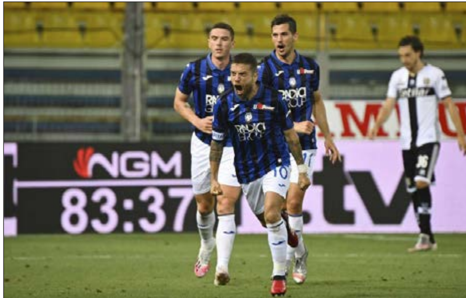
▲ Atalanta no sólo juega para conquistar la Liga de Campeones, sino para devolverle la alegría a una de las regiones más golpeadas por el coronavirus.