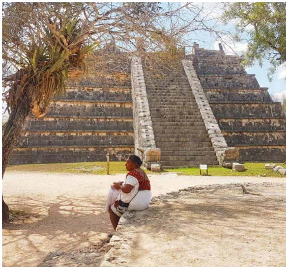
▲ El ORGA atenderá los ámbitos de seguridad alimentaria y pueblo maya, además de economía, empleo, violencia de género y restricciones a la movilidad.