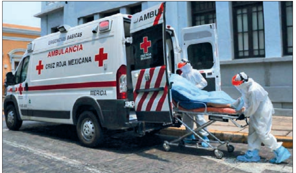
▲ Cualquier llamada de auxilio, sea o no por coronavirus, activa el protocolo de protección de los socorristas.

Al inicio, reconoció el socorrista, había un ambiente de incertidumbre y temor entre el personal sobre cómo manejar la pandemia, pero con la capacitación y al paso de los días todo cambió, además de saber que su labor es fundamental para el bienestar y salud de las personas.