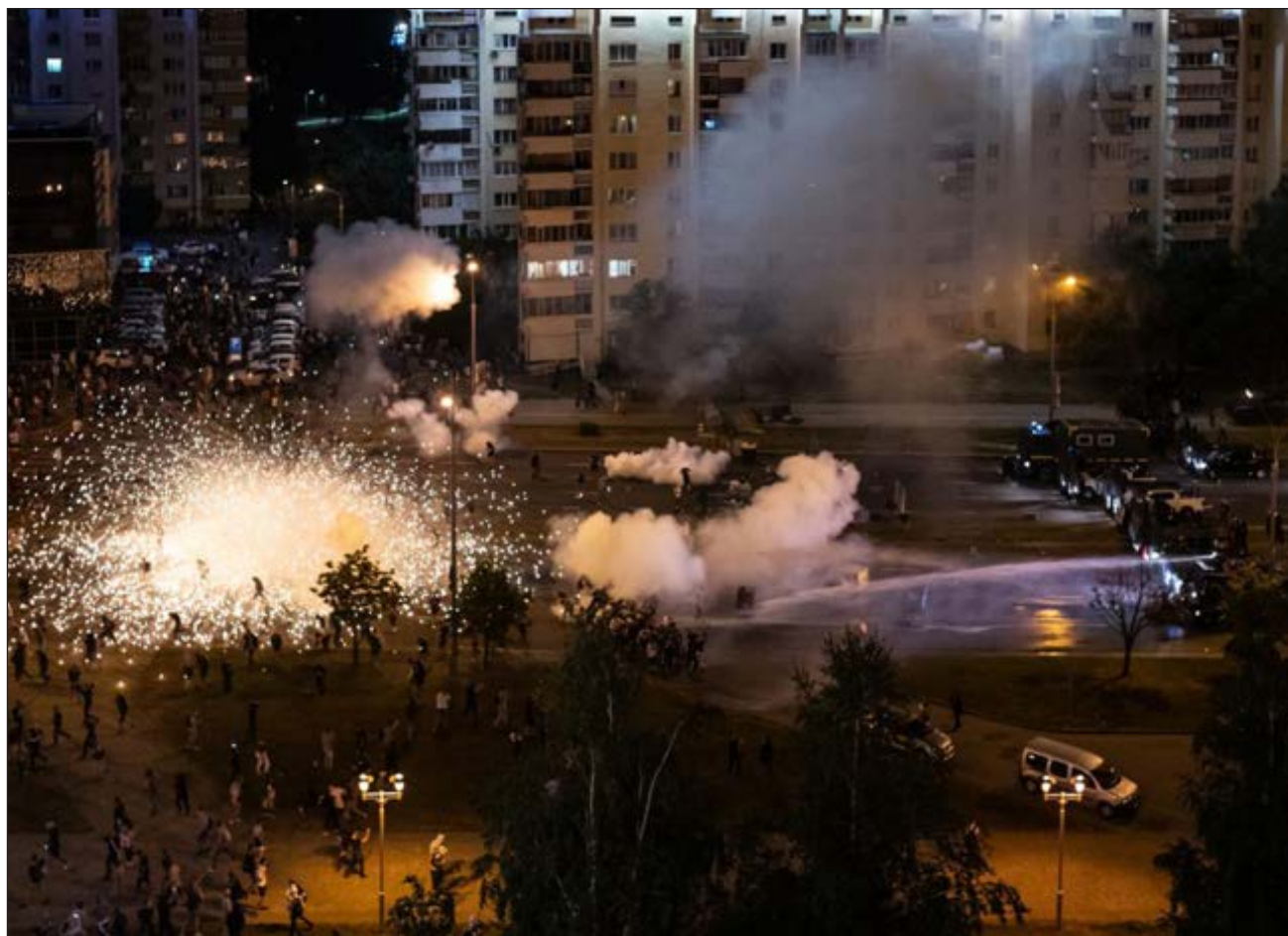
▲ La ONG bielorrusa Viasna afirma que las protestas de los últimos dos días han dejado al menos una persona muerta y más de 200 detenidos por las fuerzas de seguridad estatales.

Después del anuncio oficial, Tijanovskaya señaló que "los datos que nosotros tenemos no coinciden con los anunciados", y afirmó que ella se considera la ganadora de las elecciones presidenciales.