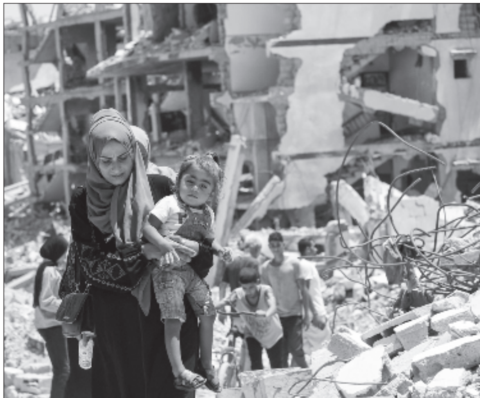
▲ El nuevo asalto israelí a Gaza ha provocado lo que la ONU ha denominado un éxodo "peligrosamente caótico" de personas que se dispersan en múltiples direcciones sin saber adónde ir.

En una visita el miércoles al centro de Gaza, el jefe militar israelí, teniente general Herzi Halevi, dijo que el ejército está operando de distintas maneras en distintas partes del territorio "para llevar a cabo una misión muy importante: ejercer presión. Segui-