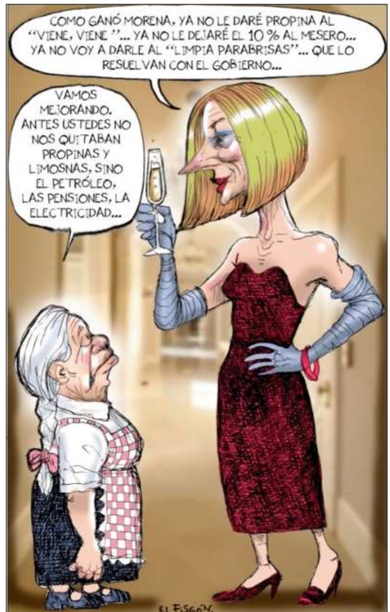
▲ "Se pasaron todo el sexenio escuchando y creyendo los mensajes de pánico en la mayoría de los medios de comunicación". Cartón Debate poselectoral de El Fisgón

EN ESTE CONTEXTO , muchos de estos partidos y movimientos pretenden redefinir el significado de la izquierda. En muchos casos abandonan la representación y defensa de los intereses de importantes grupos sociales populares, hacen a un lado las luchas de quienes fueron empobrecidos a partir de las medidas neoliberales. En síntesis, cambian sus objetivos y banderas, ya no hablan de mejoras salariales o de condiciones de trabajo, prestaciones, distribución del ingreso, salud, jubilaciones y un largo etcétera, que caracterizaba la lucha histórica de los movimientos de izquierda. Actúan en realidad más como liberales y prefieren ser referidos como "progresistas" o "progres". Su nuevo credo es la llamada política de las identida-