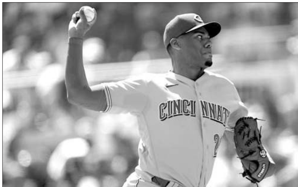
▲ El velocista Hunter Greene sometió ayer a los campeones Bravos.

Urquidy, a diferencia de Urías, se vio dominante. Ante una ofensiva encabezada por Shohei Ohtani y Mike Trout, lanzó pelota de cuatro imparables y una