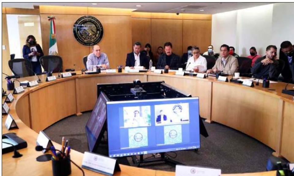
▲ Entre morenistas y petistas se menciona que aún no tienen los votos para avalar la reforma, pero siguen negociando para "construir una mayoría calificada".

En la sesión de la Jucopo, Mier resaltó que la coalición Va por México se comprometió a apoyar la iniciativa si eran atendidos esos 12 temas. De ellos, subrayó que se aceptaron nueve.