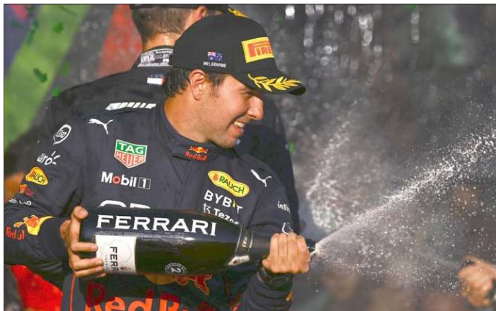
▲ Sergio Pérez consiguió el podio 16 en su carrera en Fórmula Uno.

Un fallo del motor provocó que Verstappen abandonara en la vuelta 38 en el circuito del Albert Park. El mexicano Pérez superó un lento inicio para quedar segundo, por delante de los Mercedes de George Russell, en el podio por pri-