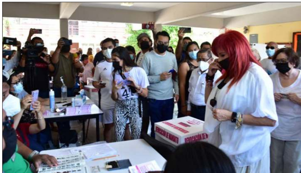
▲ A las 10 de la mañana la gobernadora de Campeche asistió a la escuela primaria Héctor Pérez Martínez, ubicada en el barrio de San Francisco.

El proceso inició a las 7:30 de la mañana con la apertura de la sesión permanente res-