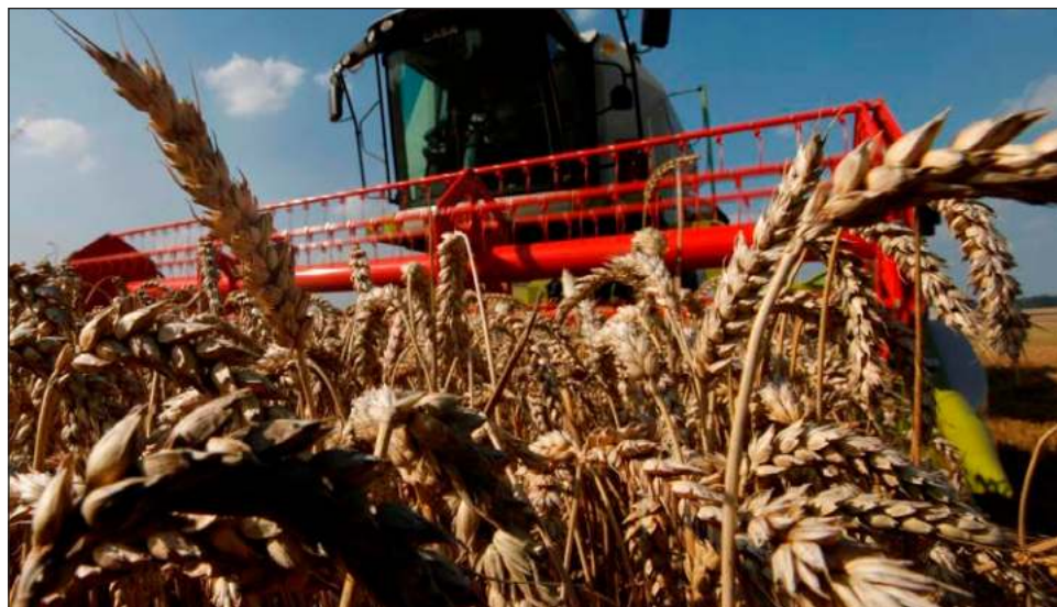
▲ El aumento en los precios del trigo y el maíz se debe a que Ucrania y Rusia son dos de los países productores agrícolas más importantes en Europa y el mundo.

El maíz es un producto clave para México, pues es la base para la elaboración de las tortillas, alimento que consume alrededor de 90 por ciento de los mexicanos, y también es utilizado para engorda del ganado. En tanto, el trigo es necesario para la elaboración de pastas, galletas, pan y cerveza, entre otros.