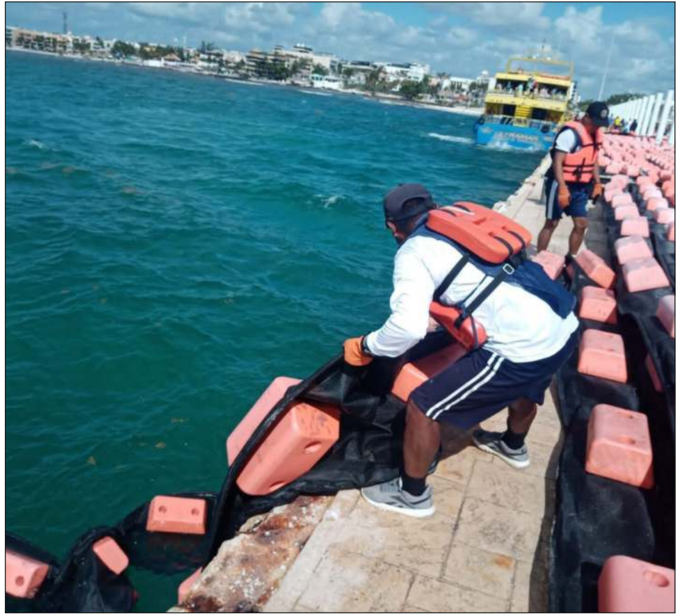
▲ Los fuertes vientos y hostiles oleajes han interrumpido la movilización de los barcos y la colocación de las estructuras para soporte de las barreras.

De acuerdo con la Secretaría de Marina (Semar), hasta la semana pasada se habían instalado un total de 97 anclajes, 500 metros de barreras en Mahahual y 120 anclajes en Playa del Carmen.