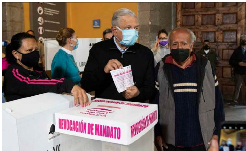
▲ "La selección de un domingo de ramos para celebrar el ejercicio no es producto del azar, al contrario, fue cuidadosamente seleccionada y por eso marca el inicio de una nueva liturgia política".

La historia, en un futuro, podría enseñarse como el Catecismo.