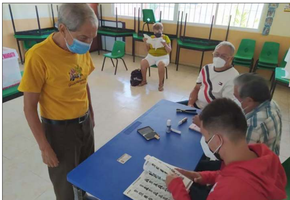
▲ Las personas no dejaban de llegar y el discurso fue el mismo: la mayoría estaba a favor de la consulta y de que López Obrador permaneciera y termine su mandato.

Además, indicó que este tipo de consultas también se deberían aplicar para gobernadores, presidentes municipales, diputados, diputadas y demás funcionarios de los tres ordenes de gobierno