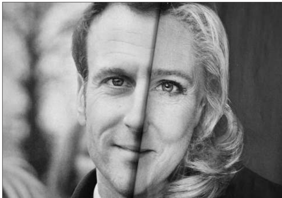
▲ La victoria del actual presidente Emmanuel Macron y Marine Le Pen demuestra el declive de los partidos políticos tradicionales en el mapa electoral de Francia.

La candidata de la Agrupación Nacional (RN), de 53 años, propone abandonar el comando integrado de la OTAN, que fija la estrategia militar de la Alianza, y su elección asestaría otro revés a la Unión Europea tras la reelección del húngaro Viktor Orban.