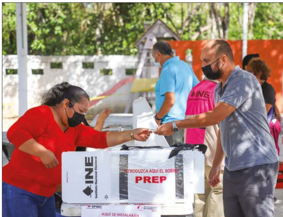
▲ Los resultados del conteo rápido surgieron a partir de la información recopilada en mil 753 casillas seleccionadas previamente como muestra nacional.

El consejero presidente ofreció la información en la