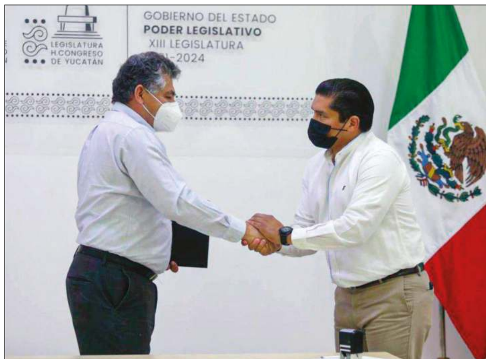
▲ La iniciativa presentada también propone aumentar a tres el número de magistrados del Tribunal de los Trabajadores al Servicio del Estado y los Municipios.

Por ejemplo, de acuerdo con un cálculo basado en el tabulador reciente de sueldos y salarios del Poder Judicial, un magistrado gana, en promedio, un sueldo base de 133,434.89 pesos mensuales, lo que anualmente