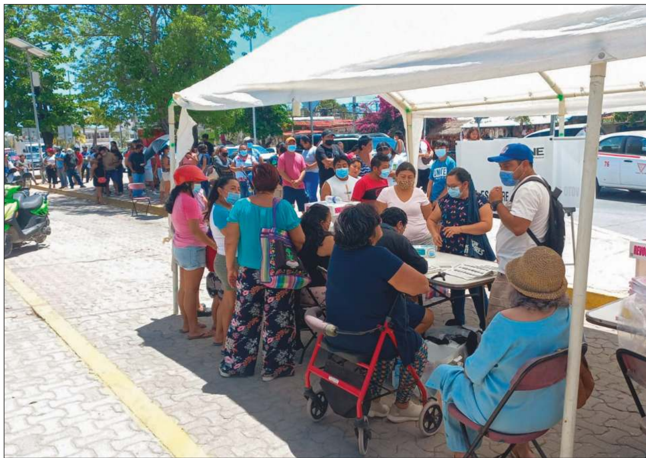
▲ Al final de la jornada fue necesaria la presencia de los agentes policiacos, pues los ciudadanos que se habían quedado sin votar exigían ejercer su derecho.

En todo el estado hubo retrasos en la instalación de casillas, fue hasta las 13 horas que el Instituto Nacional Electoral (INE) Quintana Roo reportó la instalación del 100 por de las 800 casillas programadas. Las que registraron mayor afluencia fueron las especiales instaladas en Cancún (en el kilómetro cero de la zona hotelera) y en Playa del Carmen (en la terminal de autobuses de ADO de la calle 12). En ambas al final de la