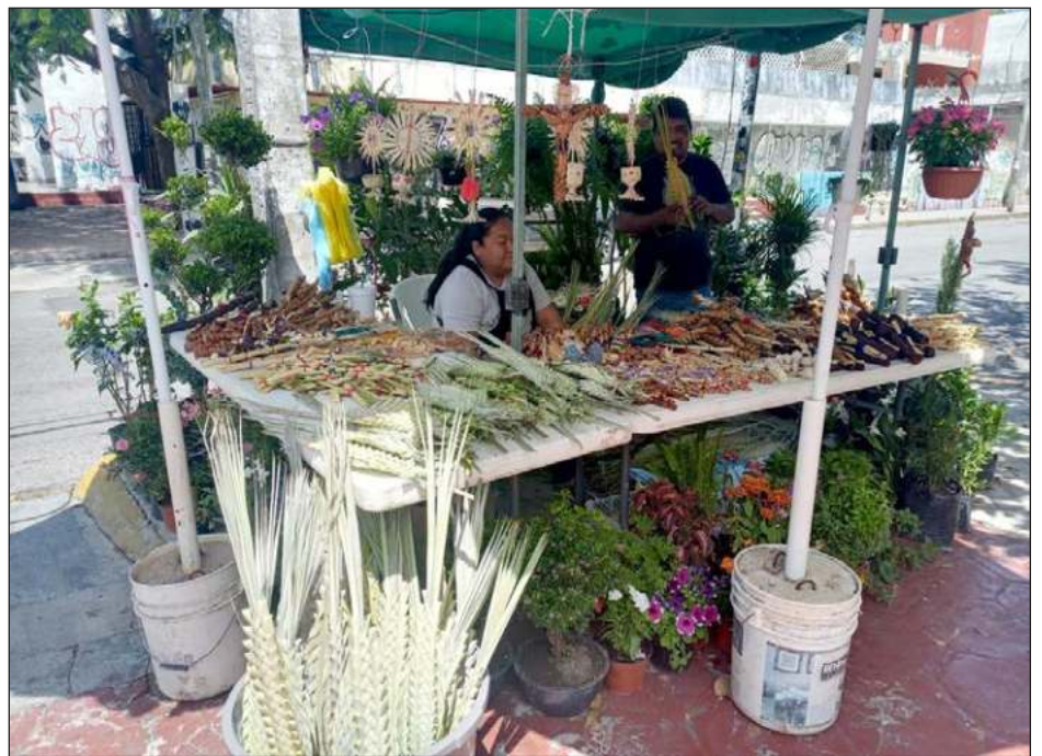
▲ En Cancún, decenas de feligreses acudieron a la iglesia de Cristo Rey, en el parque de Las Palapas, que lució con lleno total.