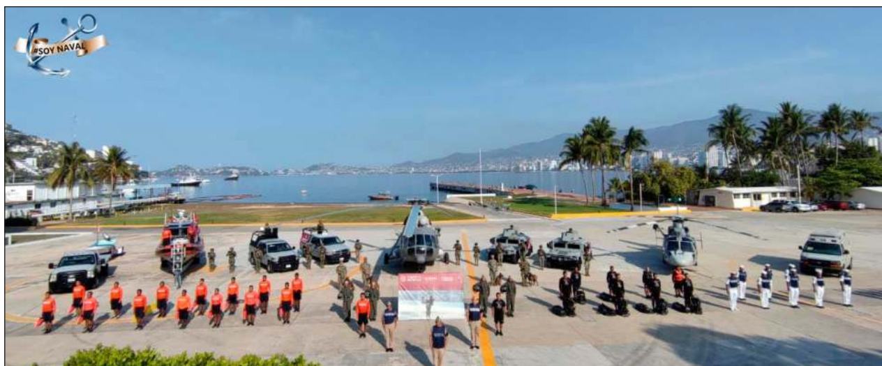
▲ En esta operaci n participar  la Estaci n Naval de B squeda, Rescate y Vigilancia Mar tima de Lerma, con el apoyo del personal de la Secretar a de Marina-Armada de M xico.

Sealaron es de suma importancia observar y respetar las indicaciones emitidas por la Capitan a de Puerto respecto al comportamiento del mar en sus niveles de marea, los cuales son se alados con banderas de diferentes colores; verde: indica que las condiciones para ba arse, nadar o bucear son buenas; amarillo: significa precauci n, debido a las corrientes marinas y la posibilidad de que el estado del tiempo empeore; y rojo: indica que los ba istas NO deben ingresar al mar.