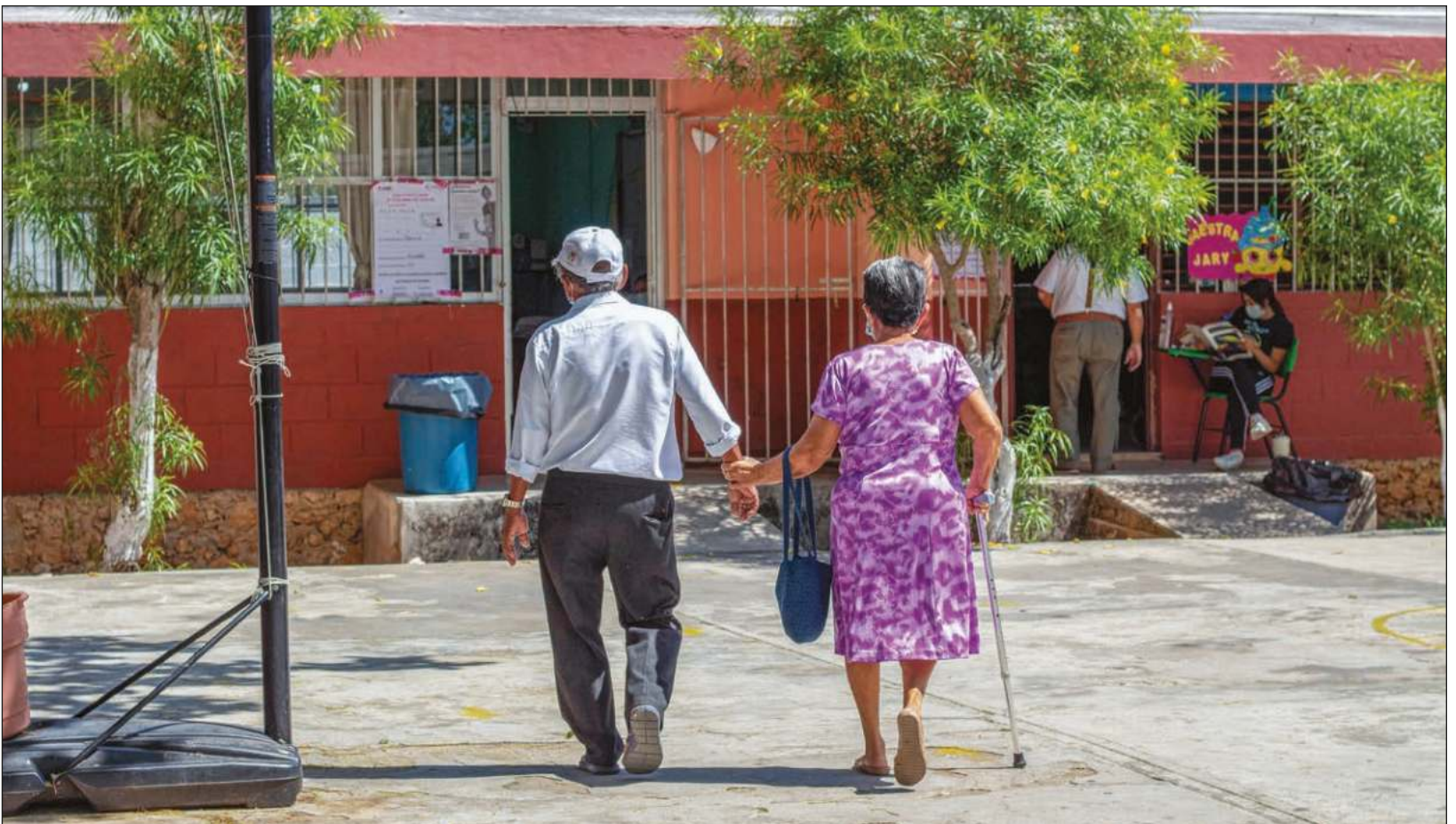
▲ La entidad contó con mil 42 casillas para recibir los votos de la lista nominal yucateca con un millón 657 mil 653 personas.