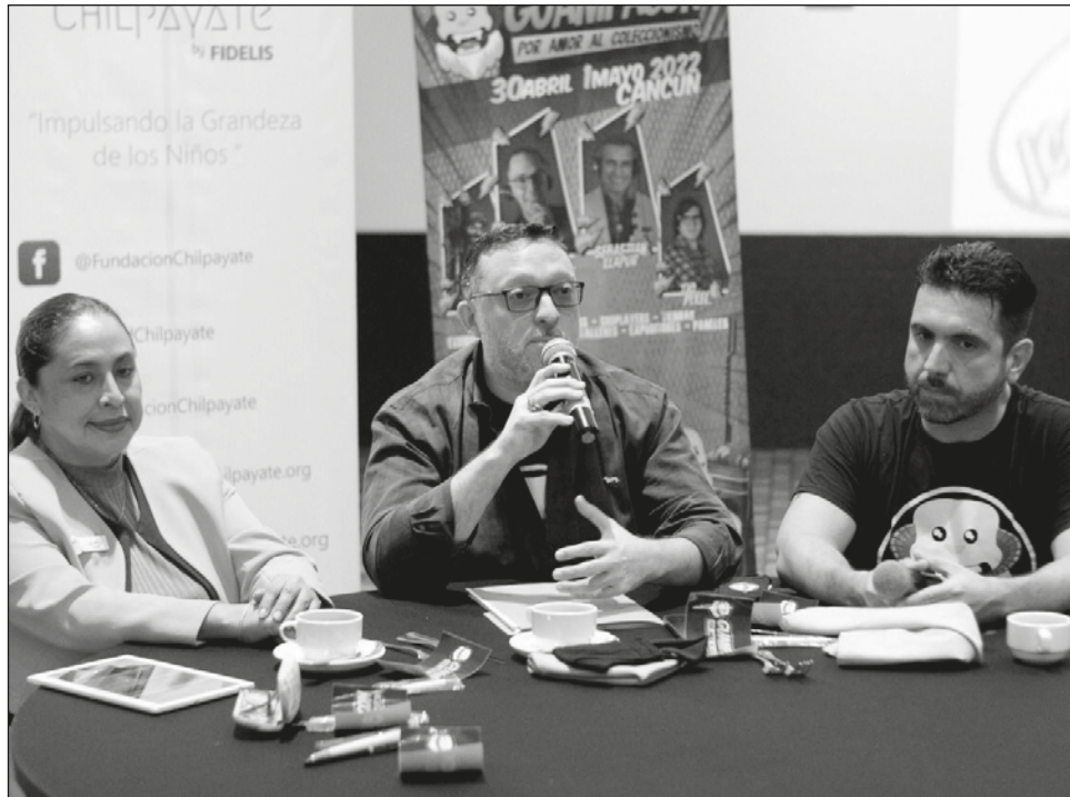
▲ La primera edición de este evento se llevará a cabo el 30 abril y el 1º de mayo, en el hotel Fiesta Inn Las Américas; se prevé una afluencia de 300 fanáticos.

“Esto nace de una mera conversación entre dos amigos respecto al coleccionismo, encontramos puntos en común, empezamos a grabar videos, a conocer personas, nos provocó abrir una fiesta para conseguir este tipo de artículos y ahora queremos un evento galáctico”, resaltó Davo Olmos, organizador del evento.