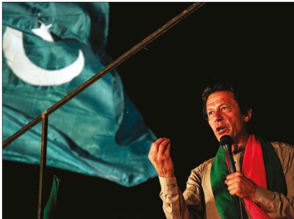
▲ Khan, como sus antecesores, no logró completar su periodo como premier.

El balance de su mandato y su propensión en estos últi-