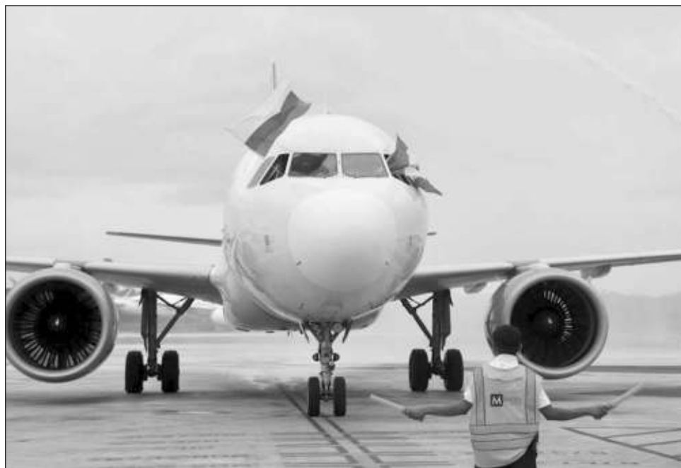
▲ Esta nueva ruta ofrece tres vuelos a la semana y es operada con aeronaves Airbus A320 con capacidad para 186 pasajeros, aviones que forman parte de la flota más joven de México.

Esta nueva ruta ofrece tres vuelos a la semana -lunes, miércoles y viernes- y es operada con aeronaves Airbus A320 con capacidad para 186 pasajeros, aviones que forman parte de la flota más joven de México, con tan sólo cinco años de edad promedio y la tercera más joven de toda Norteamérica. Los boletos para este nuevo servicio internacional ini-