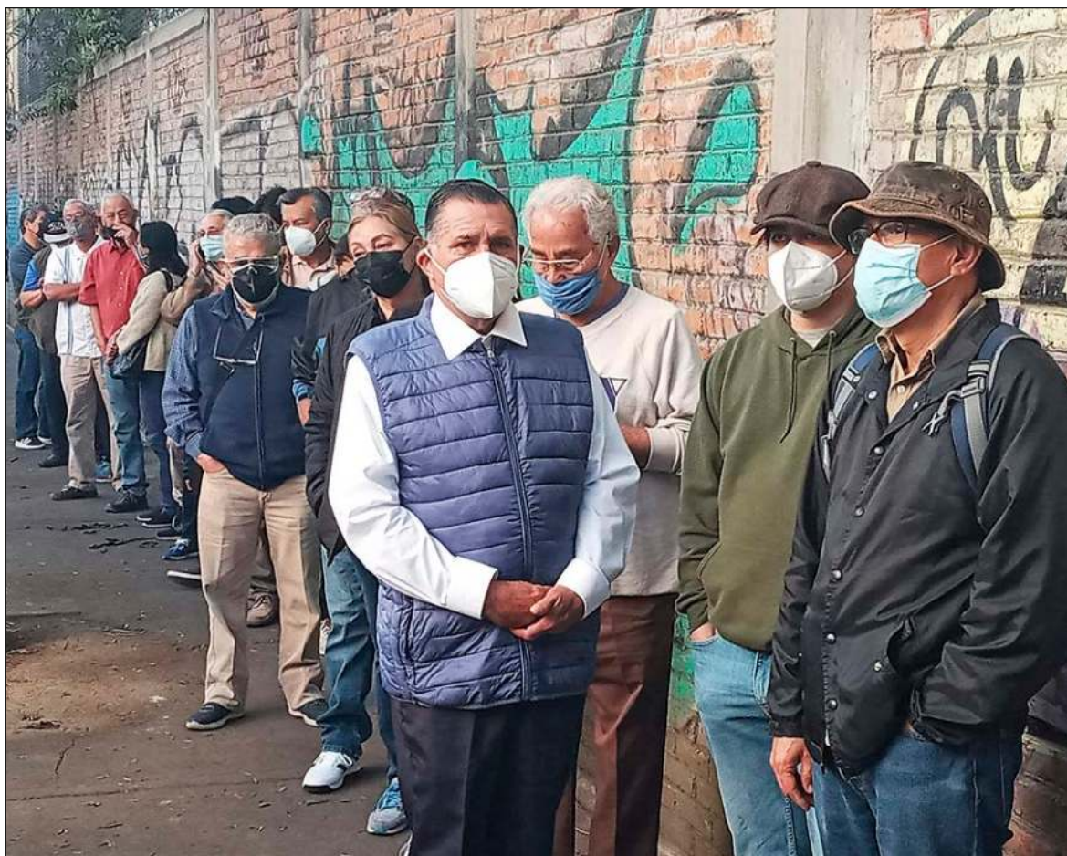
▲ Los 50 lugareños formados a las 8 de la mañana, antes de que abriera la casilla especial, eran viejos.

Es tempranera, confiesa, y transita por la fila hasta llegar a la puerta de la casilla y husmea. Registra a los guardias, camarógrafos y perros. Tañe en el cancel e interroga: ¿por qué no abren?