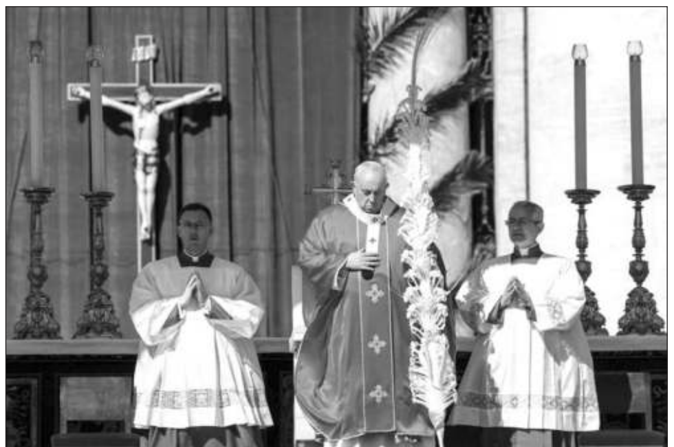
▲ Por primera vez en dos años, la celebración por el inicio de la Semana Santa se llevó a cabo ante miles de fieles católicos congregados en la Plaza de San Pedro.

Pero ayer, sin embargo, cardenales, obispos, sacerdotes y fieles recorrieron en procesión la plaza de San Pedro, portando en alto los ramos como siempre se había hecho en esta ceremonia, una de las más queridas del calendario litúrgico.