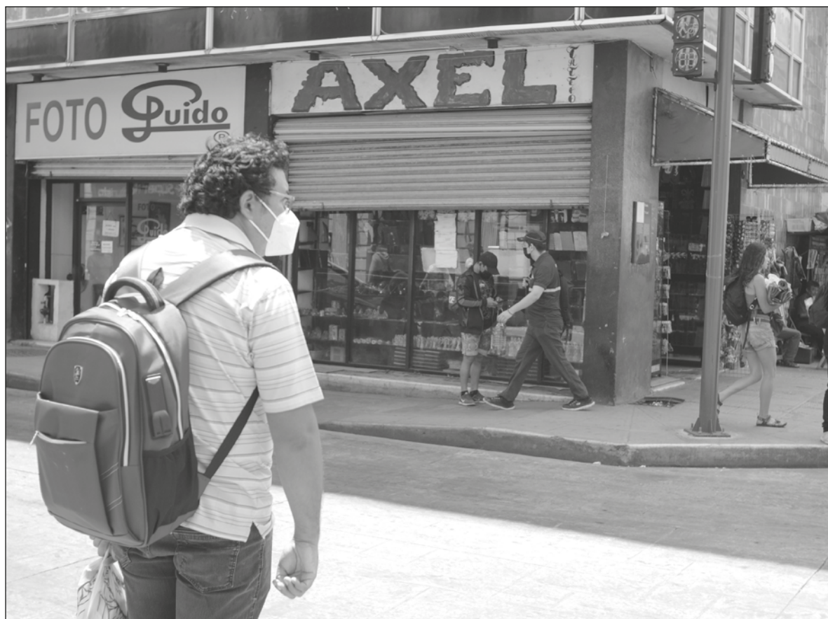
▲ "La Organización Mundial de la Salud, desde el primer momento de la pandemia de Covid-19, recomendó el uso del cubrebocas como método para evitar la propagación del coronavirus".

LA OMS DESDE el primer momento de la pandemia recomendó el uso del cubrebocas como método para evitar la propagación del coronavirus. Distintos estudios han venido demostrando que