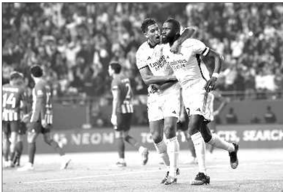
▲ Antonio Rüdiger (derecha) celebra tras el primer gol del Real Madrid, ayer en Riad.

Griezmann facturó su histórico gol con una definición de derecha desde fuera del área a los 37. “El