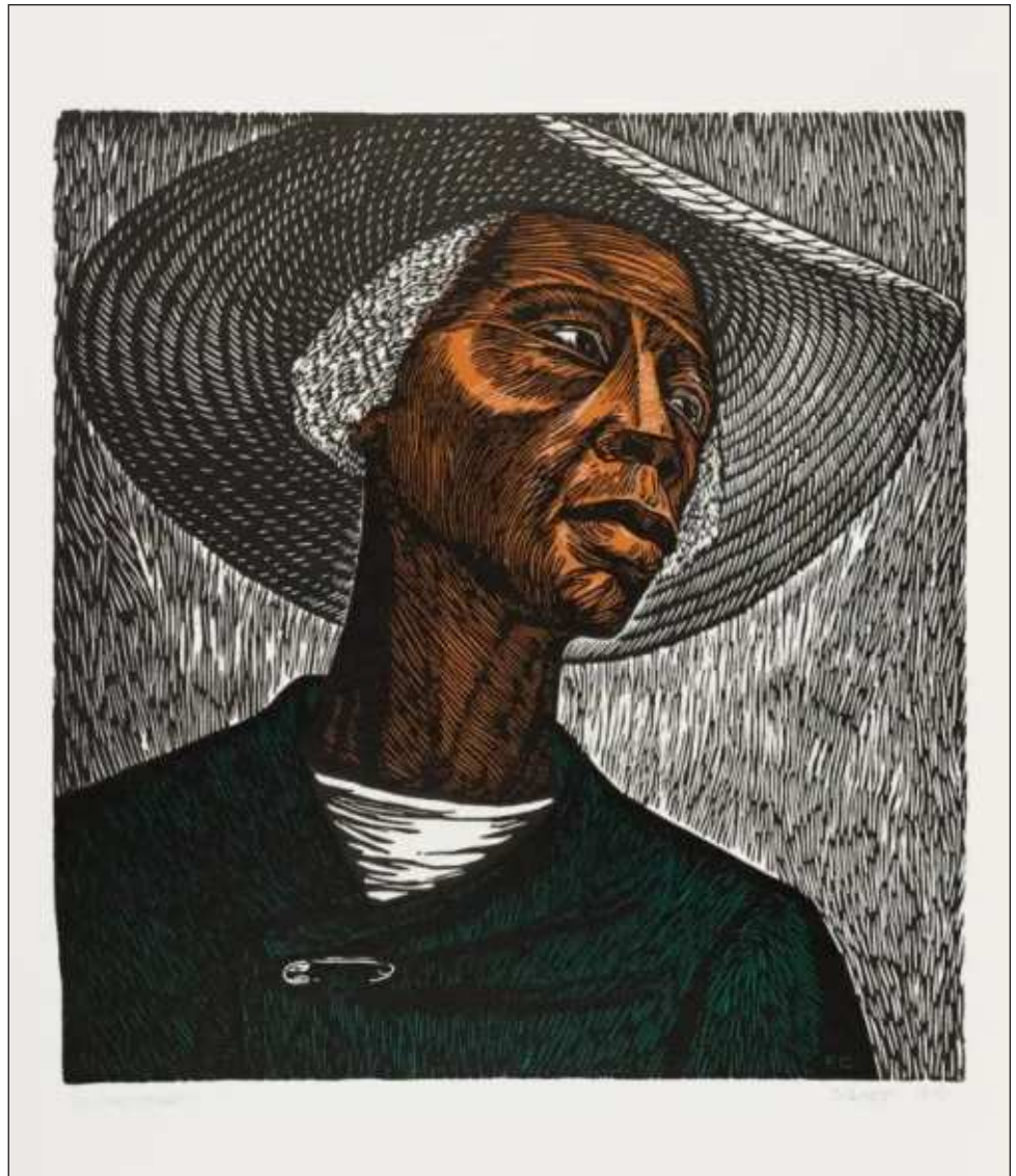
▲ Actualmente, el Museo de Arte Moderno en Frankfurt, Alemania, donde reunieron 175 piezas en una “primera revisión comprensiva” de la labor artística de Elizabeth Catlett, mucha de la cual fue realizada en México.