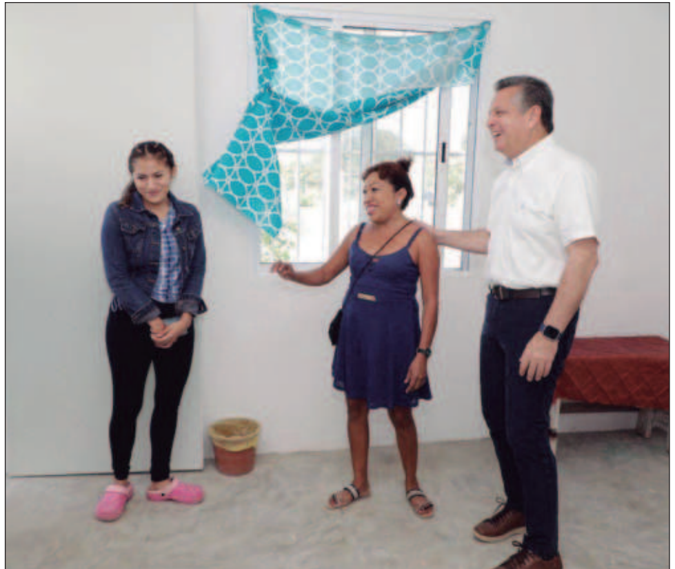
▲ Las viviendas entregadas el día de ayer por el alcalde Alejandro Ruz a los habitantes de la colonia Dzununcán incluyeron dormitorio y un baño.

Margarita Cachón Castañeda, integrante del Comité de Participación Ciudadana de la colonia, señaló que las y los vecinos que solicitaron al ayuntamiento estas obras: “agradecemos el apoyo del alcalde, antes la calle se inundaba y por su mal estado no permitía el acceso de ambulancias y de las patrullas de policía. Pero ahora, quedó muy bien y todos salimos beneficiados”.