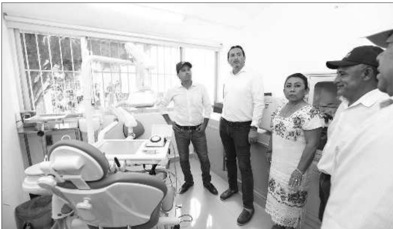
▲ El gobernador Mauricio Vila Dosal informó que, a partir de ahora, los 140 Centros de Salud de la entidad ya cuentan con exámenes de laboratorio gratuitos, ultrasonidos, atención dental y psicológica.

LA CIUDAD DE Grenoble, de Francia, ha votado para permitir que las mujeres naden con el torso desnudo. Como lo que yo vi en la ciudad llamada Cancún. Me voy a trasladar a esa ciudad para seguir dándome taco de ojo. Me lo merezco después de tantos años.