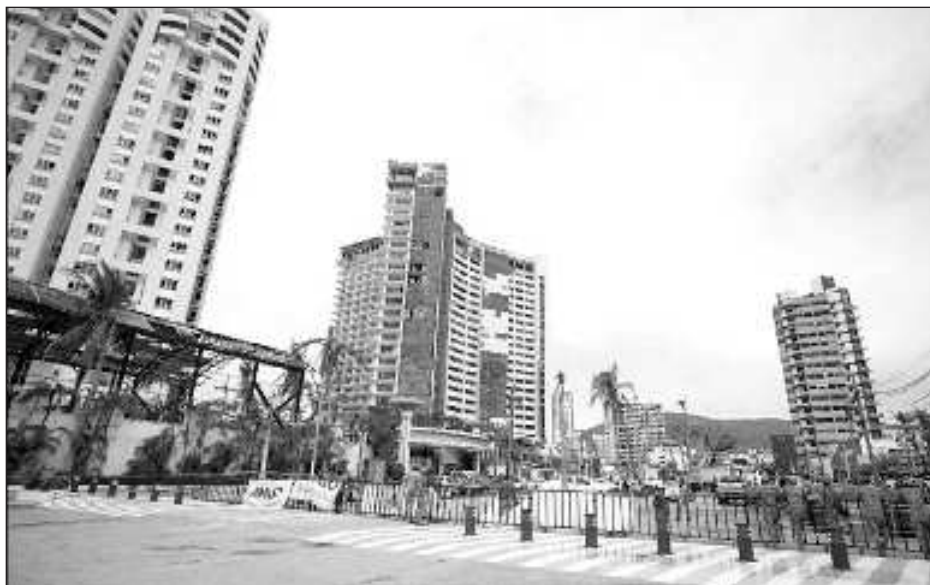
▲ Las familias de Acapulco y Coyuca, Guerrero, que fueron afectadas por el huracán, se encuentran adquiriendo materiales para rehabilitar sus viviendas.