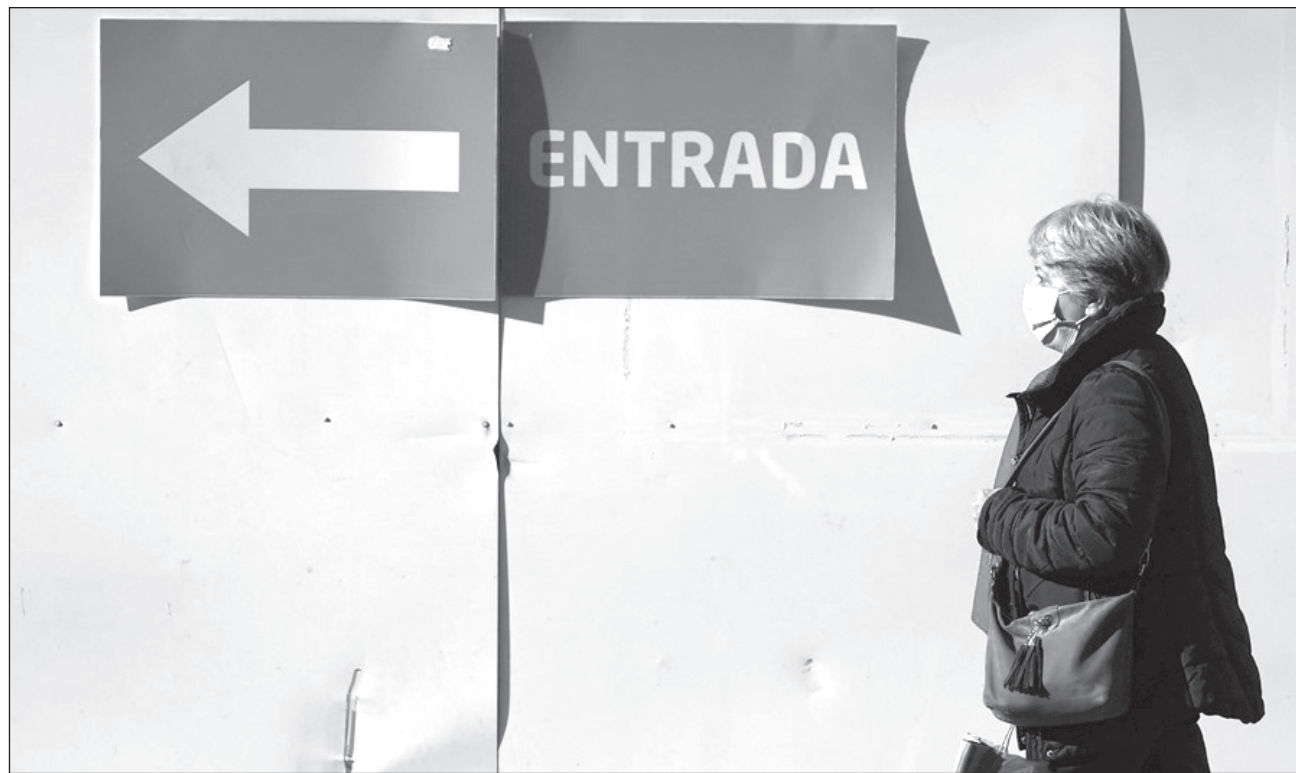
▲ El director general de la Organización Mundial de la Salud pidió a los gobiernos que sigan facilitando el acceso a pruebas, tratamientos y biológicos, y a los ciudadanos les instó a vacunarse si pertenecen a grupos de riesgo.

“Impulsada por las reuniones en el periodo vacacional y por la variante JN.1, que ya es la más comúnmente registrada, la Covid ha causado casi 10 mil muertes en diciembre”, indicó en su primera