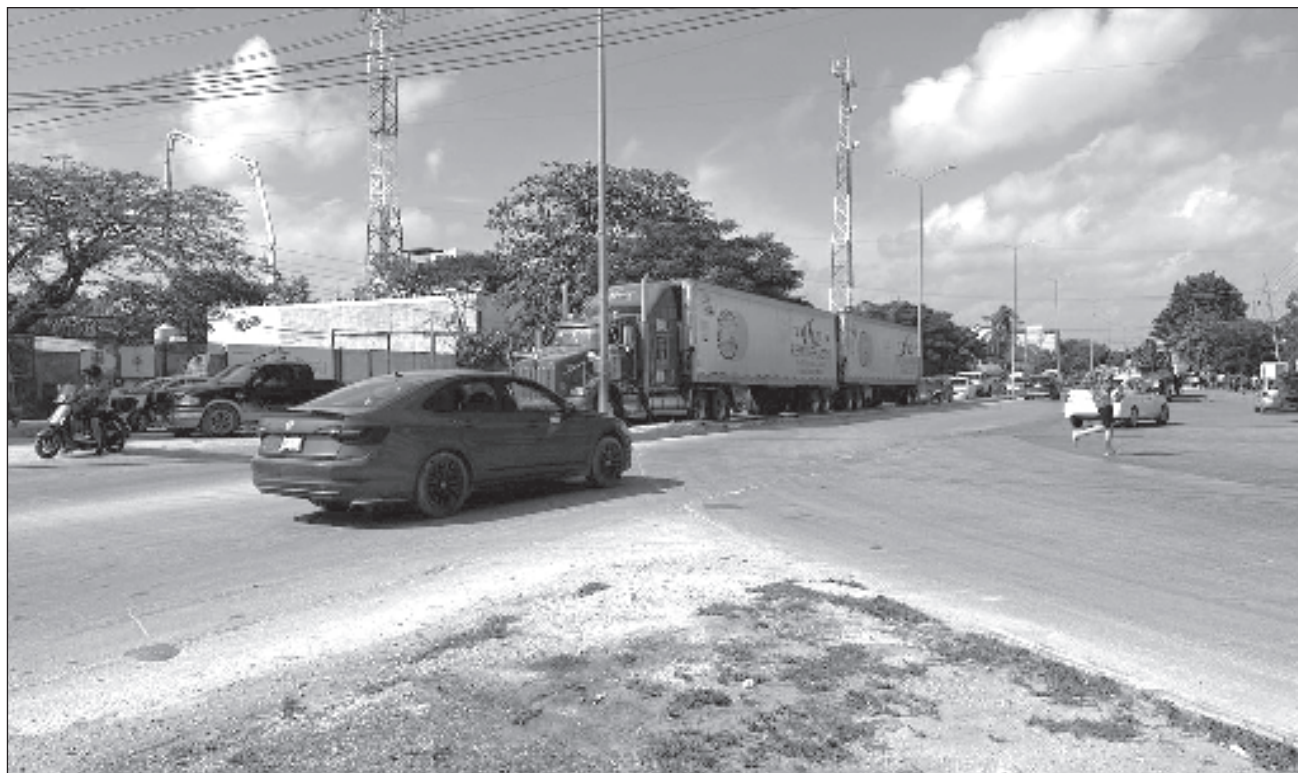
▲ Actualmente circulan hasta 75 vehículos por minuto en cada una de los tres accesos al municipio, cuando por lo general el movimiento es de 25 a 30 unidades, reveló Erik Bojorges, director municipal de Tránsito.

Apuntó que en la zona sur de la cabecera municipal también han tenido una nutrida afluencia de automovilistas, quienes ingresan y salen de los eventos musicales, pero también de los que habitan el fraccionamiento Aldea Tulum.