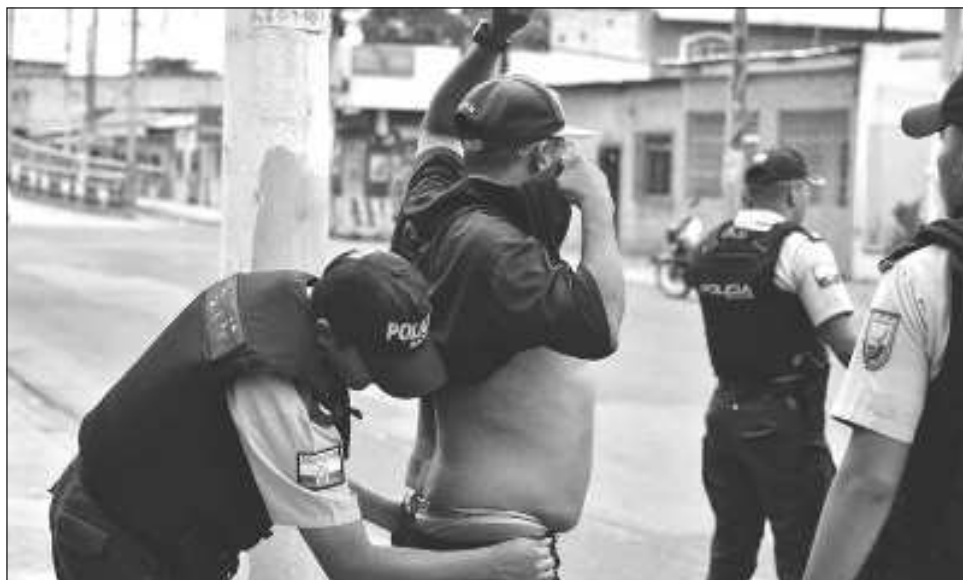
▲ El mandatario mexicano confió en que la situación sea transitoria y se restablezca la paz.

“Expresamos nuestra solidaridad y apoyo al pueblo de Ecuador y a su gobierno. Desde luego que reprobamos estas actitudes vandálicas, la violencia, el querer imponerse con el uso de