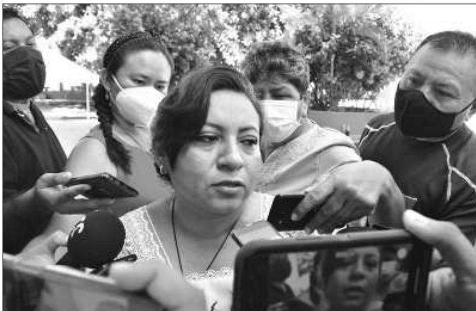
▲ La alcaldesa fue entrevistada saliendo del Palacio de Gobierno y con evidente molestia respondió que son noticias falsas vertidas desde la cabecera municipal de Calkiní.

Cuestionada al respecto, la alcaldesa fue entrevistada saliendo del Palacio de