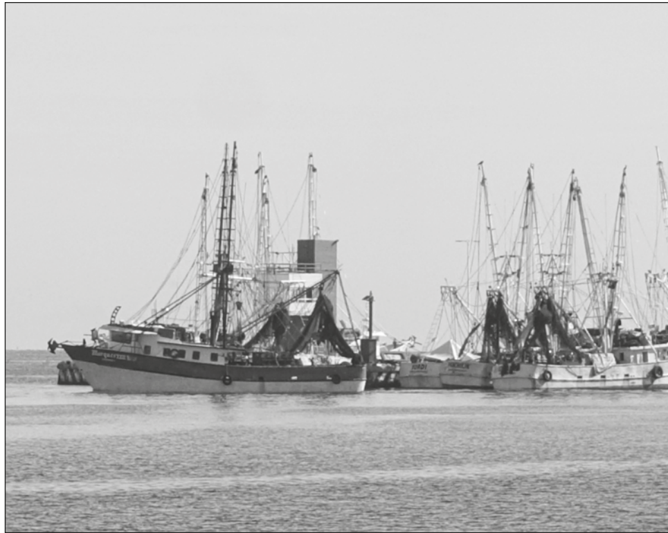
▲ Las 42 embarcaciones que lograron zarpar durante 2021 obuvieron capturas de entre 90 y 100 kilos, lo cual es muy bajo.

El 1 de septiembre pasado cuando inició la temporada de camarón, la primera área de trabajo es la zona 1 que comprende sólo al estado de Tamaulipas, sigue la zona 2 en Veracruz, posteriormente la zona 3 que son Tabasco y Campeche, luego la zona 4 que es Yucatán