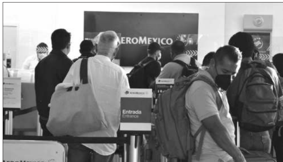
▲ Hasta el momento, la única aerolínea que ha suspendido vuelos a causa de los contagios ha sido Aeroméxico.