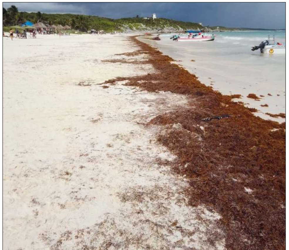
▲ La Secretaría de Marina dio a conocer en la clausura de la Temporada de Sargazo 2021 que logró la recolección de un aproximado de 44 mil 913 toneladas de esta alga en Quintana Roo.

Agregó que este 2022 será un año fuerte en el arribo de sargazo como ya lo habían anunciado sus pronósticos que vienen del monitoreo de las masas de la vegetación que pro-