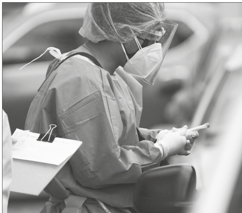
▲ La bacteria se comercializa como medicamento bajo el nombre de Broncho-Vaxom y se administra a personas de todas las edades.

La bacteria se comercializa como medicamento bajo el nombre de Broncho-Va-