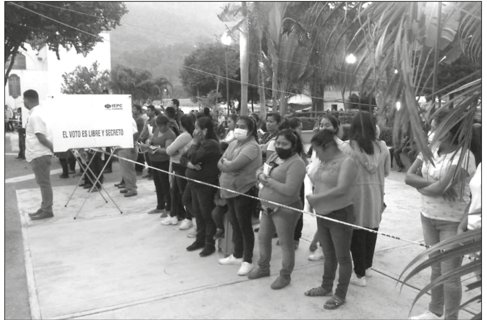
▲ Tras la elección de comisario en Ocotequila, el pasado 3 de enero, la CNDH llamó a garantizar a las mujeres sus derechos políticos.

La CNDH señaló que se debe garantizar a las mujeres sus derechos políticos y erradicar toda práctica social