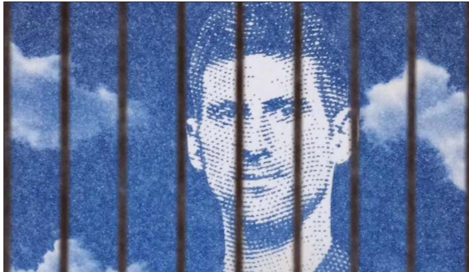
▲ En esta imagen de ayer se ve un muro con la imagen del tenista Novak Djokovic en un edificio de Belgrado, Serbia.

Tras el fallo, el abogado del gobierno, Christopher Tran, señaló al juez que el ministro de Inmigración, Ciudadanía, Servicios Migratorios