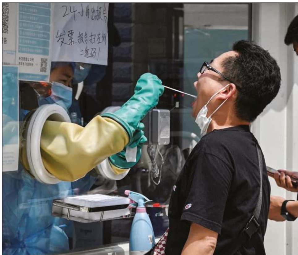
▲ Estudio reciente asegura que las muestras nasales tardan más en identificar a la variante; aunque los fabricantes no siempre recomienda la toma bucal.

En Israel, un alto funcionario de salud dijo que las personas que se autoanalizan para detectar Covid deben tomar una muestra de la garganta y la nariz cuando se usan pruebas rápidas de antígenos, incluso si van en contra de las instrucciones emitidas por el fabricante.