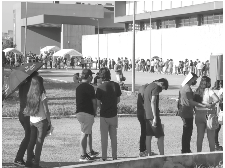
▲ La Secretaría de Salud llamó a quienes cumplen 15 años durante 2022 a aplicarse la primera dosis de la vacuna Pfizer este 13 de enero en Solidaridad y el 14 en Benito Juárez.

Igualmente, refirió que la primera dosis de Pfizer en adolescentes próximos a cumplir 15 años en este 2022 se aplicará este 14 de enero en horario de 8 a 18 horas en el Hospital General de Cancún Dr. Jesús