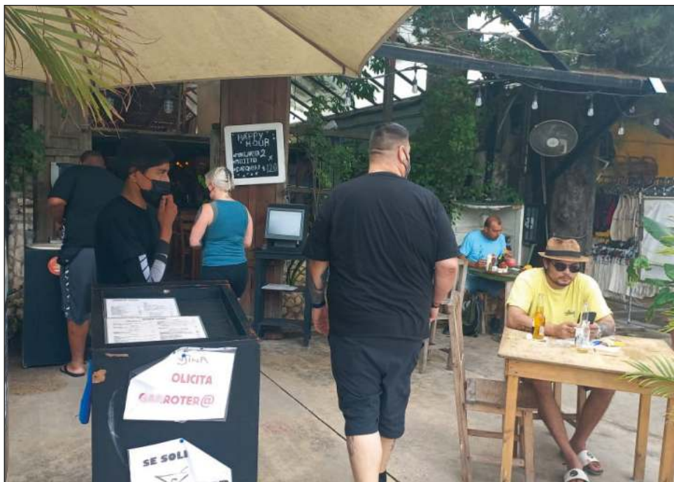
▲ Por el paso al semáforo amarillo y la falta de personal, los restauranteros calculan que sus ventas disminuyan hasta en 20 por ciento.

Además, la Secretaría de Finanzas y Planeación (Sefiplan) anunció la reducción de