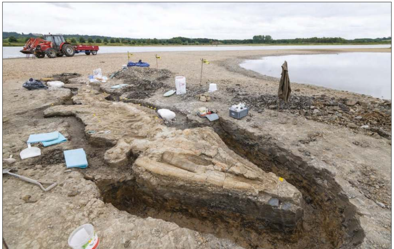
▲ Estos animales aparecieron por primera vez hace unos 250 millones de años y se extinguieron hace 90. Eran un grupo extraordinario de reptiles marinos que variaban en tamaño, desde 1 hasta más de 25 metros de largo, y se asemejaban a los delfines.

Se cree que es el primer ictosaurio de su especie, descubierto en ese país