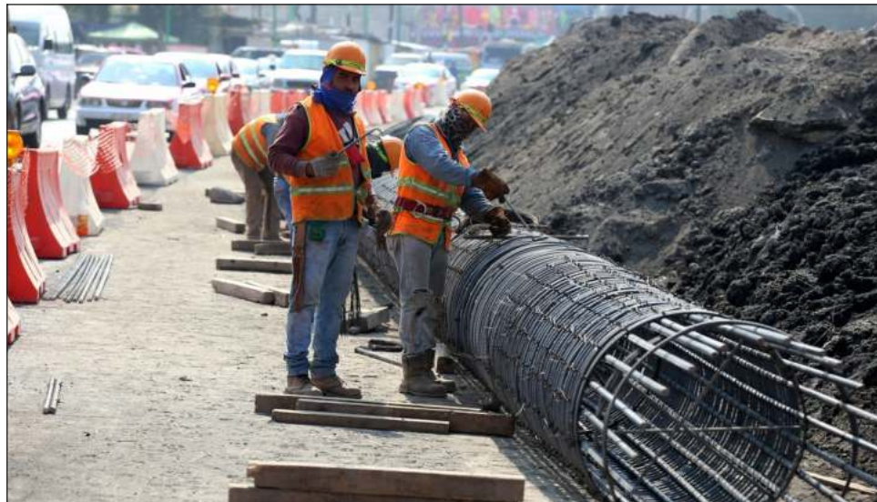
▲ Los gastos realizados en construcción, maquinaria y equipo, destinados para producir bienes y servicios que crean empleos e ingresos, presentó un estancamiento en octubre.

El indicador mensual de la inversión en instalaciones, maquinaria y equipo se ubicó en 93.3 puntos en