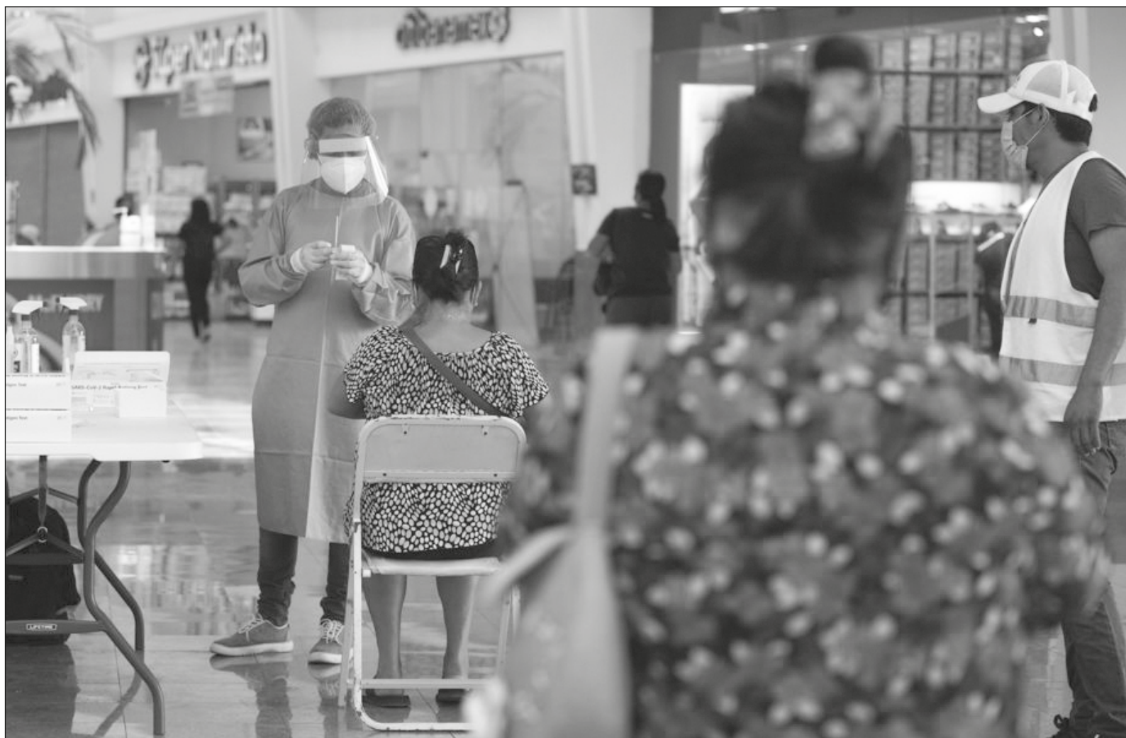
▲ Estamos en semáforo epidemiológico amarillo; ya se veía venir, pero no tomamos las precauciones necesarias.