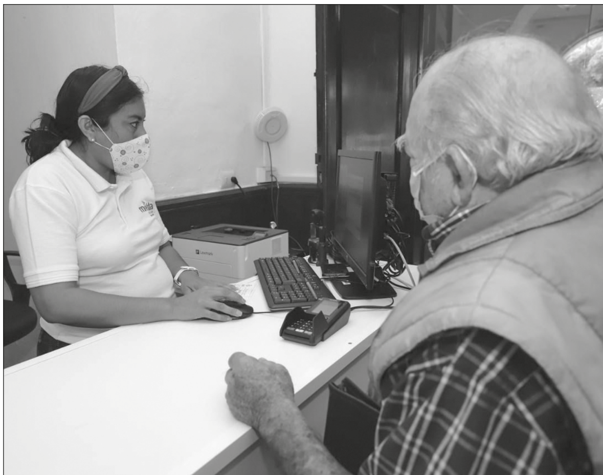
▲ Los municipios del país, incluyendo el de Mérida, carecen de las capacidades técnicas para diseñar y poner en práctica un sistema de cobro eficiente y equitativo que ofrezca la oportunidad de llevar la recaudación a su pleno potencial.

cluyendo el de Mérida, carecen de las capacidades técnicas para diseñar y poner en práctica un sistema de cobro eficiente y equitativo que ofrezca la oportunidad de llevar la recaudación a su pleno potencial, acorde a las características urbanísticas de sus demarcaciones y a su riqueza inmobiliaria. Existen a lo largo y ancho del país municipios con una riqueza inmobiliaria tal que fácilmente podrían incrementar su recaudación y su participación en sus ingresos propios, con un sistema que contemplara los valores catastrales y comerciales reales de cada colonia, que reflejara claramente la relación entre el monto del impuesto y la dotación de servicios e infraestructura urbana.