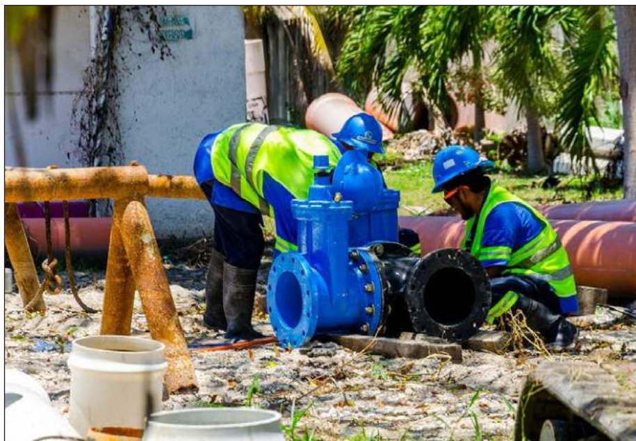
▲ Del 23 de diciembre de 2021 hasta el 1 de abril se llevará a cabo la introducción de más de 15 mil metros de tubería en la red de agua potable.

Cabe recordar que estos trabajos cuentan con todos los