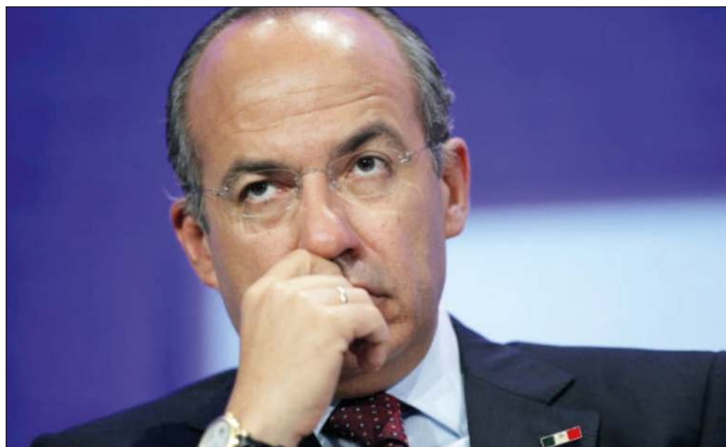
▲ Aunque Calderón ha dicho que no se enteró de los operativos, diversos testimonios indican que su gobierno tuvo puntual conocimiento de los envíos clandestinos de armas.

Sea como fuere, es indudable que la violenta estrategia gubernamental de seguridad pública y sus diversos episodios se tradujeron, paradójicamente, en una gravísima erosión de esa misma seguridad; resulta ineludible ventilar en el ámbito judicial de México las responsabilidades de diversos altos funcionarios por la imposición de un modelo que provocó decenas de miles de muertes, llevó a la devastación de regiones enteras, ahondó y extendió la violencia y la descomposición y cuyas consecuencias aún se siguen padeciendo hoy día.