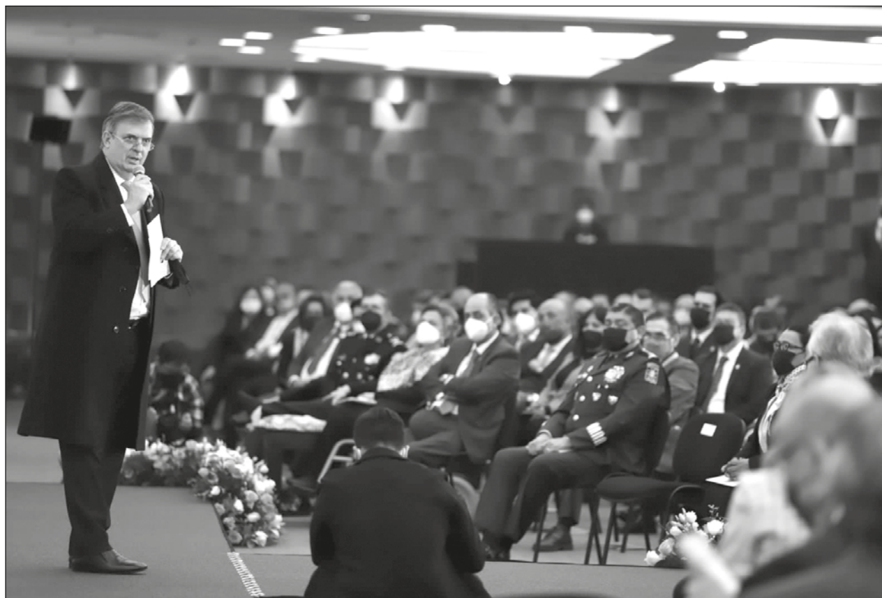
▲ El canciller Marcelo Ebrard inauguró la 33 Reunión de Embajadores y Cónsules.

Ebrard dijo que se continuará con el apoyo a la comunidad mexicana en el exterior y se reforzará la presencia y respaldo a los consulados, "con todos los recursos".