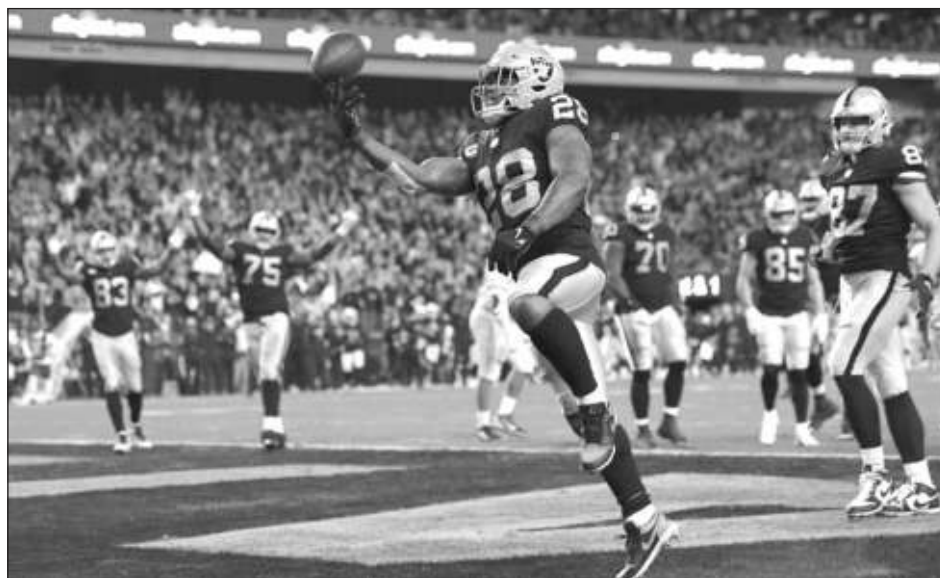
▲ Los Raiders se metieron a la postemporada con una victoria llena de emociones y drama ante los Cargadores.

Los Jefes de Kansas City (12-5) recibirán a los Acereros de Pittsburgh, que se colaron con el dramático triunfo de los Raiders, este domingo, a partir de las 19:15 horas, en la ronda de comodines. Los "malosos" (10-7), quintos de la clasificación (10-7), visitarán el sábado por la tarde, a