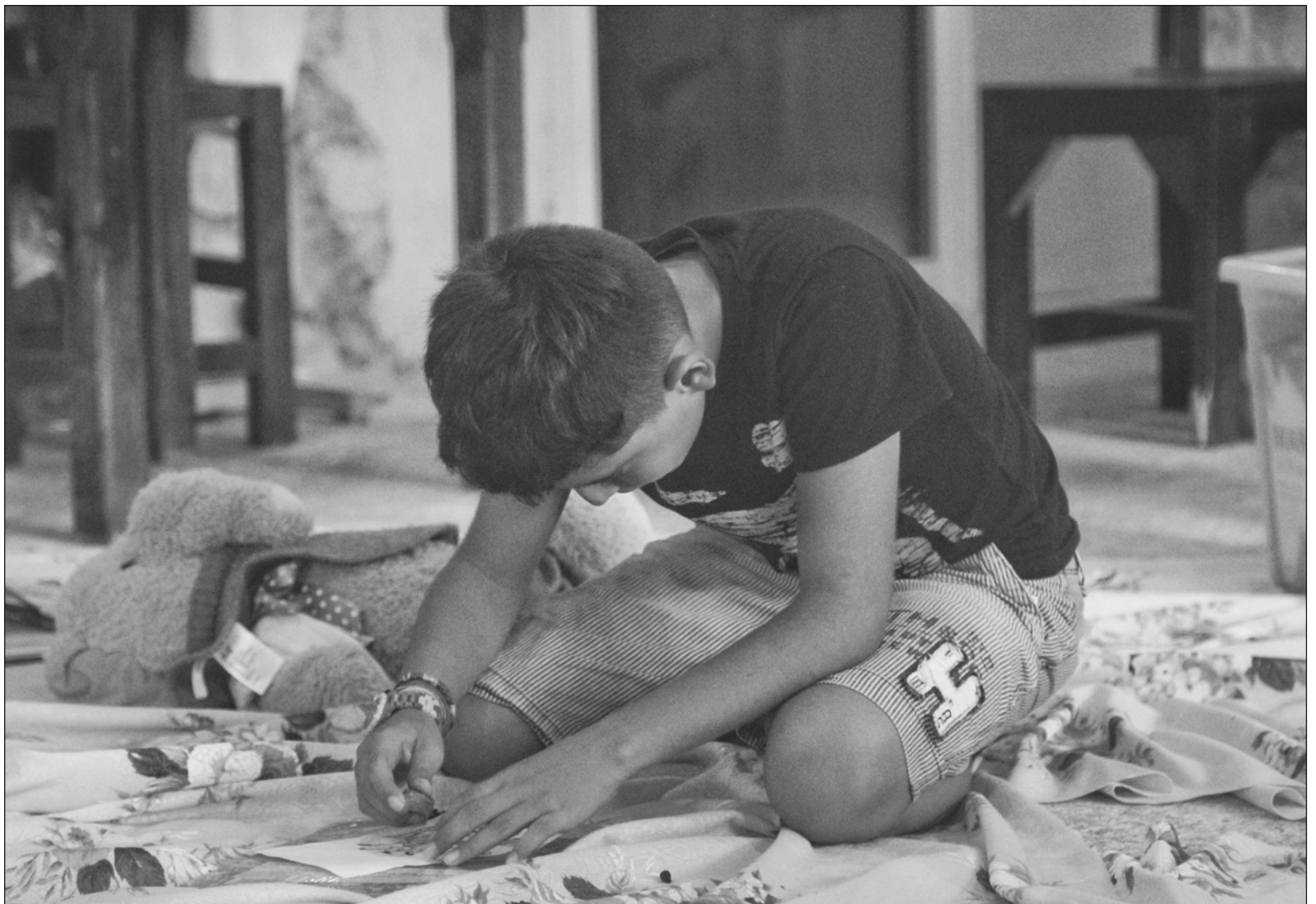
▲ He aquí la relevancia que adquiere la apreciación artística, pues es un acto de interpretación y comprensión

Al respecto de la apreciación y la educación artísticas, Reyzábal señaló que todos los espacios pueden percibirse como museos, los hogares con sus muebles; la gastronomía con sus colores, texturas, formas, olores y sabores; las calles con su mobiliario urbano, sus jardines. Y también indicó que todos éstos podrán ser apreciados quienes hayan sido formados para apreciarlos. Y tiene razón: el arte está en todas partes, es cuestión de percibirlo. He aquí la relevancia que adquiere la apreciación artística, en la que son ejercitadas las capacidades de observación y comparación, así como de interpretación y comprensión.