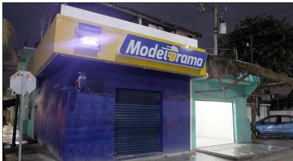
▲ Las restricciones sobre la venta de alcohol forman parte del fortalecimiento de las medidas sanitarias ante el repunte de contagios de coronavirus.

Estas dos acciones forman parte del fortalecimiento de las medidas sanitarias, la aplicación de los hábitos y el más estricto seguimiento de los protocolos para el cuidado de la salud y mitigar contagios de coro-