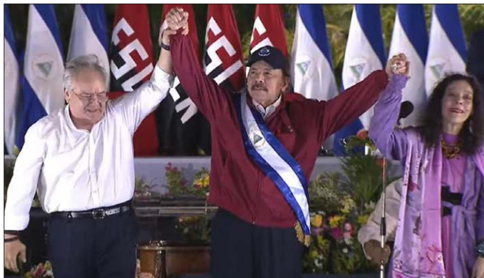
▲ El ex guerrillero sandinista, de 76 años, que gobierna sin contrapesos desde 2012, juró en una ceremonia en la Plaza de la Revolución, en Managua.

“Volvemos a la entrañable Managua, capital de Nicaragua, otra nación soberana que se salió del traspaso imperial. Venimos cargados