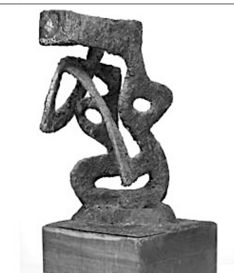
▲ Esa etapa del arte en México, duró de 1921 a 1927, junto con personalidades como Arqueles Vela, Germán List Arzubide, Fermín Revueltas, Ramón Alva de la Canal, entre otros.

teriormente, itineró al Museo de Arte Carrillo Gil de la Ciudad de México. Ahora, todo el trabajo incluido en la muestra procede de las colecciones de Ysabel Galán y de Fomento Cultural del Norte Potosino.