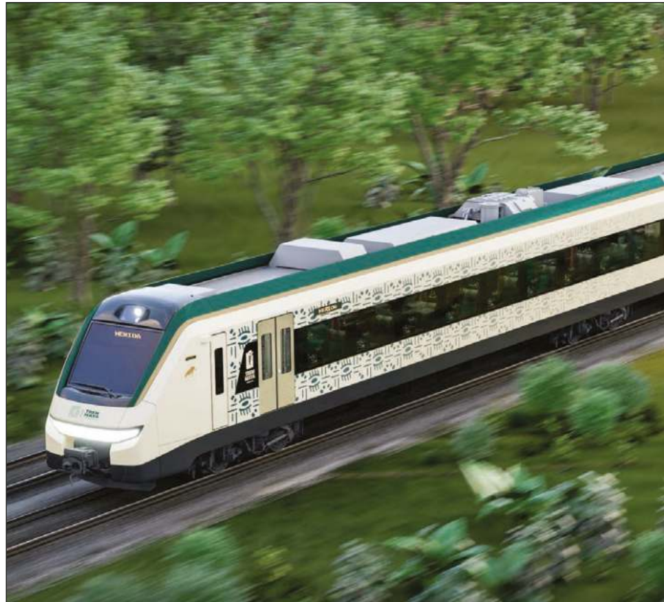
▲ El tramo 5 del Tren Maya es muy difícil técnicamente, por ello entró la Sedena a ejecutar las obras.

Estos tramos corren paralelos a la Riviera Maya,