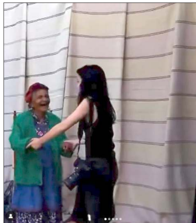
▲ El desfile de moda fue dado a conocer por Lienzos Extraordinarios, colectivo que divulga indumentaria tradicional mexicana. Fotos capturas de pantalla

Lienzos Extraordinarios puntualizó: “Basta. Las culturas originarias no son un zoológico, ni una bodega de accesorios ni un catálogo de diseños. No estamos al servicio de las marcas in-