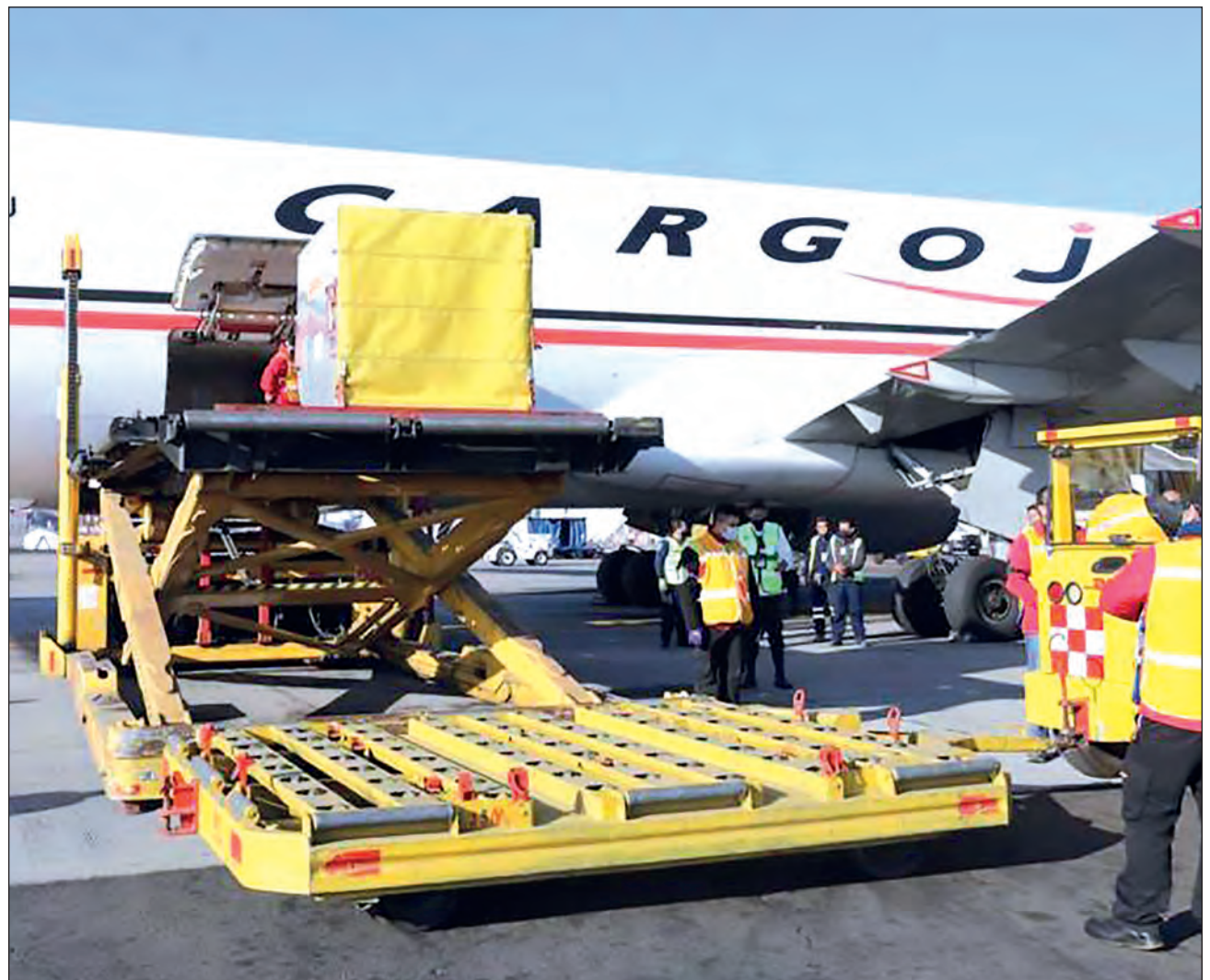
▲ A partir de mañana martes y hasta el 1 de febrero, deberán llegar a Yucatán 27 mil 300 vacunas de la farmacéutica Pfizer, que se aplicarán al personal sanitario de las áreas COVID en hospitales.

“En el tema de la vacunación no puede haber colores, aquí lo que existe es Yucatán, lo que existe es México y todos tenemos que poner de nuestra parte sin regatear un centímetro para que esto pueda salir bien y pueda ser una vacunación rápida y eficiente, que le permita a nuestro personal de salud tener la certeza de que ellos van a estar seguros, que no van a estar contagiando a su familia”, precisó.