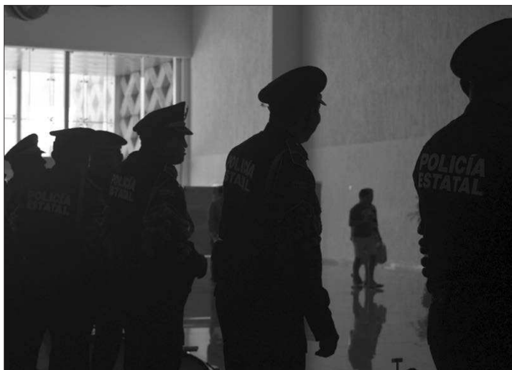
▲ Resulta sumamente difícil pronosticar cuándo habrá paz y tranquilidad en las regiones como Michoacán; al desafío, la respuesta correcta es el cumplimiento del deber.

Resulta sumamente difícil pronosticar cuándo habrá paz y tranquilidad en las regiones como Michoacán, pero la tarea de devolverla es irrenunciable, al menos hasta que los productores de aguacate y limón puedan sembrar, cosechar y comercializar sin ser víctimas de extorsión en ningún punto del ciclo productivo. Al desafío, la respuesta correcta es el cumplimiento del deber.