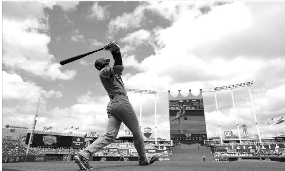
▲ Shohei Ohtani, el atleta del año para Ap, durante un partido en Kansas City en junio pasado.

El galardón de la AP se otorga desde 1931. La destacada deportista multideportiva, Babe Didrikson Zaharias, fue reconocida seis veces durante las décadas de 1930, 40 y 50, la mayor cantidad por un hombre o una mujer.