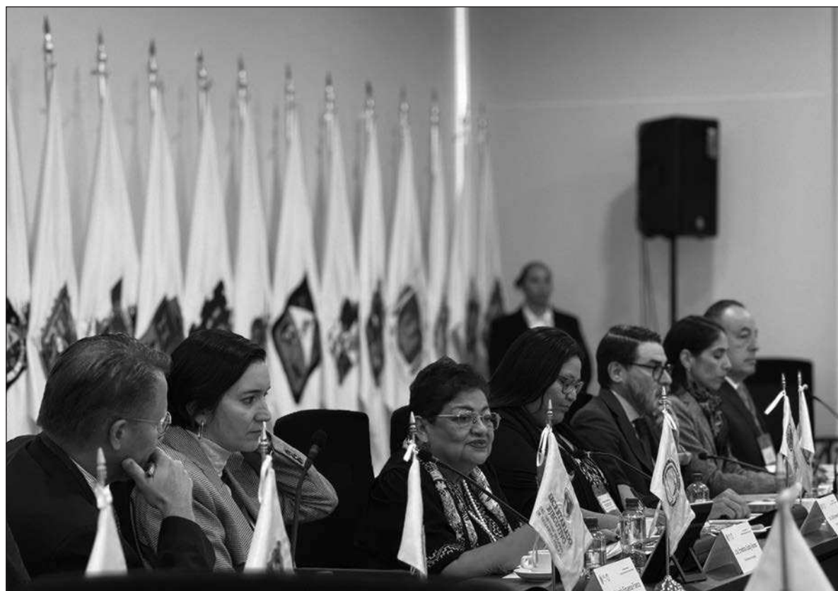
▲ "Ernestina Godoy, ha entrado en acción de inmediato en algunos casos relevantes relacionados con ex gobernadores de oposición; ha de esperarse que luego de este primer paso, avance hacia ex mandatarios guindas".

TOCAYO DE PRIMER apellido del chihuahuense, el veracruzano Javier Duarte de Ochoa ha entrado en la misma dinámica de desadormecimiento postgertziano. También peñista, huyó a finales de su represivo y corrupto gobierno, bajo acusaciones judiciales. Fue encontrado meses después en Guatemala y el gobierno federal negoció un proceso de extradición con acusaciones menores, que luego fueron modificadas a su favor en México, de tal manera