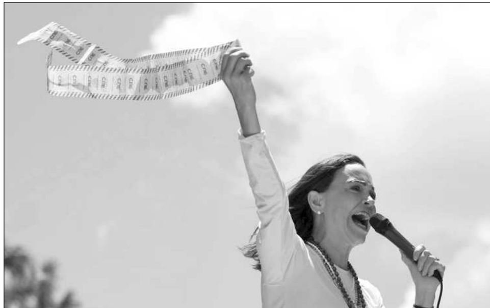
▲ Machado, ganadora del Nobel de la Paz por su lucha en su nación sudamericana, fue descrita como una mujer "que mantiene viva la llama de la democracia en medio de una creciente oscuridad".

"María Corina Machado ha manifestado en entrevistas lo difícil que será el viaje a Oslo, Noruega", indicó el instituto en un correo electrónico. "Por lo tanto, en