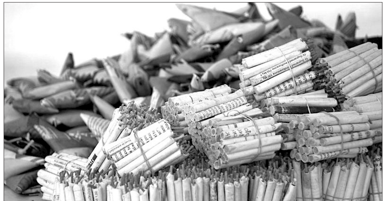
▲ Autoridades decomisarán la mercancía que sea detectada comercializándose, destacó director de Protección Civil municipal.

"Sin embargo, una vez que se cuenta con el permiso, el beneficiario debe acudir a la Dirección de Protección Civil, para que se les den las indicaciones al