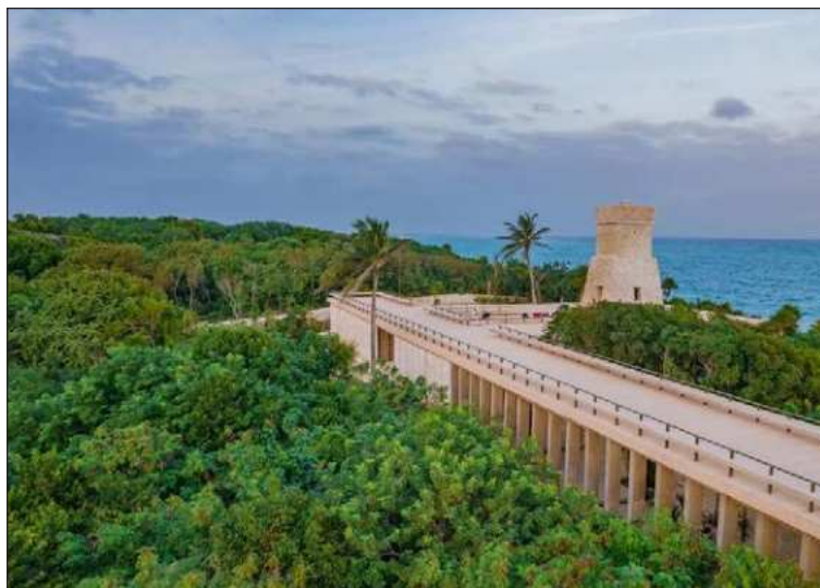
▲ “Las áreas protegidas de México enfrentan numerosos obstáculos y retos, que pueden seguir resultando insalvables en la medida en que los recursos dedicados a la operación del sistema siguen siendo insuficientes”.