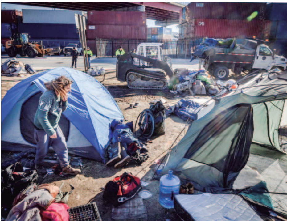
▲ El reporte indica que la concentración de la riqueza es extrema, pues 10% más rico posee 75% de la riqueza global, mientras que 50% más pobre sólo posee 2%.

En 2024, a nivel sector industrias manufactureras, la distribución del total de remuneraciones pagadas presentó niveles de 33.5 por ciento para las mujeres y 66.5 por ciento para los hombres.