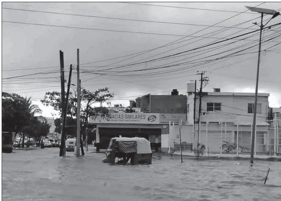
▲ En la colonia 23 de julio se puso en operación una bomba para el desalojo de agua.

En la Villa de Isla Aguada, un árbol de pino cayó en la zona del Malecón, sobre el parador turístico y los juegos infantiles, siendo retirado por personal de Protección Civil.