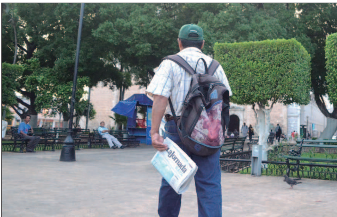
▲ "El cambio político y filosófico en México se está consolidando, más allá de nuestra preferencia individual. Releer la Revolución Francesa ayuda a entender estos fenómenos de cambio ideológico profundo".