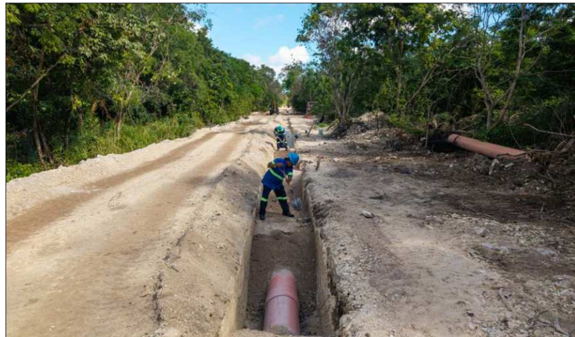
▲ Para llevar a cabo esta construcción se utiliza el método de zanja abierta, dividido en seis etapas estratégicas para reducir al mínimo las afectaciones en vialidades.

“Esta obra es fundamental para Puerto Morelos, ya que estamos reno-