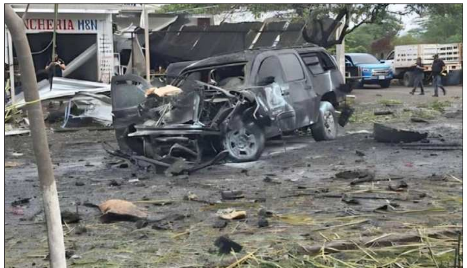
▲ Harfuch señala que fue acto criminal entre CJNG, Tepalcatepec y Unidos.

En la mañanera del pueblo , precisó que lo ocurrido el sábado “no es por terro-