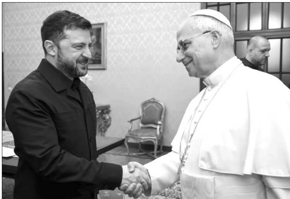
▲ El pontífice se reunió con el presidente ucraniano Zelensky en Castel Gandolfo.

El pontífice, que el martes se reunió con el presidente ucraniano Volodimir Zelensky en su residencia de campo en Castel Gandolfo, dijo a los periodistas que no había leído en su totalidad la última propuesta estadounidense para poner fin a la guerra rusa.