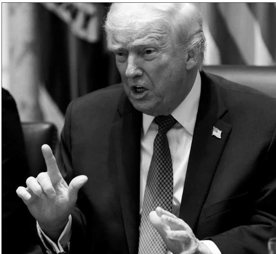
▲ Trump evitó abundar sobre los potenciales ataques militares estadounidenses dentro del territorio mexicano con los que ha amenazado desde su campaña presidencial de 2024.

Aunque afirmó estar impulsando una agenda de paz en el extranjero, Trump insistió en que podría ampliar las acciones militares que su administración ha emprendido en Latinoamérica contra objetivos que, según afirma sin pruebas, están vinculados al narcotráfico.