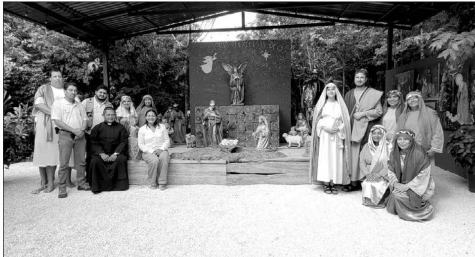
▲ El coordinador artístico de la asociación Evangelización Creativa apuntó que "ya es la séptima edición, hemos venido actualizando nuestro elenco, tenemos nuevas personas que nos vienen a apoyar (...) a esta representación del nacimiento del Niño Dios".

La cita es el día 21 de diciembre; originalmente era el 14, pero se movió al 21 por