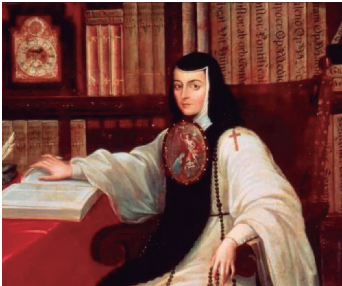
▲ “Lo sabía Sor Juana: no hay cosa más libre que el entendimiento humano”.

Magos Herrera no escogió los villancicos que escribió Sor Juana para recordarla, sino su obra mayor, Primero sueño , cuya arquitectura tiene cinco partes: la medianoche, el dormir, el sueño, el