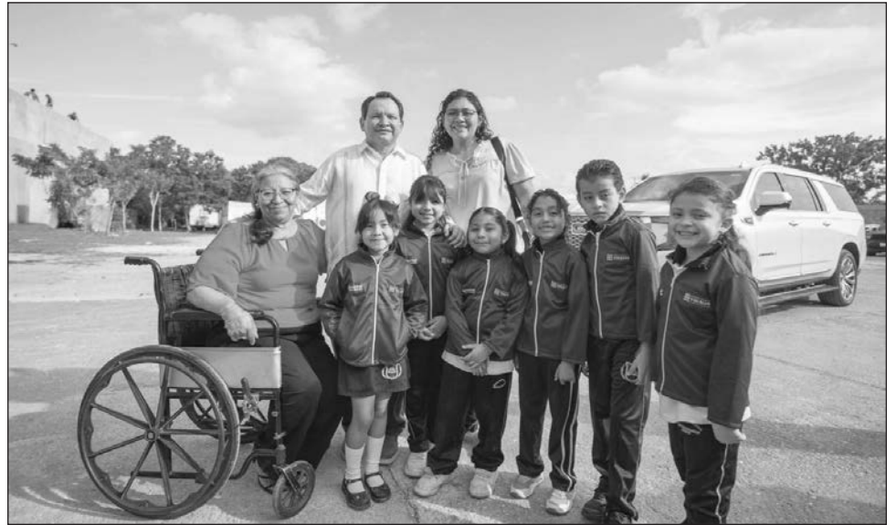
▲ El gobernador Joaquín Díaz Mena destacó que este programa contribuye a mejorar la calidad educativa: "es una gran inversión para el futuro de las y los estudiantes".

"En cambio, un niño que está en un salón bien equipado y cuya maestra también cuenta con un escritorio y una silla digna, contri-