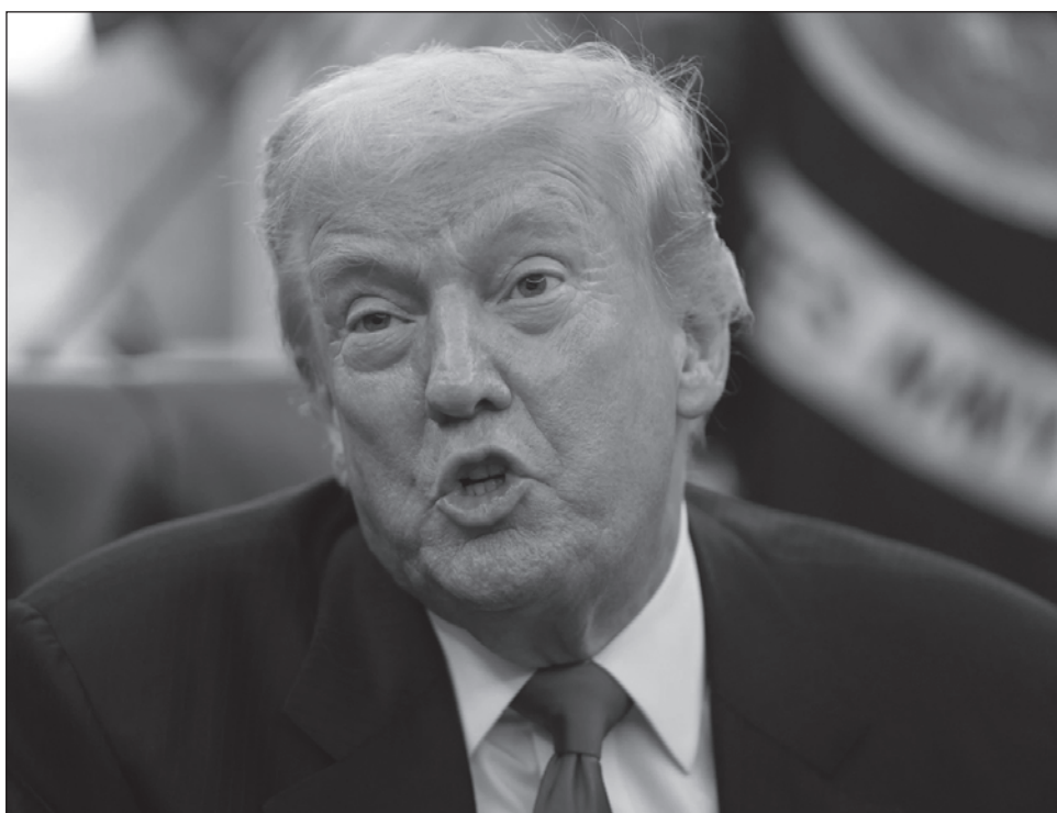
▲ Los esfuerzos de Trump para controlar el desarrollo de la IA enfrentan una intensa oposición política y legal por sus posibles daños económicos y sociales.

“¡No puede haber duda sobre esto! ¡La IA será destruida en su infancia! Estaré emitiendo una Orden Ejecutiva de una regla (para todo el país, ndlr) esta semana”, advirtió.