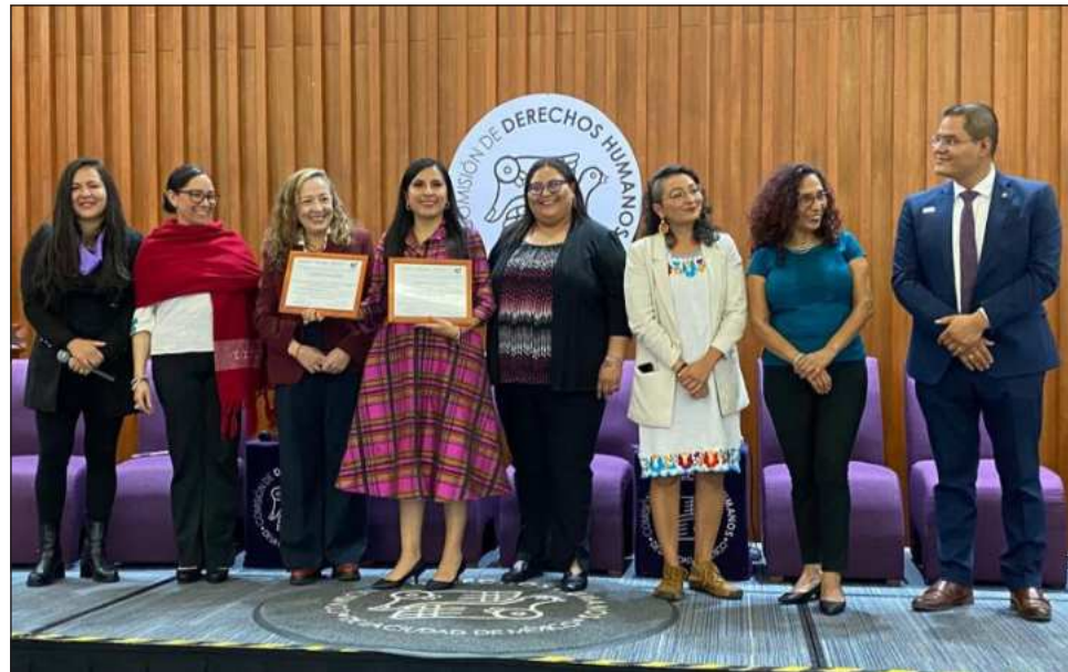
▲ La certificación promueve y fortalece una cultura organizacional basada en el ejercicio ético del personal, la transparencia en los procedimientos institucionales y la eficiencia operativa.