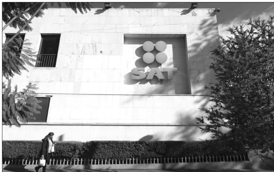
▲ La recaudación del impuesto especial sobre producción y servicios (IEPS) resultó en 617 mil 787 millones de pesos; 47 mil 775 millones más que lo registrado en el mismo periodo de 2024.

De enero a noviembre, se obtuvieron 2 billones 652 mil 597 millones de pesos por el impuesto sobre la