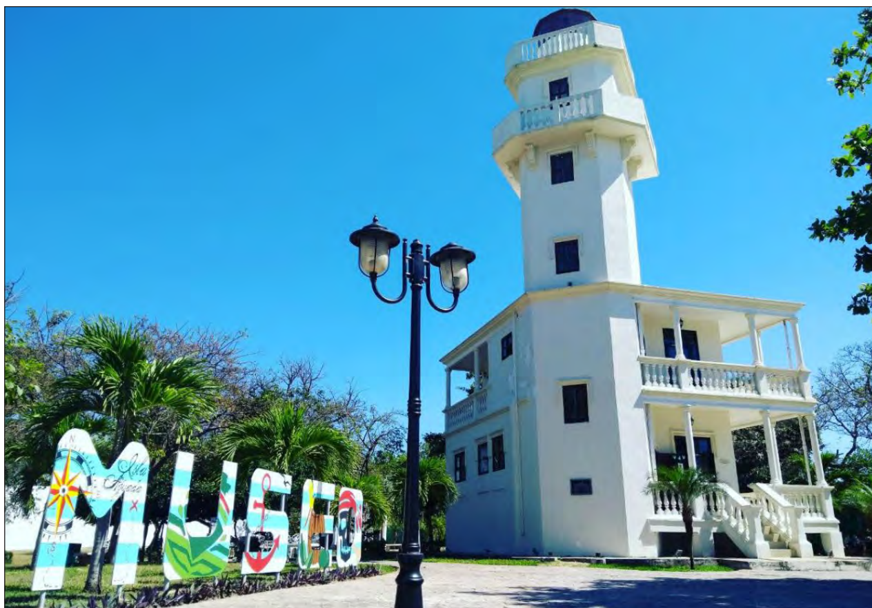
▲ El empresariado carmelita tomó el estudio del IMCO como una oportunidad para construir alianzas con empresas nacionales y extranjeras.

El funcionario señaló que el resultado de este estudio son buenas noticias para todo el estado, en especial para el municipio, lo cual no es nuevo, ya que Carmen siempre ha sido un lugar privilegiado por los recursos naturales que tiene y los recursos humanos con que cuenta.