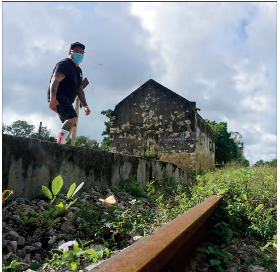
▲ La SCJN deberá resolver el amparo que solicita el grupo Chuun t'aan .

Este asunto deberá ser resuelto por la SCJN en una de sus primeras sesiones del próximo año.