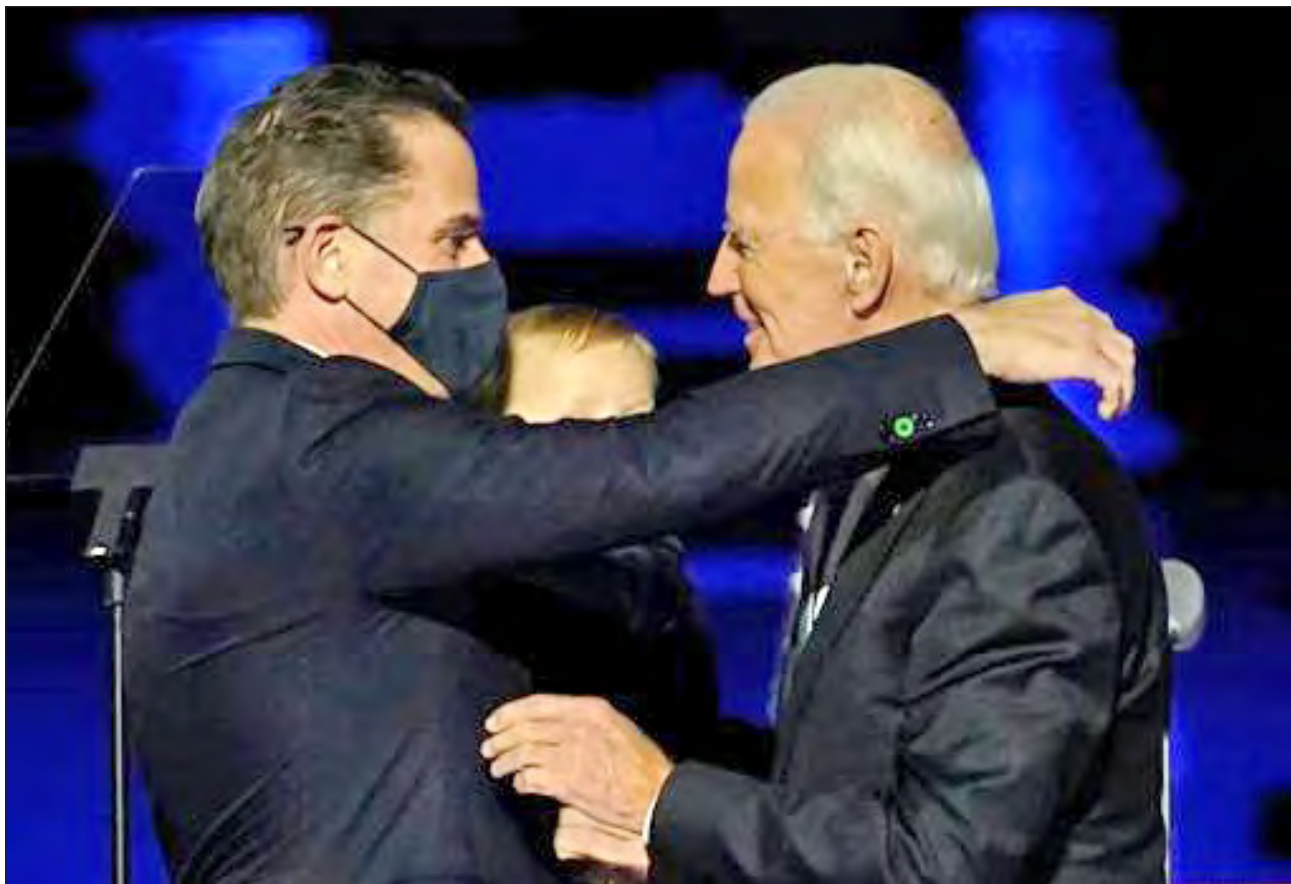
▲ Hunter Biden, hijo del presidente electo Joe Biden, dijo el miércoles que fiscales federales le informaron que sus asuntos fiscales están siendo investigados. La

pesquisa por parte de la fiscalía federal de Delaware fue dada a conocer en un comunicado divulgado por la oficina de transición de Joe Biden.