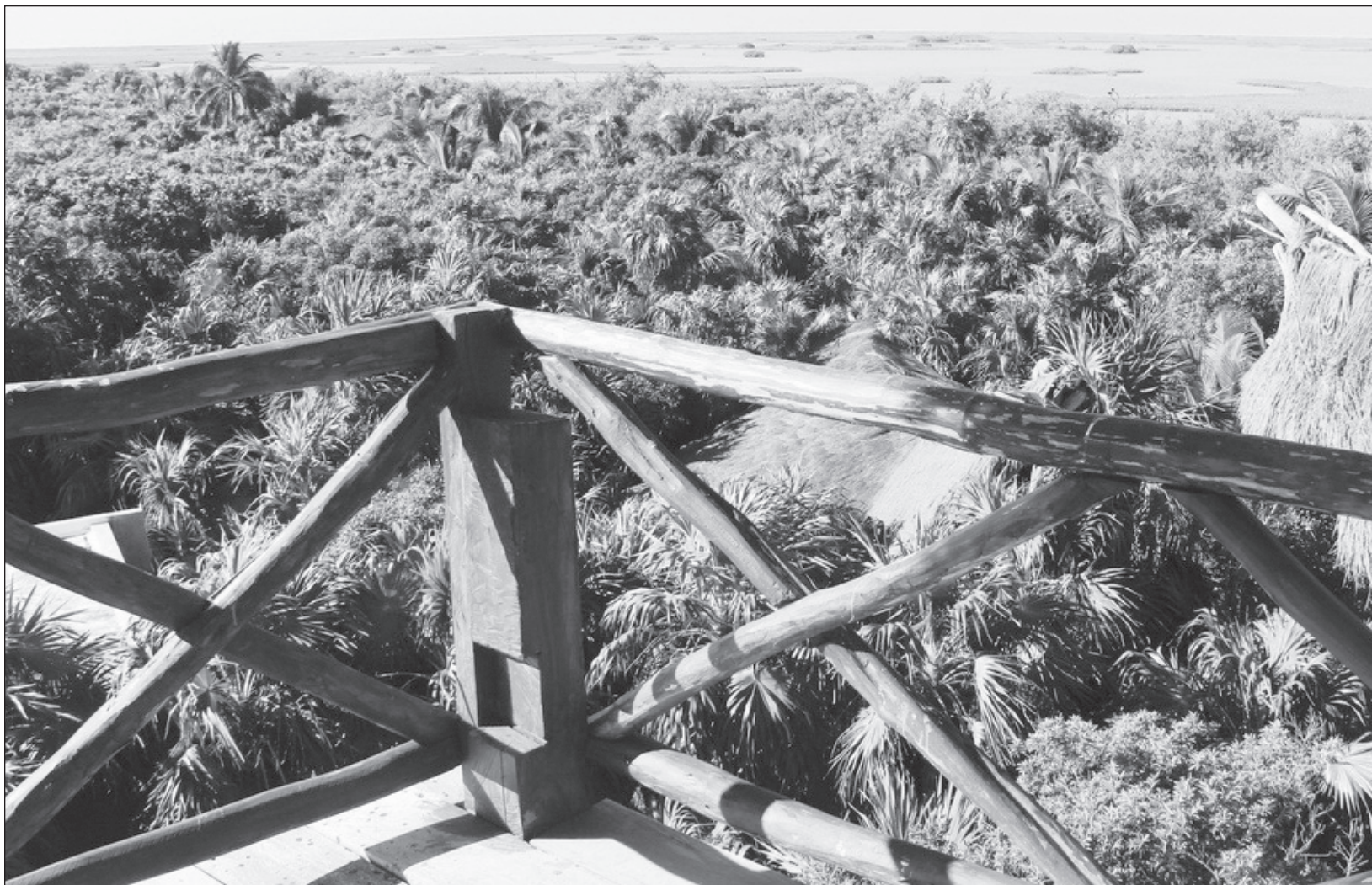
▲ Las autoridades ambientales de la península yucateca revisaron el proyecto de la ley forestal de Quintana Roo.

De las tareas iniciadas en la Ventana A quedan acciones por consolidar, a las que habrá que dar seguimiento y atención durante 2021. Resaltan como prioritarias: trabajar en los Programas de Ordenamiento Territorial Ecológico y de Desarrollo Urbano Sustentable y en las acciones para reducir el cambio de uso suelo.