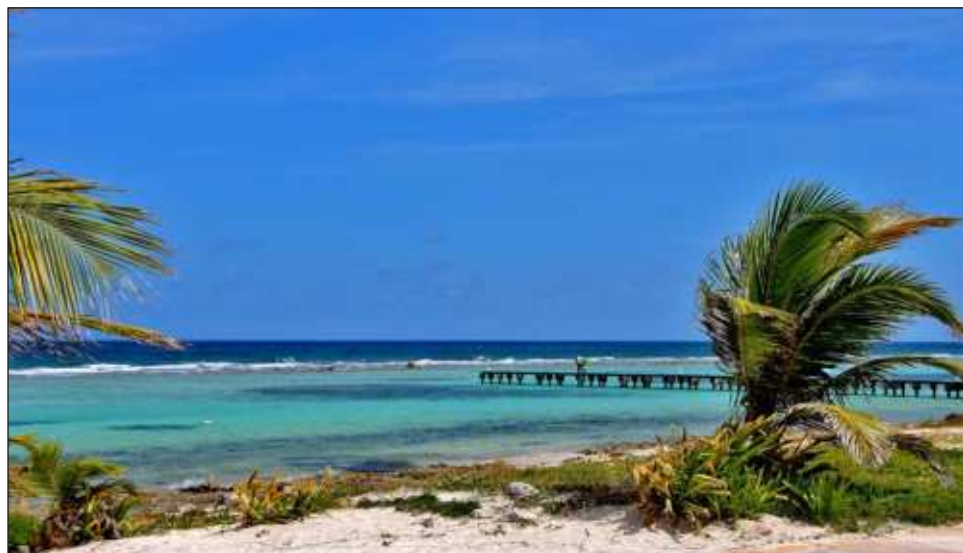
▲ La inversión también contempla una conexión directa a la estación de Limones, facilitando el acceso al Tren Maya y promoviendo visitas a destinos a lo largo del estado.

Añadió que en la Nueva Era del Caribe Mexicano