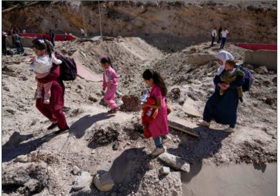
▲ Cifras emitidas por el coordinador humanitario de las Naciones Unidas para Líbano indican que del total de desplazados, al menos 150 mil son menores de edad.

“No atacamos a civiles. Pero al mismo tiempo, si descubrimos actividades de Hezbolá o la intención de lanzar cohetes contra Israel, haremos lo que cualquier otro país haría al respecto”, declaró el embajador de Israel ante la ONU, Danny Danon.