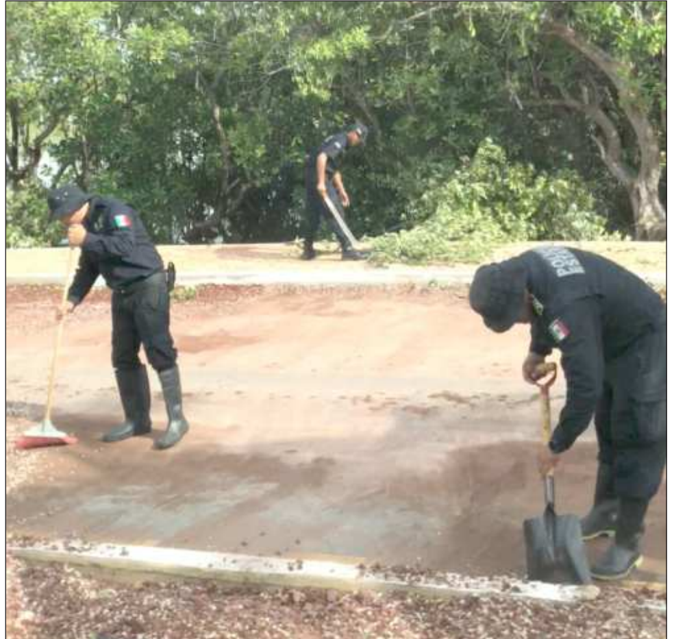
▲ En las zonas donde ya no hay agua, cuadrillas de elementos de la Secretaría de Seguridad Pública (SSP) han comenzado las labores de limpieza.

El mandatario también anunció que a partir de este jueves comenzará la brigada de limpieza para que entre todos se logre que Celestún vuelva a la normalidad muy pronto.