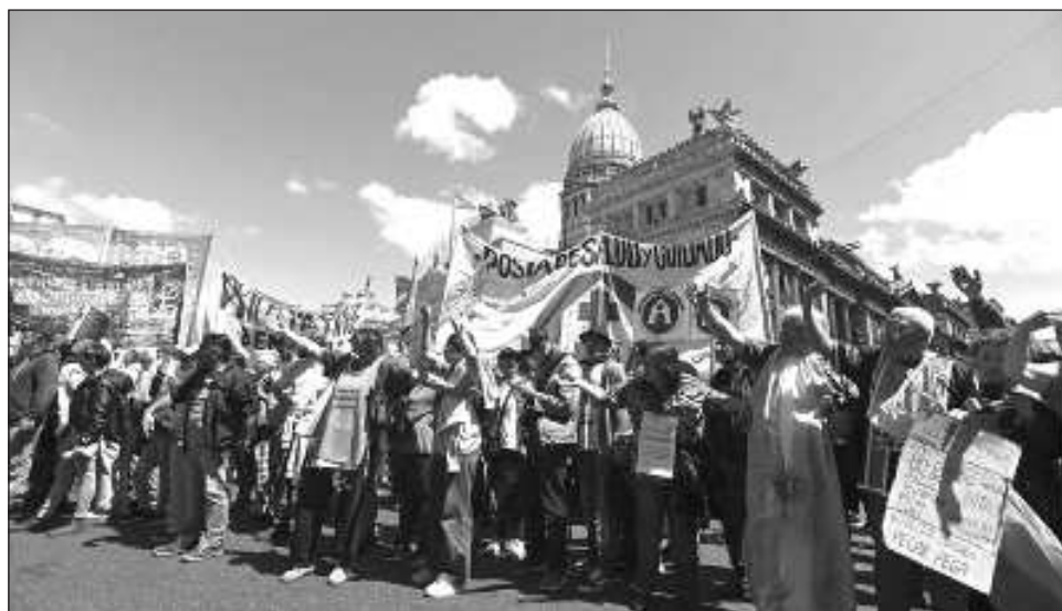
▲ El veto crispó los ánimos de la sociedad, que se movilizó en marchas multitudinarias para apoyar a los universitarios y contra el ajuste que golpea también otras áreas sensibles como la salud pública.

Cientos de manifestan- tes, muchos de ellos univer- sitarios, se concentraron