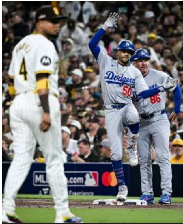
▲ Mookie Betts fue clave en el triunfo de Los Ángeles en San Diego el miércoles por la noche.

Inmediatamente después, en un camerino eufórico,