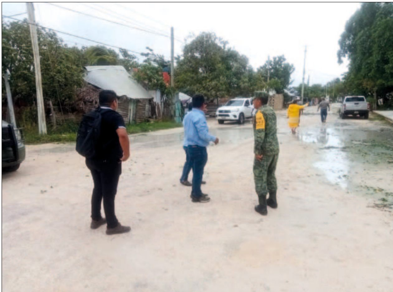
▲ La Sedena despliega el Plan DN-III-E para brindar apoyo en las zonas afectadas por el huracán Milton.

El alcalde paliceño manifestó su agradecimiento a la gobernadora Layda Elena Sansores San Román por su apoyo con los drones, y reiteró su entero respaldo y solidaridad a los familiares del menor.