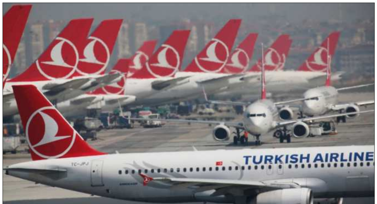
▲ Un piloto de 59 años de la compañía aérea turca Turkish Airlines falleció en pleno vuelo tras sufrir una descompensación, lo que llevó al avión a aterrizar de urgencia en Nueva York este miércoles, informó la aero-

línea. La aeronave, que partió de Seattle el martes por la noche, en la costa oeste de Estados Unidos, se dirigía a la ciudad turca de Estambul, indicó en X el portavoz de Turkish Airlines, Yahya Üstün.