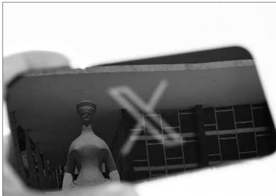
▲ Un juez del Supremo Tribunal Federal brasileño autorizó desbloqueo tras considerar que la plataforma había respondido a los requisitos judiciales.

Antes de ser autorizada a operar nuevamente, X tuvo que pagar multas por