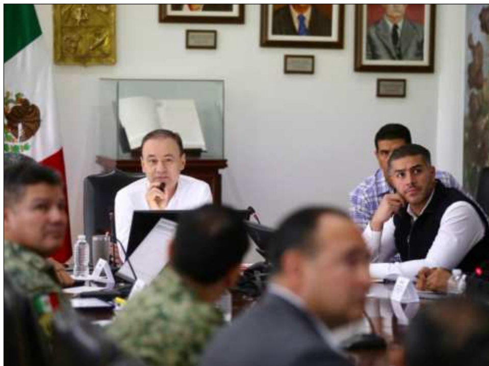
▲ El acuerdo se dio tras una reunión en el Palacio de Gobierno de Sonora encabezada por el gobernador del estado, Alfonso Durazo Montañó, con Omar García Harfuch.

La estrategia de Sheinbaum busca mejorar la coordinación entre los miembros del Gabinete de