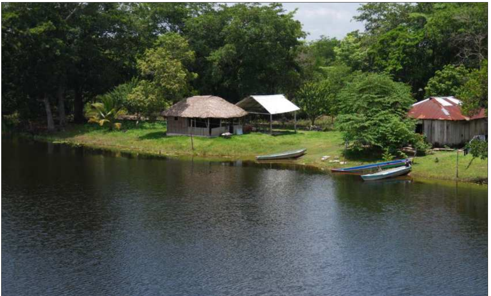
▲ Los afluentes de Champotón, Palizada y Candelaria incrementaron tras el paso del huracán Milton a principios de esta semana.

Los directivos revelaron que sólo esta boya sufrió daños, aunque se realizará una inspección a la red de balizamiento con que se cuenta.