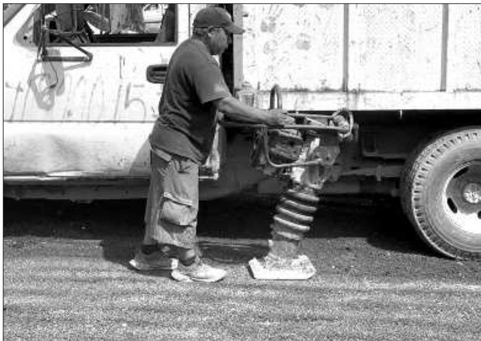
▲ La reparación forma parte de un programa de bacheo de la dirección general de Servicios Públicos que también incluye otras calles de la localidad.