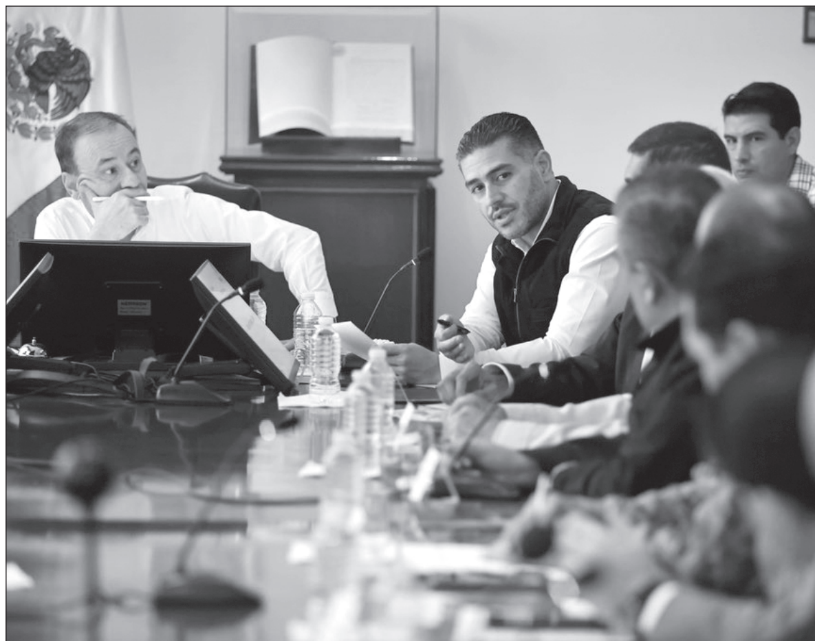
▲ “Fijó tres objetivos: 1) Disminución de la incidencia delictiva, principalmente de homicidios dolosos y delitos de alto impacto, como la extorsión. 2) Neutralizar generadores de violencia y redes criminales, con atención a zonas de alta incidencia, como Culiacán. 3) Fortalecer las capacidades de prevención y proximidad social de las policías locales en todo el país”.

LAS DIFERENCIAS QUE algunos buscan con impaciencia entre los presidentes Sheinbaum y López Obrador no van a encontrarlas en declaraciones rimbombantes de la Presidenta, sino en los hechos. “Despauzó” al embajador de Estados Unidos, Ken Salazar, a quien Andrés Manuel “pausó” porque andaba haciendo declaraciones injerentistas en el tema de la reforma judicial. Claudia dijo que el canciller Juan Ramón de la Fuente se reunirá con el diplomático en fecha próxima en el edificio de la Secretaría de Relaciones Exteriores (SRE), como corresponde. Ya había hecho ancho el camino a Palacio Nacional. Por su lado, el titular de la SRE, en su comparecencia en el Senado señaló las prioridades de la política exterior de México: “primero que nada y por arriba de cualquier otra, la defensa de la soberanía nacional. En este rubro, permí-