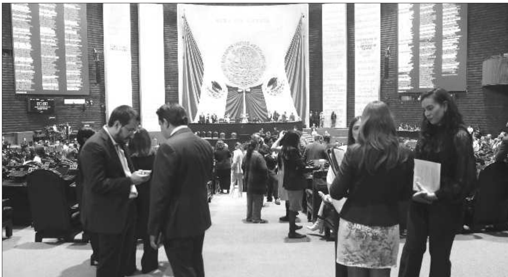
▲ La modificación al artículo 123 constitucional fue aprobada por los 124 senadores asistentes a la sesión tras una discusión de 5 horas