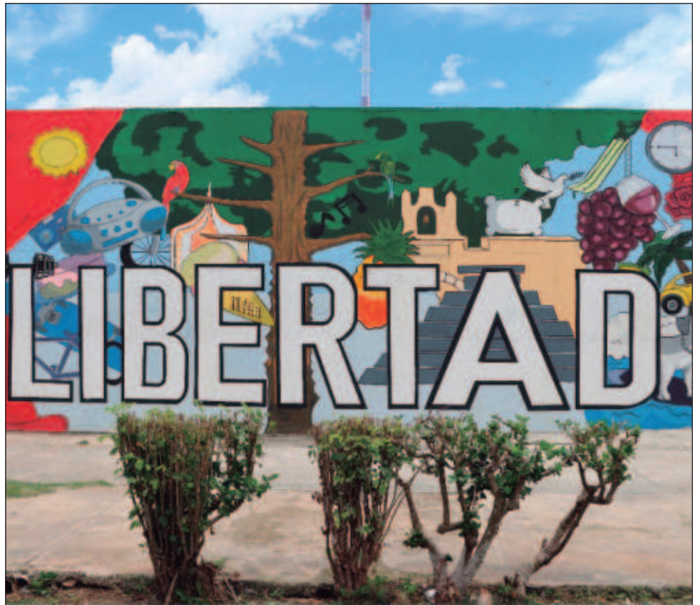
▲ Con 24 sesiones enfocadas en la autoestima, el autoconcepto y las relaciones interpersonales, el programa ofrece un espacio para el crecimiento personal.

Este curso de LSM ha permitido que las personas privadas de su libertad adquieran una herramienta fundamental para comunicarse con personas con discapacidad auditiva, contribuyendo no sólo a su reinserción social, sino también al fortalecimiento de una cultura de respeto. El proyecto también incluye un componente productivo, con actividades agrícolas y ganaderas.