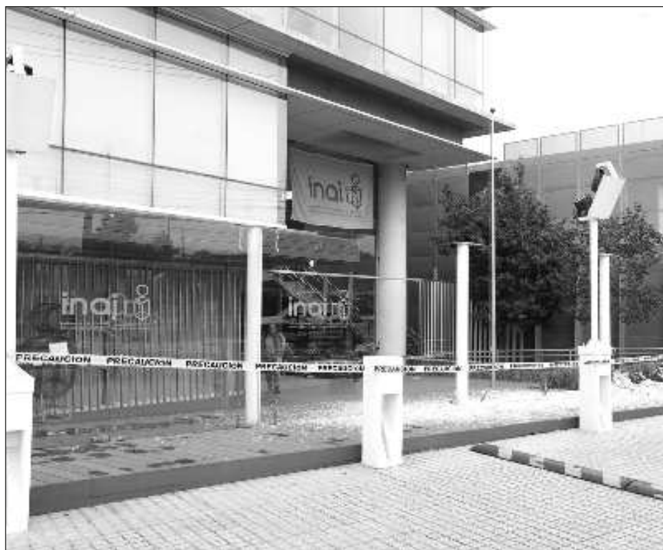
▲ Comisionada señala que hubo daños materiales, sin personas afectadas.

El Inai colaborará estrechamente con las autoridades para entregar la información necesaria que permita el esclarecimiento de los hechos.