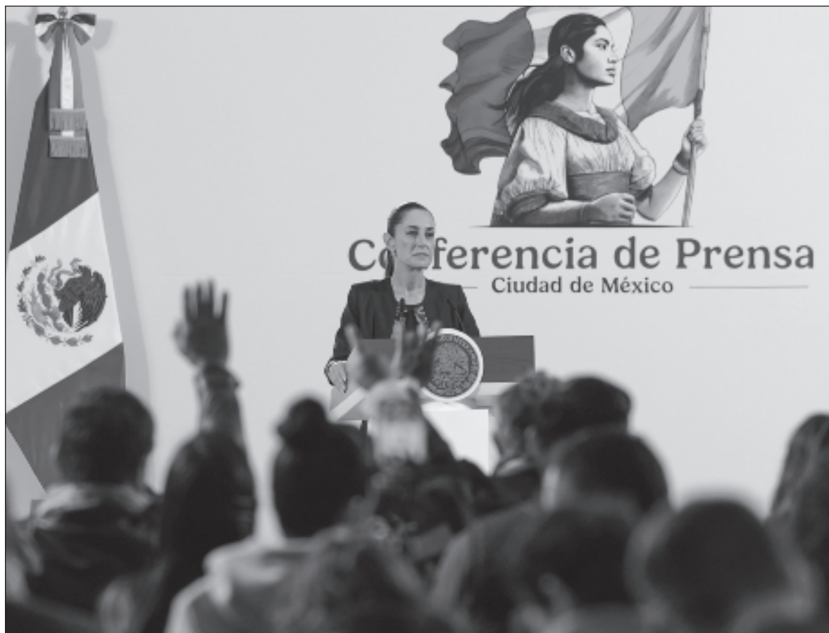
▲ “Mientras que a López Obrador con cada error se le consideraba más humano entre sus allegados y seguidores, para Sheinbaum será un constante recordatorio de que su equivocación se debió a que es mujer”.

Entonces, ¿que si me da gusto que una mujer sea presidenta? ¡Claro! ¿Que si creo que eso solucionará las problemáticas sociales que aquejan a las mujeres? Para nada. ¿Que si tendrá Sheinbaum la soltura para equivocarse durante su administración como lo hizo AMLO? También difiero; mientras que a López Obrador con cada error se le consideraba más humano entre sus allegados y seguidores, para Sheinbaum será un constante recordatorio de que su equivocación se debió a que es mujer. Y las mujeres tenemos el mismo derecho de equivocarnos en los espacios públicos como lo han hecho por siglos los hombres decapitando, violando derechos humanos, gestando guerras y bombardeando países.