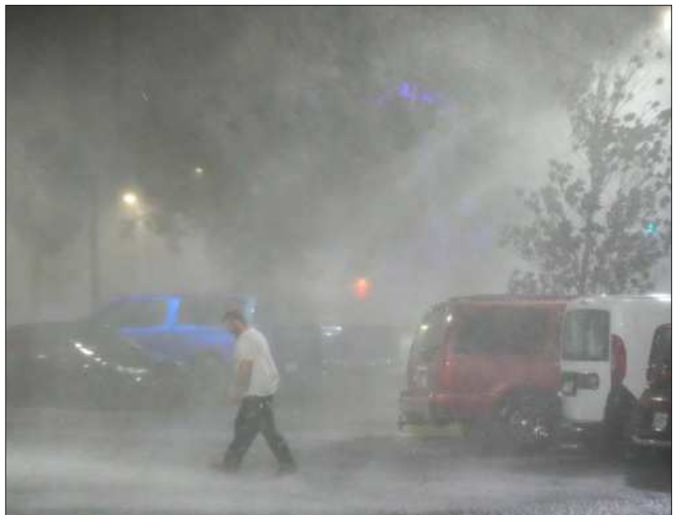
▲ El huracán Milton llegó el miércoles a Florida como tormenta de categoría 2, y azotó la costa con fuertes vientos, además de provocar una serie de tornados en todo el estado.

Milton azotó a una región de Florida que aún no se recupera del paso del huracán Helene, el cual provocó graves daños en comunidades costeras con marejadas ciclónicas que, tan sólo en el condado de Pinellas, causaron la muerte de una docena de personas.