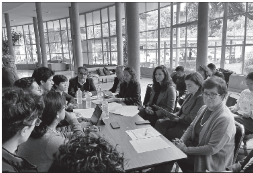
▲ En la reunión que sostuvo la secretaria de Cultura federal, Claudia Curiel, con estudiantes del conservatorio, se llegó al acuerdo de realizar comisiones de trabajo con representación para preparar una agenda conjunta y plan de acción.

En la reunión que sostuvo la secretaria de Cultura federal, Claudia Curiel de Icaza, con estudiantes del conservatorio, adonde acudió para atender la solicitud de los estudiantes y