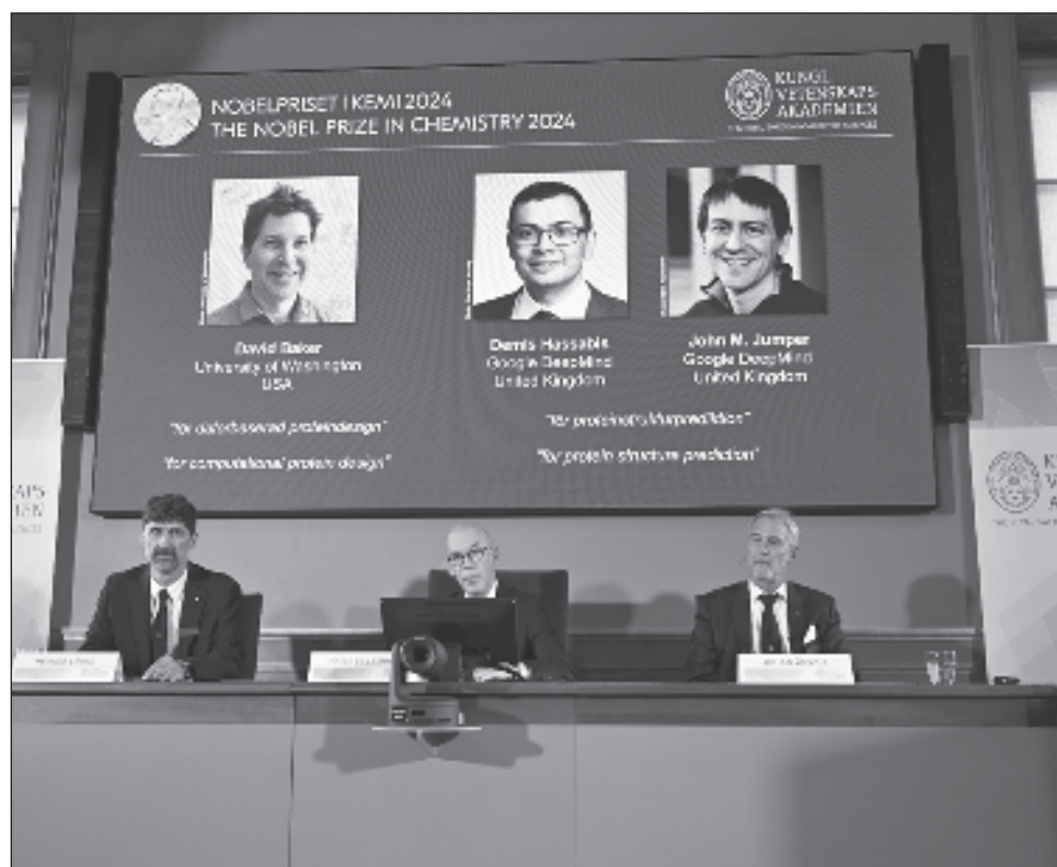
▲ El premio se concedió a David Baker, que trabaja en la Universidad de Washington, en Seattle, y a Demis Hassabis y John Jumper, que trabajan en Google Deepmind, un laboratorio británico-estadounidense de investigación de inteligencia artificial con sede en Londres.

"Las proteínas son las moléculas que permiten la vida. Las proteínas son las