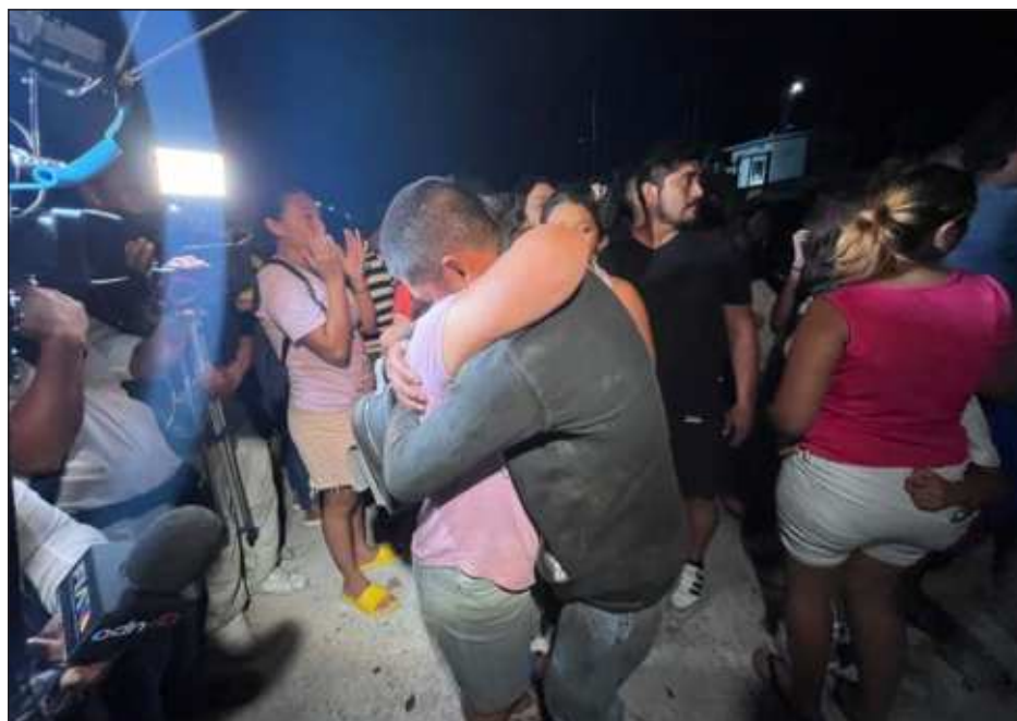
▲ Cientos de personas se reunieron para recibir a los tripulantes de Neldy , familiares, amigos y vecinos celebraron que los hombres hayan sido encontrados con vida y calificaron como un milagro el hecho de tenerlos nuevamente en casa.

Cientos de personas se dieron cita en el puerto de abrigo de Yucalpetén para recibir a los sobre-