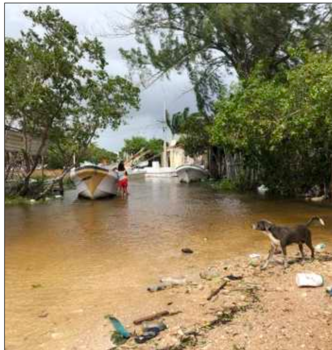
▲ Ahora es momento de que las autoridades coordinen la reparación de lo dañado y programen las siguientes medidas de prevención, y lo deseable es que exhorten a la población a participar en ellas.

La desaparición de pescadores terminó en un susto, y por los motivos que se quiera, lo importante es que no hay mayores pérdidas de vidas que lamentar. Lo que sí es cuestionable es que 1) una embarcación se haya encontrado en alta mar durante el paso del huracán; como si esto fuera garantía de que podrán capturar más pulpos, ahora que es temporada; y 2) que el rescate haya sido organizado y realizado por otros pescadores, sin contar con el permiso de la capitanía de puerto para salir, y menos con apoyo de las corporaciones de seguridad. Se entiende que existe un protocolo para seguridad de todos los par-