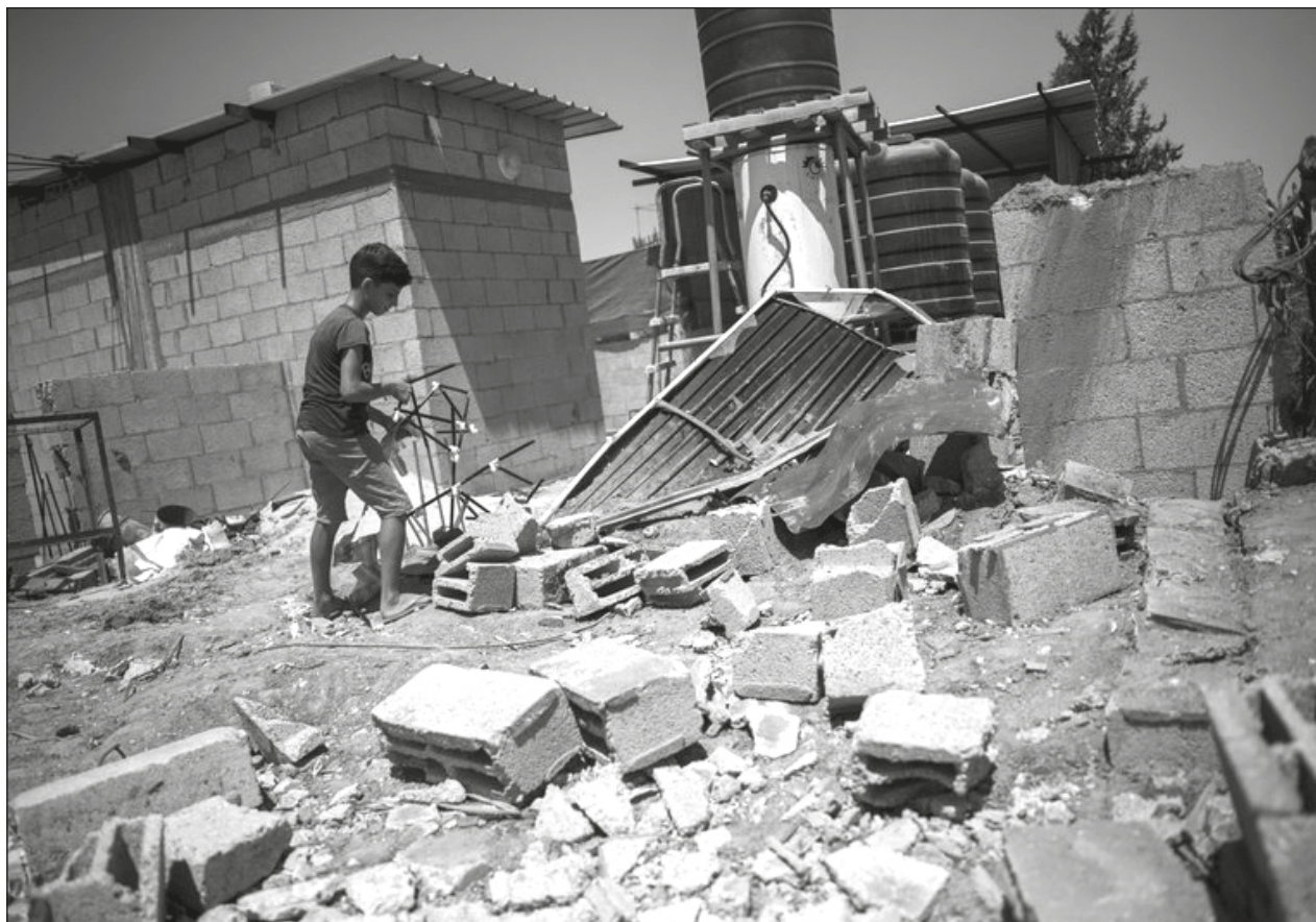
▲ Israel reabrió "por motivos humanitarios" su frontera con la franja de Gaza, anunció en un comunicado.

Se ha reportado que Hochstein fue luego a Israel y que viajará a Beirut en las próximas semanas con las respuestas israelíes a los reclamos libaneses.