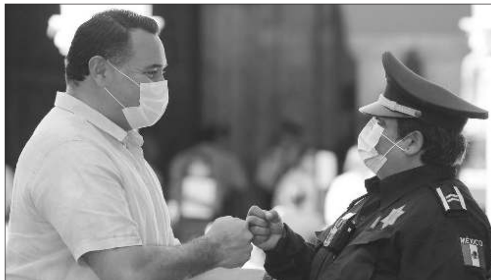
▲ Dentro de este programa de movilidad segura, el Municipio establece las bases para priorizar la seguridad de todas y todos en el uso de las vialidades.

"Nosotros trabajamos para fortalecer la cultura de la movilidad urbana sus-