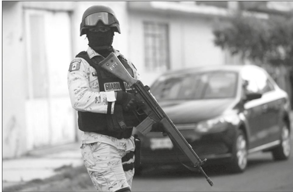
▲ El Presidente cree conveniente que la Guardia Nacional quede como una rama de la Sedena “para que se le dé estabilidad en el tiempo y no se corrompa”.

Durante su conferencia de prensa, el Presidente reconoció que no cuenta con la mayoría para aprobar una reforma constitucional pero se tiene la mayoría simple para aprobar la reforma legal y, en su caso, ante una eventual impugnación por una presunta inconstitucionalidad de esta decisión, se llegue a la Suprema Corte de la Justicia de la Nación. Refirió que será un mecanismo similar al que se utilizó con la