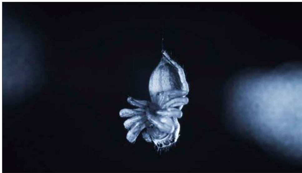
▲ Las imágenes de video que obtuvieron investigadores de la Universidad de Konstanz mostraron que las arañas saltadoras bebés experimentaban un estado similar al sueño REM.

Se ha demostrado que otros animales, incluidas algunas aves y mamíferos, experimentan el sueño REM. Pero las criaturas como la araña saltadora no han recibido tanta atención, por lo que no se sabía si tenían