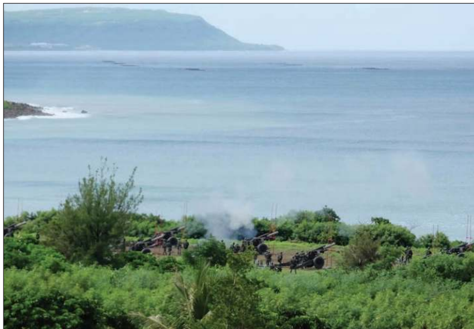
▲ El ministro taiwanés de Exteriores Joseph Wu dijo que Beijing aspira a dominar el Pacífico Occidental y anexionarse Taiwán, que reclama como su propio territorio.

China dijo que sus maniobras respondían a la visita a la isla de la presidente de la Cámara de Representantes de Estados Unidos, Nancy Pelosi, la semana pasada. Sin embargo, Wu afirmó que China utilizaba