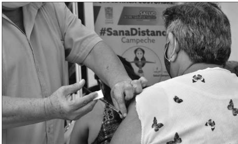
▲ La dependencia también dio a conocer ayer las fechas en que se aplicarán las dosis para todos los sectores de población que hayan quedado rezagados en la vacunación

Destacó que en el municipio del Carmen se tuvo una gran participación por parte de los padres de familia, los cuales acudieron