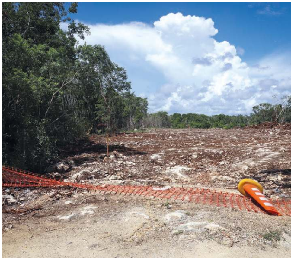
▲ Los cinco juicios de amparo en contra de la construcción de los tramos 5 y 6 del Tren Maya han sido resueltos a favor la continuación de la obra.

La suspensión también es en contra la orden verbal de Fonatur Tren Maya S. A. de C. V., para el desmonte de la selva ubicada a lo largo y ancho del tramo 5 del Proyecto Tren Maya, así como la omisión de llevar a cabo el procedimiento de Evaluación de Impacto Ambiental contemplado por la ley.