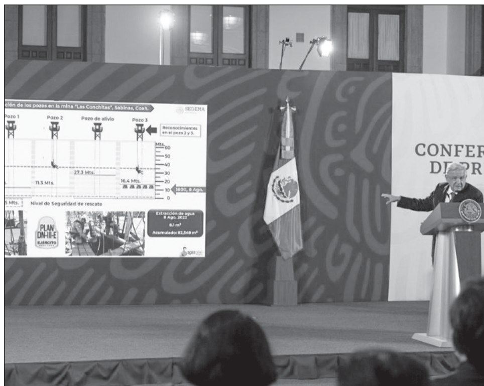
▲ El Presidente informó que faltan por bombear 16.3 metros de agua para que se generen las condiciones propicias para el ingreso de los rescatistas.

Velázquez mencionó que son ya 134 horas de trabajo ininterrumpido desde que se registró el siniestro, subrayando que hoy se continuarán abocando a extraer el agua. El reporte hasta las 18 horas de ayer era que aún falta en el Polk dos bomberos pozo dos 10.4 metros, en el pozo 3, 11.3 metros y en el Pozo 4 pozo 16.4 metros".