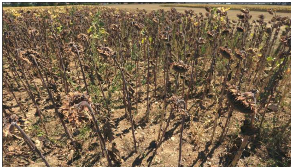
▲ La Organización Meteorológica Mundial advirtió que, además de la canícula, algunas regiones del mundo están experimentando sequías severas; la peor de ellas en Francia.

“Pero la diferencia entre estos tres meses es realmente muy pequeña”, dijo Nullis. “La desviación es me-