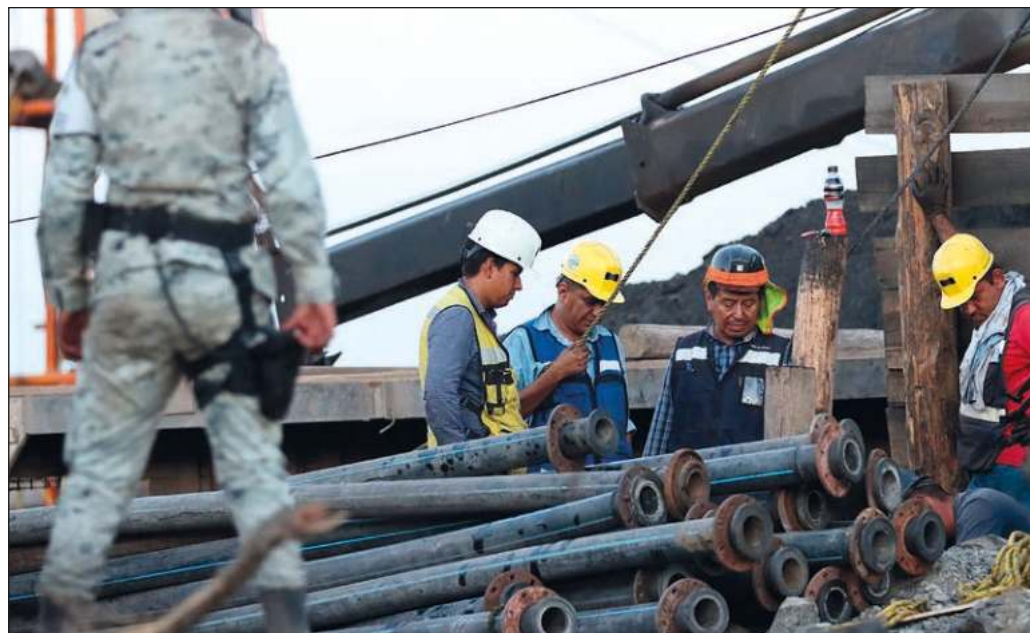
▲ En el caso de El Pinabete, no debe perderse de vista que el accidente habría podido ser evitado si en la explotación carbonífera se hubieran observado reglas de seguridad más estrictas.

Y en lo inmediato, cabe esperar que los trabajadores atrapados en el socavón de El Pinabete puedan ser devueltos sanos y salvos a sus familias.