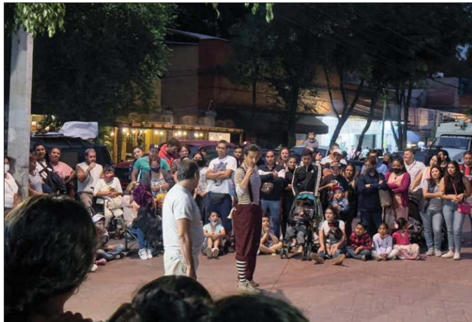
▲ El proyecto de ley busca dirigirse especialmente a los eventos de iniciativa independiente, para que puedan realizarse con el respaldo de un marco legal más plural.

“El interés nuestro es prestar atención a todas aquellas manifestaciones que han estado relegadas, no incluidas y que son más pequeñas, que van respondiendo a otras realidades”, explicó la diputada. “Digamos que esta perspectiva que estamos promoviendo, o que vamos a empezar a construir, no necesariamente quita mayor cosa de las garantías que tiene esta norma para los espectáculos