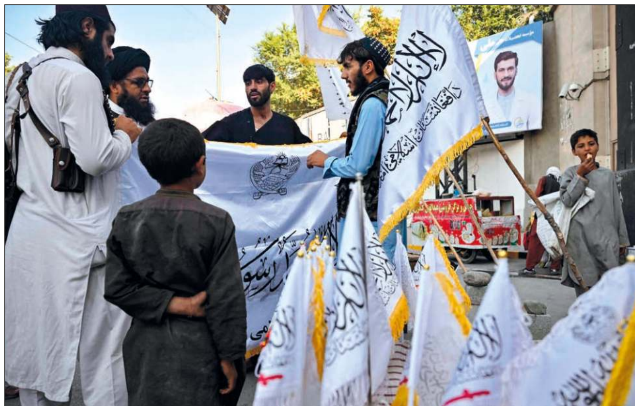
▲ Muchos de los talibanes aseguran que por primera vez en décadas, todo el territorio de Afganistán es seguro.

“Yo soy militar y puedo decir que ningún afgano es