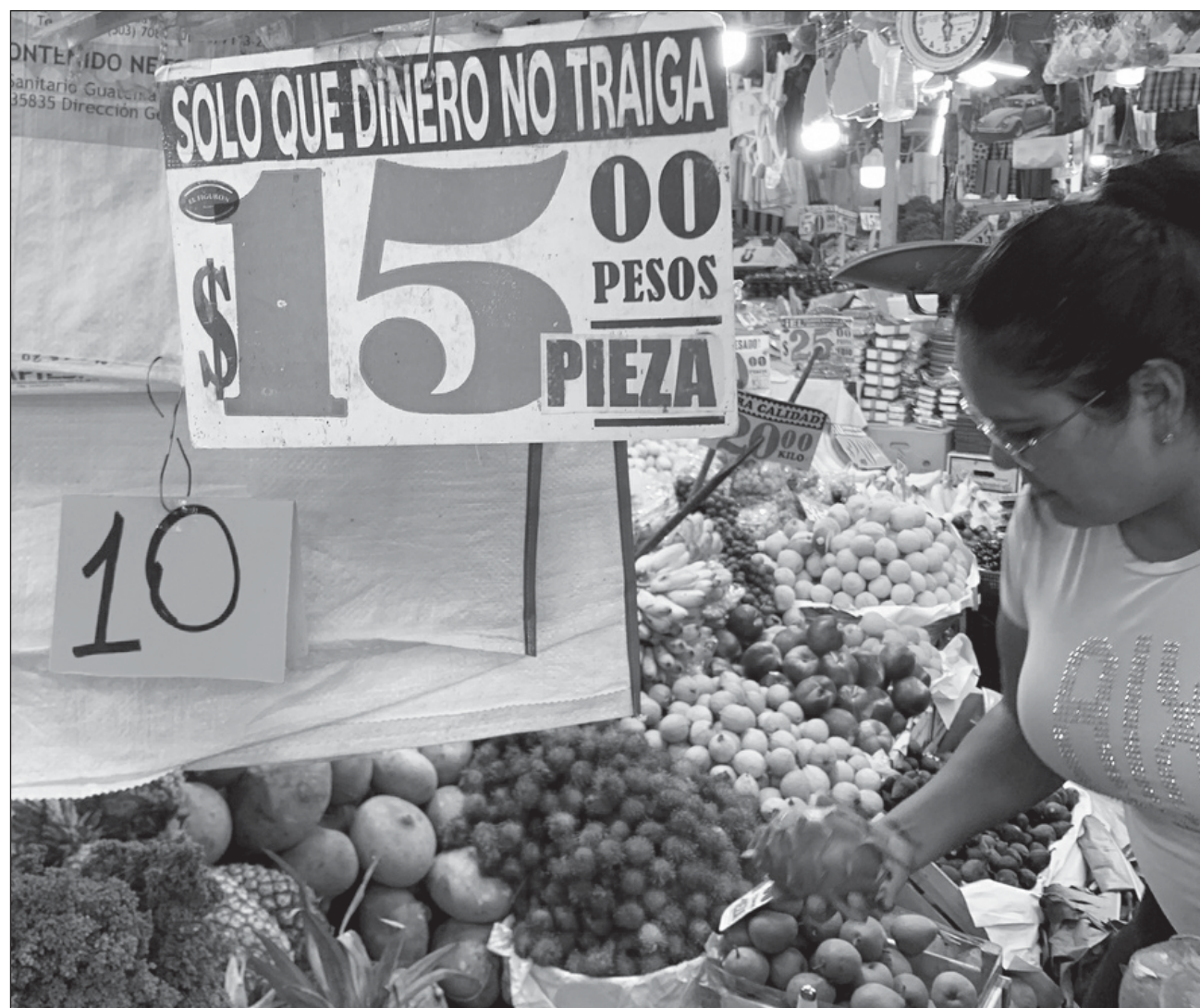
▲ La presión sobre los precios al consumidor en México proviene de productos indispensables, como alimentos.

En los últimos 12 meses, la presión sobre los precios