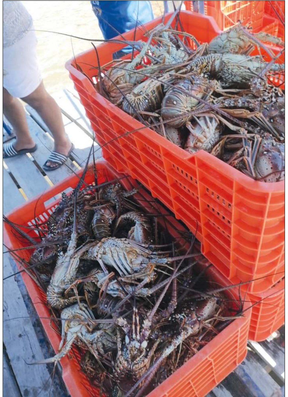
▲ Pese a que las condiciones climatológicas han favorecido a la práctica pesquera, los hombres de mar no se confían, reveló la cooperativa Vigía Chico.

"Hasta ahora estamos registrando un cuarto de la meta de 100 toneladas, y también estamos vendiendo el kilo a un precio muy bueno para los más de 70 socios. Ahora nos conviene pescar y vender la langosta entera y viva porque el peso completo es más redituable", acotó.