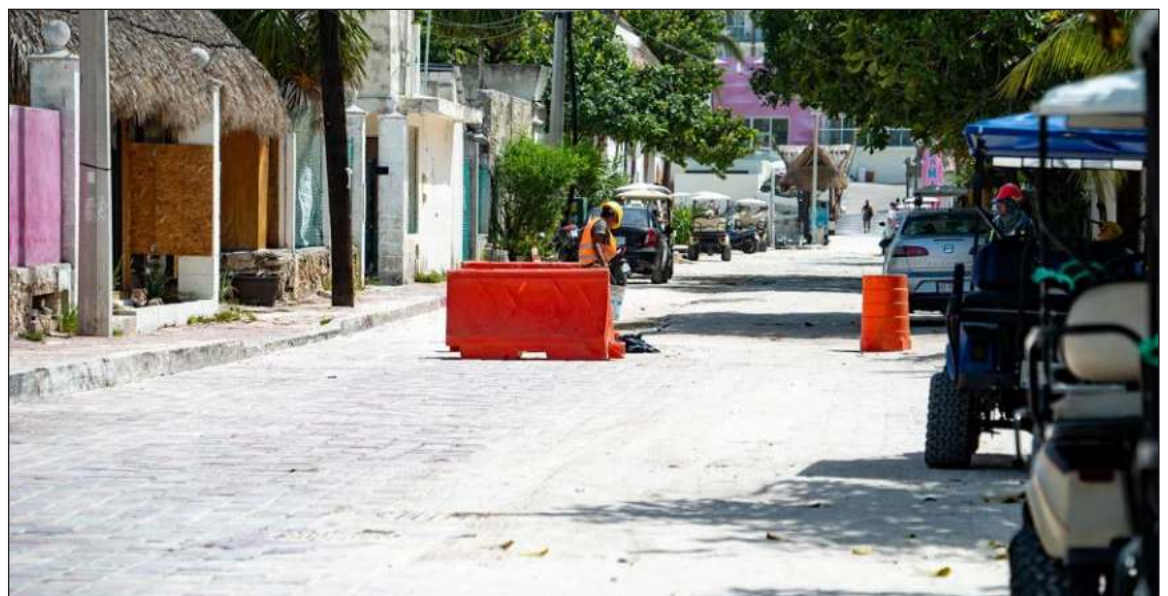
▲ La inversión en infraestructura que realiza Aguakan, que rebasa los 5 millones de pesos, evitará rebosamientos y garantizará el ciclo 360 al sanear el agua y regresarla totalmente limpia al ambiente.

A la par, con una inversión superior a los 5 millones de pesos, se trabaja en la construcción y puesta en operación de un nuevo cárcamo de aguas residuales en la zona del centro Convenciones, el cual tendrá la función de recibir y bombear las aguas residuales, lo que permitirá la