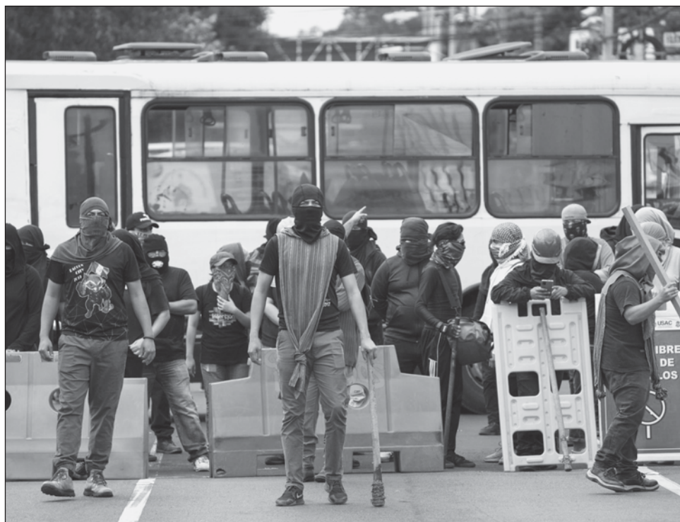
▲ En los primeros meses de 2022, la fiscalía dirigida por Porrás llevó ante la justicia a tres personas que se manifestaron contra el gobierno en 2020 tras acusarlas de daños al patrimonio.

Diversos gobiernos y entidades -entre ellos Estados Unidos, la Unión Europea, la Comisión Interamericana de Derechos Humanos y Human Rights Watch- han manifestado su alarma por el debilitamiento del estado