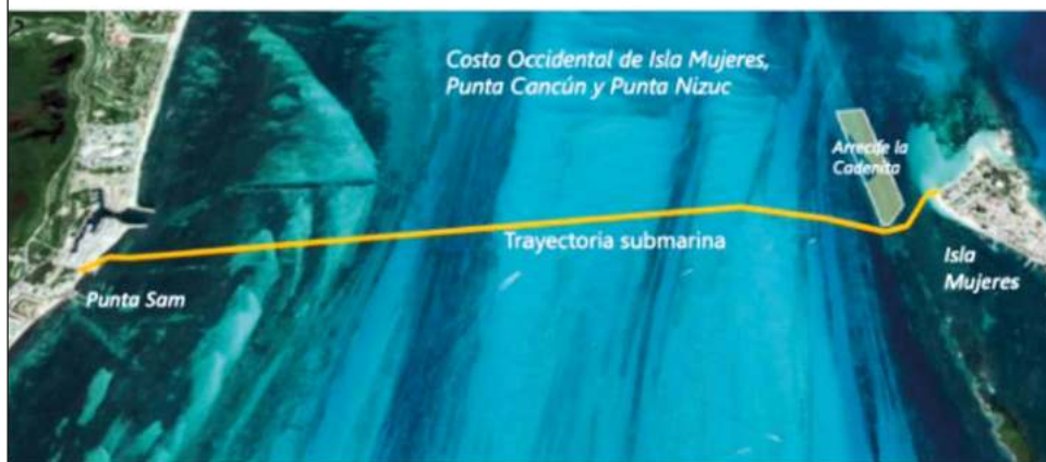
▲ Actualmente el municipio de Isla Mujeres recibe la energía eléctrica desde Cancún a través de cables submarinos de 34 mil 500 volts, instalados en el año de 1989.

que en la seguridad y respeto al ecosistema del lugar. Se cuenta con los permisos ambientales necesarios, lo que permite mantener un balance ecológico, con la respectiva seguridad de los cables submarinos, arrecifes y personas en general", aseguró la paraestatal.