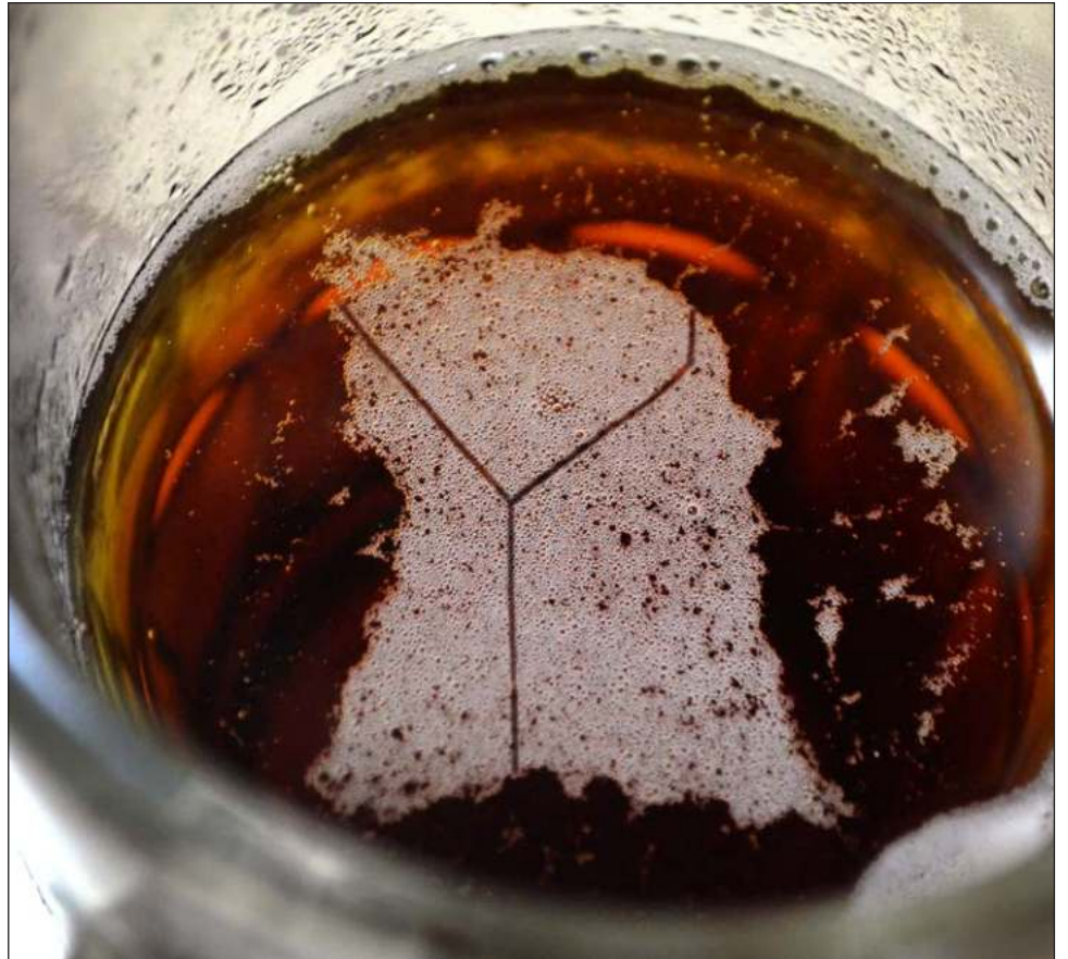
▲ Expertos señalaron que hay desequilibrio ecológico ocasionado por la empresa que extrae el agua dulce, sumado al turismo descontrolado que exigen grandes cantidades de líquido.

Aunado a esto, añadió, si se extrae mucha agua para hacer cerveza, se corre el riesgo extraer toda el agua salada y provocar la salinización de manera artificial.