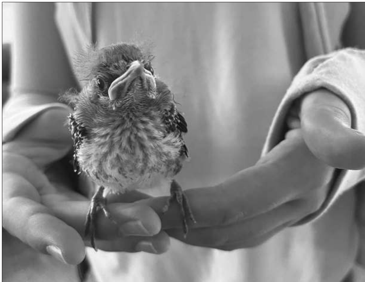
▲ “El pajarito pierde en ese diluvio sus primeras plumas, y queda desnudo, como al eclosionar; el instante le arrebató el futuro y lo repliega al pasado. Tiembla de frío y de miedo; titiritita de soledad. La tormenta dura una eternidad, su desamparo es inmenso; lo superlativo se adueña de ese ser minúsculo”.

Permanece inmóvil, en esa lucha primigenia entre dejarse llevar o ir contracorriente. El pajarito opta por lo último, y apuesta sus últimas energías a seguir con vida. Y lo logra, con ayuda. Unas manos en cuenco se transforman en nido portátil, y él, sin pensarlo dos veces, acepta la invitación y brinca hacia ellas, que con movimientos vertiginosos lo llevan a otro sitio, más seco, menos brillante. Del nido hecho con dedos pasa a una caja de cartón, con