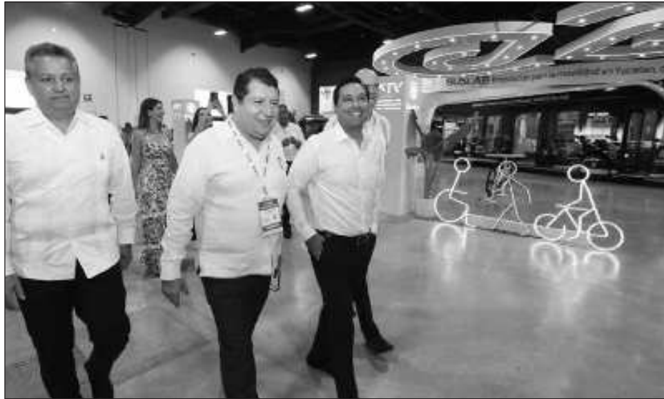
▲ Al inaugurar el encuentro, el gobernador Mauricio Vila llamó a aprovechar estos tres días para regresar a casa con una visión más amplia del desarrollo sostenible.

Se trata de un evento organizado por Pronus y enca-