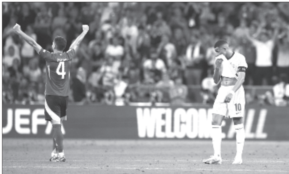
▲ Kylian Mbappé se lamenta mientras Nacho festeja tras la semifinal en Múnich.

España, que busca un cuarto título de la Euro, jugará contra Países Bajos o Inglaterra en la final en Berlín