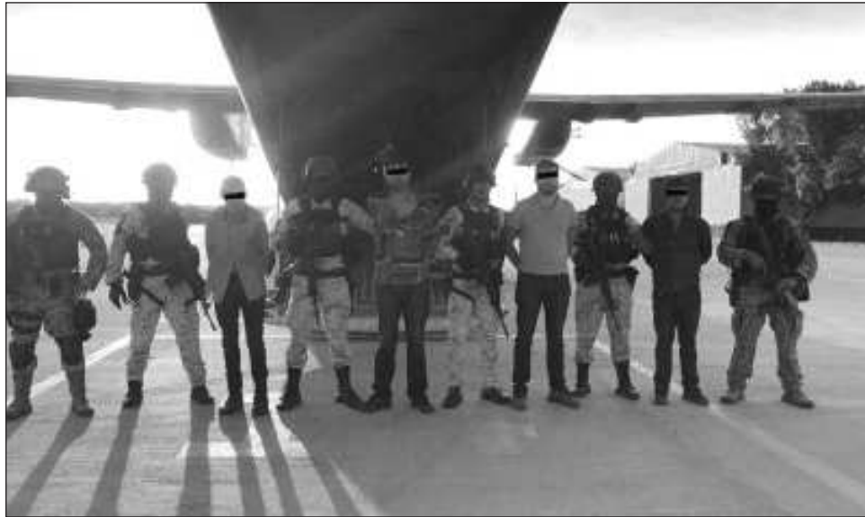
▲ Los datos proporcionados por la Sedena señalan que El R-8 era el encargado de la coordinación de la seguridad y la adquisición del equipo táctico y armamento del hermano de El Chapo .

Luis N es identificado por las autoridades federales como integrante del primer círculo de seguridad de Aureliano Guzmán Loera, líder del grupo conocido como