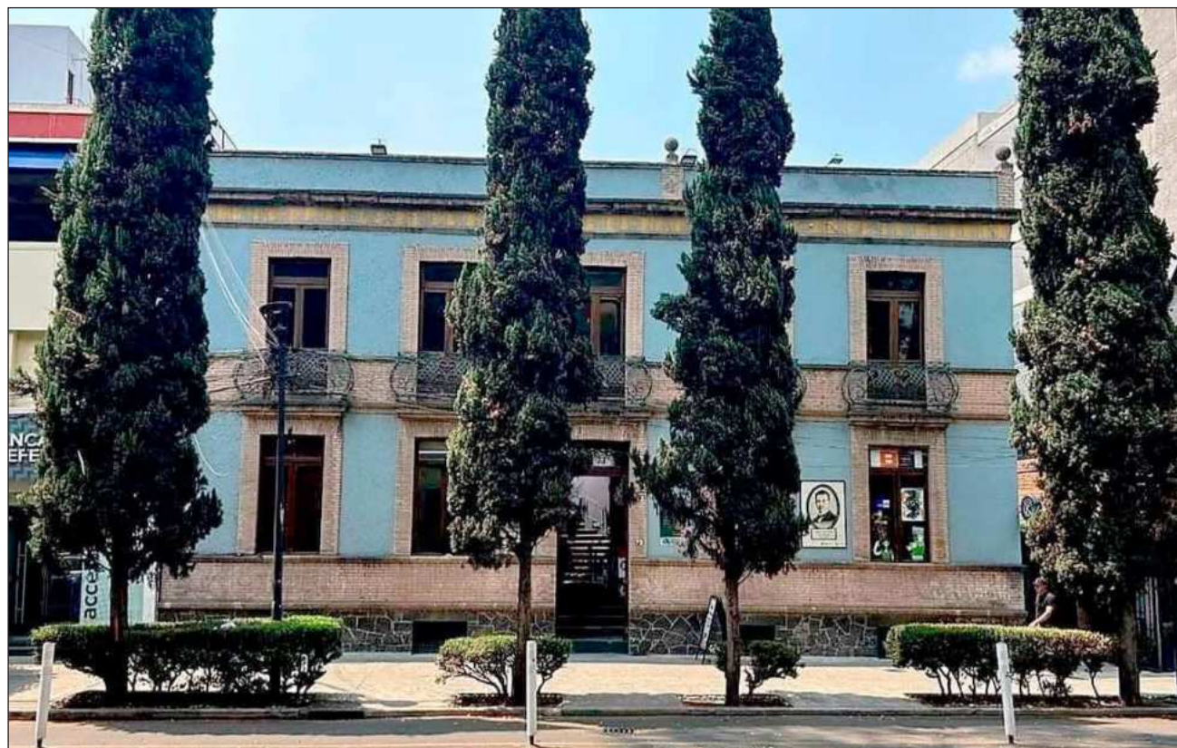
▲ Suárez explicó que los vecinos no tienen inconveniente en enriquecer la propuesta cultural con nuevos movimientos, a meter las lenguas y hablar de lo afro, pero el nombre de cabaret no es bien recibido por ellos.

El asesor recordó que Casa del Poeta, inaugurada en 1991, fue el primer centro cultural en la avenida Álvaro Obregón, lo cual lo hace fundamental en la zona. El predio fue expropiado para