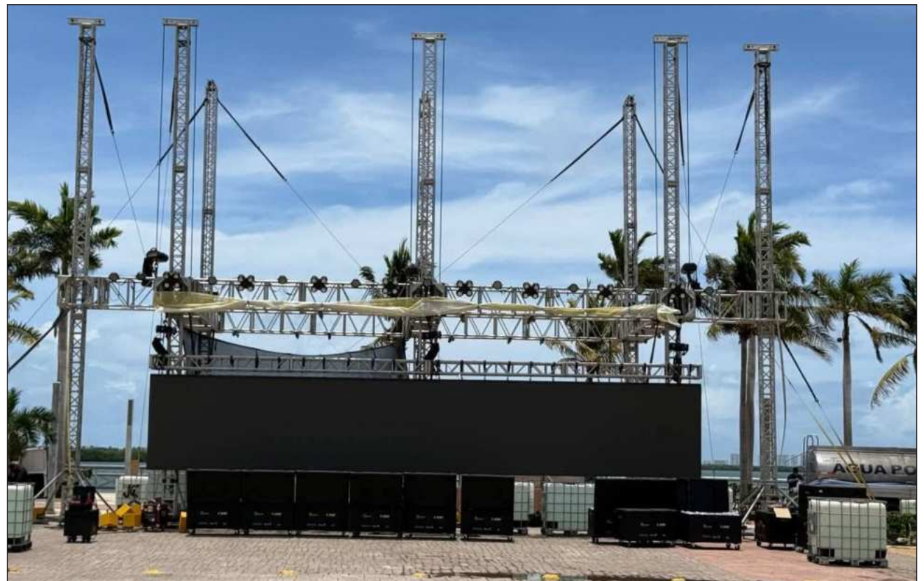
▲ La transmisión de partidos también se realizará en los municipios de Bacalar, Tulum, Cozumel e Isla Mujeres. En total serán 50 partidos, de los 104 que tendrá el Mundial, los que podrán verse gratuitamente en el Caribe Mexicano

La transmisión de partidos también se realizará en