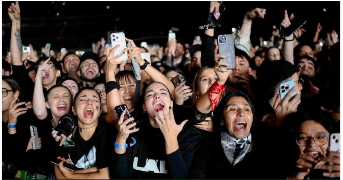
▲ Los especialistas afirman que los tapones para los oídos solo reducen el volumen, no lo apagan. Y cada vez más jóvenes los están adoptando, dando un paso sencillo para proteger sus oídos de cara a muchos conciertos más.