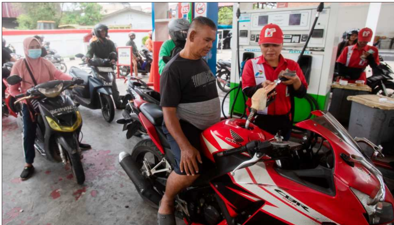
▲ El próximo presidente de las negociaciones de la COP31 declaró que la nueva preocupación en torno al suministro mundial de combustible, a medida que Irán e Israel lanzan nuevos ataques, solo "demuestra los riesgos" de la dependencia de los combustibles fósiles.

"La buena noticia es que la respuesta a la crisis