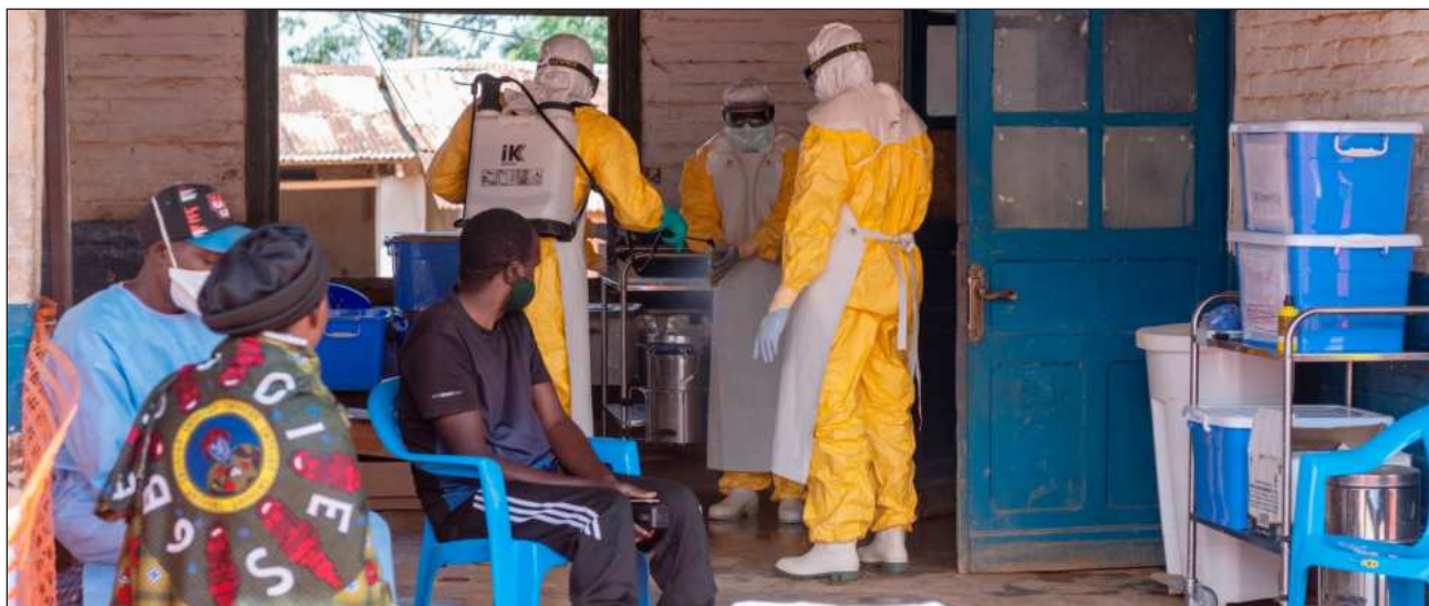
▲ Trabajadores sanitarios de primera línea, con escasos salarios y horas de descanso, han sido atacados varias veces por residentes enojados y no han podido llegar a algunas comunidades aisladas por el conflicto con rebeldes armados.

El brote se concentra en la provincia oriental de Ituri, que representa 90% de casos