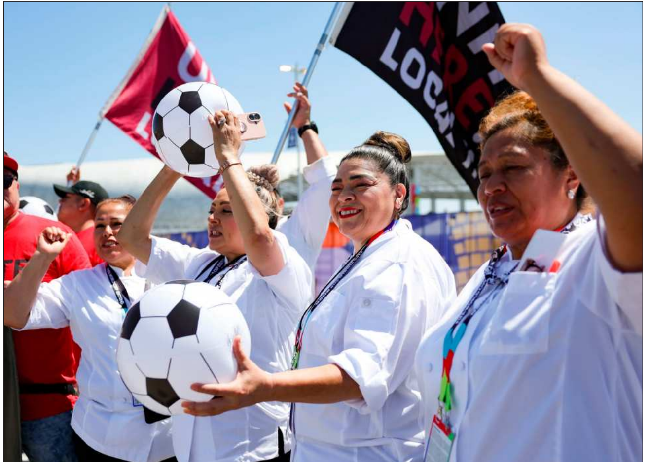
▲ El sindicato UNITE HERE Local 11 representa a 2 mil cantineros, meseros, cocineros y lavaplatos del SoFi Stadium.

Los trabajadores representados por UNITE HERE Local 11 manifestaron que buscaban aumentos salariales, protecciones frente a la subcontratación y seguridad laboral en medio del incremento de la aplicación de las leyes migratorias bajo