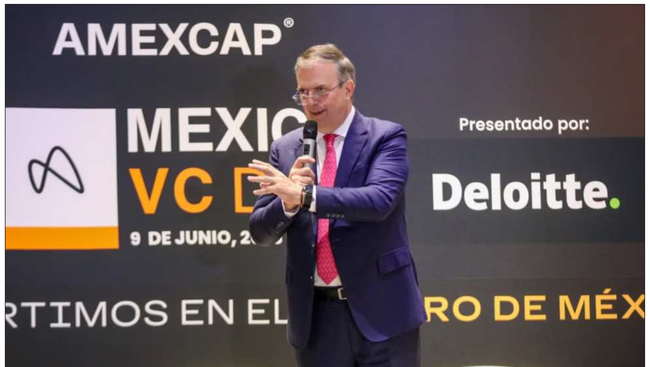
▲ El funcionario explicó que México paga actualmente un arancel de alrededor de 3.6% para ingresar al mercado de EU, mientras que sus competidores más dinámicos enfrentan tasas considerablemente más altas.

Ebrard dijo que la política comercial de Washington generará condiciones para que México crezca