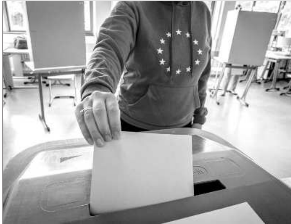
▲ La elección de los 720 diputados del Parlamento Europeo abre un nuevo ciclo en la UE, y los nuevos legisladores designarán al nuevo presidente de la Comisión Europea.

La elección de los 720 diputados del Parlamento Europeo abre un nuevo ciclo en la UE, y los nuevos legisladores designarán al nuevo presidente de la Comisión Europea, el brazo ejecutivo del bloque.