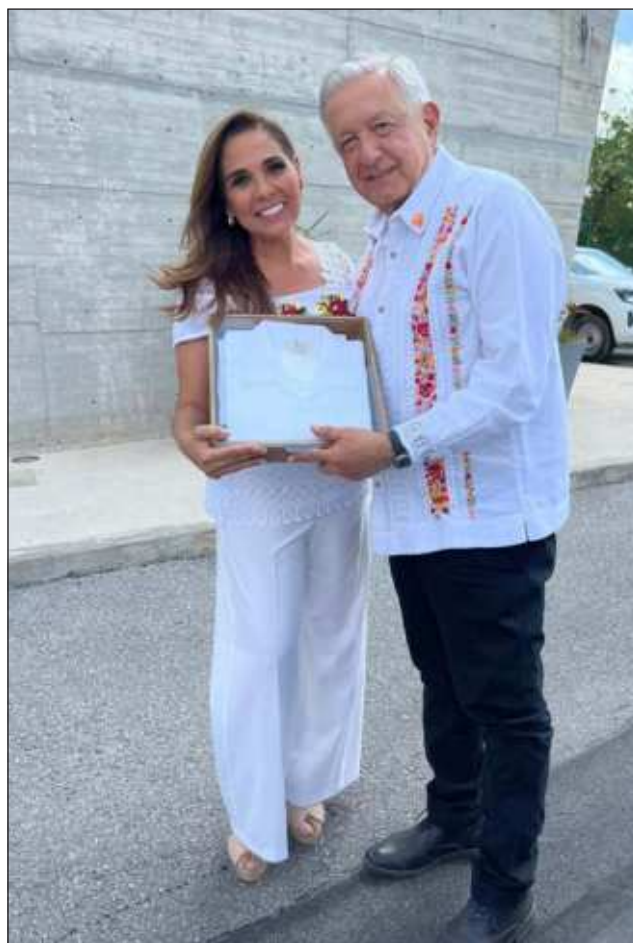
▲ Sobre el proceso electoral del pasado 2 de junio, el Presidente señaló que “se volvió a demostrar que el pueblo es bueno, es generoso, no es malagradecido”.

Sobre la virtual presidenta electa de México, dijo: “Claudia hasta a mí me cepilló, 36 millones de votos (de diferencia entre ambos) la primera mujer presidenta en 200 años del México independiente, además bien merecido porque es una mujer trabajadora, muy inteligente y honesta. Va a ayudar a todos, va a ayudar mucho a las mujeres”.