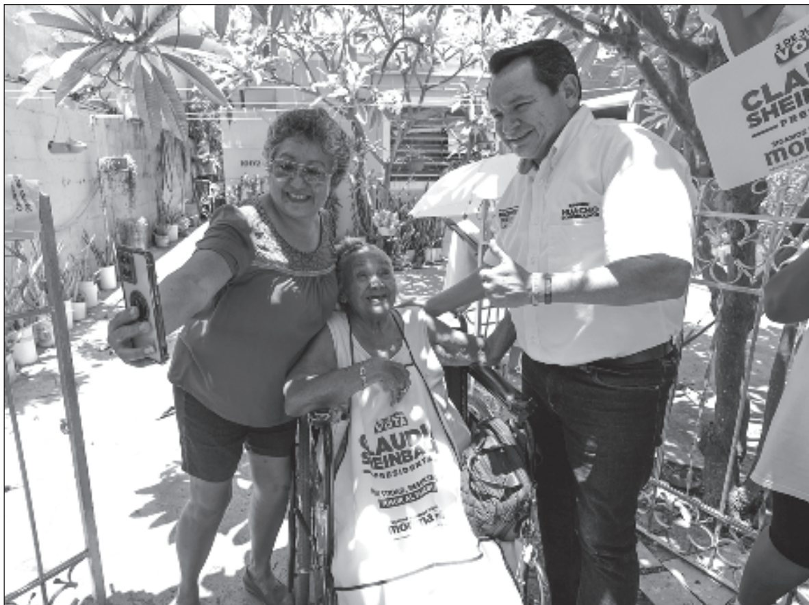
▲ "Decidió no concentrarse en la Blanca Mérida que se sabe es fiel panista, tampoco la olvidó, pero no la priorizó, se concentró en donde sabía podía ganar. Para el caso de Mérida, era oriente y sur profundo".

LO MISMO OCURRE a nivel de resultados locales; respecto a los diputados, Morena obtendría entre 14 y 16 diputados de mayoría contra 3 o 4 del PAN y 1 o 2 del PRI. Sin tener número claros aún se vislumbra que, salvo la capital, Mérida y algunos municipios aledaños, el resto del estado se pintará de color guinda. Vale la pena preguntarse ¿Qué pasó con el voto diferenciado y sofisticado que suele tener Yucatán? ¿Cómo es que el gobernador mejor evaluado del país, Mauricio Vila, pierda el estado? Desde el ORGA Podemos ofrecer una visión parcial de lo que hemos seguido en estos últimos cuatro años.