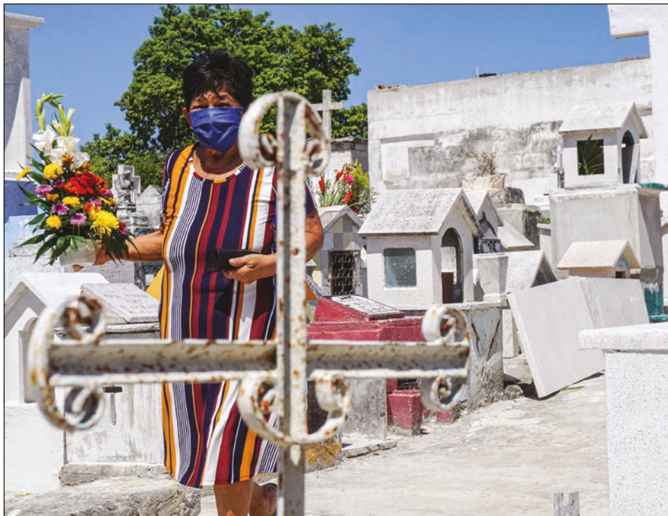
La recomendación a los meridianos es realizar visitas rápidas.

Se espera una afluencia máxima de 10 mil personas en total en ambos días en los diversos panteones de la ciudad. En el caso del Cementerio General se espera que acudan entre 3 mil y 5 mil personas.