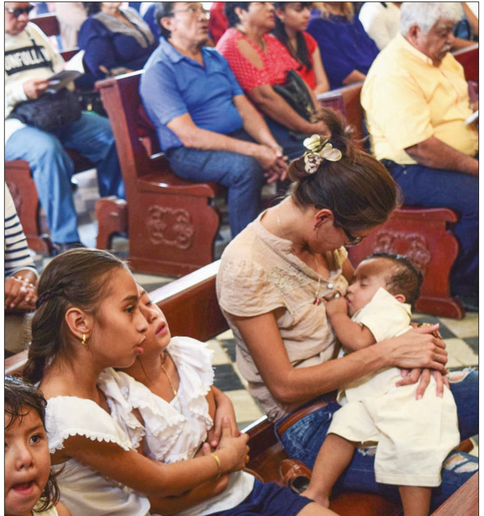
En 2020, siete de cada 10 mujeres mayores de 15 años dijo tener al menos un hijo nacido vivo.

Destacó que el rezago educativo en las madres que hablan lengua indígena es evidente, pues casi tres de cada 10 mujeres de esos grupos no tiene escolaridad, 62 por ciento curso preescolar, primaria o secundaria, 8 por ciento tiene algún grado aprobado en el nivel medio superior.