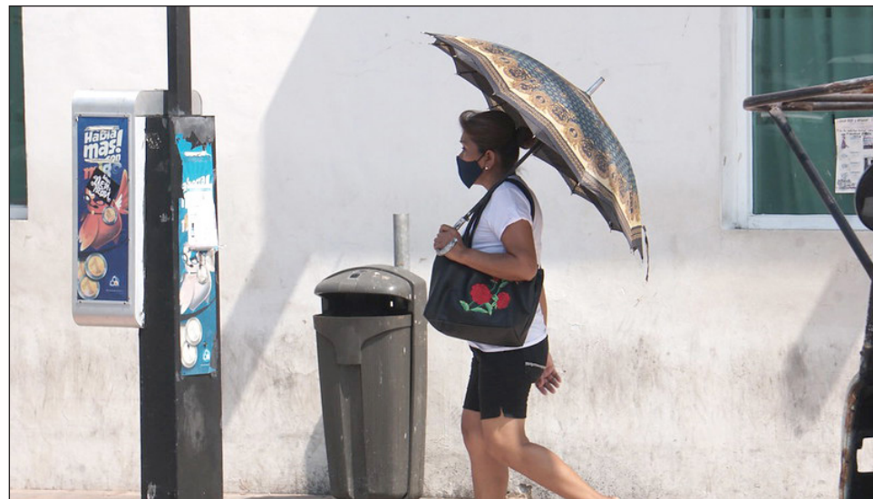
▲ En Mérida se han diagnosticado 23 mil 979 personas contagiadas de Covid-19.

Lamentablemente, este domingo se reportaron