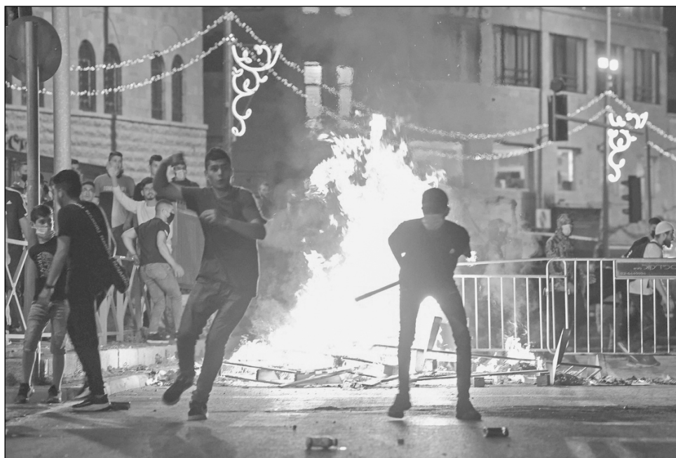
▲ Vive Jerusalén la peor turbulencia de los últimos años.