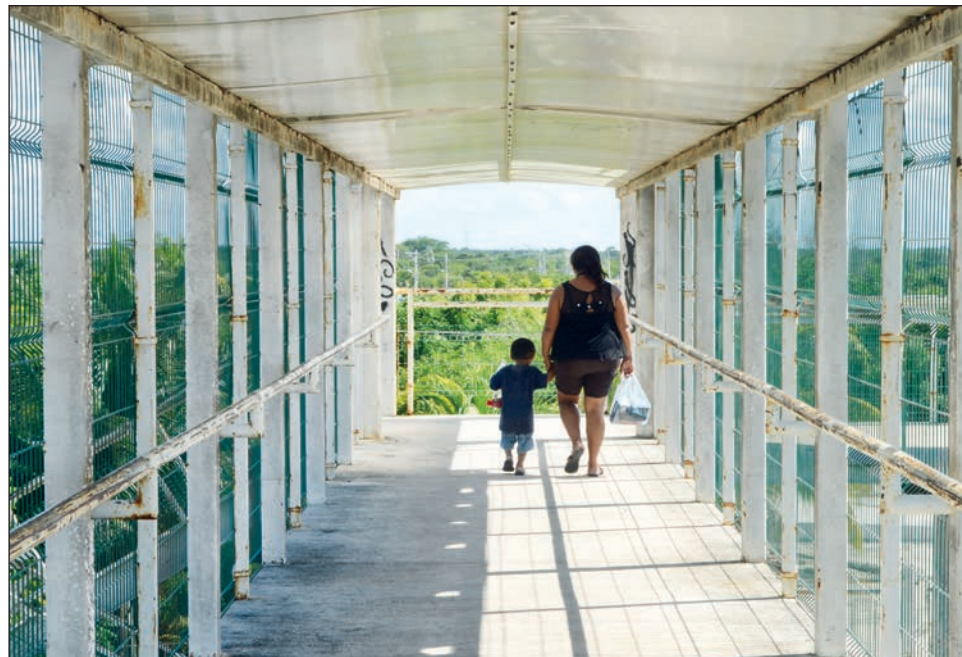
El refugio municipal para atención de mujeres víctimas de violencia extrema, también es un espacio de reflexión y de asistencia psicológica y legal, no sólo para las madres, sino también para sus hijas y sus hijos

De acuerdo con la abogada, en ocasiones las mujeres que son madres ingresan sin hijas e hijos por varios motivos: el espacio de refu-