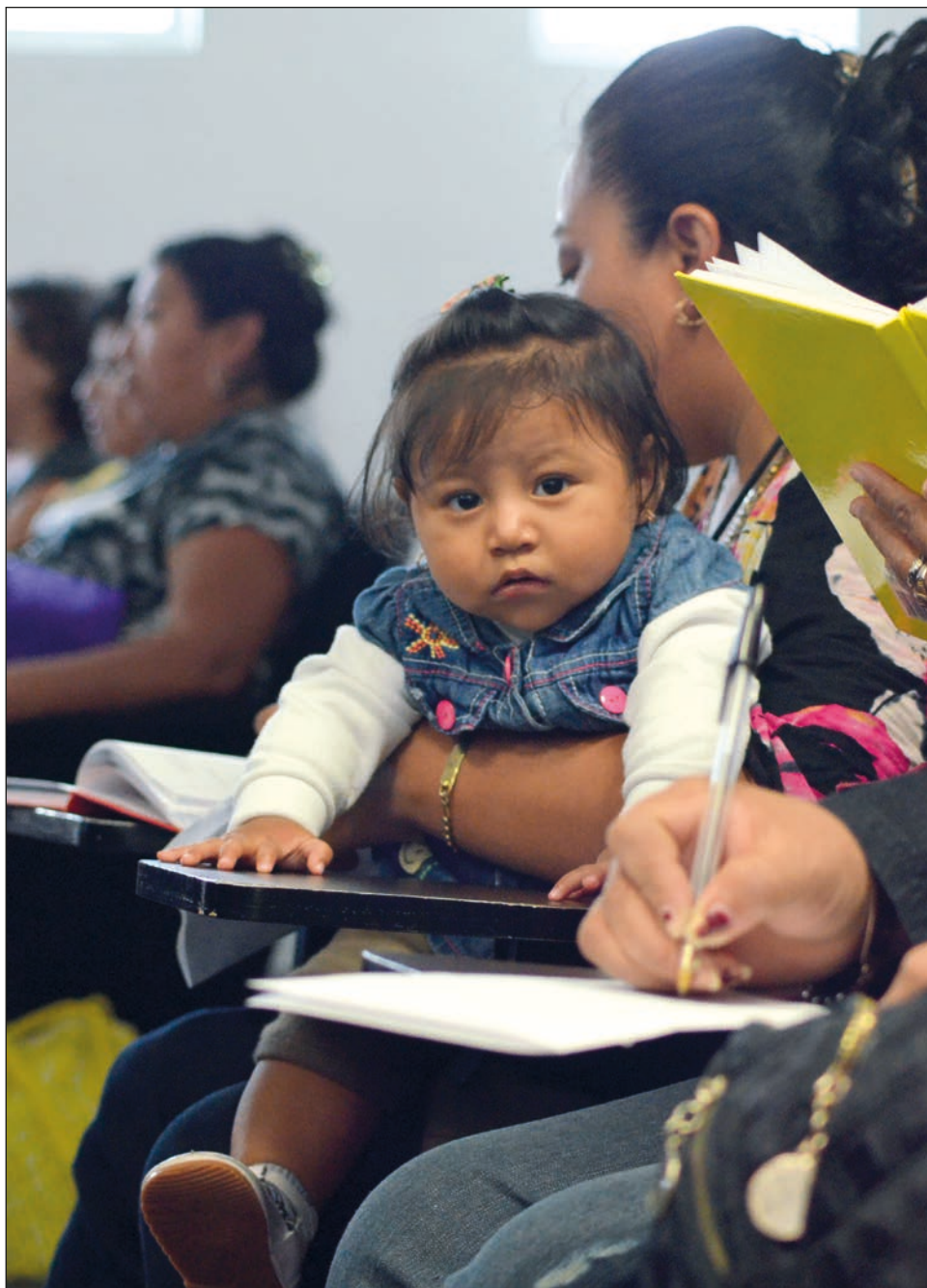
Ser madre debe compaginarse con un proyecto de vida.