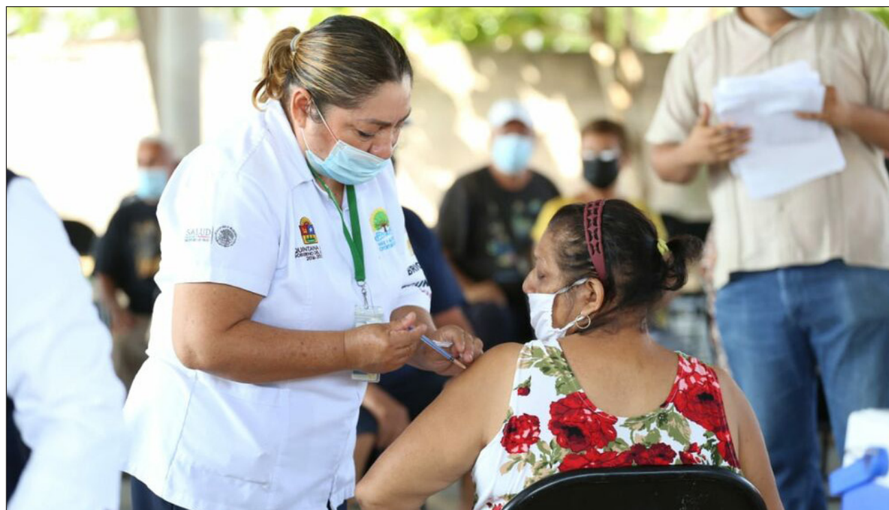
▲ De enero a la fecha, en Quintana Roo se han aplicado 208 mil 492 dosis de vacunas.

El INAH también anunció que a partir del 11 de mayo el Museo Nacional de Historia (MNH), Castillo de Chapultepec, reabrirá sus puertas al público en horario de martes a sábado de 9 a 17 horas, con un aforo máximo permitido de mil 800 personas por día.