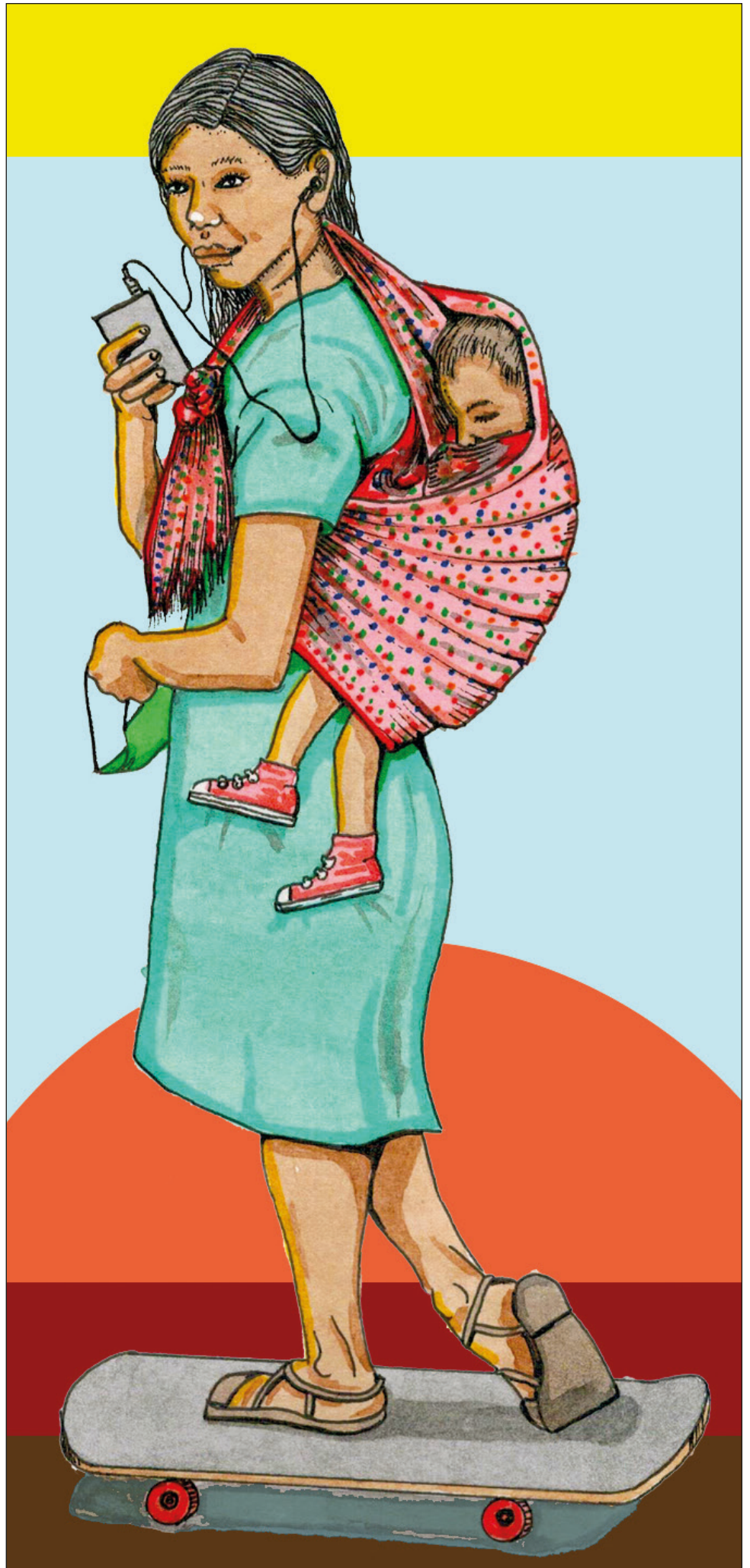
Deben hallarse nuevas formas de ser madre Ilustración Sergiopv @serpervil

En ese sentido, concluyó que, como sociedad, hablar de estos temas y construir maternidades deseadas es una manera de construir mejores entornos, con seres humanos emocionalmente más fuertes.