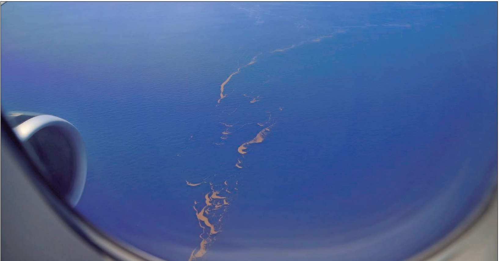
▲ El sargazo entra por la parte sur, entre Xcalak y Mahahual; conforme se acerca el verano se hace más abundante.