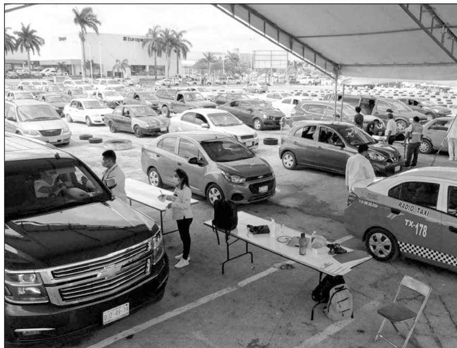
▲ El foro Ah Kim Pech, en el malecón, fue habilitado para vacunación en automóvil o motocicleta.

estar informó que aquellas personas que aún no tengan cita pueden acudir con su hoja de expediente impresa a los puntos de vacunación ubicados en el Décimo Batallón de Infantería y la tercera Región Naval para que sean canali-