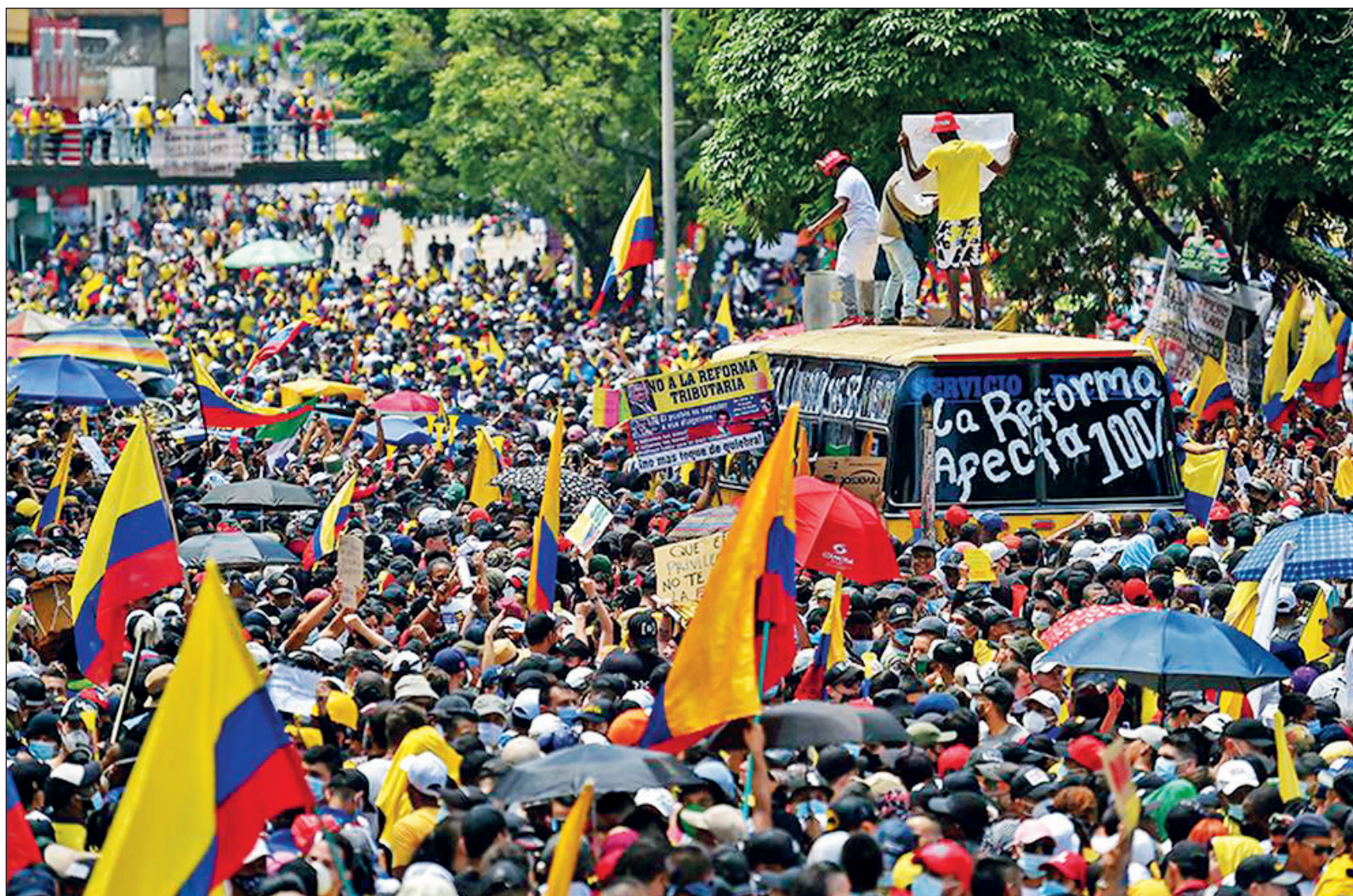
▲ Desde hace días, en Colombia acontece una rebelión social y económica de suma importancia para toda nuestra América.