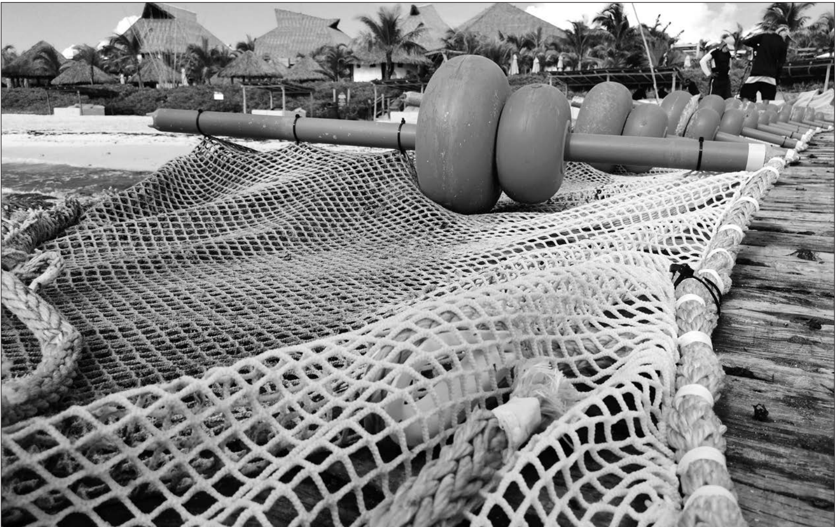
▲ En Mahahual colocarán mil 100 metros lineales que empatarán con las barreras artesanales que los empresarios ya habían puesto en la costa.