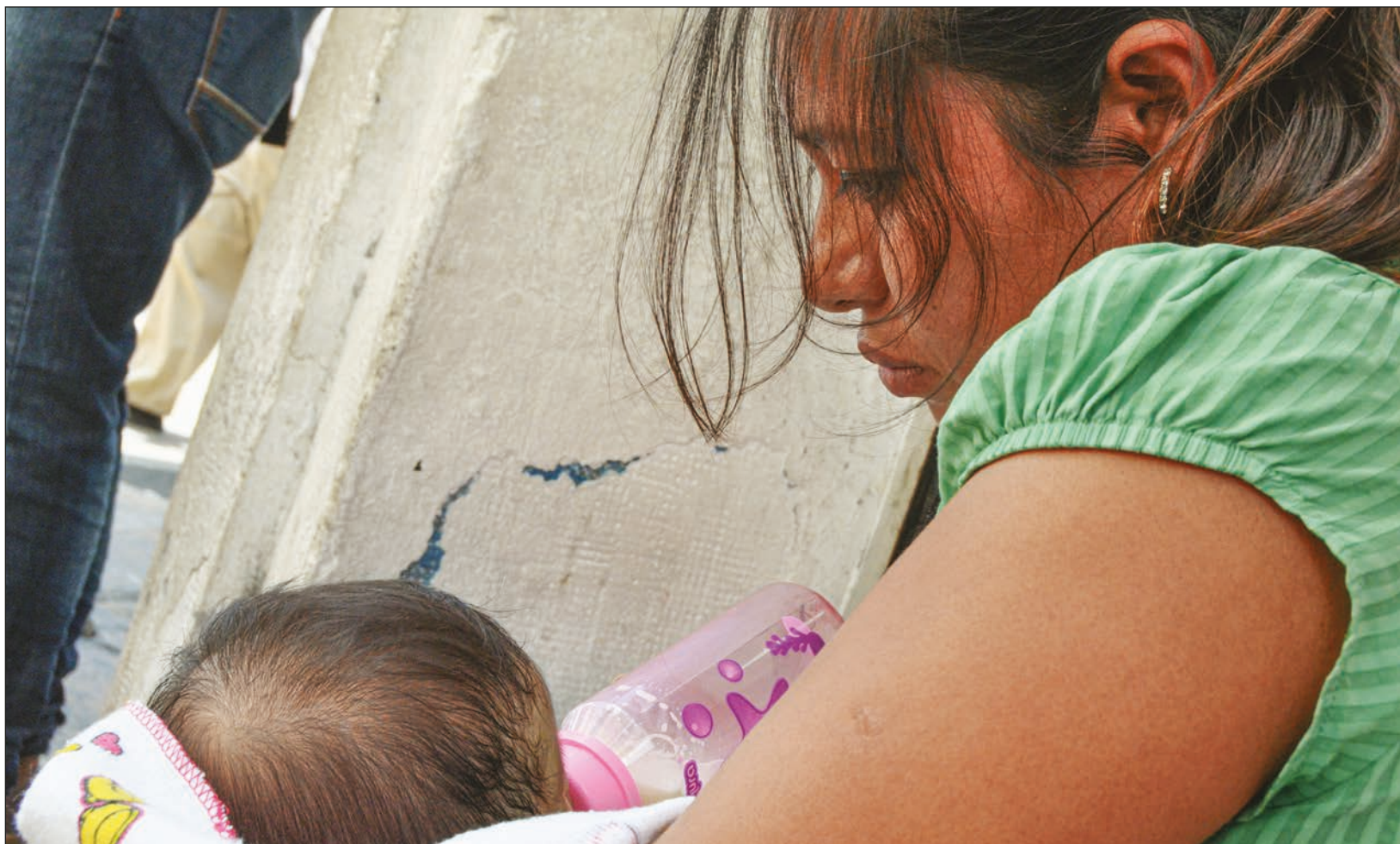
“Nació, vi a mi hija... y no sentí ese amor, ese lazo automático que me dijeron que sentiría”.