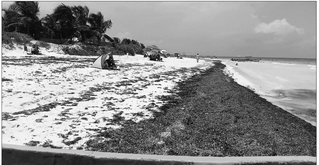
▲ La playa Santa Fe es una de las más afectadas por el sargazo.

Añadió que en el Parque Nacional Tulum (PNT), donde hay barreras antisargazo, es donde se concentra el recalcado de la macroalga, principalmente en playa Santa Fe.