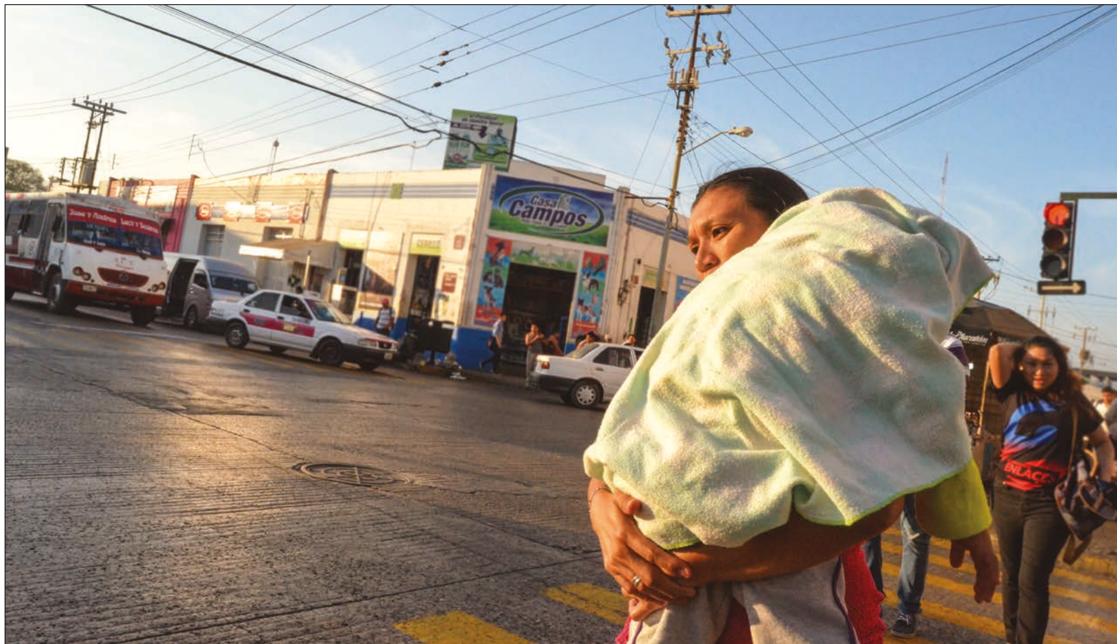
A las madres se les juzga con mayor severidad que a los padres si se dan un tiempo para divertirse o estar ausentes.