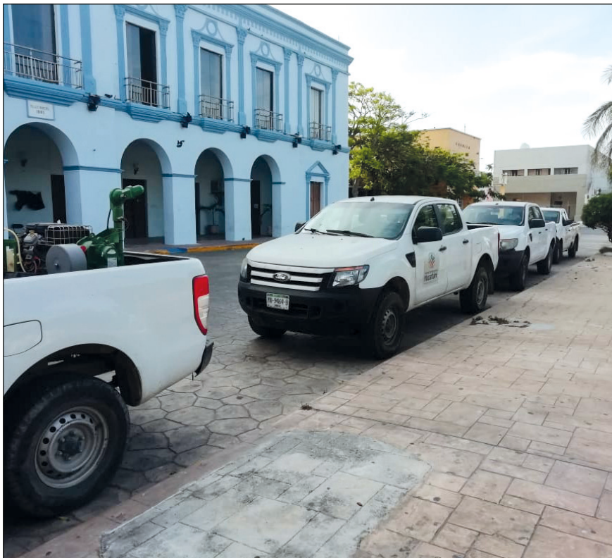
Los trabajos de la más reciente fumigación se llevó a cabo en los primeros 10 días del mes abril.

Finalmente, Alcalá Díaz agradeció a quienes abren puertas y ventanas cuando el personal realiza las labores de fumigación, pues así "se suman a la prevención de enfermedades. Como mencionamos, la participación de la ciudadanía es importante para que estas acciones den resultados".