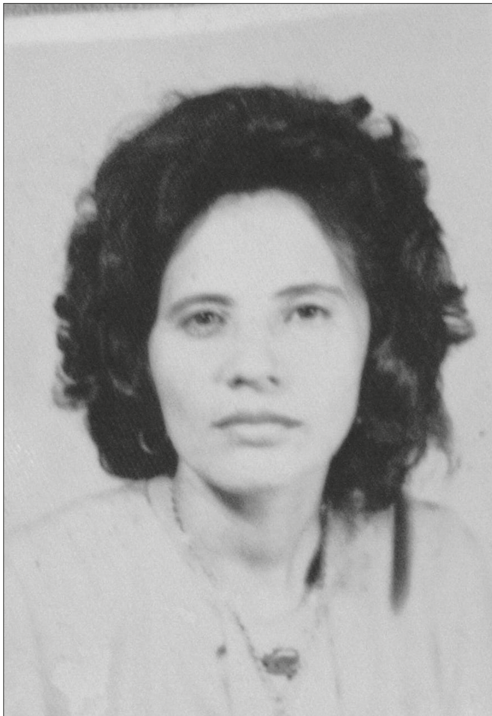
Nadie nos enseña a dejar ir, a amar desde la distancia, desde la ausencia; a continuar viviendo aunque nos falte una parte del corazón.

Conforme mi madre envejecía los papeles se fueron invirtiendo y me tocó ser mamá, enfermera, chofer y lo que se requiriera, lo cual hice con mucho gusto. Un día que nunca olvidaré fue una visita al médico por una