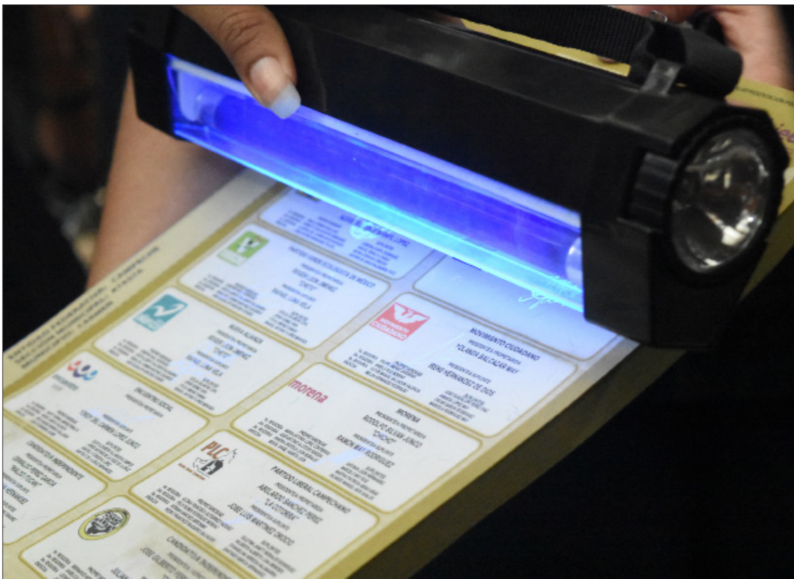
▲ En este 2021, los ciudadanos tendrán que rechazar en lugar de elegir a los candidatos que proponen los distintos partidos nacionales.