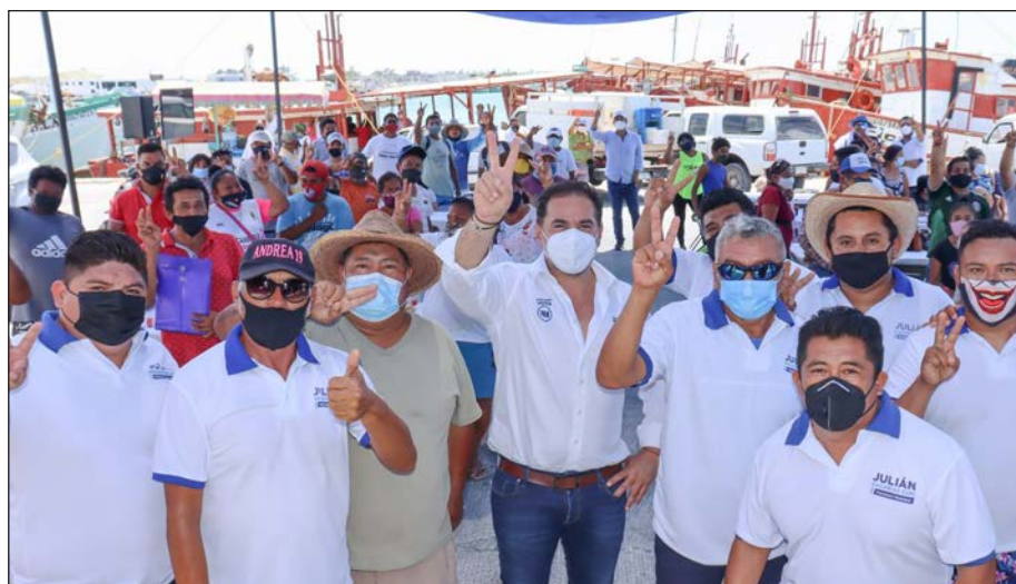
▲ El sector pesquero es clave para la reactivación económica en Progreso.

Agregó también que en estos comicios se ha propuesto acercar todavía más mejoras al sector a fin de reactivar la economía y con ello también el turismo, recuperando espacios y gestionando la rehabilitación de refugios pesqueros, otorgando así todas las facilidades para que este sector se desarrolle al máximo.