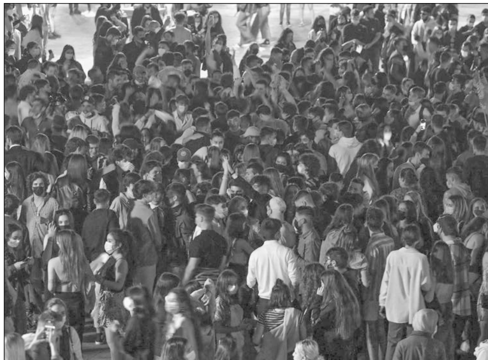
▲ Adolescentes y adultos jóvenes llenaron las plazas céntricas y playas de Madrid y Barcelona.

El residente de Barcelona de 25 años también celebró la posibilidad de poder volver a su trabajo en un restaurante con una estrella Michelin, que lleva siete meses cerrado.