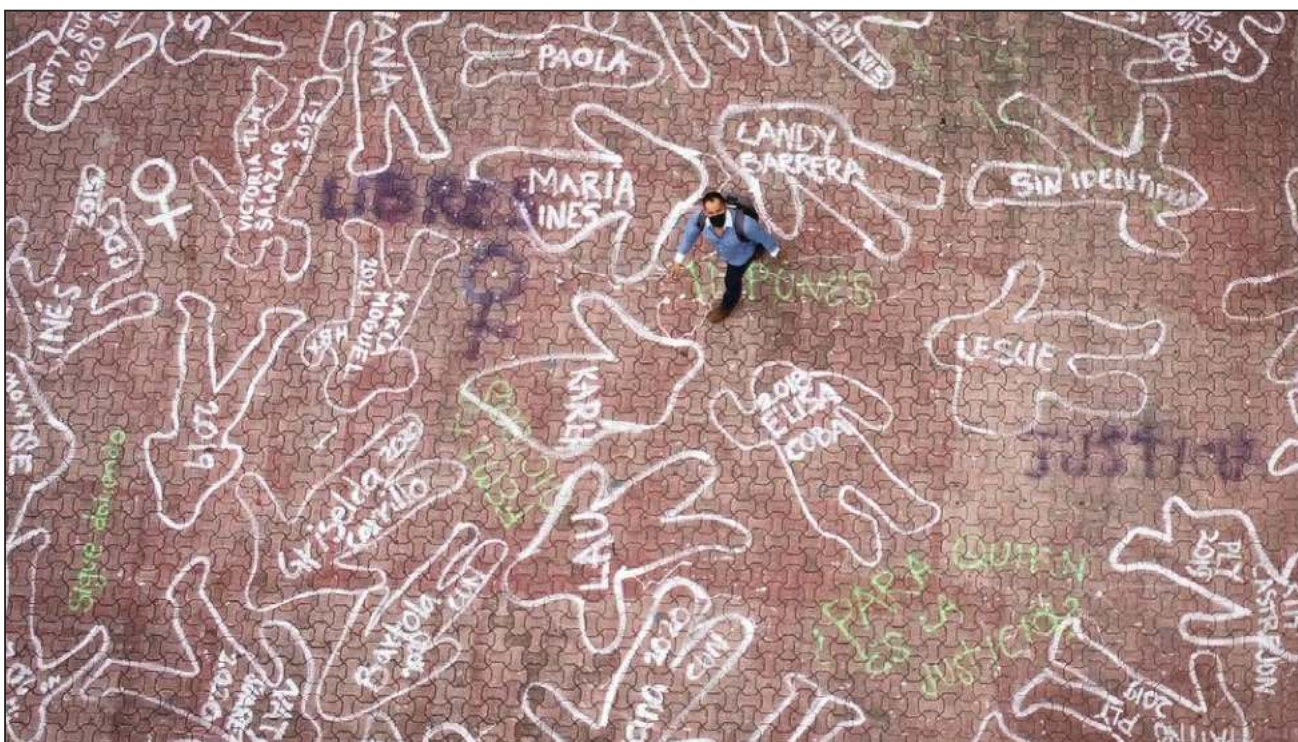
◀ El ingenio convertido en protesta por las mujeres en lucha recopila lugares comunes que vuelven normal el machismo.