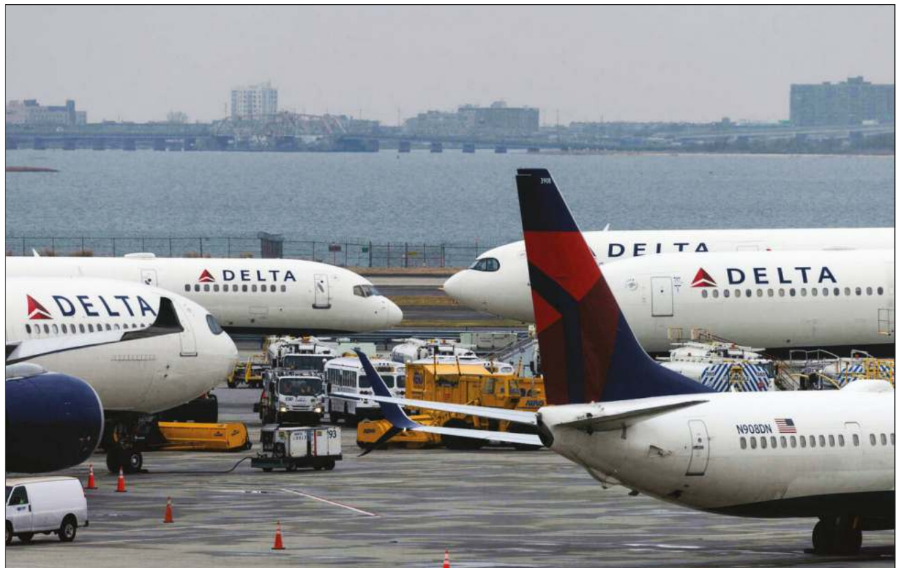
▲ La aeronave del vuelo DAL 643 permanece varada en la terminal aérea de Cancún, y algunos turistas manifestaron a través de redes sociales que seguían esperando abordar otro avión.

Al momento la aeronave sigue varada en la terminal aérea de Cancún y se desconoce en qué momento retomará su ruta de regreso.