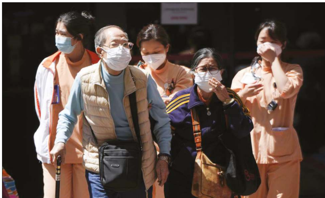
▲ El virus continúa evolucionando y llevar vacunas y tratamientos a los lugares donde se necesitan es una tarea llena de dificultades para la OMS.

“Dos años después, más de 6 millones de personas han muerto”, apuntó Ghebreyesus.