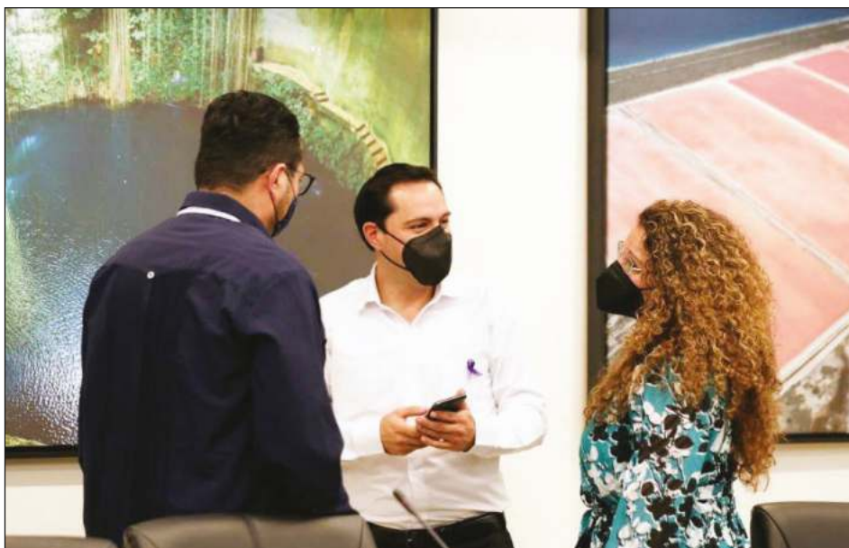
▲ En días pasados Vila Dosal recibió a los directores de CF Energía y Petroquímica de la Secretaría de Energía, así como a la presidente de la Comisión de Energía del Senado.

Vila Dosal señaló que estas obras representan una significativa fuente de empleos, ya que, se invertirá 454 millones de dólares en la planta de la capital yucateca y 762 millones en la de Valladolid, y crearán 4 mil 350 plazas, entre directos e indirectos, en cada una, durante su construcción.