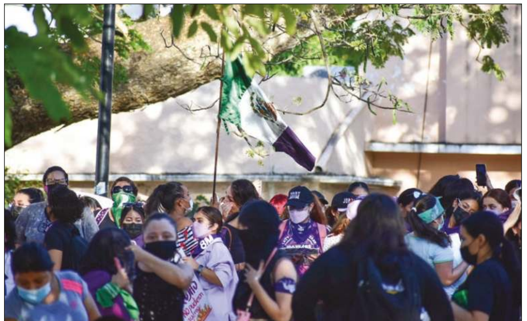
“Es deseable y urgente que el hartazgo de las mujeres se traduzca en avances reales en la concientización sobre las condiciones adversas hacia ellas”.

En suma, es deseable y urgente que el hartazgo de las mujeres se traduzca en avances reales en la concientización sobre las condiciones adversas hacia ellas, en acciones puntuales de las autoridades y en un inequívoco rechazo social hacia toda forma de violencia y discriminación por causa de género.