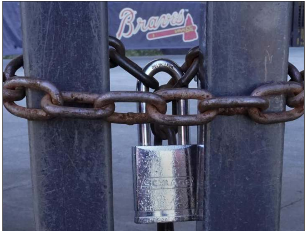
▲ Una cadena refuerza las rejas cerradas del Truist Park, casa de los Braves de Atlanta, campeones de la Serie Mundial.

Los jugadores rechazaron las tres opciones. En vez de ello, propusieron reducir la compensación para este año, que ambas partes accedan a un draft para el 15 de noviembre o que se regrese a la compensación para el receso entre campañas de 2022-23.