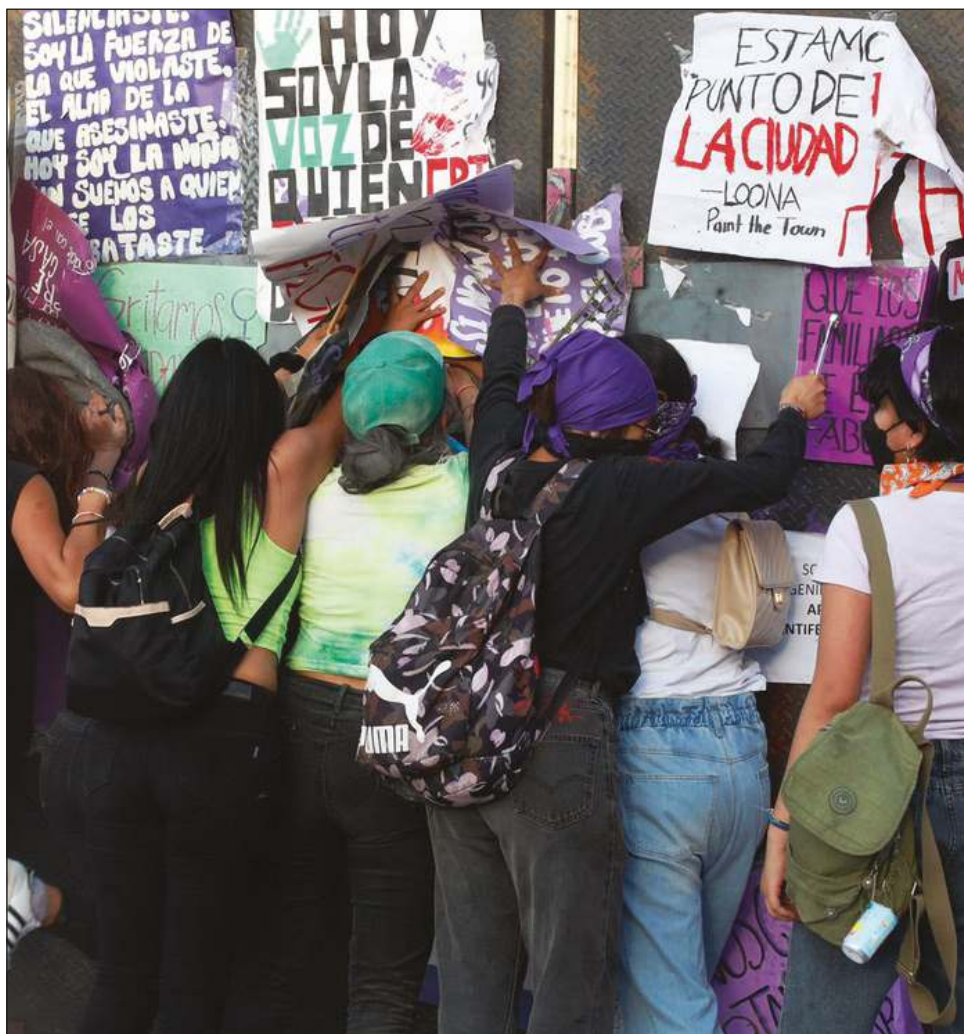
El Presidente aseguró que no hubo represión a las manifestaciones por el 8M.

Y de eso pasó a señalar a sus adversarios, porque “estuvieron esperando a que se incendiara Palacio Nacional y la Catedral, porque se tomaron las medidas necesarias. (Esperaban) los que tiran la piedra y esconden la mano, ‘te conozco bacalao aunque vayas disfrazado’ Se pusieron las vallas, imaginen si no ponemos la valla”, mencionó.