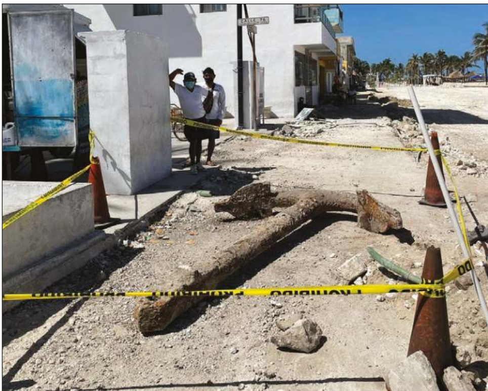
▲ El peso de la pieza hallada es de aproximadamente 1.5 toneladas y mide 3.03 de largo por 2 metros de ancho.