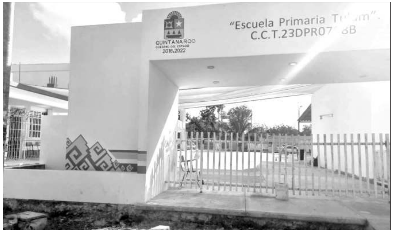
▲ Junto a la escuela Tulum hay una caseta de la Policía Municipal, que se encuentra abandonada, lo cual aprovechan los amigos de lo ajeno para perpetrar sus fechorías.

"Pues es la segunda vez que nos ocurre, la primera vez hicimos un llamado a las autoridades para que vengan a ver los robos que había ocurrido, ante ello nos visitaron y quedamos en formar un comité, pero pues antes de lograr todo eso pues ocurrió nuevamente otro robo, entonces ahora sí queremos trabajar para armar el comité para