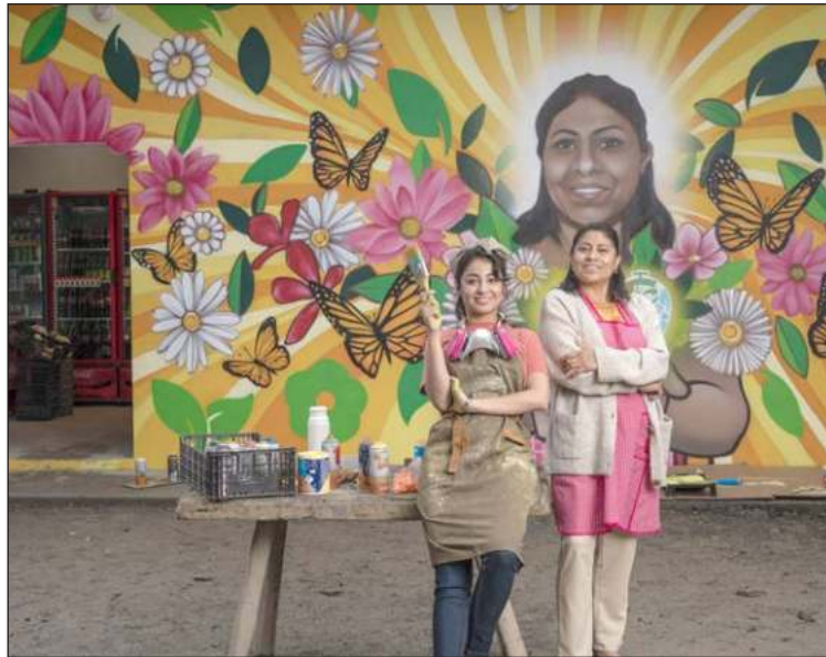
▲ Al día de hoy, Industria Mexicana Coca-Cola ha impulsado a más de 400 mil mujeres y emprendedoras en el país.

De igual manera, estos espacios digitales servirán como foros para que, utilizando el hashtag #ElAmorMultiplica, los usuarios puedan enviar soluciones y propuestas para despertar cambios positivos en sus ciudades.