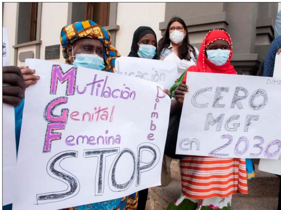
En España, cerca de 4 mil niñas están en riesgo de sufrir mutilación genital.

La práctica ha evolucionado con el tiempo, en la década de los 90 eran mu-