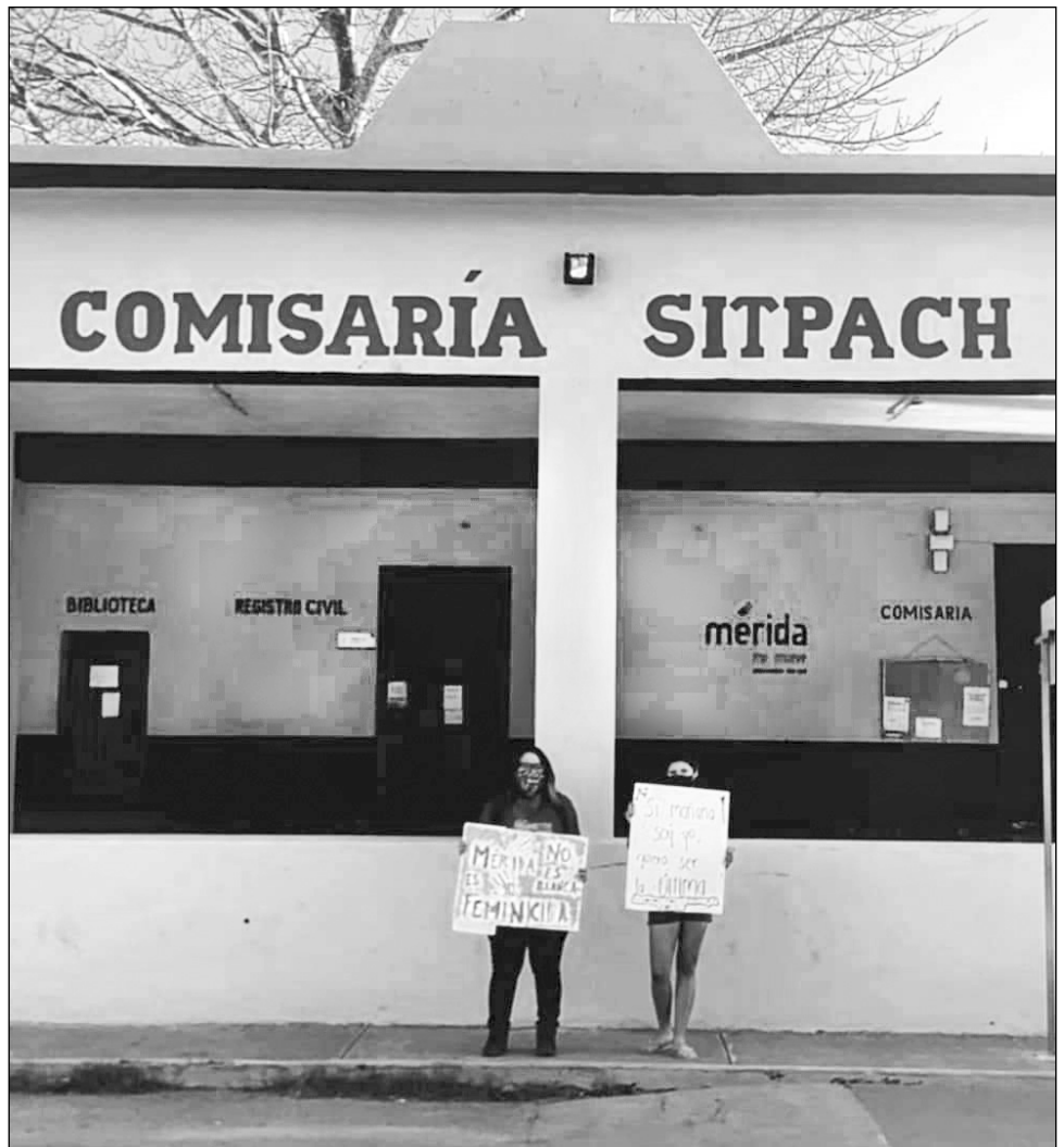
▲ Las autoridades municipales tienen poca o nula reacción en casos de violencia de género, acusaron las mujeres.

Mientras que la paridad de género aún es tema pendiente, señalaron que es urgente que se haga realidad en la elección de nuestras comisarías.