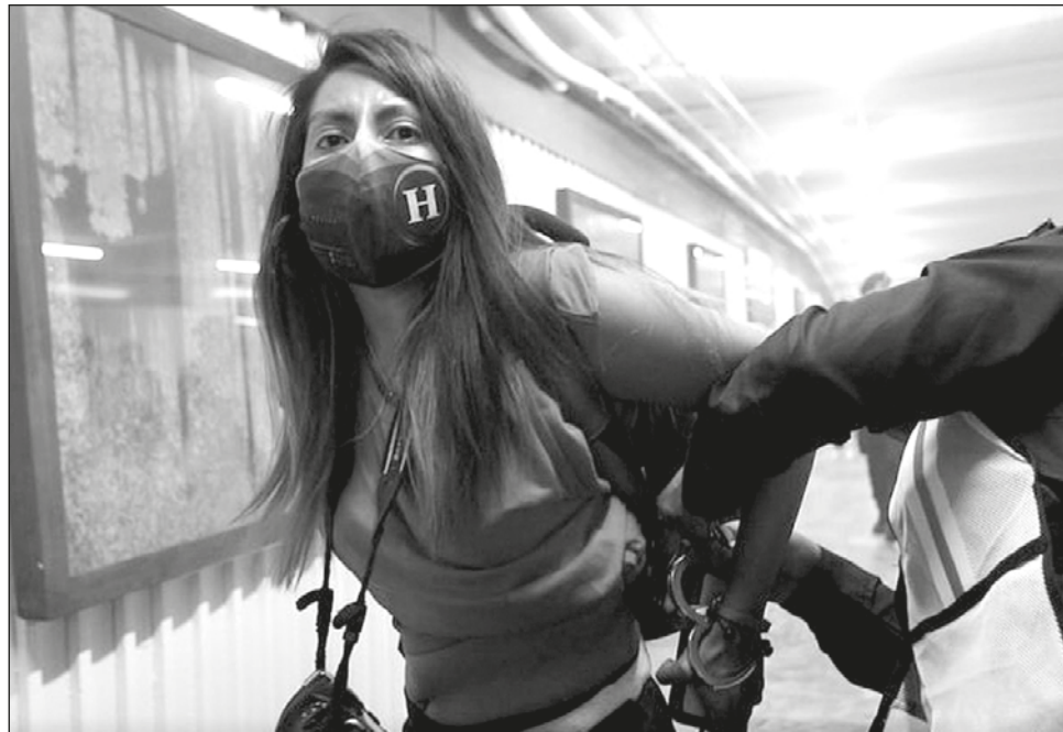
▲ Las reporteras fueron retenidas en las instalaciones del Sistema de Transporte Colectivo Metro, cuando se trasladaban para realizar la cobertura de la marcha con motivo del Día Internacional de la Mujer.

La comisión enfatizó que "ante el contexto de violencia que los periodistas continúan enfrentando en el país, las