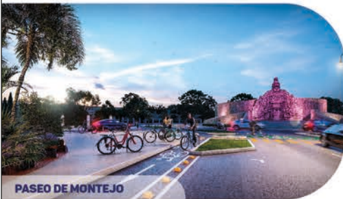
PASEO DE MONTEJO