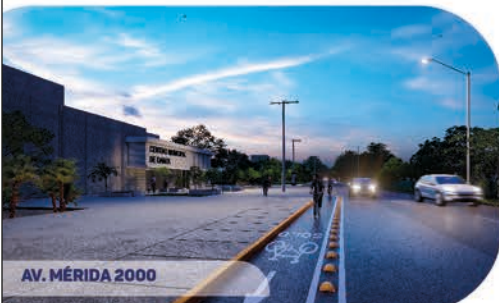
AV. MÉRIDA 2000