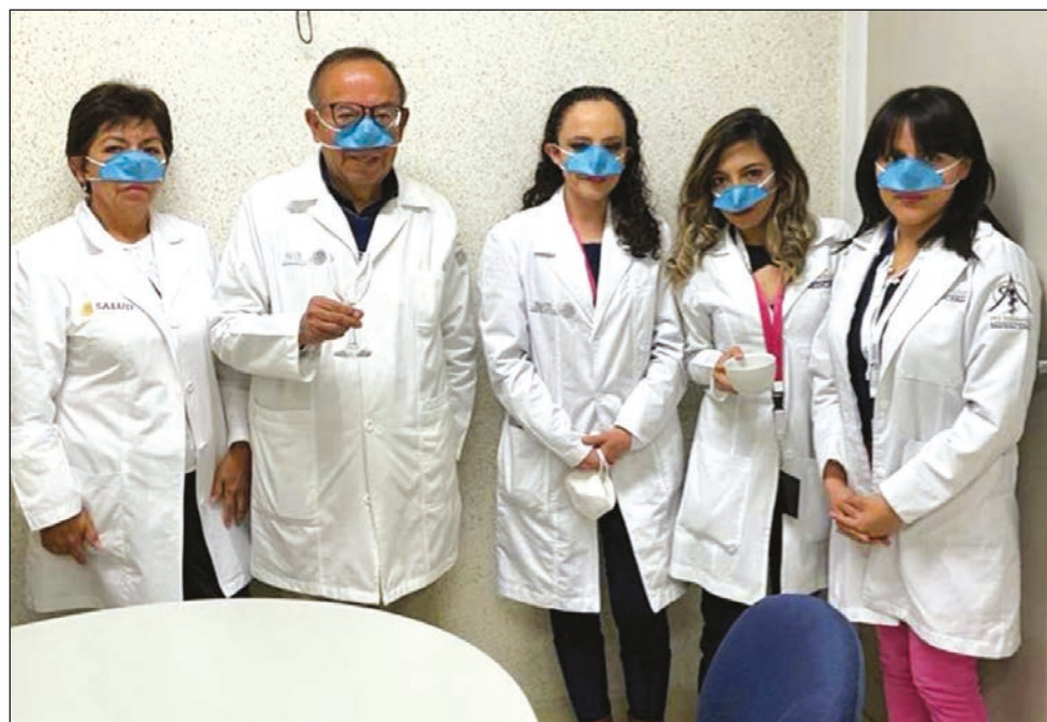
▲ La cubierta nasal se adapta fácilmente a la anatomía de todas las personas y puede colocarse abajo del cubrebocas.

En el proyecto además participaron los investigadores Eleazar Lara Padilla, de