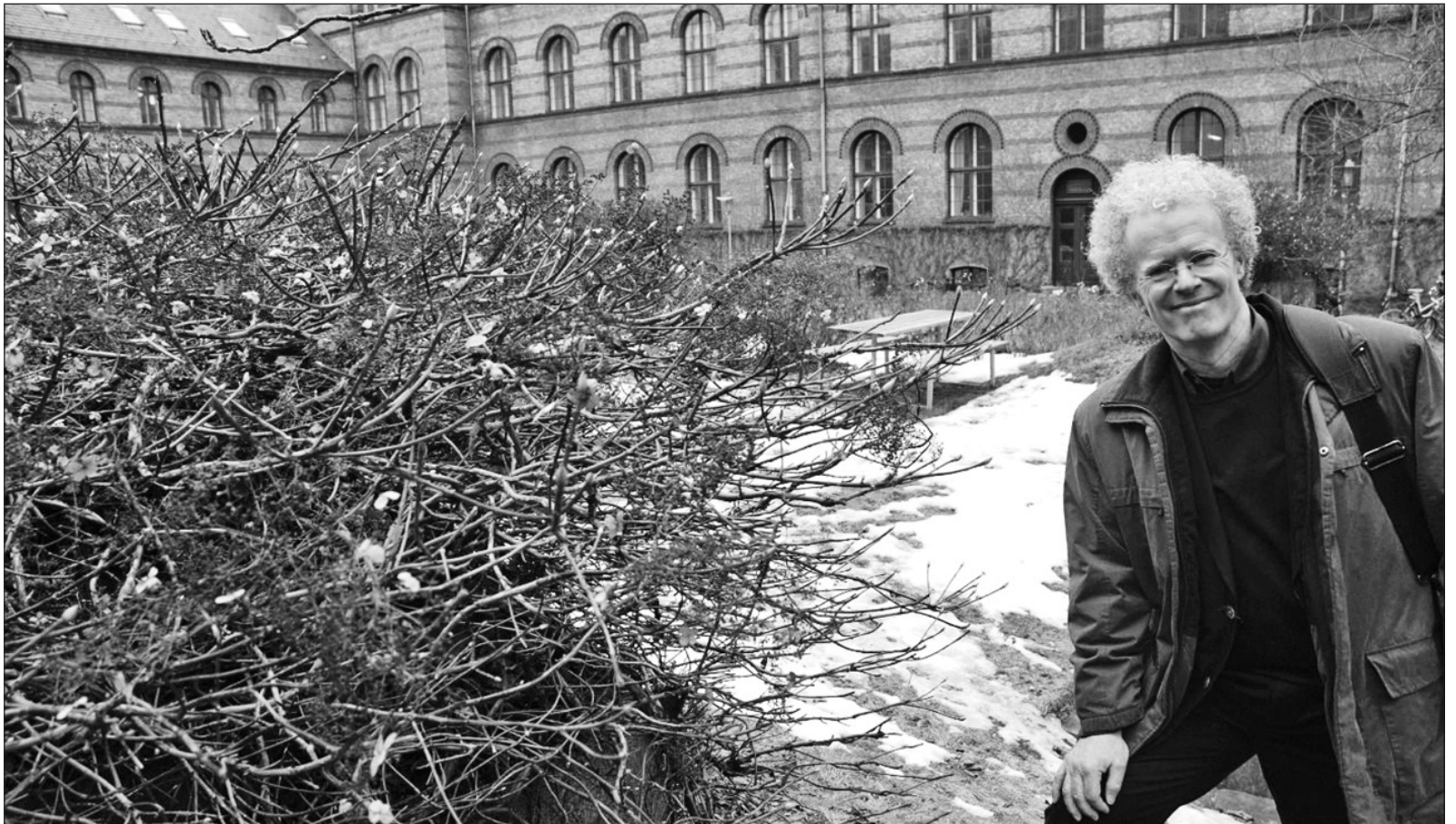
▲ Erik Olin Wright deseaba ofrecer un libro de divulgación, accesible y novedoso, fácil de leer y que diera respuestas a un lector medio, crítico del sistema pero fuera de los circuitos académicos hacia los cuales siempre se había dirigido.