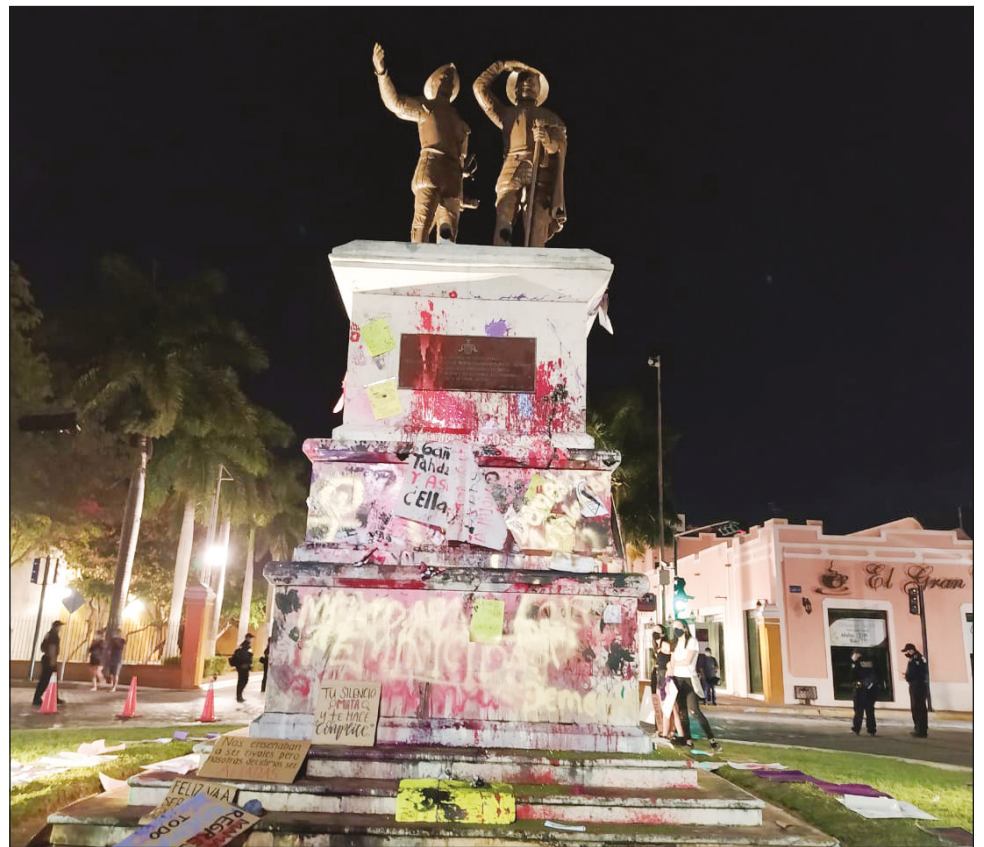
▲ Los Montejo, de acuerdo con Falú Balam, representan el pacto patriarcal.

Balam aclaró que el término “aliado” lo otorga quien lucha, es decir, no es algo que pueda autoproc-