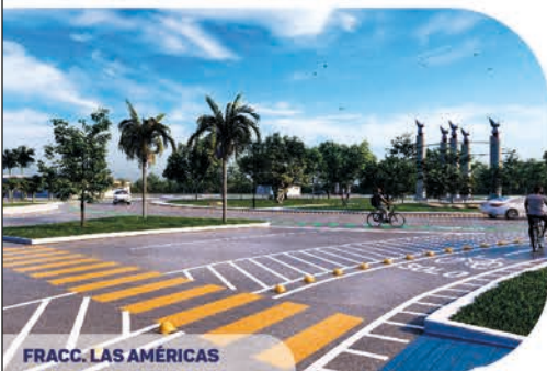
FRACC. LAS AMÉRICAS