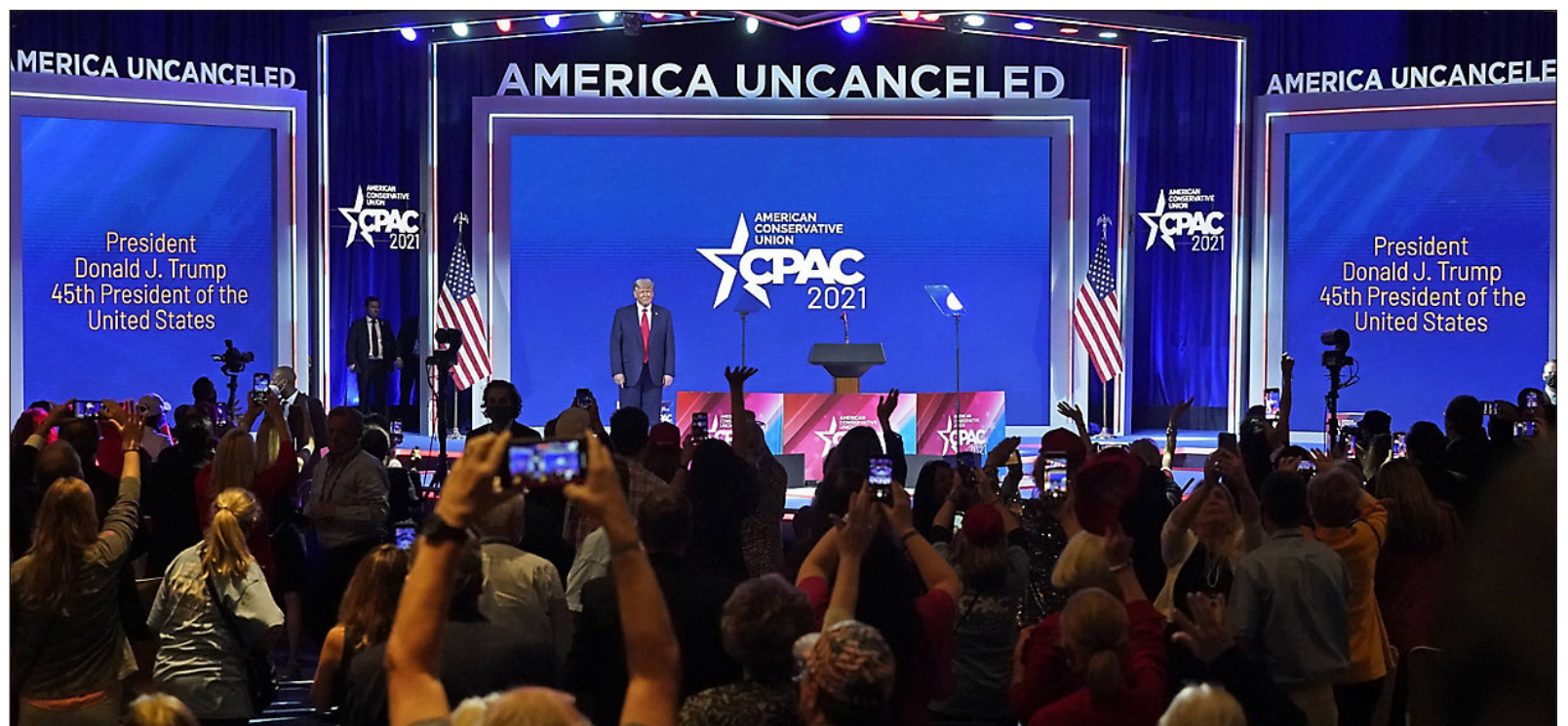
▲ When Donald Trump emerged in 2015, he opened the door for many to bring their secret lives to the surface.