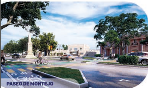
PASEO DE MONTEJO