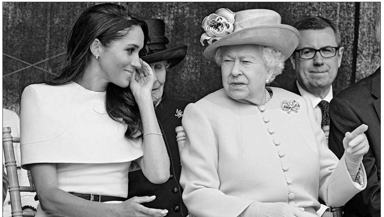
▲ En la entrevista con Oprah Winfrey, Meghan y Harry alegaron que no se les ofreció apoyo en materia de salud mental.

“ Harry, Meghan y Archie siempre serán miembros de la familia muy queridos”, indica el texto difundido.