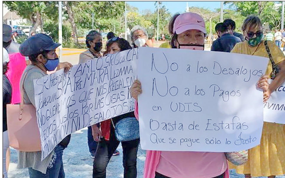
▲ Vecinos de varias colonias de Benito Juárez se manifestaron en la plaza de la Reforma, en donde denunciaron haber sido víctimas de este tipo de fraudes.

Estos bancos, dijeron los inconformes, incrementaron el costo de la vivienda al grado de hacer impagables las mensualidades, y en caso de impago proceden a desalojarlos de sus hogares. Solicitaron la intervención