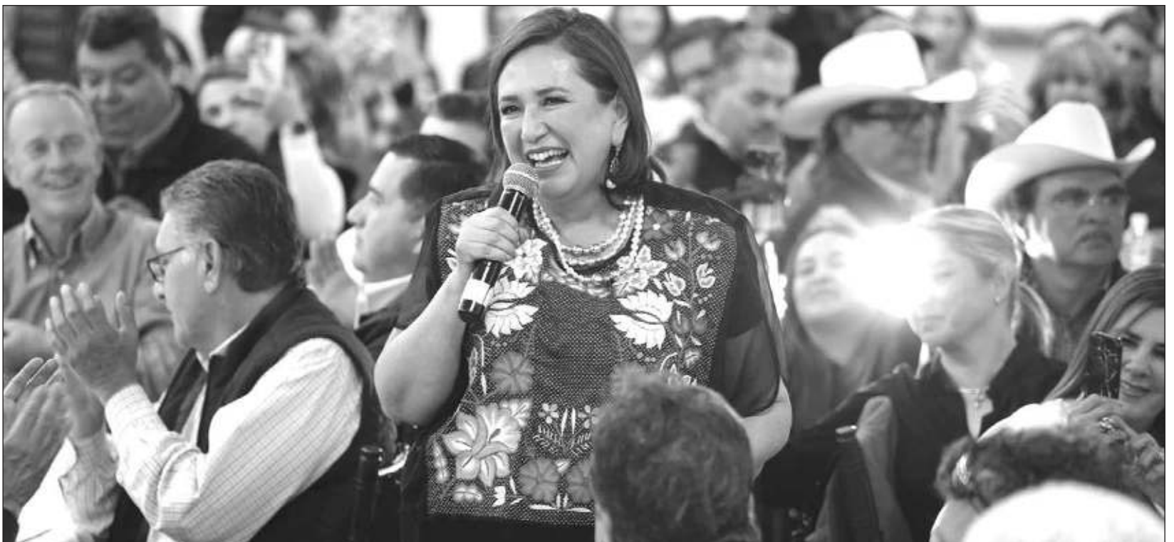
▲ La precandidata presidencial del Frente Amplio por México dijo que presentará las denuncias ante la Fiscalía Anticorrupción por el abuso contra los trabajadores de Notimex y ante el Instituto Nacional Electoral por el uso de recursos públicos en la campaña.

que la gobernadora Delfina Gómez les descontó 10 por ciento de su salario para la campaña y Marcelo Ebrard, quien había denunciado que la Secretaría del Bienestar está al servicio de Claudia Sheinbaum.