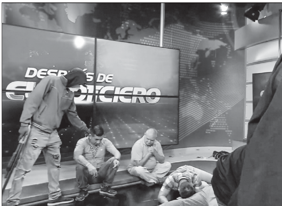
▲ En las imágenes en vivo dentro de las instalaciones del canal TC Televisión, se observaba a varios encapuchados con armas que mantenían en el piso a trabajadores del medio, a quienes exigían que pidan en directo a la Policía que se retire del lugar.

Añadió que los presidentes primero deben ser acusados y destituidos por el Congreso antes de poder ser procesados. Trump fue acusado dos veces pero el Senado no logró condenarlo.