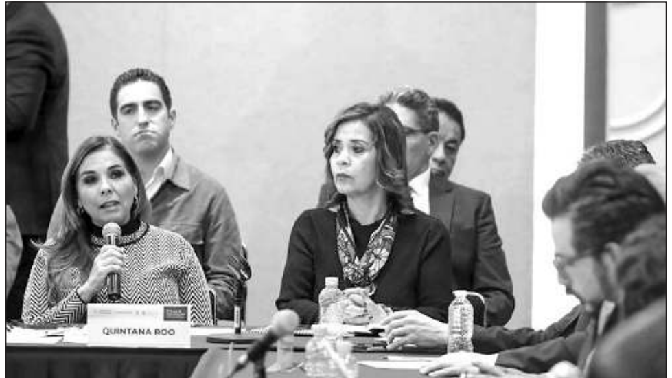
▲ El pasado 8 de enero, la gobernadora Mara Lezama y otros mandatarios se reunieron con el titular del IMSS para avanzar en la "transición de los servicios de salud".

Recordó que el lunes 8 de enero se encontró con gobernadores del país en una reunión encabezada por la secretaria de Gobernación, Luisa María Alcalde Luján; el secretario de Salud federal, Jorge Alcocer Varela; y