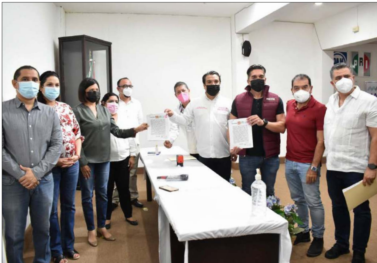
▲ El 7 de enero en sesión solemne el Ieqroo realizó la declaratoria de inicio del Proceso Electoral Local 2021-2022.