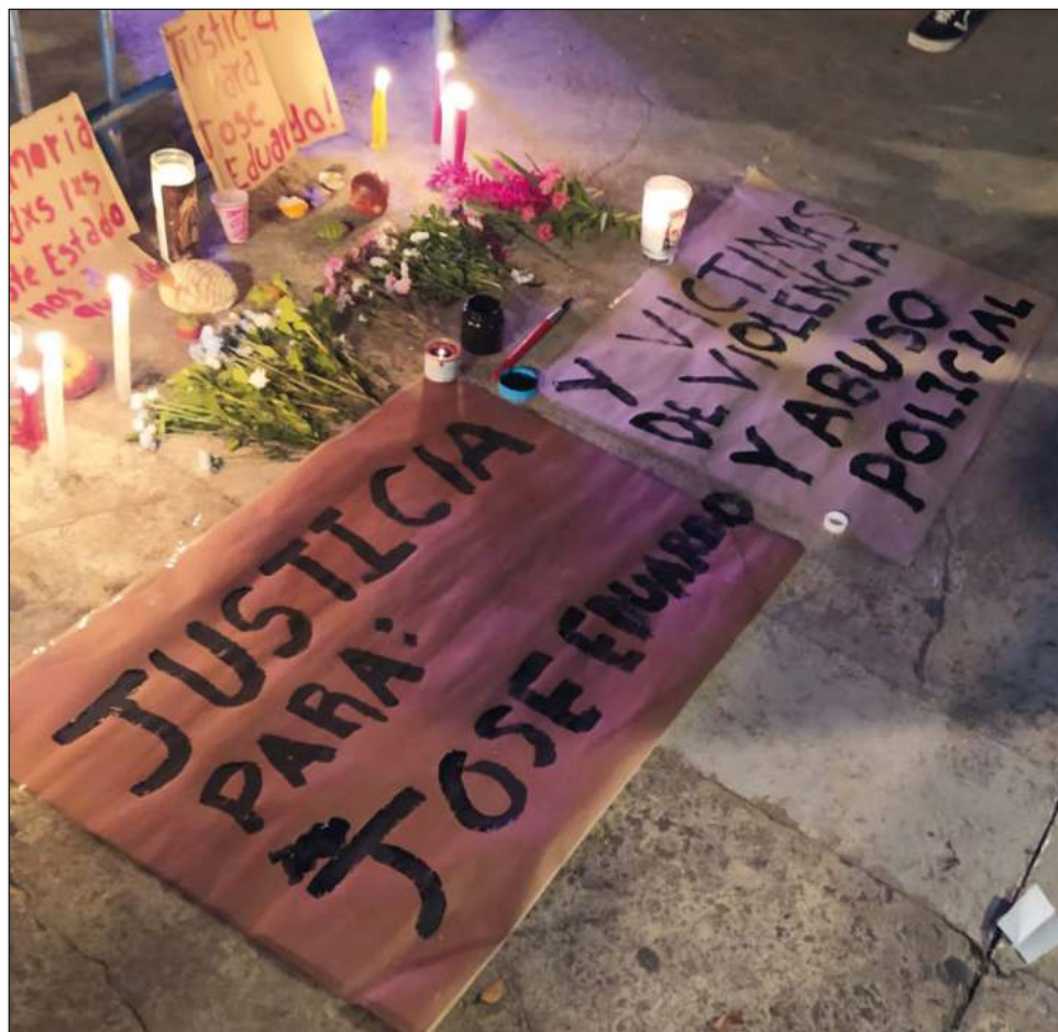
▲ De acuerdo con la recomendación de la CNDH, las violaciones a derechos humanos que se atribuyen al personal de la Policía Municipal se consideran graves.

En tanto se designa a un titular permanente, fungirá al frente de la corporación policiaca un encargado de despacho, privilegiándose la experiencia operativa y administrativa.