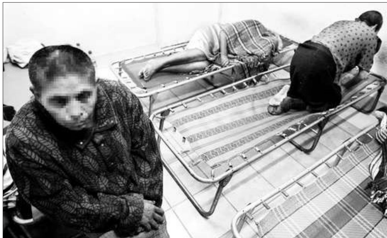
▲ La escasa infraestructura gubernamental para atender la salud mental provoca la proliferación de centros de internamiento privados que, favorecidos por la escasa vigilancia, abusan de los pacientes.

Oficialmente, la Comisión Nacional contra las Adicciones (Conadic) tiene registrados 266 centros privados de atención con tratamientos cuyo costo oscila entre 3 mil y 185 mil pesos. Sin embargo, la cifra de 24 clínicas que esta institución reporta para la Ciudad de México contrasta con las 199 que el gobierno capitalino asegura que existen. Según el directorio de Conadic, en Tlaxcala no hay registro de estos centros; en Guerrero, Quintana Roo y Tamaulipas sólo uno, aunque el reporte