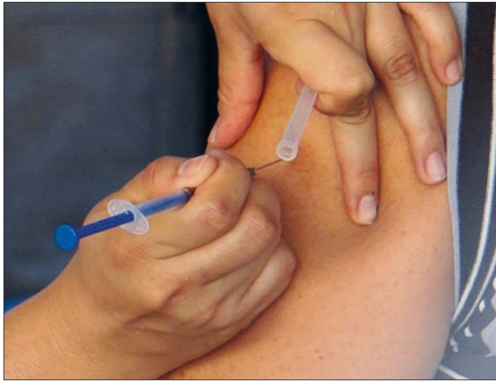
▲ Tentativamente, el personal educativo recibirá también dosis de refuerzo del 12 al 15 de enero.

El refuerzo de la vacuna contra Covid-19 para el personal educativo será apli-