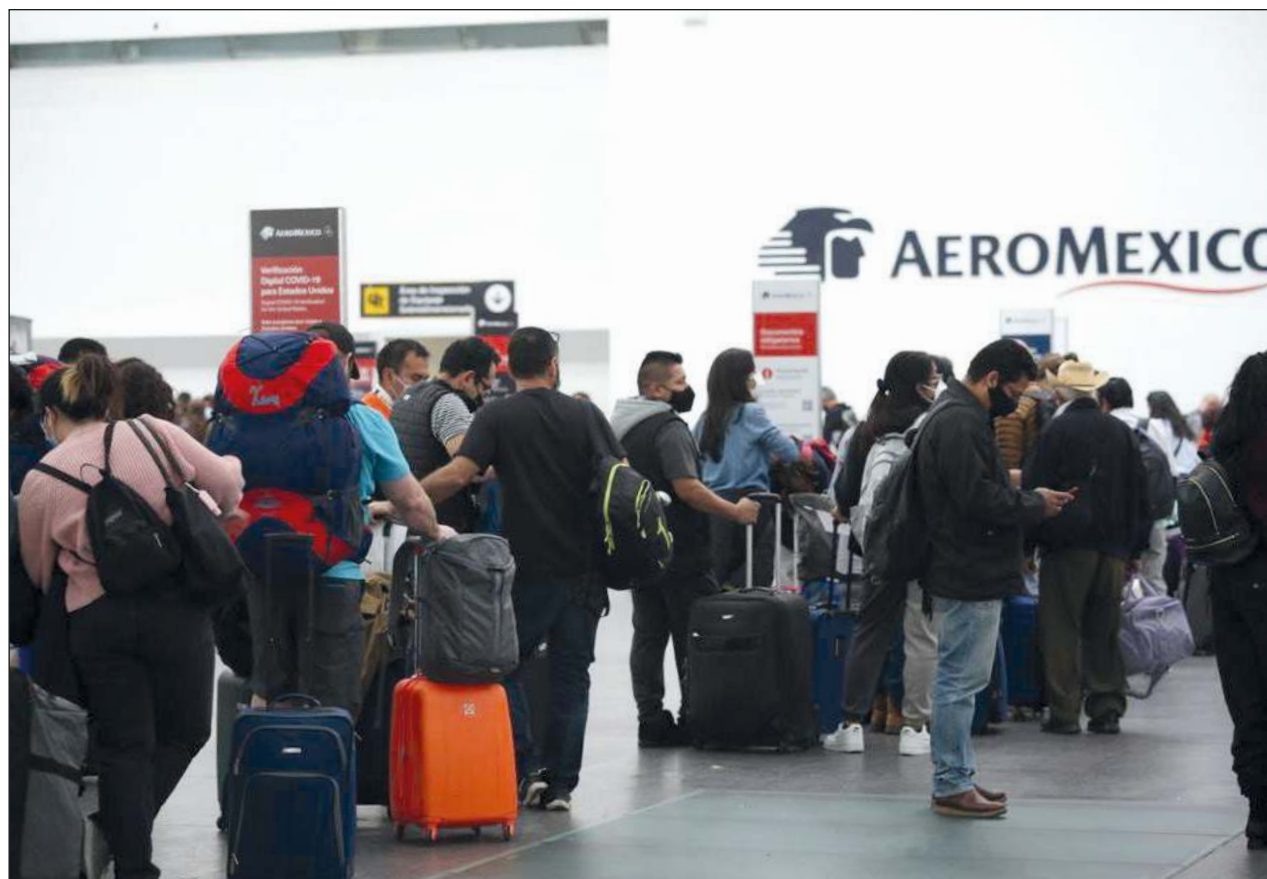
▲ Ente los vuelos cancelados por Aeroméxico este sábado estuvieron seis que debieron partir de Cancún a la Ciudad de México, y tres cuyo origen era la capital del país, hacia este destino turístico.

Las aerolíneas programadas fueron Aeromar, Aeroméxico, Air Canada, Air France, Air Portugal, Air Transat, Alaska, American, Austrian, Avianca, British, Cónдор, Copa, Delta, Eurowings, Frontier, Gol, Jet Air, Jet Blue, KLM, Latam, Lot Polish, Magni, Sky, Spirit, Southwest, Sun Country, Sunwing, TAG, TUI, Turkish, United, Viva Aerobús, Viva Air, Volaris, West Jet y Wingo.