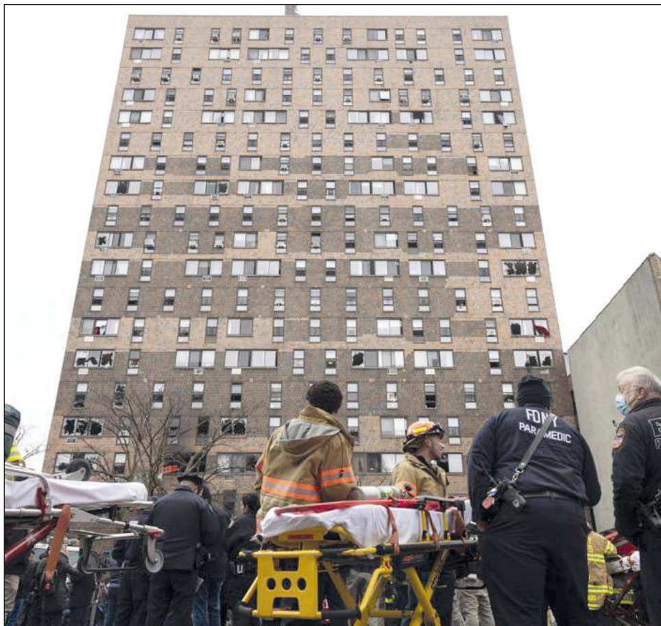
▲ Alcalde de Nueva York califica el siniestro como uno de los peores en tiempos modernos. Las llamas no se extendieron a otras viviendas.

Las llamas no se extendieron a otras viviendas, pero el humo se propagó por todo el edificio, explicó un portavoz a medios locales.