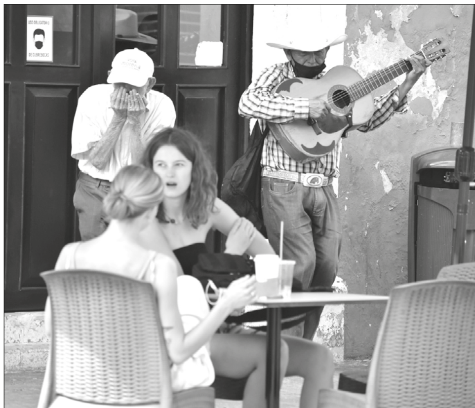
▲ La Secretaría de Salud de Campeche llamó a la población a mantener las medidas de prevención y sanidad que hasta ahora han aplicado en la entidad.