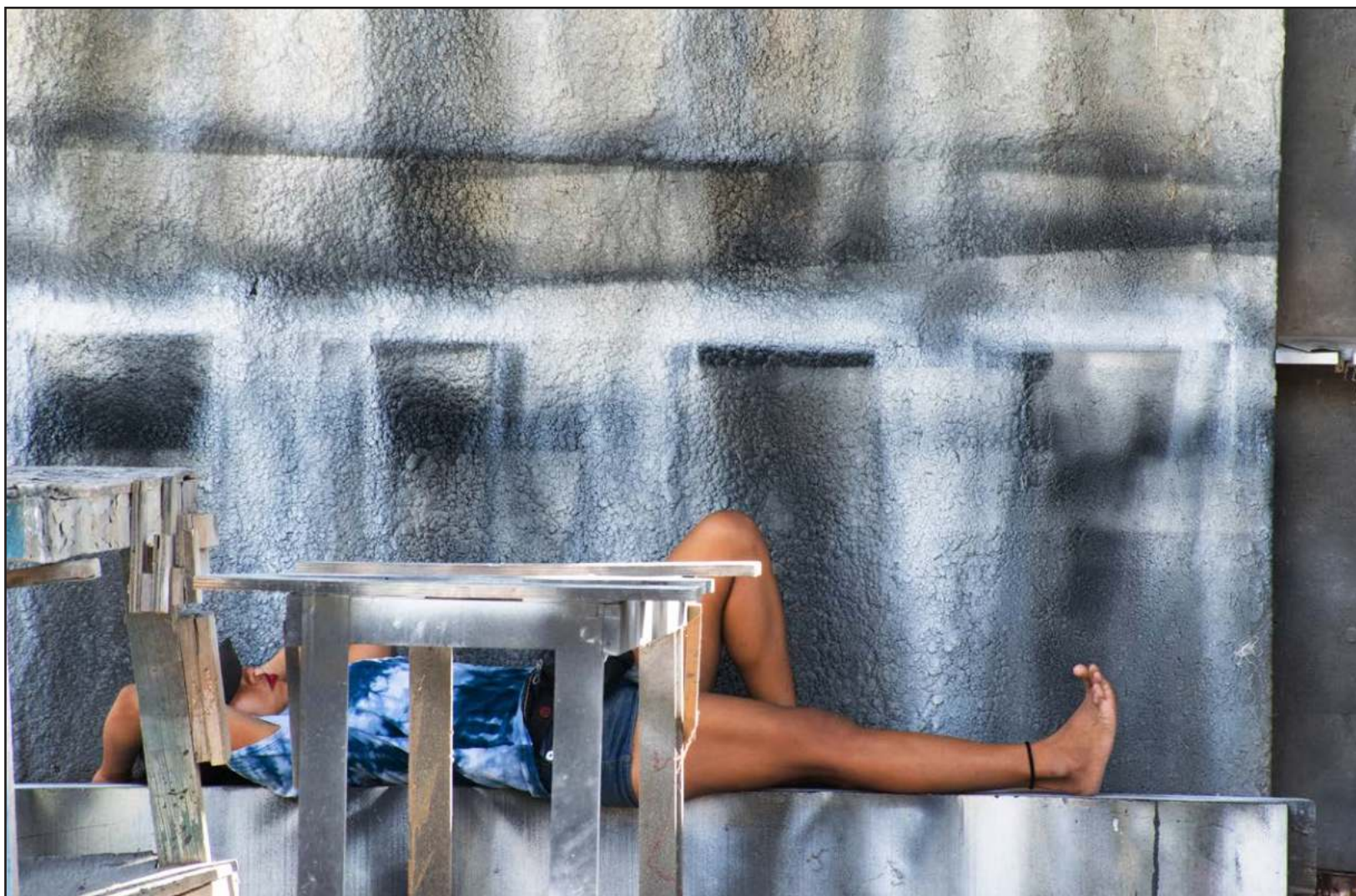
Lo que en otro lugar podría pasar desapercibido, en Vergel es más bello o feo sobre el contraste