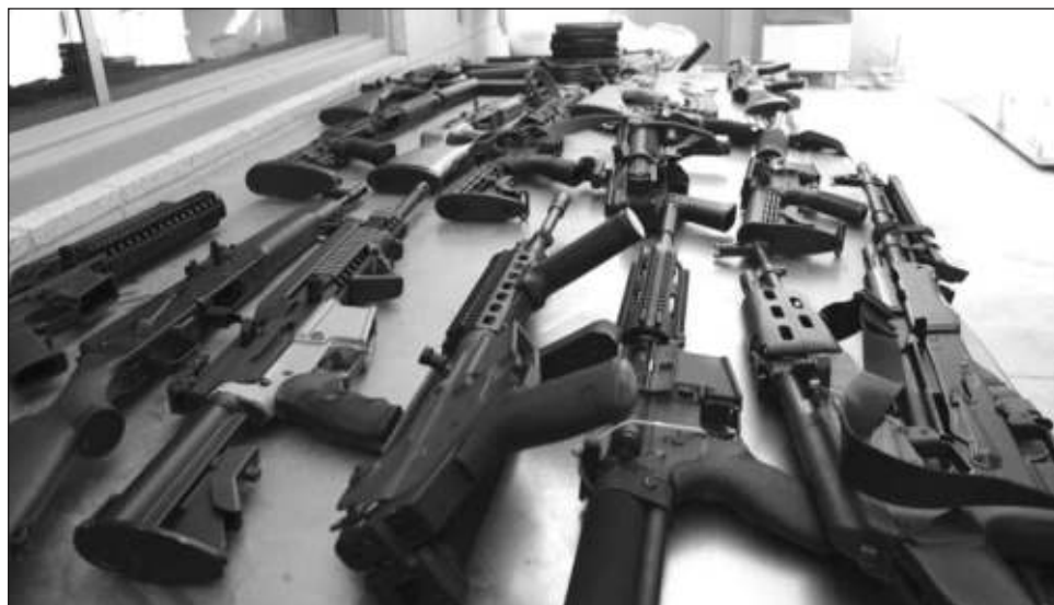
▲ Cientos de armas introducidas a México con el propósito de rastrearlas terminaron "perdidas" y fueron utilizadas en diversos delitos de sangre en el país.

En estos dos últimos casos, las autoridades mexicanas solicitarán a sus homólogos estadounidenses notificar oficialmente a los detenidos, e iniciarán un procedimiento de extradición para juzgarlos en México.