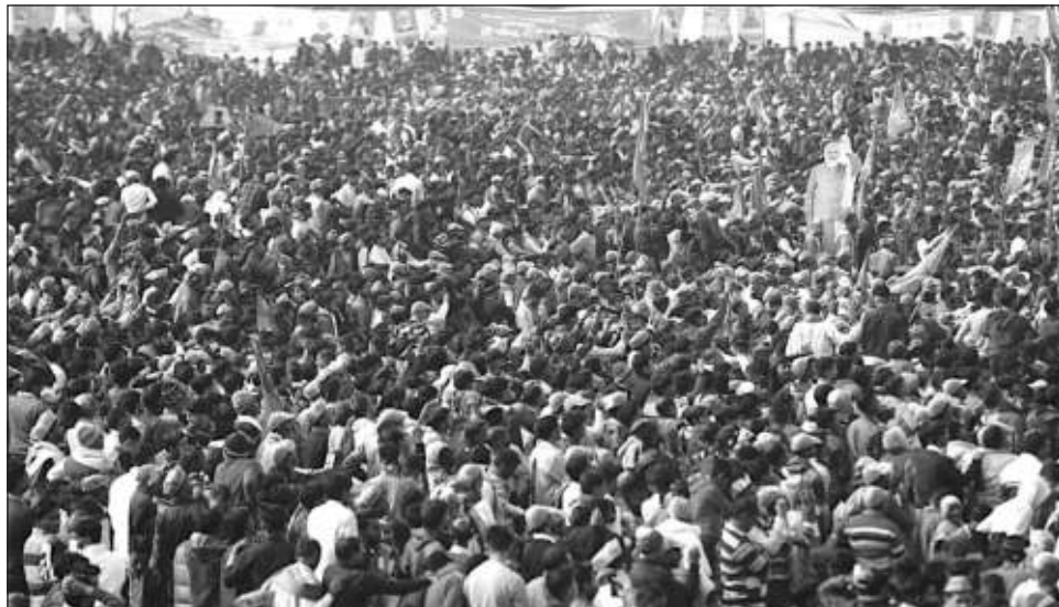
▲ Líderes políticos de India están ocupados haciendo campañas masivas antes de las cruciales elecciones estatales.

"La variante ómicron es altamente transmisible y te persigue y te atrapa, pero nuestros políticos siguen ahí para darle la bienvenida con abrazos", lamentó el vi-