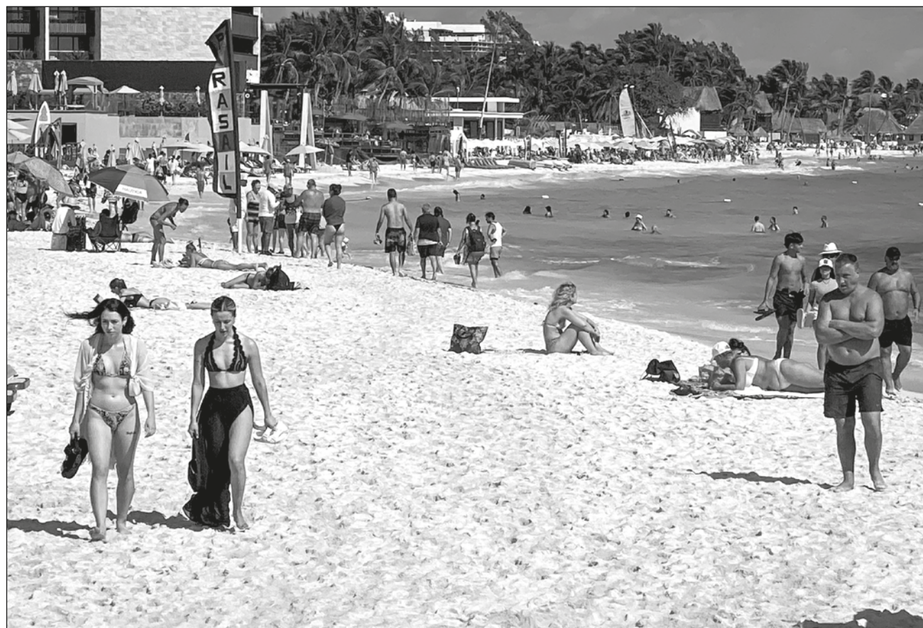
▲ La Sedetur indicó que trabajará para evitar contagios y mantener el rumbo para que los visitantes generen beneficios en favor de los quintanarroenses.

Por lo anterior, el encargado de despacho de la Sedetur informó que se trabaja en el fortalecimiento y relanzamiento de iniciativas como la edición 2022 de la Certificación en Protección y Prevención Sanitaria en Instalaciones