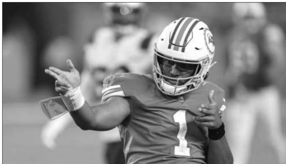
▲ Tua Tagovailoa y los Delfines suman dos temporadas ganadoras consecutivas, pero ninguna llevó a los playoffs.

Por su parte, los 49's se llevaron su boleto a los playoffs al derrotar 27-24 en tiempo extra a los Carneros de Los Ángeles, campeones de la División Oeste de la