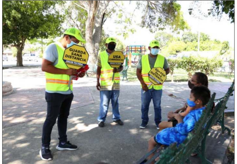
▲ A partir de hoy y hasta el 16 de enero, Quintana Roo permanecerá en semáforo amarillo, lo que implica reducir aforos en diversas actividades, lo cual se traduce en un incremento de costos de operación para las empresas.

La Secretaría de Salud informó que del 10 al 21 de enero de 2022 estarán en funcionamiento módulos fijos de pruebas rápidas en los municipios de Benito Juárez y Othón P. Blanco; adicionalmente, la Dirección de