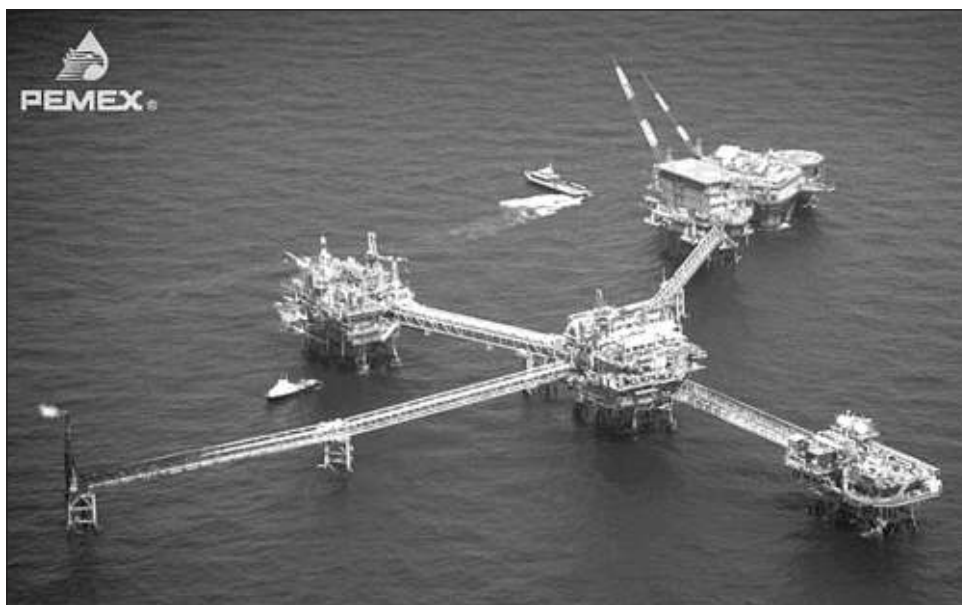
▲ El ataque a la plataforma Ku Sierra fue inadvertido incluso para los trabajadores de Pemex, que se percataron del atraco durante la madrugada del viernes.

La inseguridad que persiste en las plataformas marinas de Pemex, la cual ha tratado de ser minimizada por las autoridades, se incrementó de manera alarmante desde 2010, siendo el 2015 el año en