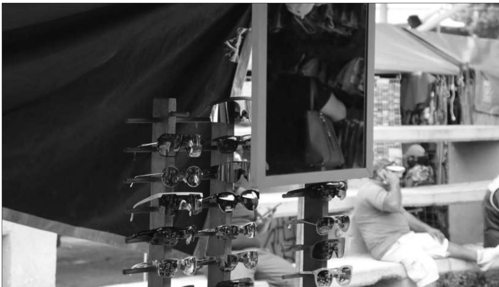
▲ Sé que los Reyes Magos ya llegaron y se fueron, pero también que siempre estamos a tiempo para renviarles el pedido en un santiamén.