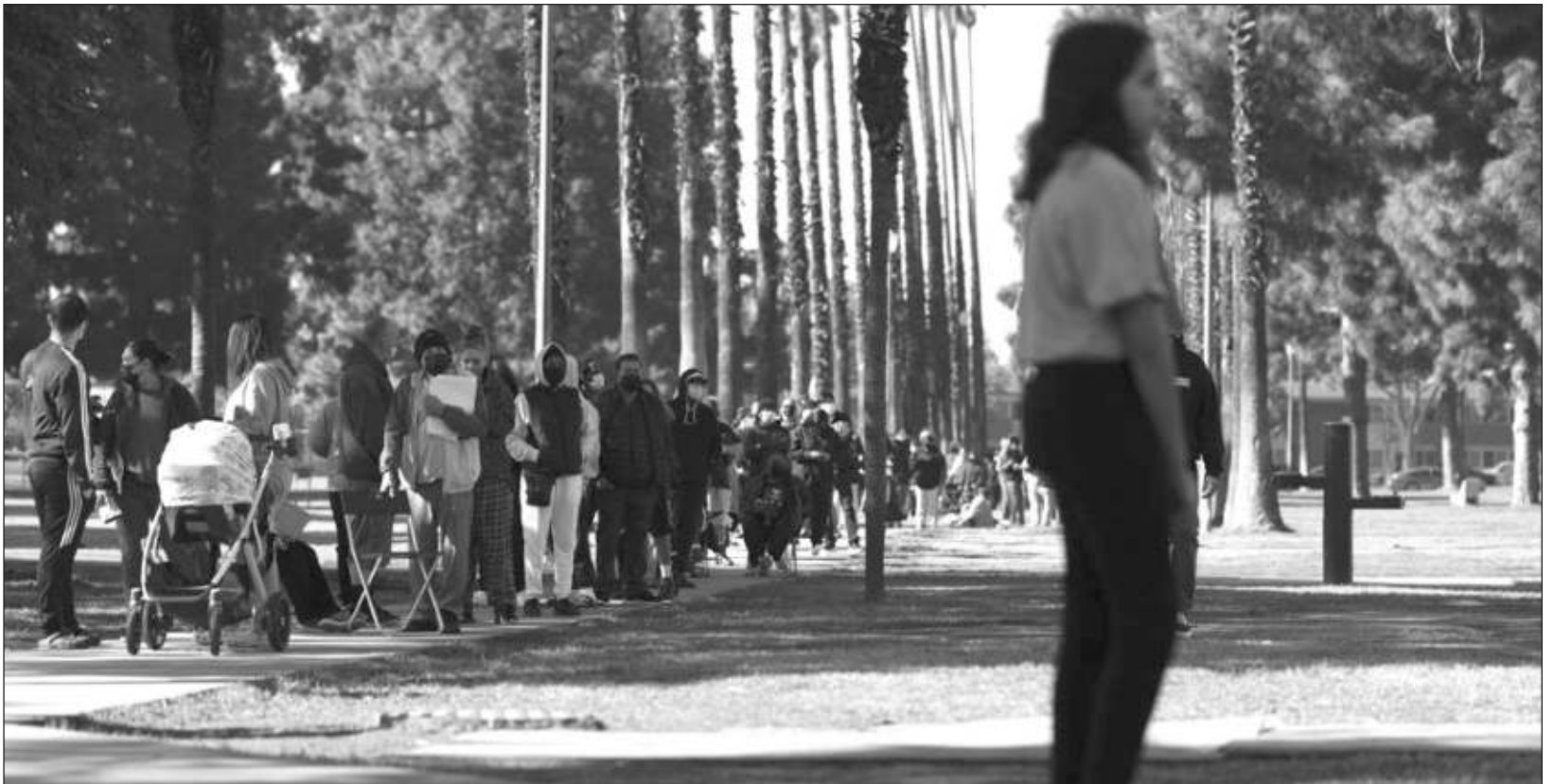
▲ El 65% de trabajadores de bajos salarios de Estados Unidos aseguró que se presentó a trabajar con síntomas de Covid-19 para que no les descontaran el día.