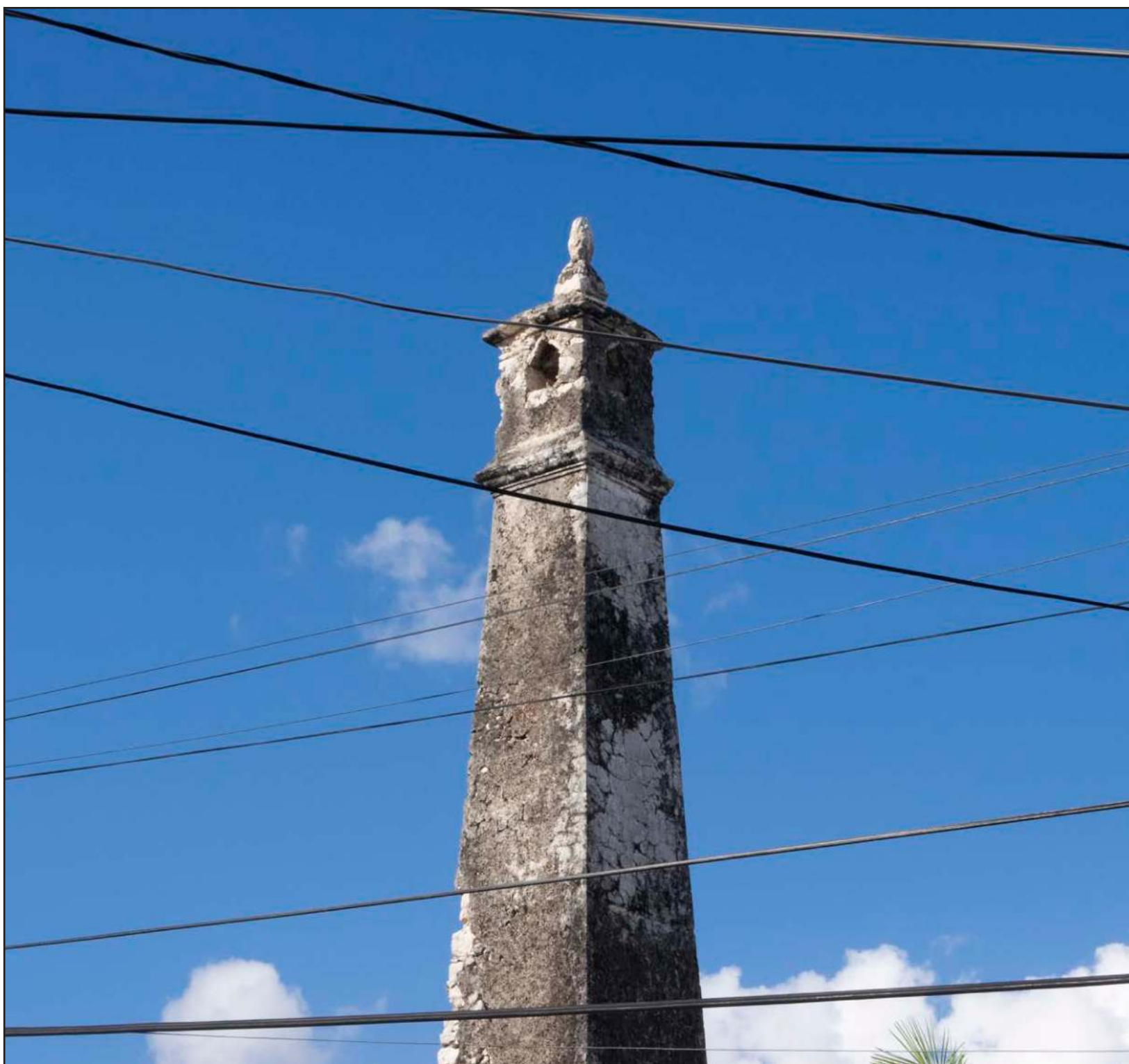
El estereotipo de Vergel, como muchas otras colonias del suroriente, la dibuja como una colonia insegura.

El acuaparque o “la aguada” era una sascabera enorme de donde se extrajo el material de construcción, “el sascab” o “tierra blanca”. El hueco se convirtió en un verdadero vergel: tenía piscinas, lago, cascada artificial, puente, muelle para hacer picnic, canchas, ciclista, tobogán, estacionamiento, flora y fauna. Hasta que las últimas tormentas lo inundaron todo.