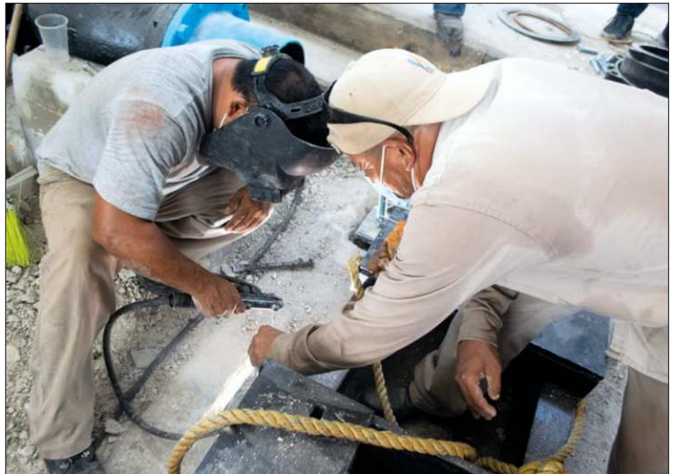
▲ Durante 2020, con motivo de la pandemia de Covid-19, en Yucatán se perdieron 25 mil empleos formales, y la economía cayó 7.7%.

Además, como muestra de los lazos de cooperación que promueve la entidad junto con otras instancias, con apoyo de la Embajada de los Estados Unidos, se otorgó un financiamiento para modernizar e impulsar sus productos, haciéndolos más atractivos para el mercado, pero manteniendo la esencia yucateca.