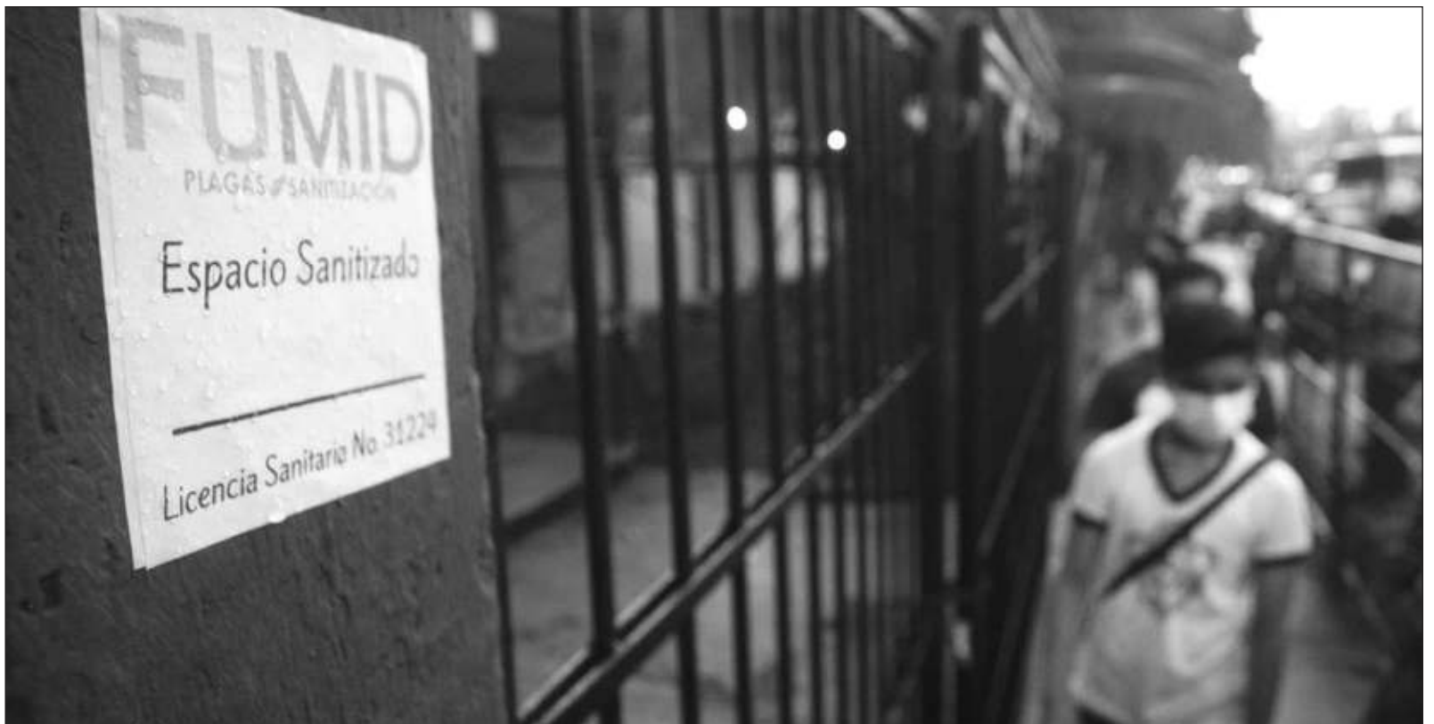
▲ Ómicron cambió los planes, aunque parece que la estrategia de vacunación permitió bajar la densidad de los decesos, la realidad es que ómicron nos envió de vuelta al encierro.