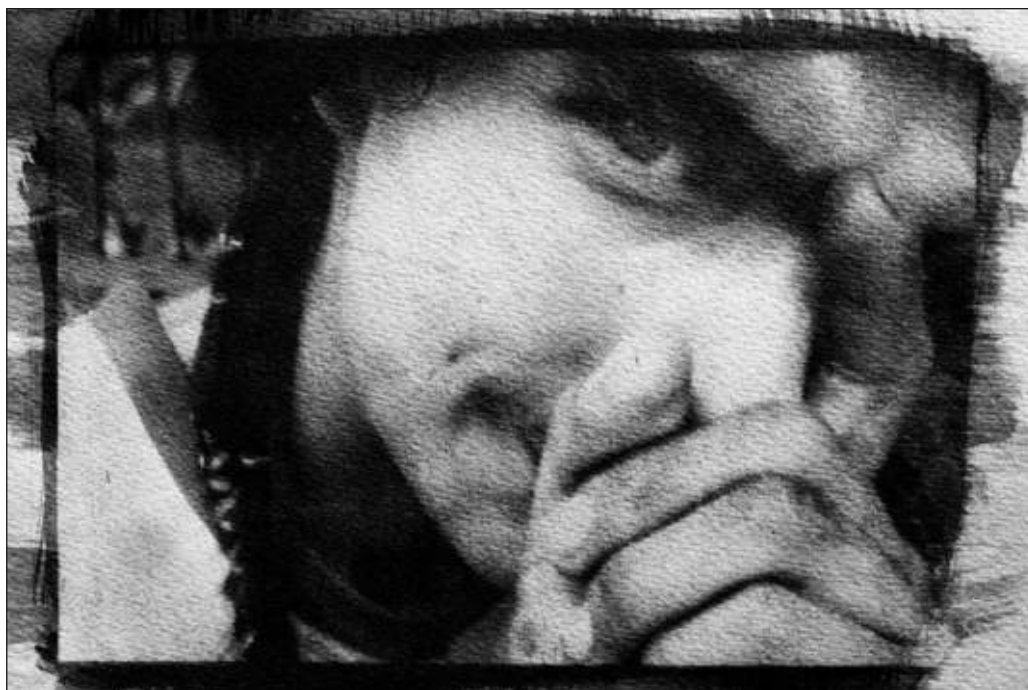
▲ Por cada clínica de adicciones con un mínimo de regulación podría haber medio centenar (o más) operando al borde de la clandestinidad.

Para transitar de manera exitosa del paradigma policiaco en torno a las drogas a uno enfocado en la salud pública, es indispensable contar con instituciones, infraestructura y personal que atiendan a personas adictas en un ambiente de respeto a sus derechos humanos, con tratamientos fundados en las mejores prácticas médicas y psicológicas, y con métodos libres de cualquier forma de coerción. En tanto falten esas condiciones, los usuarios de estupefacientes y las personas de su entorno seguirán atrapadas entre las estructuras criminales y los no menos delictivos centros que lucran con la desesperación de quienes no saben cómo ayudar a sus seres queridos.