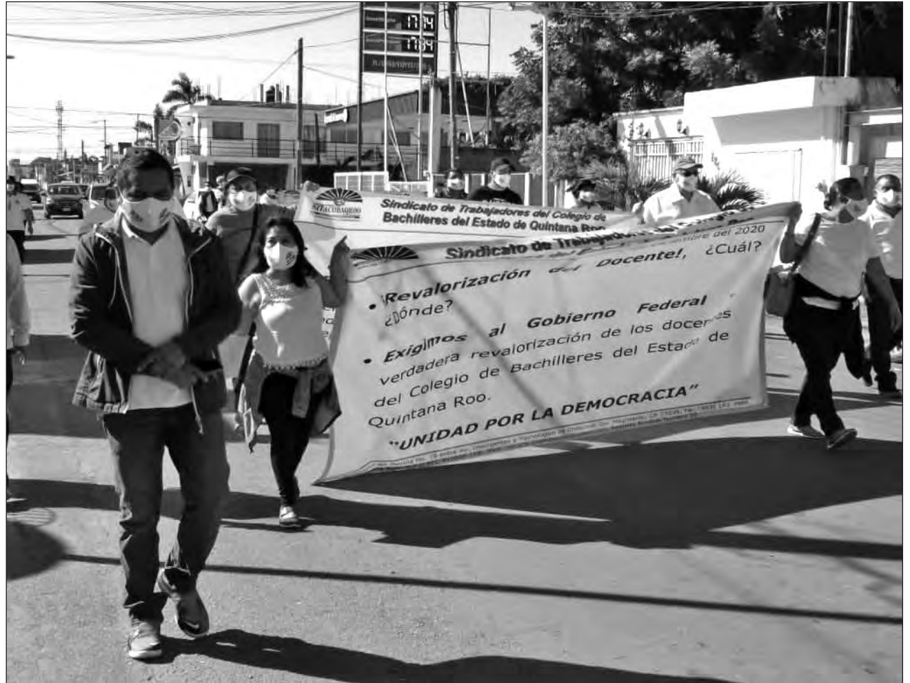
▲ Miembros del Sindicato de Trabajadores del Colegio de Bachilleres marcharon este martes para protestar por los adeudos del incremento salarial de este año y el retroactivo.

"Regresamos a dar clases, pero seguimos con la presión de trabajo con el direc-