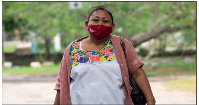
▲ Los productores de Cuxtal reciben apoyo del Ayuntamiento meridano a través del programa Círculo 47 .