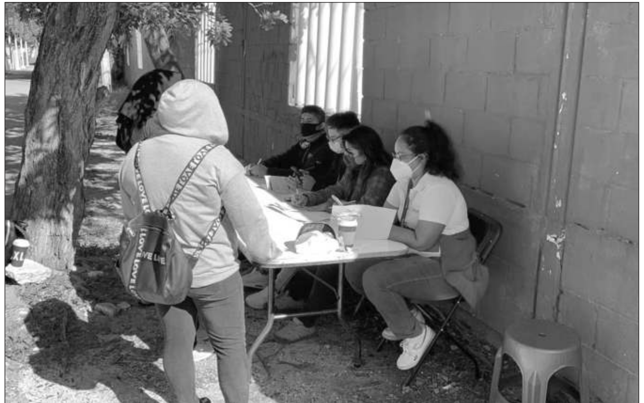
▲ En Tulum hubo un buen orden entre los asistentes, pese a que hubo quienes se formaron 17 horas antes para obtener la segunda dosis de Pfizer.

En Cozumel iniciará este martes 9 (Cansino) y se extenderá al 10 y 11, en el domo Bicentenario, mientras que en los municipios de Tulum será segunda dosis de Pfizer el 8, 9, 10 y 11 de noviembre; Isla Mujeres y Lázaro Cárdenas (Pfizer) los