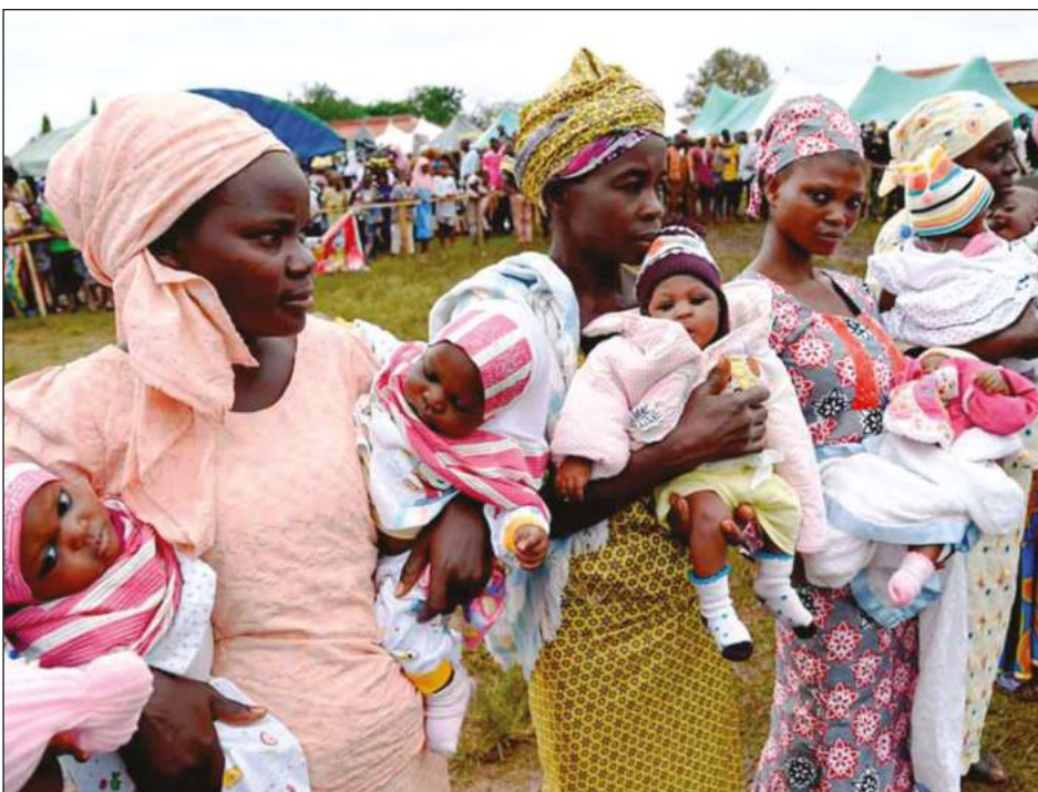
▲ Cuando aparecen gemelos en una familia, son portadores de un mensaje y de prosperidad, de acuerdo con el antropólogo Luiz Rodrigue.

La villa de Civita Giuliana, que desde 2017 cuenta con arqueólogos en la zona, fue durante años objeto de saqueos sistemáticos y parte del patrimonio arqueológico se ha perdido debido a los túneles cavados por los ladrones de tumbas que han generado un daño total estimado en casi 2 millones de euros en toda la villa, según los cálculos del ministerio italiano.