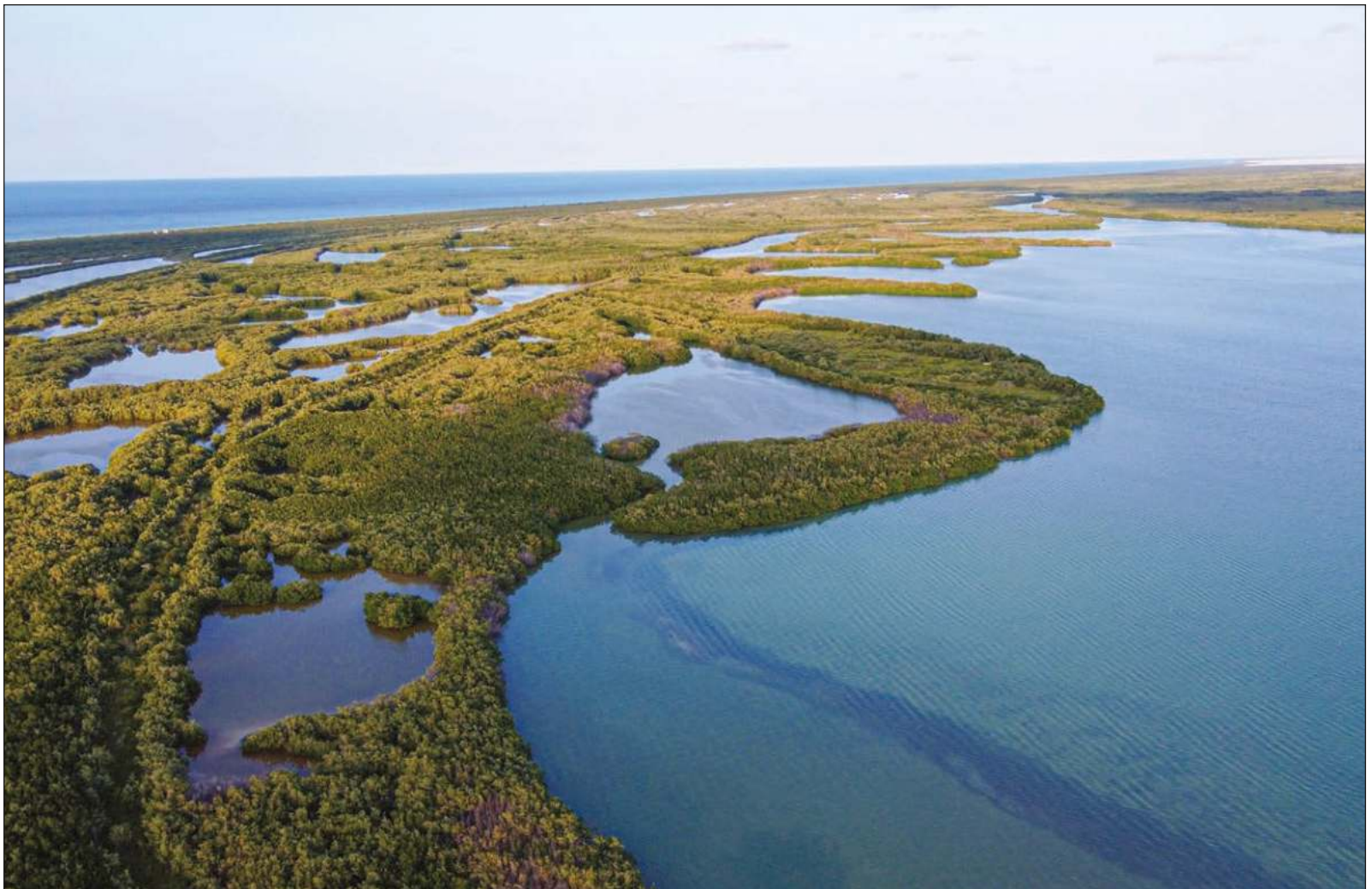
▲ Un ordenamiento ecológico territorial debe honrar su nombre y presentar información ecológica sólida a nivel de procesos, no sólo lo ambiental.