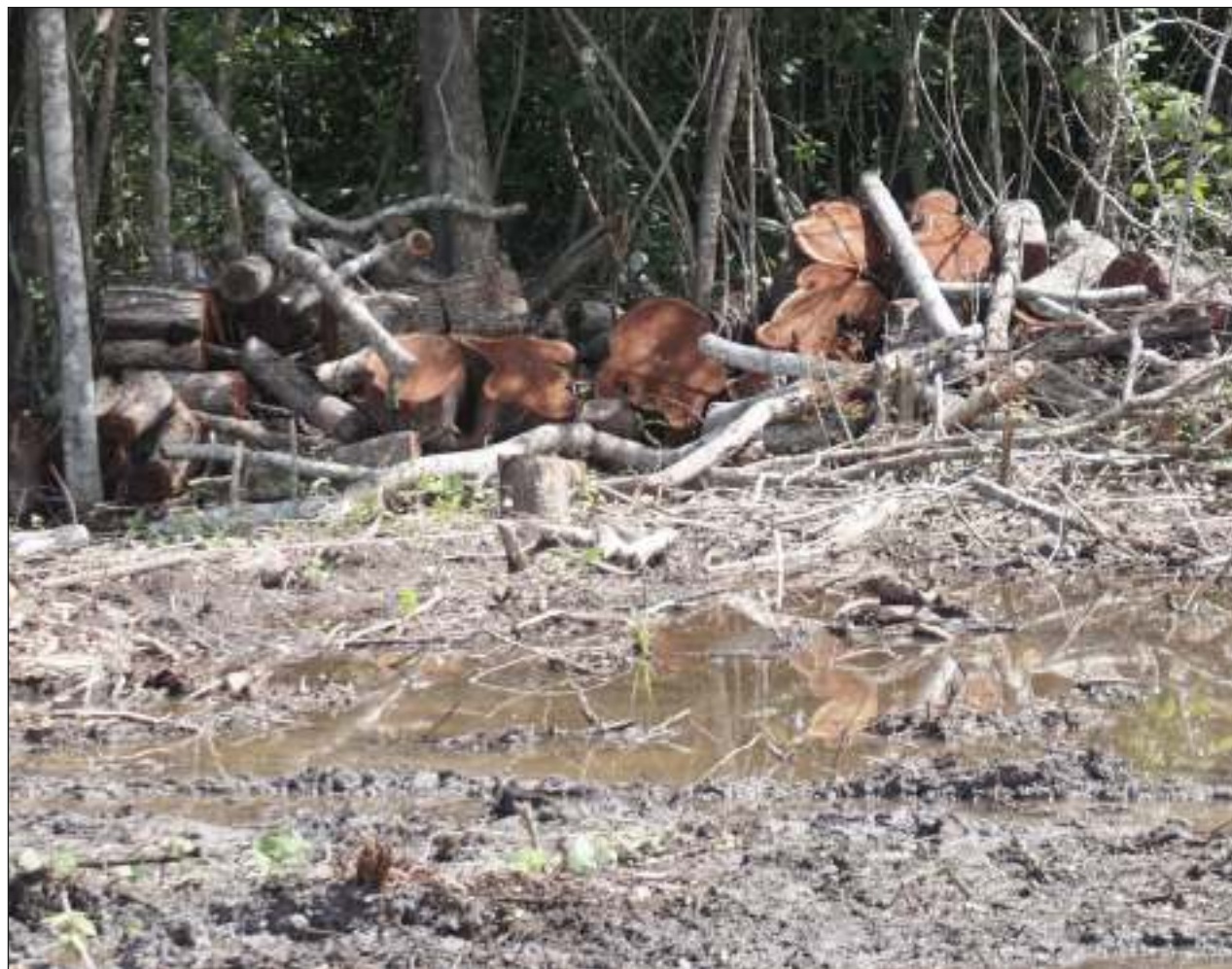
▲ El programa Sembrando Vida en algunos casos ha tenido “problemas de operación serios”, entre ellos que ha propiciado la tala de árboles en algunas zonas.

Gutiérrez recordó que en México y otros países en desarrollo, como los que comparten la selva del Amazonas, la deforestación ocurre “por necesidad y por pobreza”, ni siquiera porque existan proyectos productivos bien organizados, por lo que es necesario diseñar algún esquema que ayude a la población a no verse obligada a reducir la masa forestal.