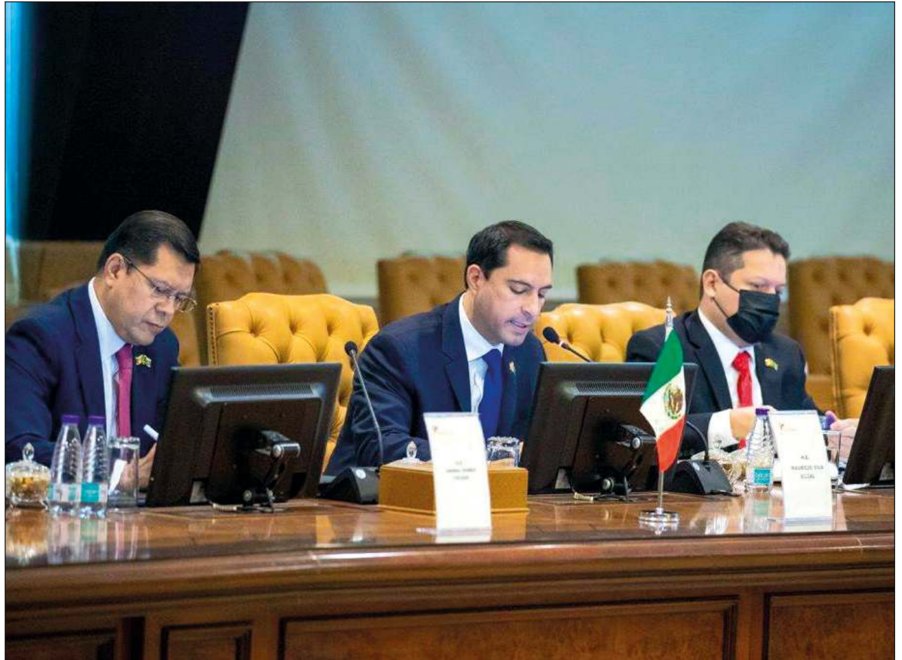
▲ Así como somos proveedores de los hoteles de la Riviera Maya y de Cancún, así podemos ser proveedores de Arabia Saudita para los miles de cuartos que se construirán, indicó el gobernador Vila Dosal.

La llegada de capital árabe al sector agroindustrial de Yucatán representaría la posibilidad de crear fuentes de empleo en el interior del