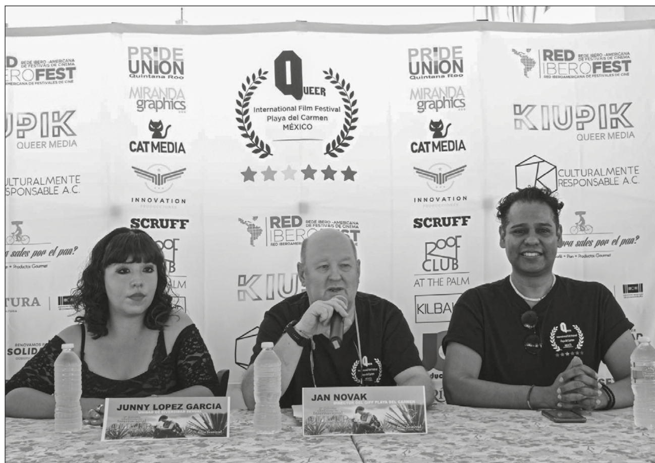
▲ Las actividades del festival iniciarán el 11 de noviembre, con la inauguración y una alfombra roja, dieron a conocer los organizadores del evento.

El 11 será la inauguración y alfombra roja con invitados especiales como