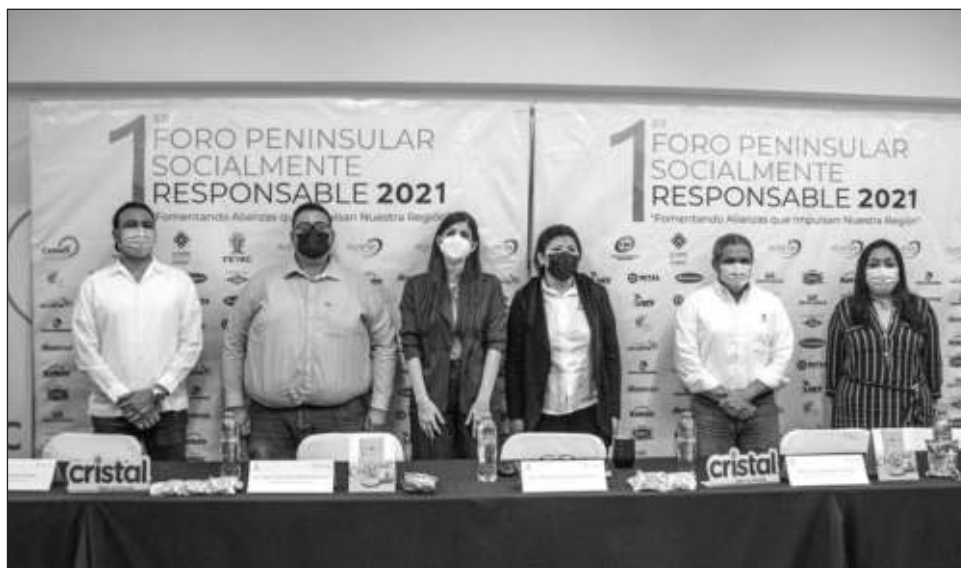
▲ La Fundación del Empresariado Yucateco convocó a participar en el foro digital.

Para poder participar, dijo, es necesario realizar un registro para enviarles la liga a la sesión de Zoom donde será el evento desde las 8:00 ho-