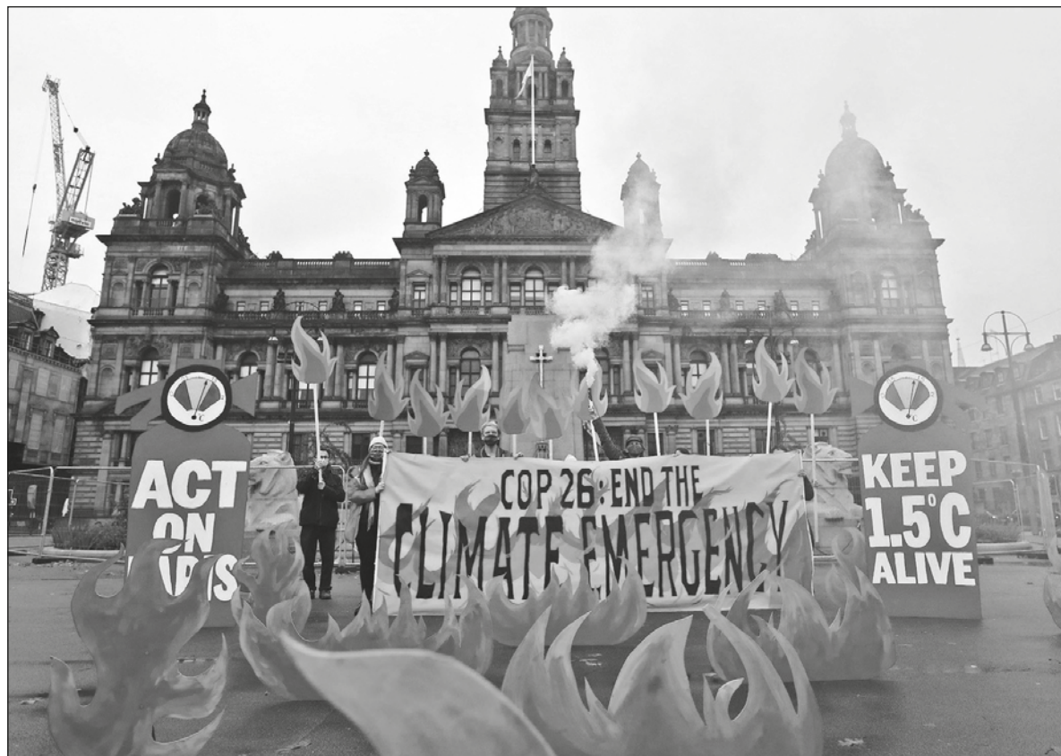
▲ Delegados enviados por empresas transnacionales del sector energético, en particular de empresas dedicadas a la extracción de carbón, petróleo y gas, son mayoría en la cumbre del clima.

La presencia en la COP26 de cientos de personas a las que se les paga para impulsar los intereses tóxicos de las empresas contaminantes de combustibles fósiles solo aumentará el escepticismo de los