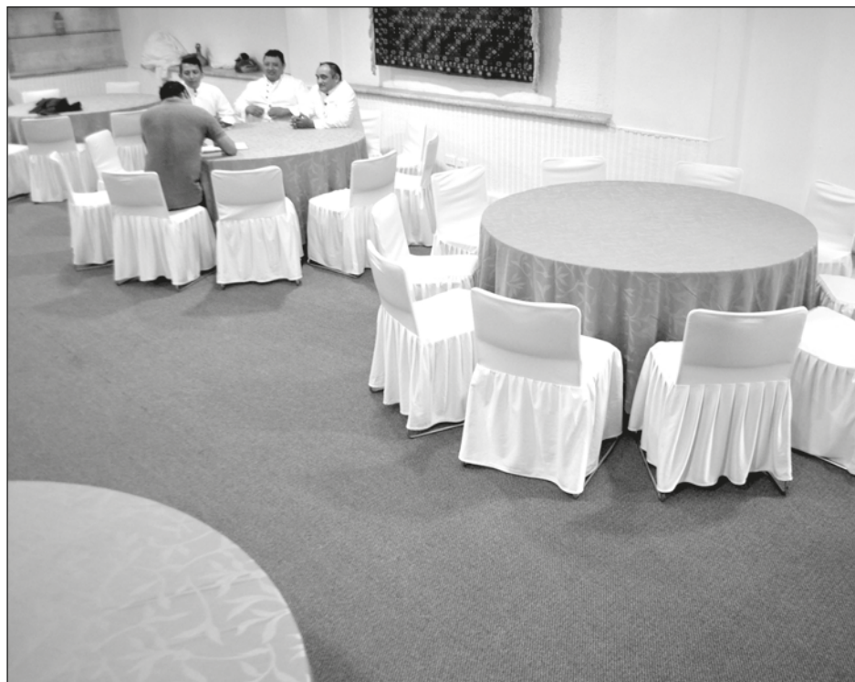
▲ A partir del 5 de noviembre se incrementa el aforo al 75 por ciento en prácticamente de todos los giros comerciales, excepto el de eventos sociales.

La Secretaría de Salud de Yucatán recordó que, el protocolo vigente para los eventos sociales es del 40 por ciento de aforo en lugares cerrados y 60 por ciento en abiertos.