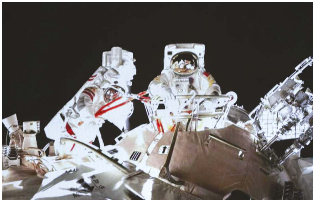
▲ Está previsto que la misión, que comenzaron con su llegada el 16 de octubre, sea la estancia más larga hecha por astronautas chinos en el espacio.

Wang y su colega Zhai Zhigang salieron el domingo del módulo principal de la estación y pasaron más de seis horas en el exterior para instalar equipamiento y hacer pruebas con el brazo robótico de la estación, según la agencia espacial china de misiones tripuladas.