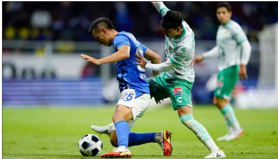
▲ La Máquina tiene la oportunidad de eliminar a Monterrey, que lo dejó fuera de la Liga de Campeones de la Concacaf.