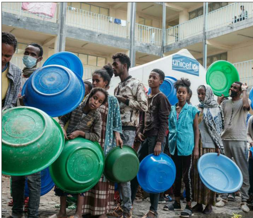
▲ Los conflictos, el cambio climático y la pandemia por el Covid-19 están agravando la hambruna en todo el mundo.

También se observa un aumento del hambre en Etiopía, Haití, Somalia, Angola, Kenia y Burundi, de acuerdo con el PMA.