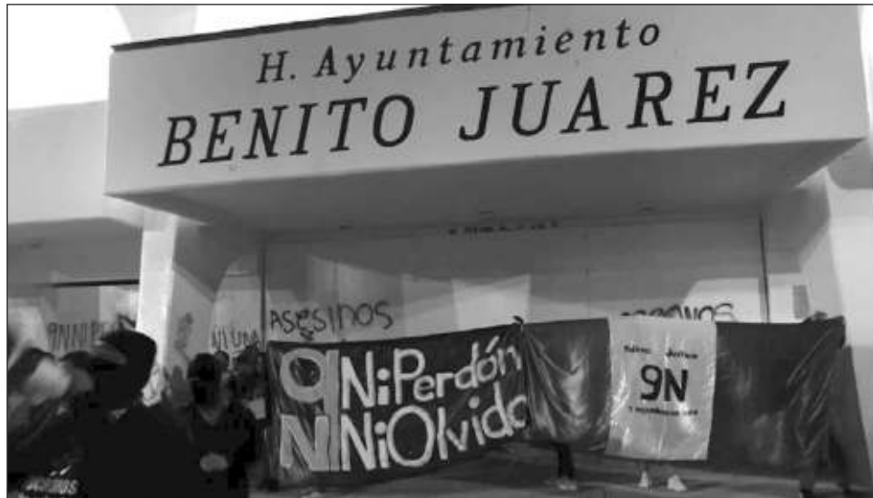
▲ Alrededor de 60 personas se manifestaron de forma pacífica hacia las instalaciones de la fiscalía, para después trasladarse al ayuntamiento de Benito Juárez.

La marcha se realizó de manera pacífica, excepto por algunas pintas en espacios públicos como la vicefiscalía del estado y el ayuntamiento de Benito Juárez, que fue resguardado con mamparas. La movilización causó enojo entre los automovilistas por el cierre de calles principales.