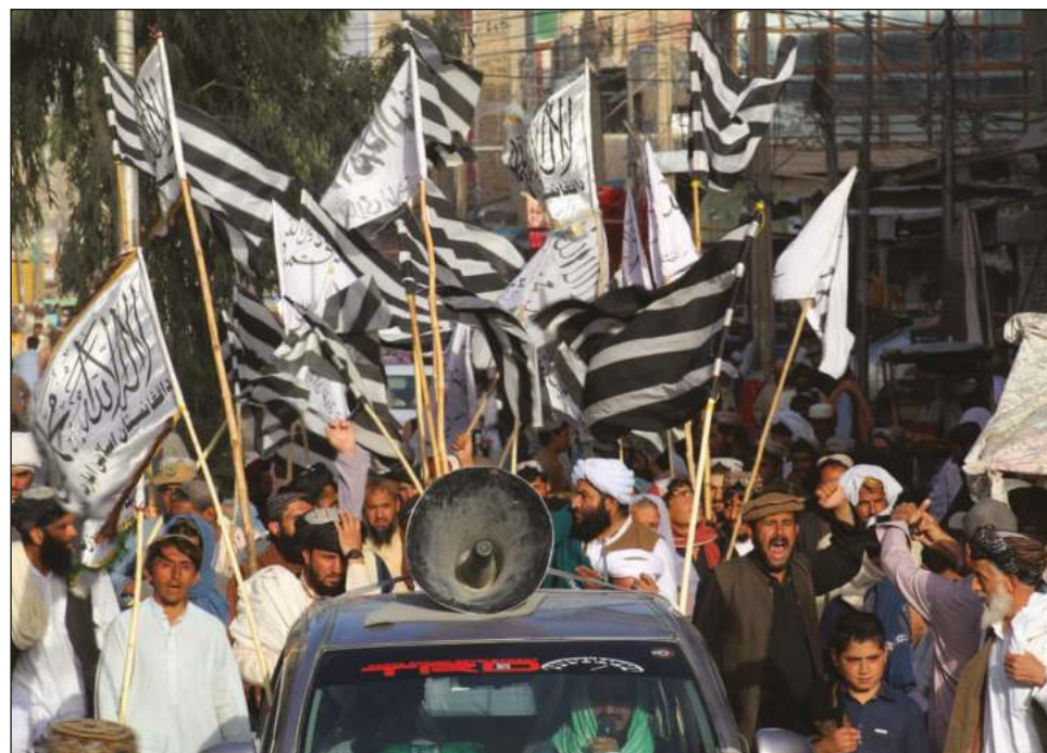
▲ El TTP es un paraguas de varios grupos tribales creado en 2007, que busca imponer un Estado islámico en Pakistán.

Chaudhry remarcó además que estas conversaciones se mantienen dentro del marco “de la Constitución y la ley”, ya que “ningún gobierno puede emprender negocia-