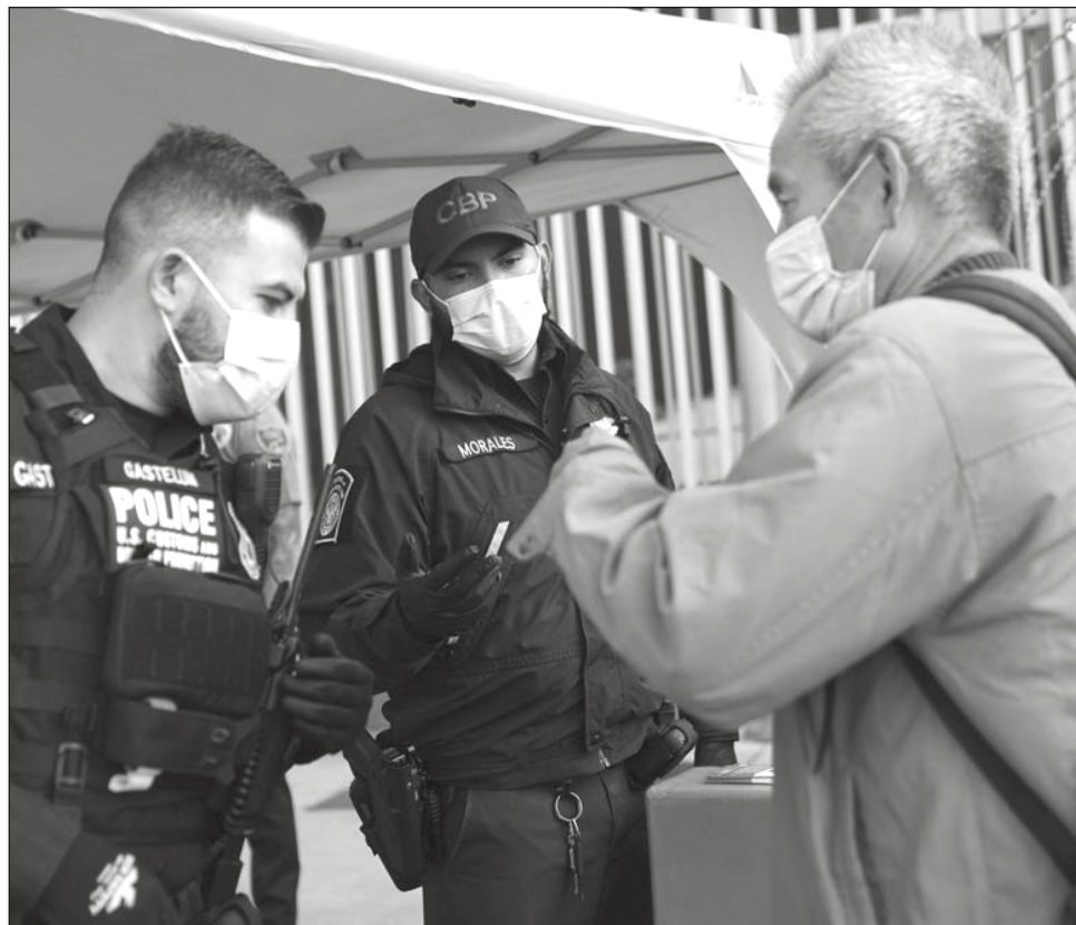
▲ Sin incidentes ni filas en las garitas de Baja California, Chihuahua, y Nuevo León.