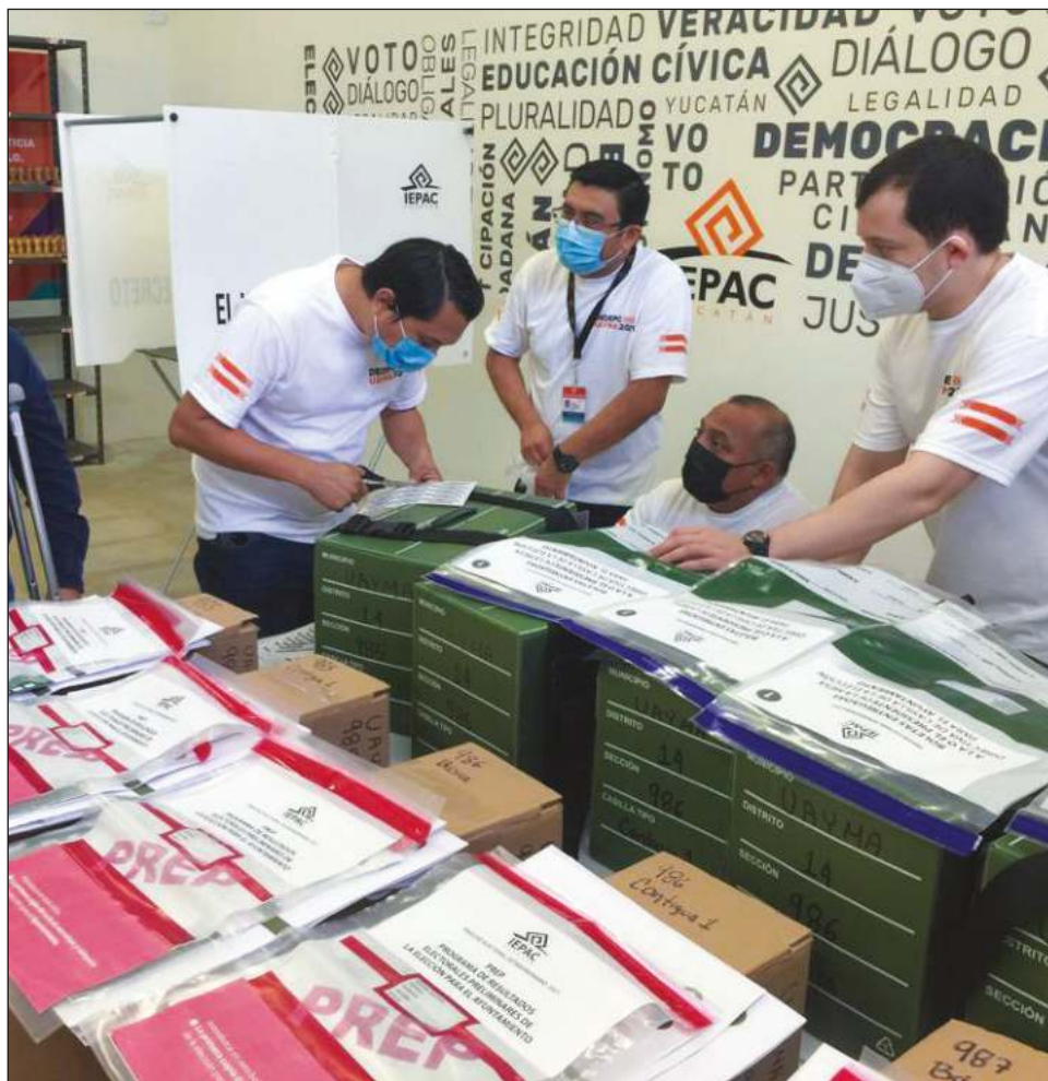
▲ Las 3 mil 280 boletas electorales llegaron el pasado 4 de noviembre al Iepac, y fueron elaboradas por la empresa Impresora de México.

El Instituto informó que, como parte del proceso electoral extraordinario, esta semana cerró la etapa de inscripción para personas que desearan ser observadoras y observadores electorales.