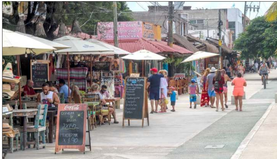
▲ Blindando cada uno de los municipios de Quintana Roo, se evitará que la delincuencia organizada se expanda en el territorio estatal.

Los Consejos Coordinadores Empresariales del estado (Cancún, Riviera Maya, Chetumal y Cozumel) hicieron público un documento en el que exigieron reforzar la seguridad en todos los municipios: “los sucesos ocurridos recientemente que han opacado el destino en materia de seguridad son lamentables, sin embargo, sabemos que estas conductas criminales obee-