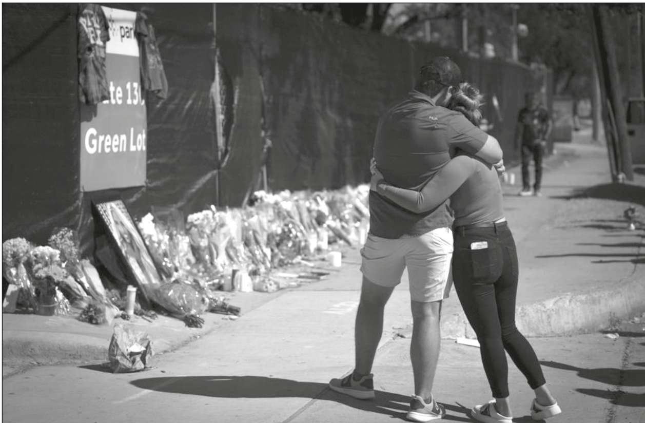
▲ Las autoridades de Houston indicaron que estaban en las primeras etapas de la investigación sobre lo que causó el pandemónium.

Schmidt alertó que Bosnia y Herzegovina afronta “la mayor amenaza existencial” desde el fin de la guerra, que de 1992 a 1995 enfrentó a musulmanes, serbios y croatas y causó casi 100 mil muertos.