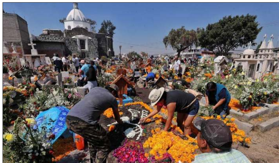
▲ Es altamente probable que en noviembre y diciembre se registre una nueva ola de Covid-19, aunque, si la vacunación continúa, la transmisión quedará acotada.

Pero si la vacunación sigue avanzando y no aparece una nueva cepa del virus, la transmisión quedará más acotada en