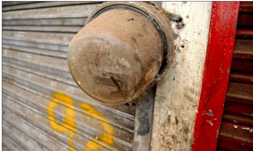
▲ El uso ilícito de electricidad se refiere a robo, fallas o daños en equipos de medición y errores administrativos, y en el periodo observado aumentó 28.44 por ciento.

“Comparando el monto de las pérdidas frente al