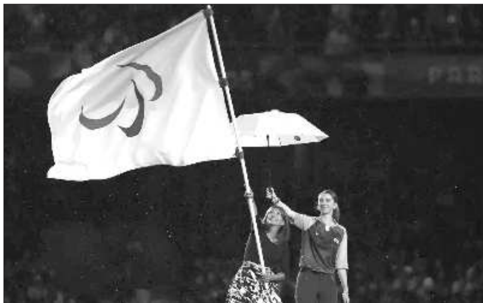
▲ La alcaldesa de París, Anne Hidalgo, ondea la bandera paralímpica en la ceremonia de clausura.

México concluyó su participación con 17 medallas, tres de oro, seis de plata y ocho de bronce, en el lugar 30. Entre las seis preseas de plata estuvo la de la yucateca Gilda Cota, en lanzamiento de bala categoría F33. China dominó con 220 metales en total, 94 de oro. Luego se ubicaron Gran