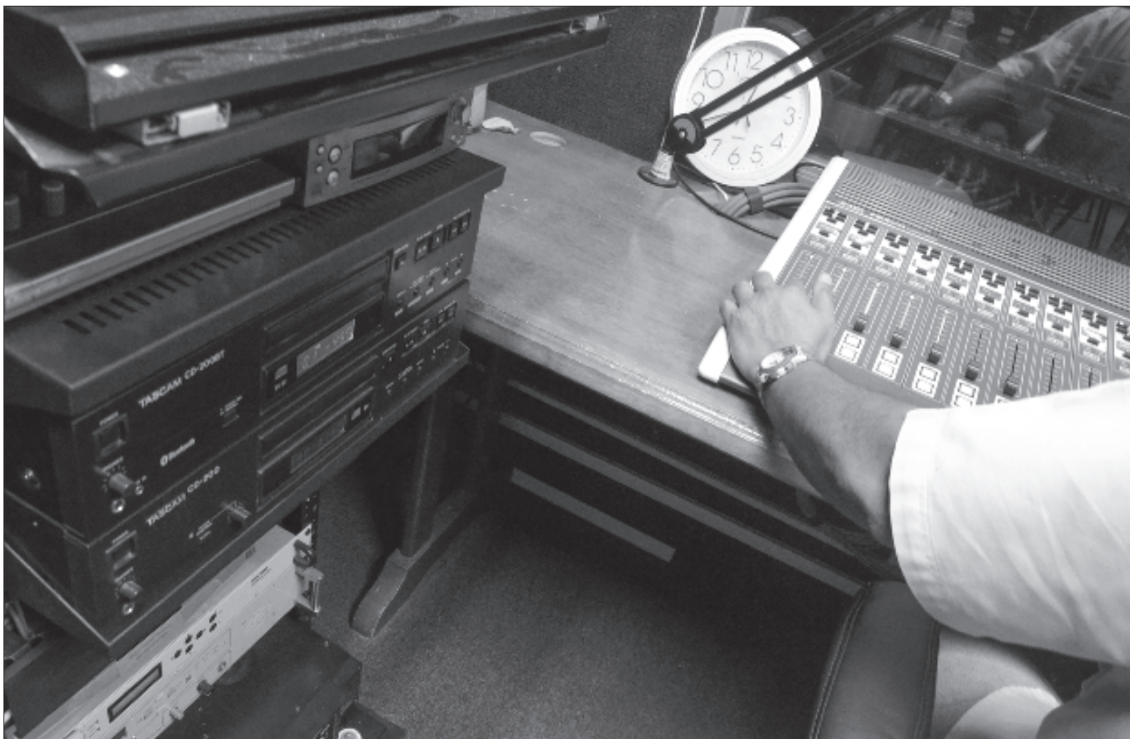
▲ "¿Qué ha hecho el Instituto Mexicano de la Radio al respecto? Al parecer, nada o no lo suficiente. Hay especialistas que no han sido aprovechados, ni siquiera han sido escuchados en ninguna parte. Si así se continúa, habrá que emprender los preparativos funerarios de la radio pública".