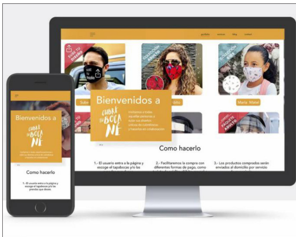
▲ La campaña tiene el objetivo de prevenir posibles contagios y acelerar la reactivación económica en la entidad.

Reapertura económica ha sido lenta y confusa: Michel Salum