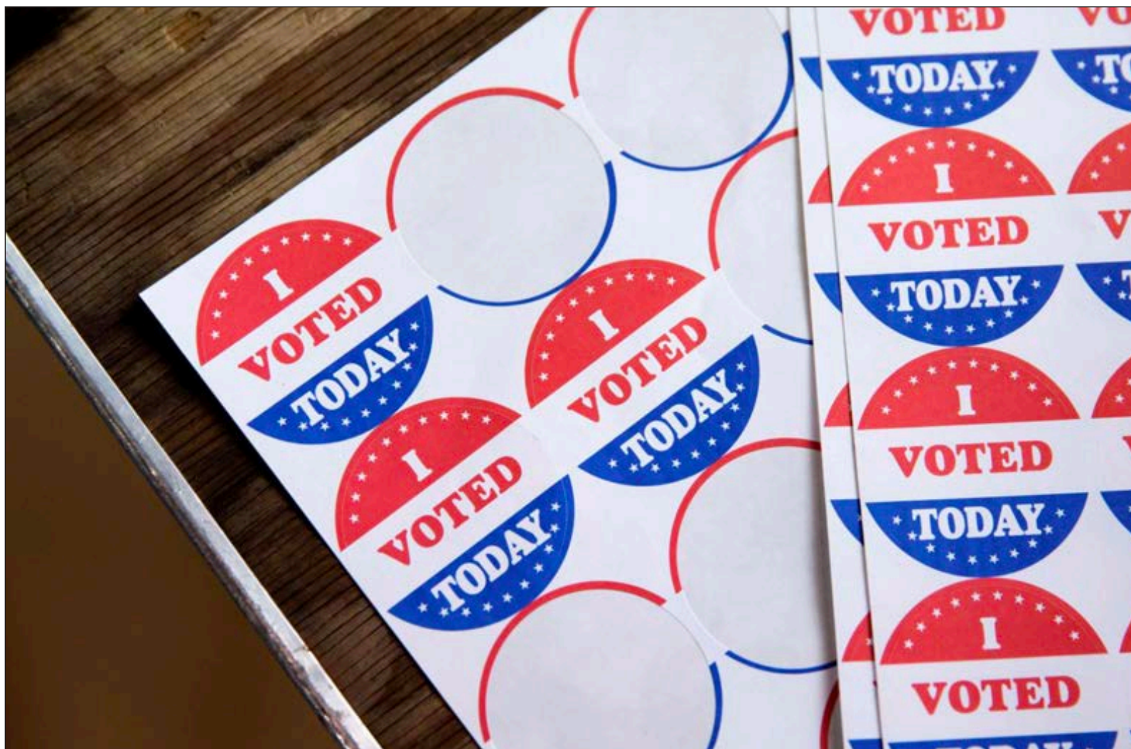
▲ This will not be an election based on policy but, rather, on character.