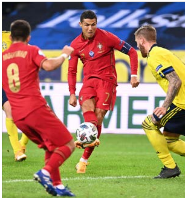
▲ Cristiano Ronaldo agrandó su leyenda al alcanzar el centenar de goles con Portugal.

En su partido número 165 con la selección, Cristiano abrió la cuenta a los