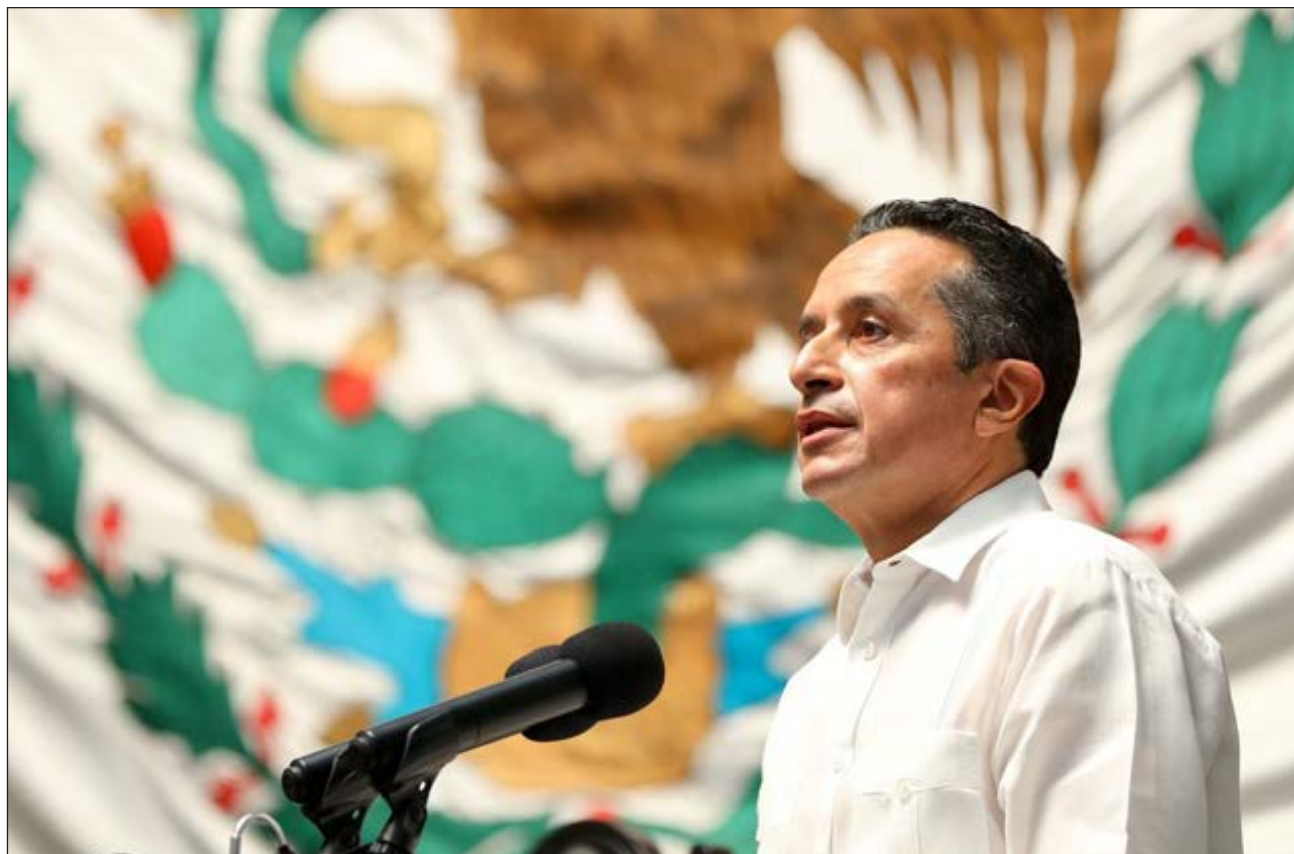
▲ Durante su discurso, el gobernador Carlos Joaquín hizo un llamado a los diputados federales y al gobierno de México para que los recursos del Fonden puedan ser aplicados en turismo, educación y vivienda.

A las 19:30 horas, Carlos Joaquín envió un mensaje a la ciudadanía a través de redes sociales desde el C5 de Cancún.