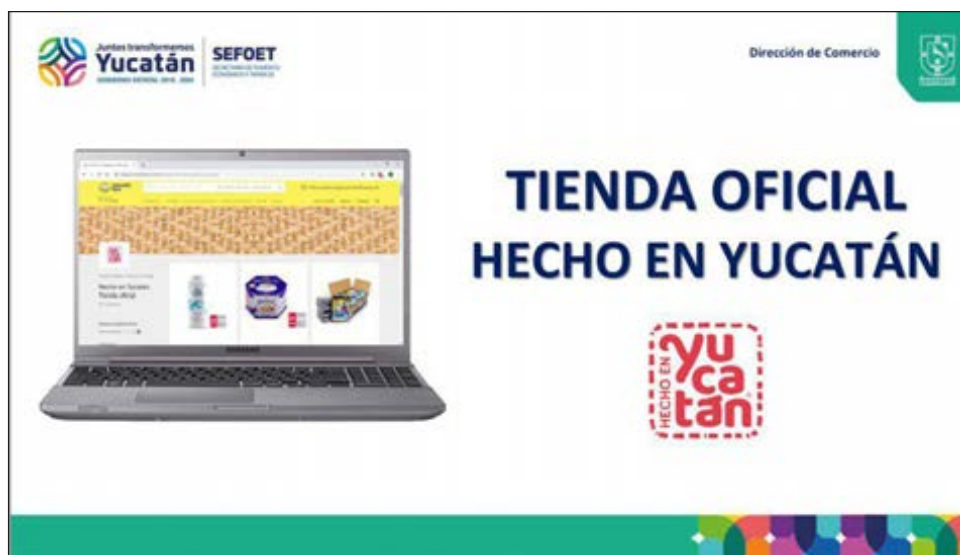
▲ La tienda Hecho en Yucatán es una estrategia para impulsar el desarrollo comercial del estado mediante el uso de nuevas tecnologías.

Hay que recordar que la tienda oficial Hecho en Yucatán es una de las estrategias para impulsar el