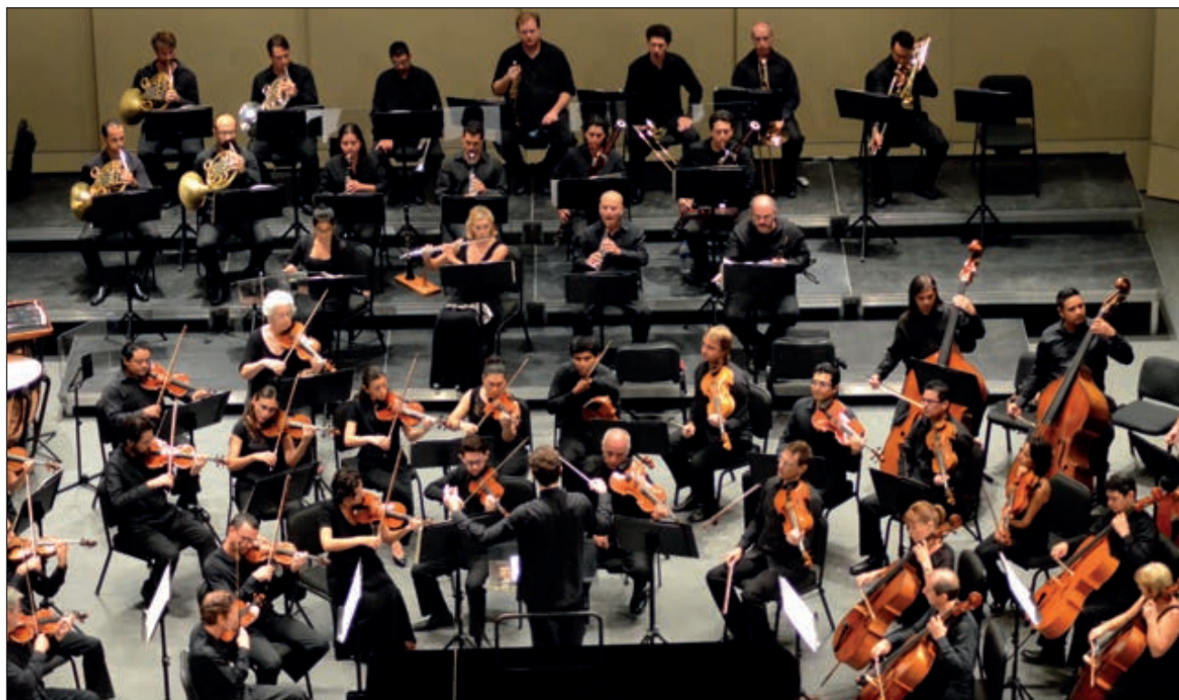
▲ Para disminuir el riesgo de contagio, los recitales programados no contarán con los 70 músicos que integran la orquesta.

Escobedo adelantó que no se podrá disfrutar de los recitales de manera habitual, esto por motivo de la distancia entre los 70 músicos que integran la OSY; aunque también fue gracias a esto que descubrieron la gran oportunidad de reencontrarse con un repertorio nunca interpretado.