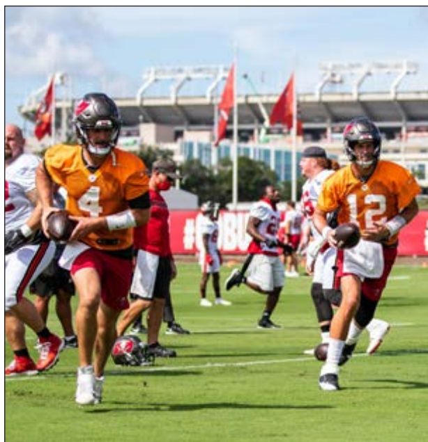
▲ Tom Brady (12) tendrá un debut durísimo con Tampa Bay al visitar a Drew Brees y los Santos este domingo.

-Santos: En el papel Nueva Orleans es el equipo más completo de la Nacional junto con San Francisco. La dupla Sean Payton-Drew Brees tiene todo para conquistar un segundo anillo. La ofensiva será aún más explosiva con el receptor Emmanuel Sanders; la defensiva puede presionar al mariscal de campo (51 capturas en 2019; tercer lu-