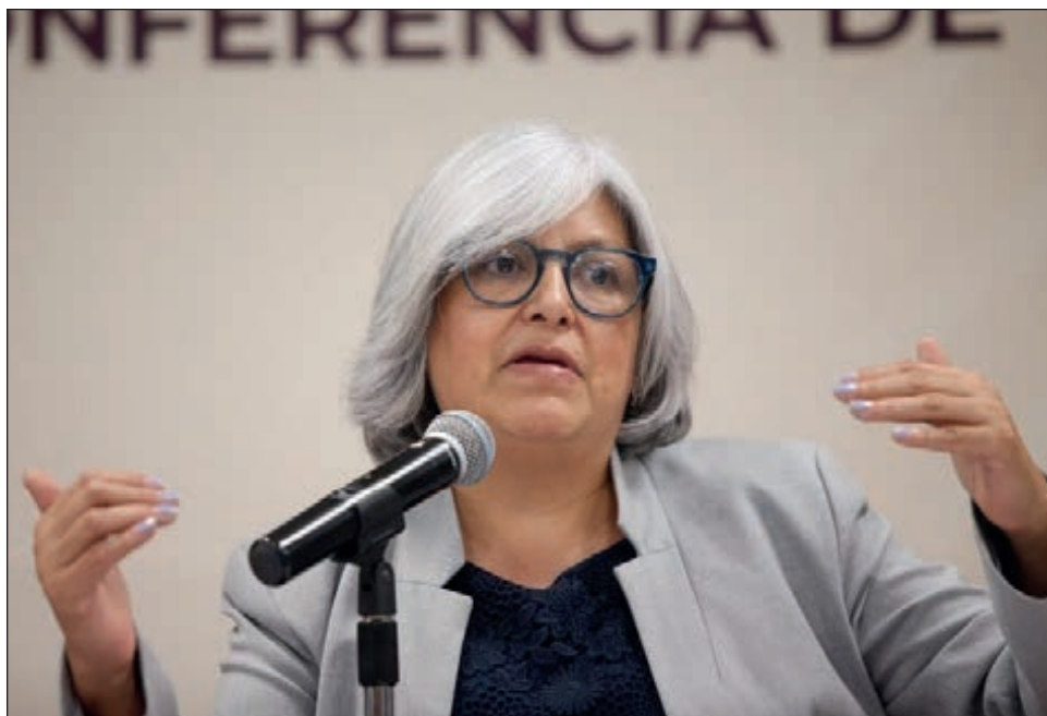
▲ Graciela Márquez, titular de la Secretaría de Economía, informó que la décima edición de El Buen Fin se realizará del 9 al 20 de noviembre próximos.

Sentido señaló que el objetivo para esta nueva edición del programa será alcanzar los 118 mil millones de pesos en ventas que se reportaron el año pasado o incluso rebasarlos ligeramente.