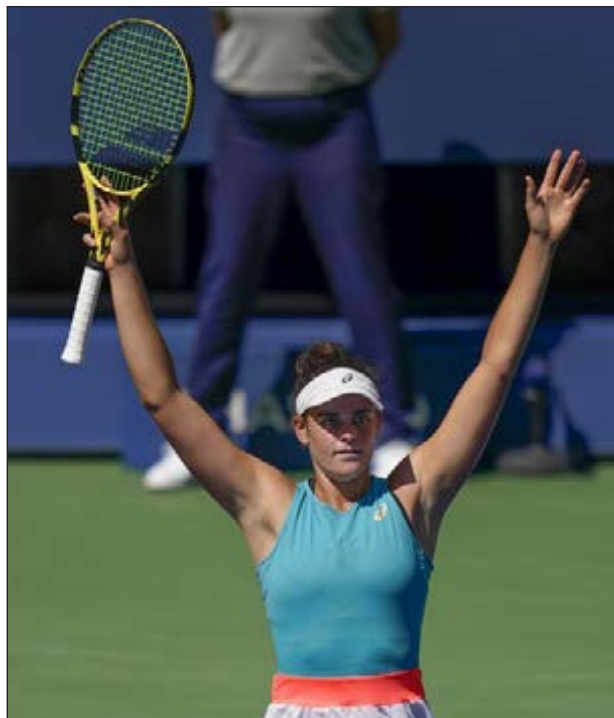
▲ Jennifer Brady lleva un paso arrollador en el Abierto estadounidense.

Por otro lado, Ash Barty optó por darle prioridad a su salud que mantenerse como la número uno del tenis femenino al renunciar a un segundo torneo de Grand Slam durante la pandemia de coronavirus.