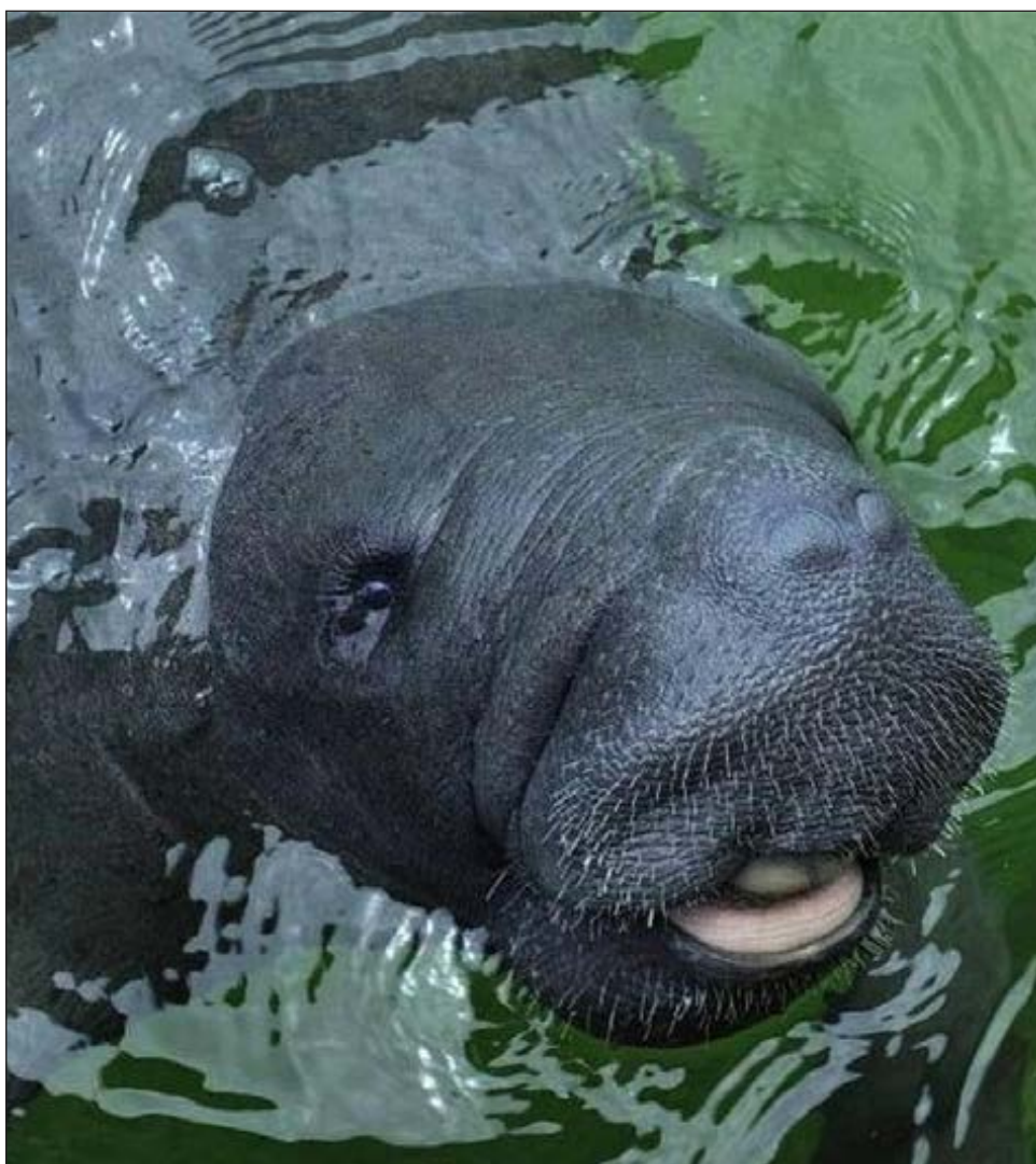
▲ Cada 7 de septiembre en México se conmemora el Día Nacional del Manatí.

La celebración incluye varias actividades culturales presentadas vía virtual