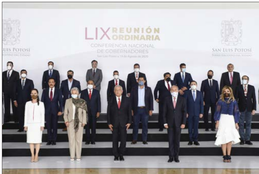
▲ La CONAGO era un punto de encuentro al que se iba por voluntad y, probablemente, con voluntad de hacer que las cosas funcionaran para todos.

La democracia no puede funcionar sin cordialidad entre quienes participan en ella. La democracia no puede sobrevivir a la polarización permanente y creciente.