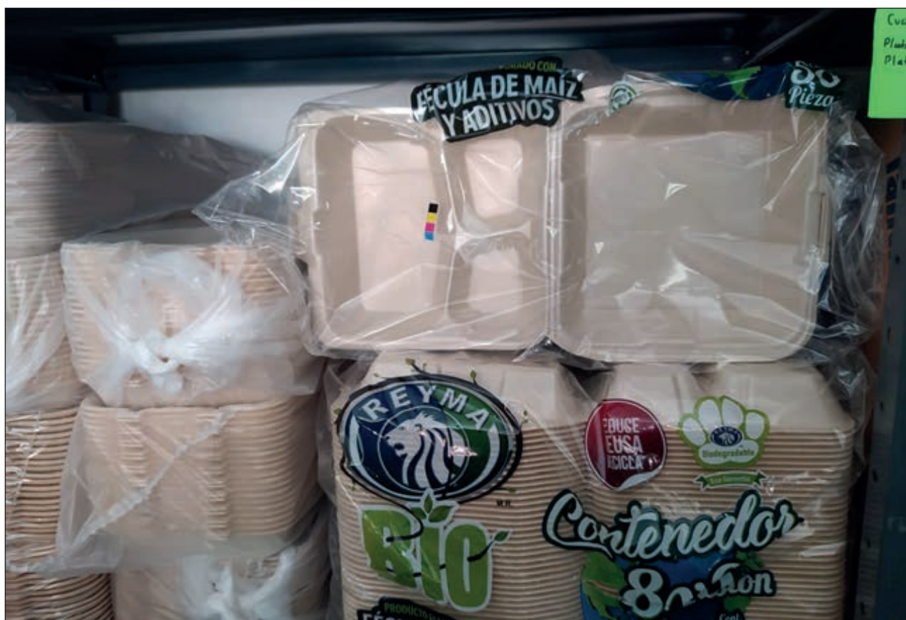
▲ Los negocios de desechables del centro dependen del mercado, mientras que la clientela ha preferido perder un peso a movilizarse para comprar estos artículos.

Podría pensarse, entonces, que la venta de los productos desechables ha aumentado considerablemente, incluso porque en un momento los restaurantes no abrieron sus puertas y sólo llevaban sus platillos a domicilio. Sin embargo, el panorama es en realidad bastante irregular y tiene mucho qué ver con las zonas geográficas.