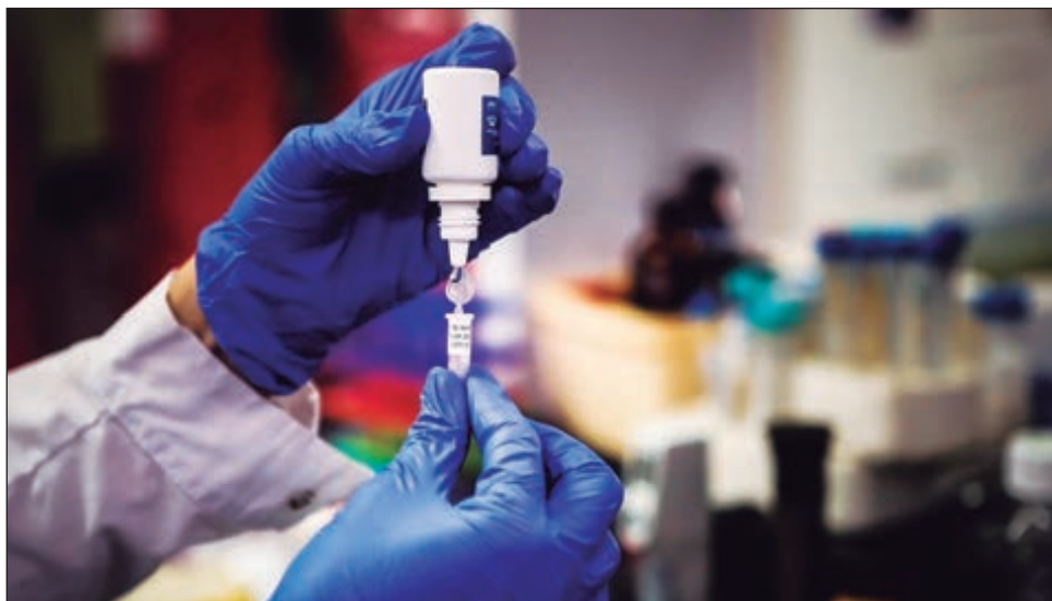
▲ Hasta el momento, hay registro acumulado de 637 mil 509 personas contagiadas del nuevo coronavirus en nuestro país.

Sobre la estrategia de vacunación contra el coronavirus, López-Gatell señaló que el grupo es coordinado por él y que además representará a la Comisión Federal para la Protección contra Riesgos Sanitarios, ya que el