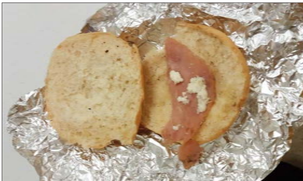
▲ Trabajadores de la plataforma Abkatún Alfa dieron a conocer imágenes de la comida que les brindan, apreciándose una torta de jamón y queso con cebolla.