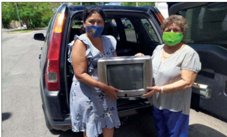
▲ Televisores y celulares no tan nuevos, todo cuenta para que niños de 40 familias puedan aprender en Tekantó, durante este ciclo escolar.

Aseguró que este curso beneficiará a los estudiantes porque además de la televisión tienen los libros de texto gratuitos, así como los útiles. “Se entrega un plan semanal, por ejemplo de la página 5 a la 10 tienen una semana para resolver ejercicios de español; de la 10 a 20 matemáticas y toda la semana para hacer la tarea. Entonces los niños van haciendo sus propios horarios de trabajo, pero ya cuentan con los libros; el gobierno les dio también los útiles es-