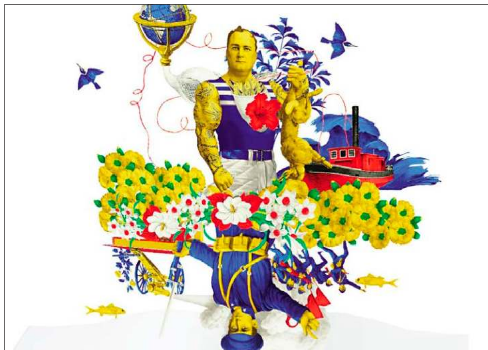
▲ El disco Homenaje a Cien años de soledad en seis vallenatos surgió con la intención de que “pudieras hacerte una idea –imposible, narrarla completa en seis canciones–, pero que se entendiera desde el origen de la fundación de Macondo, hasta el final de la novela”.

El segundo material apareció años después. Se trataba de un recorrido fotográfico por los lugares plasmados en la obra del escritor. Esta empresa lo llevó a conocer a especialistas en la literatura de García Márquez, así como a estudiar y retratar esos espacios: el colegio en