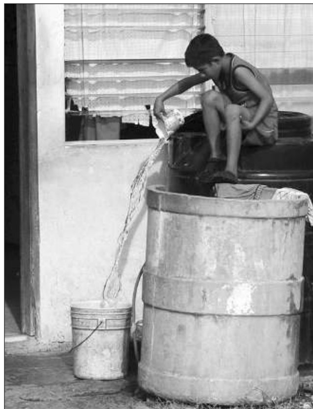
▲ La Comisión cambiará diversos tramos de la red que han colapsado por la falta de mantenimiento de las administraciones pasadas y que ahora se encuentran dañadas.

Durante el tiempo que dure este proceso, el SMAPAC estará atendiendo las familias de estas colonias, a través de pipas, que estarán surtiendo del vital líquido los días miércoles y sábados.