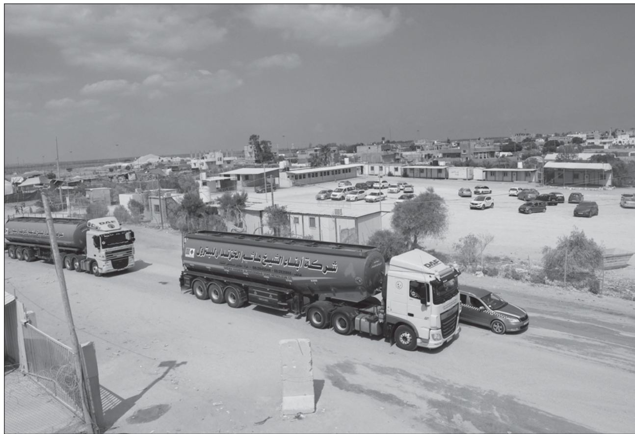
▲ Tras la tregua, gracias a la mediación de Egipto -intermediario histórico entre Israel y palestinos- el Estado hebreo anunció también la reanudación de la circulación ferroviaria y autorizó a sus ciudadanos a salir de los refugios.

La vida diaria en Gaza había quedado paralizada y la única central eléctrica tuvo que cerrar el sábado por falta de combustible, después de que Israel cerrara las fronteras del enclave de 362 kilómetros cuadrados, donde viven 2,3 millones de palestinos.