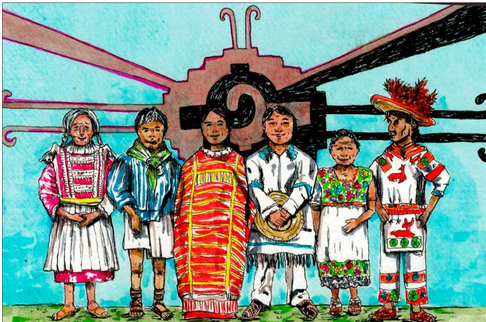
▲ En muchos pueblos está habiendo un despertar y fortalecimiento del papel de la mujer en la toma de decisiones y la preservación cultural. Ilustración Sergiopv @serpervil