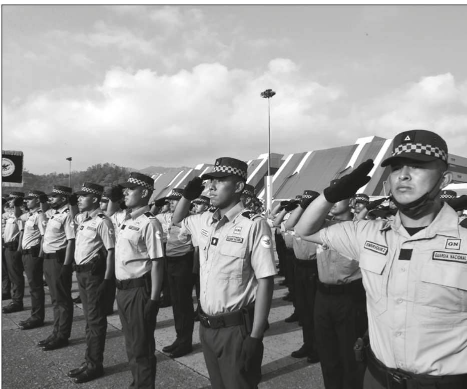
▲ La Secretaría de Seguridad Pública asumirá las funciones de justicia para los reos que están indebidamente purgando condenas en los penales.

—Comparto lo que dijo el licenciado Ebrard: unidad es piso parejo, es un trato igualitario y respetar los resultados de las encuestas, un trato apegado a la ley interna. Así se construye con piso parejo, escuchando al pueblo y a la militancia y respetando el resultado”.