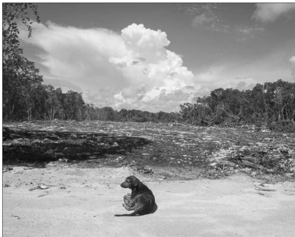
▲ El Juzgado Primero de Distrito, con sede en Yucatán, calificó que el interés individual no debe exceder al colectivo, y esta obra traerá un beneficio comunitario.

Estas dos resoluciones se suman a las tres obtenidas la semana pasada por Fonatur a su favor, y aún está pendiente un juicio más, pues son seis los amparos interpuestos contra el megapro-