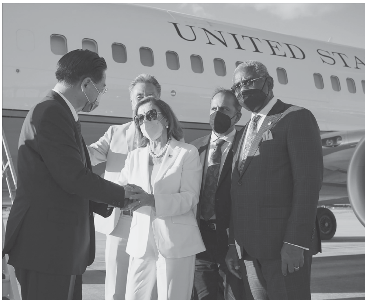
▲ "The main purpose of Nancy Pelosi's visit served to warn China not to attempt to emulate Russia's invasion of Ukraine by forcefully taking possession of Taiwan... such a move would have dire consequences for all".

SHOULD THE SITUATION come to blows, the U.S. and its allies would likely put strong sanctions against Beijing. This would disrupt already fragile production chains that would not only jeopardize the Chinese economy but also put the Western economies, already dependent on China as its manufacturing center, in grave danger of collapse.