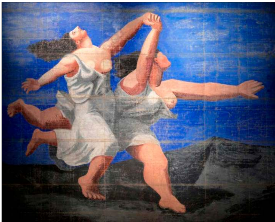
▲ La influencia del cubismo en las creaciones de Chanel es visible en la predilección por los colores blanco, negro y beige. Cuadro Dos mujeres corriendo por la playa (La Carrera) , Pablo Picasso

Por último, la sección de Le Train Bleu y del ballet producido por Diághilev en 1924, con libreto de Cocteau, que se inspiró en los juegos olímpicos, el jazz y el cine mudo.