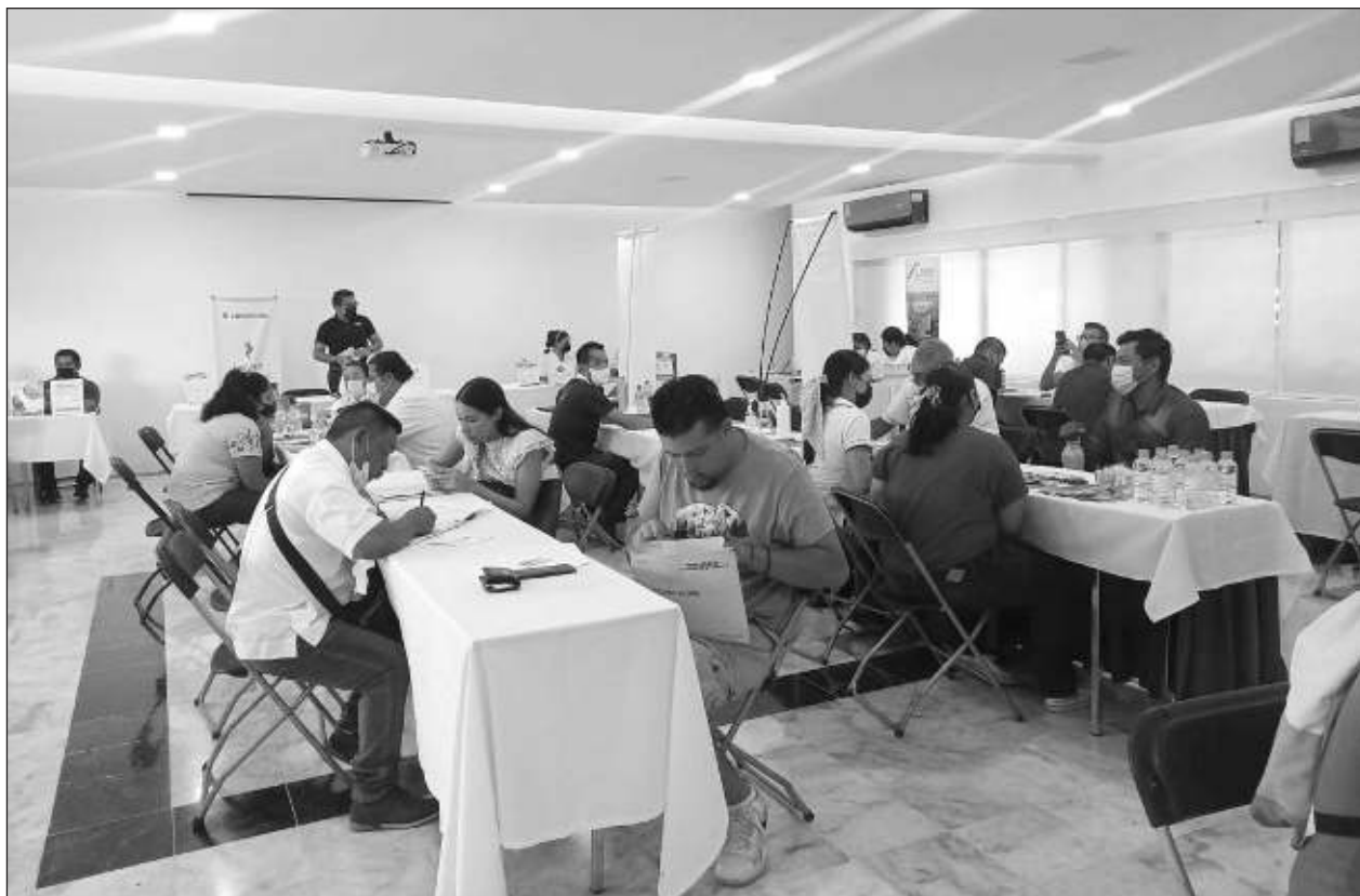
▲ Este lunes, 18 empresas se sumaron al evento para ofertar un total de 350 plazas laborales.

Sin embargo, en la zona sur del estado sí se iniciará una labor de reclutamiento inmediata, específicamente con Belice, país con el que se tiene una historia de relación muy antigua y que permitirá fortalecer los lazos, así como cubrir la necesidad que hay en esa parte del estado.