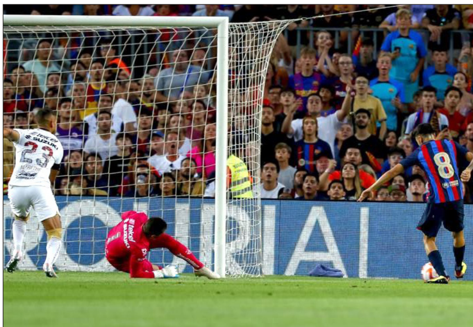
▲ Pedri se apresta a anotar tras eludir al arquero en la victoria 6-0 de Barcelona sobre los Pumas.

Barcelona vendió hace poco el 25 % de sus derechos televisivos de los partidos de la liga por los próximos 25 años en casi 670 millones de euros (682,1 millones de dólares), así como el 25 % de su centro de producción en 100 millones de euros (101,8 millones de dólares). El do-