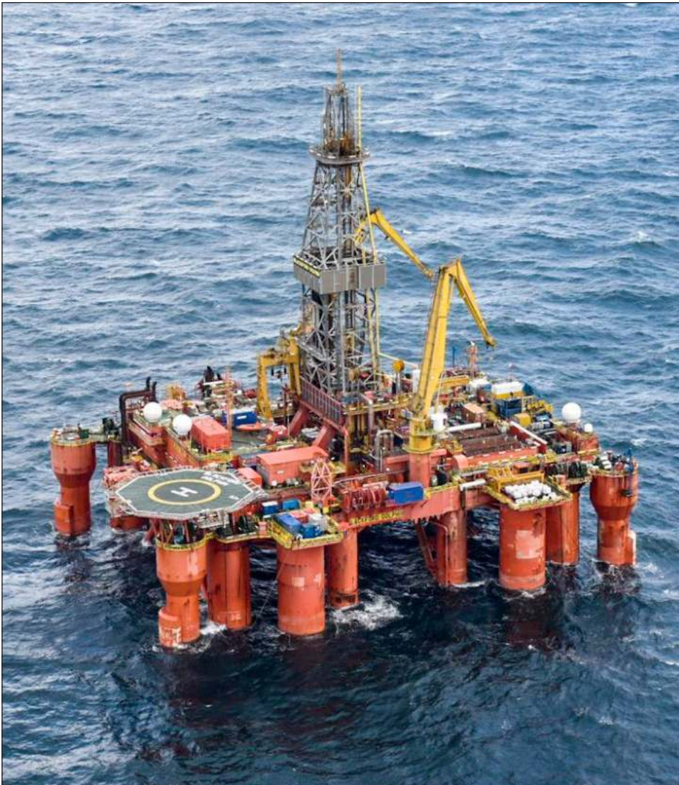
▲ Los piratas se llevaron al menos 30 equipos de respiración asistida, radios de comunicación, cables de diferentes calibres y herramientas. Foto Twitter @Pemex plataforma Blackford Dolphin