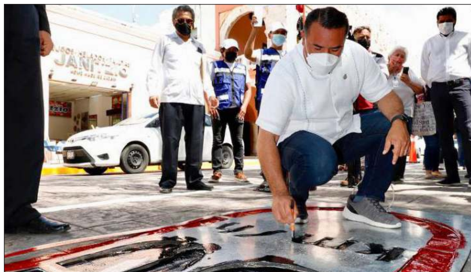
▲ El Plan Municipal de Movilidad contempla la colocación de señalamientos horizontales, como pasos peatonales, rayas de parada y delimitación de carriles.

De igual modo se delimitarán las “esquinas rojas” -15 metros-a fin de evitar que los vehículos lo interfieran con el triángulo de visibilidad y rampas peatonales.