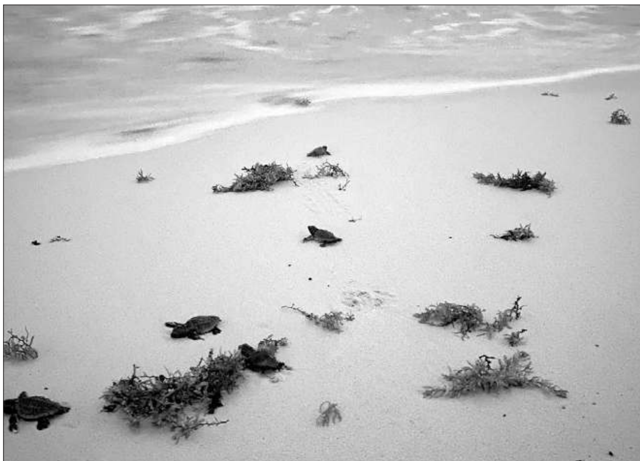
▲ El Comité Estatal de Protección, Conservación y Manejo del quelonio opera esta temporada con 20 colaboradores y 12 voluntarios para los campamentos tortugueros de las 14 playas que protegen.