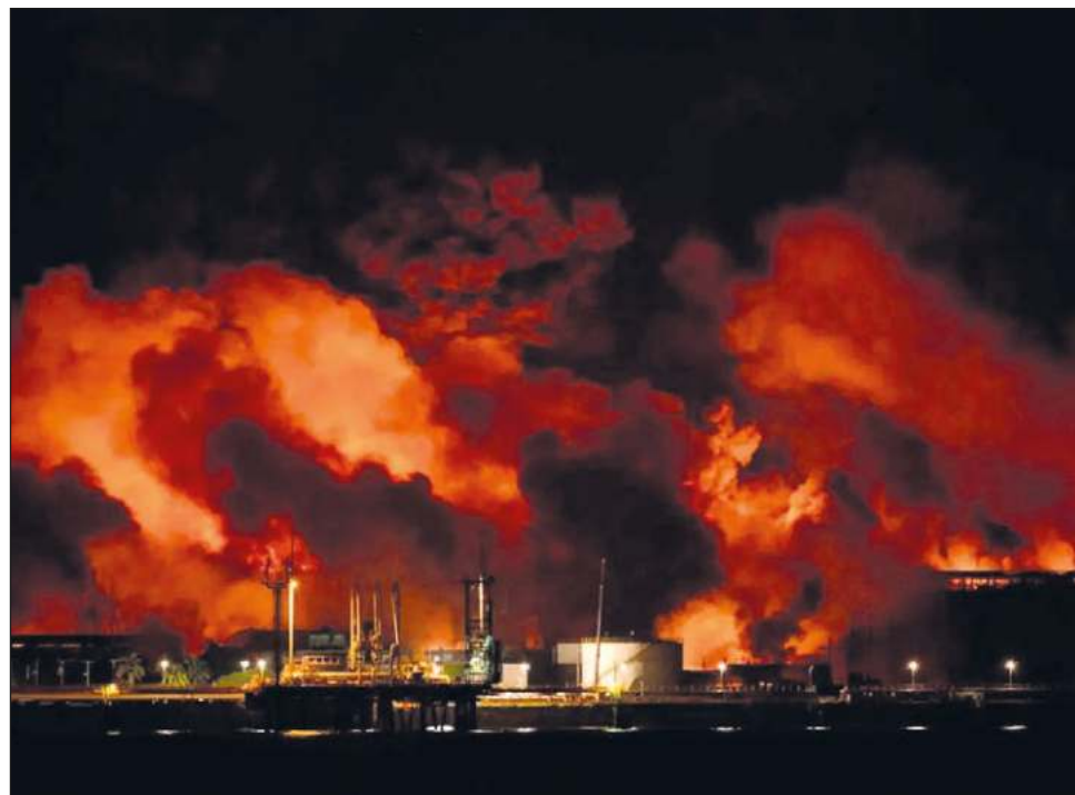
▲ Autoridades informaron que las fuerzas que laboraban ya habían sido evacuadas.

El incendio de grandes proporciones inició el viernes a las 19 horas locales, cuando un rayo impactó en un tanque que contenía 26 mil metros cúbicos de crudo nacional, alrededor del 50 por ciento de su capacidad máxima. Durante la madrugada del sábado el fuego se