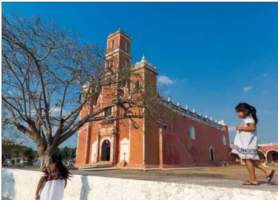
▲ En Yaxcabá, niños y adultos hablan maya, hay parteras, médicos tradicionales, y ofrece atractivos turísticos diversos, como cenotes y la zona arqueológica en Yaxunah.

Espera que los festejos del Día Internacional de los Pueblos Indígenas sean una oportunidad para que más personas conozcan el municipio y todos los atractivos que pueden ofrecer a los turistas.