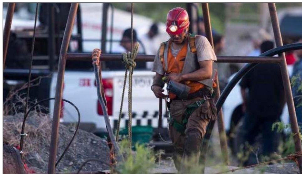
▲ Las autoridades preparan este lunes un operativo para que buzos rescatistas puedan ingresar a la mina de carbón inundada, donde diez obreros permanecen atrapados.