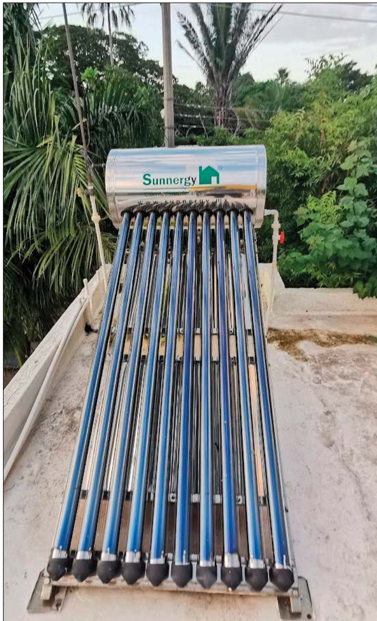
▲ “Hablamos de una inversión importante cuando se trata de las llamadas tecnologías verdes, las que se venden como la panacea y luego resultan ser un fiasco en perjuicio del consumidor”.

Contacté a la empresa y no se hicieron responsables a pesar de la