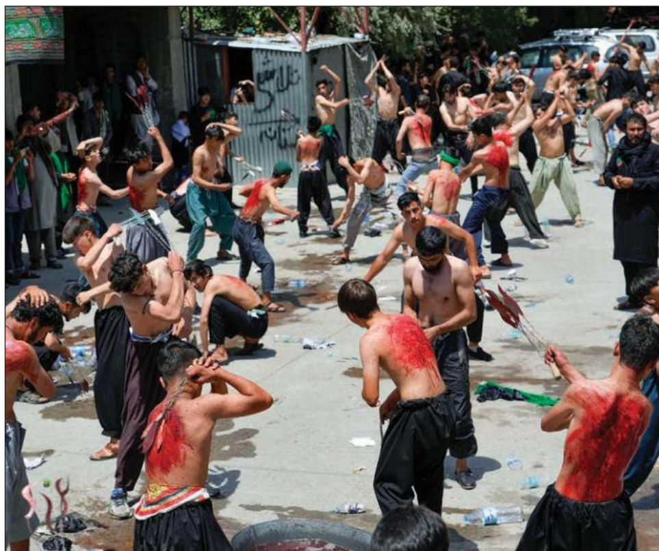
▲ En Kabul, Afganistán, los chiítas conmemoran el martirio de Hussein autoflagelándose con cadenas e instrumentos filosos, y vistiendo de negro para el luto.

Los chiítas planeaban conmemorar el día santo el martes en Irak y también en el Líbano.