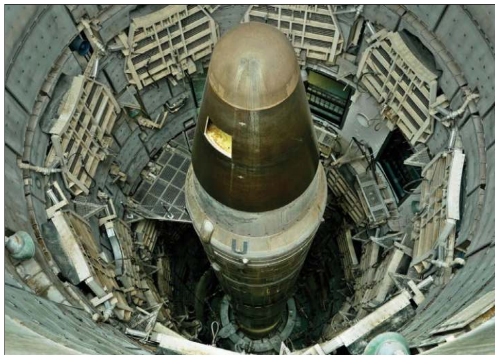
▲ El temor a una tercera bomba atómica ha ido en aumento ante las amenazas rusas de un ataque nuclear desde que comenzó su guerra en Ucrania en febrero.

“Creo que nadie puede aceptar la idea de que pueda ocurrir una nueva guerra nuclear. Esto será la destrucción del planeta”, dijo Guterres. “Lo que está claro es que si nadie las utiliza por primera vez, entonces no habrá guerra nuclear”.