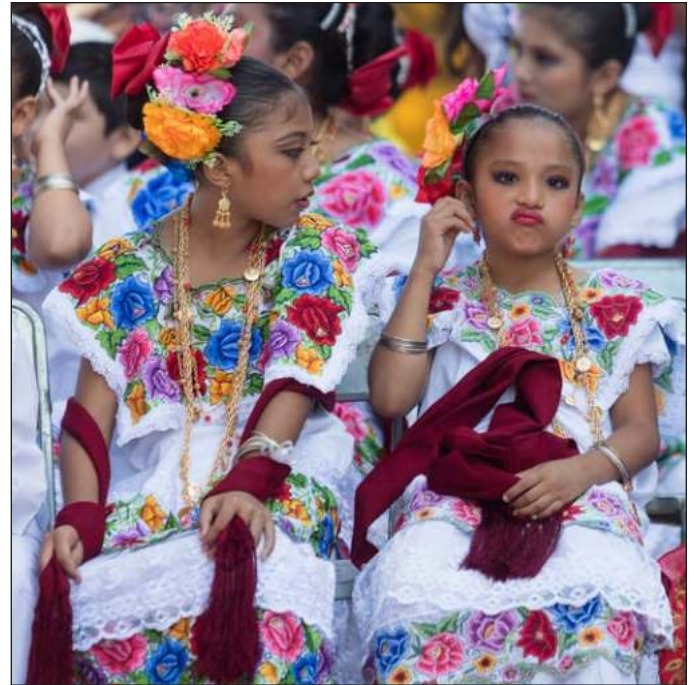
▲ K'a'anan k'iino'obe' ku meyaj ti'al u chiikbesa'al ba'ax najmal u k'eexel wa u chiimpol'tal ichil u kuxtal wiinik; beey túuno' te'e k'iina' k k'aatike', máax ti'al u k'ajsa'ilil.

Máasewal kaajo'obe' mootschaja'ano'ob ti' jump'eel lu'um mantats' u tooka'al wa u to'okol tu k'ab u jach yuumilo'obi'. Mu'uk'anchaja'ano'ob ma' chéen tu lu'umilo'obi', tumen óoli' je'el tu'uxak ka xi'ik u wiinikilo'obi',