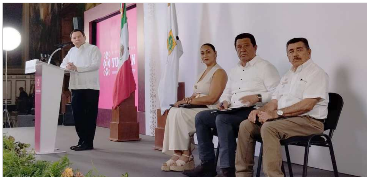
▲ El gobernador Joaquín Díaz Mena especificó que en los encuentros se podrán brindar propuestas enfocadas en tres ejes principales: agua potable, red metropolitana de vialidades seguras e infraestructura de seguridad.

Lunes 13 de julio en el norte, en el Insituto Tecnológico de Mérida; martes 14 de julio, zona sur en la Universidad Tecnológica Metropolitana; miércoles 15 de julio, zona oriente, Universidad