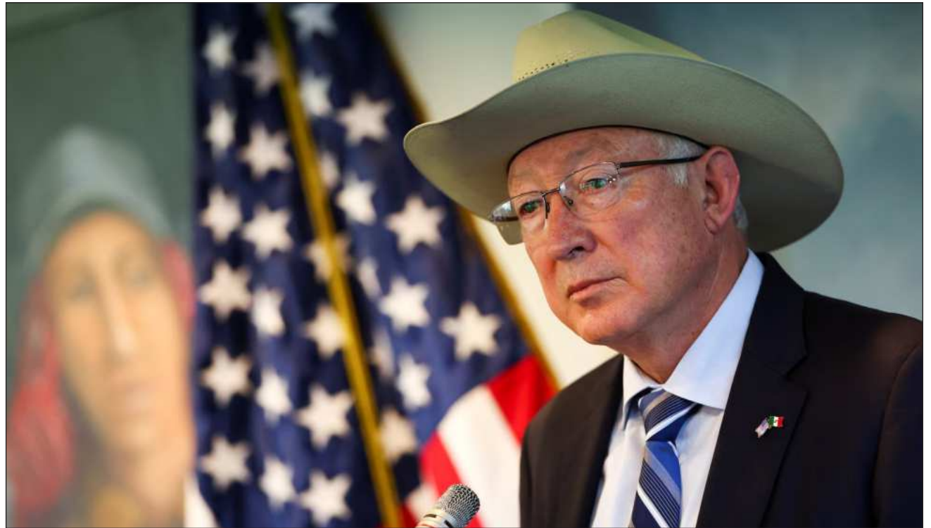
▲ “¿Qué argumentos adicionales podemos dar, aparte de la declaración de Ken Salazar?”, sentenció la Presidenta.

La presidenta Claudia Sheinbaum Pardo resaltó que en una reciente entrevista el ex embajador de México en Estados Unidos, Ken Salazar, reconoce que “no había ningún vínculo” del gobierno del presidente Andrés López Obrador con el cártel de Sinaloa, después de que “se le mintió al gobierno de México” sobre la participación de agentes estadounidenses en el operativo para detener a Ismael El Mayo Zambada.