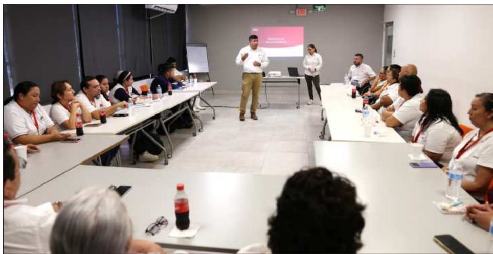
▲ El modelo impulsado por la empresa Kekén no solo beneficia a los colaboradores, sino también a sus familias, al brindar estabilidad y mejores oportunidades de vida.

Asimismo, resaltó que el modelo impulsado por Kekén no solo beneficia a los colaboradores, sino también a sus familias, al brindar estabilidad y mejores oportunidades de vida, ya que la posibilidad de acceder a un trabajo, un sueldo y seguridad representa un cambio significativo para jóvenes con alguna con-