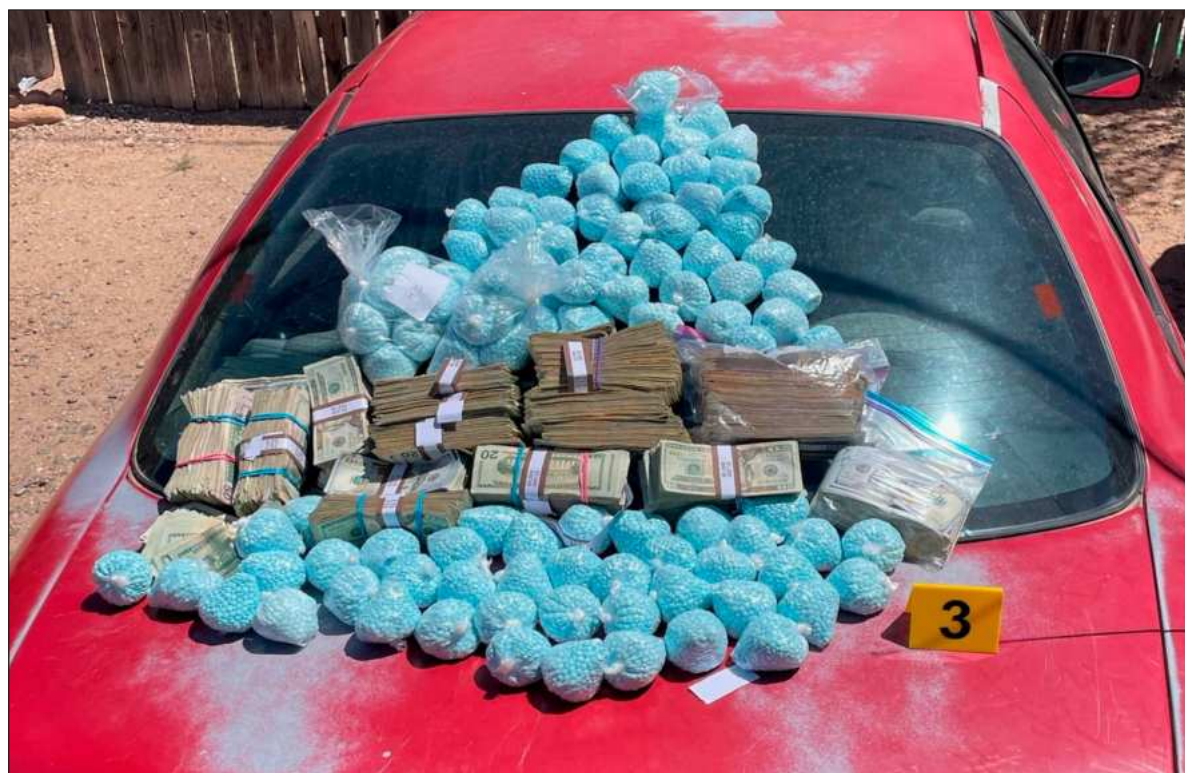
▲ “En Italia ‘desaparecieron’ 80 dosis de fentanilo de la caja fuerte del Hospital Israelita (...) Algunos descartan a los grupos mafiosos italianos ya que según dicha versión no permiten actualmente la propagación del fentanilo”.

A lo largo de dos meses, añade Ap , “el equipo de investigación revisó cientos de documentos gubernamentales y entrevistó a decenas de expertos para revelar la modificación secreta de los «protocolos sobre el fentanilo» del Departamento de Justicia, la cual otorgaba a los agentes discrecionalidad para no incautar una droga altamente letal. La exclusiva, publicada el 22 de junio, tuvo un impacto sísmico inmediato, despertando el interés de la audiencia en las plataformas de APNews y generando numerosas apariciones en medios audiovisuales. La primicia motivó una investigación