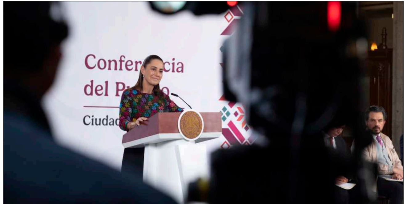
▲ Destaca que el intercambio comercial entre México y Estados Unidos alcanzó 839 mmd, cifra histórica.

-México, primer lugar entre los países de la OCDE con mayores incrementos a los salarios reales desde 2018.