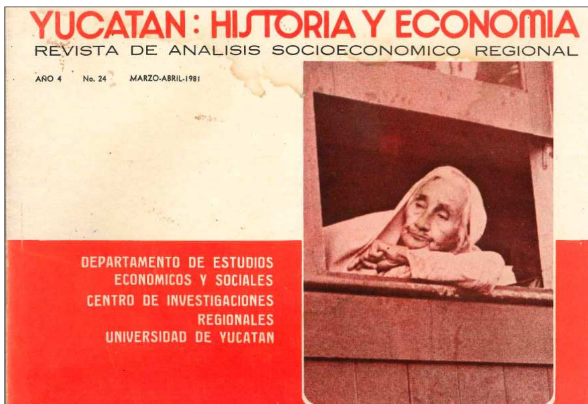
▲ "El primer número de Yucatán: Historia y Economía. Revista de Análisis Socioeconómico Regional , fechado en el bimestre mayo-junio. Sus ediciones se extendieron hasta 1983, reanudándose en 1986 con una entrega más". Foto Facsímil