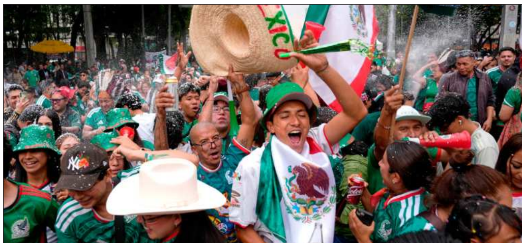
▲ Aparte de las imágenes de abrazos e intercambios de playeras, los festejos han sido relevantes para mostrar hasta dónde llega la previsión de las autoridades y las debilidades en materia de protección civil.

Sin embargo, los festejos, especialmente en la avenida Reforma de la Ciudad de México, también dejaron víctimas fatales. Precisamente ahí es donde quedó de manifiesto la falta de preparación de las autoridades de la capital del país, más ocupadas en ajolotizar que en prevenir una tragedia. Los cuatro decesos ocurridos tras la victoria contra Ecuador no fueron fortuitos. Ya se había decretado la "ley seca" precisamente para inhibir conductas de riesgo, pero por sí sola, la medida resultó insuficiente ante la concentración de más de un millón de personas en la vía. Es momento de analizar qué falló, porque se tuvo mucho tiempo para diseñar los protocolos.