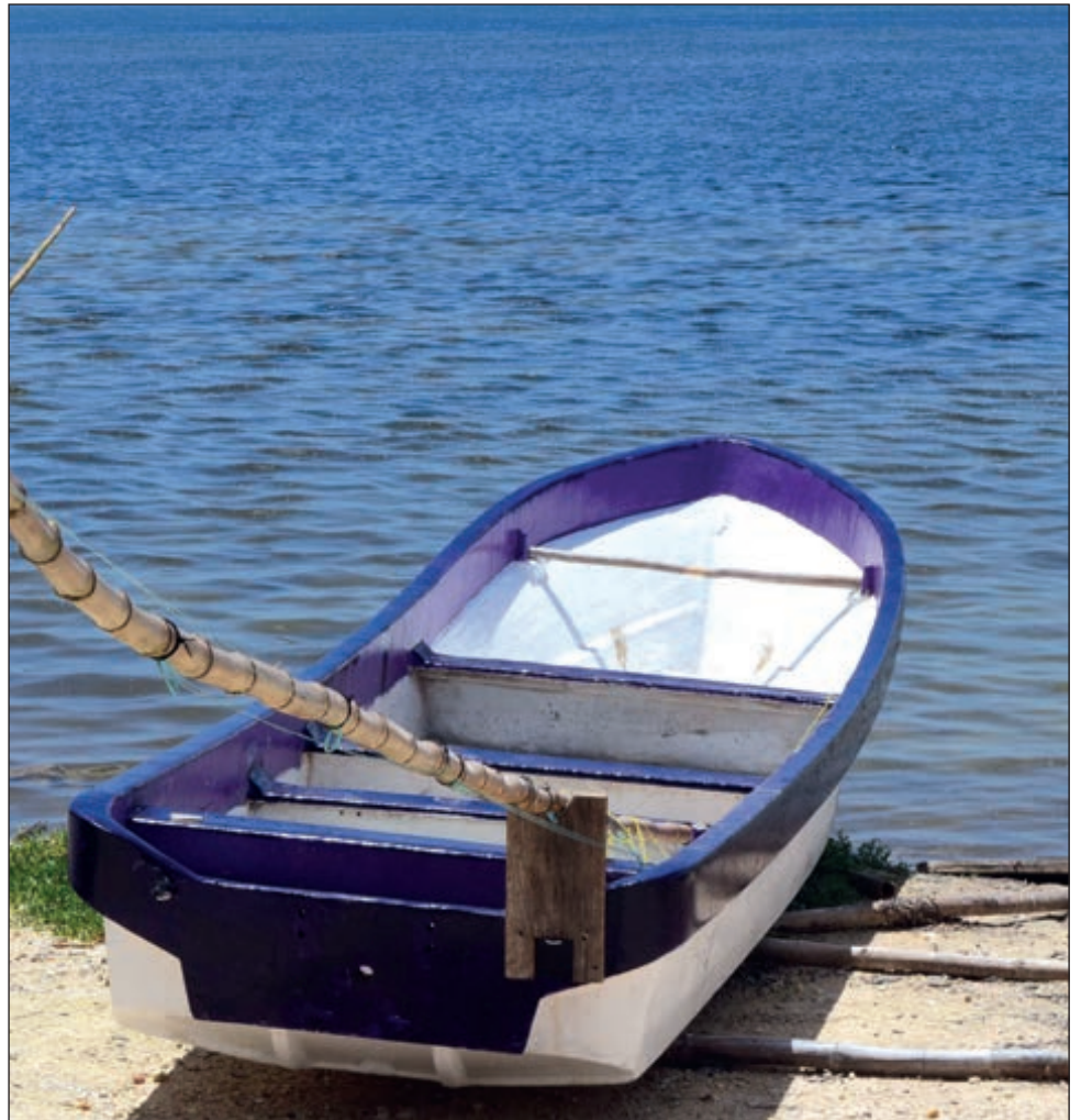
▲ La dueña del predio argumenta que las embarcaciones invadían su propiedad.

En abril de 2019, la Cámara de Diputados del Congreso de la Unión aprobó una iniciativa que prohíbe la existencia de playas privadas en nuestro país, ya que se trata de un bien nacional.