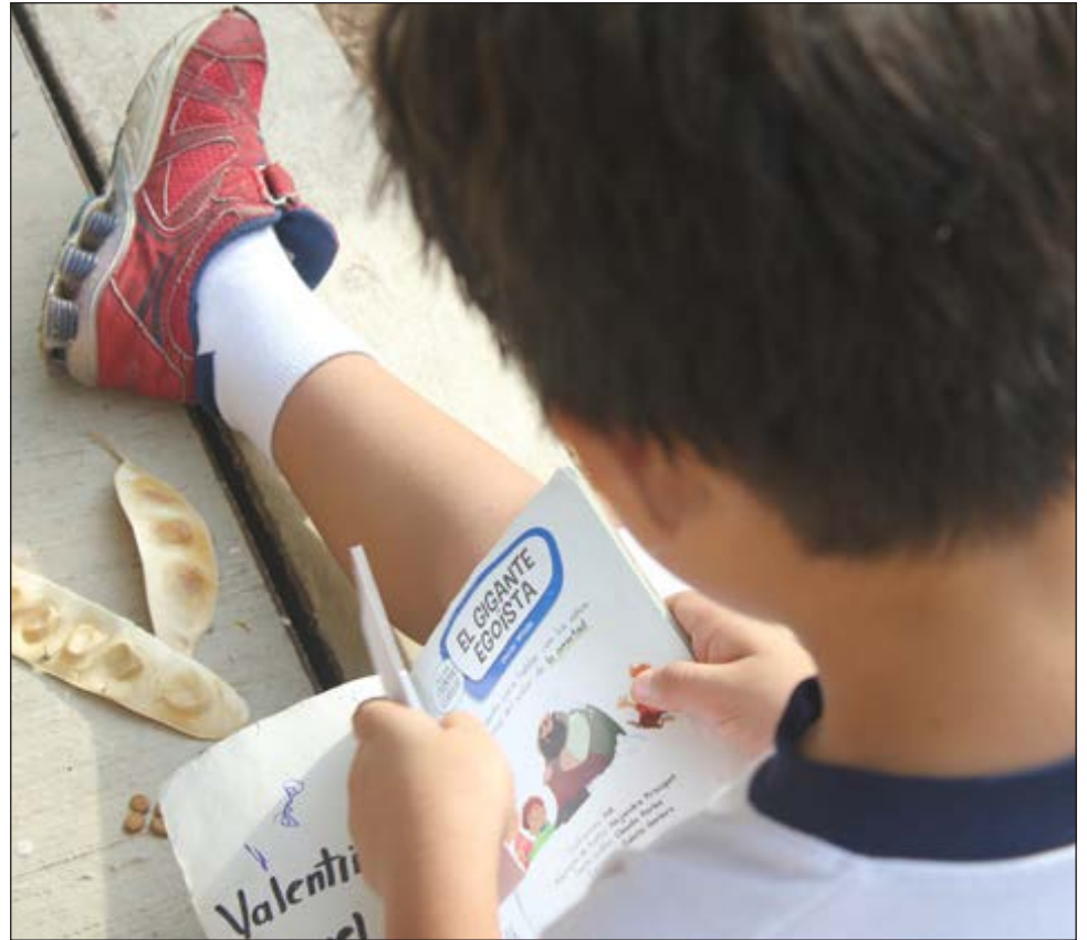
Las editoriales trabajan directamente con las escuelas y son ellas quienes escogen con qué plataforma desean trabajar.

Aseguró que los docentes, incluso los de mayor edad, han hecho un esfuerzo por adaptarse a estas novedades. Las editoriales trabajan directamente con las escuelas y son ellas qui-