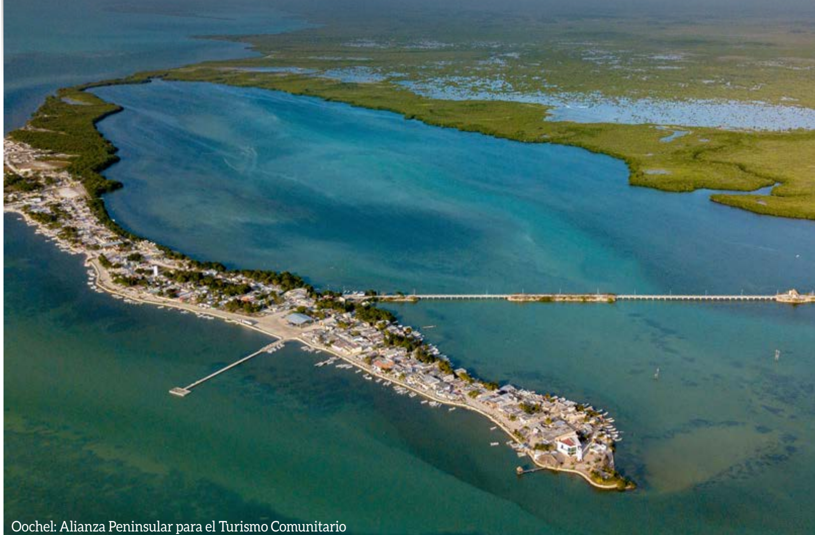
Oochel: Alianza Peninsular para el Turismo Comunitario

COOPERATIVAS PENINSULARES SE UNEN POR EL TURISMO COMUNITARIO