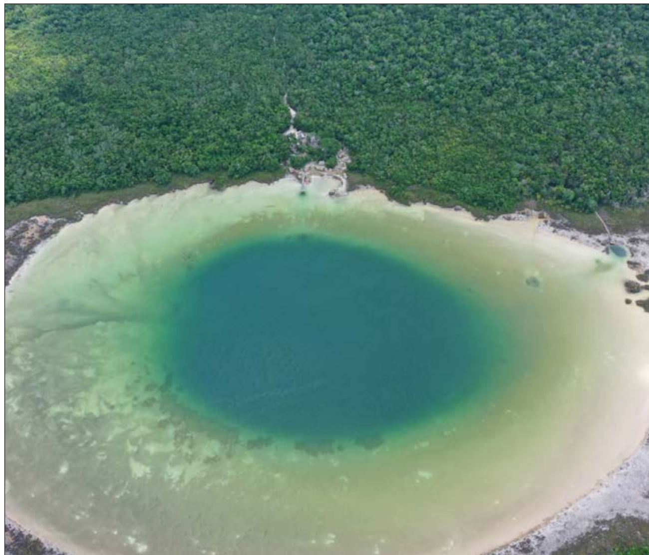
▲ Este año, el turismo busca experiencias más cercanas a la naturaleza y a la cultura.

El turismo de naturaleza es una de esas experiencias donde se podrán encontrar recorridos en los canales de la Reserva de la Biosfera de Sian Ka'an, en Quintana Roo; paseos en lancha por las costas de Campeche a lado de delfines, flamencos e islas desiertas; nado en las refrescantes aguas de los cenotes de Yucatán y la posibilidad de conocer de cerca a los cocodrilos, monos saraguatos y aves de la región.