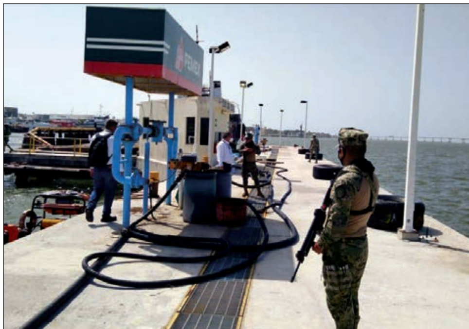
▲ El operativo derivó de denuncias anónimas, recibidas por el Gabinete de Seguridad Nacional.

Posteriormente fue inmovilizado un dispensario de la estación de servicio terrestre; quedó la clausura temporal total de la estación marítima y terrestre, pre-