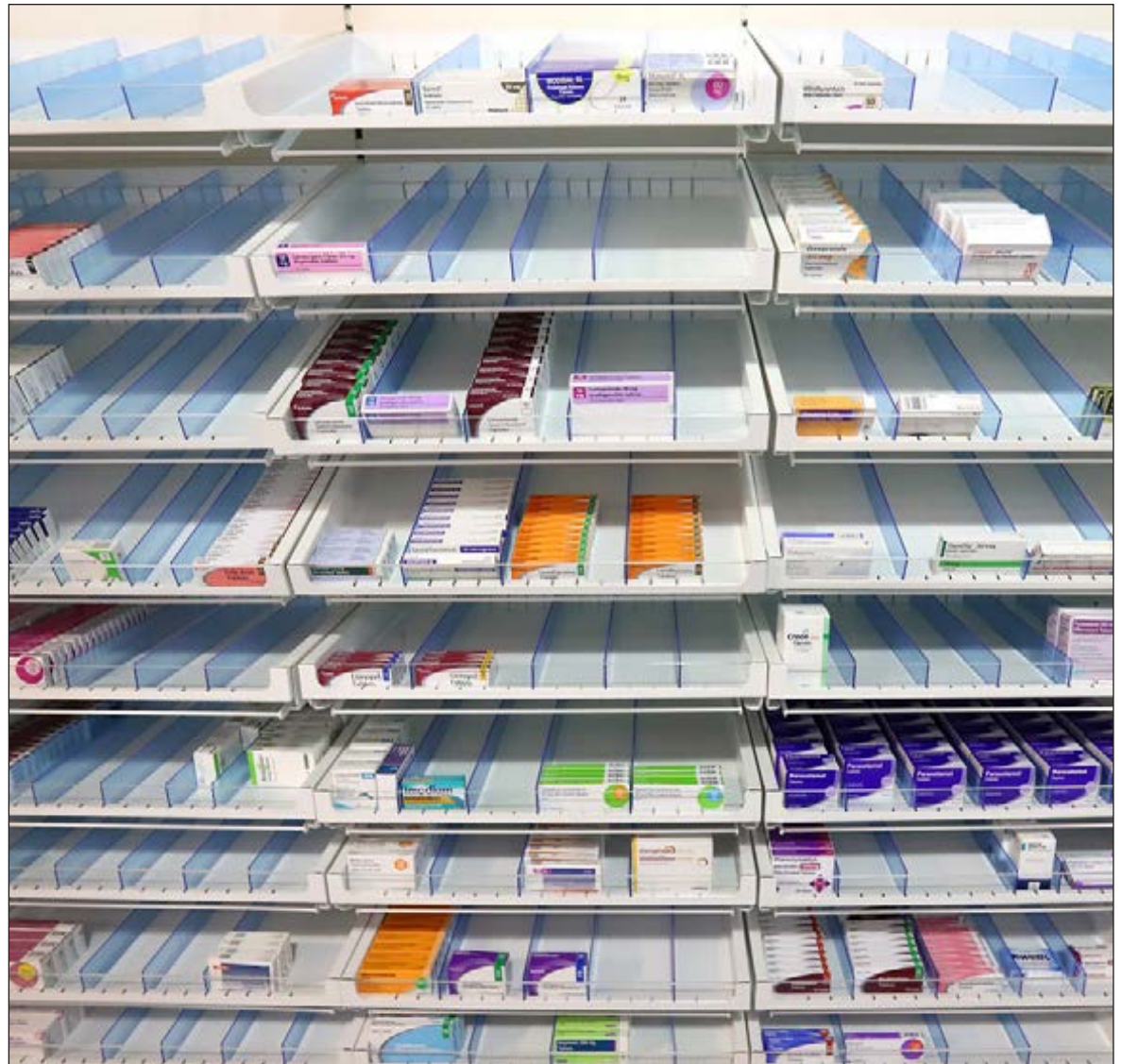
▲ En 2020, las 10 farmacéuticas con mayores activos en el mundo tendrán ingresos por 1.43 mil millones de dólares, un crecimiento del 28.8 por ciento, sin considerar la pandemia.

EL GOBIERNO MEXICANO ha hecho énfasis en las medidas de prevención de contagios de COVID 19 para evitar la saturación de hospitales. México tiene más de 127 millones de habitantes.