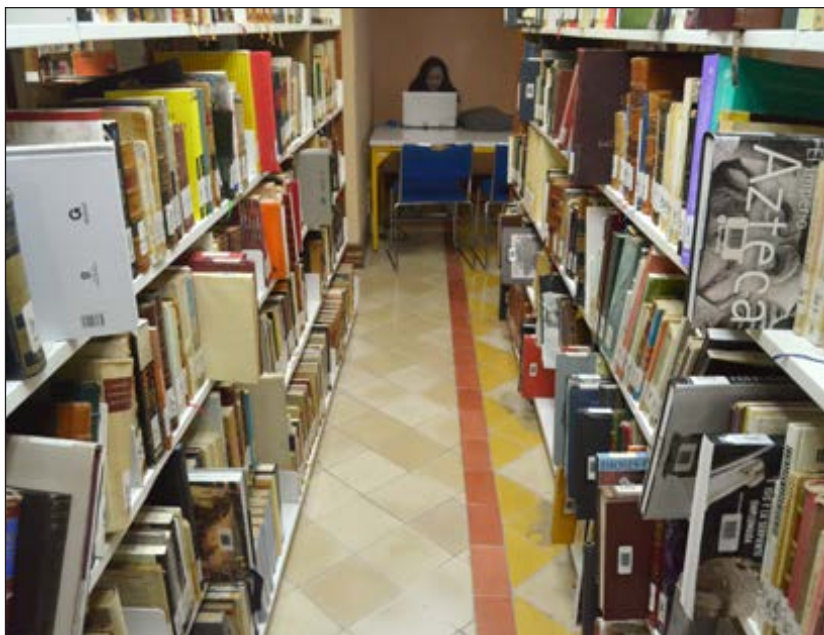
Esta iniciativa tiene como objetivo brindarles herramientas a los universitarios para que continúen con sus estudios.

*El papel arde a los 233 grados centígrados, tal como lo hace en la inmortal novela de Ray Bradbury, Fahrenheit 451.