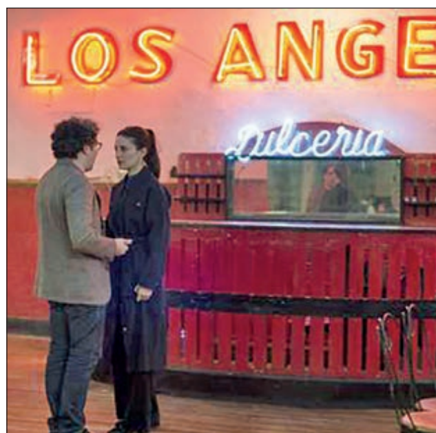
▲ El director de orquesta Gustavo Dudamel, junto con su esposa, la actriz española María Valverde, festejó en Los Ángeles el 15 de noviembre de 2019, luego de encabezar un concierto en el Auditorio Nacional.