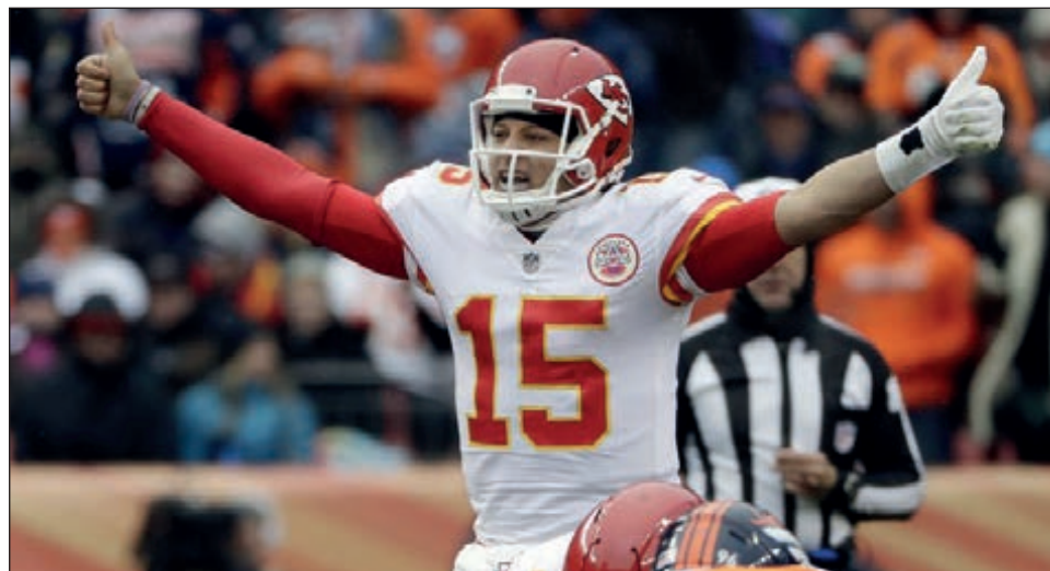
▲ Patrick Mahomes ya hizo historia en la NFL con galardones y un anillo de campeón y apenas tiene 24 años de edad.

“Así es como he actuado siempre. He seguido mis pasiones y he hecho lo mejor para mi familia”, dijo el quarterback de los Jefes, durante una videollamada realizada el martes. “Para mí, esto jamás se ha relacionado sólo