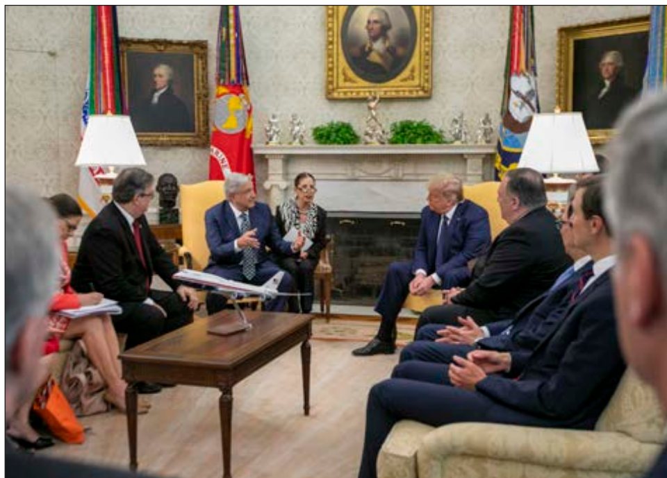
▲ López Obrador y Donald Trump apabaron su cooperación, su respeto mutuo y enfatizaron que el T-Mec generará empleo y prosperidad.

Después de los actos protocolares, López Obrador se dirigió a la Embajada de México, donde permanecerá hasta pasado el mediodía, cuando será recibido en la Casa Blanca por el pre-