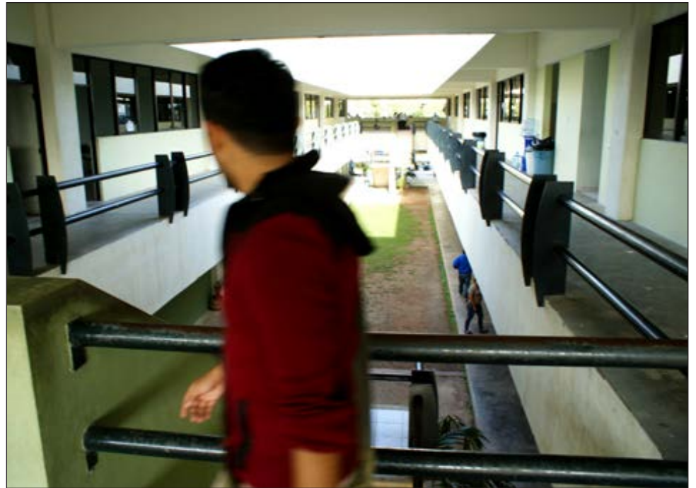
▲ El panorama educativo podría complicarse todavía más con la emergencia sanitaria.

Conajo solicita que haya un etiquetado en el presupuesto específico destinado a resolver los problemas de la educación, en relación al equipo y todo lo necesario para los estudiantes y no pierdan el ciclo escolar, y si se aprueba la deuda