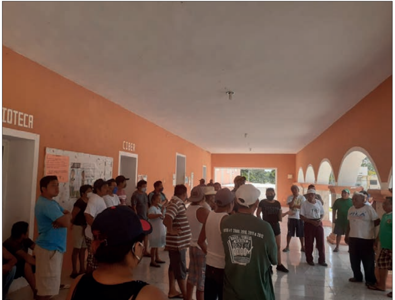
▲ Los habitantes de Tinum dependen económicamente del turismo que llega a Chichén Itzá, pero desde que fue cerrado el sitio arqueológico, varias familias se han quedado sin ingresos.