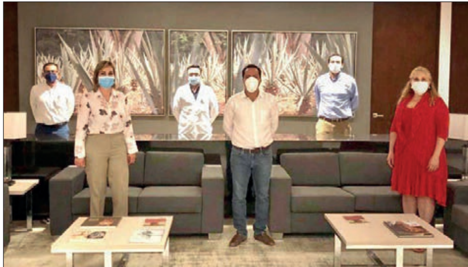
▲ En reunión con funcionarios federales del sector Salud, el gobernador Mauricio Vila reiteró la disposición de su gobierno de apoyar a hospitales del gobierno federal, sean del IMSS o el ISSSTE.

Al respecto, el gobernador agradeció, una vez más, la disposición del director general del IMSS para escuchar las peticiones de los yucatecos y trabajar en soluciones que se traduzcan en una mejor atención médica, así como para seguir colaborando con el gobierno del estado.