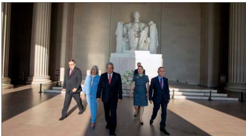
▲ La pieza oratoria de AMLO fue sinuosa, un torrente buscando una grieta a través de la cual se podrá romper un muro. Falta ver si halló oídos atentos.

No fue el poema A Roosevelt, de Rubén Darío. No fue con voz de la Biblia o verso de Walt Whitman que pretendió llegar al cazador/negociador; sí le habló a esa América que en Estados Unidos vive. Y sueña. Y ama, y vibra; y es la hija del Sol.