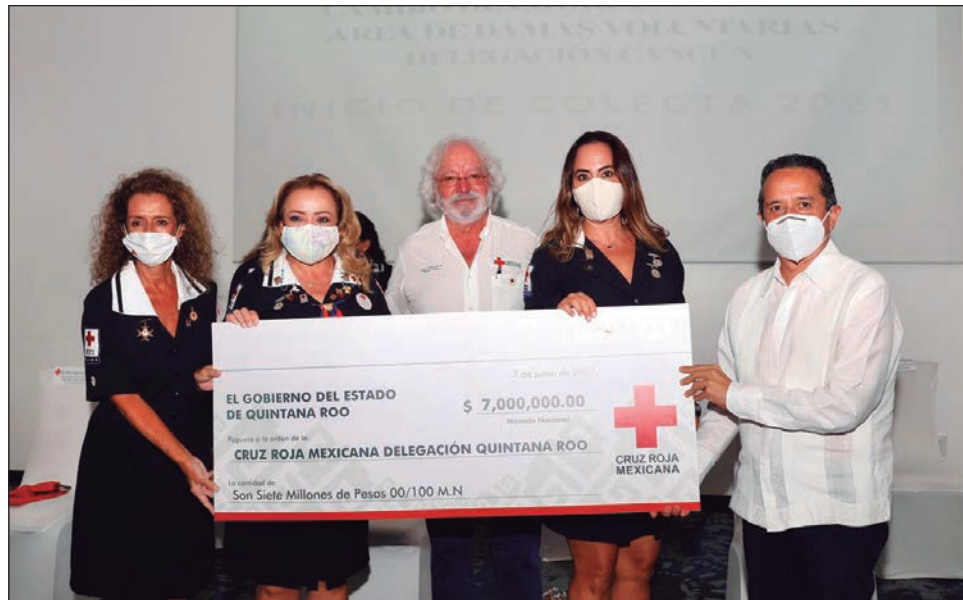
▲ Carlos Joaquín donó 7 millones de pesos a la institución humanitaria.

“Una vez más, la Cruz Roja lo está demostrando en esta pandemia. Con su aportación se ha ganado un lugar entre todos los mexicanos, por su solidaridad, entrega y apoyo para socorrer a la población en las situaciones tan terribles por las que aún atravesamos”, señaló el Ejecutivo.