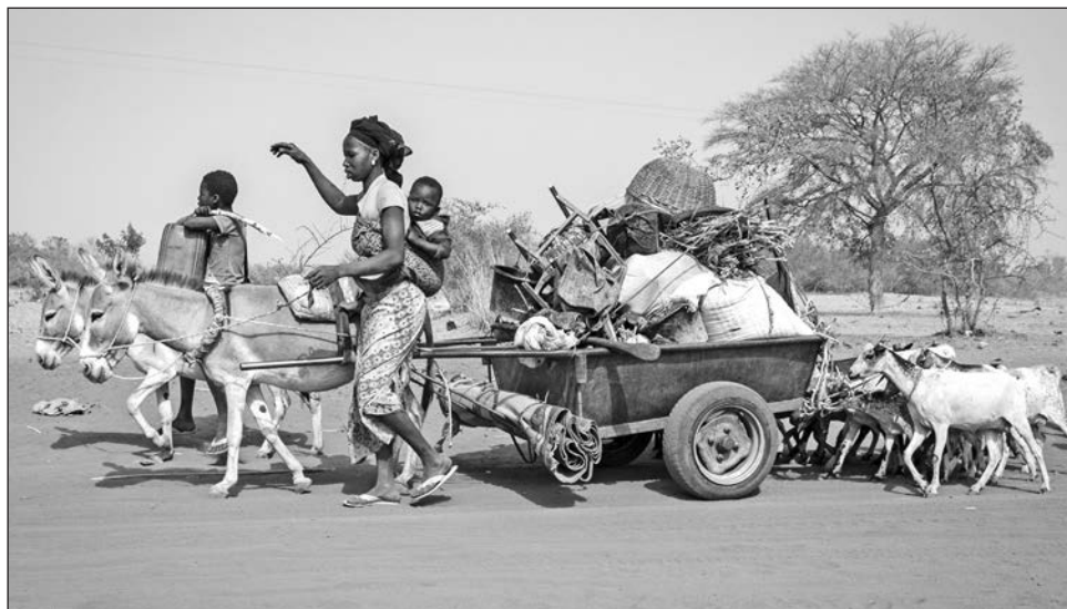
▲ Quienes llegan a las ciudades de Sampelga y Sebba lo hacen con pocas pertenencias o sin nada.

"Han llegado con pocas pertenencias o sin nada. La mayoría han sido acogidos de forma generosa por las familias locales, que están compartiendo lo poco que tienen", ha indicado, antes de resaltar que estas personas "necesitan urgentemente agua, cobijo, ayuda esencial y atención médica".