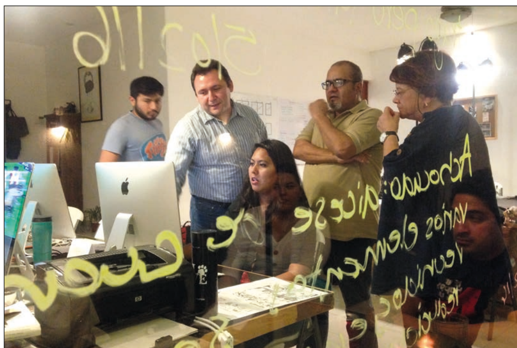
"Cuando iniciamos este periódico, el horizonte sólo existía en la imaginación de algunos de los que nos identificamos como el puñado de locos que a fin de cuentas éramos todos".

También se han ido algunos de los que comenzaron con nosotros este recorrido. Han abordado otras naves y se les desea viento en popa y que lleguen a buen puerto. Mientras, contando hasta mil 500, la costa de la que partimos se desvanece y vendrá el momento de enfrentar el mar abierto, una edición a la vez; ya habrá momento de alcanzar otra marca en nuestra historia como periódico.