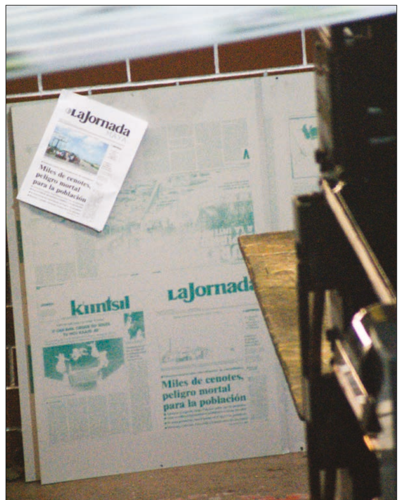
▲ No se puede hablar de mil 500 ediciones sin un número uno, y en La Jornada Maya creamos un número cero, desde cero hasta su puesto de periódico favorito... mismo que recorrería kilómetros de ideas como de distancia. Gracias por permitirnos ser parte de esta aventura informativa diaria.