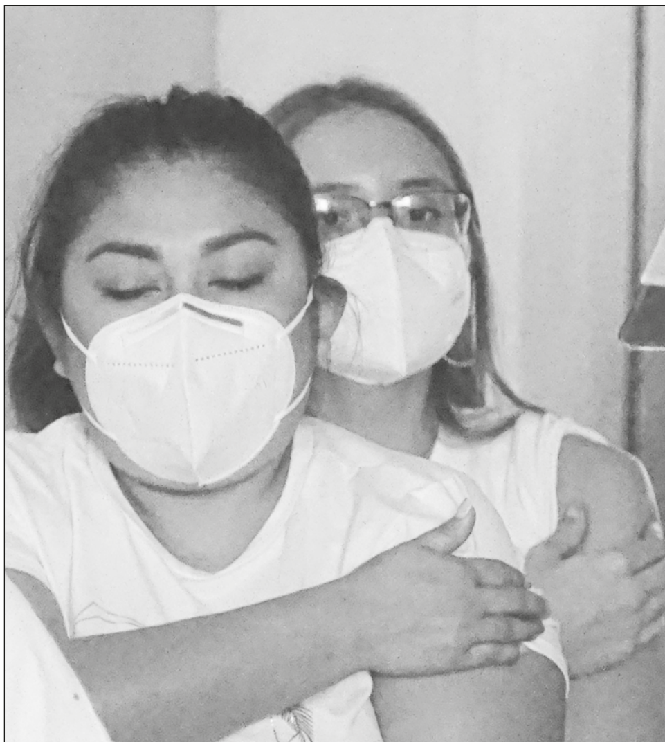
▲ Hay dos macro centros y seis módulos de vacunación distribuidos en Mérida, para la inmunización de la población de 40 a 49 años.

Se recomienda a la población identificar el día y lugar en donde le corresponde vacunarse, según su código postal, respetar las indicaciones del personal y usar ropa cómoda. No es necesario llegar con horas de anticipación.