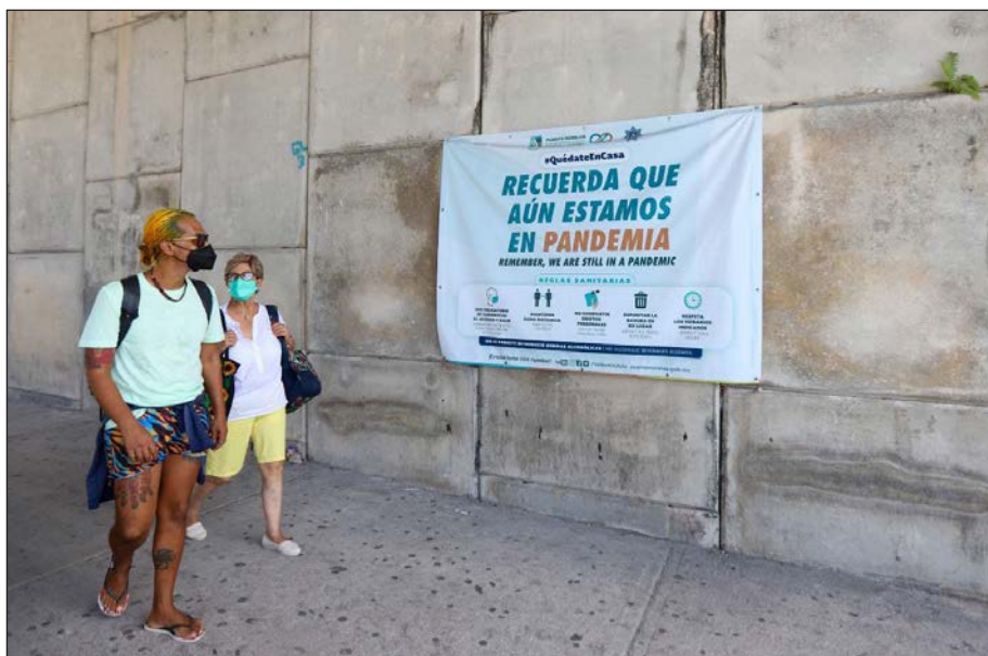
▲ Las autoridades municipales instalaron lonas para alertar a la ciudadanía sobre la importancia de mantener las medidas de prevención básicas.

La directora de Salud de Puerto Morelos mencionó que