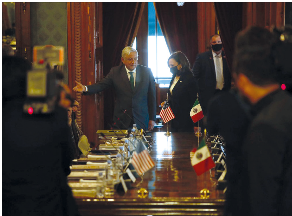
▲ Ambos gobiernos reforzaron su visión de una relación basada en el respeto mutuo y la cooperación.

"La reunión entre ambos mandatarios se traduce en avances como la puesta en marcha de nuevos mecanismos de cooperación económica de alto nivel; el fortalecimiento y atracción de inversión extranjera a México; la atención a las causas estructurales de migración en la región; la protección de derechos humanos, particularmente de las personas mi-