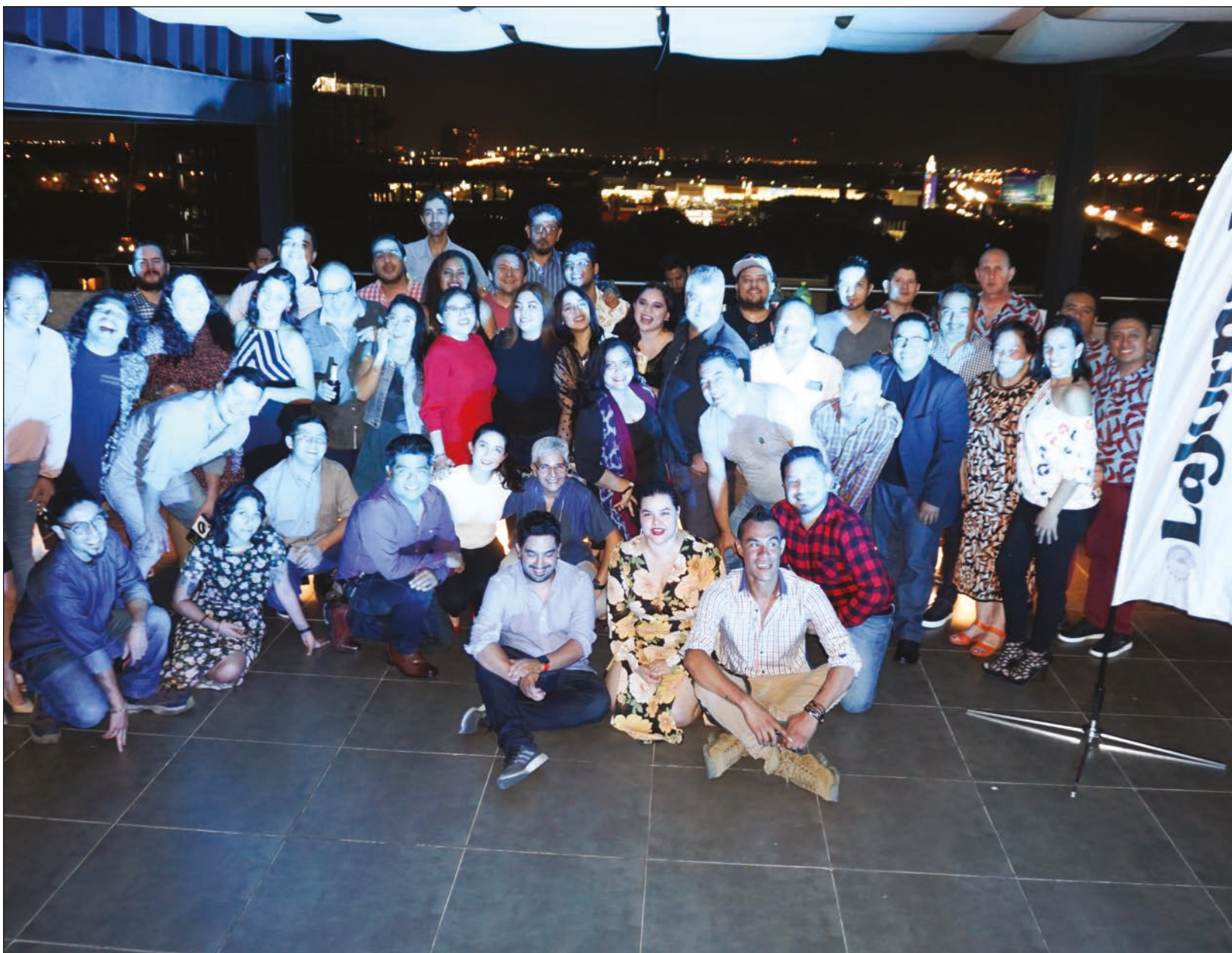
▲ Detrás de los mil 500 números de este rotativo, se encuentra un equipo que ha trabajado incansablemente, pero que también ha disfrutado de cada segundo.