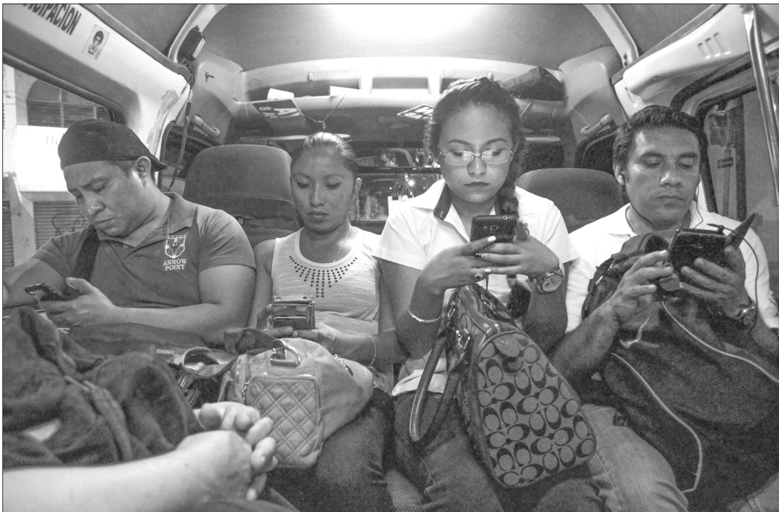
▲ Habrá que advertir que las redes sociales promueven información sin calidad y una lectura superficial.