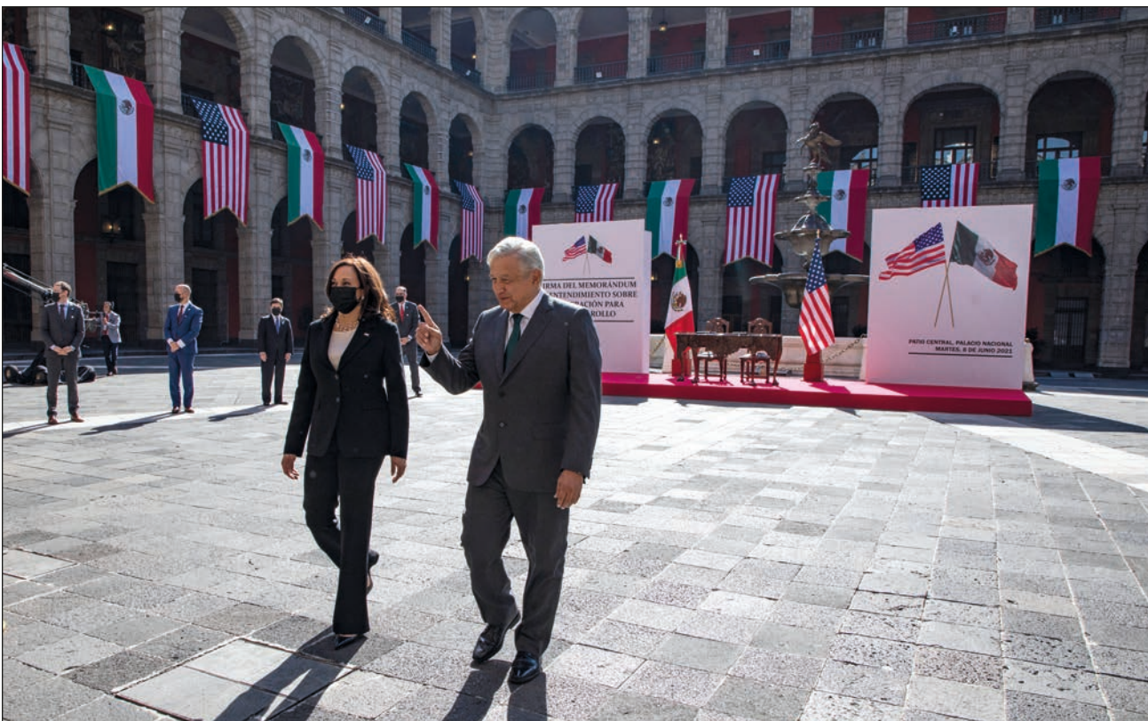
▲ Tras la llegada de la vicepresidenta de Estados Unidos, Kamala Harris, a México, el presidente Andrés Manuel López Obrador dio un recorrido a la funcionaria por los pasillos y salones de Palacio Nacional. Durante su visita, ambos gobiernos reafirmaron el compromiso de avanzar de manera coordinada y conjunta en contra del SARS-CoV-2, y abordaron temas como la migración, el empleo y la seguridad.