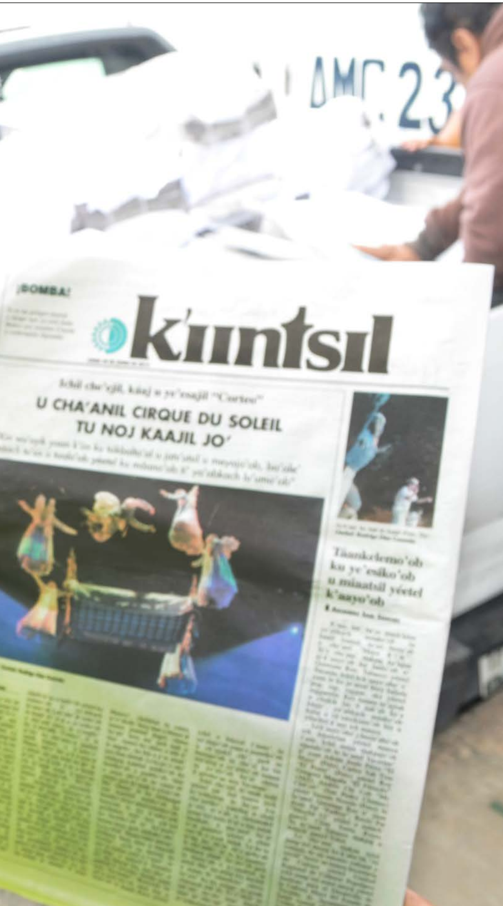
Un lector de K'iintsil, contraportada editada en lengua maya, en una de sus primeras ediciones.