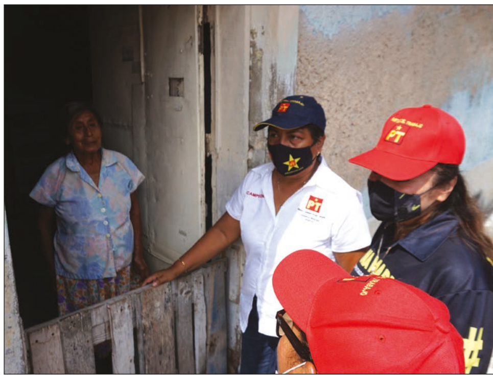
▲ El Partido del Trabajo es uno de los que no alcanzó el 3% de votación.

El PVEM, PRD y Partido del Trabajo (PT) tampoco alcanzaron el porcentaje indicado para mantener el registro. Sin embargo, los dos primeros tendrían una oportunidad en el recuento de votos que están pidiendo las dirigencias del Revolucionario Institucional (PRI), Acción Nacional (PAN), PRD y Movi-