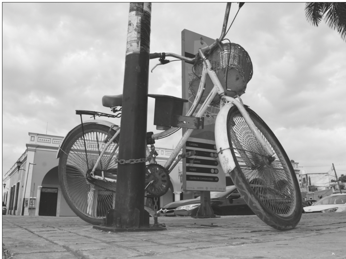
▲ La “modernidad” había llegado a las autoridades y una de las nueva disposiciones era que las bicicletas de los que concurrían a la cantina no se podían poner en la acera del bar.

Siempre mis regresos a la patria chica estuvieron llenos de sorpresas, algunas dolorosas porque tenían que ver con la señora esa que no perdona y otras veces, pedazos de mi vida que habían desaparecido; por ejemplo de las primeras cosas que me acuerdo y que fue una tragedia para mí, es la desaparición de una pequeña ventana que había en la sala de la casa de mis padres; en ella yo me sentaba para ver pasar a las primeras inquietudes de mi adolescencia, recuerdo que al llegar y ver la “moderna ventana” en que se había convertido, se me salieron las lágrimas, y se me volcaron en el alma y el corazón las imágenes de como veía pasar a aquella muchachita preciosa que me encantaba, ella salía a repartir las tortillas que hacía su madre y tenía una hora precisa para cruzar por enfrente de la casa y la ventana se convertía entonces en la puerta al paraíso, por donde revoloteaban sus pestañas y su sonrisa cuando volteaba a verme y yo moría de algo, no sabía de qué, después supe que de amor, creo que nunca le dije nada, nunca hizo falta, el lenguaje de los ojos hablaba un idioma más