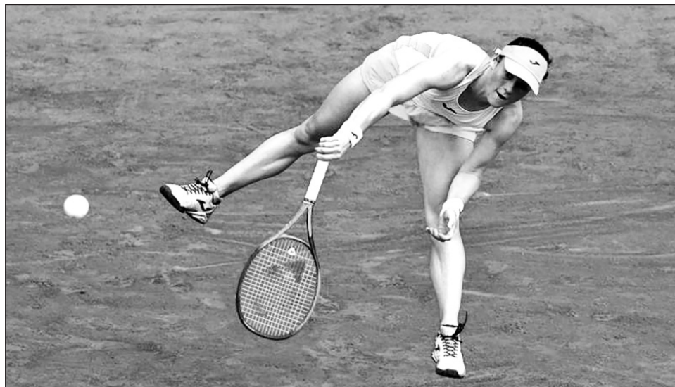
▲ Tamara Zidansek saca ante Paula Badosa, durante los cuartos de final del Abierto de Francia.

llegó al tenis procedente del mundo del esquí, acaba de convertirse en la primera mujer de Eslovenia que alcanza las semifinales de una de las grandes citas.