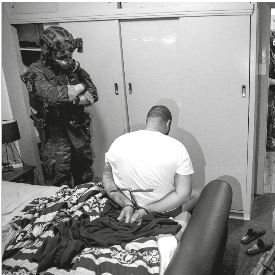
▲ El operativo de escala global fue impulsado por el FBI.

La operación surgió luego de que el FBI infiltrara sistemas similares denominados Phantom Secure y Sky Global, con lo cual accedieron a las comunicaciones de miles de usuarios, incluyendo sospechosos de crímenes.