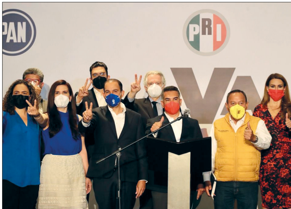
▲ Los líderes de los tres partidos de la coalición hicieron público el compromiso de frenar “los caprichos presidenciales”.