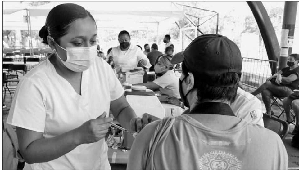
▲ Los benitojuarenses de entre 40 a 49 años reciben el biológico de AstraZeneca.