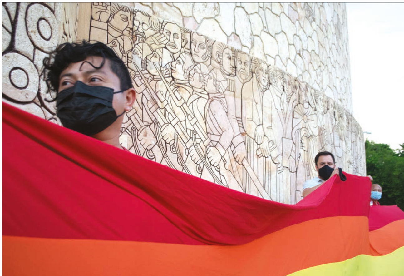
▲ El estado de Yucatán está en deuda con un amplio sector de la ciudadanía.

Reiteró que hace falta un trabajo descentralizado por los derechos humanos de todas las poblaciones en sus respectivos contextos, así como reconocer la interseccionalidad que tienen las personas pertenecientes a la diversidad sexual.