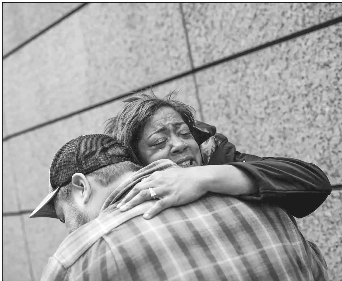
▲ The lack of “we” in all societies will continue if politicians seek to divide the electorate rather than address the challenges facing us.

THE CURRENT CONFLICT on everyone’s mind has Israeli Arabs opposing Israeli expansionist policies and side with their Palestinian brethren. Siding with them are Is-