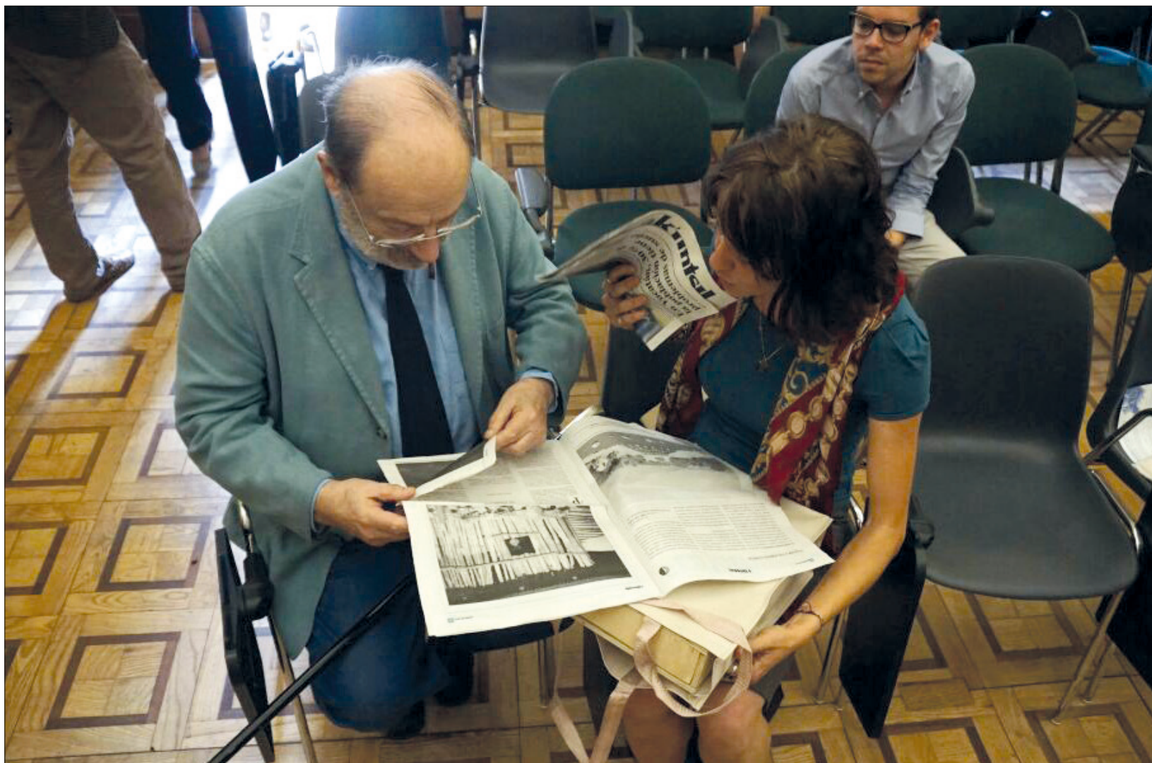
Umberto Eco hojea el número cero de La Jornada Maya, antes de recibir el Honoris Causa de la Universidad de Torino en su natal Italia.