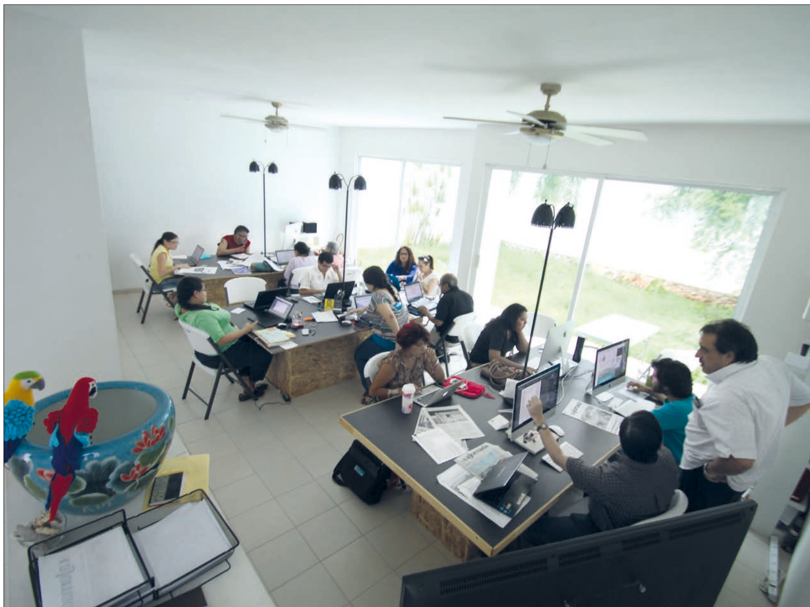
Un periódico va más allá de un lugar físico donde trabajar, más allá del escritorio, de desmenuzar las noticias; más que el papel por toneladas.