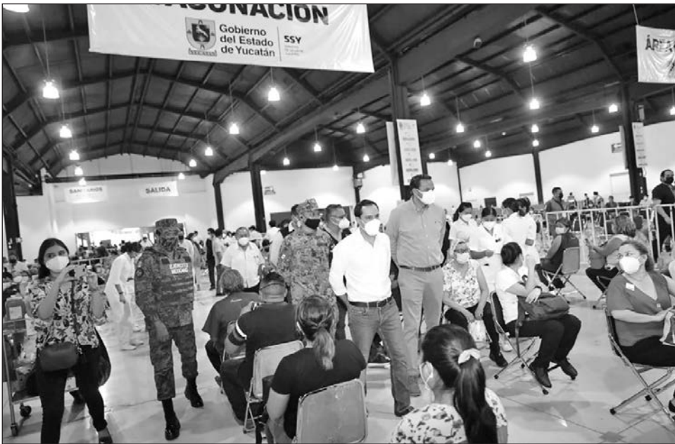
▲ El gobernador, Mauricio Vila, ofreció una rueda de prensa en el módulo de vacunación del Centro de convenciones Siglo XXI.