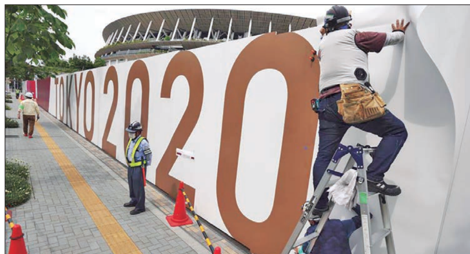
▲ Obreros colocan logos en una barrera frente al Estadio Nacional, sede de la ceremonia de apertura y otras competencias de los aplazados Juegos Olímpicos de Tokio.

Los nuevos contagios en Tokio han descendido a 500