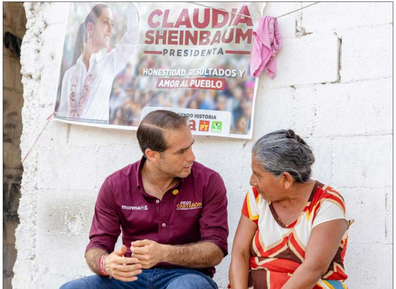
▲ Al abordar el Bienestar Compartido, el candidato habló de la continua transformación de Tulum que, como nunca antes, ha recibido en los gobiernos de Morena grandes inversiones, pero que ahora "lo mejor está por venir".

En el eje justicia social, destacó que las familias se-