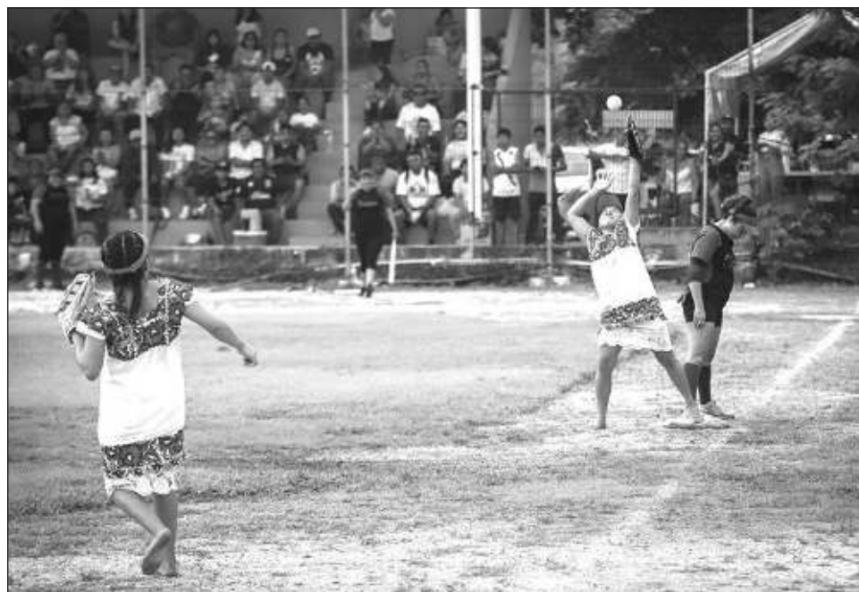
▲ Antes, las integrantes del equipo de softbol estaba limitadas a los quehaceres domésticos, pero ahora juegan y se manifiestan de forma original, portando el tradicional huipil.

El representante externo su emoción y orgullo por estas chicas que ponen en alto el nombre de su comunidad, el de Tulum, Quintana Roo y todo México por su genuina forma de jugar softbol. Ellas, recordó, antes estaban limita-