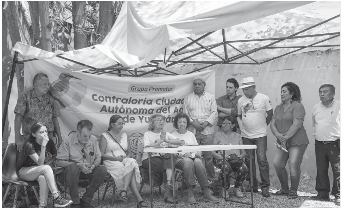
▲ Los ciudadanos pidieron que candidatas y candidatos a la gubernatura de Yucatán, así como a la cámara de Senadores, de Diputados y al congreso local asuman este compromiso y le den un seguimiento responsable.

Representantes de estos grupos apartidistas y de la sociedad civil presentaron 14 consensos que son producto de foros organizados a nivel peninsular y que atienden las principales problemáticas en materia de agua y territorio.