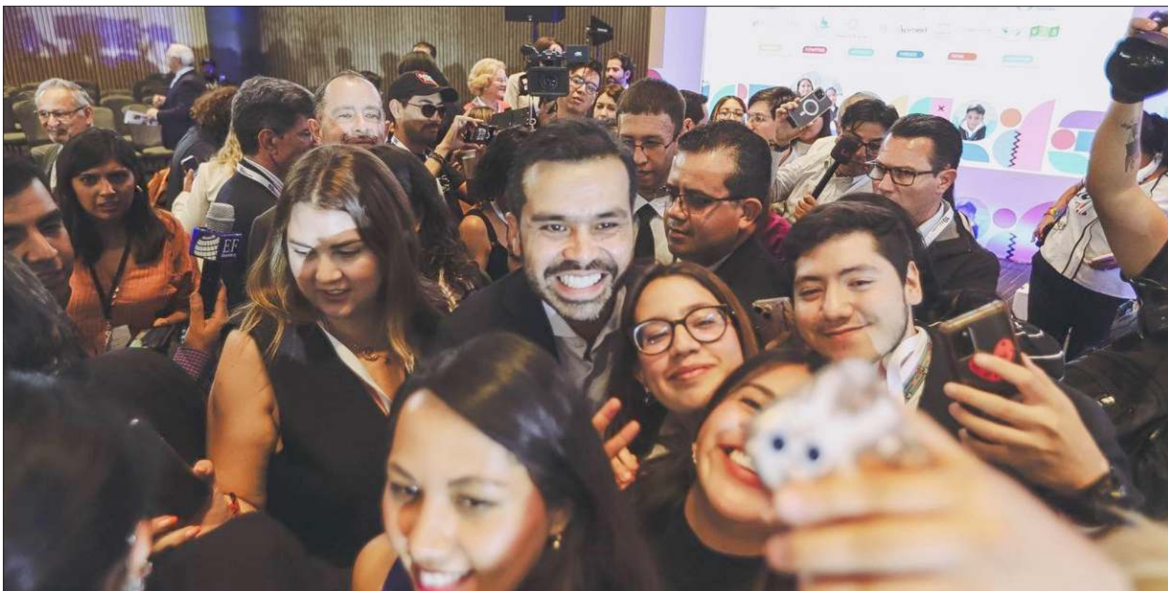
▲ “Hago responsable a Xóchitl Gálvez de estos actos de provocación que están organizando desde su coordinación de campaña”, declaró el candidato de MC.

Lo intentaron en Morelia e hicieron el ridículo. Y ahora insisten. Ten dignidad; yo siempre he sido respetuoso contigo. Acepta que ya te rebasé”.