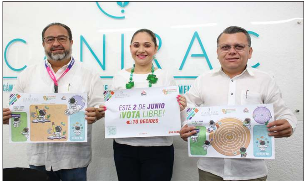
▲ Una de los incentivos de la Canirac en conjunto con los restaurantes es el café gratis, o, en su defecto, algún otro producto que se incluya en cada menú, así como distintas ofertas o descuentos.

“Esta es una muestra más del compromiso de nuestra industria con el bienestar de