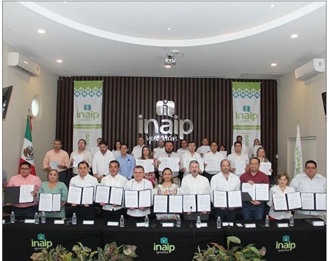
▲ Ts'o'ok 245 u túlul máaxo'ob ku báaxtikob política wáa candidato'ob ts'o'ok u na'aksiko'on información ichil u chíikuilil.

"Le ba'ax ku na'aksa'alo' je'el u páajtal u xak'alta'al tumen je'el máaxake', beyo' le kajnáalo'obo' je'el u páajtal u béetiko'ob jump'éeel ma'alob yéeyajil tumen ku k'ajóoltiko'ob tu beel máaxo'ob táan u báaxtikob le politikao' wáa taak u beetikubaob jala'achilo'ob, beyxane' ku páajtal u yila'al wáa táan u ts'atántiko'ob u meyajil