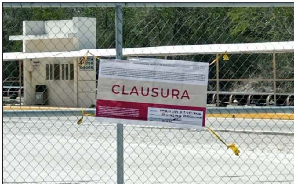
▲ En 2017 y 2018, la Profepa había impuesto una clausura y sanciones administrativas a esta empresa por aprovechamiento de roca caliza mayor al autorizado.

Derivado de la inspección se advirtió la existencia de probables daños y deterioros graves a los ecosistemas, por lo que, con base en la legislación ambiental, se impusieron como medidas de seguridad las clausuras temporales totales de las actividades y obras realizadas en el sitio, informó Profepa en un comunicado de prensa.