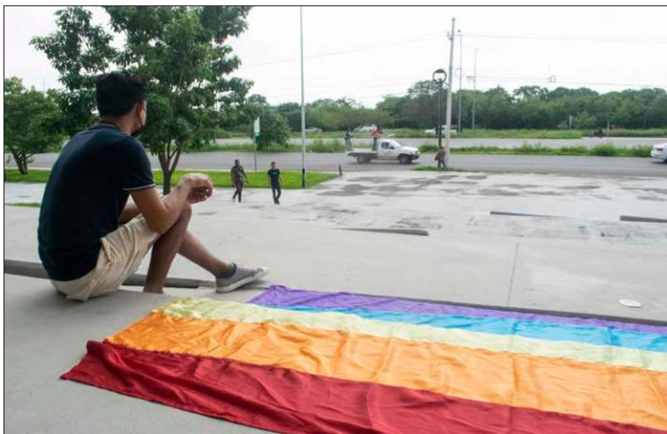
▲ Las y los participantes de la quinta mesa ciudadana expusieron problemáticas relacionadas con la falta de igualdad laboral entre hombres y mujeres, así como de accesibilidad para personas con discapacidad, violencia institucional y discriminación entre la comunidad LGBT+.

En el desarrollo, las y los participantes expusieron problemáticas relacionadas con la falta de igualdad laboral entre hombres y