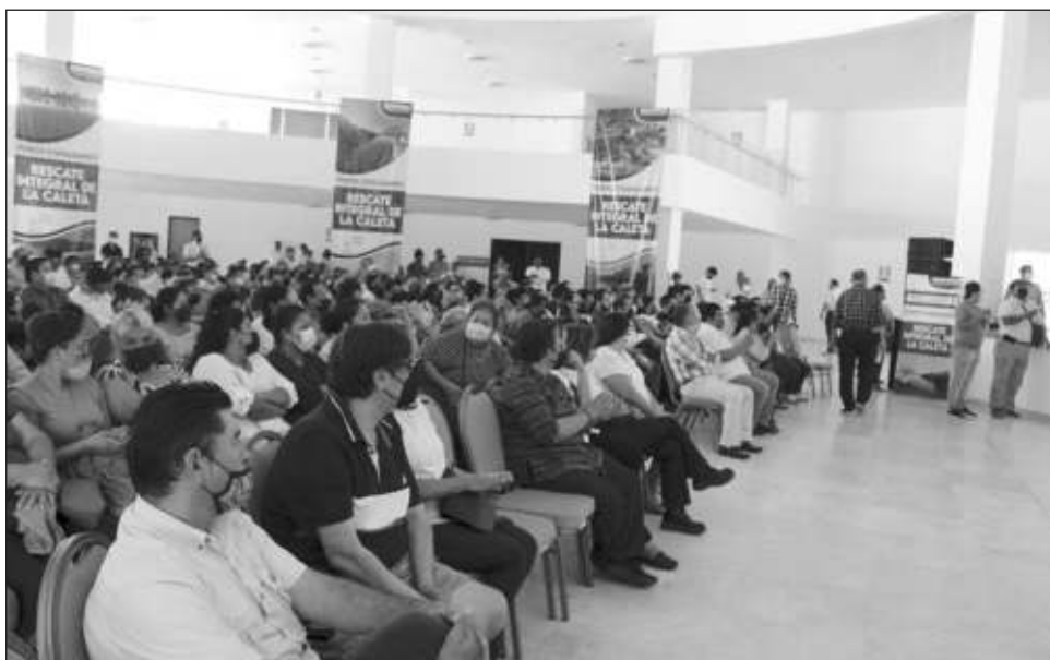
▲ El Foro de Consulta Ciudadana para el Rescate Integral del Arroyo de la Caleta se celebró en el Casino del Mar y asistieron representantes de dependencias y ambientalistas.