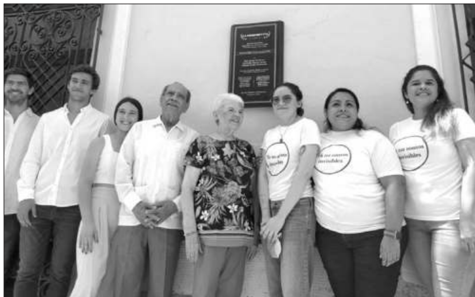
▲ La placa fue colocada en un predio ubicado en la esquina de la calle 59 con 52 del centro de Mérida, donde también funcionó la escuela de niñas La Siempreviva.