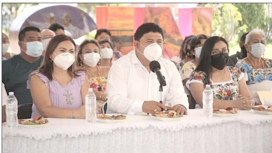
▲ El evento será el 15 de mayo en el parque principal del municipio.