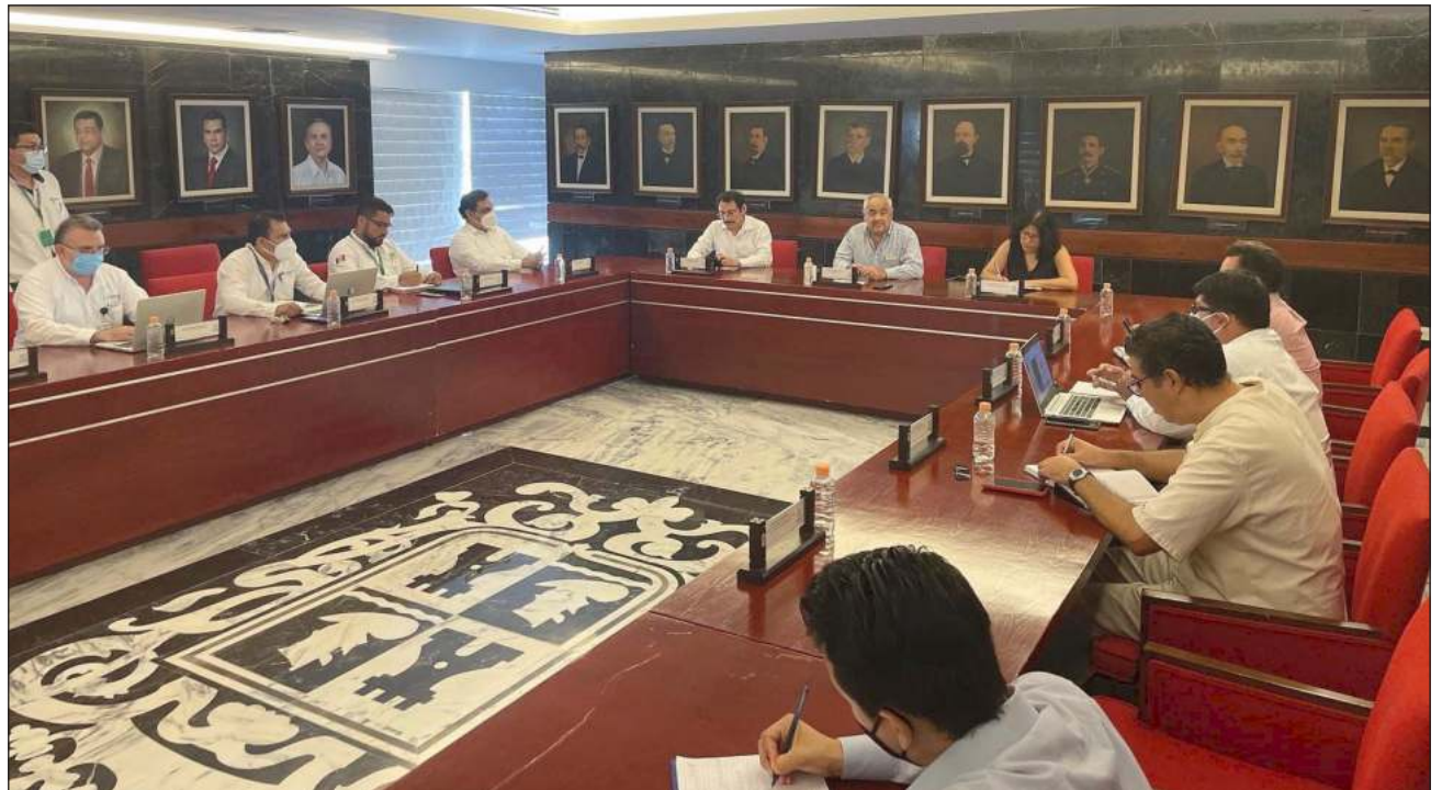
▲ Durante la primera sesión, los integrantes del comité acordaron realizar un levantamiento de condiciones y opiniones de los habitantes de diversas comunidades respecto al servicio de electrificación.