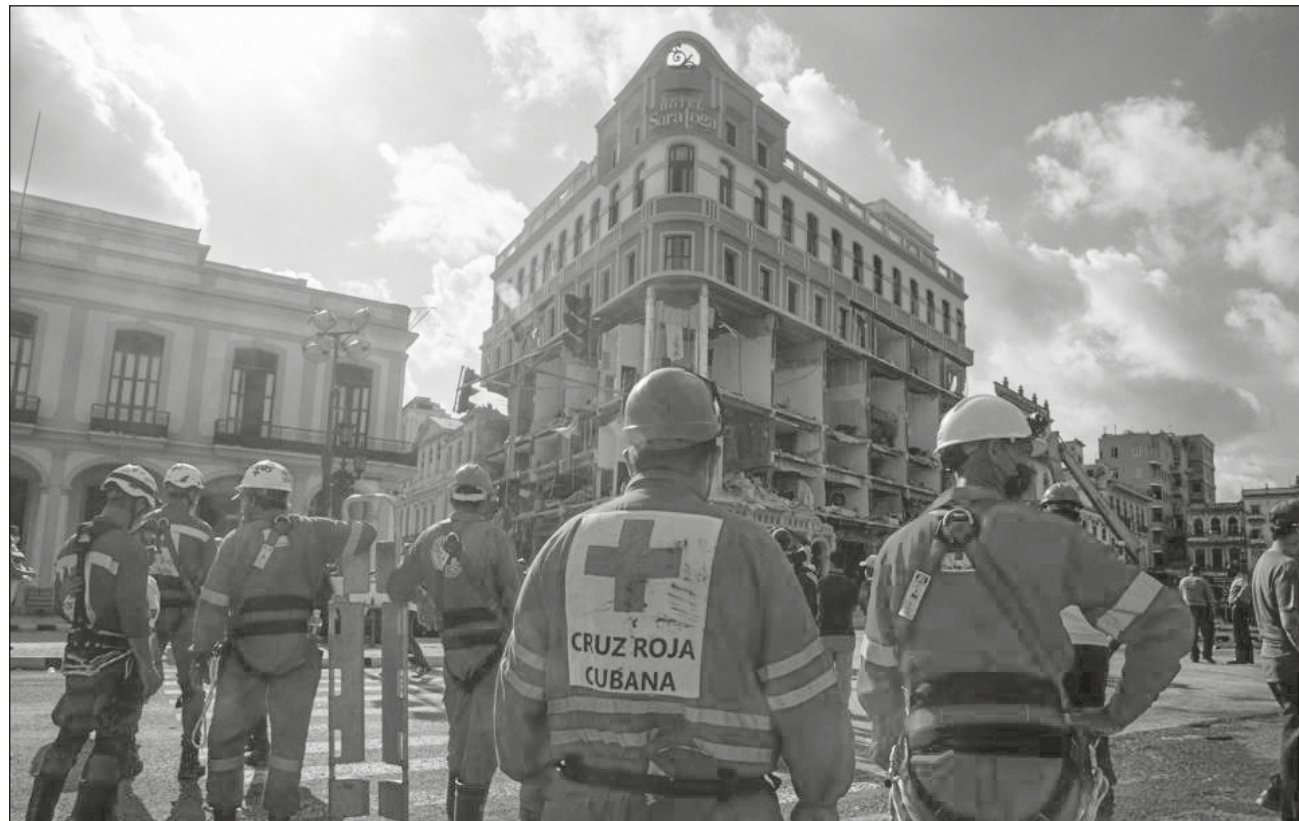
▲ Brigadas de bomberos y rescatistas trabajaron la madrugada del domingo buscando cuerpos bajo los escombros de la edificación ubicada en La Habana Vieja; los primeros cuatro pisos del hotel 5 estrellas resultaron destruidos.

De los 30 fallecidos, 16 son hombres y 14 mujeres, cuatro de ellos menores de edad, una embarazada y una turista española de 29 años, cuyo esposo también resultó herido durante la explosión que destruyó parcialmente al hotel de lujo que estaba siendo refaccionado.