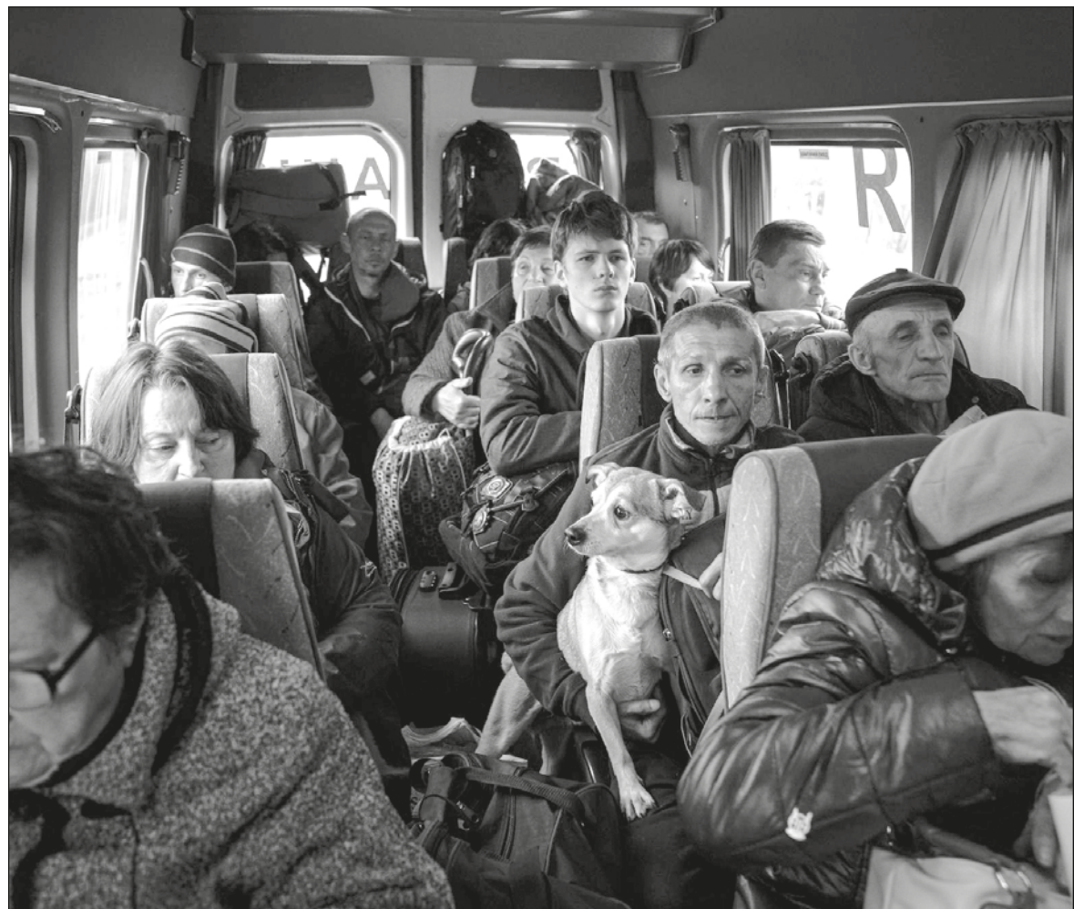
▲ "Russia seeks to rewrite history and is trying to hide both Russian responsibility for starting the war and for the international sanctions that are seriously affecting its economy".

RUSSIAN HISTORY BOOKS make no mention of the country's antisemitic past, nor do they make any reference to the Molotov-Ribbentrop Pact of 1939 in which the then Soviet Union and Nazi Germany joined forces to carve up Poland leaving Hitler free to attack Western Europe.