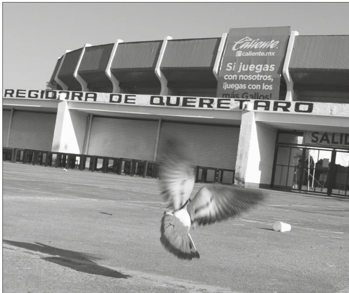
▲ El miedo se fue apoderando de todos los que estábamos ahí, una epidemia de terror.

la única tierra firme. Vi a padres cargar a sus hijos, tapándole los ojos; vi a mujeres, como yo, caer, y ser pisoteadas. Yo me aferré lo más que pude de la mano de mi amigo, pero terminé sola, perdida. Detrás de mí, un monstruo rugió, y no me atreví a voltear; temí convertirme en estatua de sal. Logré correr por uno de los pasillo, y sin saber qué hacer, me escondí en un cuartito, una minúscula bodega; cerré la puerta y esperé a que todo pasara. No sé si fueron horas o sólo unos minutos; no sé: perdí la concepción del tiempo, entre otras más cosas. En el cuartito, me hice ovillo y cerré los ojos, con fuerza; me tapé los oídos, hasta que un fuerte golpe sacudió la puerta. Por una pequeña rendija vi cómo un joven, sin playera, caía al suelo: tenía sangre en el rostro. Él me vio, y sentí que me suplicaba ayuda cuando varios pares de tenis comenzaron a patearlo, una y otra vez, una y otra vez: en el abdomen, en la cara, en los genitales. Vi cómo le quitaban el pantalón y los calzoncillos, cómo, además de patearlo, le estrellaron una si-