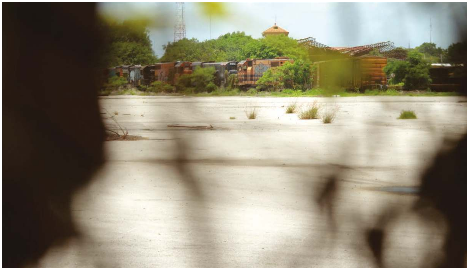
▲ Durante su visita a la entidad, el Presidente confirmó su apoyo a que el 100 por ciento del espacio se usara para el parque.

Además -agregó- les gustaría que se reutilicen los durmientes, y otras máquinas para que sirvan como muebles del parque; también que cuenten con áreas verdes, lagos, observatorio astronómico, lunario, espacios para correr, caminar, para mascotas, ciclovías, áreas de juegos, un teatro, entre otras atracciones.