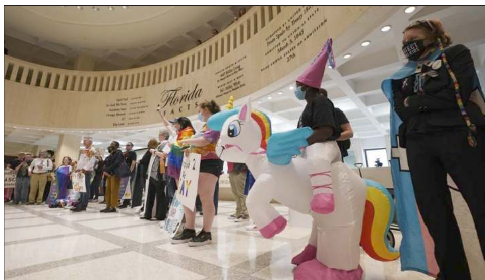
▲ La ley aprobada estipula que no puede haber instrucción de parte del personal de las escuelas o de terceros acerca de la orientación sexual o la identidad de género desde el jardín de infantes hasta el tercer grado.

“Lo que deberíamos estar haciendo es enseñar acerca de la tolerancia, el cariño, el