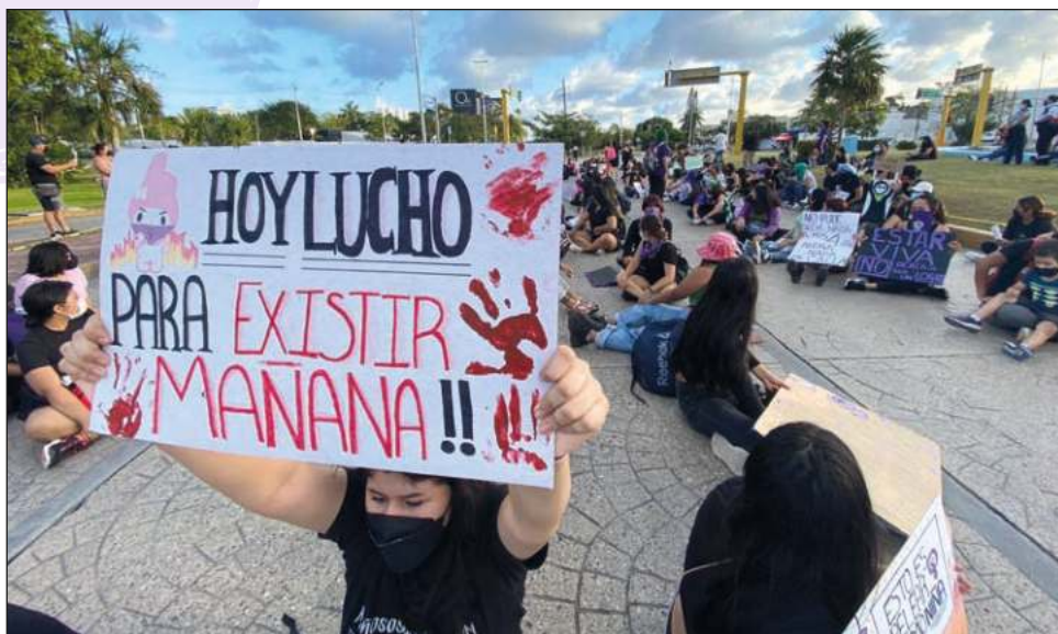
En las dos marchas convocadas para este 8 de marzo se hizo hincapié en las cifras de feminicidios y violencias que viven las mujeres.