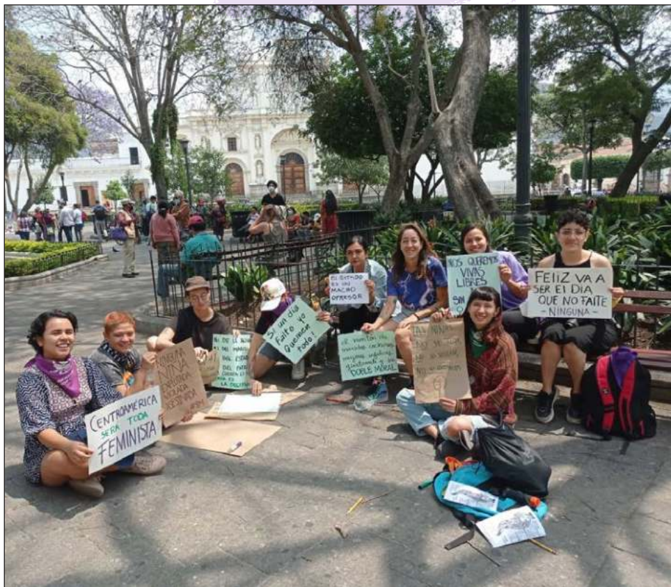
Para conmemorar la “lucha constante” de las mujeres, las integrantes de la agrupación realizaron ayer una manifestación pacífica en Antigua.

Detalló que ellas, como colectivo feminista, brindan acompañamiento a mujeres víctimas de violencia ante la autoridad judicial, hacen denuncias públicas, accionan en la calle y brindan información a las mujeres a través de redes sociales.