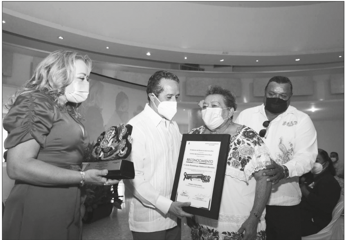
▲ El gobernador asegura que Quintana Roo es la entidad que tiene uno de los niveles más altos de participación de la mujer en puestos políticos y privados en todo el país.

Durante la entrega de reconocimientos y galardones Mujer Quintanarroense Destacada edición 2022, en el marco de las actividades conmemorativas por el Día Internacional de la Mujer, el mandatario reiteró su total apoyo para caminar juntos en este largo proceso de transformación de nuestras sociedades hacia la igualdad efectiva entre mujeres y hombres.