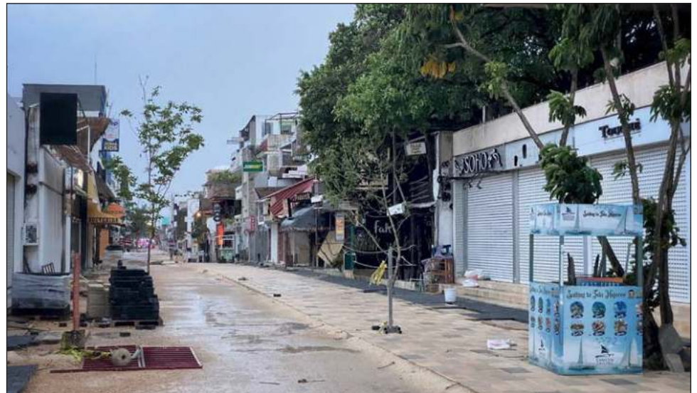
▲ Entre 2020 y 2021 los negocios tuvieron que adoptar diferentes medidas y acciones para hacer frente a las restricciones sanitarias derivadas de la pandemia.

El EDN explica las proporciones de MiPyME sobrevivientes y sus características, como tamaño, actividad,