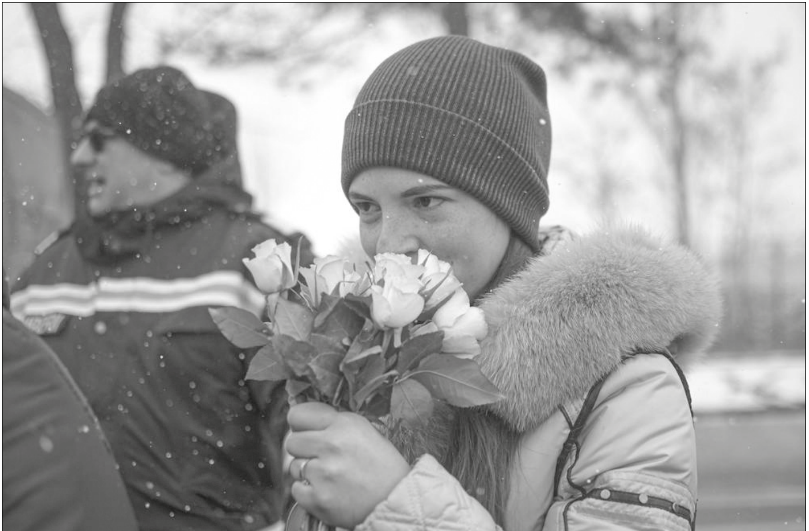
▲ La ONU estima que la cifra de personas que han salido de Ucrania por la guerra puede rebasar los 10 millones.