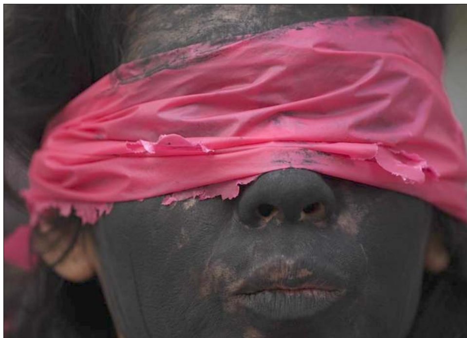
El espíritu de las marchas este martes fue hacer un ejercicio de solidaridad entre las mujeres, porque todas han sufrido algún tipo de violencia.

Durante el recorrido se registraron algunos hechos aislados de violencia protagonizados por manifestantes con los rostros cubiertos con pasamontañas, quienes con la ayuda de martillos partieron casetas de teléfonos públicos y golpearon las protecciones metálicas de tiendas. La mayoría de los comercios, hoteles y ofici-