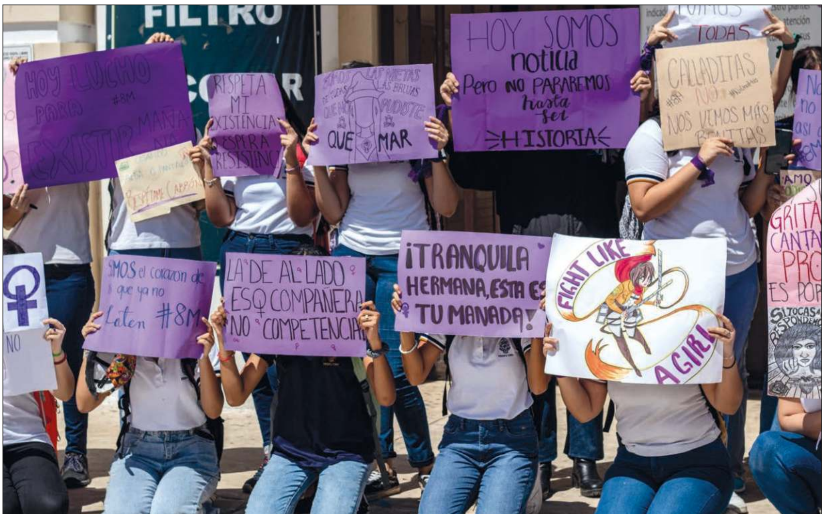
La escuela, resaltaron las estudiantes, debe ser un lugar libre de violencia, en el que deben estar seguras y ser escuchadas.

Hemos sido revictimizadas, hostigadas, acosadas, insultadas