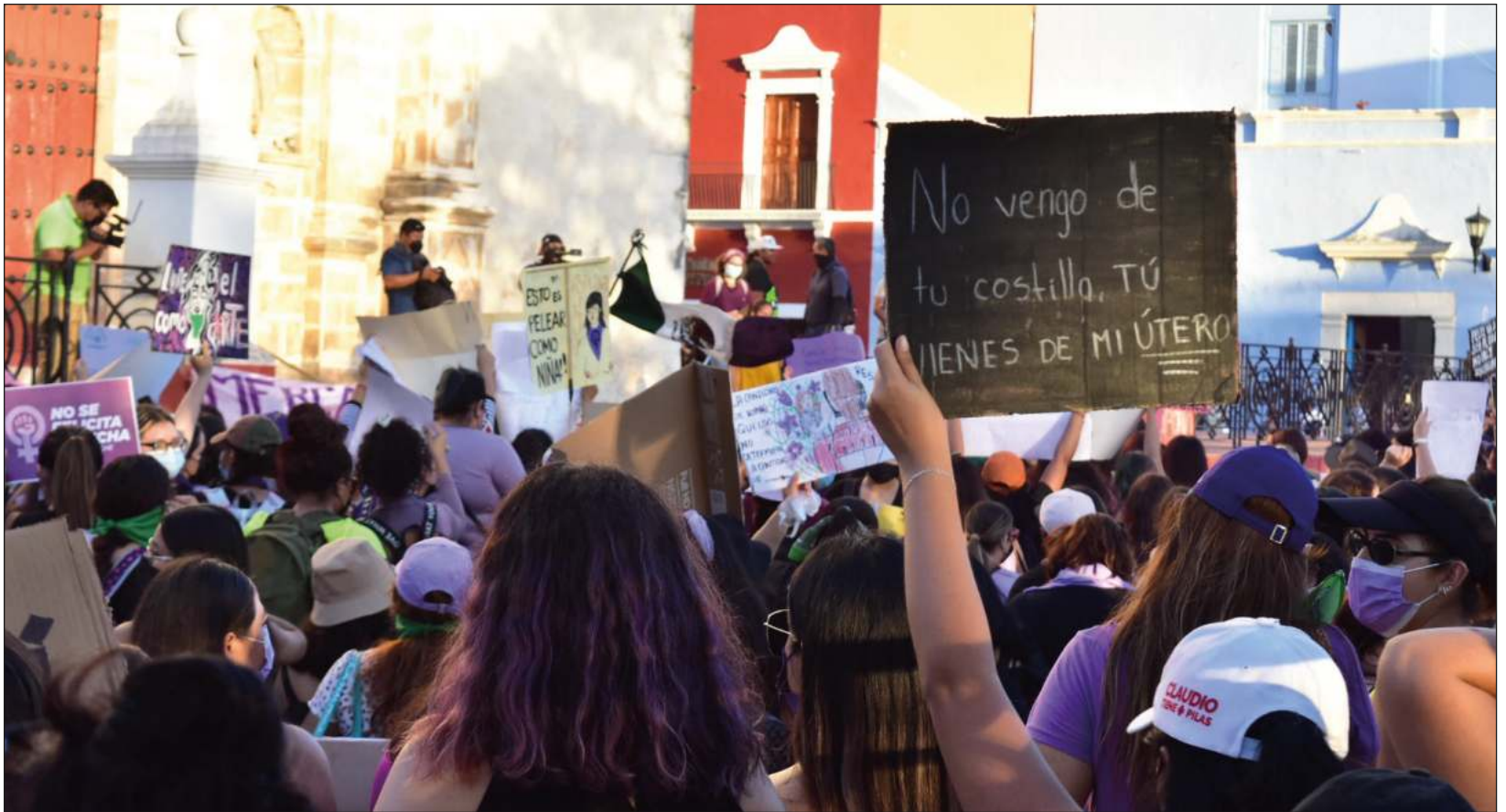
El acopio de datos y la reflexión acerca de lo que hoy se conoce como atribuciones de género, data del siglo XIX.

La conquista de los derechos de las mujeres ha tenido que enfrentar resistencias y menosprecios, pero también se liga con hechos históricos que, aun en medio de conflictos, señalan nuevas formas de relación con los varones. Así, en el campo de discusión de las ideas y en el análisis de los procesos sociales se han registrado estudios que toman como base el acopio de datos y la reflexión acerca de lo que hoy se conoce como atribuciones de género, es un sentido que desborda la mera constitución biológica de las personas. El siglo XIX dio frutos significativos en este terreno.