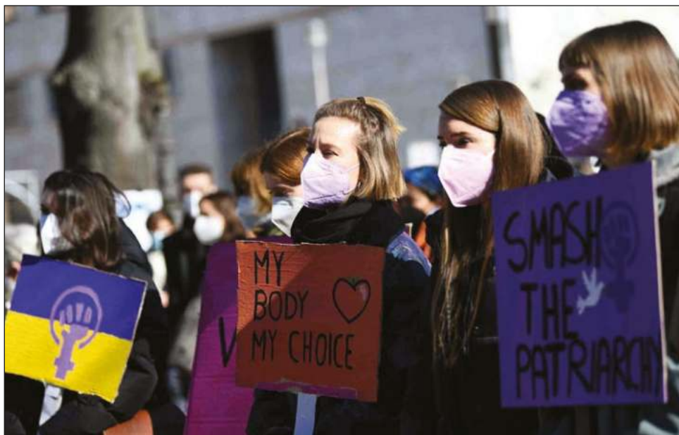
Miles de personas formaron un mar morado, con pancartas por la igualdad y contra el machismo, pero también decían "Stop Putin" o "No a la guerra".

Otras ciudades europeas fueron escenario de manifestaciones, como París, donde unas 35 mil personas, según los organizadores, marcharon contra la violencia sexista y por la igualdad salarial.