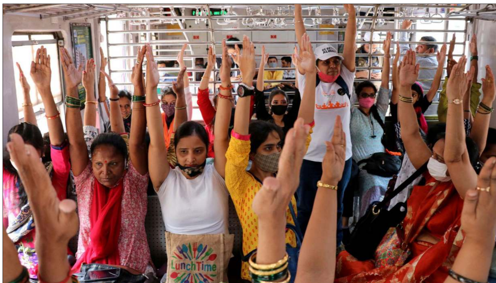
▲ En los cinco continentes, las mujeres han encontrado unidad en la violencia que padecen cotidianamente en prácticamente todos los aspectos de su vida.