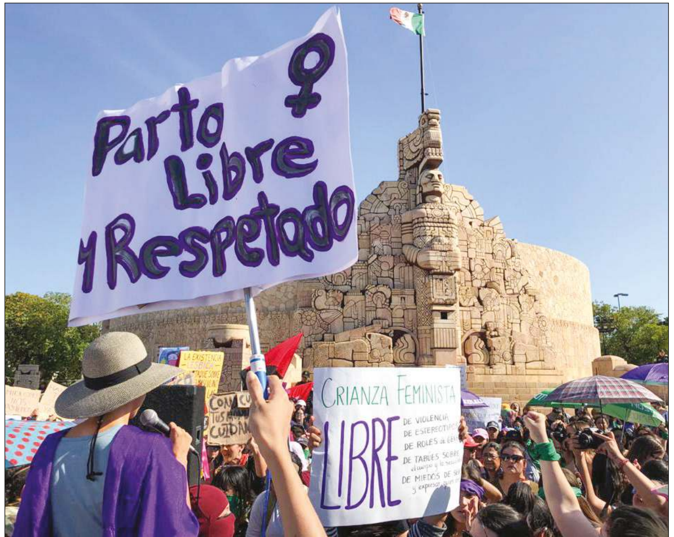
Independientemente de las diferencias que puedan tener, el objetivo es el mismo: educar para que la próxima generación construya un mundo más justo e igualitario.

A través de la Colectiva Madres Feministas han encontrado un grupo de apoyo emocional para compartir experiencias, las cuales suelen ser similares: la culpa que sienten por las expectativas y roles impuestos por una sociedad conservadora y machista, que rechaza cualquier maternidad que no se parece a esa visión que se ha perpetuado durante años; la madre abnegada que deja todo para el cuidado de los hijos e hijas, incluso su desarrollo profesional y felicidad.