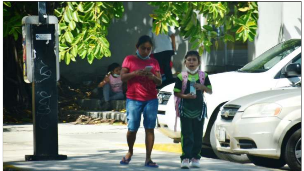
▲ El porcentaje de estudiantes en las aulas ronda el 70 por ciento, de acuerdo con el cálculo de la Asociación Padres Responsables.

Expuso que los padres de familia han hecho un esfuerzo adicional, ya que no sólo se trata de los uniformes, sino también de los insumos que utilizan para llevar a los niños, adolescentes y jóvenes para sus alimentos, los cua-