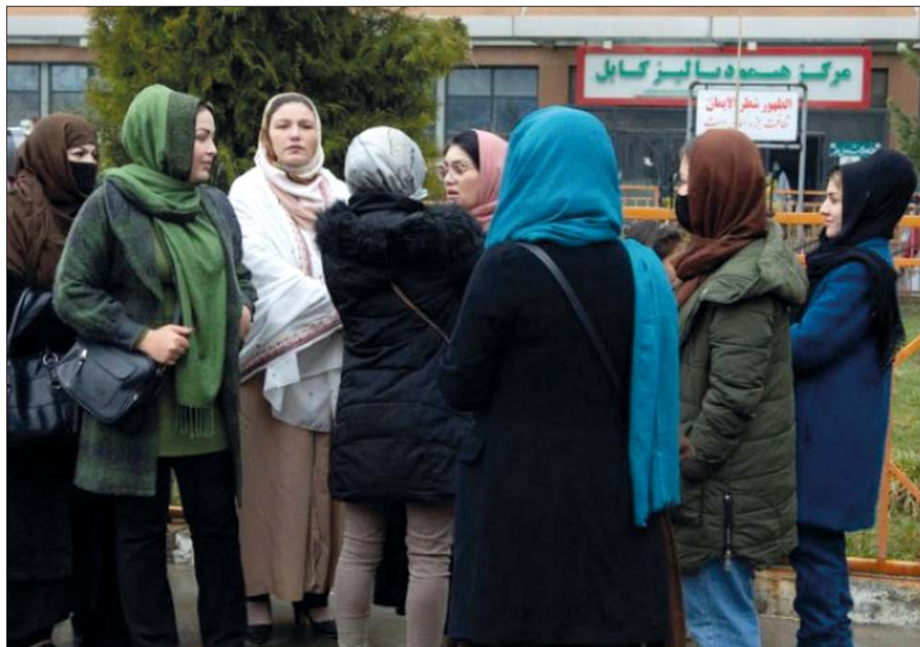
Los talibanes han reconocido el Día Internacional de la Mujer, y el Ministerio de exteriores aseguró que les proporcionarían “una vida honorable y beneficiosa a la luz de la noble religión del Islam”.

Pero los talibanes no tardaron en cansarse y detuvieron a varias de las activistas, manteniéndolas incomuni-