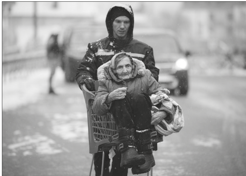
▲ La ruta de escape acordada con Rusia fue notificada previamente a la Cruz Roja; aunque en Mariúpol no logró el cometido de evacuación.

a viceprimer ministra ucraniana y ministra para la Reintegración de los Territorios Temporalmente Ocupados, Iryna Vereshchuk, explicó que no se había acordado ninguna otra ruta, después de que Rusia propusiera de nuevo este martes