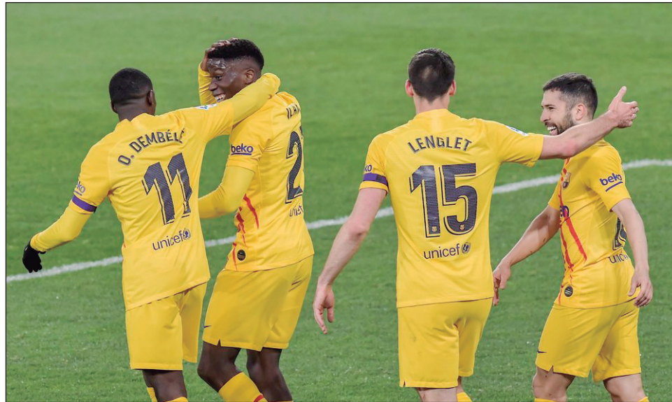
▲ El Barcelona va por otra hazaña frente al PSG.

El técnico juventino, Andrea Pirlo, ha tenido que