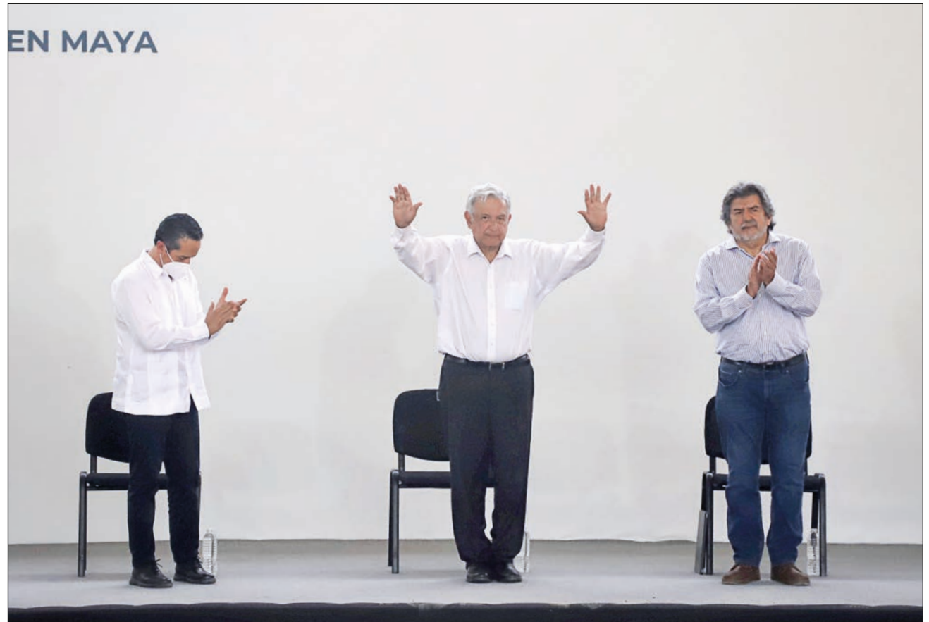
▲ Pese a las maniobras legales interpuestas por diferentes grupos en contra del proyecto, las obras del Tren Maya no se detienen, afirmó el titular del Fonatur.

Ahora, con el Tren Maya, puede ser mucho mejor, pues hay nuevas tecnolo-