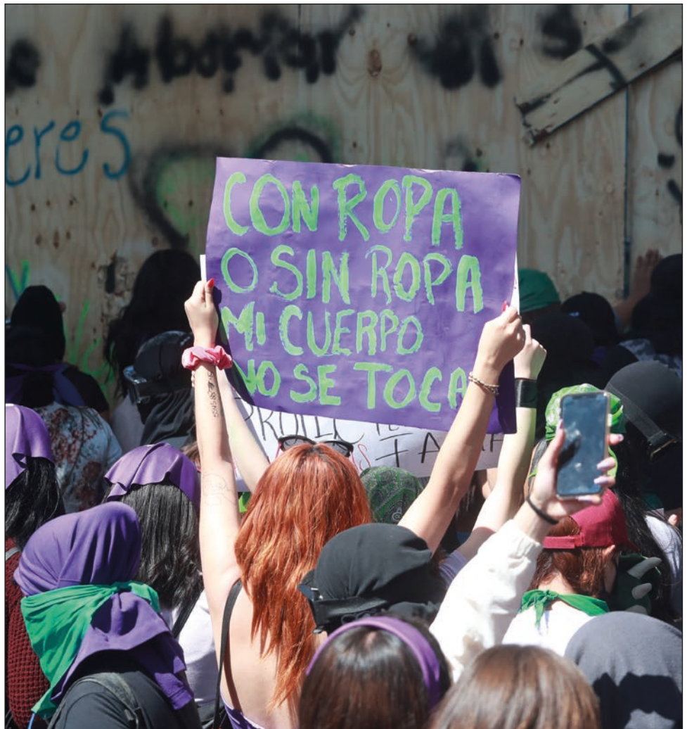
Cientos de mexicanas marcharon ayer desde el Monumento a la Revolución hasta el Zócalo de la Ciudad d México para denunciar la violencia machista que prevalece en todo país.