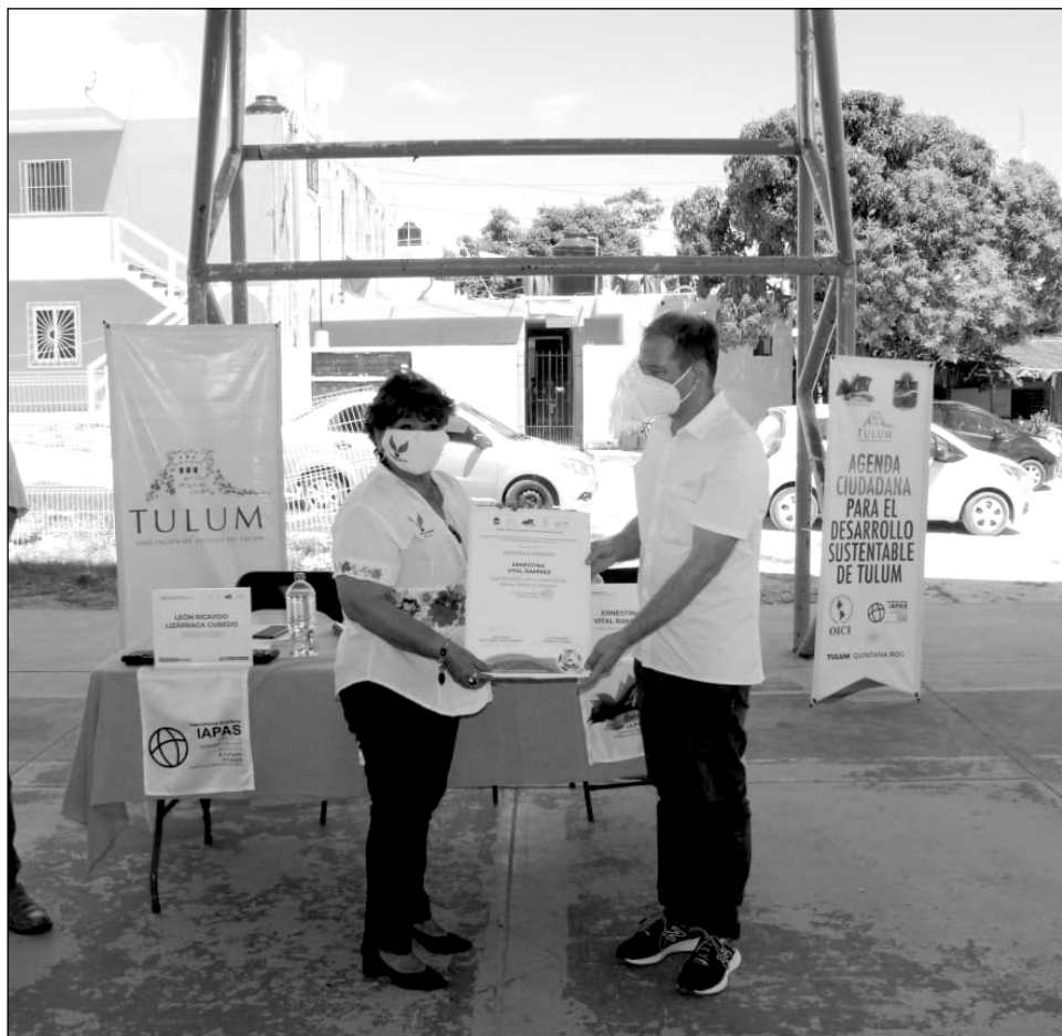
▲ Las dosis que llegaron al estado de Campeche serán repartidas en los municipios de Calkiní y Escárcega.

Las vacunas dispersadas en la entidad forman parte de las 800 mil dosis que compró el gobierno de México y que están siendo distribuidas a las 32 entidades del país para continuar la aplicación de vacunas a personas adultas mayores con la Política Nacional de Vacunación contra el Virus SARS-CoV-2, para la prevención de Covid-19 en México.