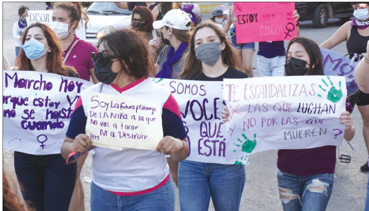
El punto de reunión de las campechanas fue el monumento erigido al Ángel Maya, en el malecón de la ciudad.

Al ritmo de cánticos, vitoreos y reclamos, las mujeres unieron sus voces en reclamos hacia los gobiernos federal y estatal, exigiendo justicia