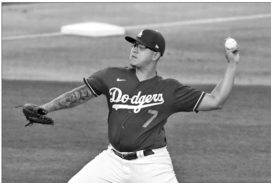
▲ Julio Urías se lució contra los Medias Blancas.

También brilló otro de los héroes de la coronación de los Dodgers, Corey Seager, quien se fue de 3-2, con su primer cuadrangular de la pretemporada, y tres carreras impulsadas. Seager y Urías llegaron a ser los mejores prospectos de bateo y pitcheo del beisbol, respectivamente, según "Baseball America", y años después, el torpedero fue el Más Valioso de la Serie Mundial en la que Julio sacó los últimos outs. Siguió ayer en la