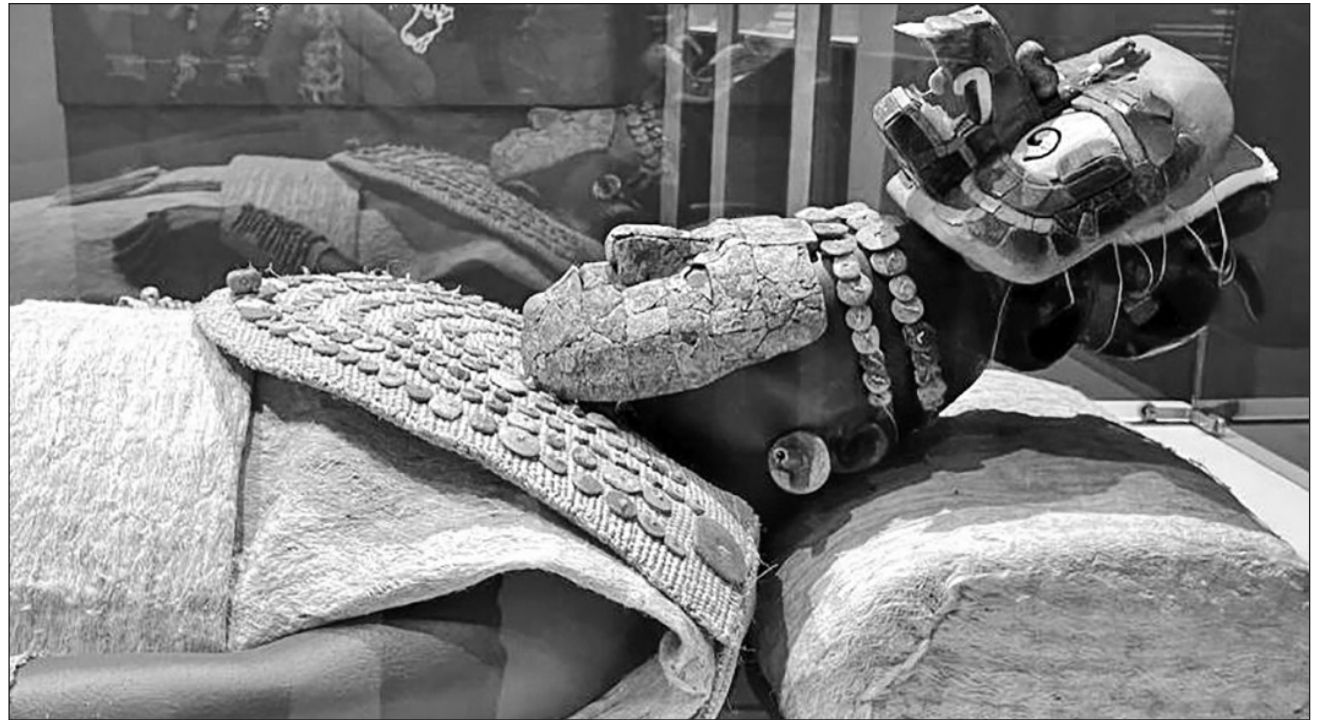
▲ “La señora Ixik Tz'aka'ab Ajaw murió el 13 de noviembre del año 672; sus restos fueron depositados en el Templo XIII, donde 11 años después de la muerte de la señora sería inhumado Pakal, cuya tumba fue encontrada por Alberto Ruz L'huillier en 1952”, comentó el director del INAH en la ceremonia de inauguración del Pabellón Reina Roja.