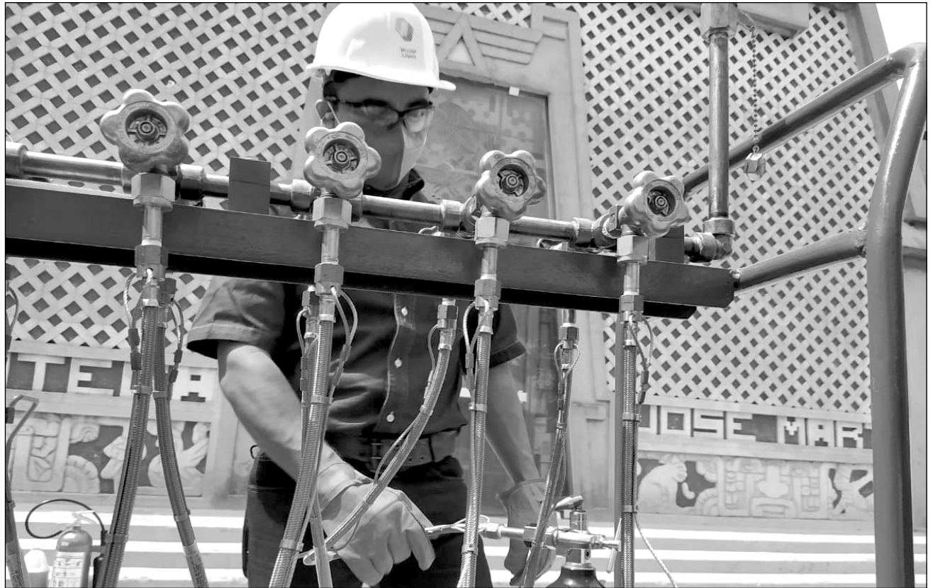
▲ El módulo de carga está a las afueras de la biblioteca José Martí, en la colonia García Ginerés.

Quienes asistan al módulo podrán recargar cilindros de hasta mil 700 litros (2 metros cúbicos) a una presión de 2 mil PSI. Los envases deberán contar con prueba hidrostática vigente y deben ser de un fabricante o recalificador aprobado por la NMX-H156-2019; la válvula debe ser CGA870 o CGA540.