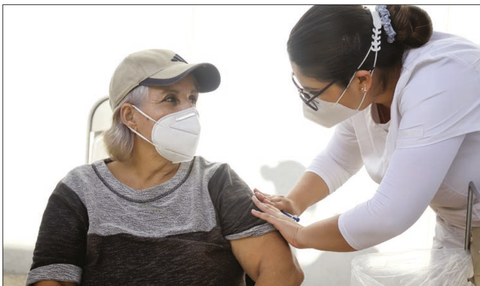
▲ Se formaron largas filas en los tres puntos de vacunación.