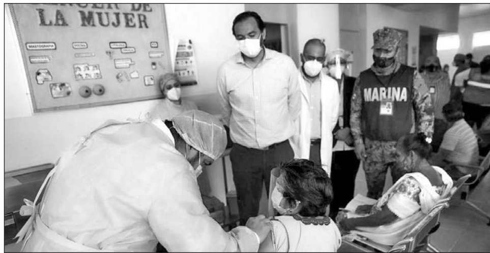
▲ Además de las 12 mil 675 dosis de la farmacéutica Pfizer que se recibieron este domingo, la próxima semana comenzará la aplicación de las 14 mil 680 vacunas de Sinovac, en Ticul, Espita y Kanasín.