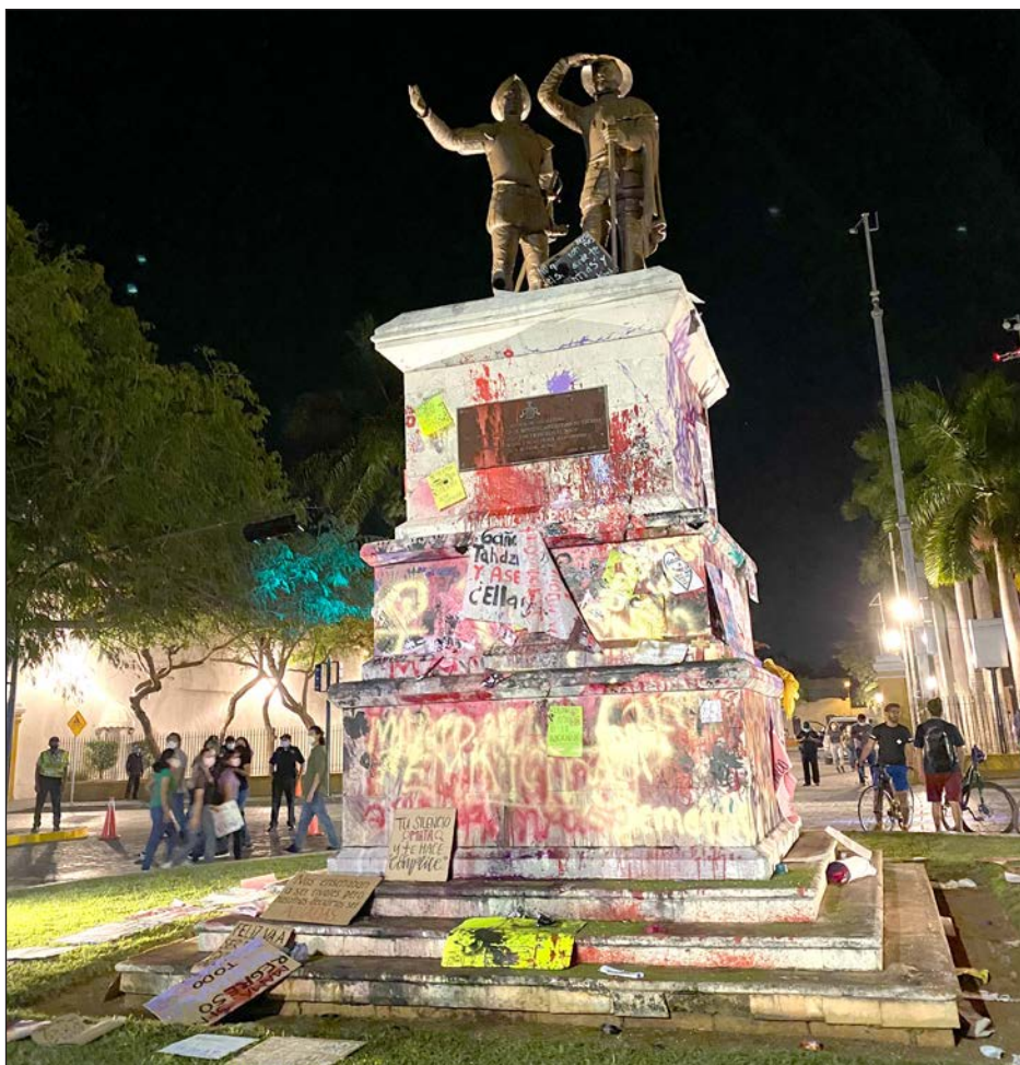
▲ Jo'oljeake' máan U K'iinil Ko'olelo'ob Yóok'ol Kaab, le beetike' ya'abach múuch'ilo'ob yéetel ko'olelo'obe' jóok' u yawto'ob yéetel u ye'es u muuk'il u t'aano'ob tu yóok'lal loobilaj ku beeta'al yóok'ol ko'olel. Xféeministaobe' tu bonajo'ob u ch'íikulal Los Montejo yaan aktáan Remate, tu noj kaajil Jo', ti'al u ch'íikbesiko'ob u k'uux óolalo'ob ti' k'aasil ba'al ku beeta'al ti' ko'olelo'ob te'e lu'uma' yéetel ti'al u xu'ulsa'al xma' keetil yaan.