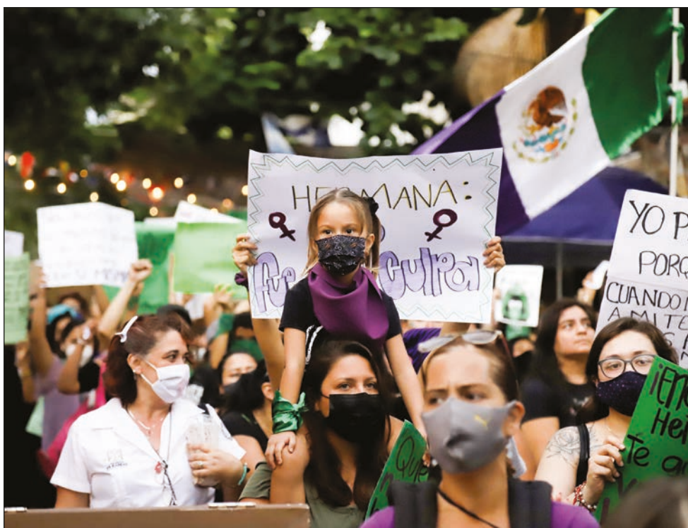
En Playa del Carmen, el contingente marchó sobre la Quinta Avenida, desde la CTM hasta el palacio municipal.

Agregó que por eso nació el programa “Taxi Rosa” y agradeció al presidente Óscar Rosas por siempre respaldar las acciones que promueve el Instituto a favor de la mujer carmelita.