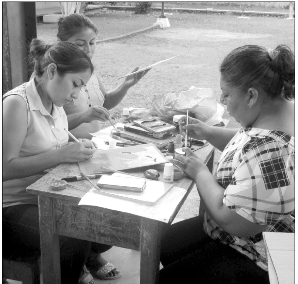
▲ Las personas involucradas en el proyecto se ponen de acuerdo sobre qué nombre ponerle al libro, qué material usar para las páginas y sobre todo, darle un sello editorial.