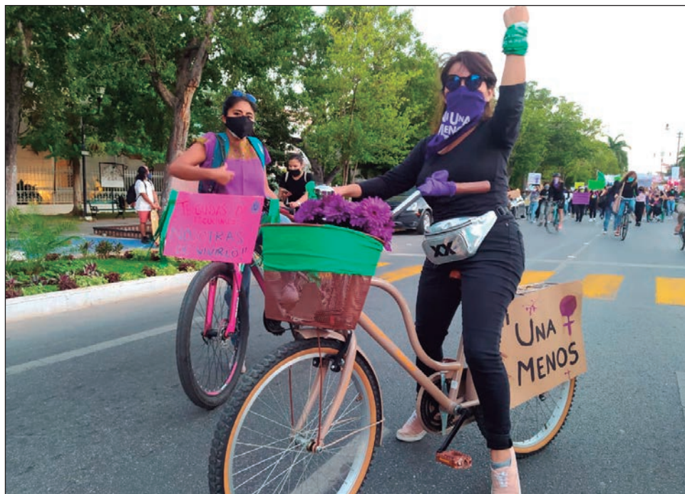
▲ En bicicletas, patines, scooters y patinetas, mujeres se reunieron en el parque de Santa Ana para después desplazarse al Paseo de Montejo.

Con una batucada y una bandera feminista, decenas de mujeres recorrieron los dos carriles de la avenida; por momentos se hincaban y con el puño arriba, guardaban minutos de silencio por las mujeres que perdieron la