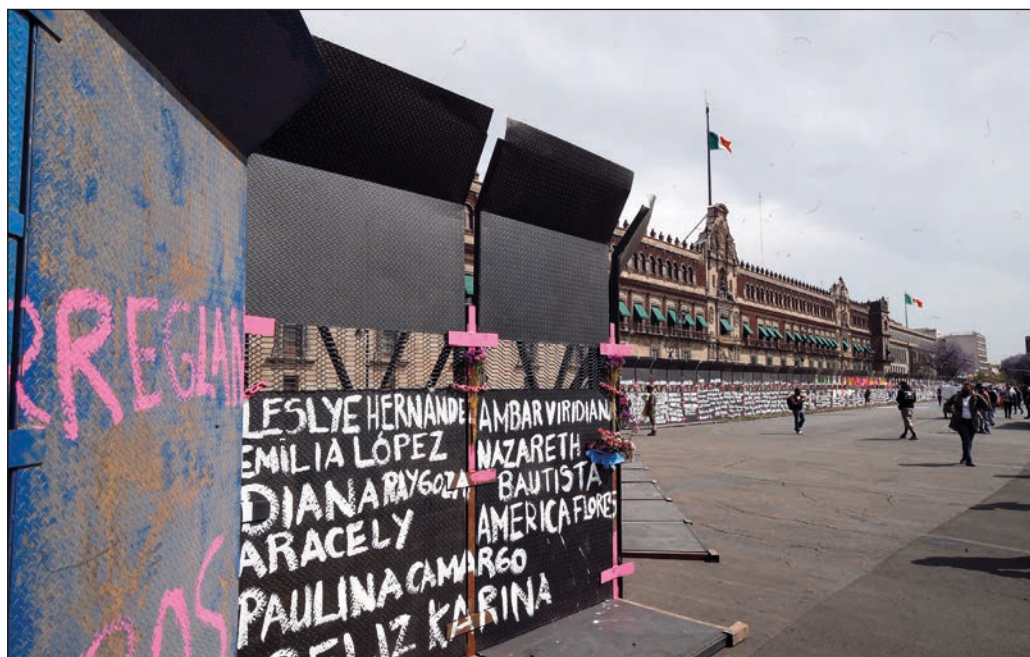
Lo deseable es que las movilizaciones de este lunes se traduzcan en una intensificación del diálogo entre las organizaciones y corrientes feministas y las autoridades.

Es entendible la exasperación ante la lentitud o la ausencia de avances en la erradicación de la violencia de género, pero no sería legítimo ni útil llevar esa fundamentada irritación a agresiones contra las agentes del orden y otros empleados públicos, sedes institucionales, monumentos, mobiliario urbano o establecimientos comerciales. Por el contrario, ello podría traducirse en tragedias personales y desvirtuaría el espíritu de luchas que están, precisamente, contra la violencia. Lo deseable es que las movilizaciones de este lunes se traduzcan en una intensificación del diálogo entre las organizaciones y corrientes feministas y las autoridades, a fin de concebir y aplicar medidas que permitan una reducción efectiva y palpable de la hostilidad y la agresión que día a día padecen las mujeres.