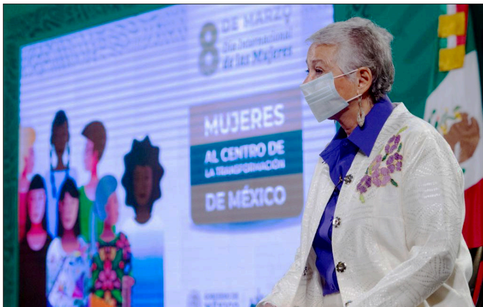
La secretaria de Gobernación, Olga Sánchez, apuntó que el gobierno de la cuarta transformación “se mueve hacia la igualdad”.

Ante los distintos grupos feministas previstos a manifestarse este 8 de marzo rumbo al Zócalo con motivo del Día Internacional de la Mujer, el mandatario apuntó que su administración ha buscado tender puentes con dichas agrupaciones, y el tema de seguridad es al que mayor atención le destina su gobierno desde las juntas con su gabinete de seguridad, junto con los titulares de Gobernación, Seguridad Pública, Defensa Nacional y Marina, quienes le presentan diario el parte de los sucesos del día anterior.